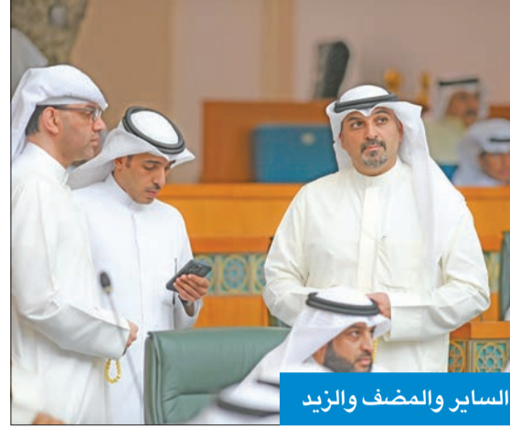
الساير والمضف والزيد

بمرسوم بناء على اقتراح من الوزير المختص. وأضاف: ويشترط في الأعضاء أن يكونوا كويتيين من ذوي النزاهة ومن أصحاب الخبرة والتخصص في الشؤون الهندسية والنفطية والطبية والاقتصادية، وفي المجالات ذات الصلة بعمل الجهاز، والا يكون قد صدر بشأنهم حكم نهائي بشهر الإفلاس، أو حكم بالإدانة في جريمة أو جريمة مخلة بالشرف أو الأمانة. وتابع: كما يتألف من ممثل لإدارة الفتوى والتشريع وممثل لوزارة المالية، وممثل للجهة المختصة بشؤون التخطيط