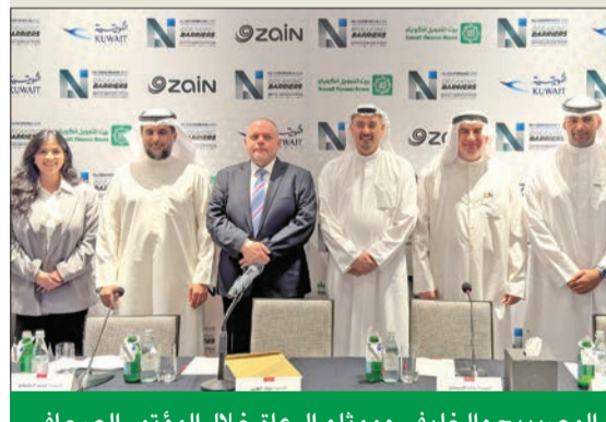
المصبيح والخليفي وممثلو الرعاة خلال المؤتمر الصحفي

أعلنت شركة زين رعايتها لمؤتمر «كسر الحواجز»، الذي يستضيفه المعهد الوطني للقادة (NLI) في أكتوبر المقبل، ويشهد مشاركة كوكبة من المتحدثين البارزين والخبراء والمتخصصين المحليين والعالميين، الذين سيناقشون أبرز المجالات المستجدة، مثل: التحول الرقمي، والتقنيات الناشئة، والتنوع والشمول، تحت رعاية وزير المالية فهد الجارالله.