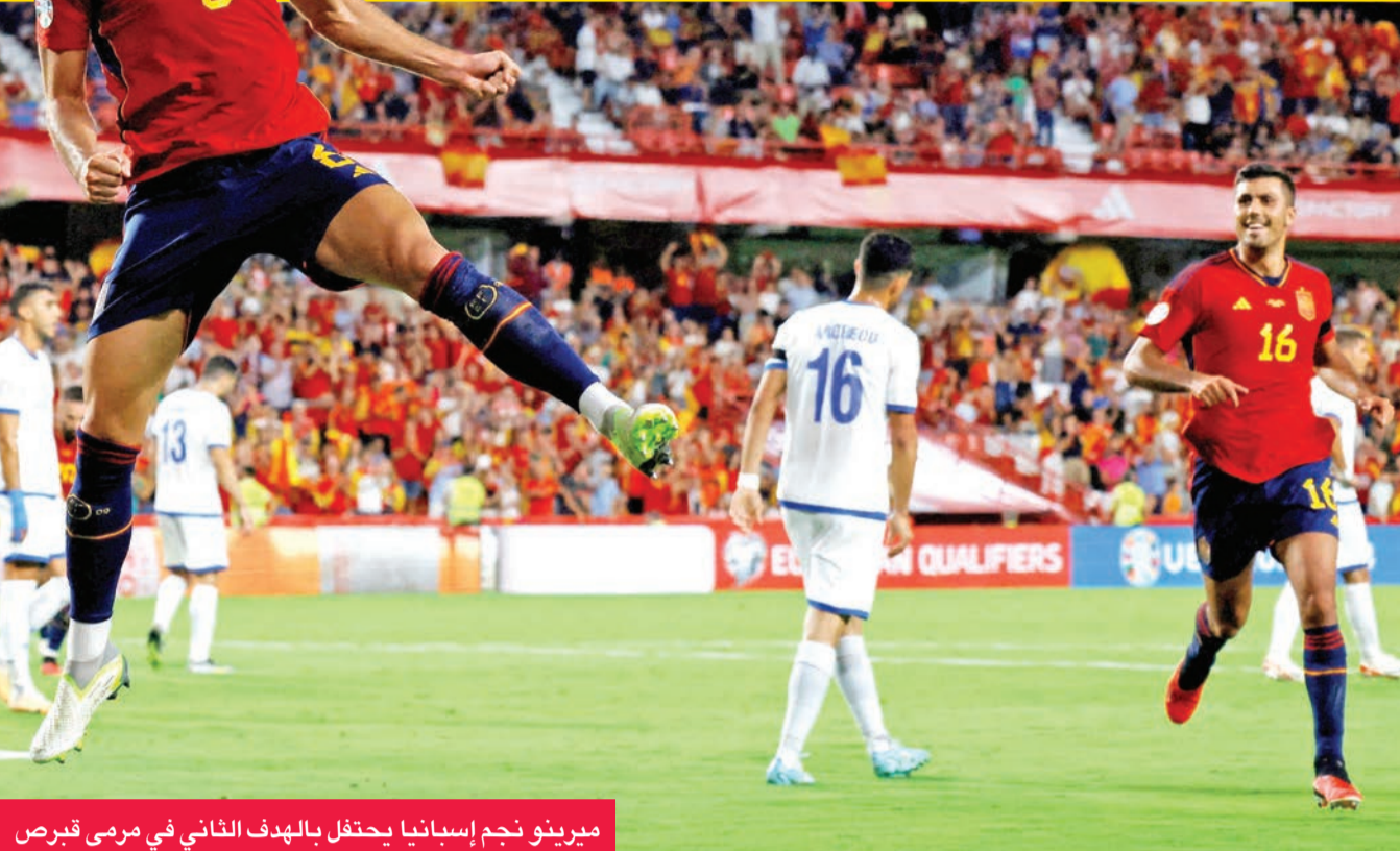
ميرينو نجم إسبانيا يحتفل بالهدف الثاني في رمى قبرص

بان الأخيرة تتأخر في المركز الثالث بفارق سبع نقاط. وفي المجموعة التاسعة، فازت سويسرا على أندورا 3 - صفر، لتعزز صدارتها 14 نقطة، بفارق نقطتين عن رومانيا، الفائزة على كوسوفو 2 - صفر، وثلاث عن إسرائيل، التي أسقطت بيلاروسيا بالنتيجة ذاتها.