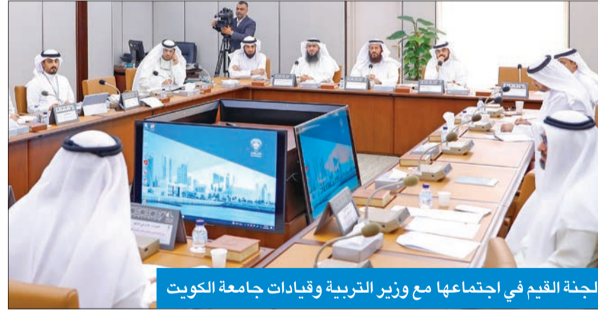
لجنة القيم في اجتماعها مع وزير التربية وقيادات جامعة الكويت

ناقشت لجنة تعزيز القيم في اجتماعها قضيتي منع الاختلاط والتشبه بالجنس الآخر، وذلك بحضور وزير التربية ووزير التعليم العالي والبحث العلمي، د. عادل المنع، ومسؤولي جامعة الكويت وعدد من عمداء الجامعة، وذكر رئيس اللجنة، النائب محمد هايف، في تصريح صحفي بمجلس الأمة، أن الاجتماع كان مثمراً، وتم خلاله وضع النقاط على الحروف بشأن تطبيق القانون رقم 24 لسنة 1996 بشأن تنظيم التعليم في جامعة الكويت والهيئة العامة للتعليم التطبيقي والتدريب والتعليم في المدارس الخاصة، الخاص بالفصل بين الطلبة والطالبات في الجامعة، ومنع الاختلاط، وكذلك إعادة التسجيل في الشعب مرة أخرى.