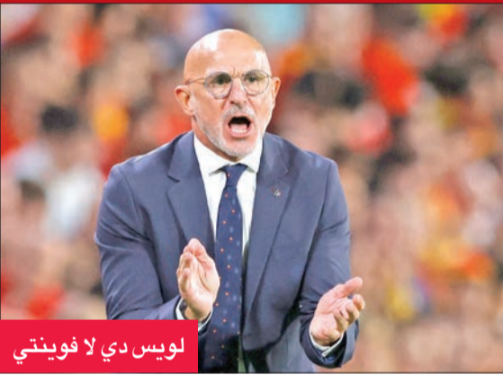
لويس دي لا فوينتي

على المجموعة. وعبر هذه النافذة، تم تحقيق جميع الأهداف التي وضعناها. والتحدي المائل حالياً هو مواصلة التحسن والنمو لأن هامش التحسن كبير جداً.