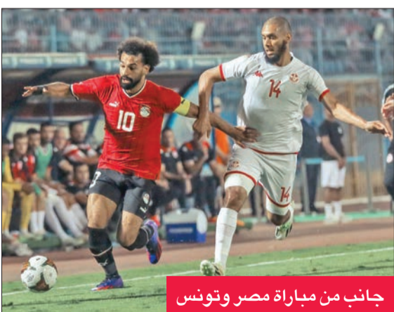
جانب من مباراة مصر وتونس

في الدقيقة الأخيرة من الوقت بدل الضائع للمباراة. وبعد نهاية اللقاء، أكد مدرب منتخب مصر روي فيتوريا، خلال المؤتمر الصحفي، أن الفريق بدأ اللقاء بصورة غير جيدة إلا أنه كان بالإمكان التعادل بعد تغيير طريقة اللعب في الشوط الأول. وأضاف: منتخب تونس قوي، ويمتلك لاعبين محترفين في أوروبا وجاهزين فنياً عكس منتخب مصر.