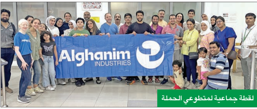
لقطة جماعية لمتطوعي الحملة

أنباء الكويت، والذي يعد امتداداً للتعاون القائم والمستمر مع «الهلال الأحمر»، التي يشار إليها بالبنان في جميع أنحاء العالم، لما تقدمه من معونة غير مشروطة لكل الفئات المحتاجة. جدير بالذكر أن صناعات الغانم، تعمل على مدار العام مع العديد من الجهات والمؤسسات المحلية والعالمية، بهدف تعزيز مبدأ العطاء للمجتمع، والذي يعد أحد المبادئ الأساسية المتصالة في هوية صناعات الغانم كشركة كويتية، وتقوم الشركة أيضاً بالتبرع بمئات الأجهزة الإلكترونية والكهربائية لمصلحة «الهلال الأحمر»، وذلك بشكل سنوي لمساعدة المحتاجين.