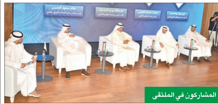
المشاركون في الملتقى

أهدافها تطبيق مفهوم التكنولوجيا الرقابية Suprtech، وربط الأنظمة التقنية للوحدة مع الجهات الحكومية والجهات المرخص لها من أجل إنجاح بيانات دقيقة وأنيقة. وتذكر أن مبادرة «بيمة ضد الغير» هي مبادرة نظام توحيد وثيقة تأمين المسؤولية المدنية الناشئة عن حوادث المرور التأمين الإجباري للمركبات (أو «بيمة ضد الغير»)، تهدف إلى تحديد شروط الهالك الكلي للمركبة، والتعويض عن كل حادث، وتحسين نسب الاستهلاك للمركبات، وتوحيد أسعار الوثيقة بالسوق، وتسهيل إجراءات تجديد وإصدار الوثيقة، وخلق منافع تأمينية أفضل وتغطية أشمل للمصلحة المؤمن له والغير، والقضاء على حالات التزوير والتلاعبات.