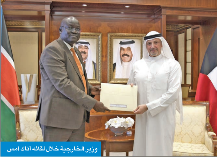
وزير الخارجية خلال لقائه أتابك أمس

تلقى سمو أمير البلاد الشيخ نواف الأحمد رسالة خطية من رئيس جنوب السودان سيلفا كير مبادرته تتصل بالعلاقات الثنائية الوثيقة التي تربط البلدين الصديقين. وتسلم الرسالة وزير الخارجية الشيخ سالم الصباح خلال لقائه وزير الشؤون الإنسانية وإدارة الكوارث في جنوب السودان، البينو أكون أتابك، بمناسبة زيارته الرسمية والوفد المرافق إلى الكويت.