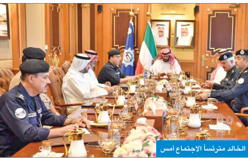
الخالد مترأساً الاجتماع أمس

وجود أمني على كل الطرق الرئيسية والفرعية وفي نطاق المدارس