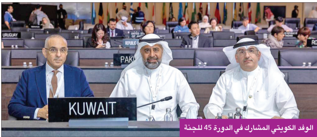
الوفد الكويتي المشارك في الدورة 45 للجنة

حماية تراثنا الثقافي والطبيعي الذي نتقاسمه، وأكد ضرورة تطوير وميكنة الية تقديم وتقييم ملفات المواقع المرشحة لإدراجها في لائحة التراث العالمي، وشدد على أهمية التنوع الجغرافي في تسمية الخبراء لضمان تنوع الثقافات والخبرات في اللجنة الخاصة بتقييم المواقع.