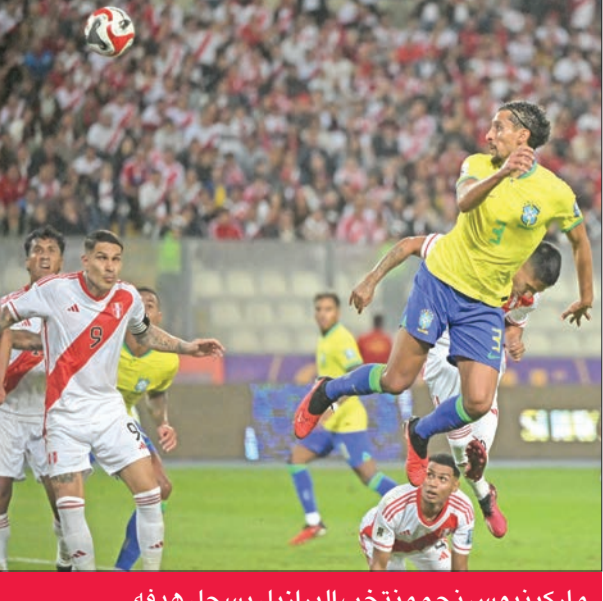
ماركينوس نجم منتخب البرازيل يسجل هدفه

مدد المنتخبين الأرجنتيني والبرازيلي بدايتهما القوية في تصفيات أميركا الجنوبية المؤهلة لبطولة كأس العالم 2026 لكرة القدم، وحقق كل منهما انتصاره الثاني على التوالي، في الجولة الثانية من التصفيات. وواصل المنتخبين سباقهما على الصدارة، التي يستحوذ عليها المنتخب البرازيلي حالياً برصيد ست نقاط، وبفارق الأهداف فقط أمام نظيره الأرجنتيني بطل العالم. في لاباز، وعلى ارتفاع أكثر من 3600 متر فوق مستوى سطح البحر، حقق المنتخب الأرجنتيني (راقصو التانغو) فوزاً مهماً جداً بالتغلب على ضيفه البوليفي 3-صفر، رغم عدم مشاركة النجم الأرجنتيني المخضرم ليونيل ميسي في المباراة. وسجل أهداف المنتخب الأرجنتيني إنزو فيرنانديز ونيكولاس تاغليايفكو ونيكولاس غونزاليس في الدقائق 31 و41 و83، ولعب النجم المخضرم أنخل دي ماريا دوراً كبيراً في هذا الفوز الثمين، حيث صنع الهدفين الأول والثاني للمنتخب الأرجنتيني، وقاد الفريق