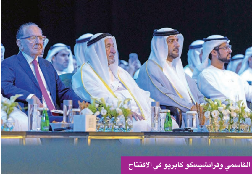
القاسمي وفرانثيسكو كاريو في الافتتاح

افتتح سمو الشيخ الدكتور سلطان بن محمد القاسمي، عضو المجلس الأعلى حاكم الشارقة، صباح أمس، بحضور سمو الشيخ سلطان بن أحمد بن سلطان القاسمي، نائب حاكم الشارقة رئيس مجلس الشارقة للإعلام، وفعاليات الدورة الـ12 من المنتدى الدولي للاتصال الحكومي، الذي ينظمه المكتب الإعلامي لحكومة الشارقة في مركز إكسبو الشارقة على مدى يومين، ويستضيف أكثر من 250 متحدثاً ومشاركاً تحت شعار «موارد اليوم... ثروات الغد».