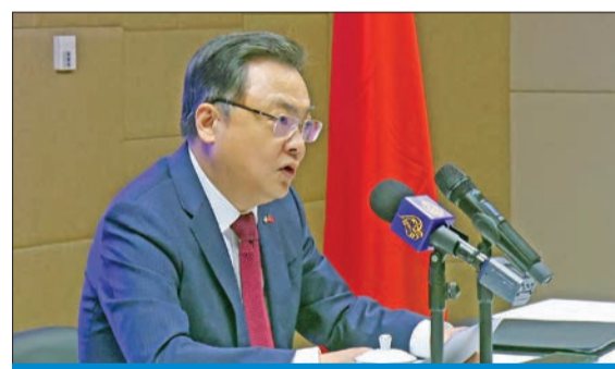
السفير الصيني متحدثاً خلال المؤتمر الصحفي أمس

ولفت إلى أن «زيارة ولي العهد ستسلي استقبالاتاً حاراً من الجانب الصيني»، مؤكداً أن «هذه الزيارة مهمة