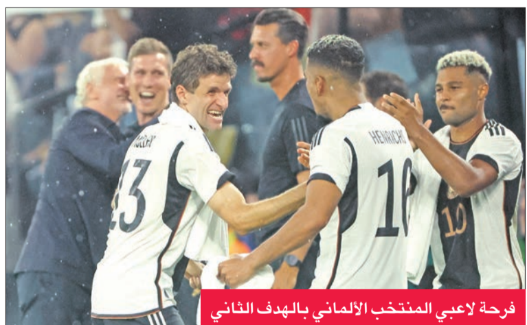
فرحة لاعبي المنتخب الألماني بالهدف الثاني

بفوز معنوي مهم على نظيره الفرنسي 2-1 في مباراة دولية ودية على ملعب سيفغال إيدونا بارك، الثلاثاء. وسجل توماس مولر (4) ولوروا