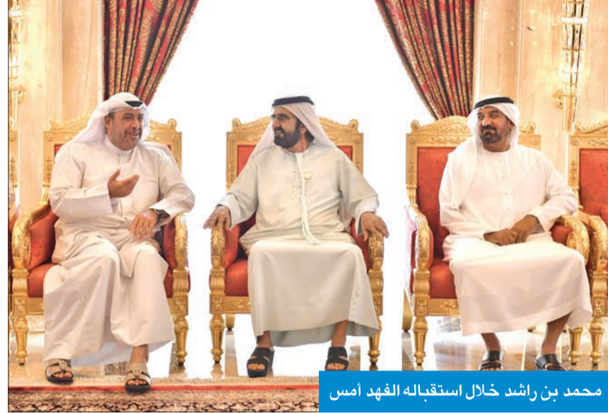
محمد بن راشد خلال استقباله الفهد أمس

وصادق تمنياته له بدوام الصحة والعافية، ولدولة الكويت وشعبها الكريم بمزيد من التقدم والرخاء. وتم خلال اللقاء الذي جرى في قصر زعبيل بدبي، استعراض