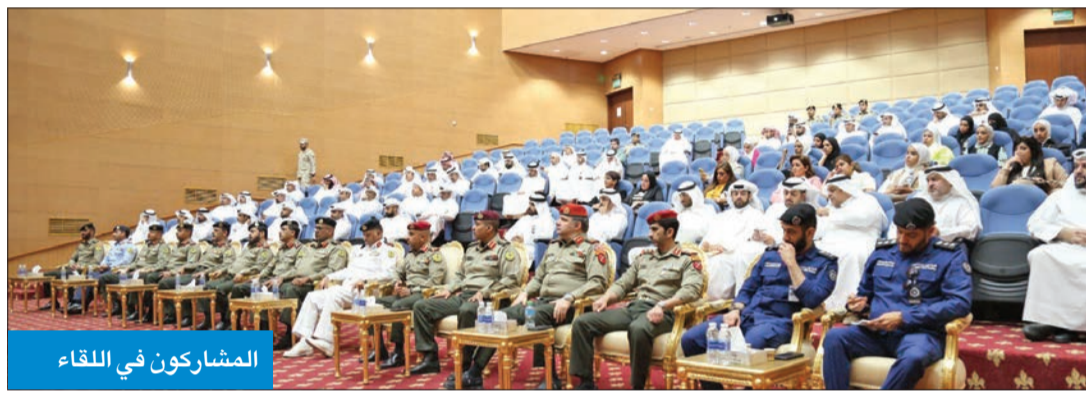
المشاركون في اللقاء

وأضاف الجسار أن المجندين ينتقلون بعد ذلك لاستكمال المدة المتبقية لهم من خدمتهم العاملة ومدتها عشرة أشهر، أعد لهم فيها برنامج تدريبي وعملي مكثف، وفقاً