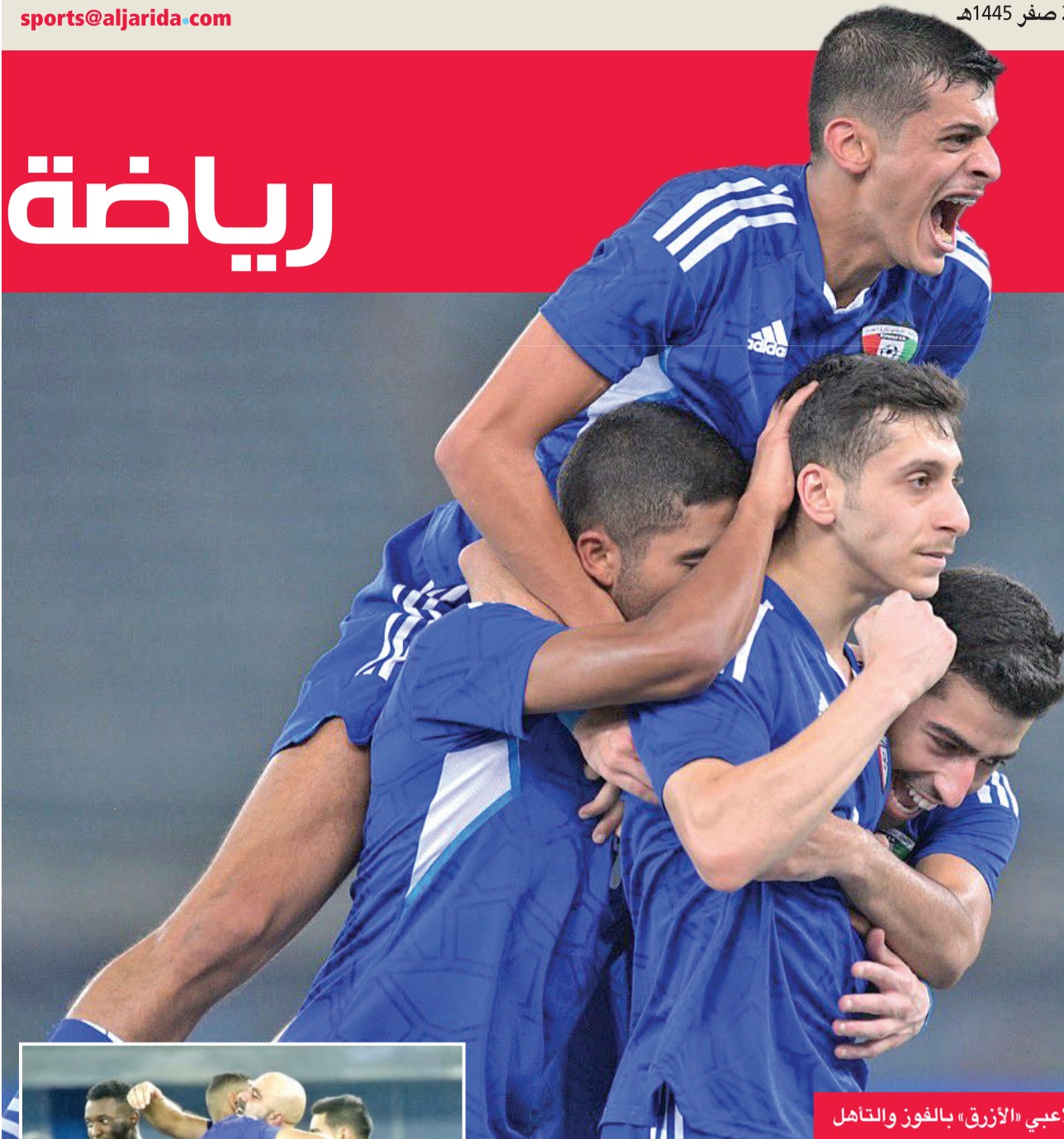
فرحة عارمة للاعبي «الأزرق» بالفوز والتأهل