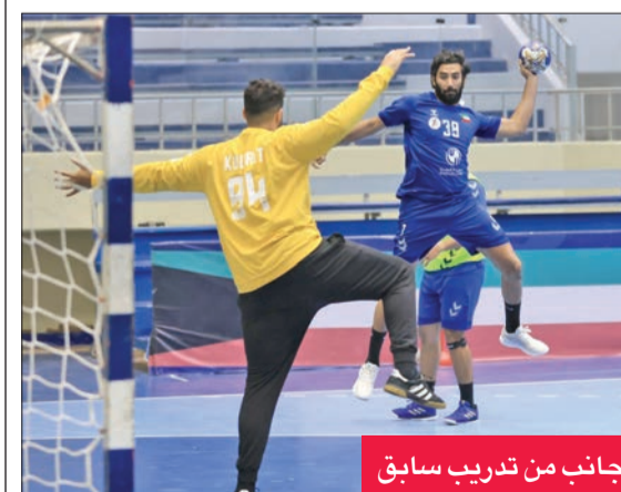
جانب من تدريب سابق