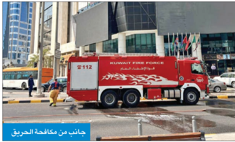
جانب من مكافحة الحريق

أعلنت إدارة العلاقات العامة والإعلام بقوة الإطفاء العام أن الفرق التابعة لها أخدمت أمس حريقاً يواجه أحد الفنادق في العاصمة.