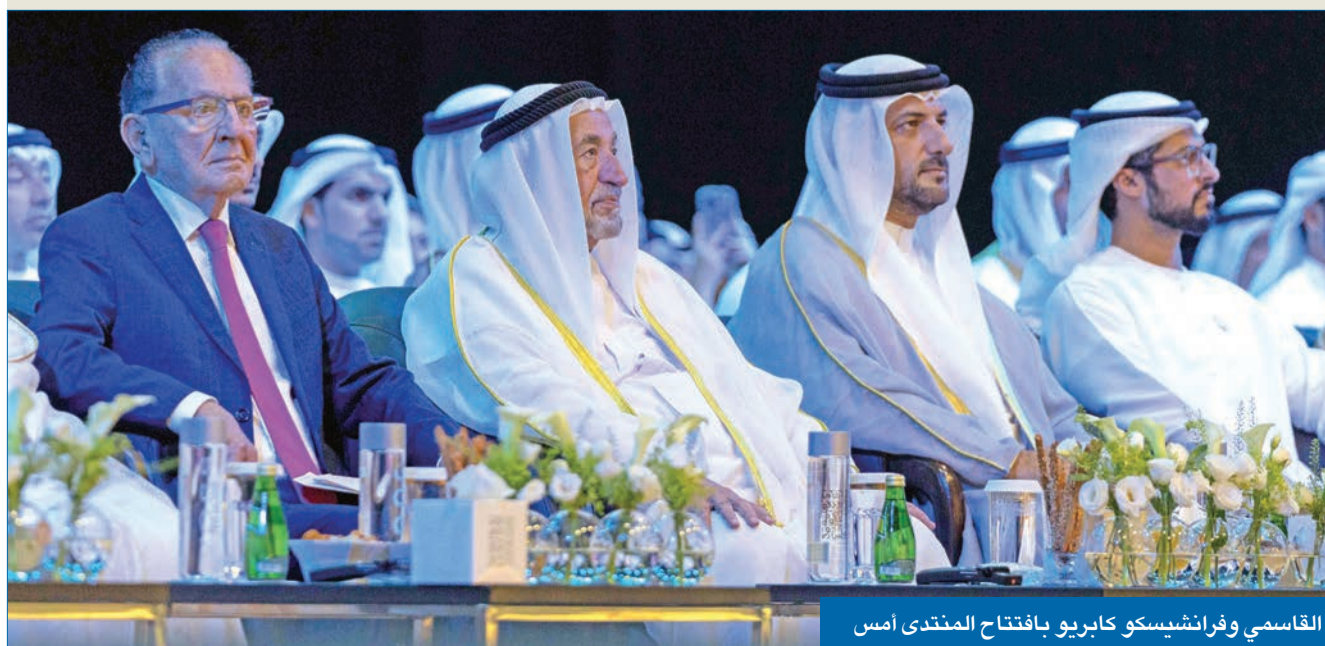
القاسمي وفرانسييسكو كابريلو بافتتاح المنتدى أمس

الافتتاح شهد خطاباً ملهماً للقاضي الرحيم أثنى فيه على الإمارات كمثال رائد