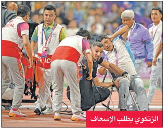
الزنكوي يطلب الإسعاف