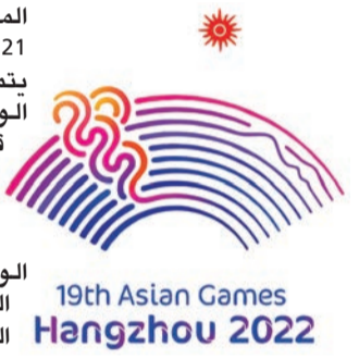
19th Asian Games Hangzhou 2022

أضاف أبطال الرماية الكويتية ميداليتين فضيتين في منافسات مسابقة «تراب»، رافعين بذلك غلة الكويت من الميداليات الملونة إلى 5.