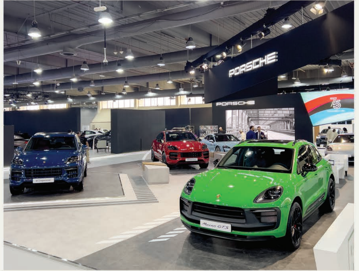
عرض خمس طرازات مختلفة لسيارات بورشه

الفاخر، ولوحة التحكم المزودة بأحدث التقنيات الرقمية، موفرة بذلك تجربة قيادة استثنائية للركاب بالمقاعد الأمامية. كما لفتت سيارات بورشه أنظار الحضور، بفضل دمجها بين الألوان الخالية للهيكل الخارجي والتصاميم الساحرة للمقصورة الداخلية، حيث تميزت الكاين باللون الأزرق ميتاليك للهيكل الخارجي، والمقصورة الداخلية المصنوعة من الجلد باللونين الأسود والأحمر البوردو، فيما امتازت الكاين كوبيه باللون الأحمر كارمين، مع مقصورة داخلية من جلد «كلوب» باللون الأسود بازلت. ولا يمكننا أن ننسى طراز المكان جي تي إس الفريد باللون الأخضر بايثون والمقصورة الداخلية بمجموعة جي تي إس، وباناميرا بلاتينيوم بلون دولميت الفضي الميتاليك، ذات المقصورة الجلدية الجذابة باللون البني الكوهيبا و«جلد «كلوب». كما تألفت التايبان بلونها الأزرق الجلدي الميتاليك والمقصورة الداخلية المصنوعة من أجود أنواع الجلد الفاخر باللونين الأسود والأحمر البوردو الذي يحاكي روح الفخامة والرفاهية. وبذلك، أصبح جناح مركز بورشه الكويت محط الأنظار، مقدماً لزواره تجربة فريدة لا مثيل لها. إن تواجد مركز بورشه الكويت في معرض Auto World Show أضفى رونقاً من نوع آخر، حيث تعبر هذه العلامة التجارية الرائدة في مجال السيارات مثالاً حياً على الابتكار والأداء الفائق، كما أن الكشف عن سيارة بورشه كاين الجديدة، وغيرها من الطرازات الأيقونية، عكس التزام بورشه وتفردتها بالتميز والريادة في صناعة السيارات الرياضية. ومن خلال المعرض، أتيحت لبورشه تقديمها وسعيها لتشكيل مستقبل القيادة، كما منحت الحضور فرصة عيش تجربة واقعية تجمع بين التقنيات المتطورة والتصميم العصري لتجربة قيادة مستقبلية وتقديم مغامرة استثنائية لعشاقها.