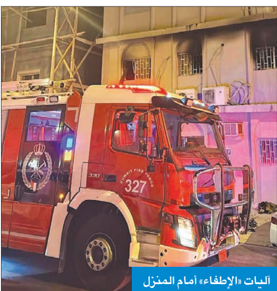
اليات «الإطفاء» أمام المنزل

لقي مواطن ومواطنة مصرعهما، وأصيب اثنان بحالات اختناق وإجهاد حراري، من جراء حريق كبير ألتهم أحد المنازل في ضاحية صباح السالم، وأسفر عن خسائر مادية جسيمة لحقت بالمنزل. وذكرت إدارة العلاقات العامة والإعلام بقوة الإطفاء العام أن إدارة العمليات المركزية تلقت بلاغاً مساء أمس الأول، يفيد بانطلاق حريق في منزل بمنطقة صباح السالم، فتم تحريك مركزي إطفاء مشرف والقرين إلى الموقع، حيث تبين أن الحريق في شقة بالدور الأول من المنزل، وأن هناك أشخاصاً محاصرين داخل منطقة الحريق، وقد تمكن رجال الإطفاء من إنقاذ 4 أشخاص حاصرتهم النيران، وكانت حالتهم حرجة للغاية، ونقلهم إلى المستشفى فنيو الطوارئ الطبية. وأشارت الإدارة إلى أن رجال الإطفاء عملوا على مكافحة الحريق والسيطرة عليه، ومنعوا وصوله إلى بقية أرجاء المنزل. من جانبها، قالت مصادر أمنية لـ «الجريدة» إن رجلاً وامرأة لفظا أنفاسهما الأخيرة بالمستشفى، متأثرين بالجروح والحروق التي لحقت بهما من جراء الحادث، وقد أحال رجال الأدلة الجنائية جثتيهما إلى إدارة الطب الشرعي، وتم تسجيل قضية حريق ووفاة وإصابة.