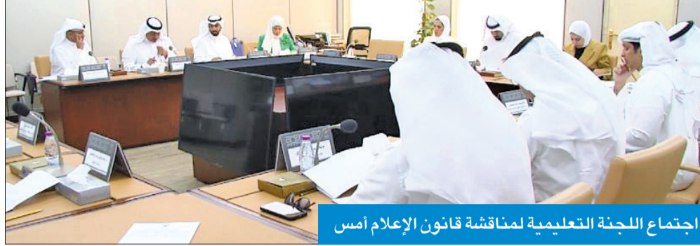
اجتماع اللجنة التعليمية لمناقشة قانون الإعلام أمس

التوافق على القانون كما يريده الشعب والنواب مبدئياً أن النواب قدموا ملاحظاتهم مكتوبة إلى وزير الإعلام، الذي أكد استعداده للتجاوب مع بعضها واستشارة الحكومة في البعض الآخر. وأضاف أن النواب انتقدوا المبالغ والغرامات المبالغ فيها في ظل القانون الجديد، والوزير المطيري وعد بدراستها من جديد، وتم الطلب من الوزير أيضاً وضع ضوابط حول تمجيد الشخصيات والأحزاب، كما طلبنا التعديل على المادة الخاصة بالأعمال العدائية ضد الدول الصديقة، فهذه المادة كانت فضفاضة، ويجب أن تضبط صياغتها، فبموجب النص الذي