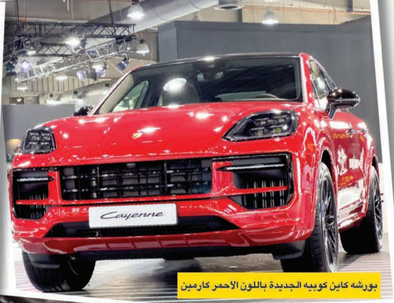
بورشه كاين كوبيه الجديدة باللون الأحمر كارمين