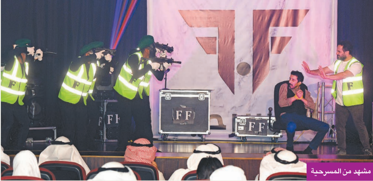
مشهد من المسرحية