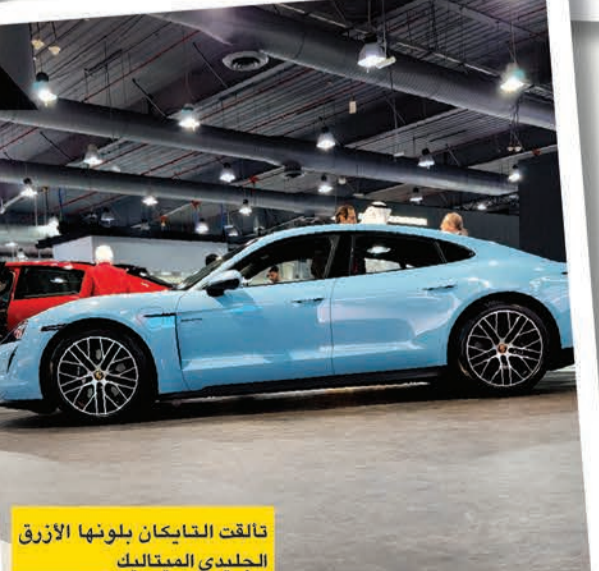
تألفت التايبان بلونها الأزرق الجلدي الميتاليك