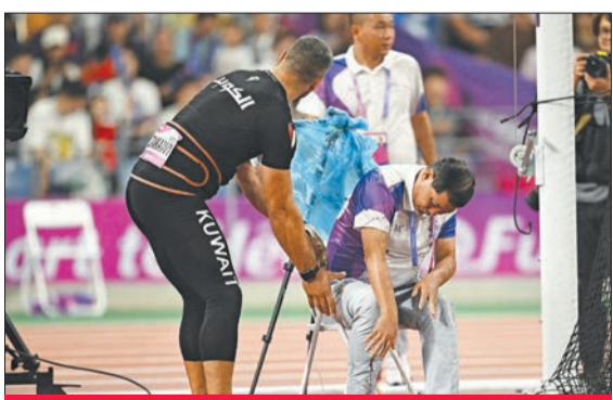
الحكم يتالم ومواساة من الزنكوي

وأضاف «رفعت رأسي، واكتشفت أن المطرقة ارتدت من الأرض إلى ساق الحكم، فهرعت سريعاً إليه وحاولت إسعافه، خصوصاً أنه كان في حالة من الصدمة، وكان يتولى من الألم». وتابع «بعد وصولي إليه اكتشفت شقاً في بطنه ورأيت الدماء تنف من الساق بكثافة، وعلمت أن ثمة كسراً في الساق. عندها ربطت القدم بقوة حتى أوقف النزيف إلى أن وصلت سيارة الإسعاف، فساعدتهم بوضعه على حاملة الإسعاف لنقله إلى المستشفى».