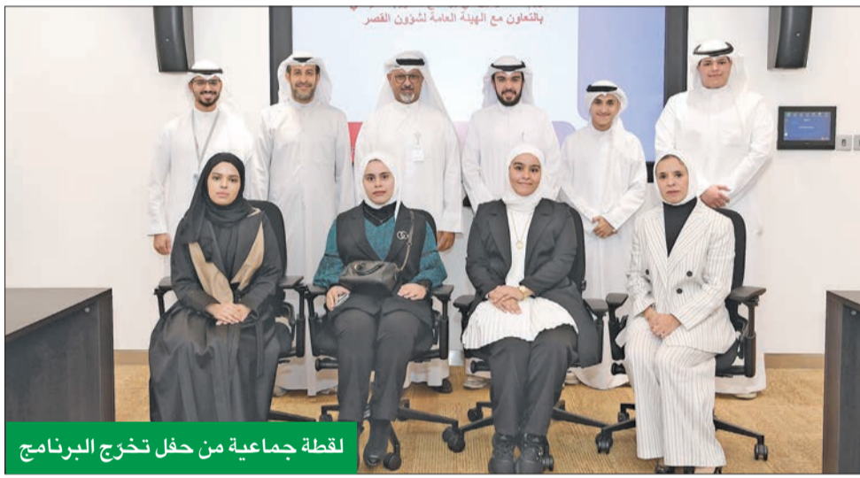
لقطة جماعية من حفل خريج البرنامج

نظم بنك بوبيان برنامج تدريب ضمن مشروع «بادر ويانا»، الذي تنظمه الهيئة العامة لشؤون القصر، ويهدف إلى إعداد وتدريب مجموعة من طلبة الجامعات والمعاهد، في إطار سعي البنك الدائم إلى الاستثمار في الكوادر الوطنية الشابة وتطويرها لسفح مهاراتهم.