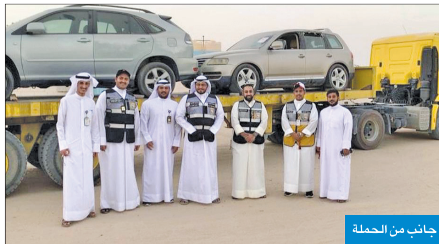
جانب من الحملة

نظافة الروضة حملة واسعة لإزالة المركبات المهمة والسكراب بمنطقة الخالدية، وأسفرت عن رفع 15 مركبة ما بين مهمة وسكراب. وأكد مدير إدارة النظافة واشغالات الطرق في بلدية محافظة العاصمة سعد