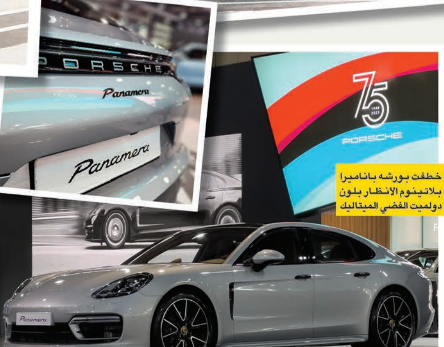
خطفت بورشه باناميرا بلاتينيوم الأنظار بلون دولميت الفضي الميتاليك