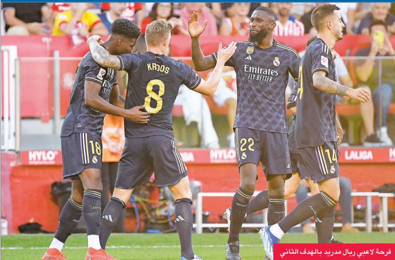
فرحة لاعبي ريال مدريد بالهدف الثاني