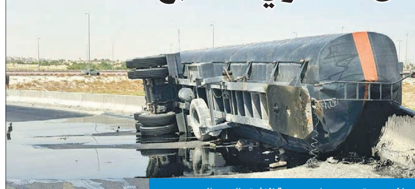
جانب من تسرب مواد سريعة الاشتعال من الصهريج