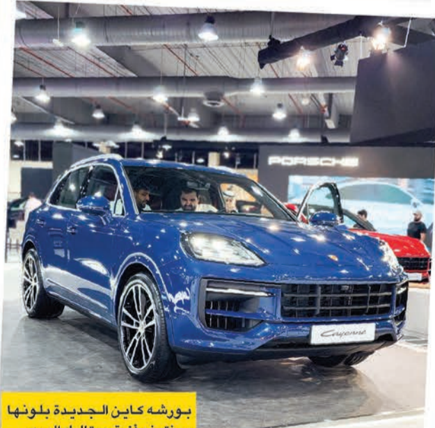
بورشه كاين الجديدة بلونها مونتيفغو أزرق ميتاليك الميه