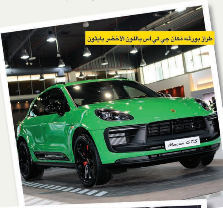
طراز بورشه مكان جي تي إس باللون الأخضر بايثون