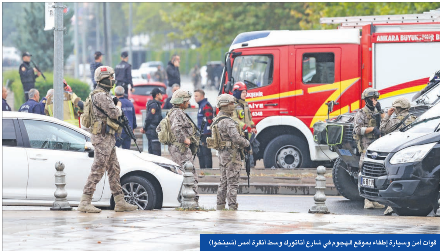
قوات أمن وسيارة إطفاء بموقع الهجوم في شارع أتاتورك وسط أنقرة أمس

أردوغان يستعجل صياغة دستور جديد ويدعو إلى انتظار «ظروف مناسبة» لتدخل عسكري ضد الأكراد