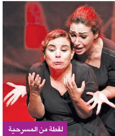
لقطة من المسرحية

أول مسرحية كويتية تقدّم في القاهرة لموسم مسرحي كامل