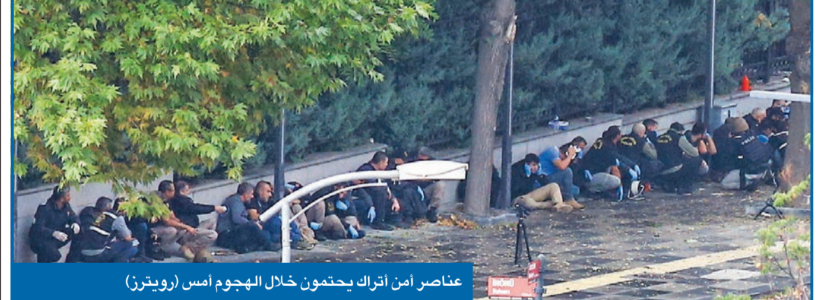
عناصر أمن أتراك يحتمون خلال الهجوم أمس

● الكويت تدين العمل الإرهابي وتؤيد الإجراءات الأمنية التركية ● أردوغان يستعجل الدستور الجديد وينتظر الوقت المناسب لمهاجمة الأكراد