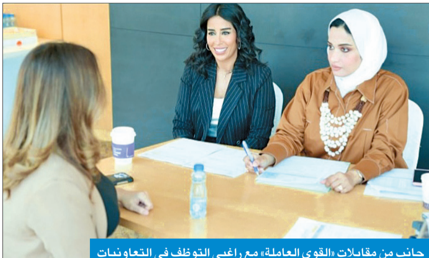
جانب من مقابلات «القوى العاملة» مع راغبي التوظيف في التعاونيات

إلى ذلك، وللميوم الثالث توالياً تواصل الهيئة العامة للقوى العاملة، ممثلة في قطاع شؤون تنمية العمالة الوطنية، إجراء مقابلات المواطنين المتقدمين لشغل الوظائف الإشرافية في الجمعيات التعاونية وفقاً للقرار الوزاري رقم 68 لسنة 2023، بشأن الشروط والمؤهلات والخبرات المطلوبة لكل مسمى وظيفي من المناصب الإشرافية، عقب عملية فرز المتقدمين عبر منصة «فخرنا»، خلال الفترة