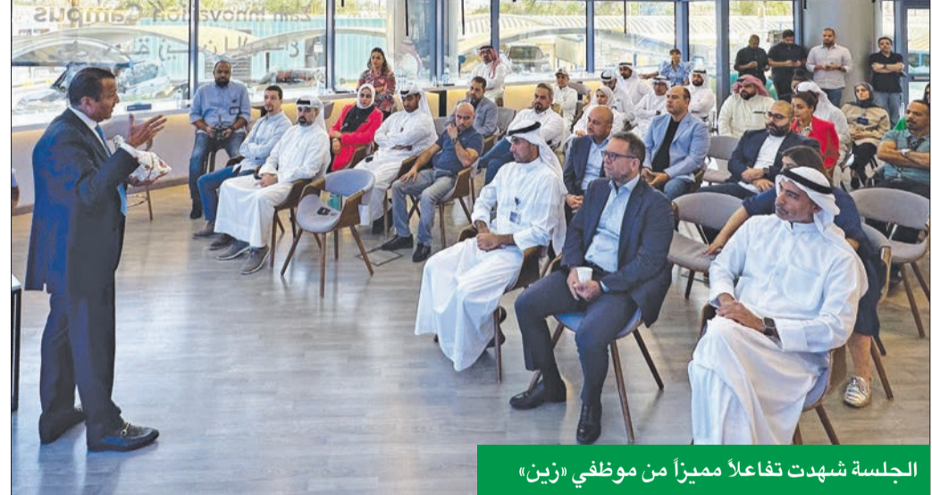
الجلسة شهدت تفاعلاً مميزاً من موظفي «زين»