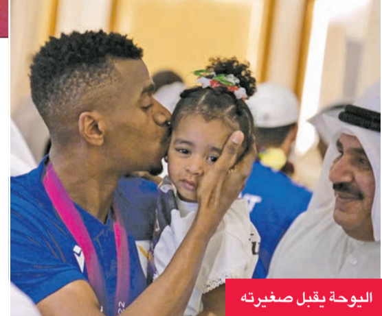
البويع يقبل صغيرته