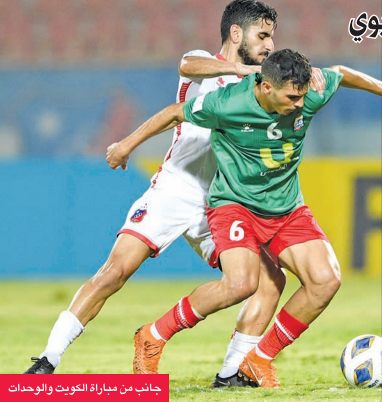
جانب من مباراة الكويت والوحدات