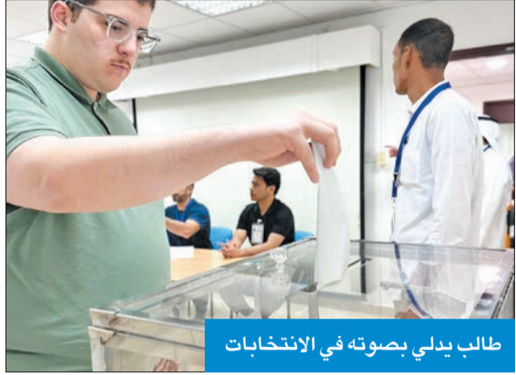
طالب يدلي بصوته في الانتخابات

إلى أن إقبال الطالبات كان مرتفعاً، حيث وصلت نسبة الحضور حتى 12 ظهراً 62%، موضحة أن عدد الطالبات اللاتي أدلين بأصواتهن بلغ نحو 480 طالبة من أصل 775 طالبة يحق لهن التصويت في انتخابات كلية الطب.