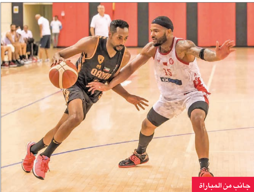
جانب من المباراة

مشواره بمنافسات المجموعة الأولى، التقى قطر القطري في وقت متأخر من مساء أمس.