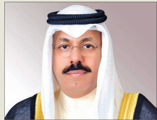
بعث سمو الشيخ أحمد نواف الأحمد رئيس مجلس الوزراء ببرقية تهنئة إلى ملك مملكة ليسوتو ليتسي الثالث بمناسبة العيد الوطني لبلادته.