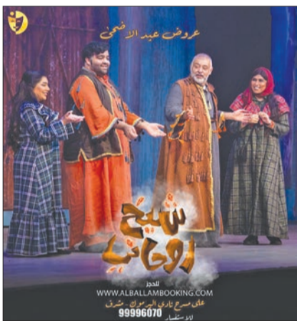
مشهد من مسرحية «شيخ روحاني»