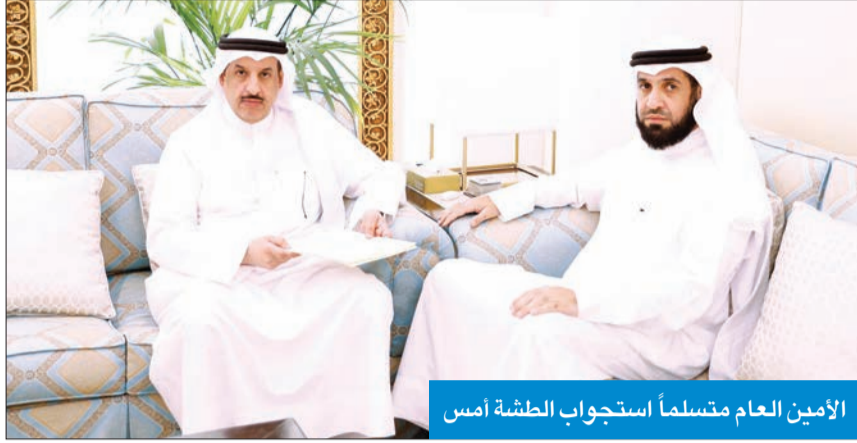
الأمين العام مستمسماً استجواب الطشة أمس

استناداً إلى أحكام المواد 100 و101 و102 من الدستور وأحكام المواد 133 و134 و135 من اللائحة الداخلية لمجلس الأمة، تقدم النائب مبارك الطشة باستجواب إلى وزيرة الأشغال العامة أماني بوقماز من 4 محاور هي: الفشل في إنجاز وصيانة وإصلاح الطرق وتعطل المشاريع، وشبهات الفساد والتنفيع وتضارب المصالح وهدر المال العام، والتراخي والتهاون في تحصيل مبالغ غرامات التأخير المستحقة على المقاولين في المناقصات والعقود، والتجاوز على الدستور والقانون وتجاهل الرد على الأسئلة البرلمانية.