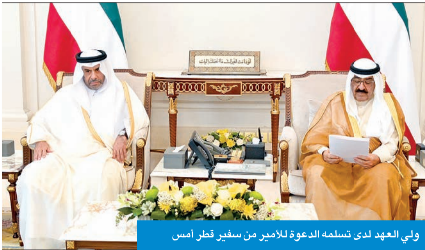
ولي العهد لدى تسلمه الدعوة للأمير من سفير قطر أمس

العبدالله، ووزير شؤون الديوان الأميري الشيخ محمد العبدالله، ومدير مكتب سمو ولي العهد الفريق متقاعد جمال الذباب، والوكيل في الديوان الأميري الشيخ خالد العبدالله، ووكيل الشؤون الخارجية بمكتب سمو ولي العهد مازن العيسى. واستقبل سمو ولي العهد بقصر بيان، أمس، رئيس مجلس الأمة أحمد السعدون. في مجال آخر، بعث سموه ببرقية تهنئة إلى ملك مملكة ليسوتو ليتسي الثالث، ضمنها سموه خالص تهنائه بمناسبة العيد الوطني لبلادته، راجياً له دوام الصحة والعافية.