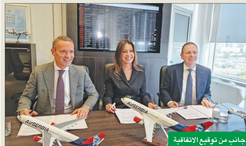
جانب من توقيع الاتفاقية

موسم صيف هذا العام نمواً غير مسبوق، وفي الوقت نفسه واجهت بعض التحديات في مجال المناولة الأرضية، لذا أود تقديم اعتذارنا مرة أخرى لجميع الركاب الذين تأثرت تجربتهم معنا، جراء