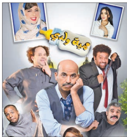
ملصق مسرحية «ممية ولدي»