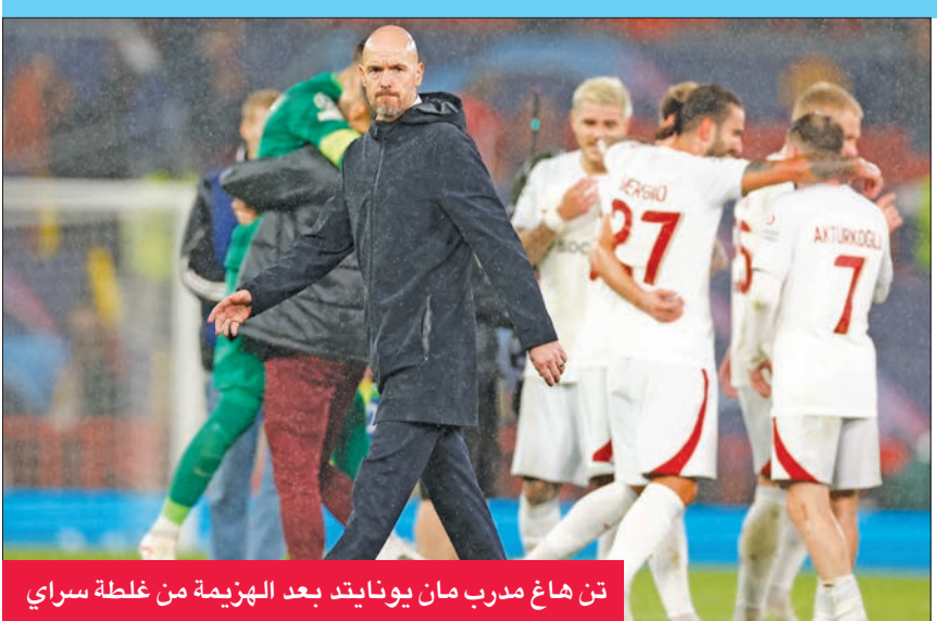
تن هاغ مدرب مان يونايتد بعد الهزيمة من غلطة سراي

جداً كما يرى الجميع لكننا سنخرج منها متحدين. نحن نقاتل معاً، نحن متماسكون، نحن ندعم بعضنا البعض. أنا، المديرين، الفريق، جميعنا سنقاتل معاً. هذا ليس نحن. نحن نعلم أنه يتعين علينا فعل ما هو أفضل وبالتعاون معاً سنخرج (من هذا الوضع)».