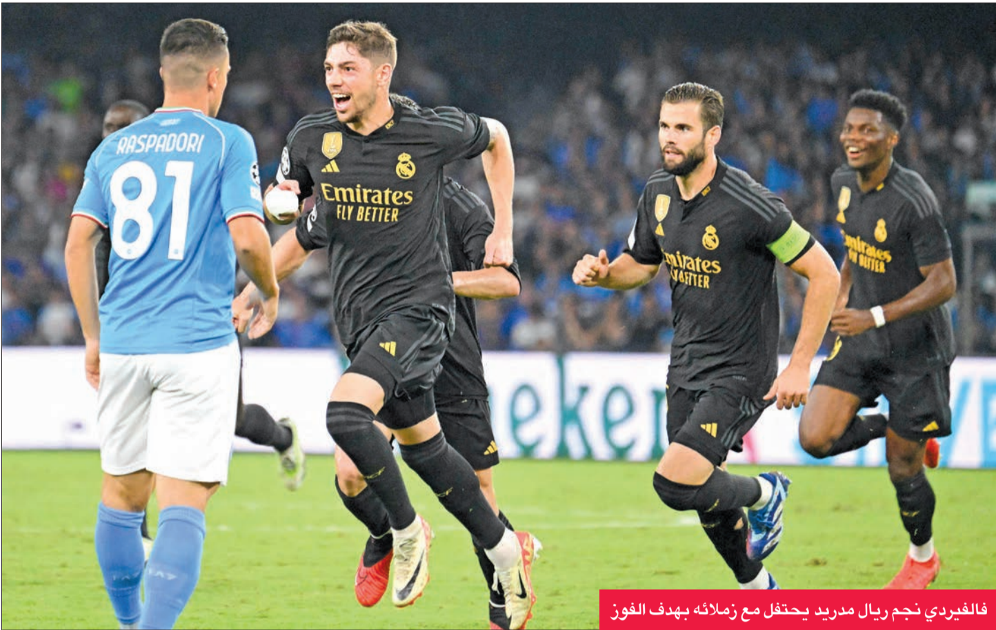
فالفيردي نجم ريال مدريد يحتفل مع زملائه بهدف الفوز

حقق المدرب الإيطالي كارلو أنشيلوتي عودة موفقة إلى ملعب فريقه السابق نابولي، بعد فوز ريال مدريد الإسباني على مضيفه 2-3 في مباراة مثيرة الثلاثاء في دور المجموعات لدوري الأبطال الذي شهد سقوط مانشستر يونايتد وأرسنال الإنكليزيين أمام غلطة سراي التركي ولنس الفرنسي. في المجموعة الرابعة، كان ريال الطرف الأخطر، لكن نابولي فاجاه بهدف إثر ركلة ركنية أخفق الحارس كييا أريسابالغا في تدبيرها لتصل إلى المدافع البرازيلي ناتان الذي حولها برأسه، فأرادت من العارضة وسقطت أمام الترويجي ليو أوستيغارد الذي حولها برأسه في الشباك (19).