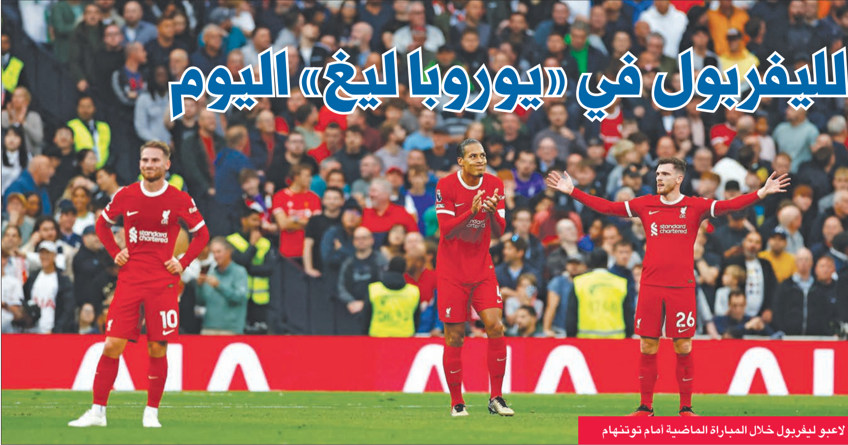
لاعبو ليفربول خلال المباراة الماضية أمام توتنهام

يستقبل ليفربول الإنكليزي ضيفه سان جيواز البلجيكي اليوم في الجولة الثانية من منافسات المجموعة الخامسة بمسابقة الدوري الأوروبي لكرة القدم.