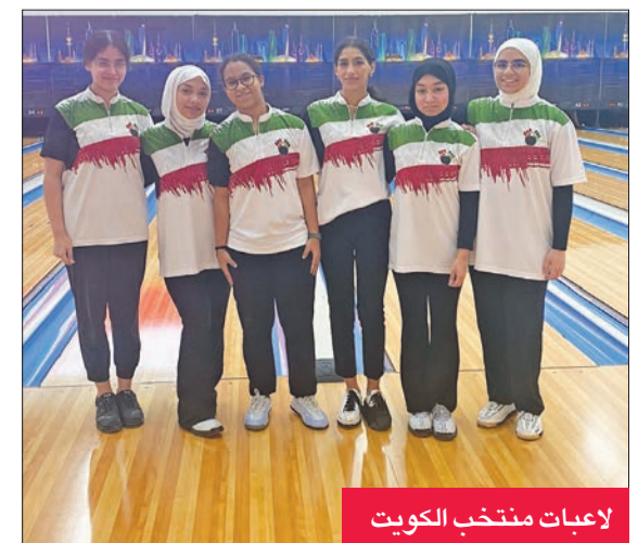
لاعبات منتخب الكويت

أكد رئيس الاتحاد الإفريقي وعضو المكتب التنفيذي بالاتحاد الدولي للبولينغ، فاروق هريدي، ثقته في قدرة الكويت على تقديم نسخة مثالية من مونديال العالم للبولينغ، الذي انطلق بالكويت