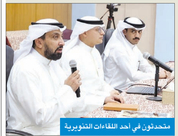
متحدثون في أحد اللقاءات التنويرية

أعلنت وزارتا التربية والتعليم العالي والبحث العلمي عقد سلسلة من اللقاءات التنويرية لطلبة الصف الثاني عشر علمي في جميع المناطق التعليمية، لتوعية الطلبة بألية التقديم على الاختبارات الوطنية الموحدة لقياس القدرات للطلبة الراغبين في التقدم للتخصصات الطبية والهندسية للقبول في قطعتي البعثات الداخلية والخارجية، تنفيذاً لتوجيهات وزير التربية وزير التعليم العالي والبحث العلمي، د. عادل المنع. وأشارت الوزارة، في بيان صحفي، إلى انطلاق اللقاءات التنويرية من منطقة الفروانية التعليمية في مدرسة لبيد بن ربيعة بمنطقة الصف الثاني عشر العلمي، موضحة أنها تستمر مدة أسبوعين لتشمل جميع طلبة المدارس الحكومية في جميع المناطق التعليمية، وتعقد لقاءات