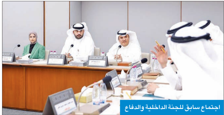
اجتماع سابق للجنة الداخلية والدفاع