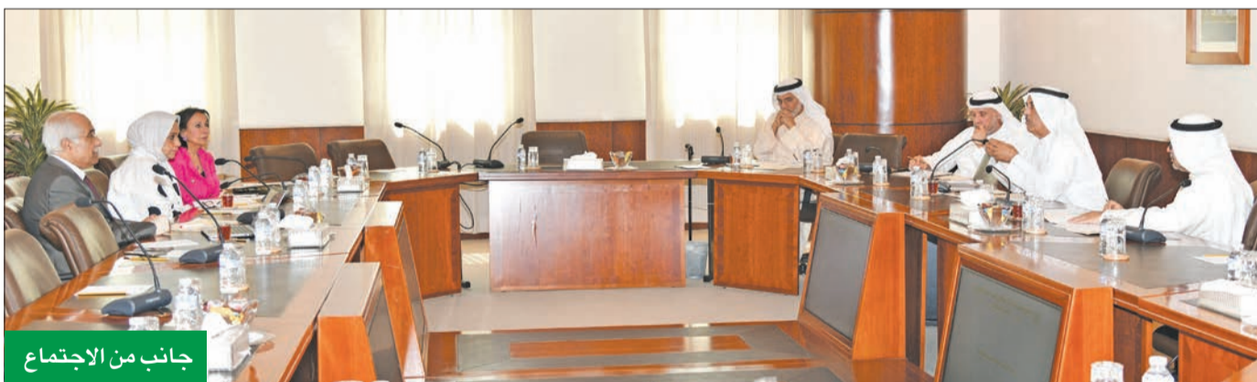
جانب من الاجتماع

وفي الختام، أشار الحمضي إلى أن «الغرفة» توأكب المتغيرات المحلية والإقليمية والعالمية، وتتطلع دائماً لأن يقدم المركز البرامج النوعية الرائدة ذات القيمة المضافة، والعائد المؤسسي الكبير، والمردود المهني والغني العائلي، مما يساهم مساهمة مباشرة في تعزيز المهارات الأكاديمية والمهنية للعاملين بالدولة، سواء بالقطاع الأهلي أو الحكومي.