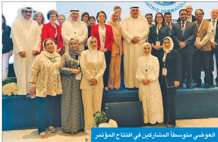
العوضي متوسطاً المشاركين في افتتاح المؤتمر

أكد وزير الصحة د. أحمد العوضي اهتمام الوزارة بأمراض الجلد لدى الأطفال خلال السنوات الأخيرة. وقال العوضي، في كلمته خلال افتتاح فعاليات المؤتمر الإقليمي الأول للأمراض الجلدية لدى الأطفال والذي ينظمه مجلس أقسام الجلدية في وزارة الصحة بالتعاون مع الجمعية الدولية للأطباء الجلدية ومعهد الكويت للاختصاصات الطبية، إن تطوير طب الأمراض الجلدية في مقدم الشوب ورفاهيتها. وأضاف أن البحث العلمي يعد أولى خطوات حلول المشكلات لما يعانيه الأطفال، مشدداً على اهتمام الوزارة الدؤوب لمواكبة التقدم السريع في التخصصات الطبية وتعزيز التعاون الطبي بين الوزارة وأرقى المراكز الطبية الإقليمية والعالمية لسعي نحو تقديم أفضل وأحدث الخدمات الصحية والطبية للمواطنين. وأكد ضرورة تبادل الخبرات والاستمرار في الارتقاء بكفاءة الأطباء والمختصين من