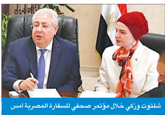
شلتوت وزكي خلال مؤتمر صحفي للسفارة المصرية أمس

أعلنت القنصل العام لمصر لدى البلاد، السفيرة هبة زكي، منح المواطنين الكويتيين تأشيرة دخول جديدة إضافية لمصر مدة 5 سنوات متعددة الدخول على ألا تتجاوز مدة الإقامة الواحدة 90 يوماً، لافتة إلى أن «قيمة رسم هذه التأشيرة تبلغ نحو 250 ديناراً، وذلك لتسهيل على الكويتيين خلال زيارتهم بلدهم الثاني مصر». وخلال مؤتمر صحافي للسفارة المصرية أمس، أوضحت زكي أن «قرار منح الكويتيين هذه التأشيرة، يأتي في إطار تسهيل وإسراع