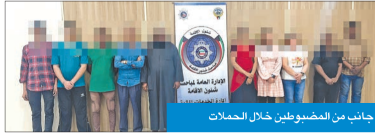
جانب من المضبوطين خلال الحملات

المناطق بتهمة ممارسة الأعمال المنافية للأداب العامة مقابل مبالغ مالية، كما تمكن رجال مباحث قطاع الأمن الجنائي، ممثلاً في الإدارة العامة للمباحث الجنائية «إدارات مباحث المحافظات»، من ضبط 15 وافداً من مختلف الجنسيات في 6 قضايا منفصلة، وعثر بحوزتهم على 265 زجاجة خمر محلية الصنع وزجاجة خمر مستوردة.