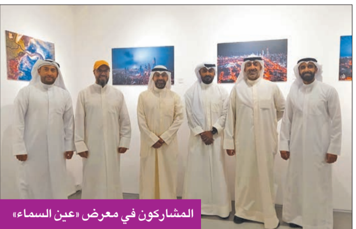
المشاركون في معرض «عين السماء»