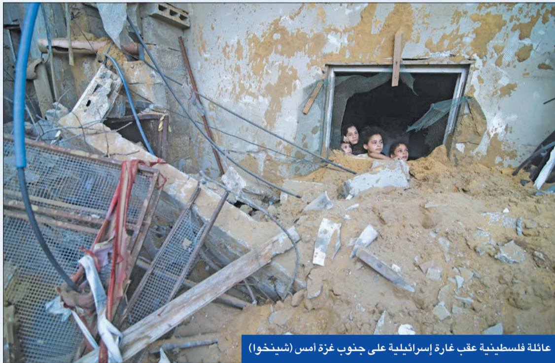
عائلة فلسطينية عقب غارة إسرائيلية على جنوب غزة أمس

وقال عبدالمهيان، عقب محادثات مع أمير قطر تميم بن حمد آل ثاني أن الأطراف التي