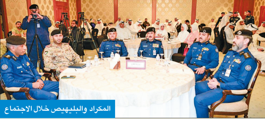
المكراد والبلهيص خلال الاجتماع

عقدت الاجتماع الثاني «لجنة متابعة تنفيذ إطار سندي»