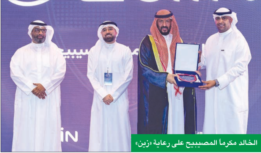
الخالد مكرم المصباح على رعاية «زين»

أطلقتها أكاديمية CODED بالتعاون مع المركز الوطني للأمن السيبراني