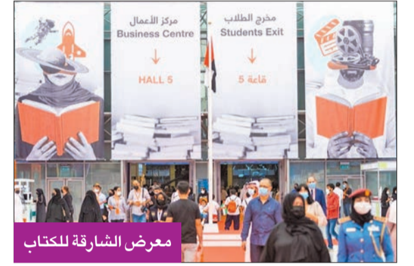
معرض الشارقة للكتاب