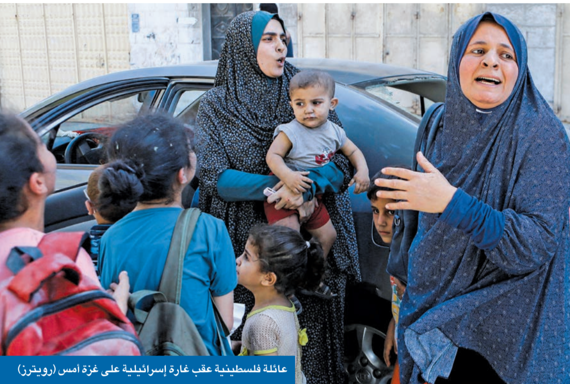
عائلة فلسطينية عقب غارة إسرائيلية على غزة أمس

وقال المجلس، الذي يرأسه محمد جاسم الصقر، في بيان أمس، إن ما تمارسه إسرائيل أمام سمع وبصر المجتمع الدولي من جرائم إبادة وتهجير للشعب الفلسطيني، ومخططاتها لتحويل القطاع إلى معسكر اعتقال وإجبار أكثر من نصف سكانه على إخلاء منازلهم،