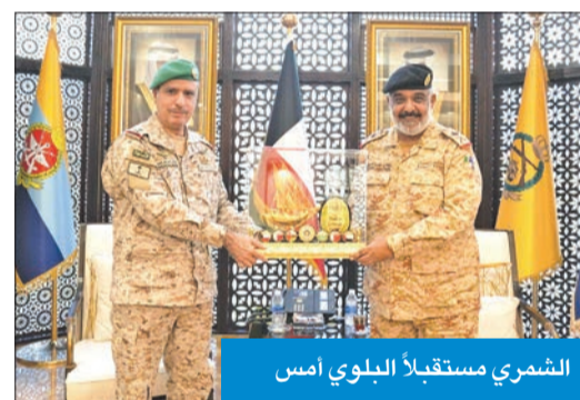
الشمري مستقبلاً البيوي أمس

استقبل رئيس الأركان العامة للجيش بالتفويض، اللواء الركن مهندس دكتور غازي الشمري في مكتبه، صباح أمس، قائد قوات درع الجزيرة اللواء الركن عبدالعزيز أحمد البيوي، بمناسبة زيارته للبلاد. وتم خلال اللقاء تبادل الأحاديث الودية والمواضيع ذات الاهتمام المشترك، لاسيما المتعلقة بالجوانب العسكرية. حضر اللقاء مساعد أمر القوة البرية العميد الركن عبدالله الجبعة.