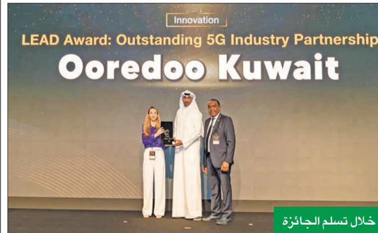
خلال التسلم الجائزة

في حفل توزيع جوائز مجلس سامينا للقيادة والتميز LEAD