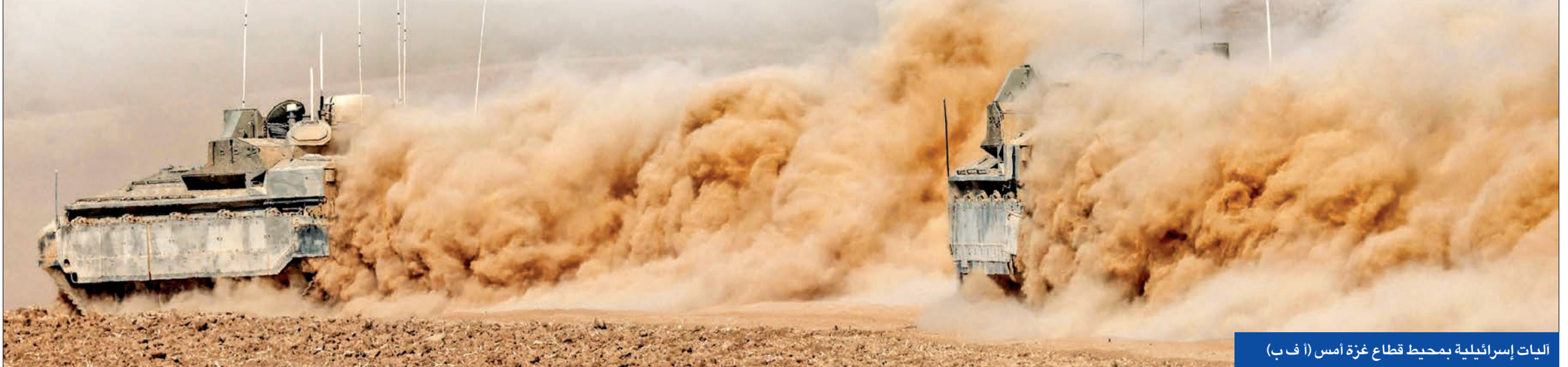
اليات إسرائيلية بحميح قطاع غزة أمس (أ ف ب)

وأكد الضباط أنه لتسهيل عمل الجنود، تم تخفيف قواعد الاشتباه، الرامية لتفادي قتل مدنيين، للسماح بإجراء فحوصات أقل قبل إطلاق النار على أعداء مشتبه بهم. في غضون ذلك، كشفت وزارة الصحة الفلسطينية، عن ارتفاع حصيلة ضحايا العدوان إلى 2329 قتيلاً وأكثر من 9042 جريحاً في