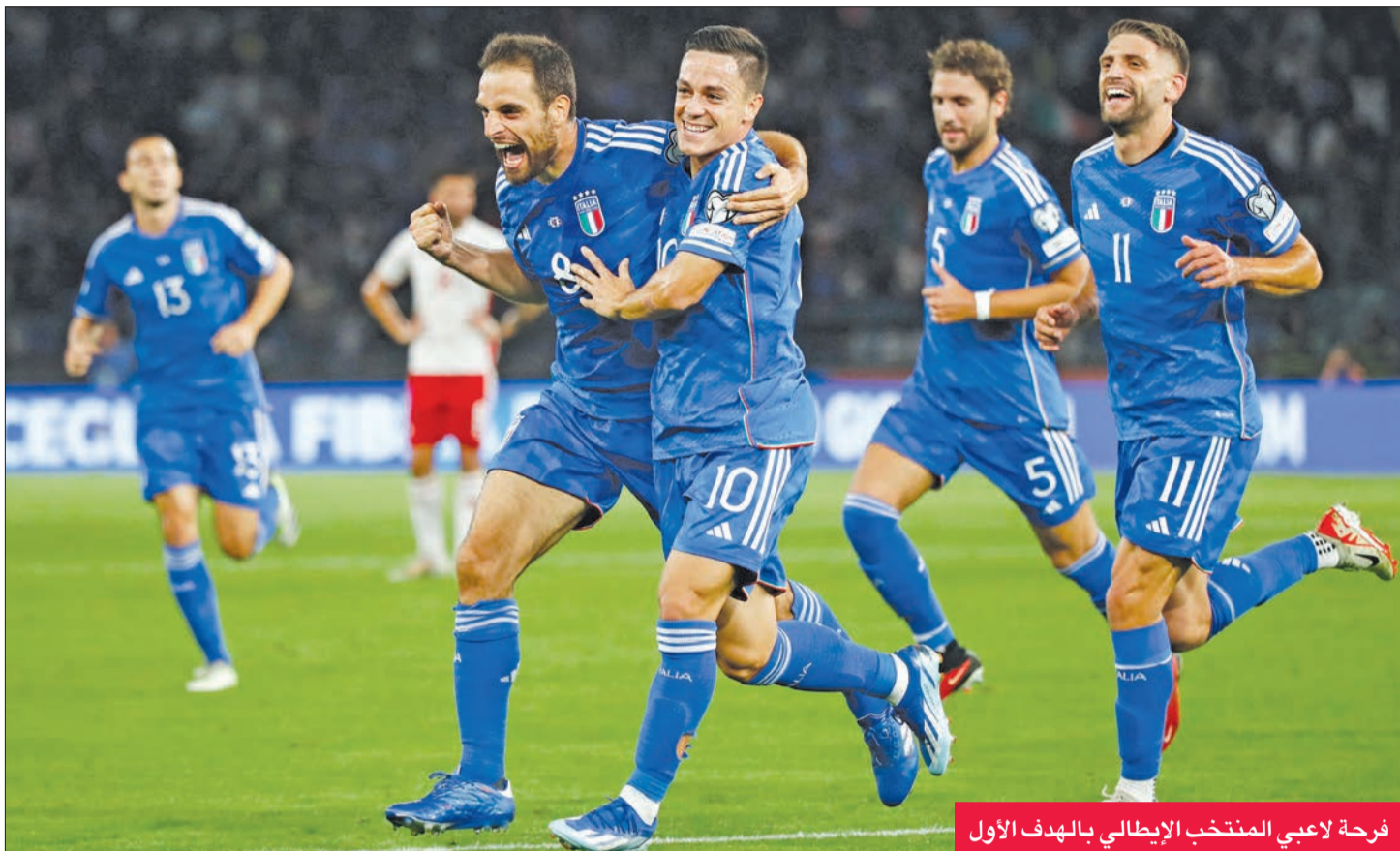
فرحة لاعبي المنتخب الإيطالي بالهدف الأول

سجل المهاجم دومينيكو بيراردي هدفين ليقود إيطاليا للفوز 4- صفر على ضيفتها مالطا، ضمن منافسات المجموعة الثالثة من تصفيات بطولة أوروبا لكرة القدم 2024 أمس الأول.