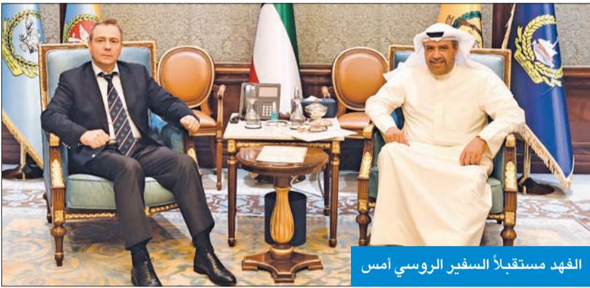
الفهد مستقبلاً السفير الروسي أمس

استقبل نائب رئيس مجلس الوزراء وزير الدفاع الشيخ أحمد الفهد، في قصر بيان أمس، سفيراً تركيا لدى البلاد طوبى نور سونمز. وتم خلال اللقاء استعراض وجهات النظر حول العديد من القضايا والموضوعات ذات الاهتمام المشترك، إضافة إلى بحث أوجه التعاون والعمل الجماعي بين دولة الكويت والدول الشقيقة والصديقة، لاسيما ما يتعلق منها بالجوانب العسكرية. كما استقبل الفهد سفير روسيا الاتحادية لدى البلاد فلاديمير جيلتوف. وجرى خلال اللقاء مناقشة عدد من الموضوعات ذات الاهتمام المشترك ويحث سبل تعزيز أوامر التعاون المتبادل بين البلدين الصديقين، إضافة إلى استعراض آخر التطورات والأحداث الجارية على الساحتين الإقليمية والدولية.