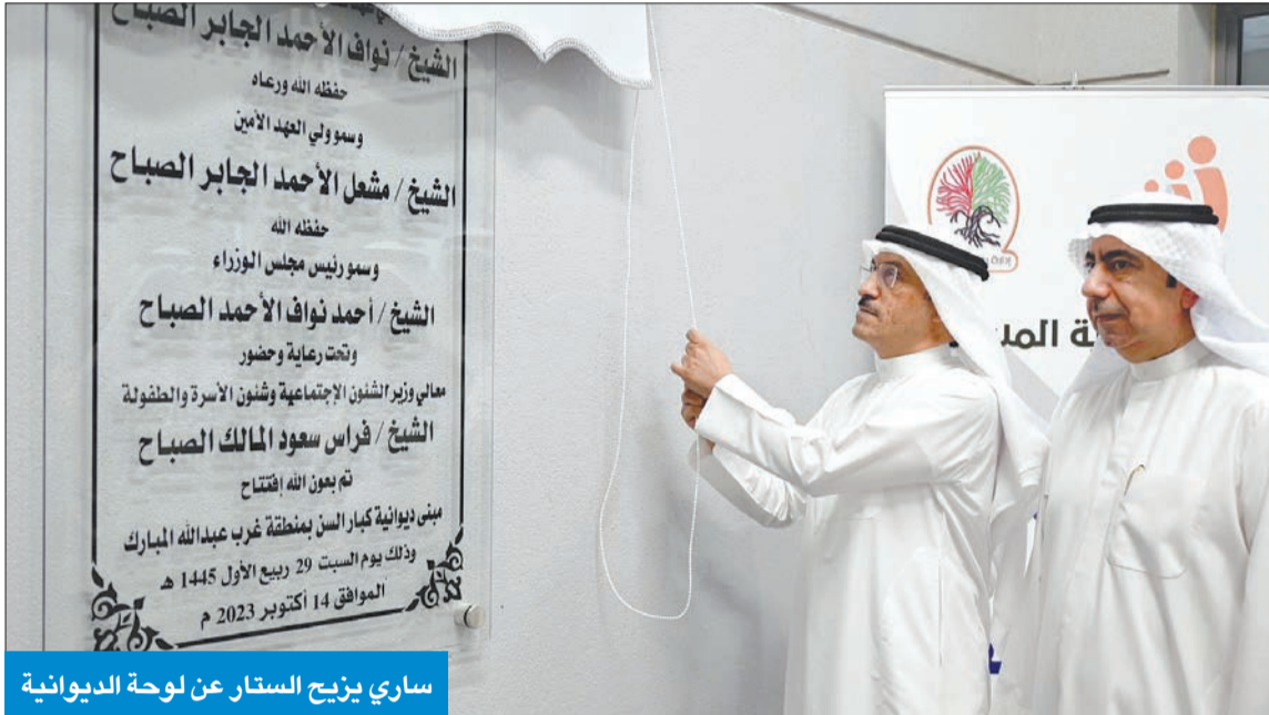
ساري يزيع الستار عن لوحة الديوانية

وشدد ساري على أن الوزارة لن تدخر جهداً في تقديم كل