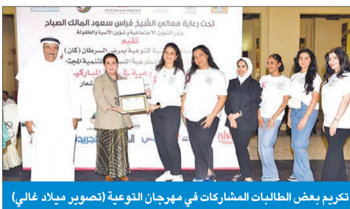
تكريم بعض الطالبات المشاركات في مهرجان التوعية