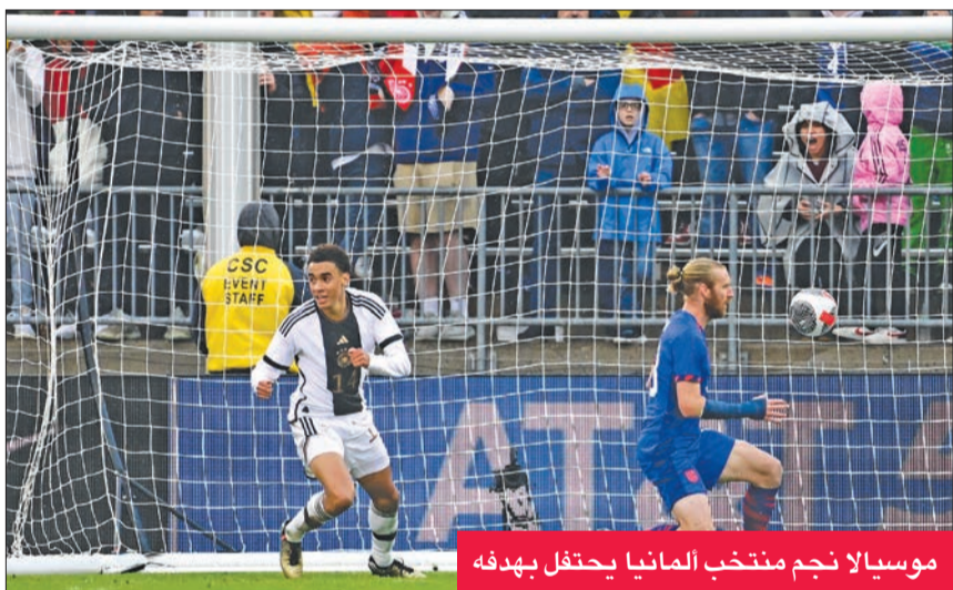
موسيو لا نجم منتخب ألمانيا يحتفل بهدفه

للمرة الثانية توالياً من دور المجموعات في كأس العالم. وتخوض ألمانيا ودية ثانية في الولايات المتحدة الثلاثاء الماضي، بعد ثلاث مباريات في فيلادلفيا. وهو الفوز الثاني توالياً لألمانيا بعد الأول على