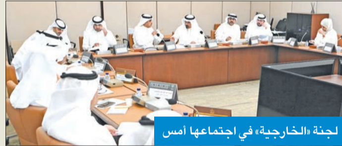
لجنة «الخارجية» في اجتماعها أمس

اللجنة أبلغت بحضورها الجلسة الخاصة بعد غد لمناقشة الانتهاكات الإسرائيلية في غزة