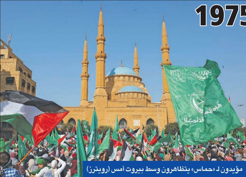
مؤيدون لـ «حماس» يتظاهرون وسط بيروت أمس

في المقابل، تستفز سياسة حزب الله جهات أخرى، لا سيما القوى المسيحية المعارضة للحزب، التي تعتبر أنه لا يمكن الموافقة على توريط لبنان بأي حرب، وأن لبنان غير معني في هذا الصراع. هذا ما يعزز الانقسام اللبناني أكثر، وسط أجواء تذكر اللبنانيين بما سبق الحرب الأهلية (1975) التي اندلعت في أحد أشكالها على خلفية عمل الفصائل الفلسطينية انطلاقاً من لبنان، وهذا ما يتكرر الآن من خلال دفع حزب الله بفصائل فلسطينية لشُرْ عمليات انطلاقاً من الجنوب. من هنا لا بدّ من طرح تساؤلات كثيرة تتصل بالمستقبل السياسي للبنان ما بعد تداعيات هذه الحرب، لا سيما أن حزب الله سيخرج منها منتصراً، مما يعني أن وضعه سيتعزّز أكثر على الساحة اللبنانية، وهو ما سيعارضه مسيحيون آخرون، الأمر الذي سيؤدي إلى الارتفاع في منسوب دعوات التقسيم أو الانفصال أو الفدرالية.