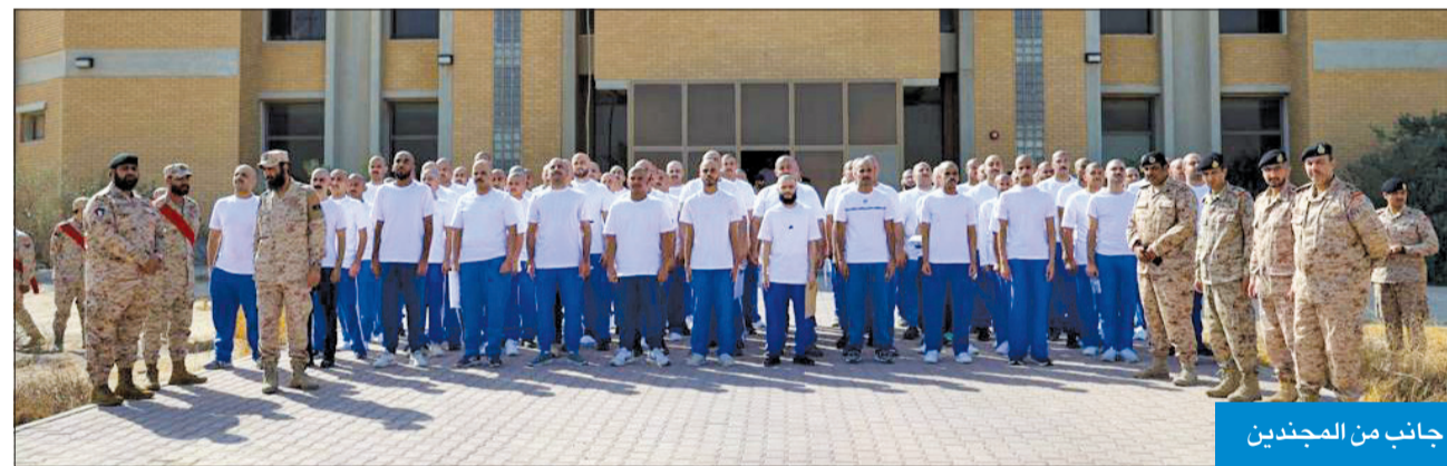
جانب من المجندين

ووجه نائب رئيس مجلس الوزراء الدفاع الشيخ أحمد الفهد الجهات المختصة في وزارة الدفاع بسرعة العمل على إنهاء كل الإجراءات الإدارية والمالية المتعلقة بصرف المكافآت والبدلات الخاصة للمكلفين بالخدمة الوطنية العسكرية، تمهيداً لصرفها، وذلك وفقاً للشروط والضوابط المنظمة في هذا الشأن.