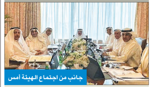
جانب من اجتماع الهيئة أمس

عقد مجلس إدارة الهيئة العامة لشؤون القصر اجتماعه، أمس، برئاسة وزير العدل وزير الدولة لشؤون الإسكان رئيس مجلس إدارة الهيئة فالح الرقبة، الذي أوضح أن المجلس بحث وضع استثمارات الهيئة خلال النصف الأول من عام 2023، وإطمأن على سلامة موقفها، بعد العرض على لجنة تنمية أموال القصر بجلستها التي عقدت في 11 الجاري.