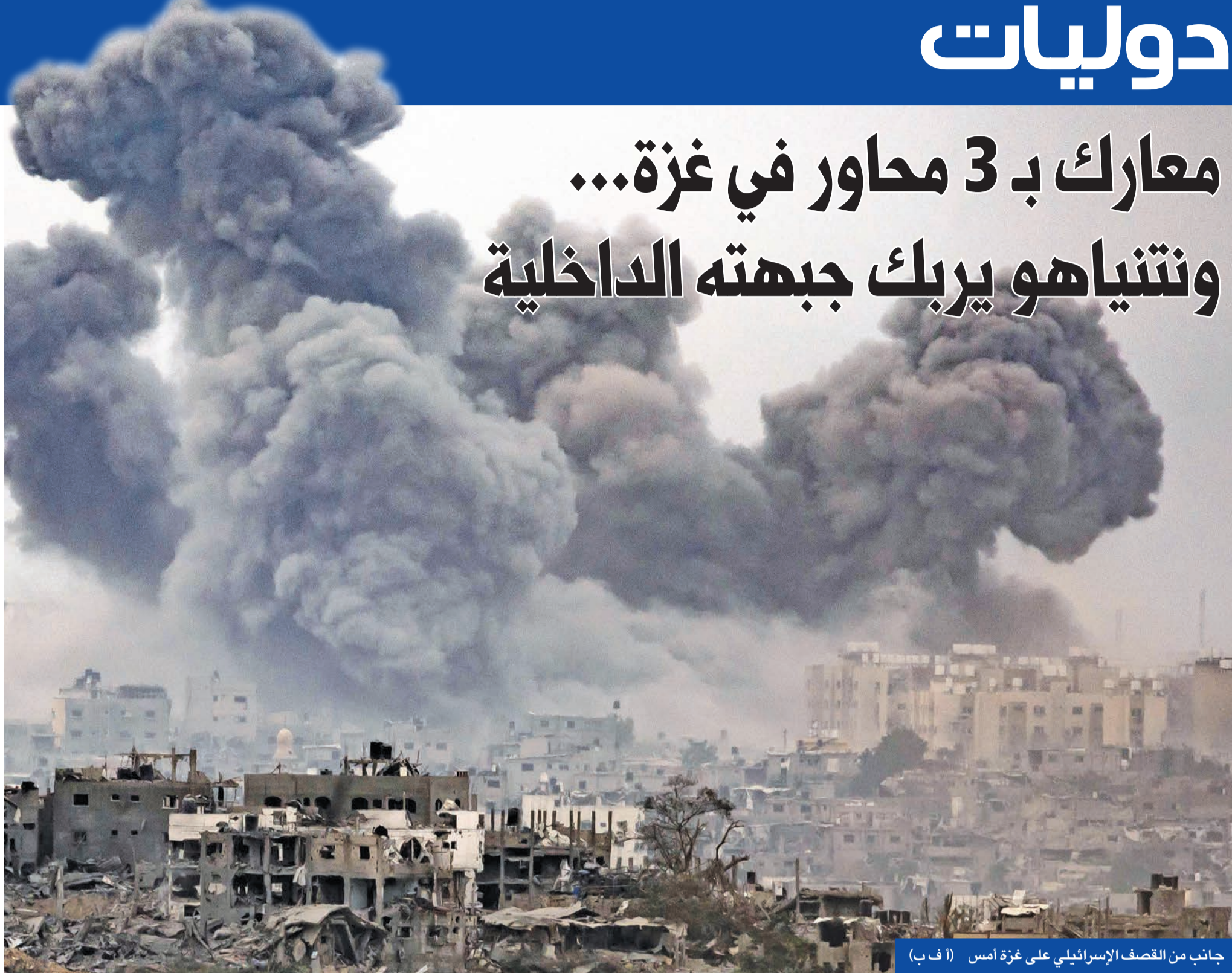
جانب من القصف الإسرائيلي على غزة أمس