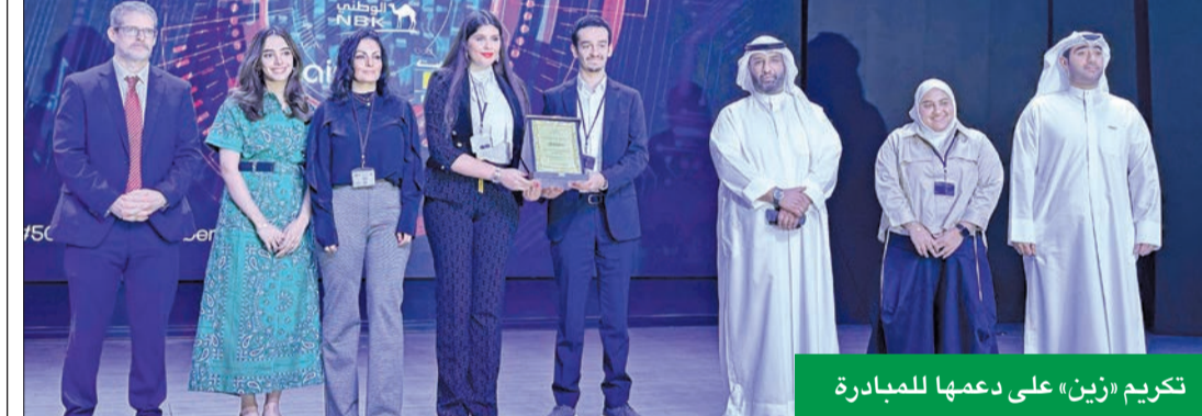
تكريم «زين» على دعمها للمبادرة

رعت تحدي هاكاثون «50 امرأة بالأمن السيبراني في الكويت»