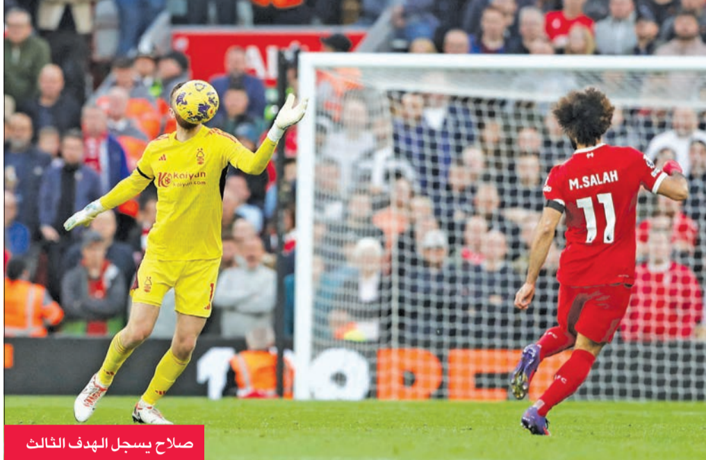
صلاح يسجل الهدف الثالث

واصل النجم الدولي المصري محمد صلاح هوابته في هز الشباك للمباراة الرابعة على التوالي بمختلف المسابقات، ليقود فريقه ليفربول للفوز 3 - صفر على ضيفه نوتينغهام فورست أمس، في المرحلة العاشرة لبطولة الدوري الإنجليزي الممتاز لكرة القدم.