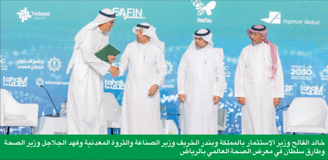
خالد الفالح وزير الاستثمار بالملكة وبندر الخريف وزير الصناعة والثروة المعدنية وفهد الجلال وزير الصحة وطارق سلطان في معرض الصحة العالمي بالرياض

بهدف دعم رقمنة قطاع الرعاية من خلال تعزيز المعرفة وإدخال تقنيات متطورة