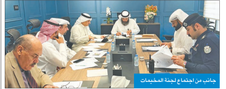
جانب من اجتماع لجنة المخيمات

وافقت لجنة دراسة وتحديث مواقع التخيم لموسم 2023/2024 في بلدية الكويت على تخصيص 12 موقعاً لأفرع الجمعيات التعاونية في مواقع التخيم التي حددتها البلدية بالمنطقتين الشمالية والجنوبية. وقالت البلدية، في بيان صحافي أمس، إن المواقع موزعة على 7 أفرع في مواقع المخيمات المسموح بها بمنطقة الشمال تشمل أسواقا