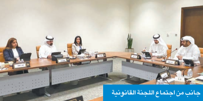
جانب من اجتماع اللجنة القانونية

«العاصمة» تناقش إعادة إعمار «المباركية»... الخميس