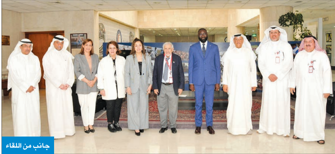
جانب من اللقاء

وذكر أن «الهلال الأحمر» من أهم شركاء اللجنة الدولية للصليب الأحمر، داعياً إلى مزيد من التعاون والتنسيق مع اللجنة في العديد من الدول التي تعاني أوضاعاً إنسانية صعبة.