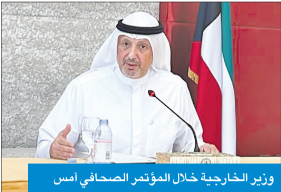
وزير الخارجية خلال المؤتمر الصحفي أمس