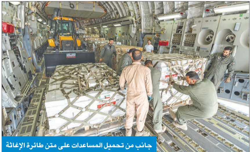
جانب من تحميل المساعدات على متن طائرة الإغاثة

الكويتية عبر الجسر الجوي لمساعدة الأشقاء الفلسطينيين بقطاع غزة قد انطلقت الاثنين الماضي محملة بـ 150 طناً حتى الآن من المواد الغذائية والدوائية والمعدات الطبية، إضافة إلى سيارات إسعاف