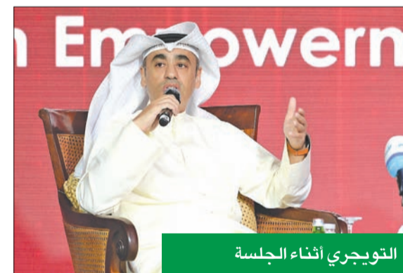
التويجري أثناء الجلسة

شارك في جلسة نقاشية رئيسية ضمن فعاليات مؤتمر «تمكين» الشباب