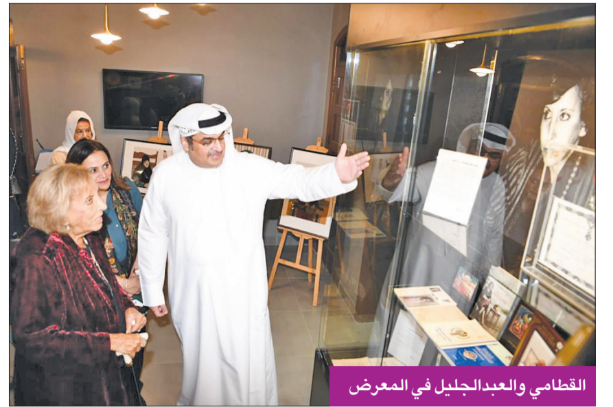
القطامي والعبد الجليل في المعرض