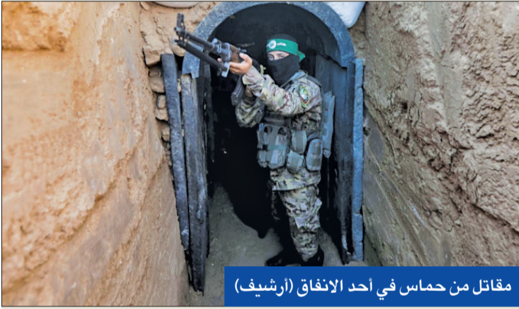
مقاتل من حماس في أحد الانفاق (أرشيف)

«أصعب وأطول من معركة الفلوجة وأعنف من الموصل»