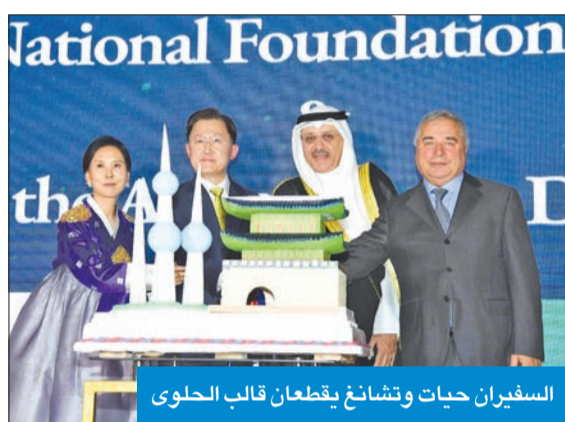
السفيران حيات وتشانغ يقطعان قالب الحلوى

الدولية المرسومة ما بيننا وبين دول الجوار». حجم التجارة بدوره، قال السفير الكوري الجنوبي لدى البلاد تشانغ يونغ ها إن «تاريخ تأسيس العلاقات الدبلوماسية الكورية الكويتية يعود إلى عام 1979، والكويت هي الدولة الأولى التي استوردت منها كوريا النفط الخام، مبيناً أن «حجم التجارة بين البلدين بلغ نحو 13 مليار دولار العام الماضي، ما يعني أن الكويت هي سادس أكبر مصدر لكوريا، وعلاوة على ذلك يتدفق 100 مليون برميل من النفط إلى كوريا كل عام، ما يجعل الكويت ثالث أكبر مصدر للنفط إلى كوريا». وأضاف: «شاركت كوريا بشكل عميق في ترجمة رؤية 2035 إلى واقع من خلال بناء العديد من البنى التحتية والاستراتيجية، ولكن الأهم من ذلك هو أن كوريا