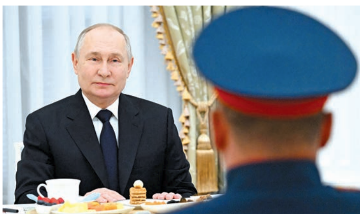
بوتين مستقبلاً جديداً مشاركاً في حرب أوكرانيا

بعد الكشف عن نية واشنطن تطوير قنبلة أقوى بـ 24 مرة من «هيروشيما»