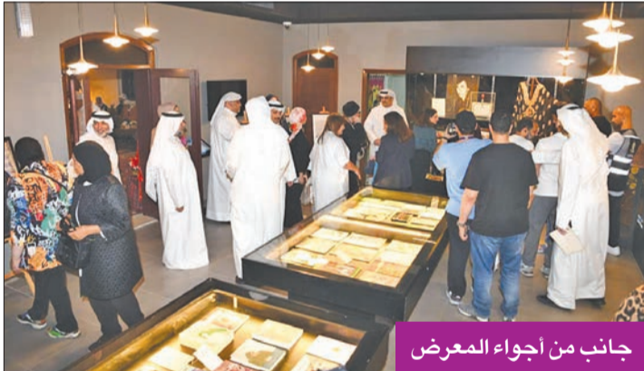
جانب من أجواء المعرض