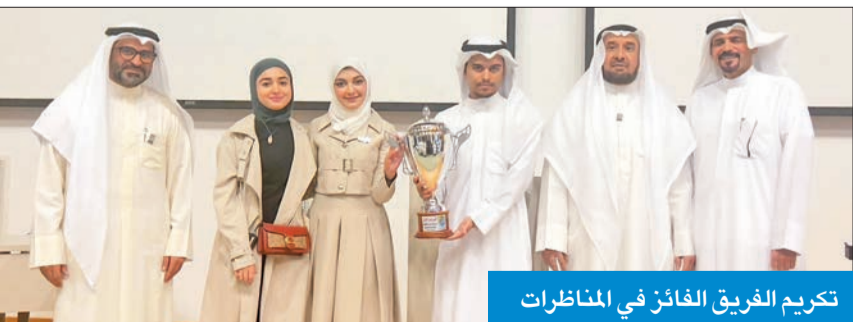
تكريم الفريق الفائز في المناظرات