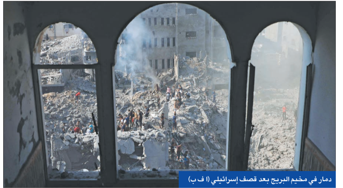
دمار في مخيم البريج بعد قصف إسرائيلي