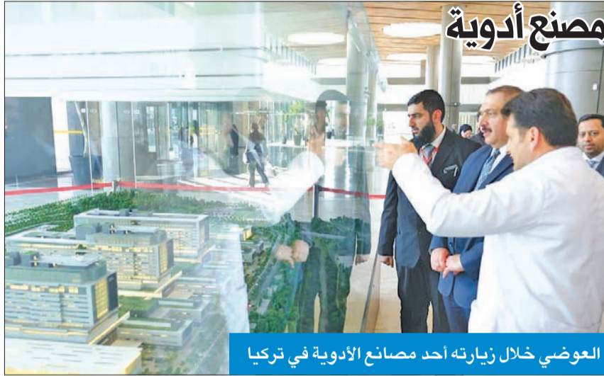
العوضي خلال زيارته أحد مصانع الأدوية في تركيا

زار وزير الصحة د. أحمد العوضي المستشفى الأكبر في إسطنبول، وأحد مصانع الأدوية التركية، لبحث سبل التعاون المشترك، وتبادل الخبرات، وتعزيز الأمن الدوائي. وقالت وزارة الصحة في بيان صحفي، إن العوضي اجتمع مع المؤسسة الدولية للخدمات الصحية (USHAS) التابعة لوزارة الصحة التركية، على هامش أعمال المؤتمر الطبي التركي بمدينة إسطنبول، وتناول البحث سبل التعاون المشترك في مجالات عدة تنصب في نطاق الخدمات الصحية، كعلاج المرضى بالخارج، وتبادل الخبرات في المجال الفني، وشراء الأدوية والمستلزمات الطبية، وغيرها من المواضيع ذات الصلة، مرتكزين على الألية للتواصل والتفاهم على كثير من القضايا الصحية ذات الاهتمام المشترك. وأضاف الوزير أن العوضي وبالتنسيق مع مؤسسة USHAS، أحد مصانع الأدوية التركية، واستمع إلى عرض