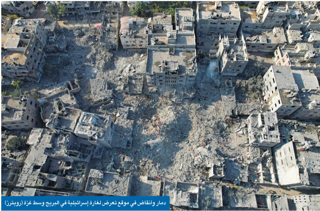
دمار وانقاض في موقع تعرض لغارة إسرائيلية في البرج وسط غزة