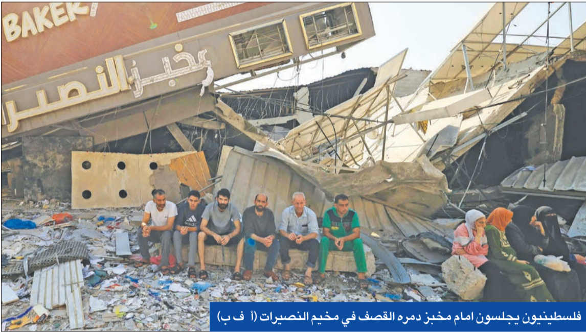
فلسطينيون يجلسون امام مخبز دمره القصف في مخيم النصيرات