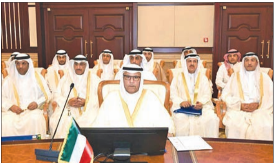
البرجس مترئساً وفد الكويت في اجتماع وكلاء داخلية «التعاون»

شدد وكيل وزارة الداخلية، الفريق أنور البرجس، في الكلمة التي ألقاها أمام اجتماع وكلاء وزارات الداخلية لدول مجلس التعاون لدول الخليج العربية، والذي عقد في سلطنة عمان، على ضرورة تعزيز العمل الخليجي المشترك، وتوحيد الجهود، حفاظاً على أمن وسلامة مواطني دول المجلس. ونقل البرجس للاجتماع تحيات النائب الأول لرئيس مجلس الوزراء وزير الداخلية،