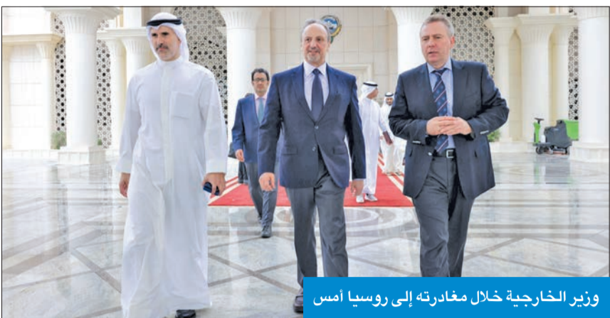
وزير الخارجية خلال مغادرته إلى روسيا أمس

غادر وزير الخارجية، الشيخ سالم الصباح، البلاد أمس متوجهاً إلى روسيا الاتحادية، في زيارة رسمية سيجرها والوفد المرافق لعقد عدد من اللقاءات مع المسؤولين في موسكو، تعزيزاً وتوثيقاً للعلاقات الخنائية التي تجمع دولة الكويت وروسيا الاتحادية، ويبحث عدد من الموضوعات الحيوية والقضايا المهمة على الصعيدين الإقليمي والدولي، لاسيما التطورات في المنطقة.