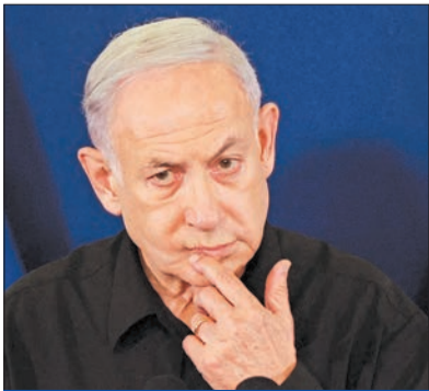
ننتياهو بمؤتمر صحافي السبت الماضي

«الرجل الخطأ في المكان الخطأ في الوقت الخطأ»