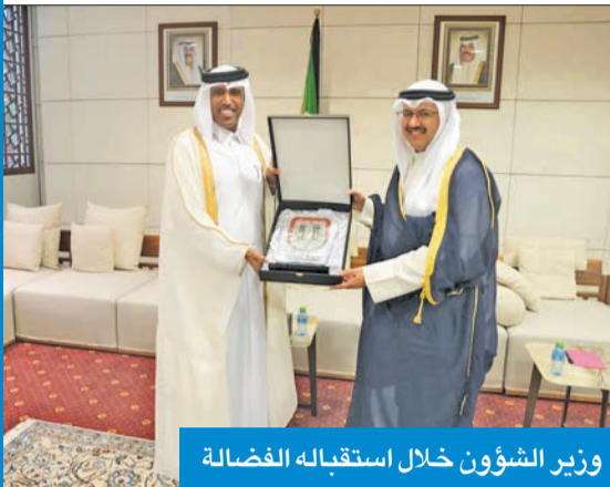
وزير الشؤون خلال استقباله الفضالة

أكد وزير الشؤون الاجتماعية وشؤون الأسرة والطفولة، الشيخ فراس المالك، أهمية تعزيز التعاون والتكامل العربي في مختلف المجالات. جاء ذلك خلال استقباله رئيس جمعية الأبناء العاملين للبرلمانات العربية والوفد المرافق له، د. أحمد الفضالة. ورحب الوزير بزيارة الوفد، مشيدا بدور الجمعية في خدمة العمل العربي المشترك. بدوره، أكد الفضالة أن ما يعزز اليقين في تنامي دور الجمعية في خدمة البرلمانات العربية، استجابتها الفاعلة ومواكبتها للمستجدات وتطلعات البرلمانات العربية، والعمل على تطوير اختصاصات الأبناء العاملين، وإبراز دورهم الحيوي في أداء البرلمانات.