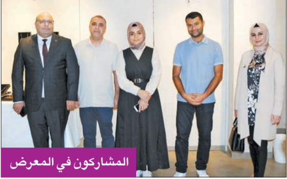
المشاركون في المعرض