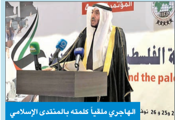
الهاجري ملبياً كلمته بالممتدى الإسلامي

أكد النائب د. فلاح الهاجري دعم مجلس الأمة لكفاح وصمود الفلسطينيين في غزة وفي عموم الأراضي الفلسطينية المحتلة وتقديم مختلف أوجه الدعم والتأييد على حق الفلسطينيين في المقاومة.