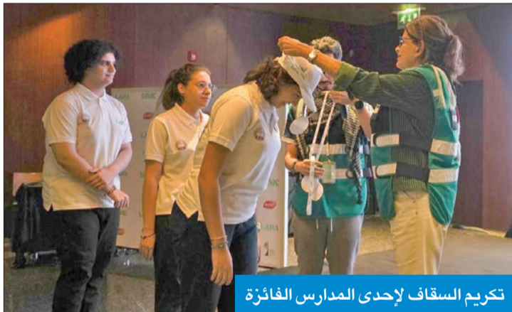
تكريم السقاف لإحدى المدارس الفائزة