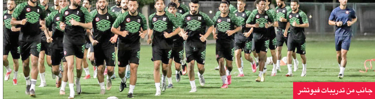
جانب من تدريبات فيوتشر