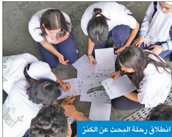
انطلاق رحلة البحث عن الكنز