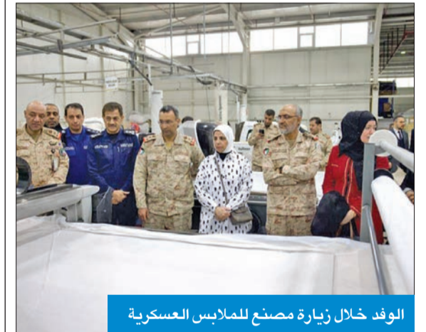
الوفد خلال زيارة مصنع للملابس العسكرية

ضمن إطار التعاون الثنائي العسكري في مجال الصناعة الدفاعية، قام وفد عسكري مشترك من وزارتي الدفاع والدخيلة وقوة الإطفاء العام، برئاسة معاون رئيس الأركان لهيئة الإبراء والقوى البرية، اللواء الركن الدكتور خالد الكندري، بزيارة تركيا. وتخللت الزيارة جولة على عدد من المصانع المتخصصة في إنتاج الملابس العسكرية، للاطلاع والتعرف على الجاهزية