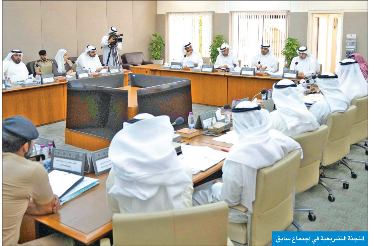
اللجنة التشريعية في اجتماع سابق