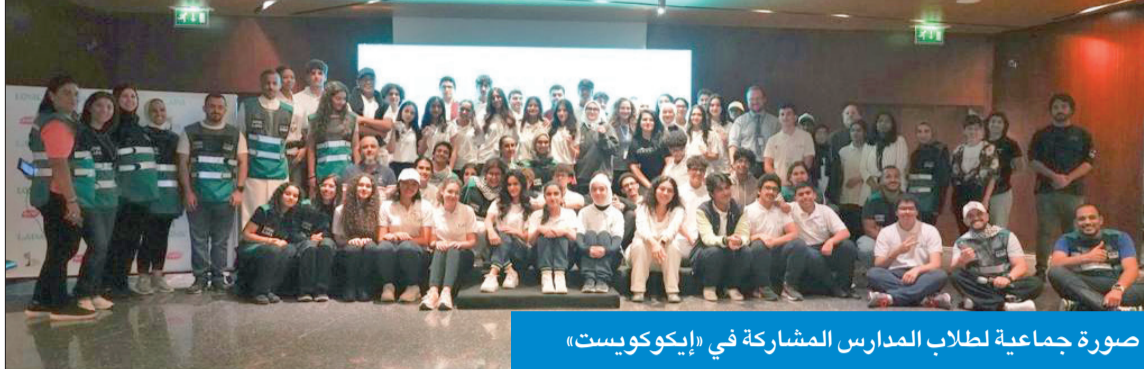
صورة جماعية لطلاب المدارس المشاركة في «إيكوكويست»

أطلقت مسابقتها البيئية الدورية «إيكوكويست» برعاية شركة KDD