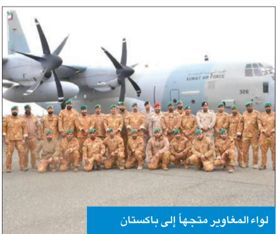
لواء المغاوير متجهاً إلى باكستان

أعلنت وزارة الدفاع أن قوة من لواء (المغاوير/ 25) غادرت إلى باكستان، أمس الأول، للمشاركة في التمرين المشترك (فجر الشرق) بنسخته الخامسة، الذي تنطلق فعالياته الأسبوع القادم وتستمر أسبوعين. وقالت الوزارة، في بيان صحفي، إن التمرين يهدف إلى تبادل الخبرات في عمليات البحث والتفتيش، ومكافحة الإرهاب، وتأمين المياني الحيوية، وكيفية التعامل مع المنفجرات، وتنفيذ عمليات إخلاء طبي. وأشارت إلى أن هذه المشاركة تأتي ضمن إطار دعم وتعزيز علاقات التعاون العسكري المشترك مع كل الدول الشقيقة والصديقة.