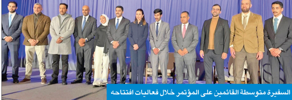
السفيرة متوسطة القائمين على المؤتمر خلال فعاليات افتتاحه

شاركت في انطلاق مؤتمر الاتحاد ودعت إلى الاهتمام بالوطن المبني على الشراكة