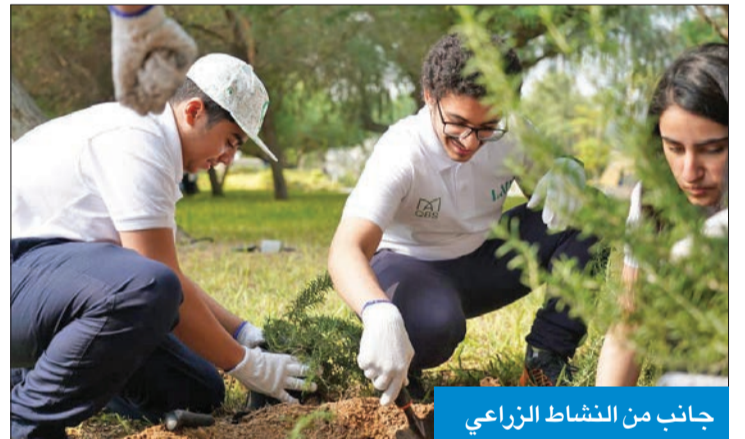
جانب من النشاط الزراعي