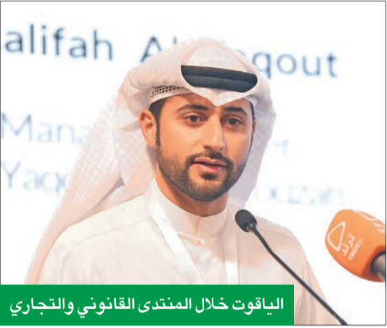
الياقوت خلال المنتدى القانوني والتجاري

وهو ما يعزز تطوير التشريعات والقوانين لتتناسب مع احتياجات بيئة الأعمال وتلبية احتياجات الأفراد والشركات، لتطوير التشريعات في الكويت، وبما يسهم في تحقيق رؤية كويت جديدة 2035».