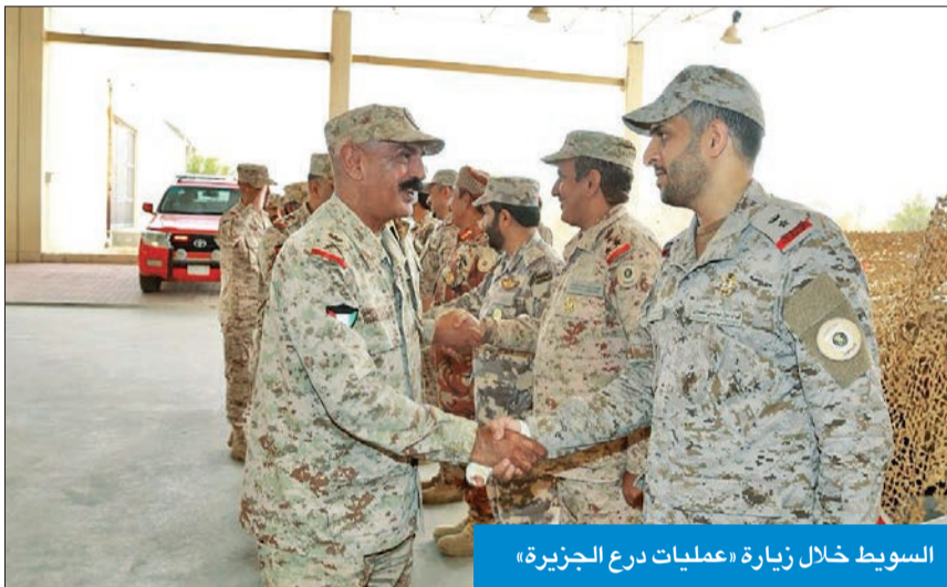
السويط خلال زيارة «عمليات درع الجزيرة»

المشاركة في تمرين تكامل 1، والذي ستنفذ فعالياته في منطقة التدريب (الأديرع - الأبرق) الواقعة شمال غرب البلاد من اليوم حتى 7 ديسمبر 2023 بقيادة الجيش الكويتي، ممثلاً بتشكيلات من القوة البرية، وقوات درع الجزيرة.