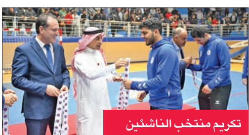
تكريم منتخب الناشئين

حصل منتخب الكويت الوطني للناشئين لكرة اليد على المركز الثالث في النسخة الأولى للبطولة العربية للمنتخبات لمواليد 2006 لكرة اليد، إثر فوزه على منتخب الجزائر (أ) بنتيجة 24-29 في مباراة جمعت المنتخبين أمس الأول على صالة المهدي بنونس العاصمة، لتحديد المركزين الثالث والرابع للبطولة، التي فاز بها منتخب تونس (أ)، صاحب الضيافة، بعد تغلبه على نظيره السعودي (أ)، الذي حل ثانياً، بنتيجة 24-28 في المباراة النهائية. وأسفرت مباريات تحديد المراكز من الخامس إلى الثامن عن حصول منتخب تونس (ب) على المركز الخامس، بعد فوزه على منتخب السعودية (ب) السادس بنتيجة 34-28، وجاء منتخب ليبيا في المركز السابع، بعد تغلبه على منتخب الجزائر (ب) الثامن بنتيجة 37-27.