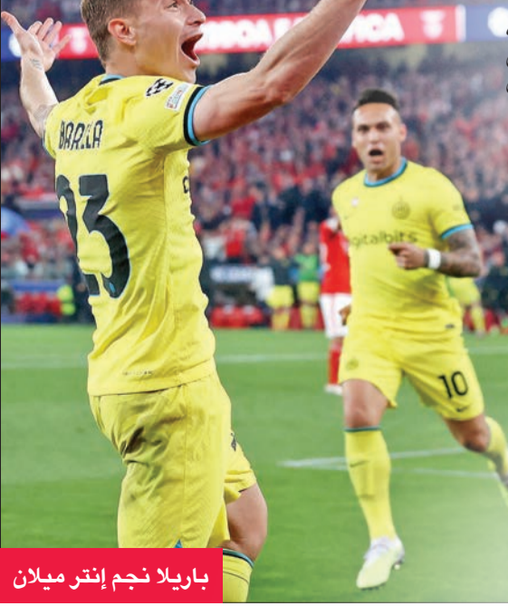
باريلا نجم إنتر ميلان

يسجل لاعبو سيموني إنزاغي 29 هدفاً بينها 12 لقائه المهاجم الدولي الأرجنتيني لوتارو مارتينيس الذي كان نجاح شراكته مع الوافد الجديد الدولي الفرنسي ماركوس توراو (4 أهداف) أحد أسباب هذه البداية القريبة من المثالية لهذا الموسم، دون نسيان صانع الألعاب الدولي التركي هاكان تشالهان أوغلو (5 أهداف).