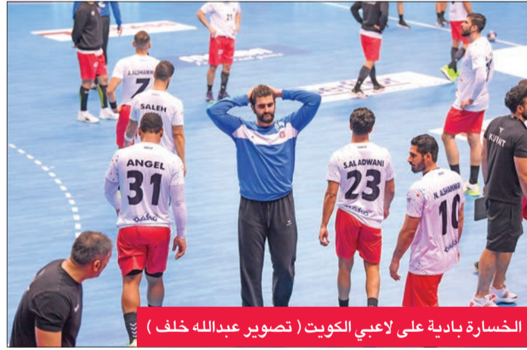
الخسارة بادية على لاعبي الكويت