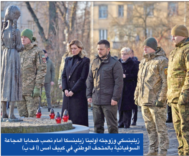
زيليوسكي وزوجته أولينا زيليوسكا أمام نصب ضحايا المجاعة السوفيياتية بالمتحف الوطني في كيف

خطة أوكرانية لتعبئة شاملة... وضغوط لبدء المفاوضات