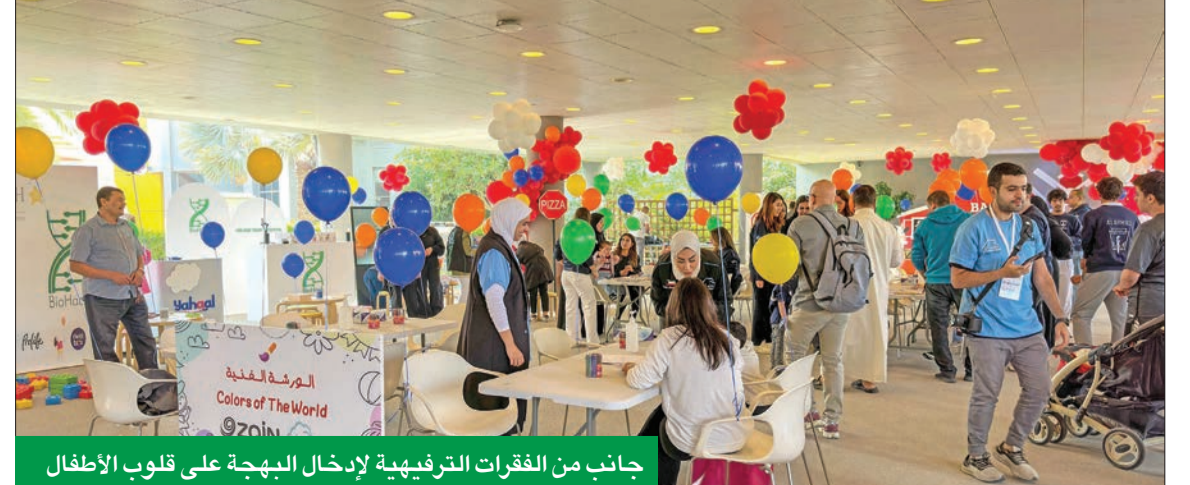
جانب من الفقرات الترفيهية لإدخال البهجة على قلوب الأطفال

هذه المبادرة الجميلة تحت مظلة شراكتها الممتدة مع كل من فريق «سحابة أمل» التطوعي، وبيت عبدالله لرعاية الأطفال، والجمعية الكويتية لرعاية الأطفال (BACCH)، شارك فيه العديد من الأطفال وعائلاتهم في أجواء غمرت السعادة، ونظمه فريق «سحابة أمل» التطوعي بالتعاون مع الجمعية الكويتية لرعاية الأطفال في المستشفى (KACCH). وأنت مساهمة «زين» في