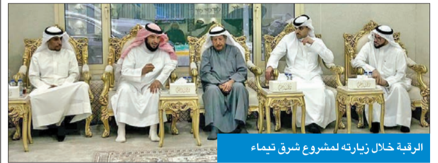
الرقبة خلال زيارته لمشروع شرق تيماء

تفقد المشروع وكلف العنزي رفع تقرير حول مطالب الأهالي