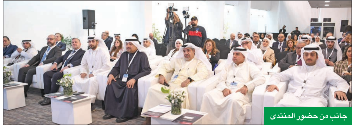
جانب من حضور المنتدى

38 مليار دولار عقود البناء في القطاع الحكومي العوضي