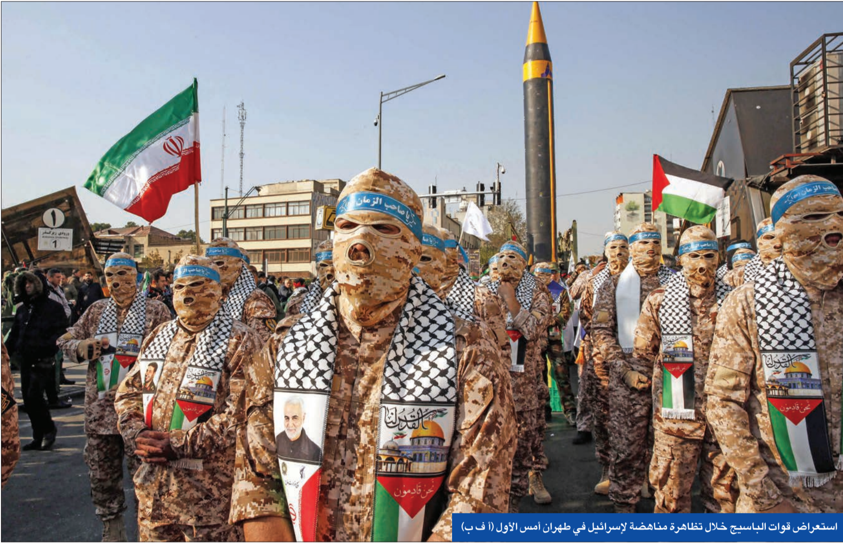
استعراض قوات الباسيج خلال تظاهرة مناهضة لإسرائيل في طهران أمس الأول

الحادث تزامن مع مناورتين إيرانيتين بالمنطقة... وطهران «تحتفظ بحق» تفتيش السفن في «هرمز»