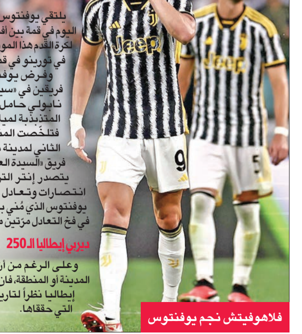
فلاهوفيتش نجم يوفنتوس

يملك الفريقان قواسم مشتركة تتمثل في تلقيهما هزيمة واحدة فقط هذا الموسم، وكانت أمام فريق واحد هو ساسولو الخامس عشر حالياً، كما أنهما يعتمدان على دفاع محكم حيث استقبلت شباك إنتر ستة أهداف ستة فقط واهتزت شباك يوفنتوس سبع مرات فقط. في المقابل، لا توجد مقارنة بين خطي هجوم الفريقين: إنتر، وصيف بطل سابقة دوري أبطال أوروبا الموسم الماضي والضامن لتأهله إلى ثمن النهائي هذا الموسم، يتفوق على جميع خصومه الطليان.