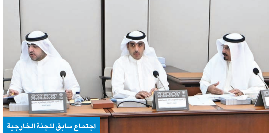
اجتماع سابق للجنة الخارجية

وأضافت اللجنة أنها تبين لها من دراسة نصوص الاتفاقية المشار إليها أنها تشتمل على (22) مادة، حيث تضمنت المادة (1، 2) الغرض من الاتفاقية ومجالات التعاون، حيث نصت على أن تطبق على الضباط وضباط الصف والطلبة العسكريين والموظفين المدنيين التابعين للقوات المسلحة لدى أحد الطرفين ممن يتم قبولهم لتلقي التدريب عند الاقتضاء، وتطبق هذه الأحكام في حق أفراد عائلات الموظفين المدعوين الذين تم تزكهم أعلاه من الوافدين المدعوين في الدولة المستقبلة إن استدعى الأمر، وذلك في حدود المتاح. وأوضحت أن المادة (3) تناولت التعريفات الخاصة بالمصطلحات الواردة فيها، وحددت المادة (4) السلطات المختصة المخولة من قبل الطرفين لتنفيذ أحكام هذه الاتفاقية، حيث تمثل حكومة دولة الكويت رئاسة الأركان العامة للجيش الكويتي، وتمثل حكومة الجمهورية التركية برئاسة هيئة