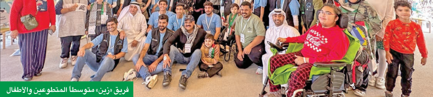
فريق «زين» متوسط المنطوعين والأطفال

في خطوة لترسيخ ثقافة العطاء والمشاركة الاجتماعية الفاعلة، شاركت «زين» في حفل خاص أقيم احتفاءً باليوم العالمي للطفل في بيت عبدالله لرعاية الأطفال (BACCH)، شارك فيه العديد من الأطفال وعائلاتهم في أجواء غمرت السعادة، ونظمه فريق «سحابة أمل» التطوعي بالتعاون مع الجمعية الكويتية لرعاية الأطفال في المستشفى، وهي الشراكات التي أثمرت على مدى سنوات عديدة الكثير من المبادرات والمشاريع لخدمة الأهداف الإنسانية التي تسعى الجهات الثلاث إلى تحقيقها، لتعكس دور شركات القطاع الخاص في دعم ومساندة مؤسسات المجتمع المدني والمنظمات