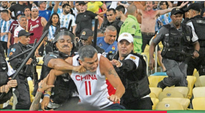
جانب من الاشتباكات خلال مواجهة البرازيل والأرجنتين

مباريات دولية على أرضهما مع إغلاق جزئي أو كلي لملعبيهما، وهما العقوبتان الأكثر شيعاً.