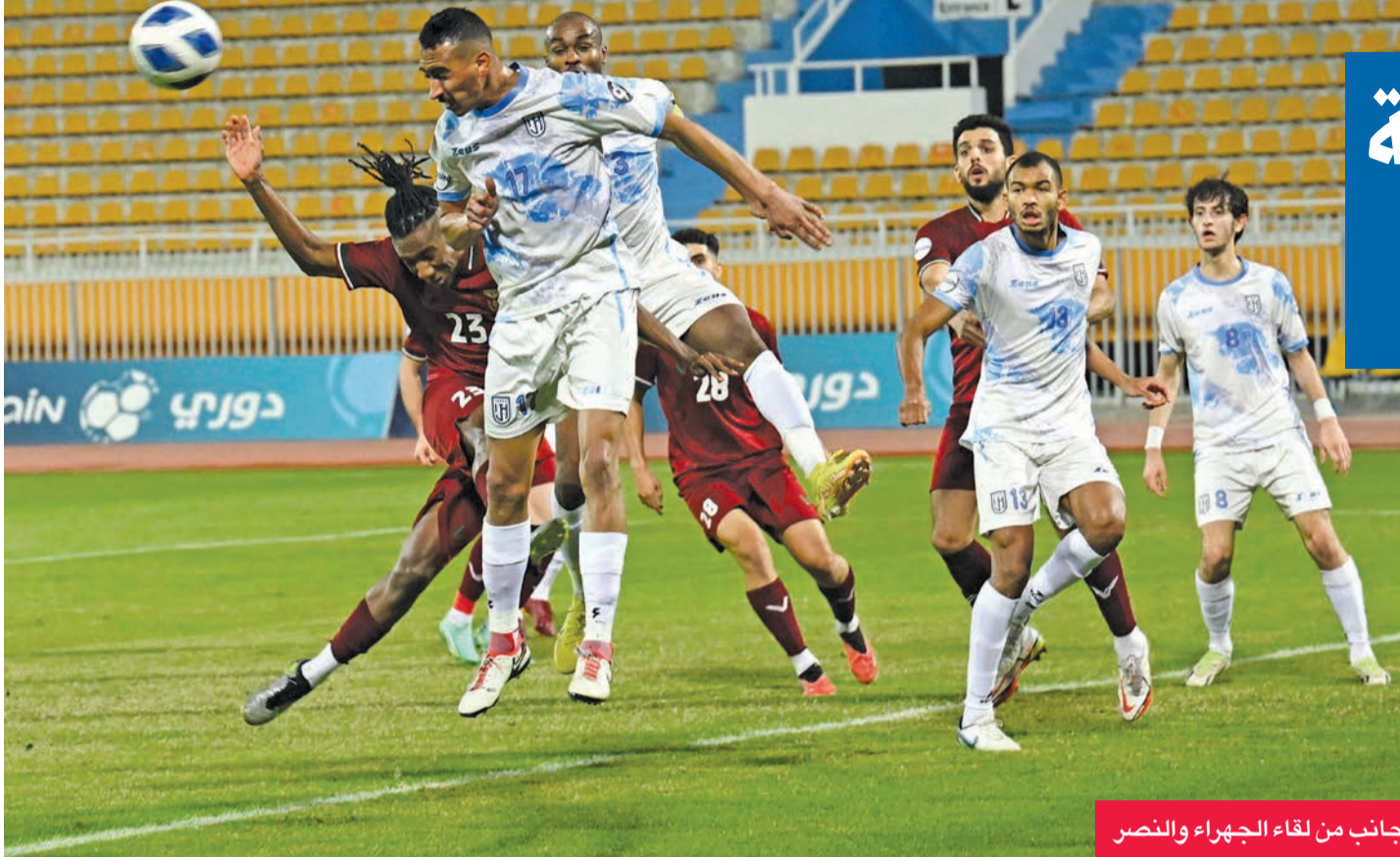
جانب من لقاء الجهراء والنصر