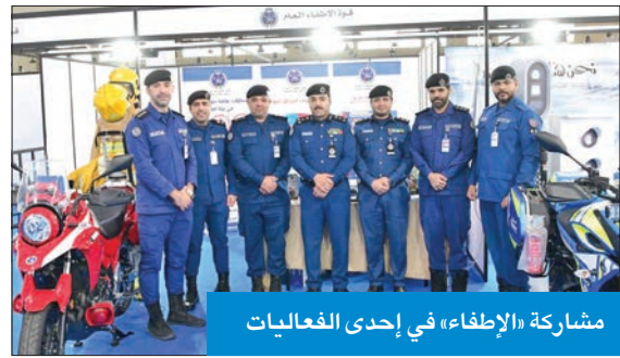
مشاركة «الإطفاء» في إحدى الفعاليات

ومعرض صحة الكويت الثاني عشر المقام في فندق الجميرا، ويستمر يومين، ويهدف إلى التعرف على كيفية تقديم الرعاية الطبية للمرضى ووجود أكبر المستشفيات العالمية بهدف تقديم الخدمات الصحية المتكاملة، بالإضافة إلى مشاركة إدارة تكنولوجيا المعلومات في القوة بمؤتمر الخليج لتكنولوجيا المعلومات والاتصالات الذي أقيم في فندق راديسون بلو من 29 إلى 30 نوفمبر الماضي.