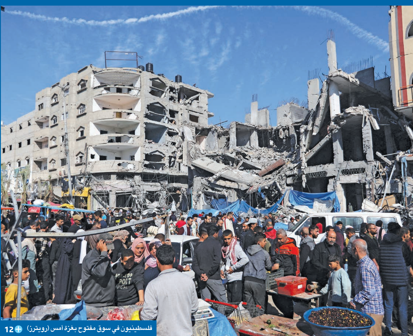
فلسطينيون في سوق مفتوح بغزة أمس 12+