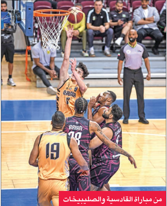
من مباراة القادسية والصليبيخات

بينهما، قبل أن يأخذ «الأصفر» الأفضلية، وينتهي لمصلحته