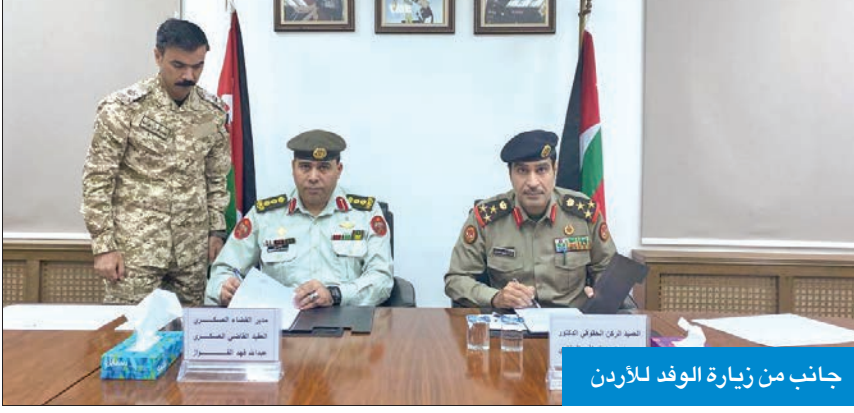
جانب من زيارة الوفد للأردن

وفد من هيئة القضاء العسكري زار المملكة الأردنية