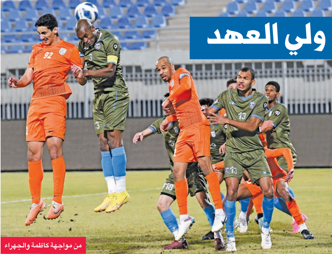
من مواجهة كاظمة والجھراء

الإيجابية في بطولة الدوري الممتاز. وفي مباراة التضامن والصلبيخات تعتبر كفة التضامن أفضل، حيث يتصدر أبناء الفروانية دوري الدرجة الأولى، مقابل تراجع في نتائج الصليبيخات.