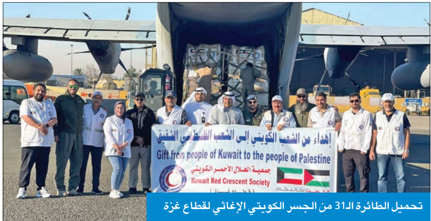
تحميل الطائرة الـ 31 من الجسر الكويتي الإغاثي لقطاع غزة

«الكويتية للإغاثة» تطلق «سفينة غزة» لنقل 1200 طن من المعونات