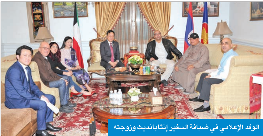
الوفد الإعلامي في ضيافة السفير إثابانديث وزوجته

السيارات الخاصة بالدبلوماسيين ليسوا بحاجة إلى تأشيرة، في حين تستغرق فترة حصول الكويتيين على التأشيرة 3 أيام عمل مقابل 15 ديناراً، أما التأشيرة المستعجلة، فيمكن للكويتي الحصول عليها خلال يوم واحد فقط مقابل 20 ديناراً، لافتاً إلى عدم وجود خط طيران مباشر مع لاوس.