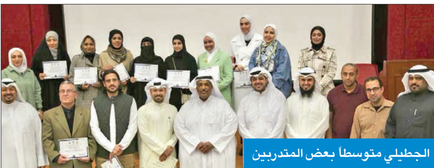
القطبي متوسطاً بعض المتدربين

كرّمت 90 متدرباً أنهوا بنجاح دوراتهم التدريبية