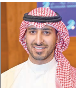
الشيخ يوسف الصباح

تنتقل الساعة 8:30 صباح الجمعة الجولة الأولى للنسخة الثالثة من الدوري الكويتي لفروسية قفز الحواجز، في نادي المسيلة للفروسية بمنطقة صباح، برعاية شركة زين، وبمشاركة كبيرة من الفرسان والفارسات من مختلف الأندية المحلية.