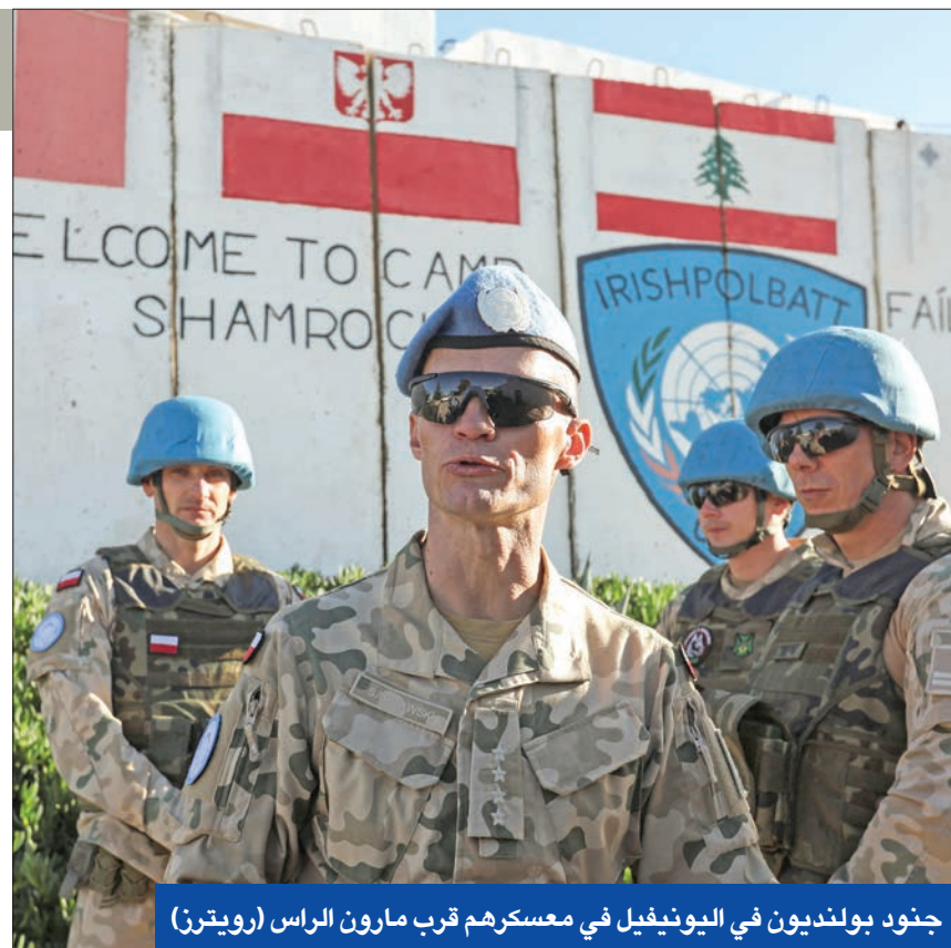
جنود بولنديون في اليونيفيل في معسكرهم قرب مارون الراس

على وقع التطورات، التي فرضتها حرب غزة، عادت المصطلحات الخاصة بتنفيذ أو تعديل القرار 1701 الذي أنهى حرب 2006، إلى التداول السياسي، كأحدى الوسائل للعودة إلى الهدوء على الحدود اللبنانية الجنوبية وضمان أمن إسرائيل، بعد المواجهات العسكرية مع حزب الله التي أجبرت الآف الإسرائيليين على مغادرة مستوطنات الشمال. وبعد أن استهلك إلى حد بعيد الحديث عن كل ما يتعلق بالقرار 1701 بما في ذلك احتمالات إرجاعه ضمن الفصل السابع، تسلل إلى الخطاب السياسي والإعلامي مصطلح «المنطقة العازلة»، وهو «قديم جديد»، اتاحت إسرائيل لبنان مرتين تحت بافتقته، المرة الأولى في العام 1978 لمنع العمليات العسكرية الفلسطينية المسلحة ضدها انطلاقاً من الأراضي اللبنانية، والمرة الثانية العام 1982 التي احتل الجيش الإسرائيلي خلالها بيروت، وأدت لخروج مقاتلي منظمة