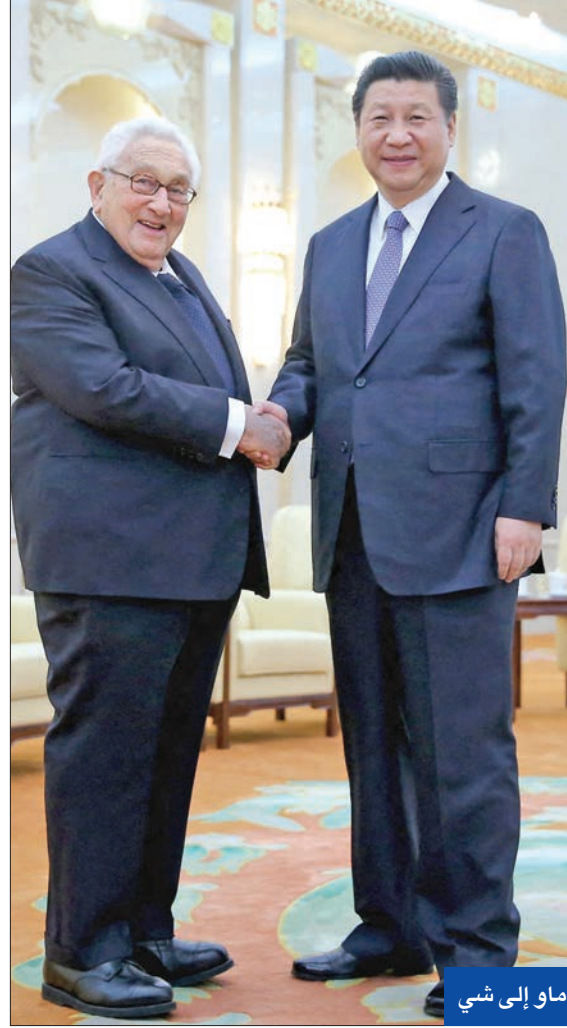
كيسنجر من ماو إلى شي

وفاته عن 100 عام تجدد الجدل حول إرثه: مجرم دولي أم حكيم جنب العالم صدامات الحرب الباردة؟