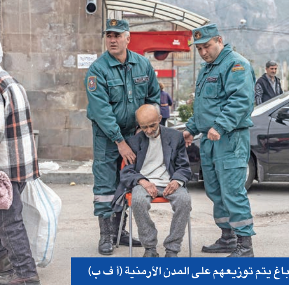
لاجئون أرمن من قرية باغ يتم توزيعهم على المدن الأرمينية

وفي أكتوبر، وقعت أرمينيا اتفاقية مع فرنسا لاستيراد معدات عسكرية، ومع ذلك، لا ترغب يريفان في تكرار أخطاء الماضي من خلال الاعتماد بدرجة كبيرة للغاية على حليف واحد. ونتيجة لذلك، من المستبعد أن يقتصر بحثها عن شركاء جدد على الغرب فقط. ورأى زوليان أن الخيار الأكثر وضوحاً بالنسبة لأرمينيا عندما يتعلق الأمر بحليف غير غربي، هو إيران، التي قالت أكثر من مرة إنها تدعم وحدة أراضي أرمينيا وأذربيجان. كما أعربت طهران أيضاً عن معارضتها لإقامة ممر خارج الحدود عبر جنوب أرمينيا لربط أذربيجان بجيب ناخيتشيفان التابع لها. وأشار إلى أن الشريك الآخر من الجنوب الذي تأمل يريفان التحالف معه هو الهند. وقد اهتمت نيودلهي بأرمينيا بعد حرب عام 2020، عندما دعمت باكستان أذربيجان أيضاً وقد نمت العلاقات بين الجانبين منذ ذلك الحين، حتى وصلت إلى عمليات تسليم أسلحة. ويرى زوليان أنه على الرغم من ذلك فإن آيا من الشركاء النظريين الجدد لأرمينيا لا يمكن أن يحلوا محل روسيا كضامن للأمن. فلا تزال أرمينيا معتمدة أيضاً على روسيا فيما يتعلق بقضايا أخرى