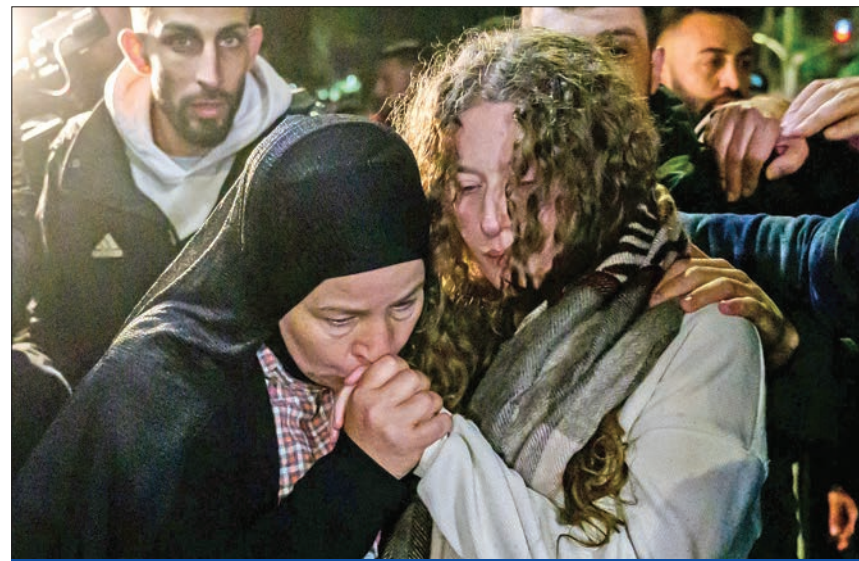
سيدة تقبل يد الناشطة الفلسطينية عهد التميمي لدى إطلاق سراحها من سجن إسرائيلي في الضفة الغربية المحتلة ليل الأربعاء، الخميس

الأزمة التي تهدد باندلاع حرب إقليمية أوسع تشمل خصوصاً «حزب الله» اللبناني وفضائل إقليمية متحالفة مع إيران، بينها «انصار الله» الحوثية في اليمن، توقع أن تشهد المنطقة حضوراً دولياً ودبلوماسياً مكثفاً بهدف احتواء الصراع، إذ أعلن قصر الإليزيه أن الرئيس الفرنسي إيمانويل ماكرون سيلتقي قادة من الشرق الأوسط في مؤتمر «كوب 28» بالإسارات، قبل أن يزور قطر التي تقود جهود الوساطة بين «حماس» والدولة العبرية. كما أفيد بأن الرئيس الإسرائيلي يبحث تطورات الحرب مع قادة العالم على هامش زيارة سريعة يجريها للإمارات لحضور «كوب 28».