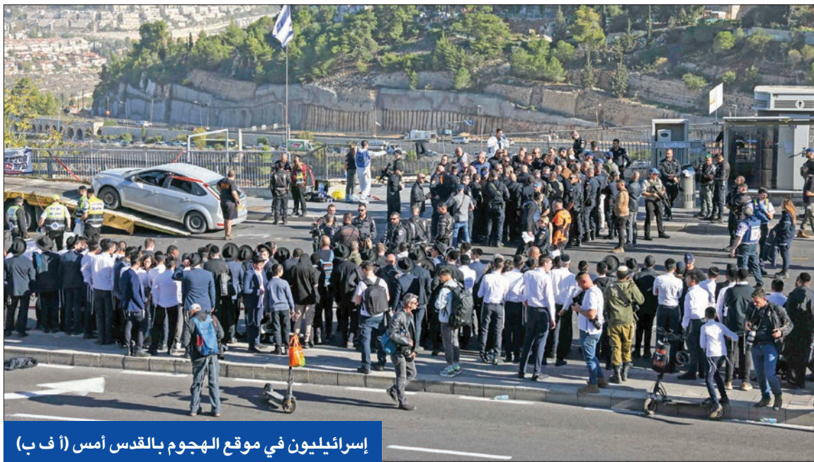
إسرائيليون في موقع الهجوم بالقدس أمس