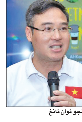
نجو ثوان تانغ

أقامت السفارة الفيتنامية لدى البلاد، فعالية «اكتشف المطبخ الفيتنامي» شارك فيها مجموعة كبيرة من المواطنين ومن أبناء الجالية الفيتنامية، إضافة إلى عدد من الدبلوماسيين، وبحضور يوسف الجمعان من المجلس الوطني للثقافة والفنون والآداب. وفي هذا السياق، قال السفير الفيتنامي لدى الكويت نجو ثوان تانغ حول دور «بلوماسية الطعام» في تقوية العلاقة بين الكويت وفيتنام: «نسعى لتعزيز التبادل الثقافي مع الكويت، على عدة مستويات، منها الطعام، الذي يعتبر أهم عناصر التبادل الثقافي الذي يوفر فهماً متبادلاً ومبدياً بين الدول، لذلك يسعدني أن يختبر الكويتيون طعامنا، فالطعام مهم جداً لحياتنا، وعندما يشعر الكويتيون بالارتياح خلال تناولهم طعامنا، فيمكنهم فهم ثقافتنا، لذلك اعتقد أنه من خلال الطعام يتعرف الناس على بعضهم البعض بشكل أكبر».