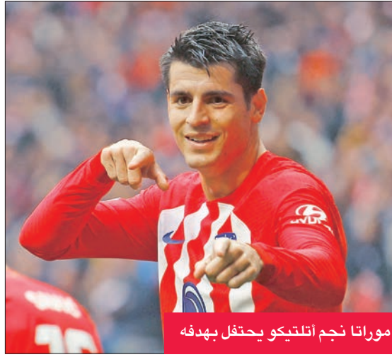
موراتا نجم أتلتيكو يحتفل بهدفه

الاول لأتلتيكو في الدقيقة 17 بعدما تخطف المدافع والحارس ليسجل ثامن أهدافه في الدوري هذا الموسم. وأضاف كوريا الهدف الثاني (22) بسهولة بعد عرضية من ماركوس لورنتي. وقلص باتيستاتو الفارق لألميريا في الدقيقة 62 مستغلاً كرة مرتدة تصدى لها الحارس السلوفيني يان أوبلاك.