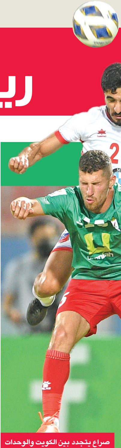
صراع يتجدد بين الكويت والوحدات

تقام اليوم مباراتان في دوري بنك وربة لكرة القدم، الذي تقام ضمن منافسات دورة الألعاب الرياضية الثالثة للتعليم العالي، التي ينظمها الاتحاد الكويتي الرياضي المدرسي والتعليم العالي، ويلتقي على استاد المدينة الرياضية بالهيئة العامة للتعليم التطبيقي والتدريب بالتواصل الاجتماعي خلال الفترة الحالية، والترتيب فقط في الترتيبات. ويستقبل الفريق الأحمر مشواره في البطولة، التي تقام من 12 حتى 22 ديسمبر، يوم الخامس عشر، بملاقاة الفائز من مباراة اتحاد جدة وأوكلايد سيتي النيوزيلندي. وقالت مصادر بالأهلي إن بيبو أبغ لاعبي الفريق بهذا القرار، للحفاظ على الترتيب، من أجل تحقيق الهدف من المشاركة في مونديال الأندية، وهو المنافسة على مركز متقدم، في ظل الإنقاذ الذي يتعرض له الفريق أخيراً، بسبب تراجع الأداء والناتج على الصعيدين المحلي والقاري. إلى ذلك، قرر رئيس النادي الأهلي، محمود الخطيب، تفعيل العقوبة التي أقرها مدير الكرة بعد سقوط الفريق في فخ التعادل أمام شباب بلوزداد، يوم الجمعة الماضي، بالعودة الثالثة من دور المجموعات بدوري أبطال إفريقيا.