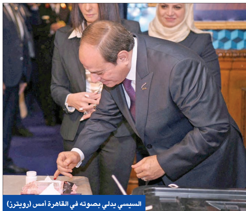
السيسي يدي بصوته في القاهرة أمس