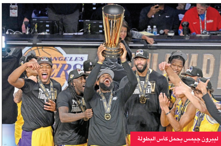
ليبرون جيمس يحمل كأس البطولة

توج فريق لوس أنجلوس ليكرز بلقب النسخة الأولى من كأس رابطة الدوري الأمريكي للمحترفين فجر أمس في المباراة النهائية التي جرت في لاس فيغاس. وتأنق أنتوني ديفيز بشكل لافت وسجل 41 نقطة و20 متابعة لفريق ليكرز، وأضاف ليبرون جيمس 24 نقطة و11 متابعة ليفودا فريقهما للفوز بلقب النسخة الأولى من كأس رابطة الدوري الأمريكي. ويقضي جيمس الموسم الـ 21 له في الدوري