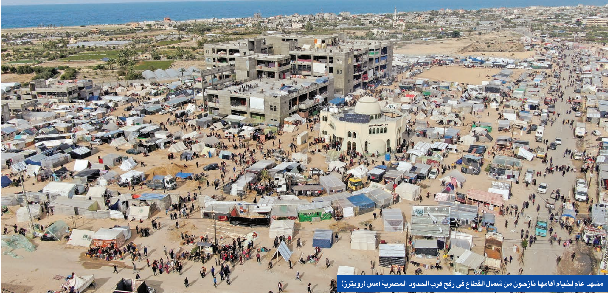
مشهد عام لحيامها نازحون من شمال القطاع في رفح قرب الحدود المصرية أمس