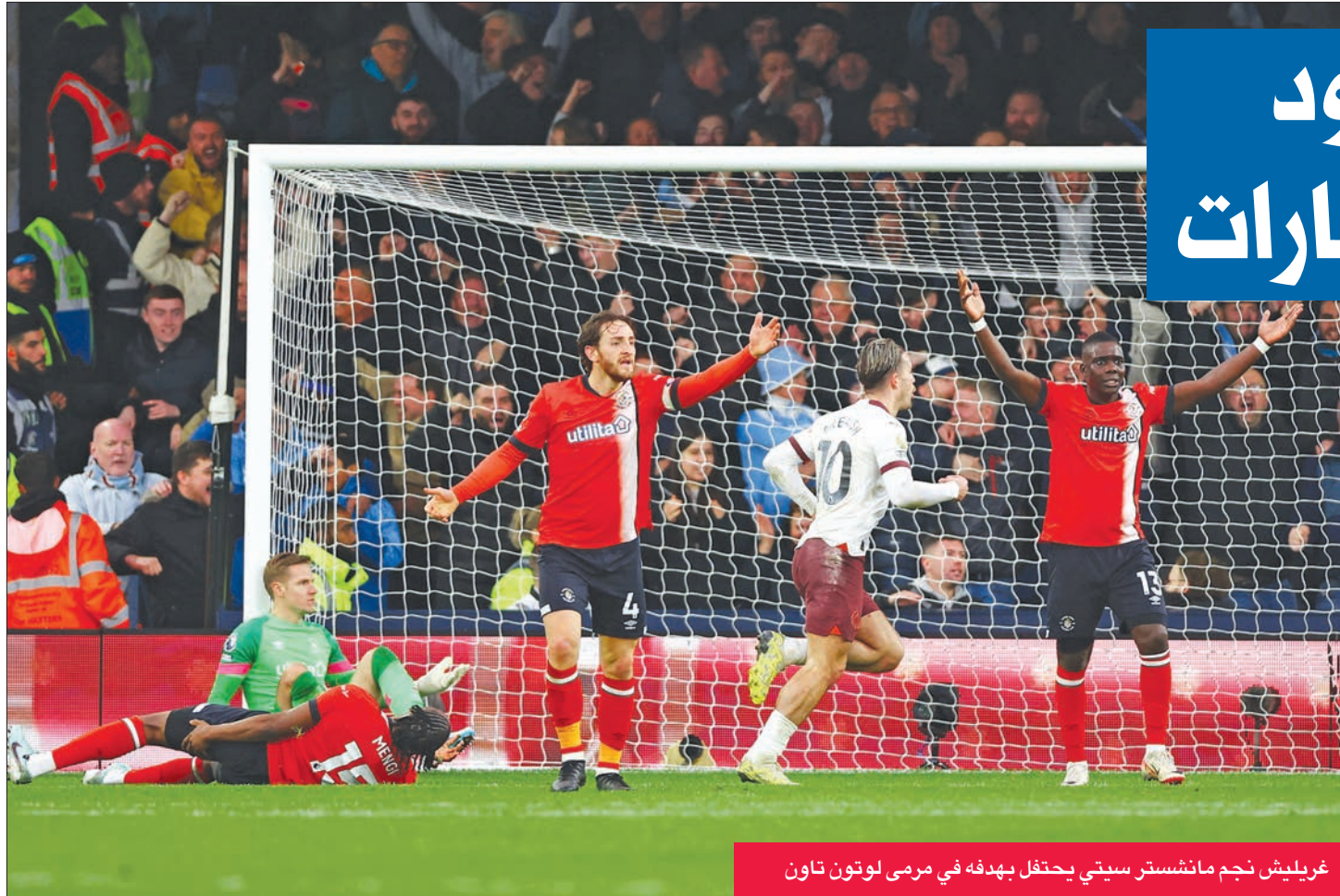
غريليش نجم مانشستر سيتي يحتفل بهدفه في مرعى لوتون تاون

وفي مباراة نصف النهائي الأخرى فاز بلاطينسي على جودوي كروز 6 - 5 ببركلات الترجيح أيضاً عقب انتهاء الوقت الأصلي بالتعادل 1 - 1. وسيبقي بلاطينسي للفوز بأول لقب في تاريخه الممتد على مدار 118 عاماً.