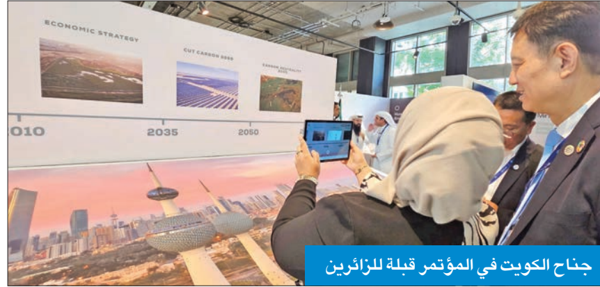
جناح الكويت في المؤتمر قبله للزائرين

وفد من «البيئة» يزور سفينة الأبحاث «المستكشف» في ميناء جبل علي