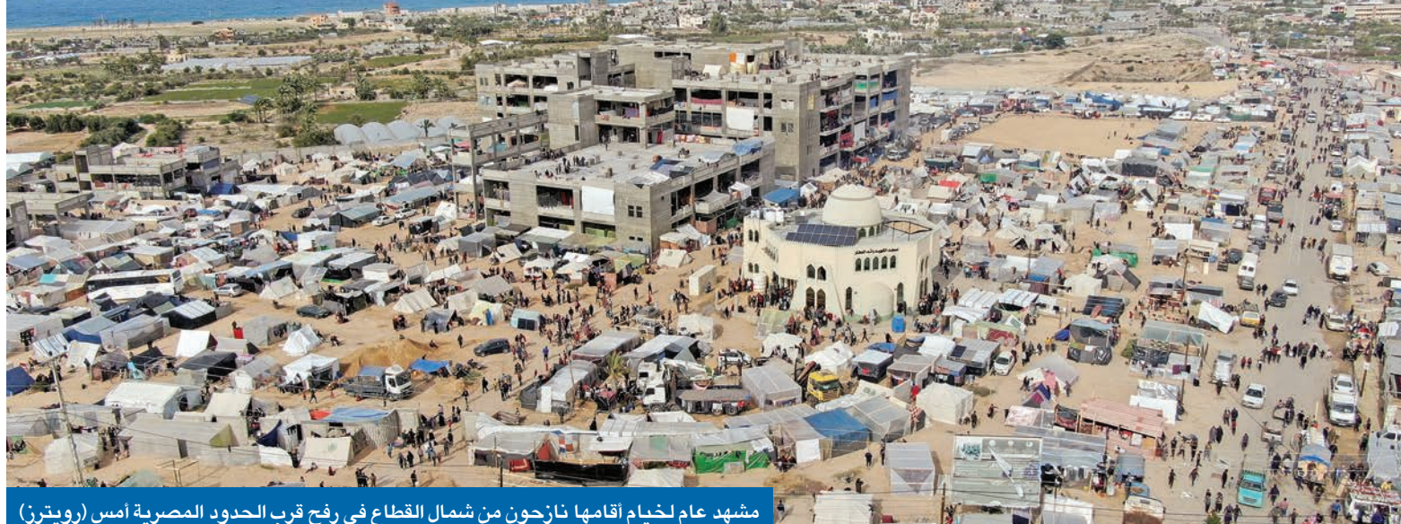
مشهد عام لخييام أقامها نازحون من شمال القطاع في رفح قرب الحدود المصرية أمس

«مفاوضات بالنار» بين تل أبيب و«حزب الله» • فرنسا تُسقط مُسَيَّرَتَيْن للحوثي