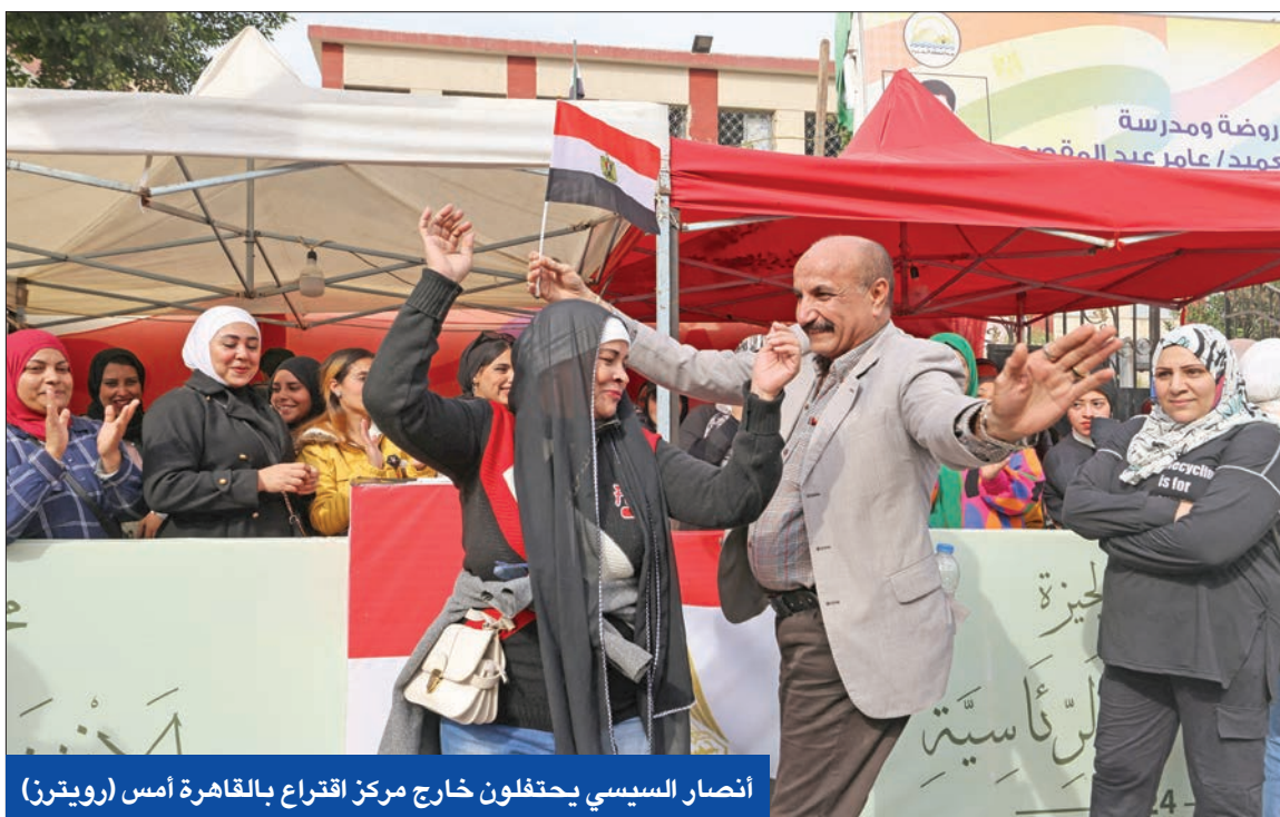
أنصار السيسي يحتفلون خارج مركز اقتراع بالقاهرة أمس

قاضي لكل صندوق من التصويت حتى النتيجة وكبار السن والنساء يتصدرون اليوم الأول من «الرئاسية»