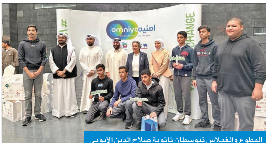
المطوع والغملاس نتوسطان ثانوية صلاح الدين الأيوبي

بأهمية إعادة تدوير البلاستيك للمحافظة على بيئة الكويت، لافتة إلى أنه خلال تلك الفترة تم جمع أكثر من 150 طناً من البلاستيك خلال 60 يوماً فقط من 48 مدرسة حكومية من جميع المراحل التعليمية. وأضافت أنه «وفق مقاييس الانتشار، وصلنا إلى 125 ألف شخص في الكويت، وعشرات الآلاف من الأشخاص على مستوى المحافظات».