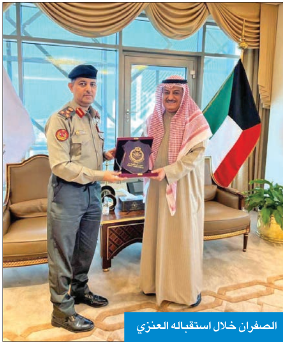
الصفوان خلال استقباله العنزي

استقبل النائب العام المستشار سعد الصفوان، بمكتبه، صباح أمس، رئيس هيئة القضاء العسكري بالتكليف العميد حقوقي د. نواف العنزي. وتم خلال اللقاء مناقشة أهم المواضيع ضمن محور الزيارة، فضلاً عن بحث سبل التعاون، وتعزيز العمل المشترك بما يخدم المصلحة العامة.