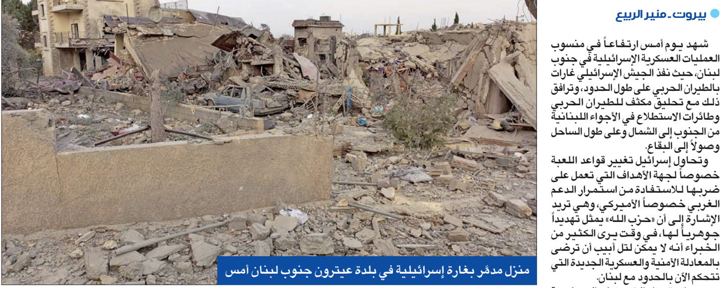
منزل مدمر بغارة إسرائيلية في بلدة عيترون جنوب لبنان أمس

شهد يوم أمس ارتفاعاً في منسوب العمليات العسكرية الإسرائيلية في جنوب لبنان، حيث نفذ الجيش الإسرائيلي غارات بالطيران الحربي على طول الحدود، وترافق ذلك مع تحليق مكثف للطيران الحربي وطائرات الاستطلاع في الأجواء اللبنانية من الجنوب إلى الشمال وعلى طول الساحل وصولاً إلى البقاع. وتحاول إسرائيل تغيير قواعد اللعبة خصوصاً لجهة الأهداف التي تعمل على ضربها للاستفادة من استمرار الدعم الغربي خصوصاً الأميركي، وهي تريد الإشارة إلى أن «حزب الله» يمثل تهديداً جوهرياً لها، في وقت يرى الكثير من الخبراء أنه لا يمكن لتل أبيب أن ترضى بالمعادلة الأمنية والعسكرية الجديدة التي تتحكم الآن بالحدود مع لبنان. ومع استمرار التحركات السياسية والدبلوماسية العسكرية الإسرائيلية في جنوب لبنان، حيث نفذ الجيش الإسرائيلي غارات بالطيران الحربي على طول الحدود، وترافق ذلك مع تحليق مكثف للطيران الحربي وطائرات الاستطلاع في الأجواء اللبنانية من الجنوب إلى الشمال وعلى طول الساحل وصولاً إلى البقاع. وتحاول إسرائيل تغيير قواعد اللعبة خصوصاً لجهة الأهداف التي تعمل على ضربها للاستفادة من استمرار الدعم الغربي خصوصاً الأميركي، وهي تريد الإشارة إلى أن «حزب الله» يمثل تهديداً جوهرياً لها، في وقت يرى الكثير من الخبراء أنه لا يمكن لتل أبيب، ربما بعد وقف إطلاق النار في غزة، إلى حرب واسعة وفعلية ضد «حزب الله» ترسي معادلة جديدة على الحدود. هدف آخر تسعى إسرائيل إلى تحقيقه في ظل المعلومات عن استهدافها مواقع في مخازن أسلحة لـ «حزب الله»، ويعتمد الجيش الإسرائيلي الإعلان عن استهداف مقرات أو مراكز قيادة أو مناطق إطلاق صواريخ ليصالح رسالة بان إسرائيل لديها