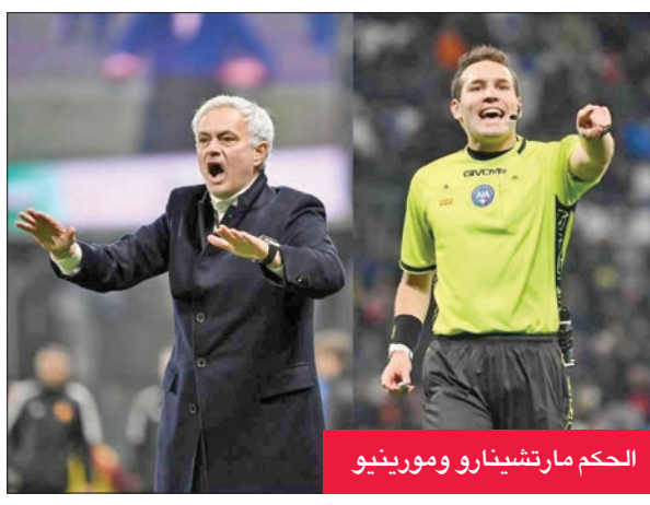
الحكم مارتشيناو ومورينيو

وقال مورينيو: «ما انتظره هو العدالة الرياضية، العدالة»، مضيفاً