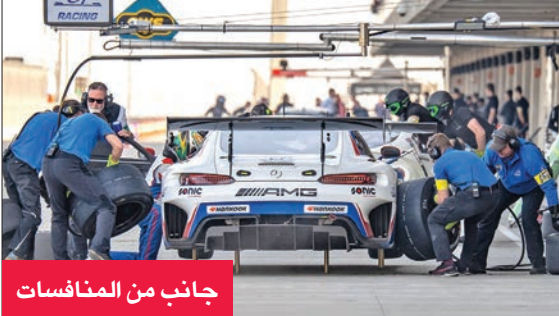
جانب من المنافسات

على المركز الأول، يليه «سنشري موتور سبورت»، بالمركز الثاني، أما في منافسات فئة «TCE»، فقد