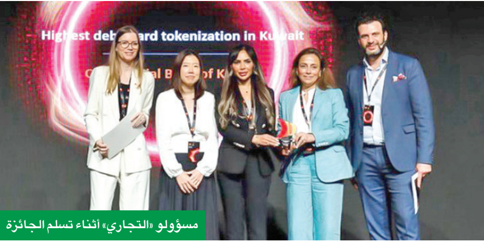
مسؤولو «التجاري» أثناء تسلم الجائزة

الرموز لتمثيل معلومات البطاقة الفعلية أثناء عملية الدفع، مما يقلل من مخاطر اختراق البيانات والاحتيال، فلا يمكن استخدامه للوصول بشكل احتيالي إلى حساب حامل البطاقة أو إجراء عمليات شراء غير مصرح بها. ويحرص البنك على توفير أحدث الأنظمة المتطورة لتعزيز عمليات شبكته المصرفية، وذلك من خلال فريق عمل محترف وبرامج متطورة تعزز مكانة الرائدة في تقديم أحدث الخدمات المصرفية الرقمية، وترسخ ثقافة الرقمنة في جميع عمليات البنك، سواء عن طريق خدمة الموقع الإلكتروني، أو على الهواتف الذكية من خلال تطبيقه.