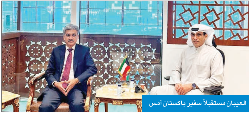
العيان مستقبلاً سفير باكستان أمس

عقد اجتماع اللجنة التجارية المشتركة بين البلدين قريباً