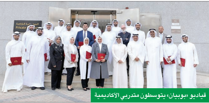
قياديو «بوبيان» يتوسطون متدربي الأكاديمية

والتطوير كمستويات متقدمة من هذه الأكاديمية المتكاملة والتي تستهدف مديري علاقات العملاء في مجموعة الخدمات المصرفية الخاصة بهدف رفع مستوى الخبرات والمهارات الاستثمارية لدى جميع الموظفين لتوفير خدمة مميزة وفريدة للعملاء». كما تناول المحجم مختلف أنواع المحافظ الاستثمارية وكيفية تحديد ما يناسب كل عميل منها في ضوء فهم أهدافه الشخصية. سروراً بالعوامل التي قد تؤثر على قرار العميل الاستثماري والاستراتيجيات التي تناسب كل شريحة من العملاء والمعادلات الأمنية للاستثمار في أوقات التضخم والركود وإعادة النظر في مفهوم المخاطر وتوصيفها وتخصيص الأصول التحوطية لمواجهة التضخم.