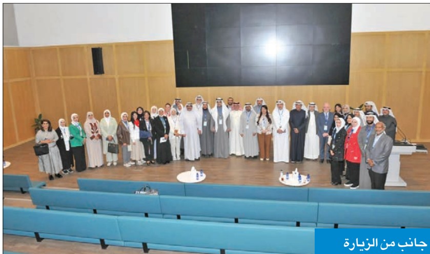
جانب من الزيارة

الحقائق حول ما يتميز به مجتمع مدينة صباح السالم الجامعية الصحية من سمات حضارية وصرح عمراني متميز وما حققته جامعة الكويت من تقدم اجتماعي وثقافي.