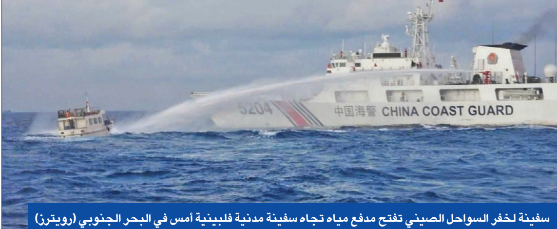
سفينة لبحر السواحل الصيني تفتتح مدفع مياه تجاه سفينة فلبينية أمس في البحر الجنوبي

غير قانونية وعدوانية، بإطلاقها مدافع المياه باتجاه سفينة صيد حكومية بشغلها مدنيون، وهي خطوة اعتبرتها بكين «إجراءات رقابية» ومفتوحة. وفيما يتعلق بالحادث، قال بحر السواحل الصيني، في بيان، إن سفينتين فلبينيتين تجاهلتا التحذيرات المتكررة و«دخلتا بطريقة غير قانونية المياه المتاخمة لمنطقة شعاب ريناي المرجانية في جزر نانشا من دون موافقة الحكومة الصينية». وأضاف أن السفينة أونابرا ما 1 «انعلقت فجأة وبطريقة خطيرة وغير احترافية، واصطدمت عمداً بسفينة بحر السواحل الصينية رقم 21556»، وحملت الجانب الفلبيني المسؤولية الكاملة عن الحادث. ودعا جان يو، المتحدث باسم بحر السواحل الصيني، الفلبين إلى وقف «أعمالها الاستفزازية»، قائلاً إن بكين ستواصل القيام «بأعمال إنقاذ القانون» في مياهها. وكتب جاي تريلا، المتحدث باسم بحر السواحل الفلبيني، على منصة إكس للتواصل الاجتماعي، «تعرض محرك إيمال كاليان لأضرار جسيمة» وخلفاً للمعلومات المضللة التي أعلنتها بحر السواحل الصيني، صدمت السفينة سي سي جي السفينة يو إم 1». وأدانت قوة عمل تابعة للحكومة الفلبينية «تصرفات الصين العنيفة وغير المبررة الأخيرة» ومناوراتها الخطيرة ضد مهمة إعادة الإمداد المشروعة والروتيينية، وقالت في بيان إن