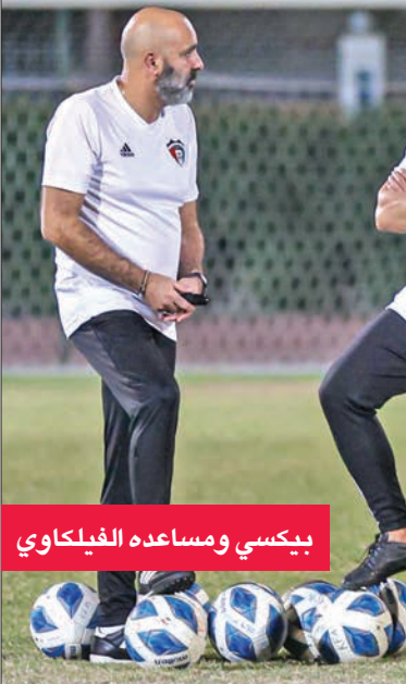
بيكسي ومساعدته الفيلاوي

على أن يتم حسم هذا الملف بشكل نهائي خلال الأيام القليلة المقبلة، من خلال التنسيق مع بعض الاتحادات القارية.