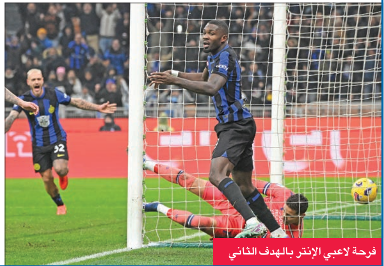
فرحة لاعبي إنتر بالهدف الثاني