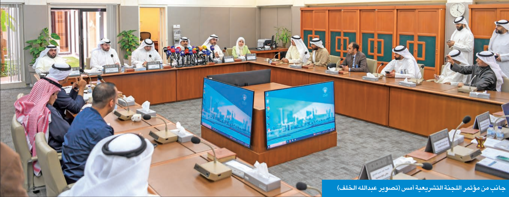
جانب من مؤتمر اللجنة التشريعية أمس