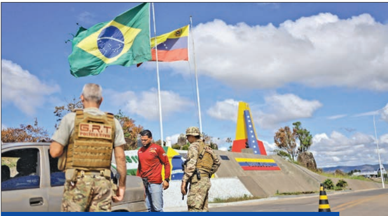
إجراءات أمنية على معبر حدودي بين البرازيل وفنزويلا

لولا المهدد بزعامته الإقليمية يحذر مادورو من أي إجراءات أحادية