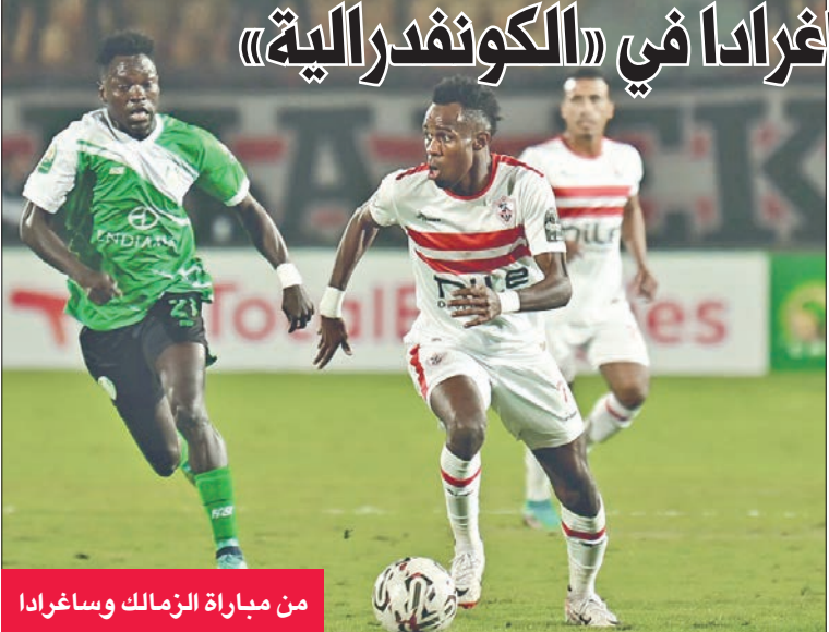
من مباراة الزمالك وساغرادا