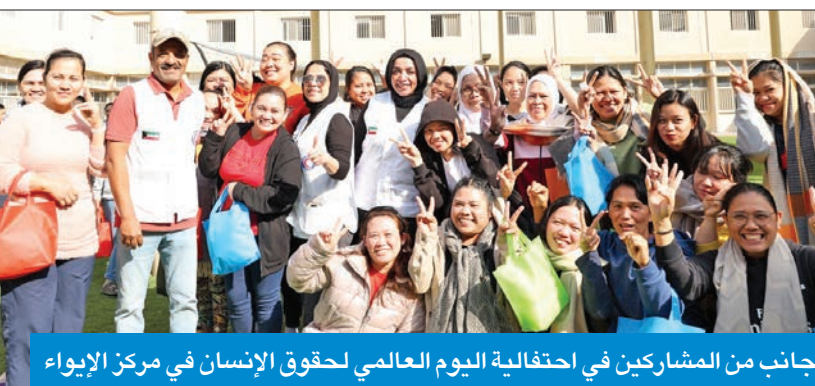
جانب من المشاركين في احتفالية اليوم العالمي لحقوق الإنسان في مركز الإيواء

ويحت اللقاء أفاق التعاون المشترك، وكيفية بناء شراكات تنفيذ برامج مفيدة وفعالة لخدمة الأمور المتعلقة بتعزيز حقوق الإنسان عموماً، وما يتعلق بحقوق الأشخاص الذين يقعون في نزاع مع القانون، بما في ذلك حقوق المهاجرين والعمال، ومناهضة الاتجار بالبشر من منطلق الحقوق الإنسانية ووفقاً لما تؤكده المعايير الدولية.