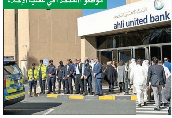
موظفو «المتحد» في عملية الإخلاء

وتعتبر خاصية الترميز من الخصائص التي تعمل