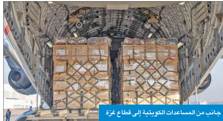
جانب من المساعدات الكويتية إلى قطاع غزة

إقلاع الطائرة الإغاثية الـ37 من الجسر الجوي إلى القطاع