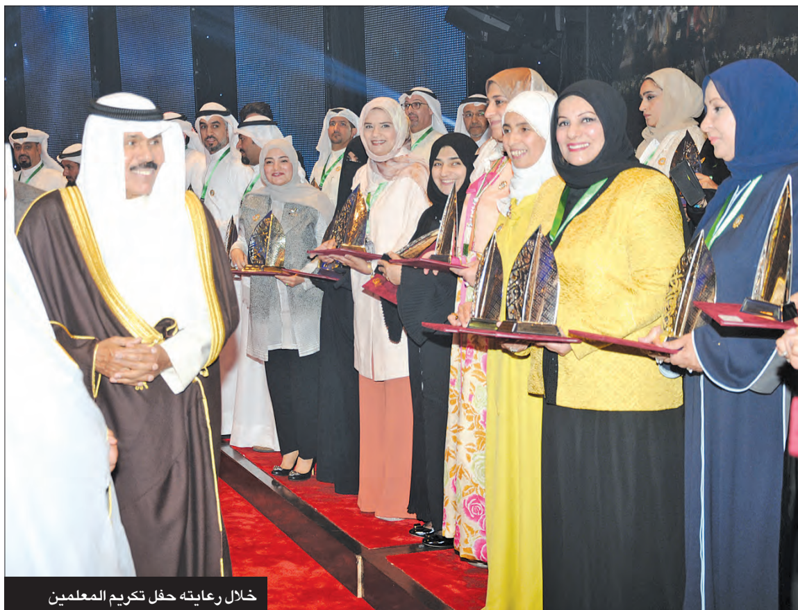
خلال رعايته حفل تكريم المعلمين