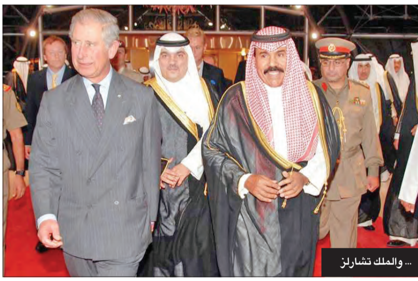
... والملك تشارلز