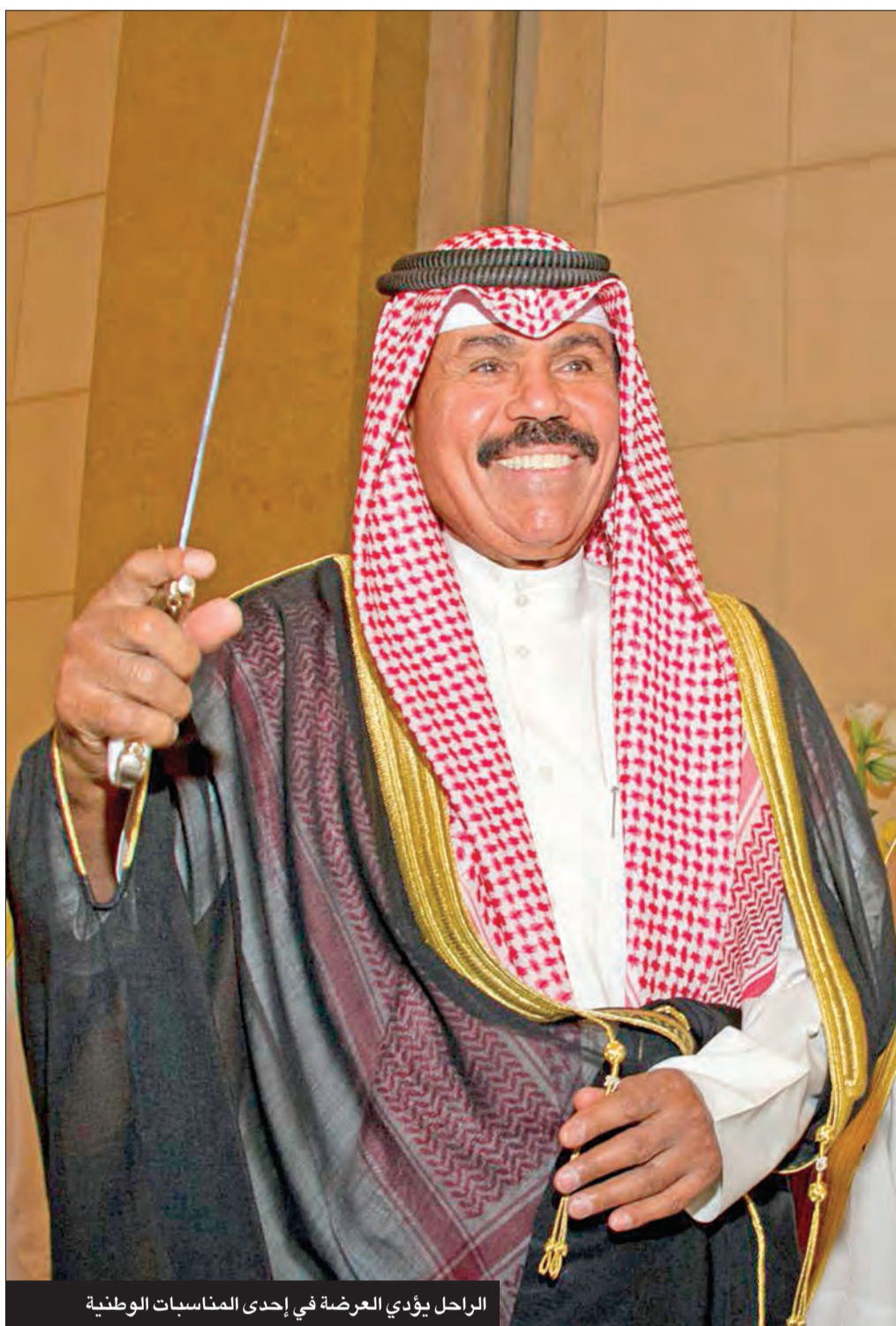
الراحل يؤدي العرضة في إحدى المناسبات الوطنية