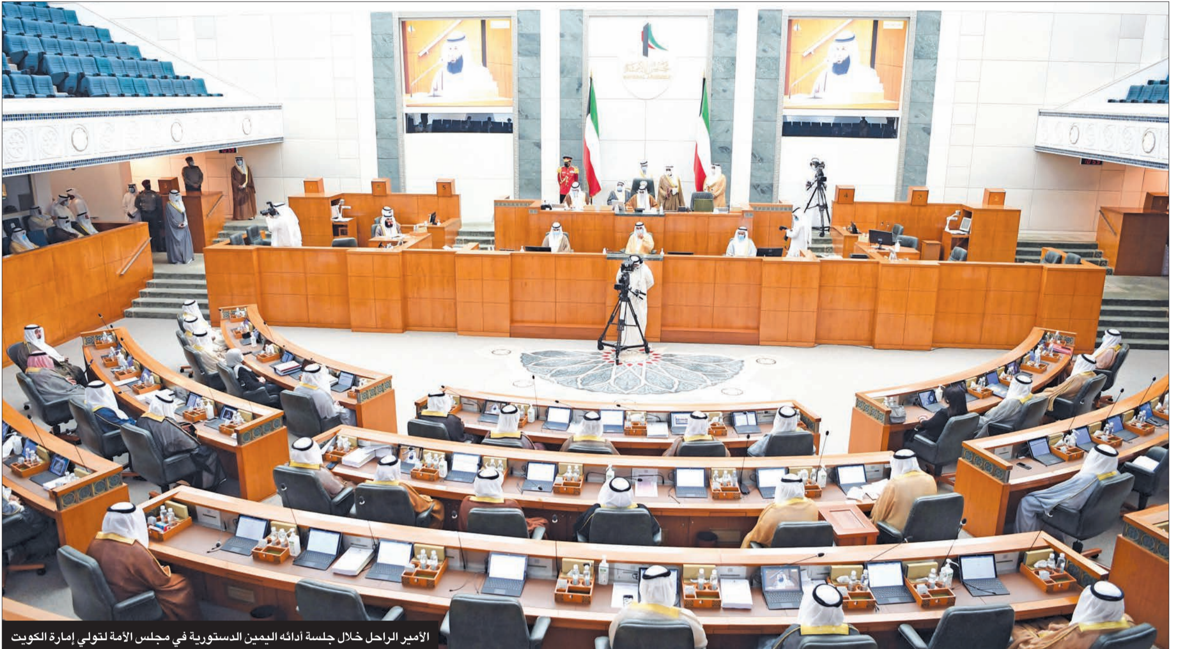
الأمير الراحل خلال جلسة أدائه اليمين الدستورية في مجلس الأمة لتولي إمارة الكويت