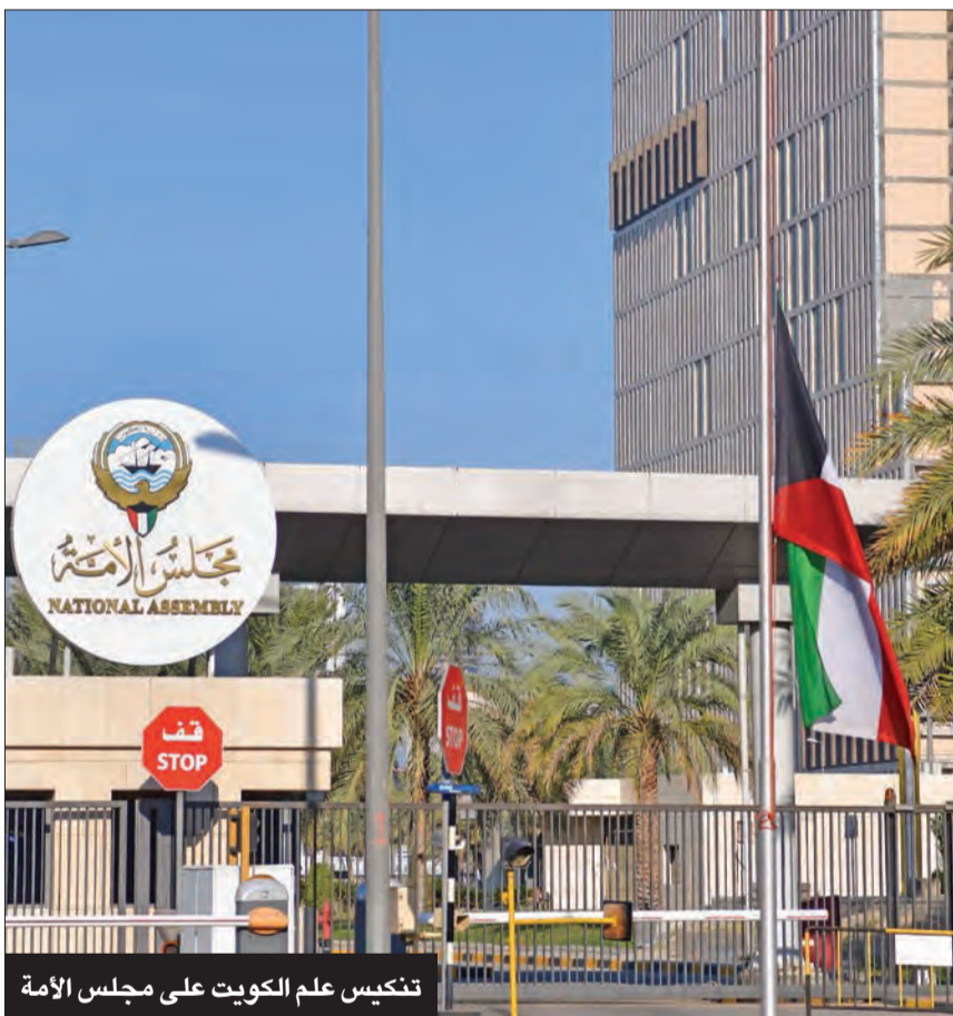
تتخمس علم الكويت على مجلس الأمة

وأعرب النائب محمد الرقيب قائلاً: «بقلوب مؤمنة بقضاء الله وقدره تلقينا خير وفاة والدنا الشيخ نواف الأحمد، ونسال الله تعالى له المغفرة والرحمة، وخالص عزائنا لسمو الشيخ مشعل الأحمد، ولسمو الشيخ أحمد الخواف وللشعب الكويتي كافة». بدوره، دعا النائب بدر نشمي: «اللهم ارحم عبدك نواف الأحمد الصباح، واغفر له، اللهم إنا نشهد نزلته ووسع مدخله، واغسله بالماء والتلج والبرد، اللهم إنا نشهدك أنه حمل الأمانة وصانها، وأرضى ربه وضميره ومواطنيه، نستودعك الله يا أميرنا».