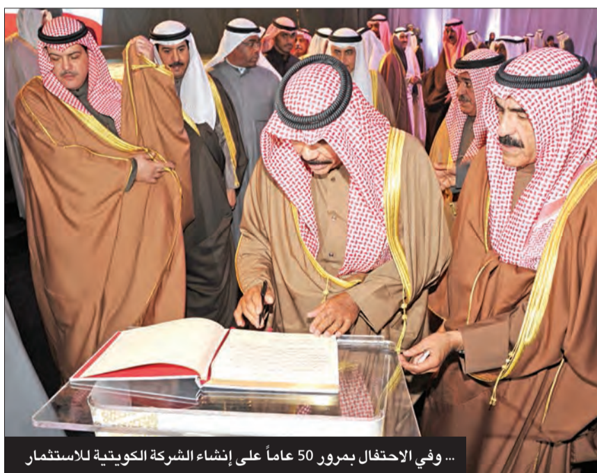
... وفي الاحتفال بمرور 50 عاماً على إنشاء الشركة الكويتية للاستثمار

وخلال جولاته على مختلف القطاعات، زار سموه عدداً من وزارات الدولة، وبعث توجيهات سامية للحكومة تشدد على ترسيخ دولة القانون والمؤسسات، والالتزام بتطبيق القانون على الجميع، وتجسيد العدالة والمساواة، ووضع مصلحة الكويت فوق كل اعتبار، والتصدي للقضايا الجهورية وحماية المال العام.