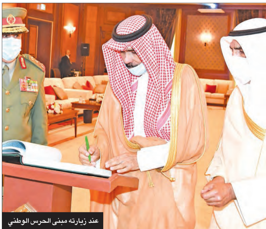
عند زيارته مبنى الحرس الوطني