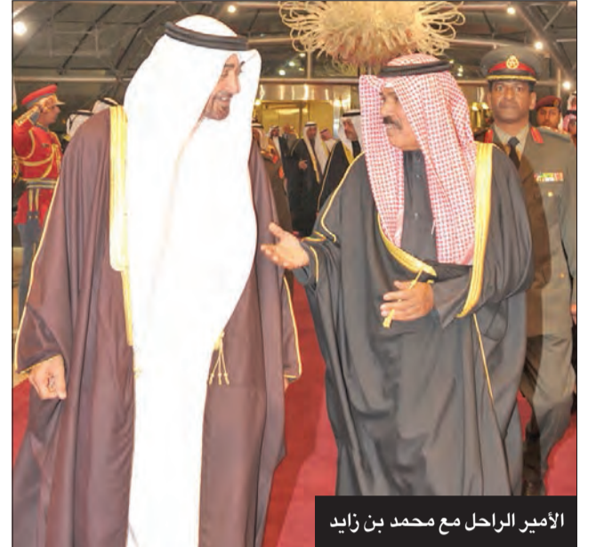
الأمير الراحل مع محمد بن زايد

الأمير الراحل، داعياً الله أن يتغمد الفقيد برحمته الواسعة ورضوانه.