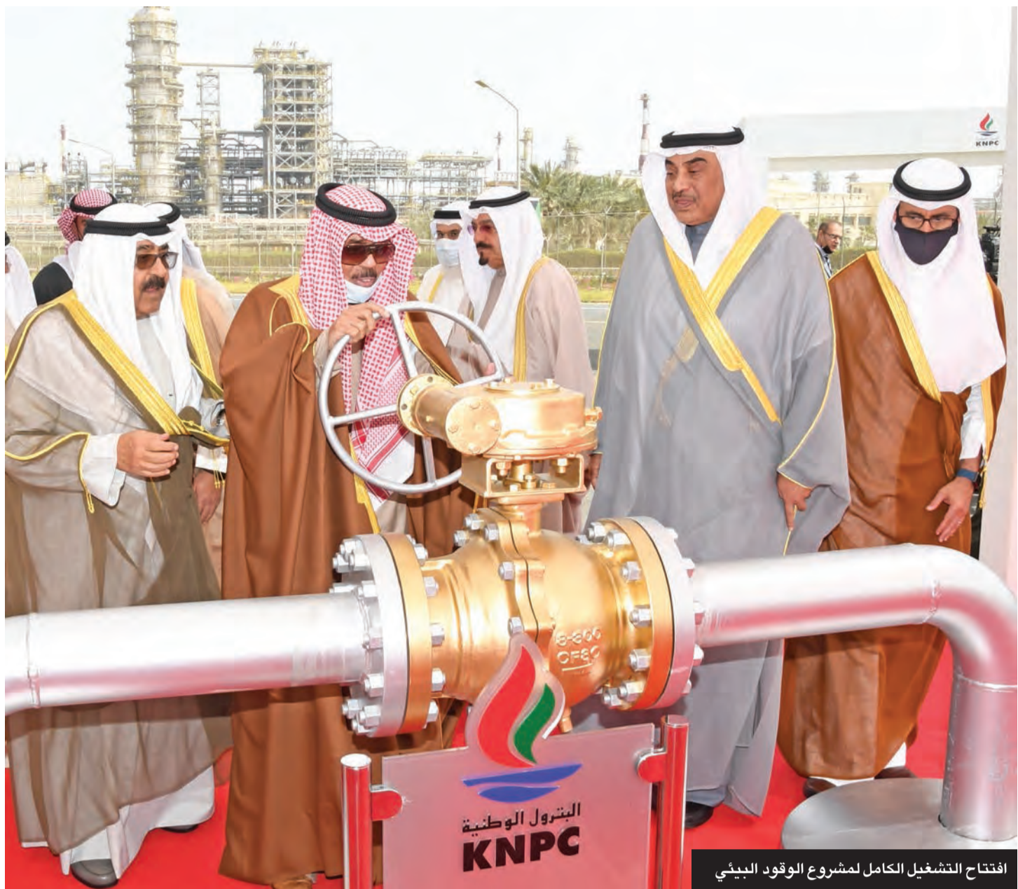
افتتاح التشغيل الكامل لمشروع الوقود البيئي