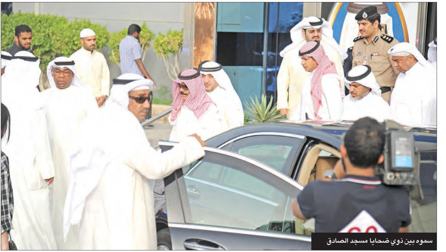
سموه بين ذوي ضحايا مسجد الصادق