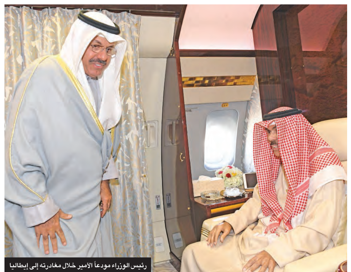
رئيس الوزراء مودعاً الأمير خلال مغادرته إلى إيطاليا