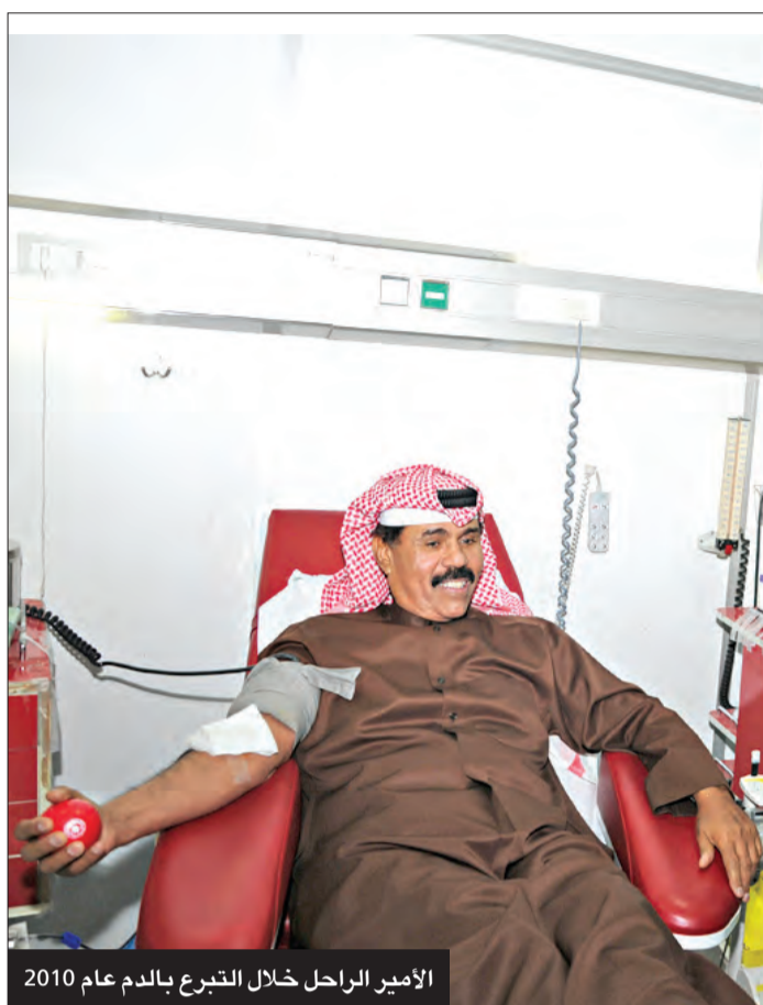
الأمير الراحل خلال التبرع بالدم عام 2010

بدأت خططاً جديدة تعتمد فيها على معطيات الحاضر لبناء مستقبل زاهر تواكب فيه مستجدات العصر وتطوراته وتتواءم المكانة التي تستحقها إقليمياً وعالمياً.