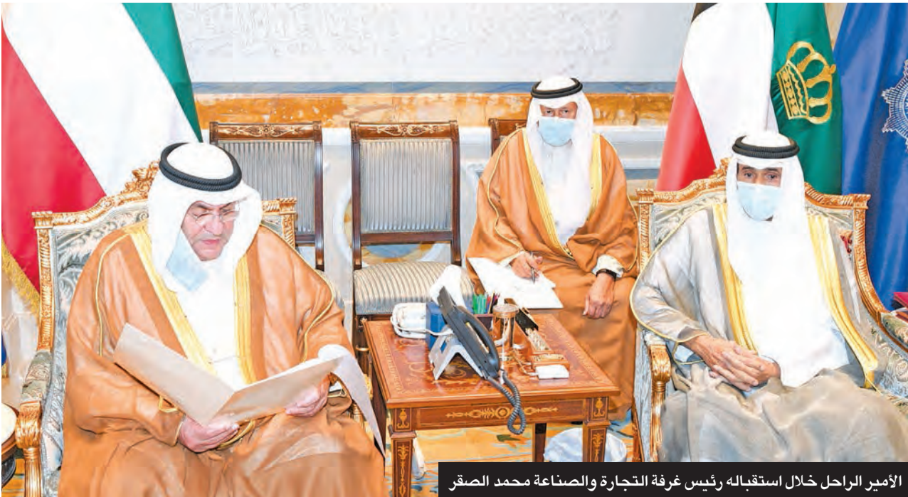
الأمير الراحل خلال استقباله رئيس غرفة التجارة والصناعة محمد الصقر