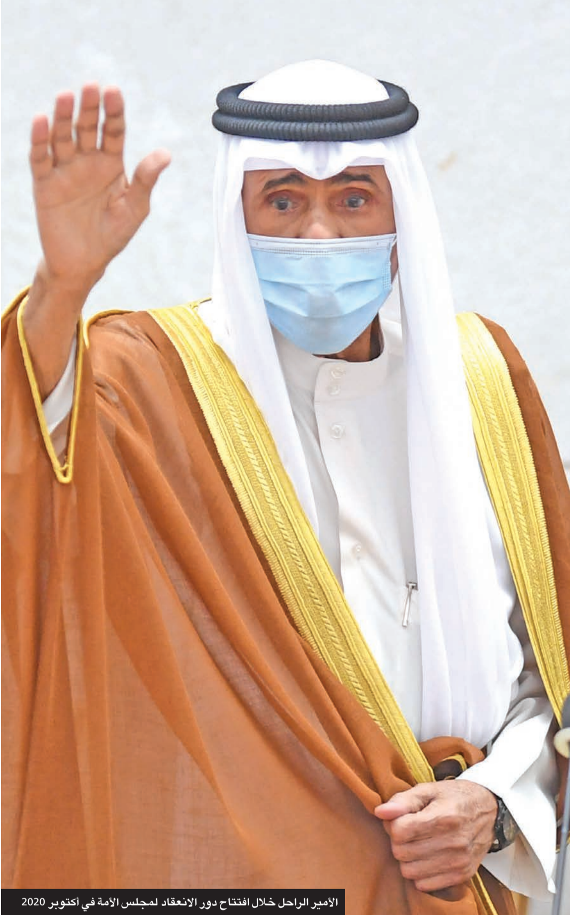
الأمير الراحل خلال افتتاح دور الانعقاد لمجلس الأمة في أكتوبر 2020

ولد سموه في 25 يونيو 1937 في مدينة الكويت بفريج الشيوخ، وهو الابن السادس لحاكم الكويت العاشر المغفور له، بإذن الله، الشيخ أحمد الجابر، وقد نشأ سموه وترعرع في بيوت الحكم منذ ولادته، وهي بيوت تعتبر مدارس في التربية والتعليم والالتزام والانضباط وإعداد حكام المستقبل وتأهيلهم. درس سموه في مدارس حمادة وشرق والنفرة، ثم المدرسة الشرقية والمباركية، وواصل دراساته في أماكن مختلفة من الكويت حيث تميز بالحرص على مواصلة تحصيله العلمي، وظلت هذه الصفة تلازمه طوال حياته، وتجلت بتشجيع سموه لطلبة العلم في مختلف مراحل التعليم انطلاقاً من إيمانه بأهمية التحصيل العلمي الذي يعتبر أساس تقدم المجتمعات ورفقيها. تزوج سموه من الشبيخة شريفة سليمان الجاسم، وله من الأبناء أربعة أولاد وبنات، هم: الشبيخة وشيخة والشيوخ فيصل وأحمد وعبدالله وسالم. ويعتبر سمو الشيخ نواف الأحمد، رحمه الله، أحد مؤسسي الكويت الحديثة الذين ساهموا في إرساء دعائم الدولة، وشاركوا في عمليات النهضة والبناء التي شهدتها عقب الاستقلال مطلع الستينيات، وكان لسموه بصمة في العمل السياسي، ففي 12 فبراير عام 1961 عينه الأمير الراحل الشيخ عبدالله السالم محافظاً لحولي، وظل في هذا المنصب حتى 19 مارس عام 1978 عندما عُيّن وزيراً للداخلية في عهد الأمير الراحل الشيخ جابر الأحمد حتى 26 يناير 1988 عندما تولى