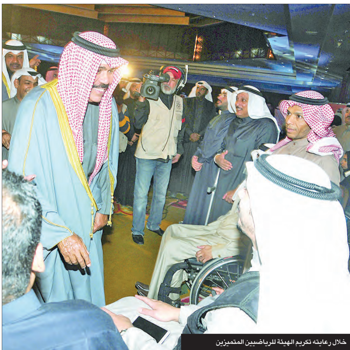
خلال رعايته تكريم الهيئة للرياضيين المتميزين