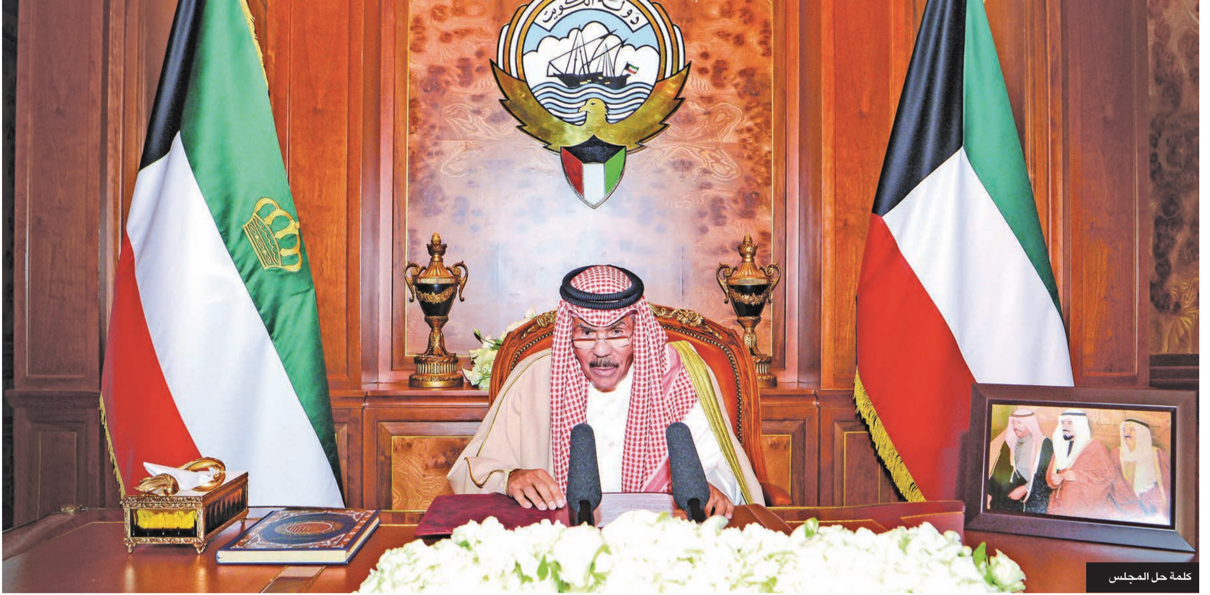
كلمة حل المجلس

العهد كلمة قال فيها: «إننا لجنا للشعب لإعادة تصحيح المسار وعليه حسن الاختيار بعيداً عن الطائفية أو التعصب»، مضيفاً أن «الدستور في حيزه مكتون بوصفه شرعية الحكم والعهد الوثيق بيننا ولا مساس به أو حيدة عنه». وفي الأول من أغسطس، أصدر سمو ولي العهد الشيخ مشعل الأحمد المرسوم رقم 135 لسنة 2022، القاضي بتشكيل الوزارة الـ 40 في البلاد، ويعتد الأمير الراحل، رحمه الله، برسالة شكر وتقدير إلى سمو الشيخ صباح الخالد، ثمن فيها سموه ما بذله الخالد خلال فترة رئاسته لمجلس الوزراء، وأعرب عن خالص تحياته وصادق التمنيات لسموه بدوام الصحة وموفق العافية، كما أشاد بكل ما بذل من جهود مخلصه وعمل دؤوب ومن تفان في خدمة الوطن العزيز ورفع مكانته، والإسهام في دفع مسيرته التنموية طوال فترة رئاسته لمجلس الوزراء.