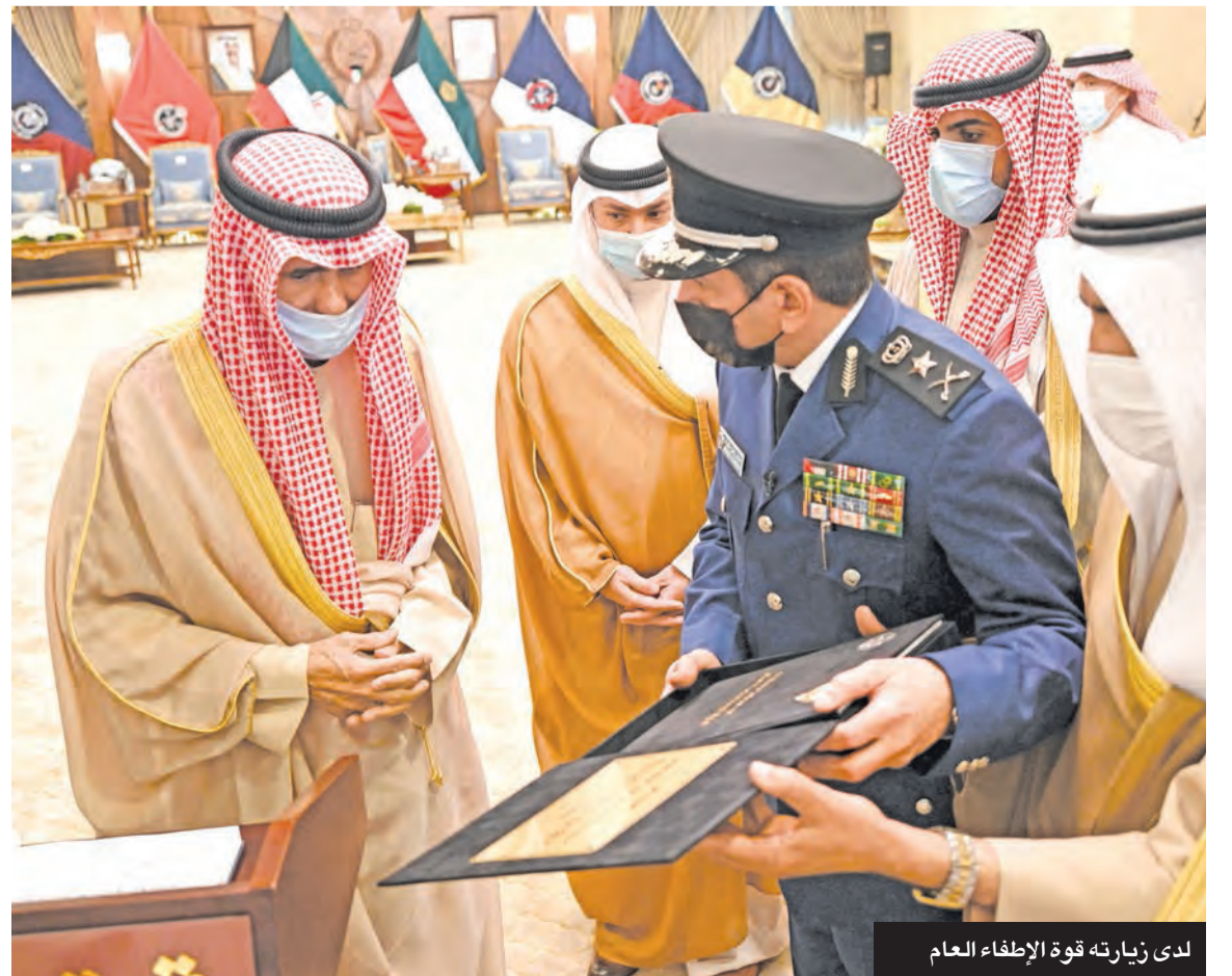
لدى زيارته قوة الإطفاء العام