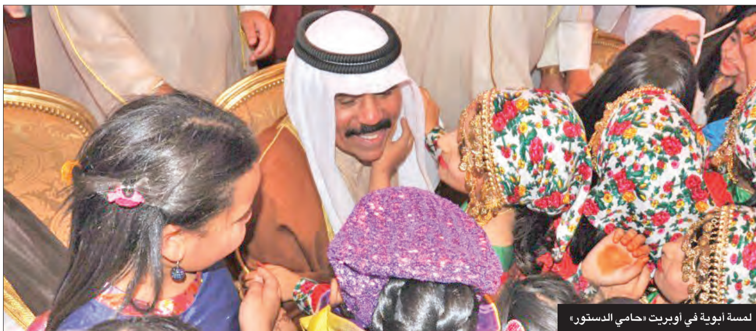
لمسة أبوية في أوبريت «حامي الدستور»