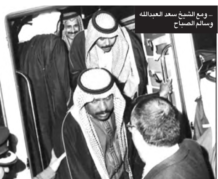
... ومع الشيخ سعد العبدالله وسالم الصباح

في يوليو الماضي، شهدت مدينة جدة قمة خليجية - عربية - أميركية، ركزت على الشراكة الاستراتيجية مع الولايات المتحدة ومواجهة قضايا الأمن والتنمية والتحديات الإقليمية وأزمة الغذاء العالمية وتقلبات أسعار النفط، وجهود تعافى الاقتصاد، فضلاً عن خطر تدخل إيران في الشؤون الداخلية لدول المنطقة، إلى جانب القضية الفلسطينية وتجييف منابع الإرهاب.