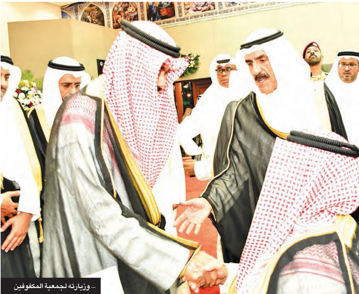
...وزيارته لجمعية المكفوفين