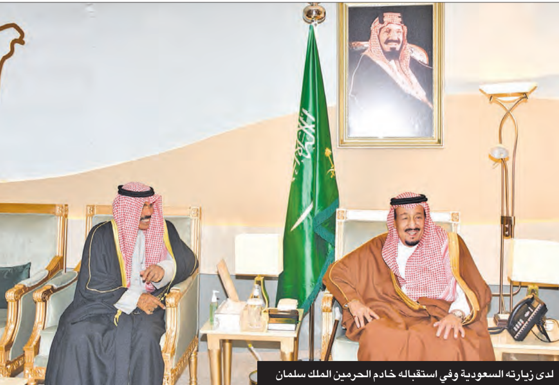
لدى زيارته السعودية وفي استقباله خادم الحرمين الملك سلمان