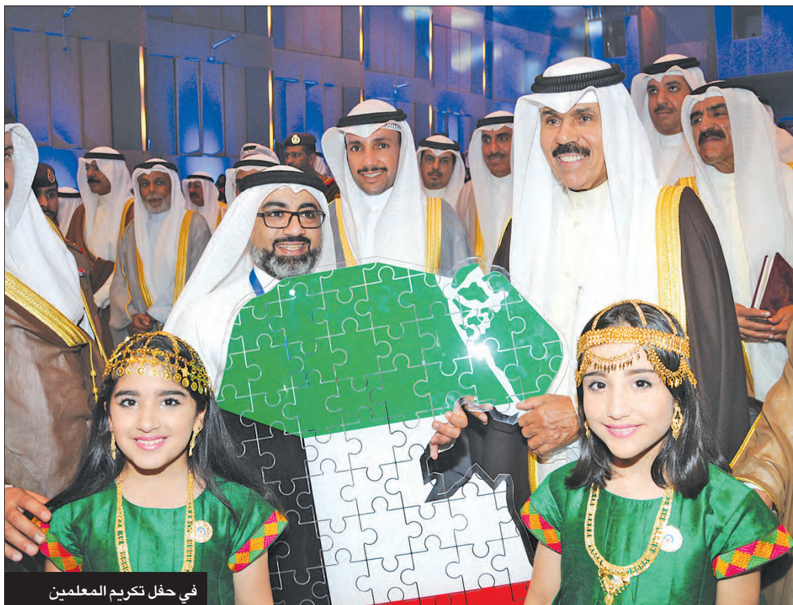
في حفل تكريم المعلمين

كان للشباب والمرأة نصيب وافر من توجيهات سموه، رحمه الله، فالشباب هم عماد المستقبل وبناء النهضة والحضارة، والمرأة نصف المجتمع، وتمكينها ضماناً لاستمرار دورها النهضوي التنموي. واستمراراً لمسيرة العمل البرلماني، أجريت في عهد سموه، انتخابات مجلس الأمة للفصل