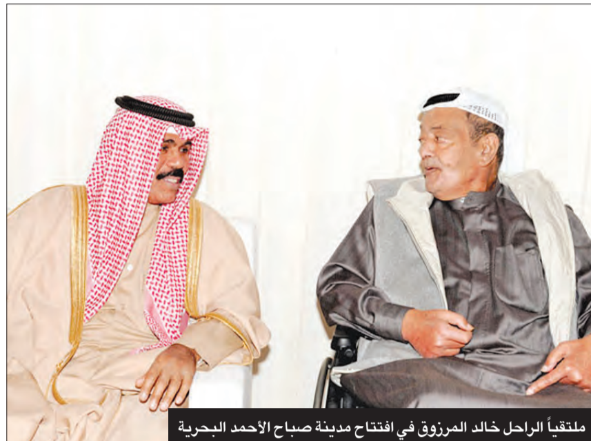
ملتقىاً الراحل خالد المرزوق في افتتاح مدينة صباح الاحمد البحرية