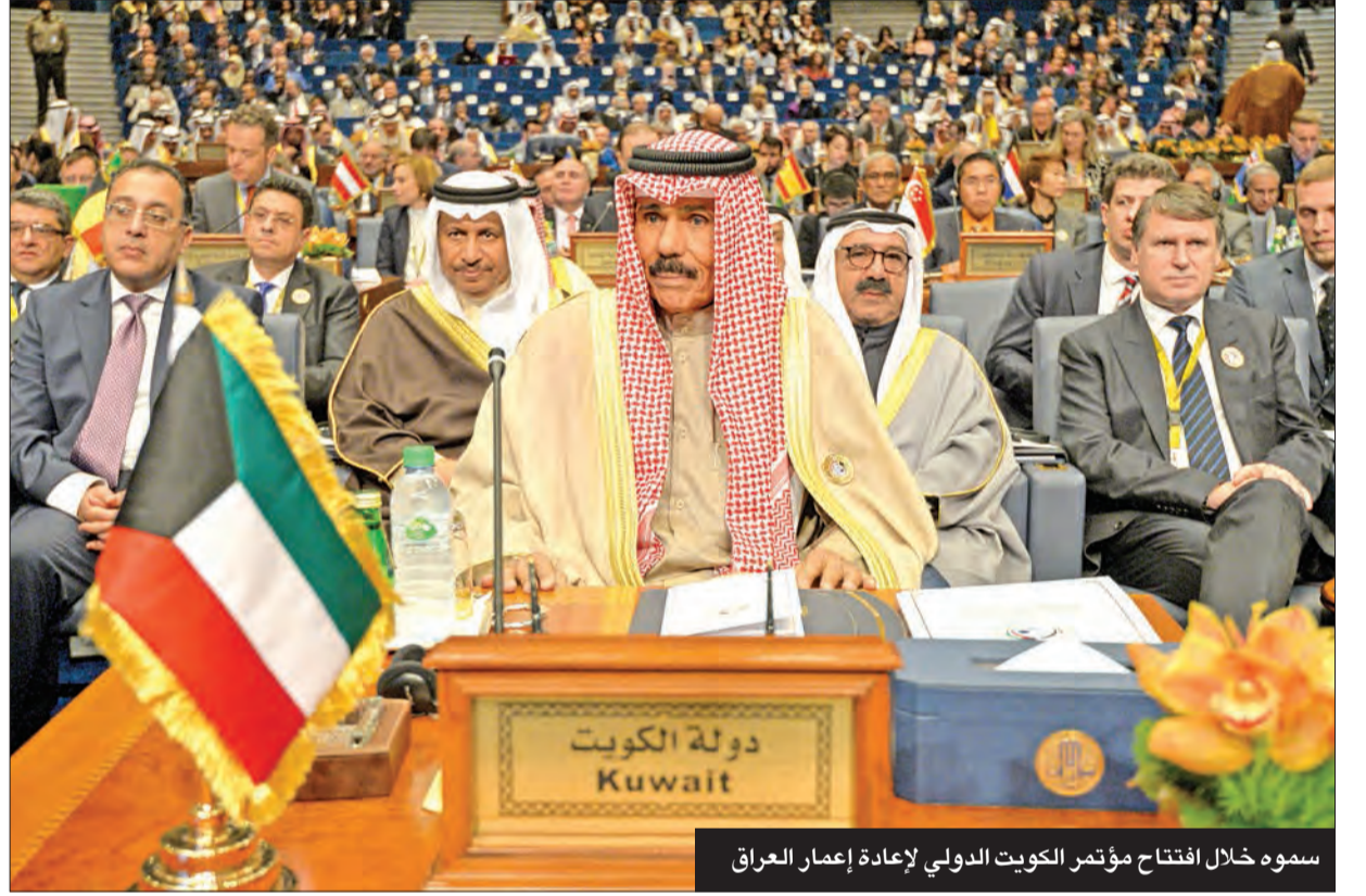
سموه خلال افتتاح مؤتمر الكويت الدولي لإعادة إعمار العراق