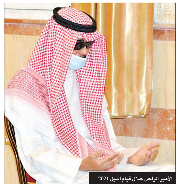
الأمير الراحل خلال قيام الليل 2021