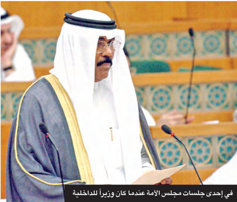
في إحدى جلسات مجلس الأمة عندما كان وزيراً للداخلية