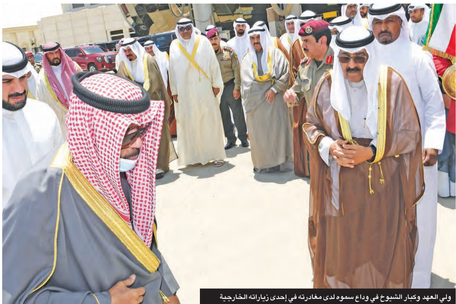
ولي العهد وكبار الشيوخ في وداع سموه لدى مغادرته في إحدى زياراته الخارجية