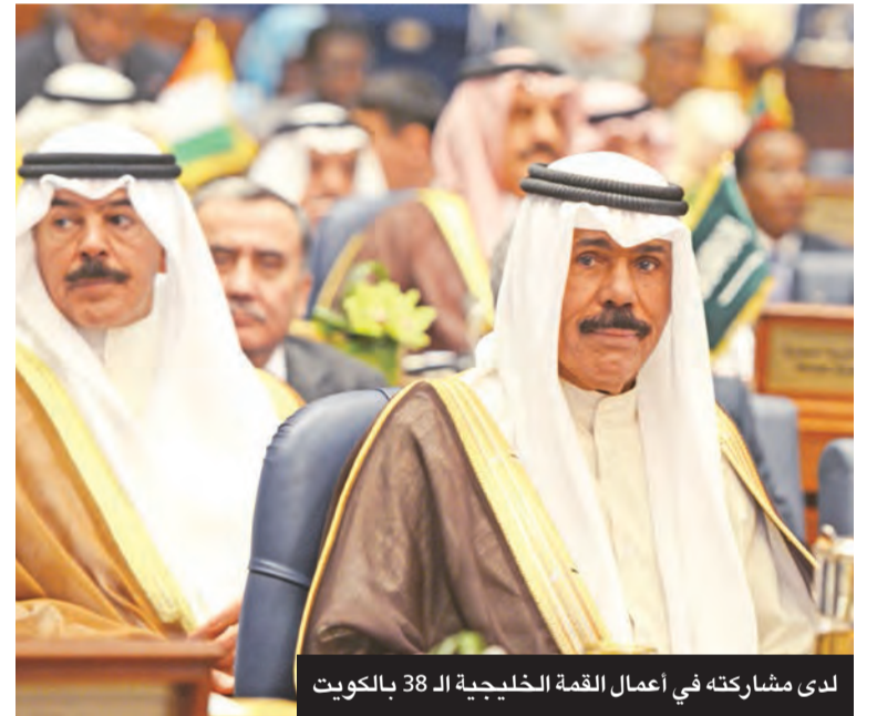
لدى مشاركته في أعمال القمة الخليجية الـ 38 بالكويت

وتعامل رحمه الله بشكل حازم مع الحوادث الإرهابية التي حدثت في أماكن متفرقة من البلاد شهري يناير وفبراير من عام 2005، حيث قاد سموه بنفسه المواجهة ضد الإرهابيين وكان موجوداً في مواقع تلك الأحداث لاستئصال أفة الإرهاب في البلاد من جذورها.