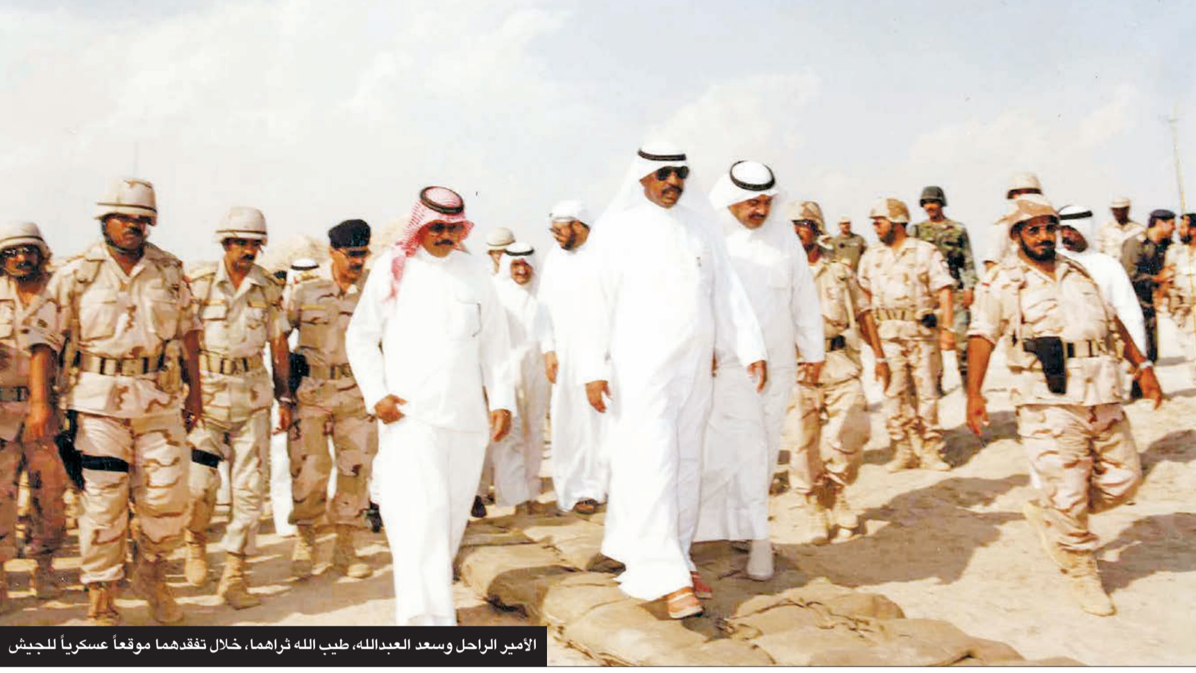
الأمير الراحل وسعد العبدالله، طيب الله ثراهما، خلال تفقدتهما موقعاً عسكرياً للجيش

58 عاماً من العطاء في مناصب عدة خدم خلالها الكويت في عهد عدد من أمرائها الكرام ونال تزيينهم وثقتهم جميعاً، وبدأها بتعيينه محافظاً لحولي ثم وزيراً للداخلية ثم «الدفاع» فوزيراً للشؤون الاجتماعية والعمل ثم نائباً لرئيس الحرس الوطني، ونائباً لرئيس مجلس الوزراء فوزيراً للداخلية.