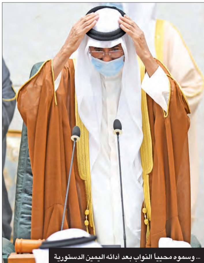
... وسموه محيياً للتواب بعد أدائه اليمين الدستورية

وأكد النائب خالد الطمار: «إن القلب ليحزن وإن العين لتدمع ولا تقول إلا ما يرضي ربنا، إننا لله وإننا إليه راجعون، اللهم ارحم والدنا وأميرنا الشيخ نواف الأحمد الصباح، اللهم انزله منازل الصديقين، والشهداء، والصالحين، واجعل قبره روضة من رياض الجنة». بينما ذكر النائب متعب الرثعان: «اللهم اغفر لصاحب السمو الشيخ نواف الأحمد، اللهم اجعل قبره روضة من رياض الجنة»، وقال النائب محمد هابيف: «نعزي أنفسنا والشعب الكويتي وأسرة الصباح والأمة الإسلامية بوفاة الشيخ نواف الأحمد صاحب الأخلاق والتواضع والحكمة، وأسأل الله أن يرفع درجته ويعلي منزلته ويسكنه الفردوس الأعلى من الجنة».