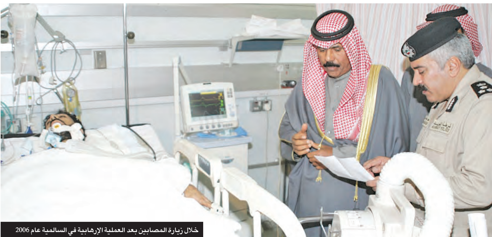
خلال زيارة المصابين بعد العملية الإرهابية في السالمية عام 2006

ونيابة عن صاحب السمو ألقى سمو ولي العهد كلمة قال فيها، إننا لجأنا للشعب لإعادة تصحيح المسار، وعليه حسن الاختيار بعيداً عن الطائفية أو التعصب، مضيفاً أن الدستور في حيزه مكنون بوصفه شرعية الحكم والعهد