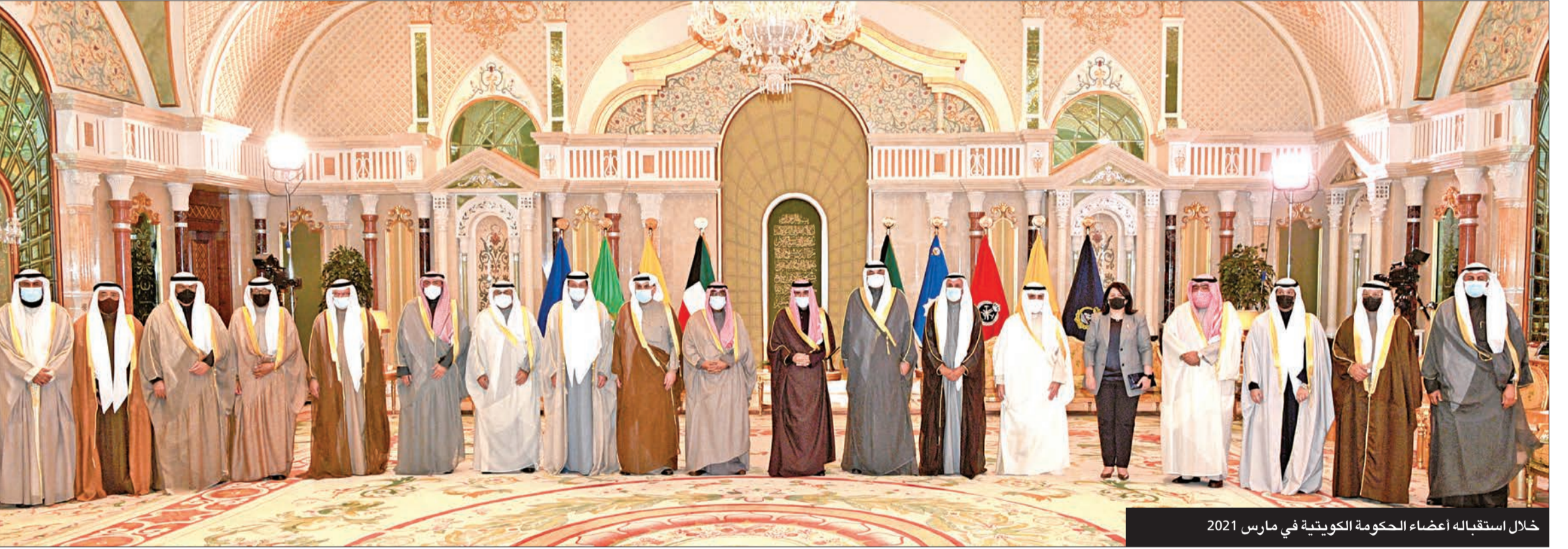
خلال استقباله أعضاء الحكومة الكويتية في مارس 2021