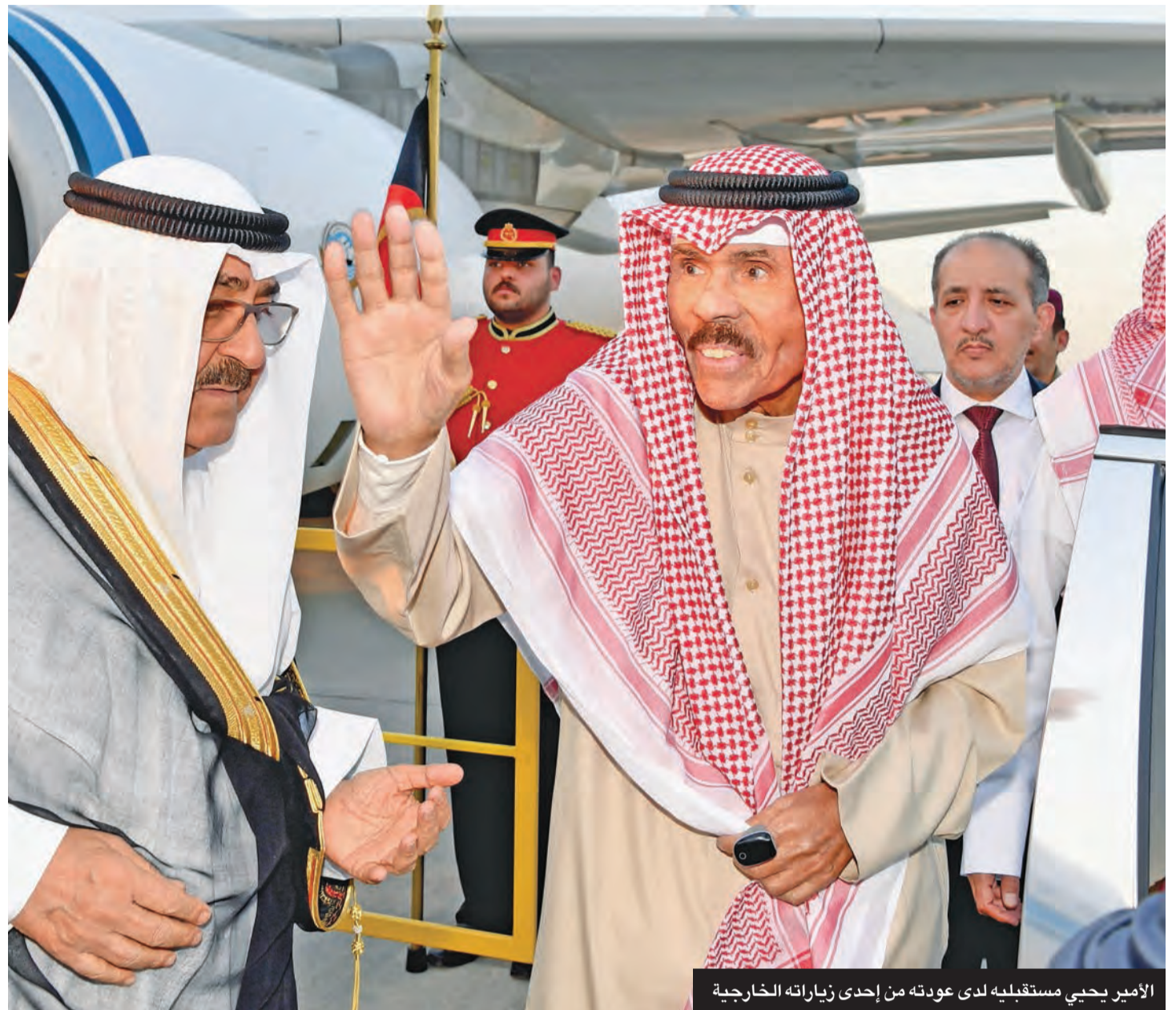
الأمير يحيي مستقبليه لدى عودته من إحدى زيارته الخارجية

التي من الله تعالى عليهم بها، داعياً أن «تدوم للكويتيين إلى أبد الأبدين».