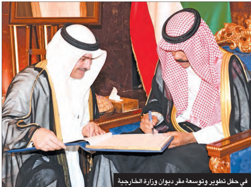
في حفل تطوير وتوسعة مقر ديوان وزارة الخارجية