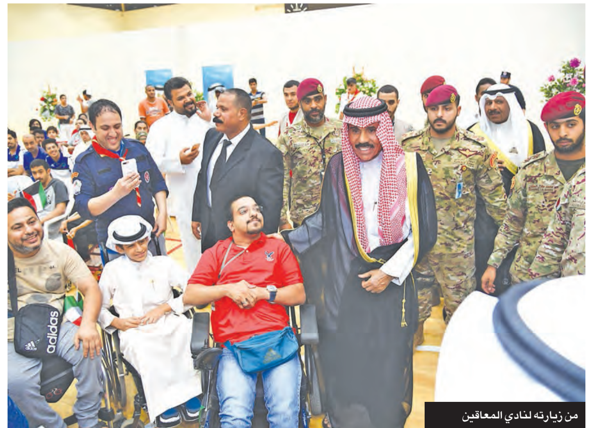
من زيارته لنادي المعاقين