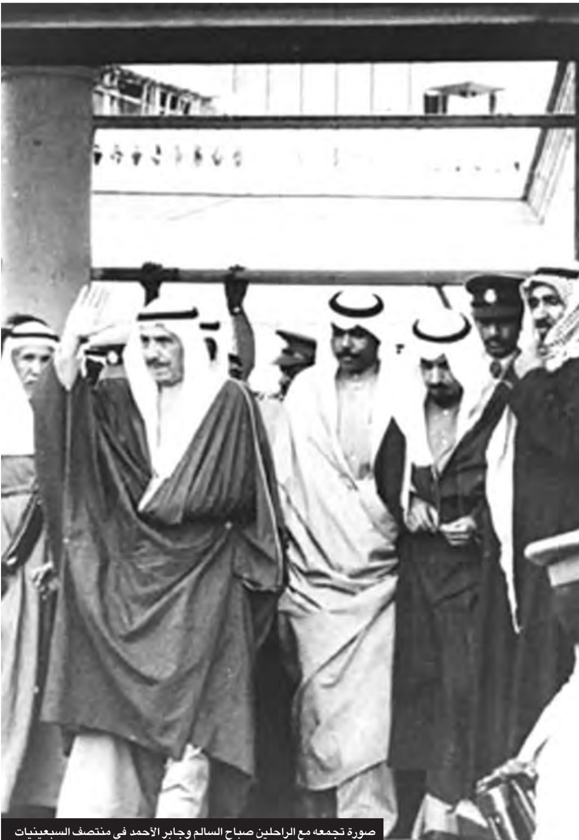
صورة تجمعه مع الراحلين صباح السالم وجابر الأحمد في منتصف السبعينيات

إِنَّا لِلَّهِ وَإِنَّا إِلَيْهِ رَاجِعُونَ