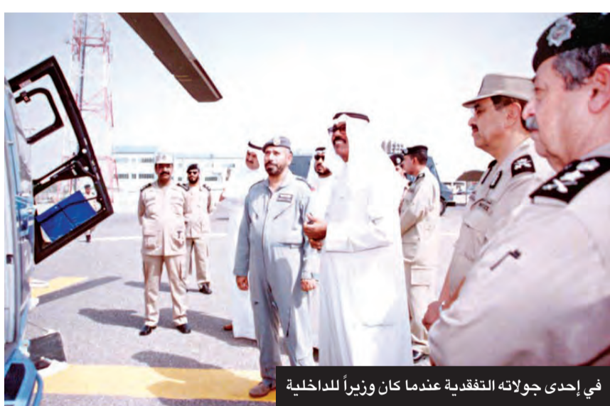
في إحدى جولاته التقفدية عندما كان وزيراً للداخلية

وفي كلمة الكويت بقمة جدة للأمن والتنمية، قال ممثل سمو أمير البلاد الشيخ نواف الأحمد، سمو ولي العهد الشيخ مشعل الأحمد: «يسرني في البداية ونحن في رحاب مدينة جدة؛ الدوابة الرئيسة لدخول أعظم بقعة على وجه الأرض، مكة المكرمة، أن نمثل حضرة صاحب السمو أمير دولة الكويت المغدى الشيخ نواف الأحمد الجابر الصباح، حفظه الله ورعاه، ويطلب لي أن أنقل لكم تحياته الأخوية لأشقائه ولأصدقاء دولة الكويت من أصحاب الجلالة والفخامة والسمو، وتمنياته لهم بالنوفيق والسداد وللقامة الميمونة كل النجاح».