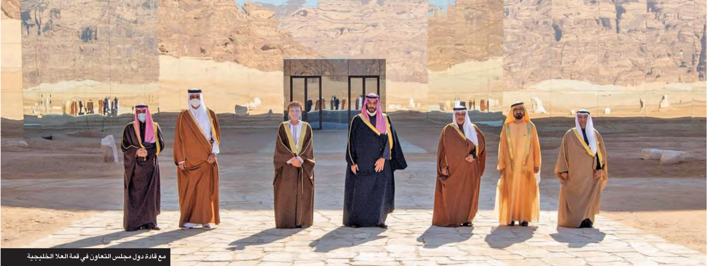
مع قادة دول مجلس التعاون في قمة العلا الخليجية