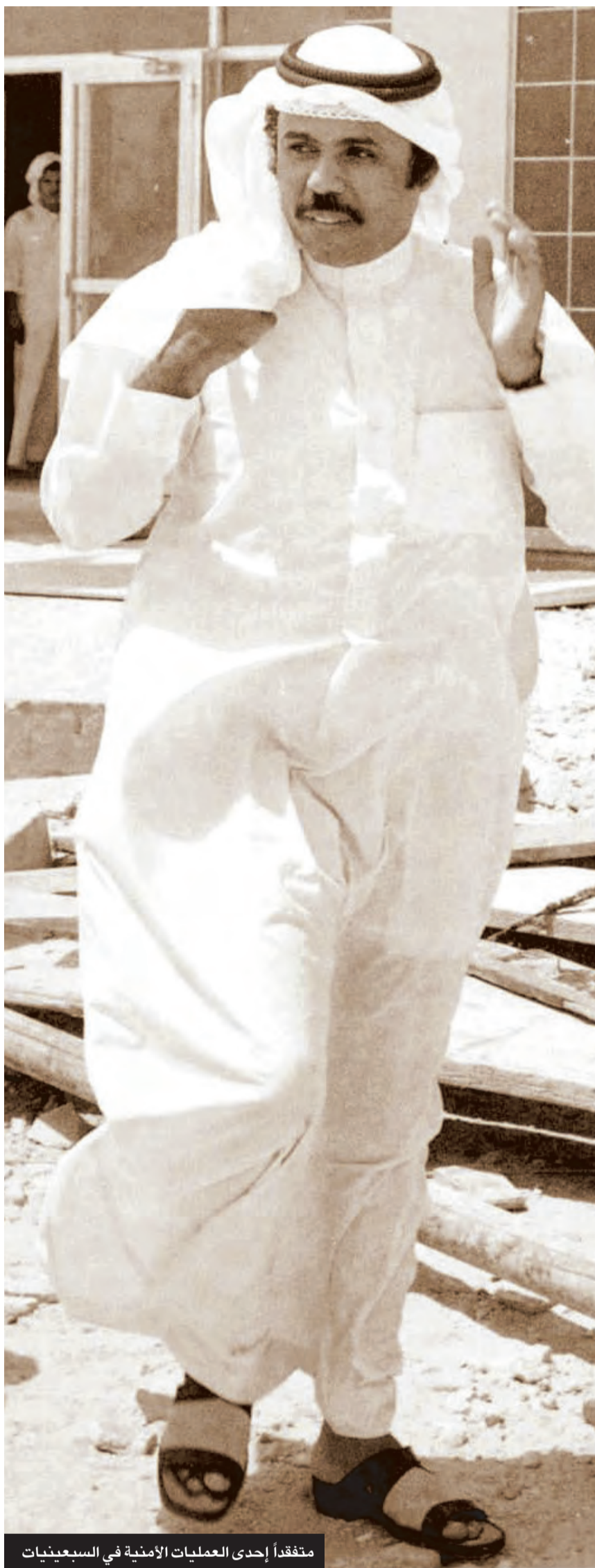
متفقداً إحدى العمليات الأمنية في السبعينيات