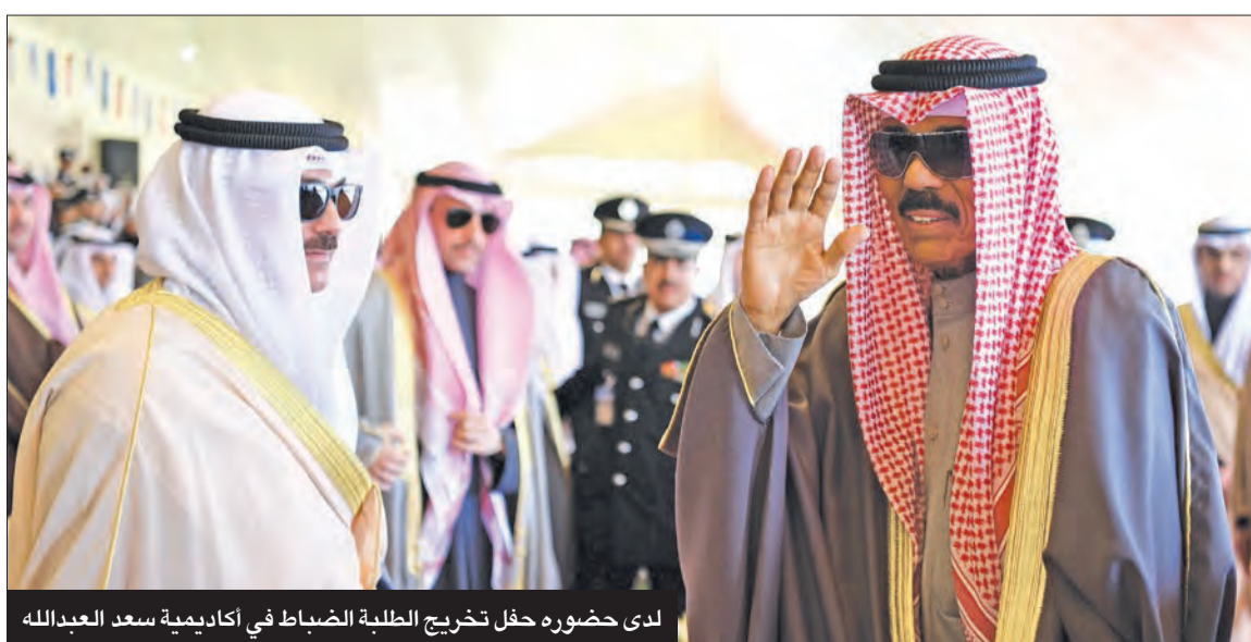
لدى حضوره حفل تخريج الطلبة الضباط في أكاديمية سعد العبدالله