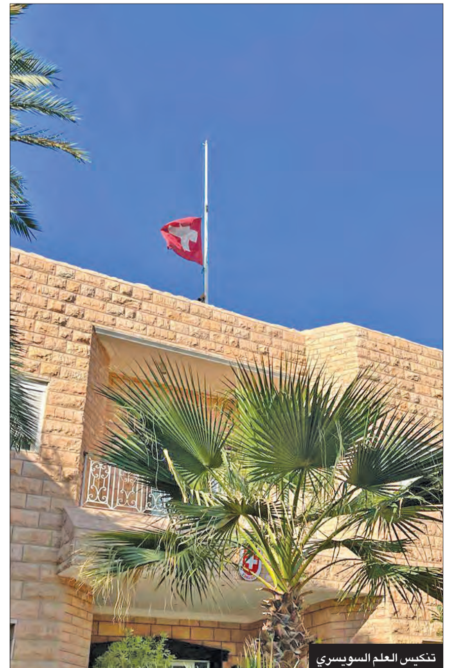
تكيس العلم السويسري

وأوضح أن «الكويت حافظت تحت قيادته على سياستها الراسخة المتمثلة في الاعتدال والتسامح، واحترام الحكم الذاتي لجميع الدول، وعدم التدخل في شؤونها الداخلية، والالتزام بالقانون الدولي والتسوية السلمية للصراعات بين الدول، وكلها أمور ذات أهمية قصوى بالنسبة لدول العالم ولجمهورية قبرص كذلك». وختم مافروس: «بالنيابة عن حكومة وشعب جمهورية قبرص، أود أن أتقدم إلى العائلة المالكة المكلمة وشعب دولة الكويت الصديق بتعازينا القلبية».