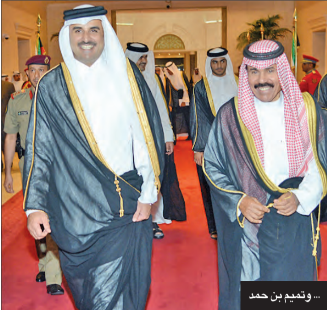
... وتميم بن حمد

الملك سلمان وولي عهده: الشيخ نواف رحل بعد مسيرة حافلة بالإنجاز والعطاء محمد بن زايد: كان قائداً حكيماً قام بدور كبير في دعم العمل الخليجي المشترك السيسي: كان داعماً لأمتيه العربية والإسلامية حريصاً على شؤونهما حكيماً في قيادته عبدالله الثاني: عرفناه صاحب نخوة وحكمة ودوراً في تمثيل العلاقات العربية سوناك: نتذكر بكل تقدير ما أسداه الفقيد من أجل إرساء الاستقرار في الشرق الأوسط بوتين: للراحل مكانة كبيرة بالمنطقة ونقدر مساهمته في تعزيز علاقات موسكو والكويت