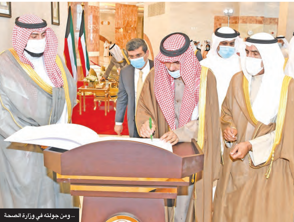
...ومن جولته في وزارة الصحة