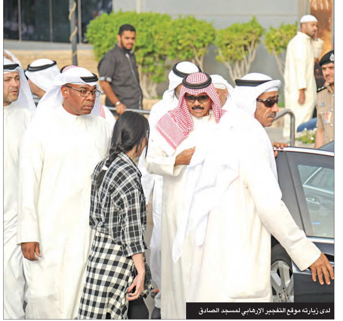
لدى زيارته موقع التفجير الإرهابي لمسجد الصادق

العرب، إذ كان يحرص على التنسيق مع القادة العرب في كل ما يخص القضايا العربية والتعاون البناء معهم لحل المشكلات التي تواجه الأمة العربية، مع التركيز على القضية الفلسطينية باعتبارها قضية العرب الأولى ومن أهم ركائز السياسة الكويتية والعربية والإسلامية، إلى جانب الوقوف مع الشعب الفلسطيني، سعياً لتحقيق كل ما يتطلع إليه من أهداف تمكنه من إقامة دولة فلسطين المستقلة وعاصمتها القدس الشرقية، وفقاً لقرارات الشرعية الدولية ومبادرة السلام العربية.