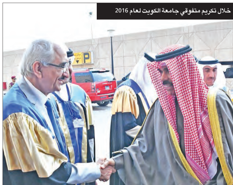
خلال تكريم متفوق في جامعة الكويت لعام 2016