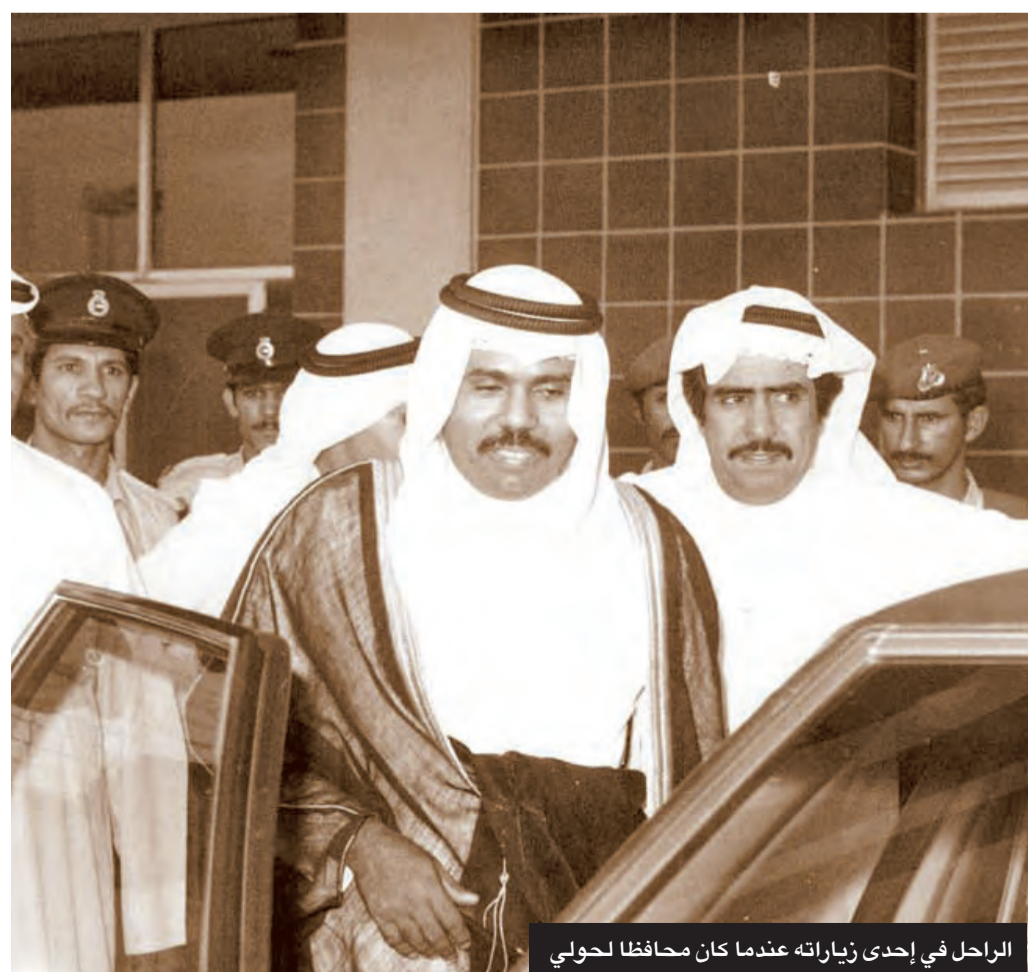
الراحل في إحدى زياراته عندما كان محافظاً لحولي