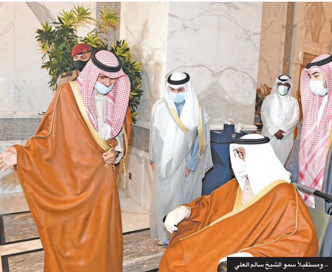
...ومستقبلاً سمو الشيخ سالم العلي