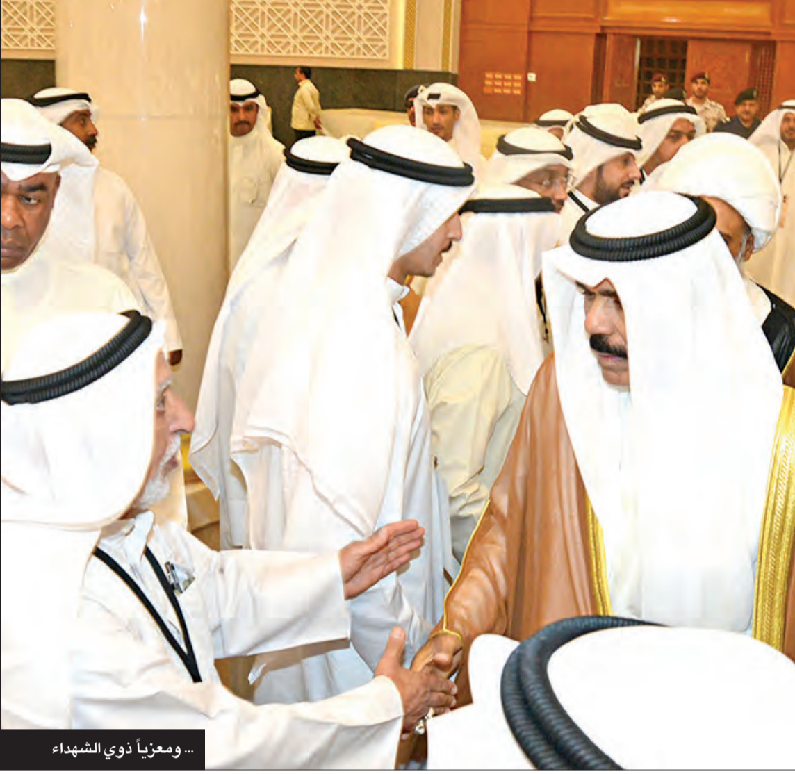
...ومعزياً ذوي الشهداء