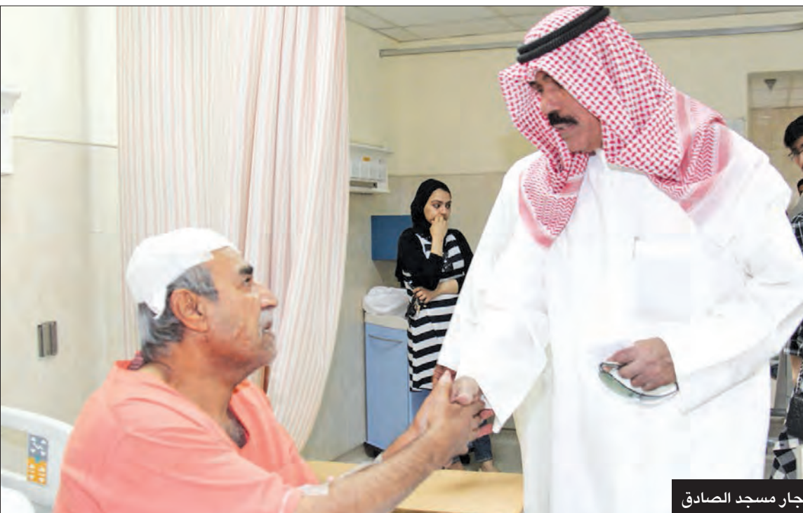
متفقاً المصابين في انفجار مسجد الصادق