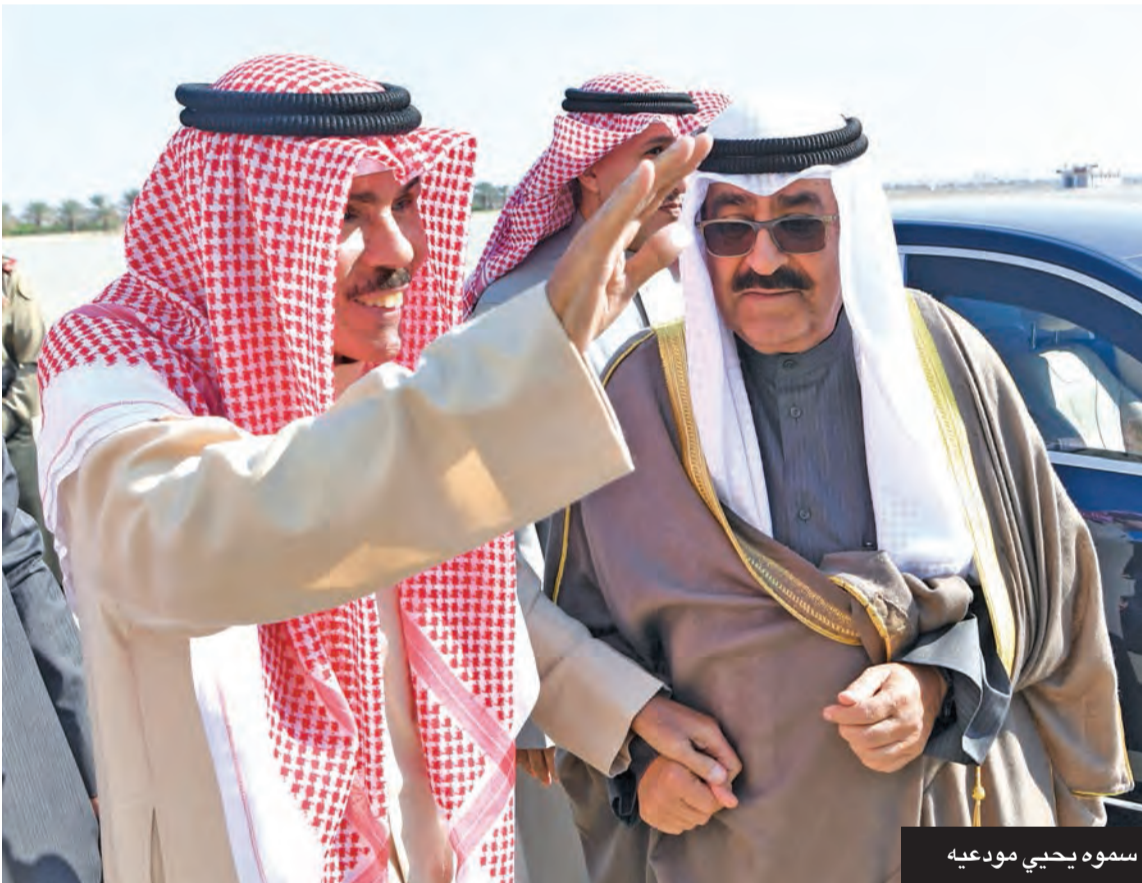
سموه يحيي مودعيه

وافتح المجلس في 20 يونيو الماضي، وفي 18 يونيو أصدر سمو نائب الأمير، ولي العهد الشيخ مشعل الأحمد، المرسوم رقم 116 لسنة 2023 القاضي بتشكيل حكومة أحمد نواف الأحمد لتصبح الحكومة رقم 44 في تاريخ البلاد.