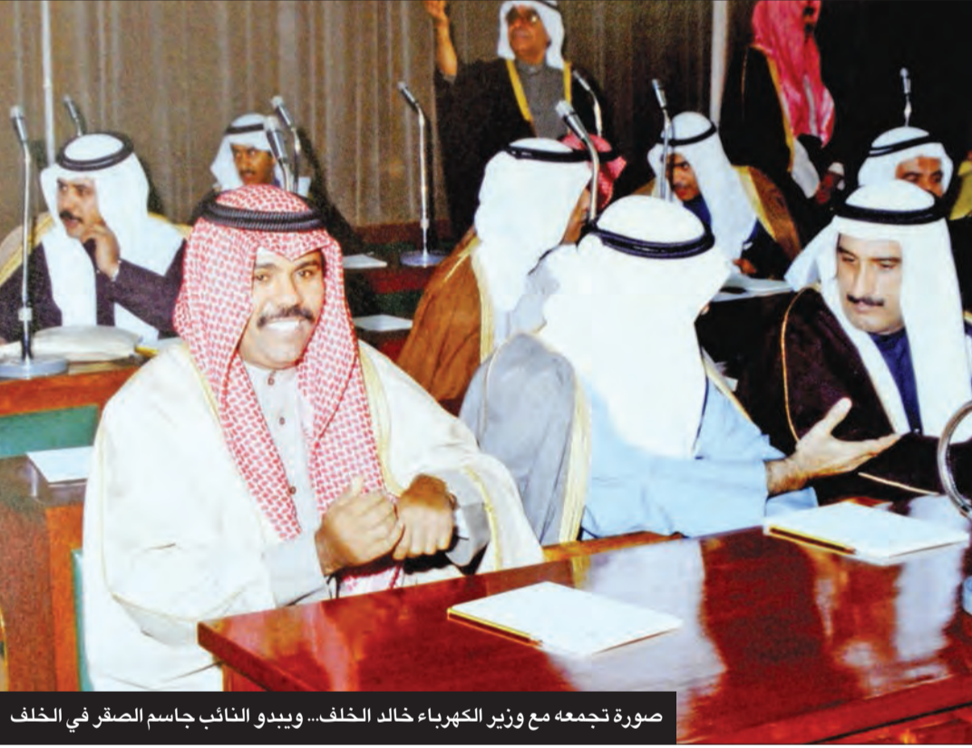
صورة تجمعه مع وزير الكهرباء خالد الخلف... ويبدو النائب جاسم الصقر في الخلف

وبدأت البلاد في عهد سموه مرحلة تاريخية في مسيرة البناء والعطاء إكمالاً للمراحل التي بدأها أسلافه الكرام، كما