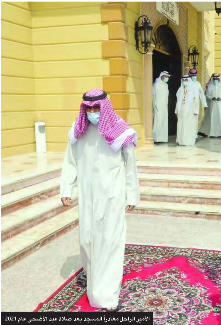
الأمير الراحل مغادراً المسجد بعد صلاة عيد الأضحى عام 2021