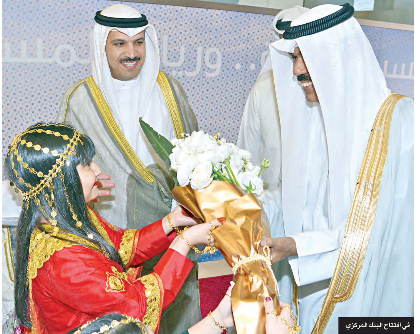
في افتتاح البنك المركزي