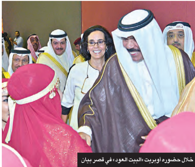
خلال حضوره أوبريت «البيت العود» في قصر بيان