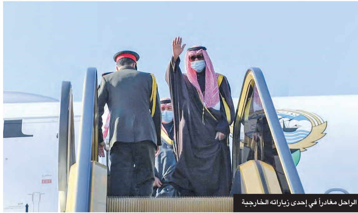
الراحل مغادراً في إحدى زياراته الخارجية

في مارس 2022 دشّن سموه التشغيل الكامل لمشروع الوقود البيئي أحد أبرز مشاريع القطاع النفطي في البلاد