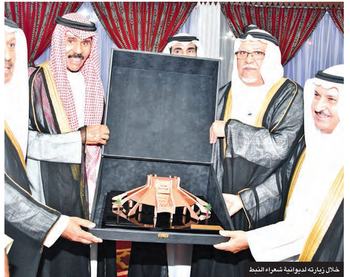
خلال زيارته لديوانية شعراء النبط