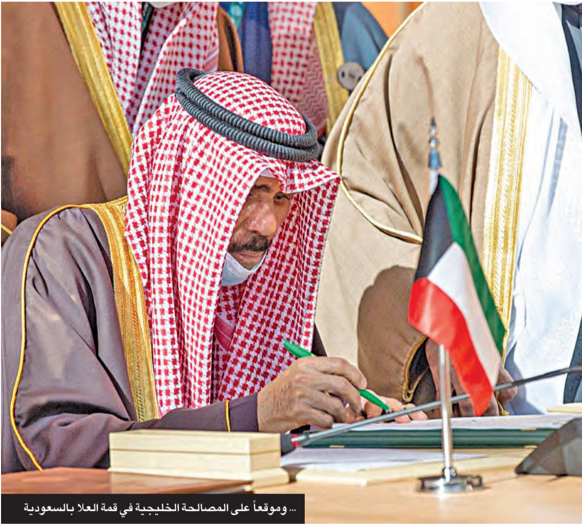
... وموقعاً على المصالحة الخليجية في قمة العلا بالسعودية

● أتقدم بجزيل الشكر لأخي خادم الحرمين الشريفين وإلى حكومة وشعب المملكة العربية السعودية الشقيقة على حسن الاستقبال وكرم الضيافة، والإعداد والتنظيم المتميز لهذه القمة مشيداً بحرص كل الإخوة على عقد هذا اللقاء لتمتكن معاً من دعم عملنا الخليجي والعربي المشترك والحفاظ على مكاسبنا وتحقيق ما نتطلع إليه شعوبنا من آمال وطموحات. ● أتقدم لكم جميعاً بالتهنئة على ما تحقق لنا من إنجاز تاريخي في الإعلان اليوم عن توصلنا إلى التوقيع على بيان العلا.