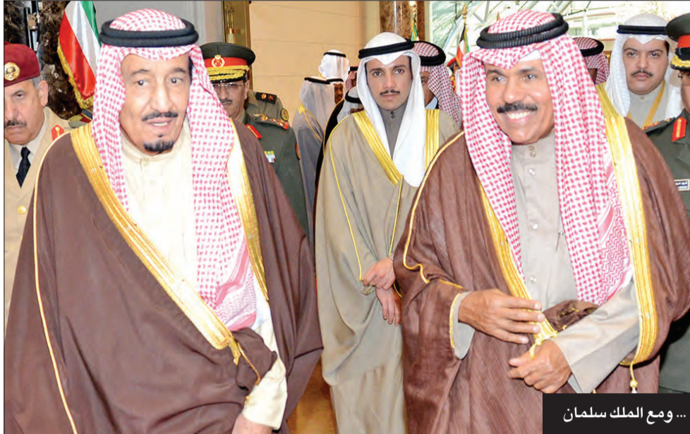
... ومع الملك سلمان