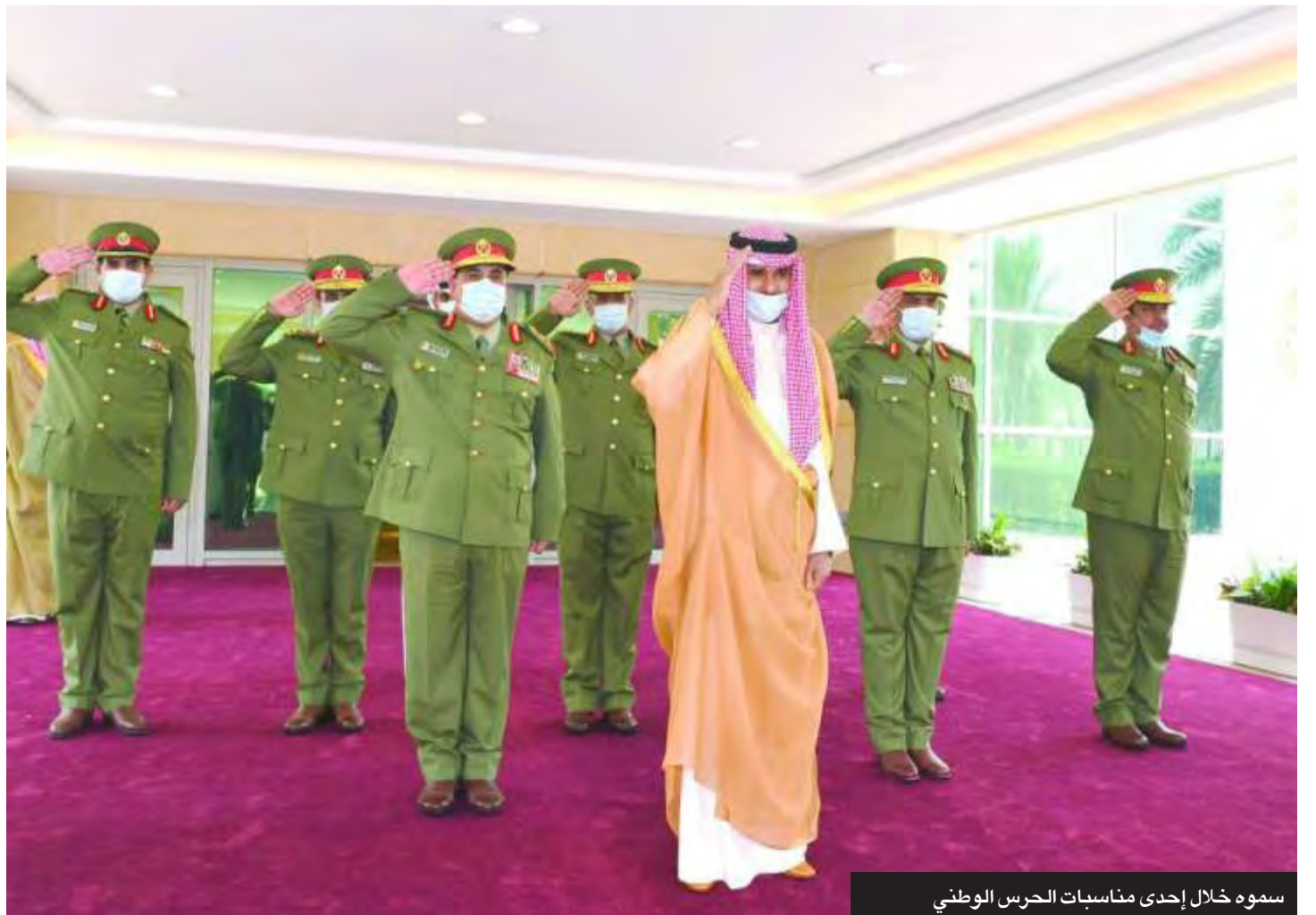
سموه خلال إحدى مناسبات الحرس الوطني