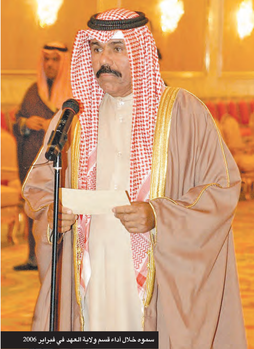
سموه خلال أداء قسم ولاية العهد في فبراير 2006