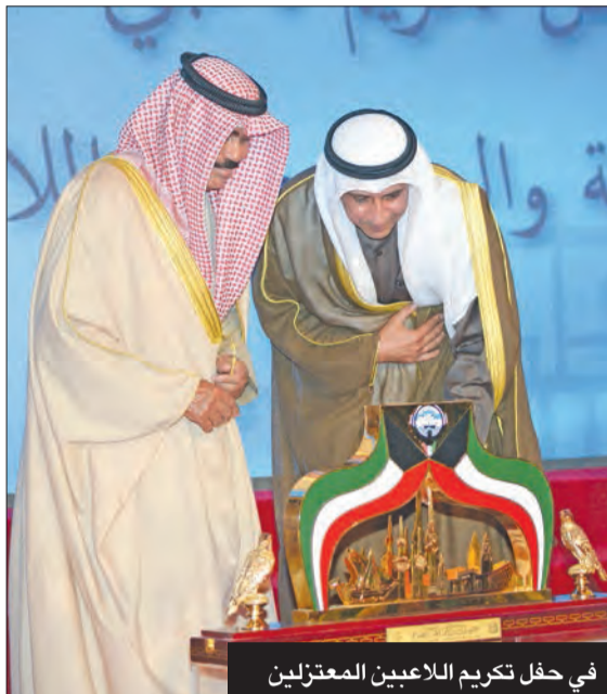
في حفل تكريم اللاعبين المعتزلين