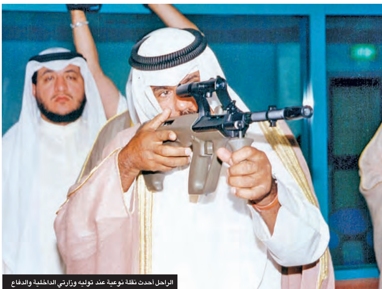
الراحل أحدث نقلة نوعية عند توليه وزارتي الداخلية والدفاع