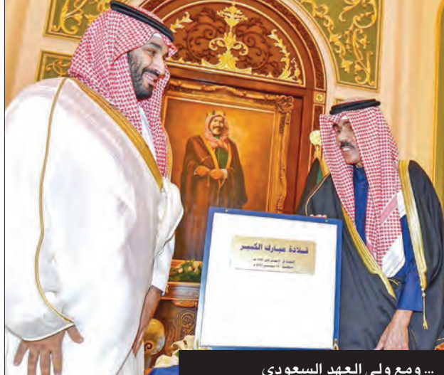
... ومع ولي العهد السعودي

نعي فضيلة الإمام الأكبر د. أحمد الطيب شيخ الأزهر الشريف، أمير البلاد الشيخ نواف الأحمد، مؤكداً أن سموه قضى طوال حياته في خدمة شعبه ووطنه، ودعم قضايا الأمتين العربية والإسلامية. وقال الطيب، في بيان: «يتمتع الشيخ نواف الأحمد بصداقة المواساة إلى الشعب الكويتي وإلى أسرة الفقيد الكبير الراحل»، داعياً المولى عز وجل أن يتغمد فقيد الأمتين العربية والإسلامية بواسع رحمته ومغفرته، وأن يرقق أسرته وشعب الكويت العزيز الصبر والسلوان، إننا لله وإنا إليه راجعون.»