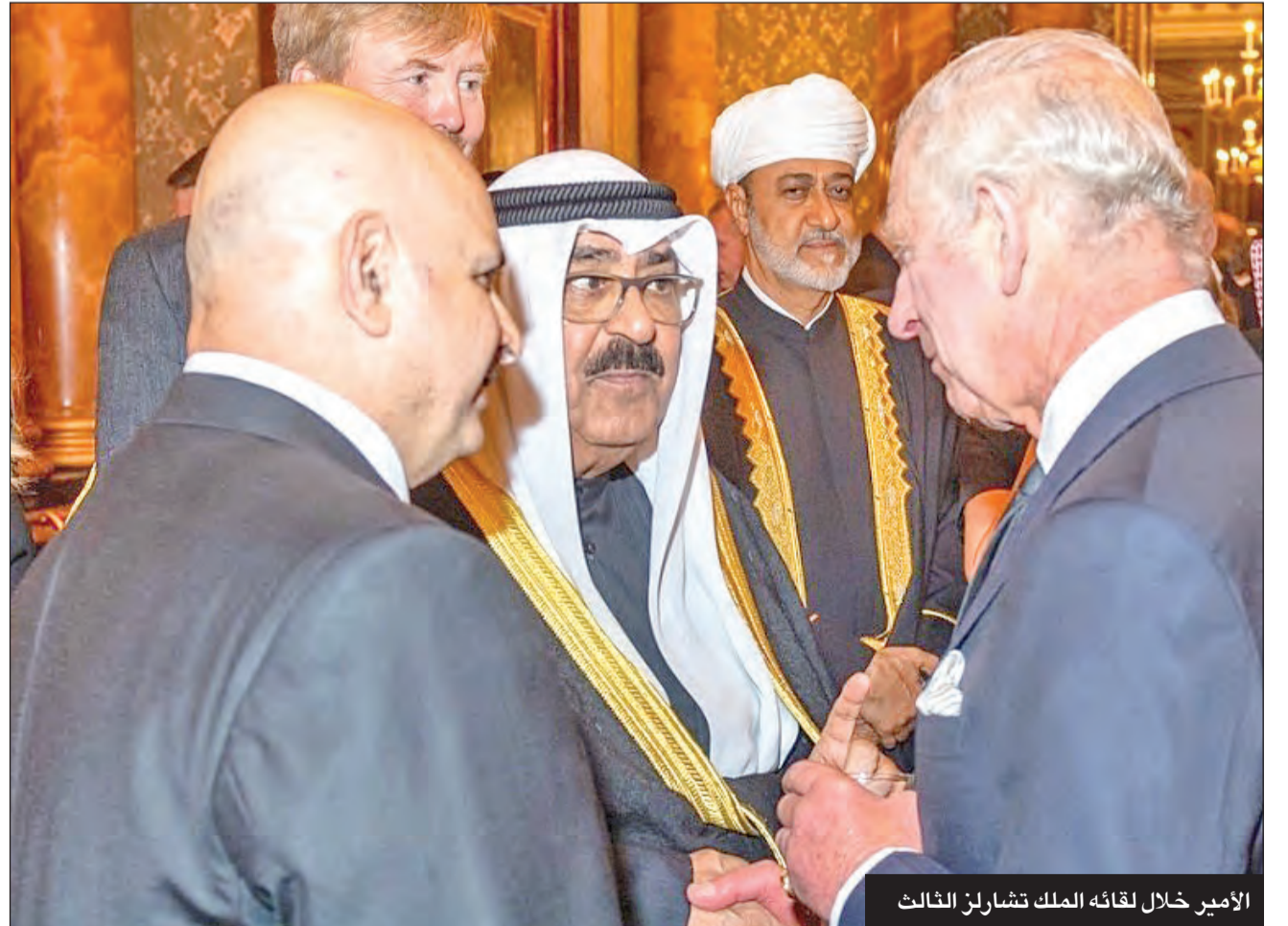
الأمير خلال لقائه الملك تشارلز الثالث