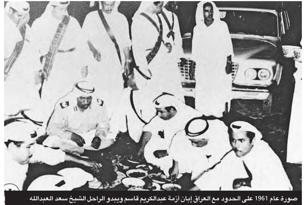
صورة عام 1961 على الحدود مع العراق إبان أزمة عبد الكريم قاسم ويبدو الراحل الشيخ سعد العبدالله