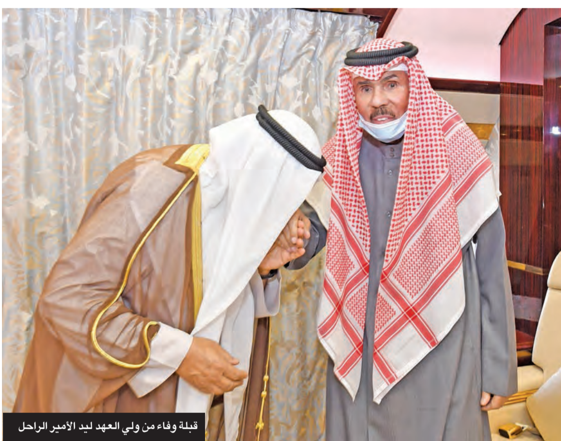
قبله وفاء من ولي العهد ليد الأمير الراحل

ودائماً ما أكد سموه في مناسبات عدة حرصه على الحفاظ على الوحدة الوطنية باعتبارها السياج الذي يحمي الكويت