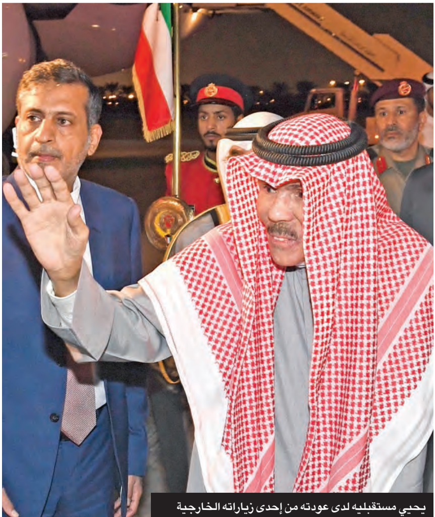
يحيي مستقبله لدى عودته من إحدى زياراته الخارجية