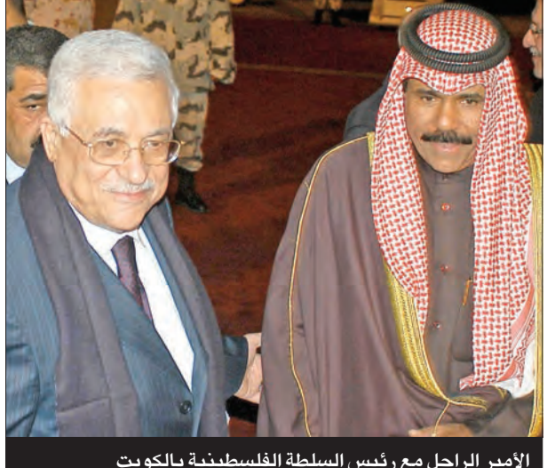
الأمير الراحل مع رئيس السلطة الفلسطينية بالكويت