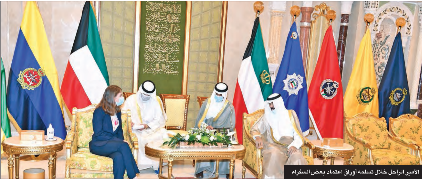
الأمير الراحل خلال تسلمه أوراق اعتماد بعض السفراء

«قائد رحيم ذو رؤية صائبة سبقي إرثه منارة تثير الطريق للأجيال القادمة في الكويت»