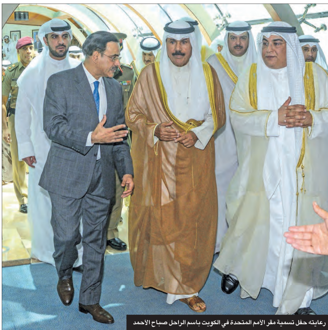
رعايته حفل تسمية مقر الأمم المتحدة في الكويت باسم الراحل صباح الاحمد