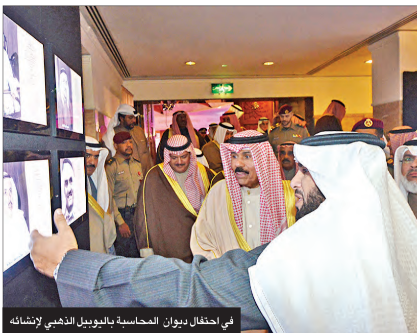
في احتفال دنوان المحاسبة باليوبيل الذهبي لإنشائه