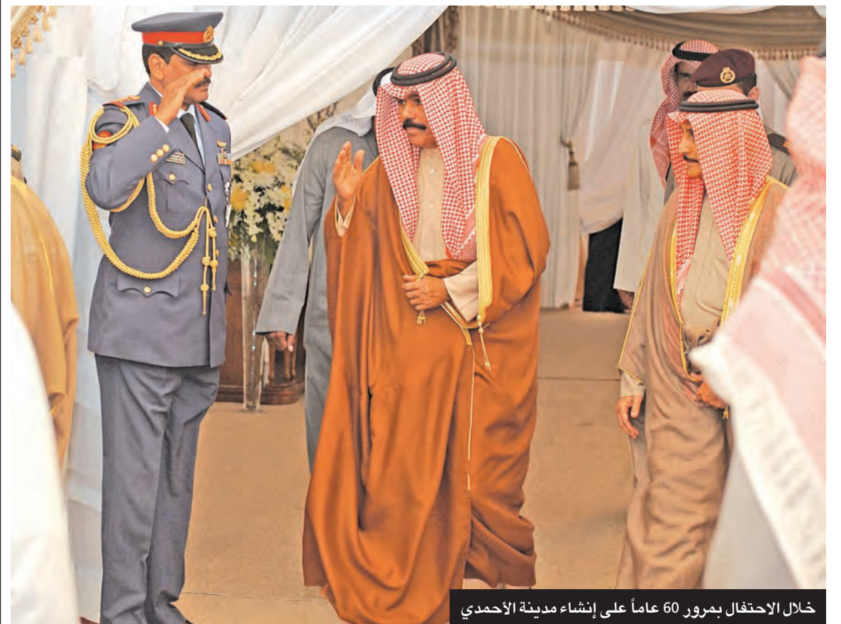
خلال الاحتفال بمرور 60 عاماً على إنشاء مدينة الأحمدية