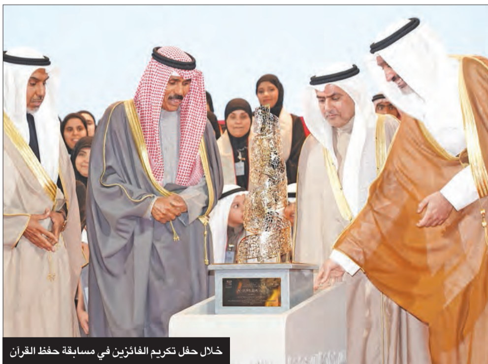
خلال حفل تكريم الفائزين في مسابقة حفظ القرآن

فوجه بتسيير حملات الإغاثة العاجلة لتلك الشعوب، كما حافظت الكويت على حضورها الفاعل وإسهاماتها الإيجابية في دعم الدول الشقيقة والصديقة خلال جائحة فيروس كورونا المستجد، وقدمت دعماً سخياً لمنظمة الصحة العالمية لمساندة جهود المنظمة في مكافحة الجائحة.