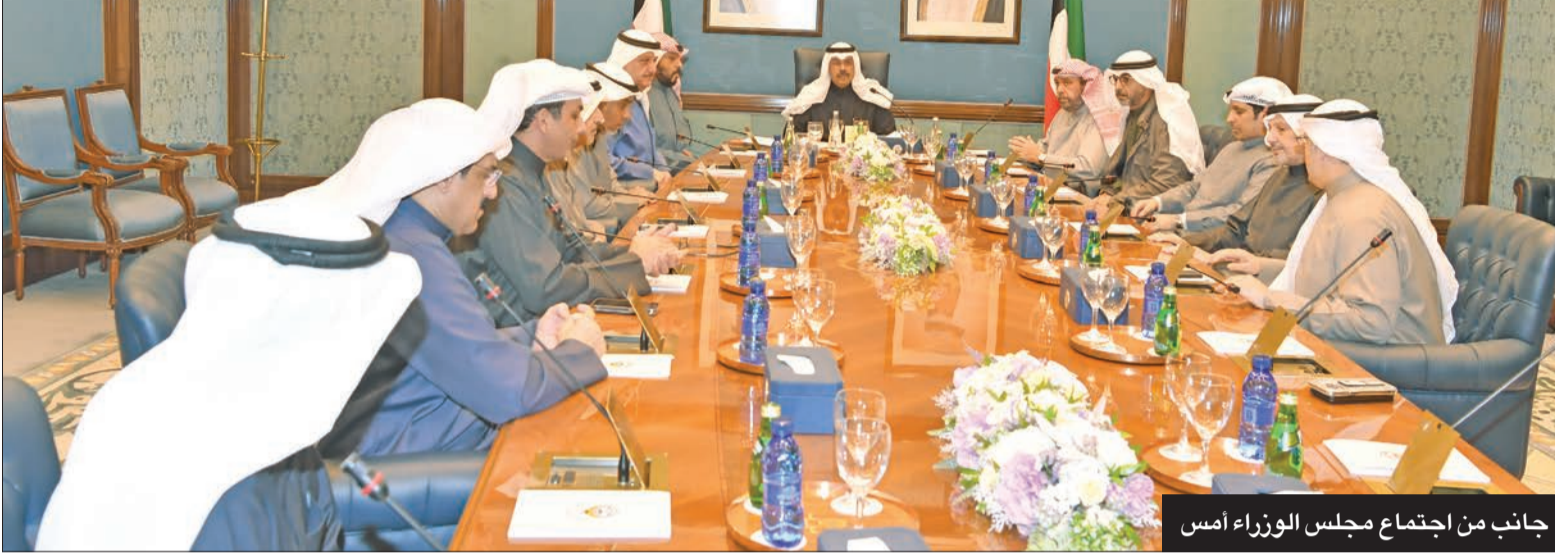
جانب من اجتماع مجلس الوزراء أمس