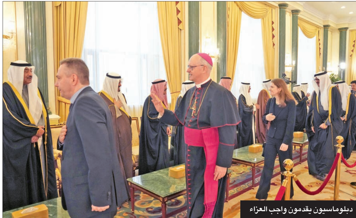
دبلوماسيون يقدمون واجب العزاء