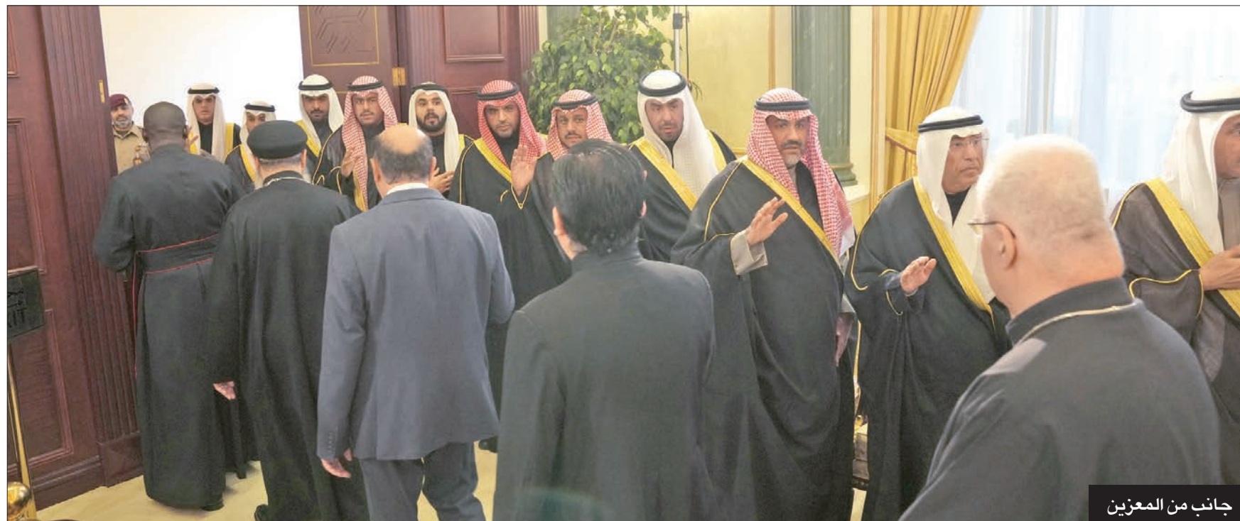
جانب من المعزين