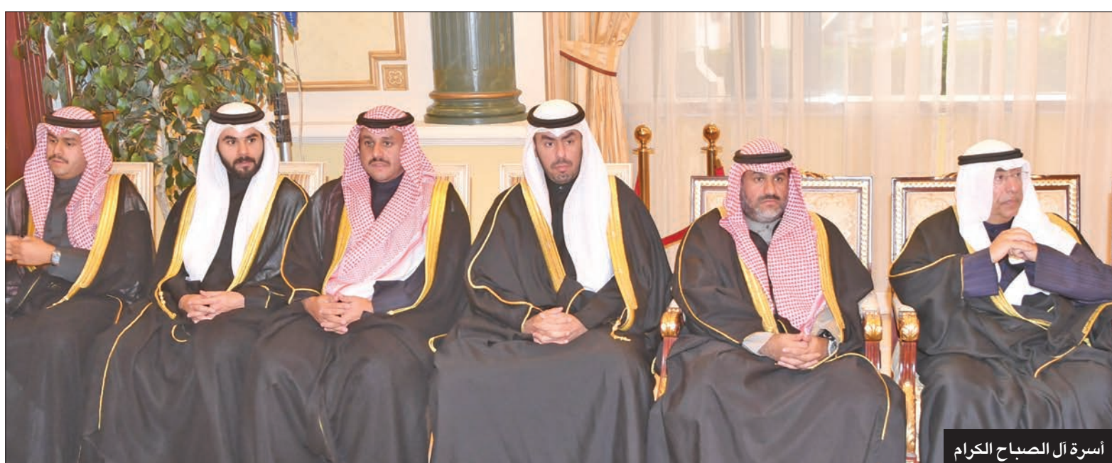
أسرة آل الصباح الكرام