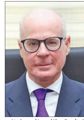
السفير اليوناني يوانيس بلوتاس

واستطرد: «بوفاته الشيخ نواف الأحمد، أود أن أتقدم بالتعزية شخصياً، وبالنيابة عن سفارة فيتنام في الكويت إلى الديوان الأميري، وإلى الكويت حكومة