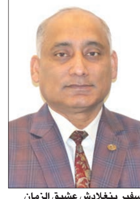
سفير بنغلادش عشيق الزمان