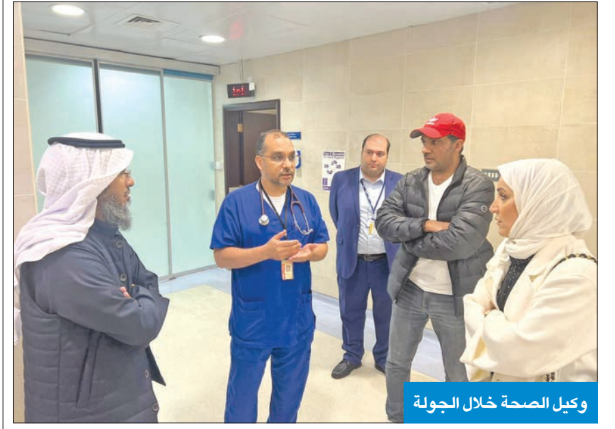
الوكيل الصحة خلال الجولة

تفقد وكيل وزارة الصحة د. عبدالرحمن المطيري، أمس، مستشفيات الأميري والعدان والجهراء ومركز السموم، للوقوف على سير العمل خلال عطلة الحداد. وأكد «الصحة» استمرار تقديم المنشآت الصحية خدماتها الطبية بانتظام وفق ما هو محدد، مثنية جهود جميع العاملين فيها على اختلاف مسيبتهم. وأضافت الوزارة أن التنسيق بين تلك المنشآت وقطاعات «الصحة» مستمر بهدف تذليل أي تحديات قد تواجه العاملين فيها.