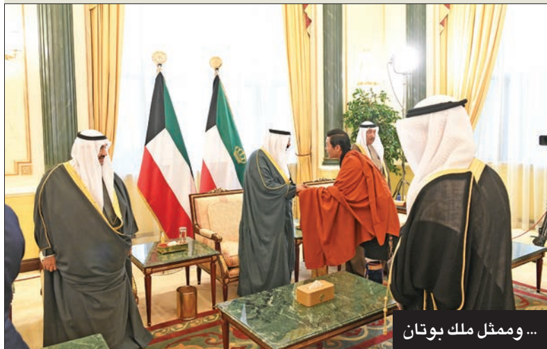
... وممثل ملك بوتان

سموه التقي رئيس البرلمان العربي وممثل مقتدى الصدر وبحر العلوم ونجل سلطان البهرة ووزير خارجية كازاخستان وممثل ملك بوتان