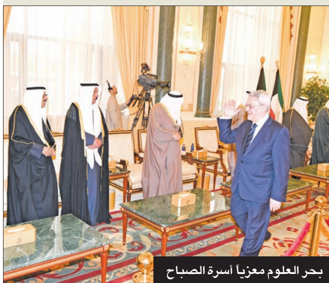
بحر العلوم معزياً أسرة الصباح