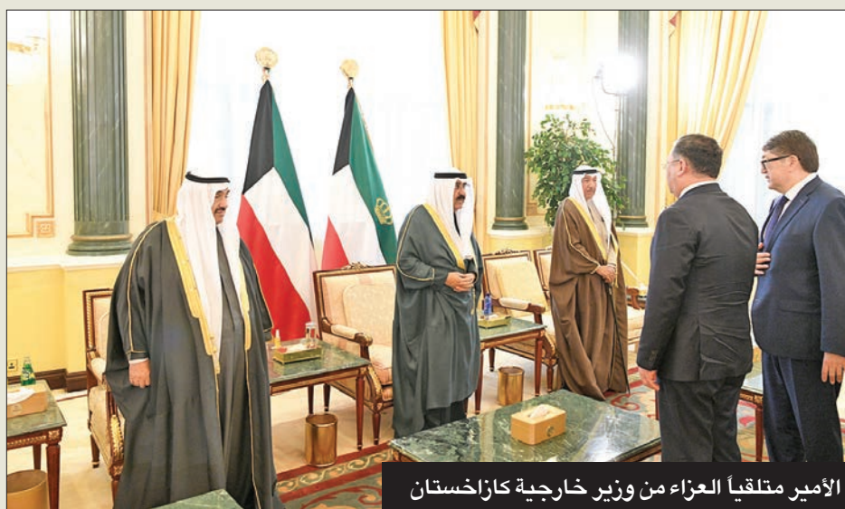
الأمير متلقياً العزاء من وزير خارجية كازاخستان

استقبل سمو أمير البلاد الشيخ مشعل الأحمد، في ديوان أسرة الصباح بقصر بيان، صباح أمس، رئيس البرلمان العربي عادل العسومي والوفد المرافق، حيث قام بتقديم واجب العزاء في وفاة فقيد الوطن المغفور له بإذن الله تعالى الأمير الراحل الشيخ نواف الأحمد، طيب الله ثراه وجعل الجنة مثواه.