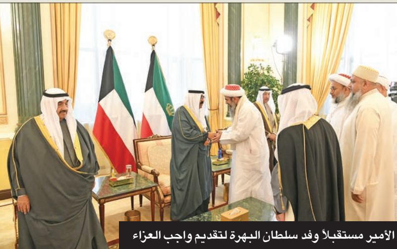
الأمير مستقبلاً وفد سلطان البهرة لتقديم واجب العزاء