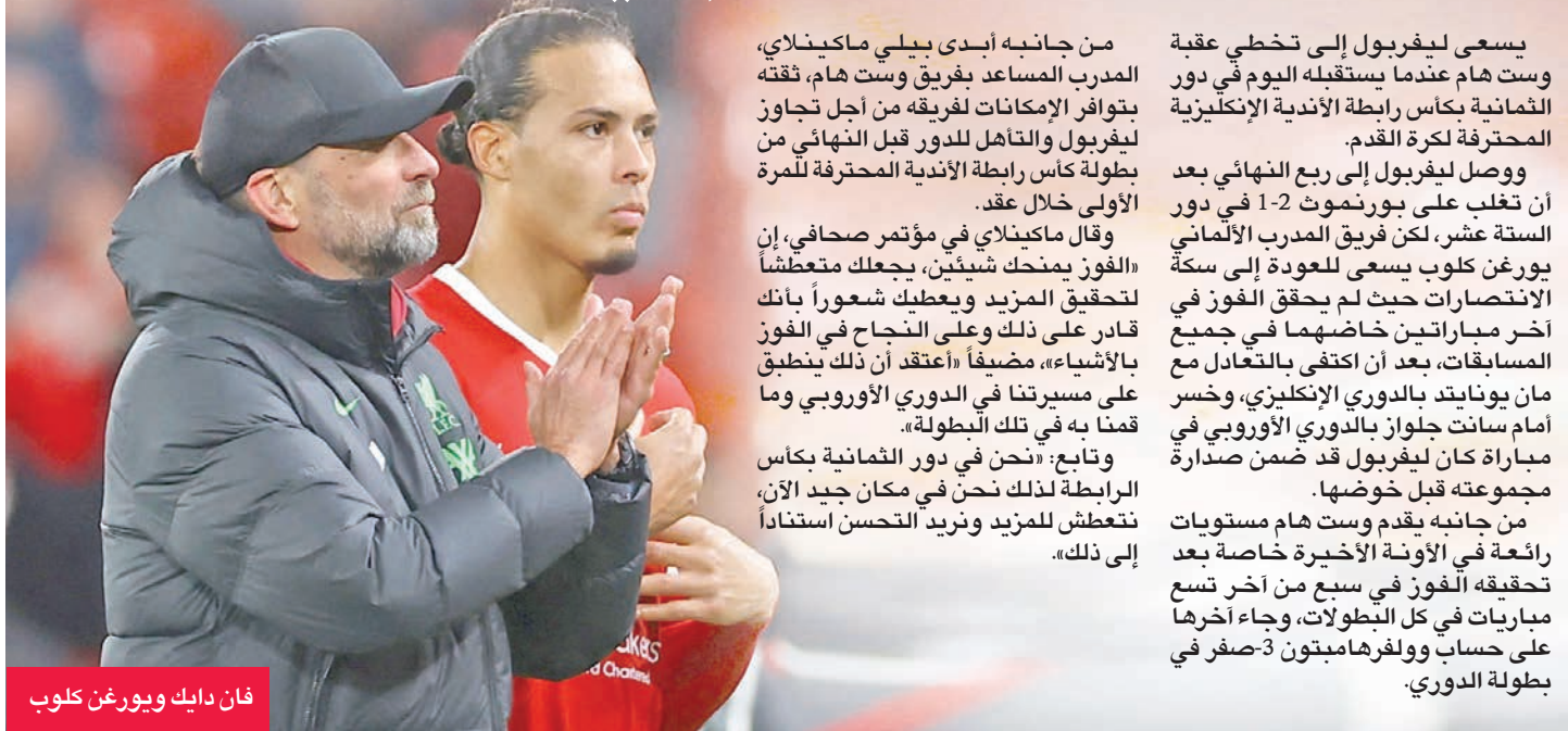
فان دايك ويورغن كلوب

يسعى ليفربول إلى تخطي عقبة وست هام عندما يستقبله اليوم في دور الثمانية بكأس رابطة الأندية الإنكليزية المحترفة لكرة القدم.