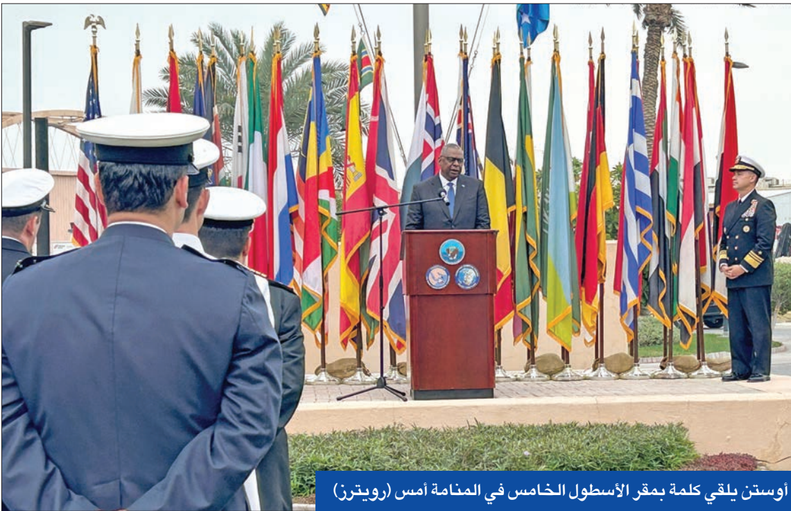
أوستن يلقي كلمة بمقر الأسطول الخامس في المنامة أمس

وبينما ارتفعت حصيلة قتلى الحرب الإسرائيلية غير المسبوقة على غزة إلى 19.453، بينما بلغت حصيلة الجرحى 52.286 مصاباً، دعا