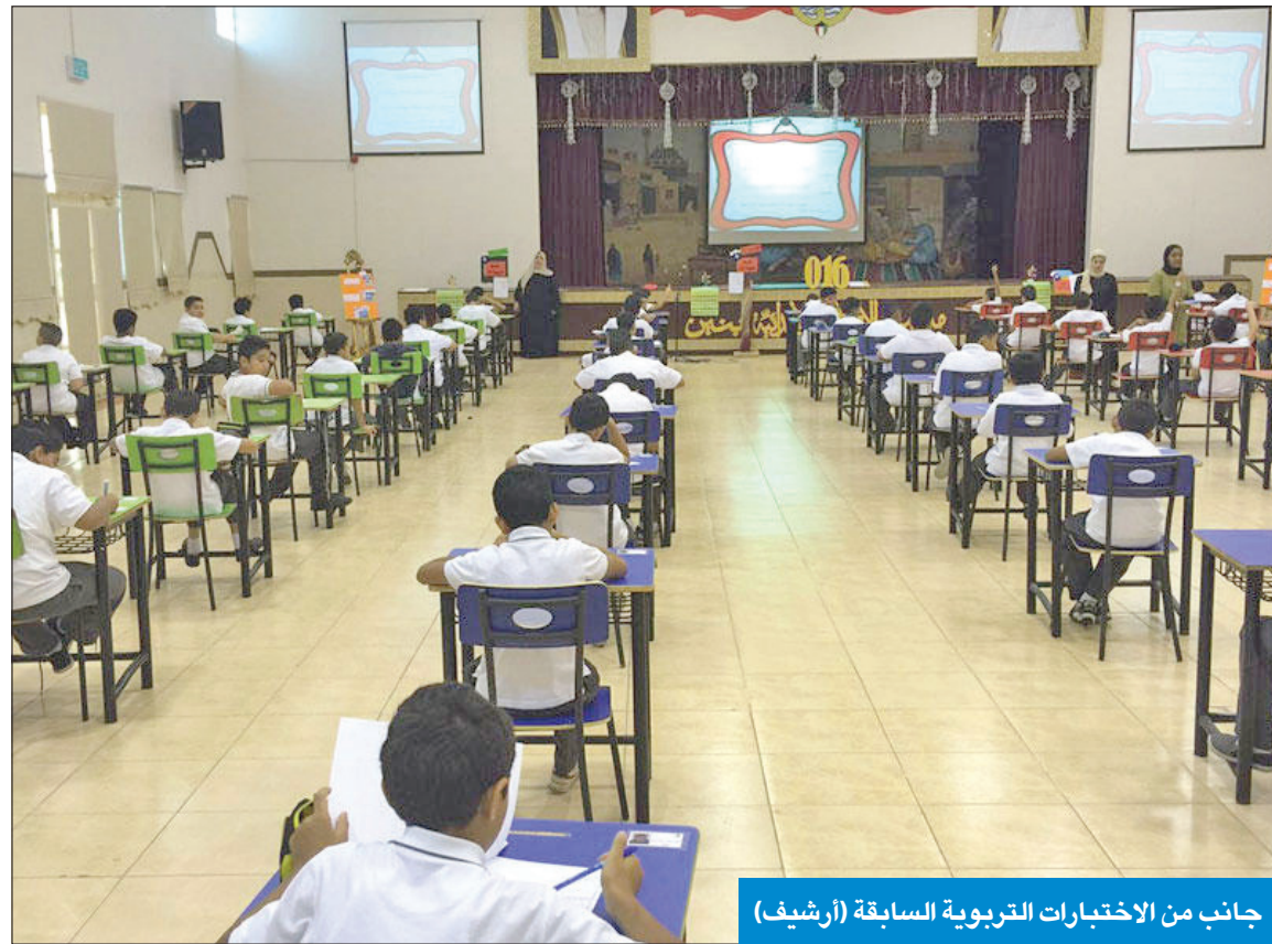
جانبا من الاختبارات التربوية السابقة