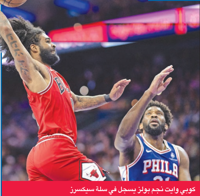
كوبي وايت نجم بولز يسجل في سلة سيكسرز

الذي بلغ 17 نقطة خلال النصف الأول. وفي إنديانابوليس، سجل جيمس هاردن 21 من نقاطه الـ35 في الربع الرابع ليقتود لوس أنجلوس كليبرز للفوز على بايسرز 151 - 126. واحتاج كليفلاند كافاليرز لوقت إضافي من أجل هزيمة هيوستن روكتس 135 - 130. وفي أتلانتا، زاد هوكس من جراح ديترويت بيستونز والحق به الخسارة الـ24 توالياً بنتيجة 130 - 124.