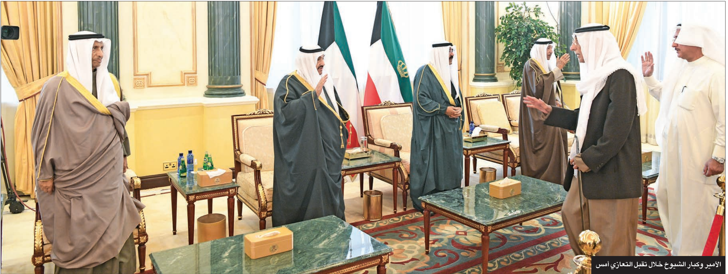
الأمير وكبار الشيوخ خلال تقبل التعازي أمس

سموه شكر كبار الشيوخ والمسؤولين والمواطنين وقادة الدول الخليجية والشقيقة والصديقة والمنظمات الدولية