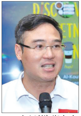
سفير فيتنام فانغ تون نجيو