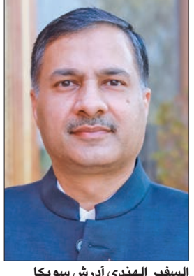
السفير الهندي أنرش سويكا

وشعباً، بوفاته رجل دولة عظيم» وقال السفير البنغلادشي اللواء إم دي عشيق الزمان: «شعرت بحزن عميق عندما علمت بوفاته صاحب السمو الشيخ نواف الأحمد. (إننا لله وإننا إليه راجعون)»، متابعا: «بالنيابة عن سفارة بنغلادش والجالية البنغلادشية بدولة الكويت، وبالإصالة عن نفسي، أعرب عن صادق وأعظم التعازي لحكومة وشعب دولة الكويت الشقيقة لمصابها الجلل».