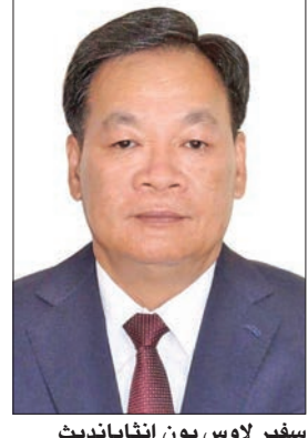
سفير لاوس بون إنابانديت