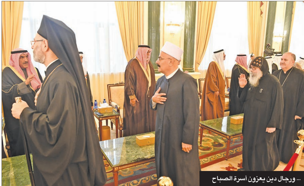
... ورجال دين يعزّون أسرة الصباح