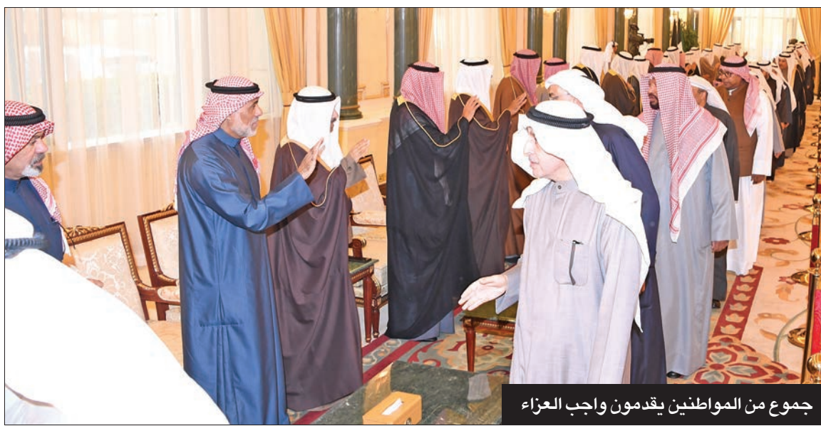
جموع من المواطنين يقدمون واجب العزاء