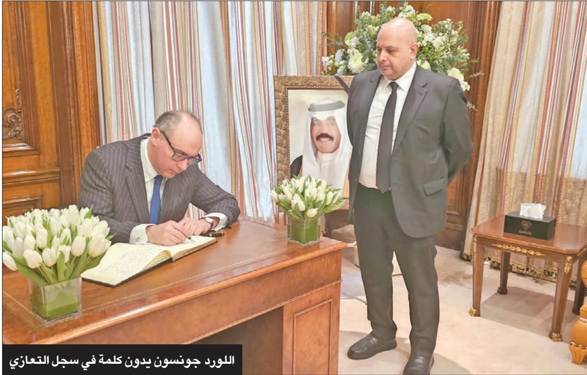
اللورد جونسون يودن كلمة في سجل التعازي