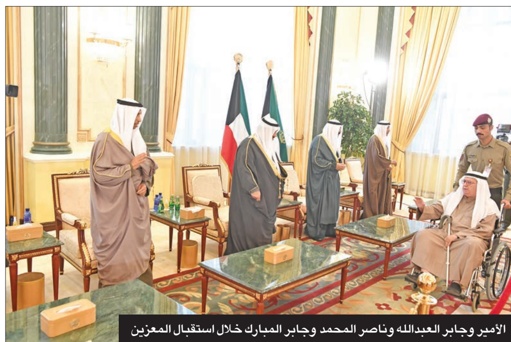
الأمير وجابر العبدالله وناصر المحمد وجابر المبارك خلال استقبال المعزين