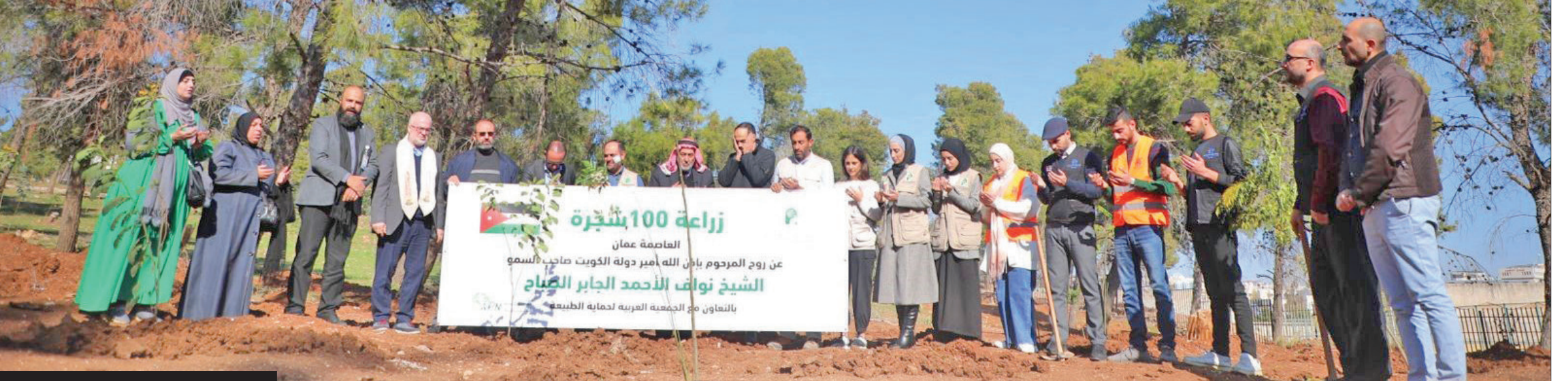
غرس الأشجار وفاء لذكرى الأمير الراحل

للمغفور له بإذن الله تعالى، وحرصه رحمه الله على تعزيز علاقات التعاون مع الأردن، راجحين المولى عز وجل أن يتغمّد فقيد الأمتين العربية والإسلامية بواسع رحمته ويسكنه فسيح جناته.