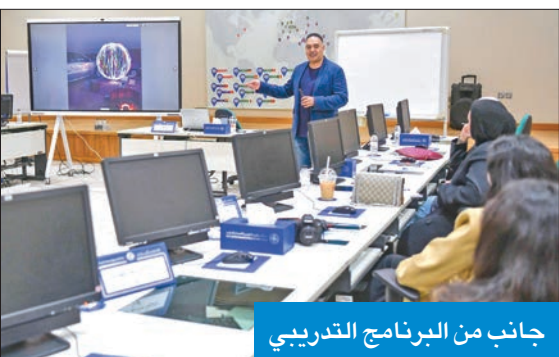
جانب من البرنامج التدريبي

أطلق مركز «كونا» لتطوير القدرات الإعلامية أمس البرنامج التدريبي «مبادئ التصوير الفوتوغرافي» بمشاركة عدد من منتسبي وكالة «كونا» والهيئة العامة لمكافحة الفساد (نزاهة).