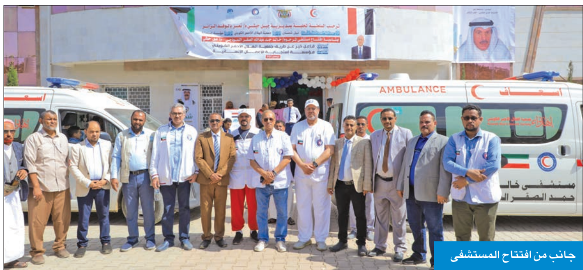
جانب من افتتاح المستشفى

افتتاح مركز يوسف ونورة الصحي بالمسرح لتقديم الخدمات لـ 12 ألف يمني بالمنطقة