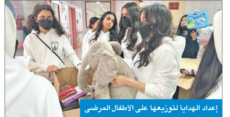
إعداد الهدايا لتوزيعها على الأطفال المرضى