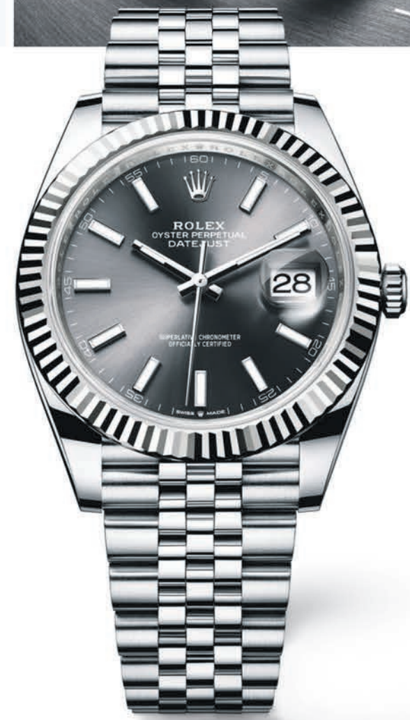
OYSTER PERPETUAL DATEJUST 41