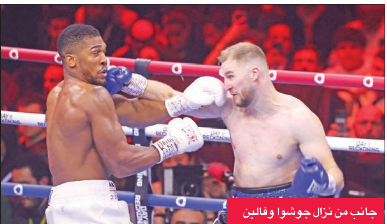
جانب من نزال جوشوا وفالين

على قدميه حتى نهاية الجولة، لكن الفريق المرافق له أكد عدم قدرة الملاكم السويدي على الاستمرار، ليتم إعلان فوز جوشوا وسط فرحة عارمة.