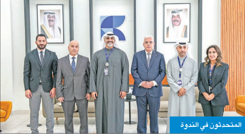
المحدثون في الندوة

مدنية أو اجتماعية أو اقتصادية، فهي جميعا متضادة لضمان كرامة العيش للبشر عامة، ونجتمع ونحن نحاول جاهدين أن نعلم أبناءنا وبناتنا أن حقوق الإنسان مكفولة للجميع.