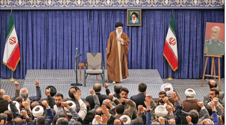
خامنئي يلتقي أبناء محافظتي كرمان وخوزستان أمس الأول

وصفها مراقبون بأنها «خرافية» لأنها تضمنت زيادة تعادل 6.5 مليارات دولار على الميزانية السرية للقوات المسلحة.