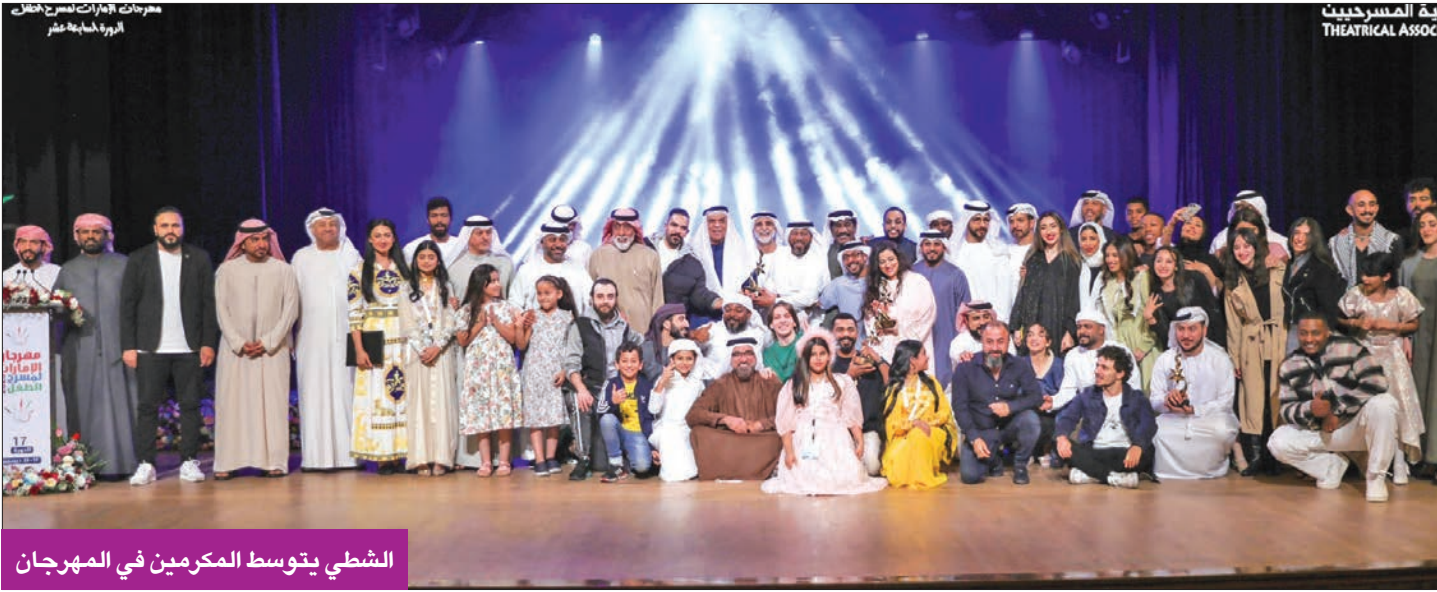
الشطى يتوسط المكرمين في المهرجان

المسرحية اقتنصت 4 جوائز في مهرجان مسرح الطفل بدورته الـ 17