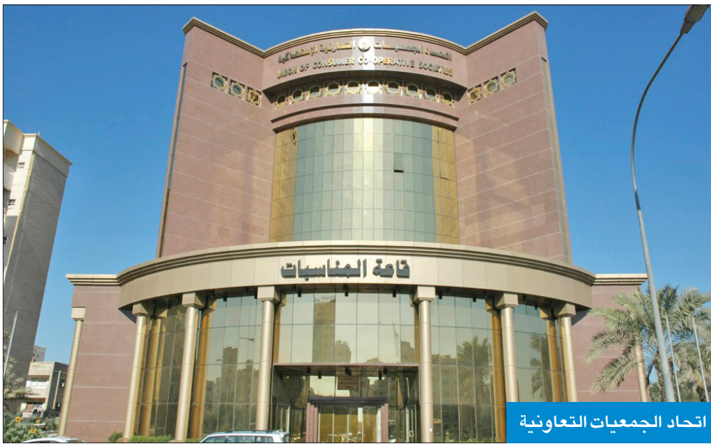
اتحاد الجمعيات التعاونية

علمت «الجريدة» أن الهيئة العامة لمكافحة الفساد «نزاهة» وجهت مخاطبة رسمية إلى وزارة الشؤون الاجتماعية، تستفسر من خلالها عن 133 مواطناً تم تعيينهم في مجالس إدارات جمعيات تعاونية عدة خلال الفترة الماضية، مطالبة الوزارة بتزويدها بمؤهلاتهم الدراسية وصحف الحالة الجنائية لهؤلاء المعينين، للوقوف على مدى انطباق قرارات تعيينهم القرار الوزاري رقم (4/ت) لسنة 2022، الصادر بشأن ضوابط اختيار المديرين والأعضاء المعينين داخل مجالس الجمعيات. ووفقاً لمصادر «الشؤون»، فإن الوزارة وجهت مخاطبات رسمية إلى كل من جامعة الكويت، والهيئة العامة للتعليم التطبيقي والتدريب، ووزارة الداخلية، للاستفسار عن المؤهلات الدراسية وصحف الحالة الجنائية للمعينين، من ثم تزويد «نزاهة» بها، للوقوف على مدى قانونية التعيينات، مؤكدة أن التعيينات بالجمعيات التعاونية سلطة جوازية منحها المشرع لوزير الشؤون، ونظمتها