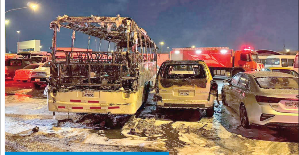
جانب من المركبات والحافلات المحترقة في الجليب

حريق كبير يلتهم عدداً من المركبات والحافلات في الجليب