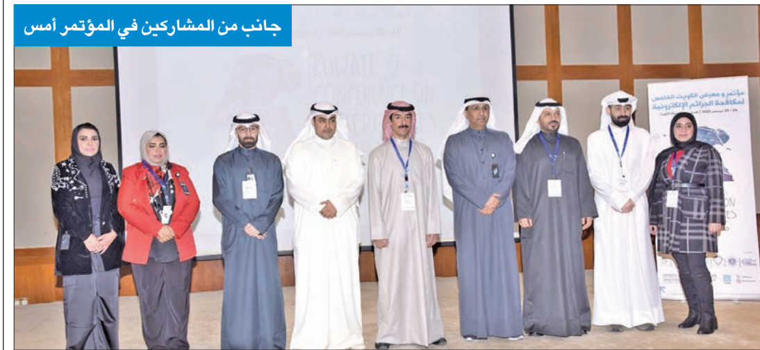
جانب من المشاركين في المؤتمر أمس

● انطلاق مؤتمر الكويت الخامس لمكافحة الجرائم الإلكترونية ● الصراف: تسجيل قفزة نسبية في ضبط الأساليب الاحتيالية بواقع 3 أضعاف عن العام السابق