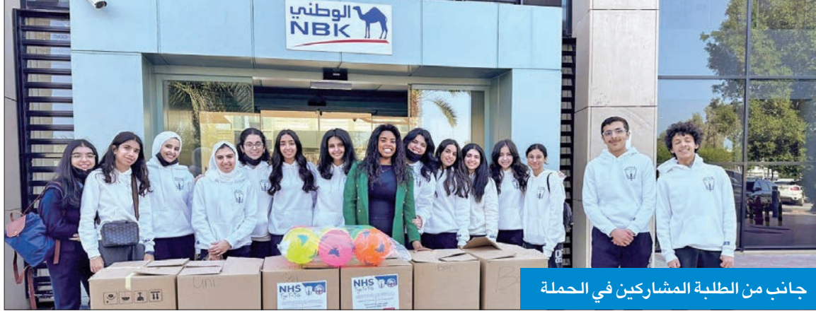
جانب من الطلبة المشاركين في الحملة

المرضى بهدف إدخال السرور والبهجة في نفوسهم. وتأتي هذه الحملة الخيرية في إطار التوعية الطلابية، حيث يتم تشجيع الطلاب على المشاركة في الأعمال الإنسانية والخيرية، وقد قام الطلاب بالتعبير عن روح المسؤولية الاجتماعية والإنسانية، من خلال جهودهم في تحقيق هذه الحملة. وأظهرت حملة التبرعات الناجحة لمدرسة