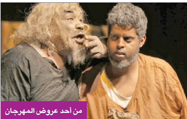
من أحد عروض المهرجان