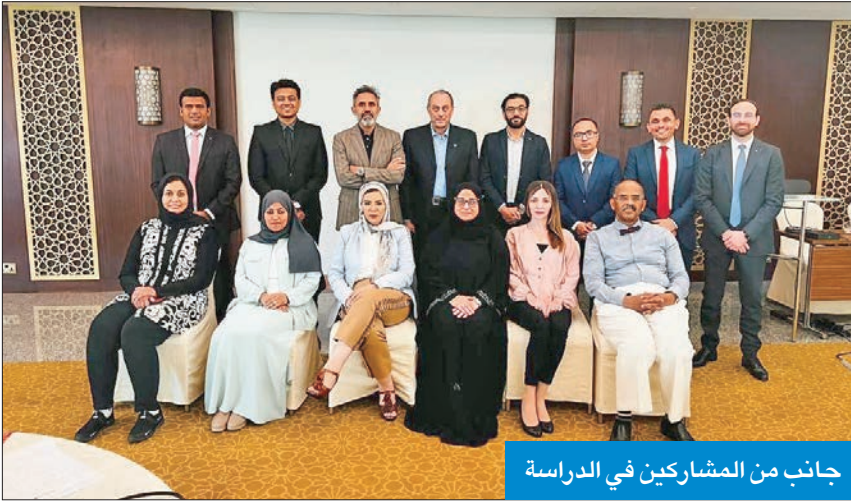
جانب من المشاركين في الدراسة

وتقدم الشركة مواد تعليمية وتدريبية، كما توفر منتجاتها وخدماتها في جميع أنحاء العالم. ويعمل لدى الشركة أكثر من 61400 شخص في 80 مكتباً في جميع أنحاء العالم، وتقوم بتسويق منتجاتها في 170 دولة.