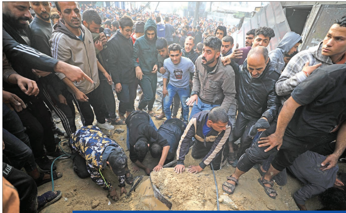
فلسطينيون يبحثون عن ناجين تحت انقاض منزل دمرته غارة إسرائيلية في رفح الأريبع الماضي (شبخوا)

• ننتياهو: ندفع ثمننا باهظاً وقراراتنا مبنية على حساباتنا • بايند يريد حماية المدنيين دون وقف النار