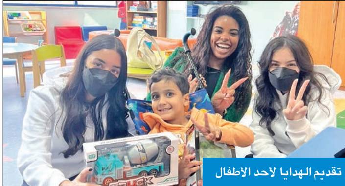
تقديم الهدايا لأحد الأطفال