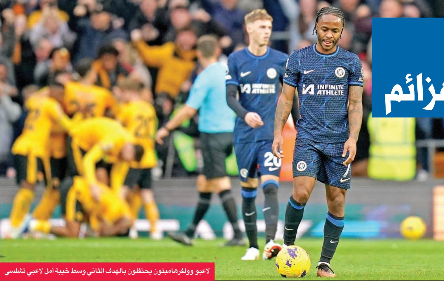
لاعب وولفرهامبتون يحتفلون بالهدف الثاني وسط خيبة أمل لاعبي تشلسي

ويبقى أرسنال في صدارة الترتيب التي خسرها لـ 24 ساعة لمصلحة أستون فيلا، قبل أن يتعيدها متقدماً بفارق نقطة واحدة عن ليفربول الثاني وفيلا الثالث.