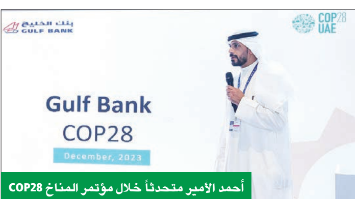
أحمد الأمير متحدثاً خلال مؤتمر المناخ COP28

ضمن مبادراته المجتمعية خلال الشهر الفضيل، بادر «الخليج» إلى توزيع عبوات المياه والمرطبات