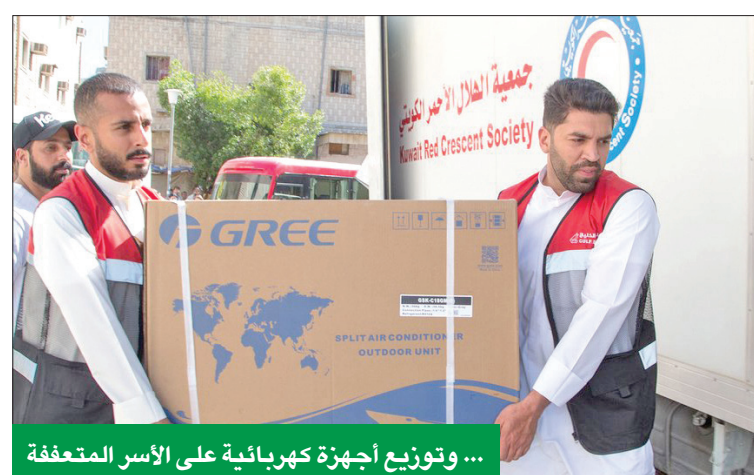
... وتوزيع أجهزة كهربائية على الأسر المتعففة