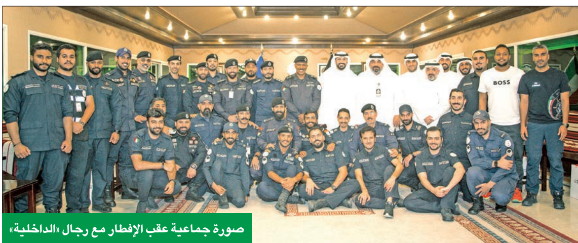
صورة جماعية عقب الإفطار مع رجال «الداخلية»

استعرض البنك تجربته الرائدة في استخدام وسائل التواصل الاجتماعي خلال المؤتمر الإقليمي الذي نظّمته شركة Sprinklr، المتخصصة في إدارة وسائل التواصل الاجتماعي، في دبي بحضور ممثلي عدد من الشركات والمنصات العالمية، وهي شركات: ميتا، وتيك توك، وواتساب، ولينكدان، والتي طرحت آخر التحديات التي أدخلت على منصاتها، والمميزات الجديدة التي يمكن للشركات وأصحاب الأعمال التجارية الاستفادة منها، للوصول إلى جمهورها بشكل هادف وجذاب.