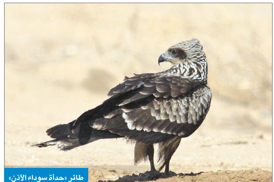
طائر حداة سوداء الأذن