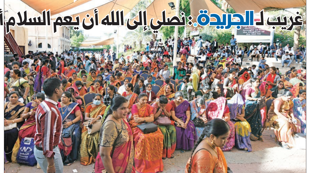
جانب من المشاركين في قداس الميلاد