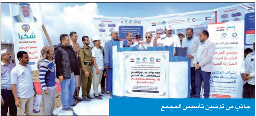
جانب من تدشين تأسيس المجمع

يضم مركزاً طبياً ومدرسة ودار أيتام ومسجداً على مساحة 6000 متر