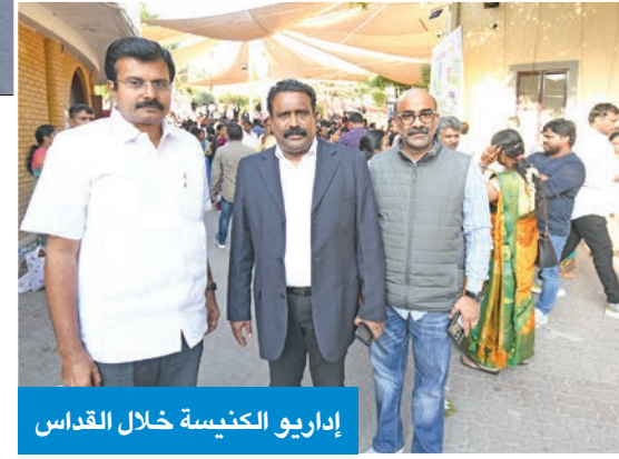
إداريو الكنيسة خلال القداس

وأشاد بالحريات الدينية في الكويت، حيث يمارس الجميع شعائره بكل حرية ومحبة وفي أجواء من السلام. يذكر أن القوى الأمنية اتخذت عدداً من الإجراءات والتدابير في محيط الكنائس بالعاصمة لتسهيل أداء القداس وتفادي الازدحامات.