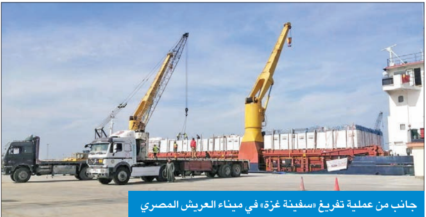
جانب من عملية تفرغ «سفينة غزة» في ميناء العريش المصري

الضرورية والإنسانية العاجلة. وأشاد بالجهود المبذولة من الجهات الرسمية في الكويت والجمعيات الخيرية الكويتية وجهود الهلال الأحمر التركي والمسؤولين عن إدارة الموانئ التركية في تجهيز السفينة وتسيرها.