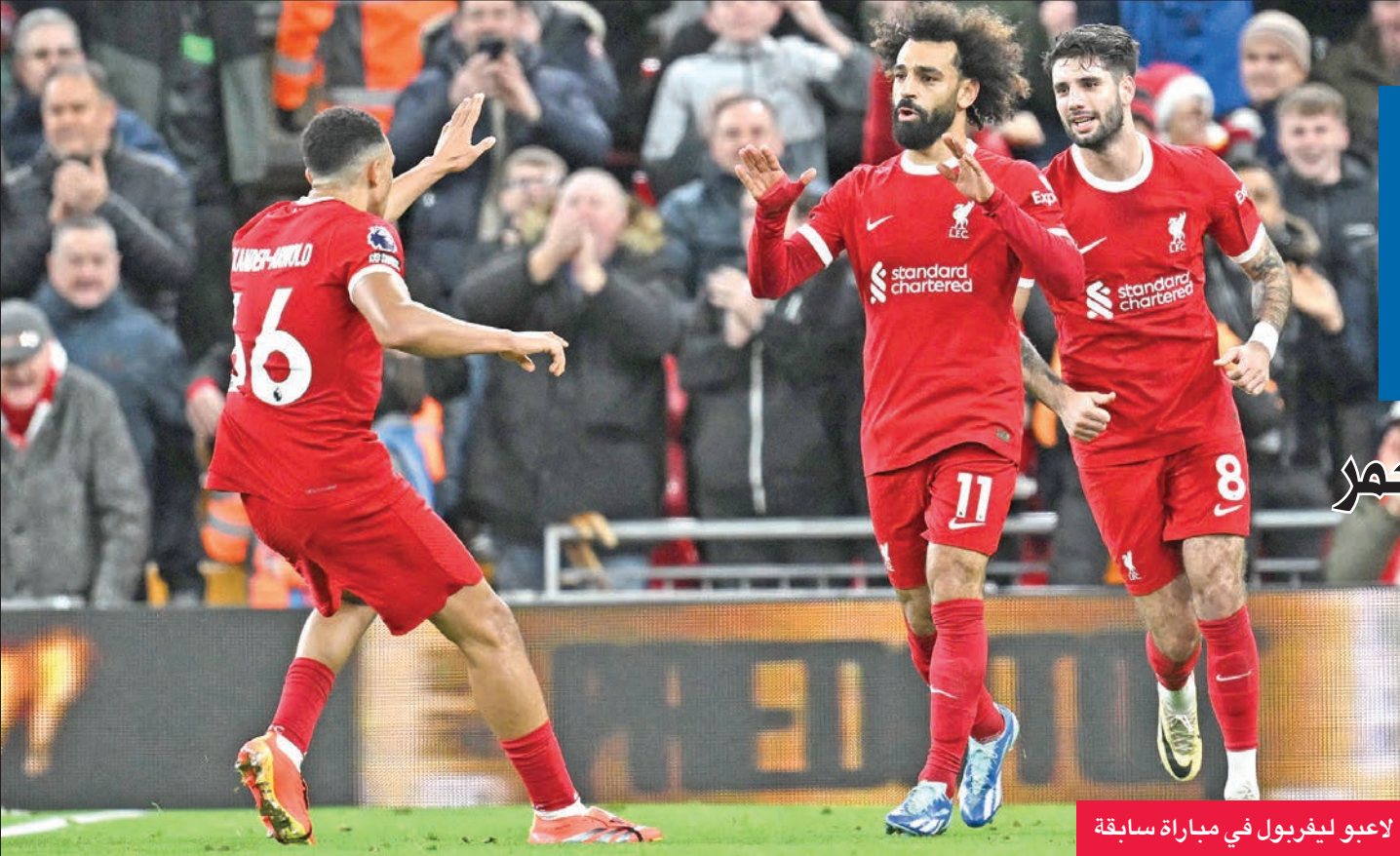
لاعبو ليفربول في مباراة سابقة