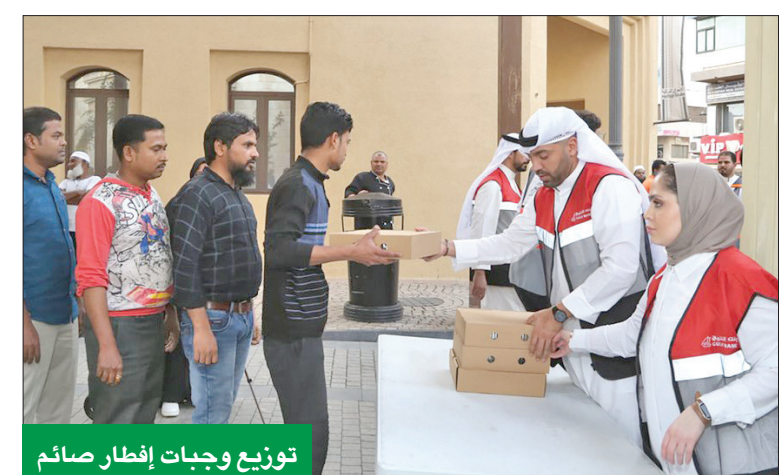
توزيع وجبات إفطار صائم