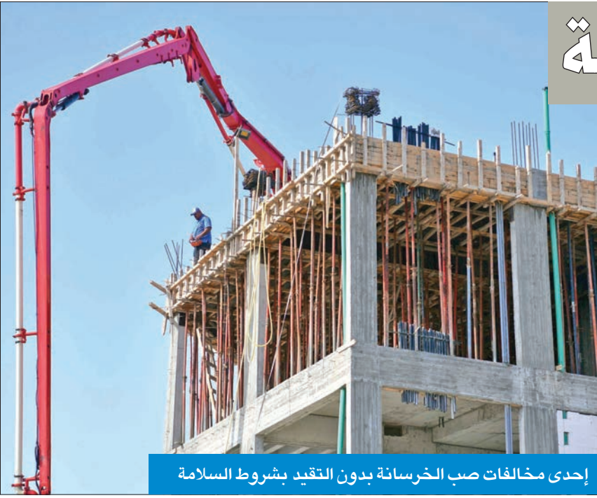
إحدى مخالفات صب الخرسانة بدون التقيد بشروط السلامة

بلغنا منعطفاً خطيراً لا يخدم مصلحة الكويت وأهلها ولا مكانتها وهبتها ولم يعد من الحكمة السكوت عنه