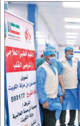
مشاركون في المخيم الطبي العلاجي باليمن