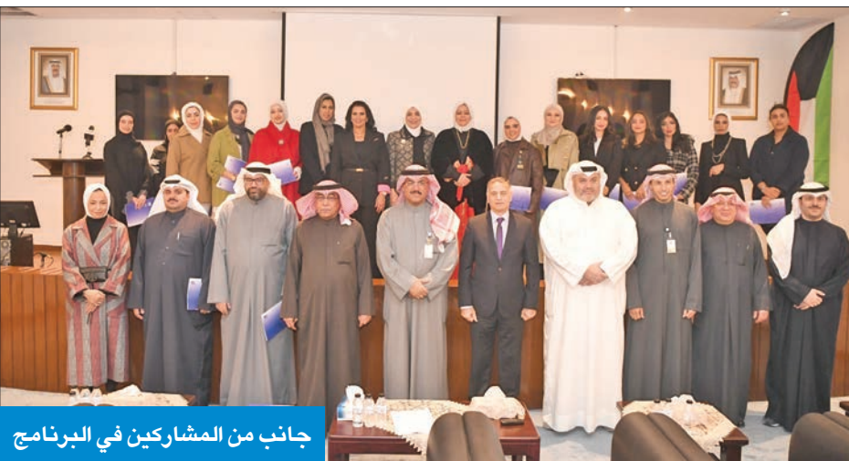
جانب من المشاركين في البرنامج

وأوضح أن هذا البرنامج أول باكورة تعاون مع جمعية الصحافيين، وهناك الكثير من البرامج الأخرى والمتنوعة في المستقبل مثل برنامج الإعلام