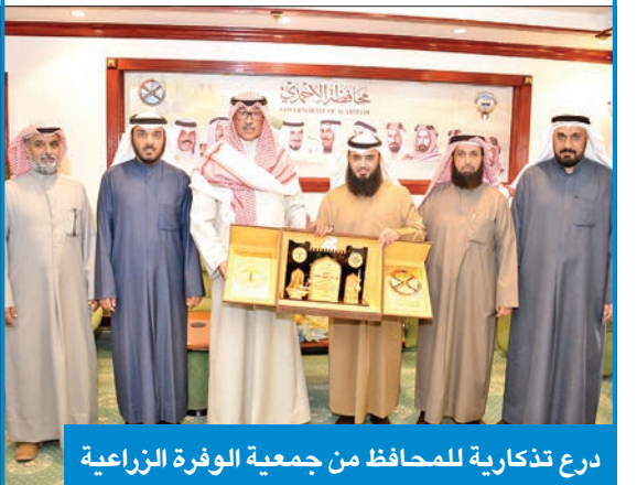
درع تذكارية للمحافظ من جمعية الوفرة الزراعية

الدوسري، اطلع الخالد على مجمل أنشطة ومستجدات العمل والخطط المستقبلية للجمعية. وأكد أن محافظة الأحمدى تفخر باحتوائها على إحدى أهم المناطق الزراعية المنتجة بالبلاد، وهي منطقة الوفرة الزراعية، مشدداً على أن كافة أجهزة الدولة الرسمية لا تالو جهداً لتوفير الاحتياجات الخدمية والاستهلاكية المختلفة للمواطنين والمقيمين، لاسيما قاطني المناطق الحدودية والعاملين في مزارع منطقة الوفرة وغيرها من المناطق على نحو خاص نظراً لمساهمتهم الفاعلة في تحقيق الأمن الغذائي بالبلاد.