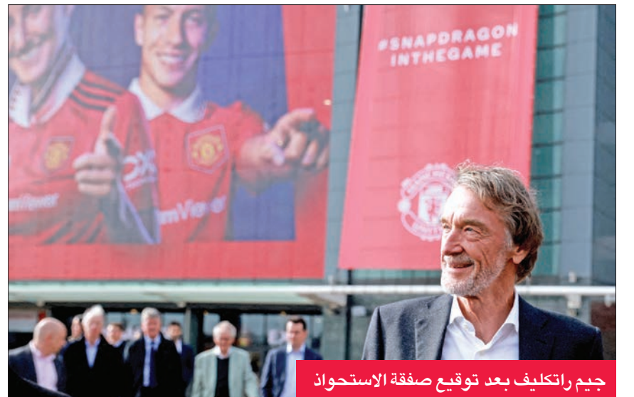
جيم راتكليف بعد توقيع صفقة الاستحواذ

أعلن رئيس شركة الكيماويات العملاقة إنيوس، جيم راتكليف، أمس الأول،