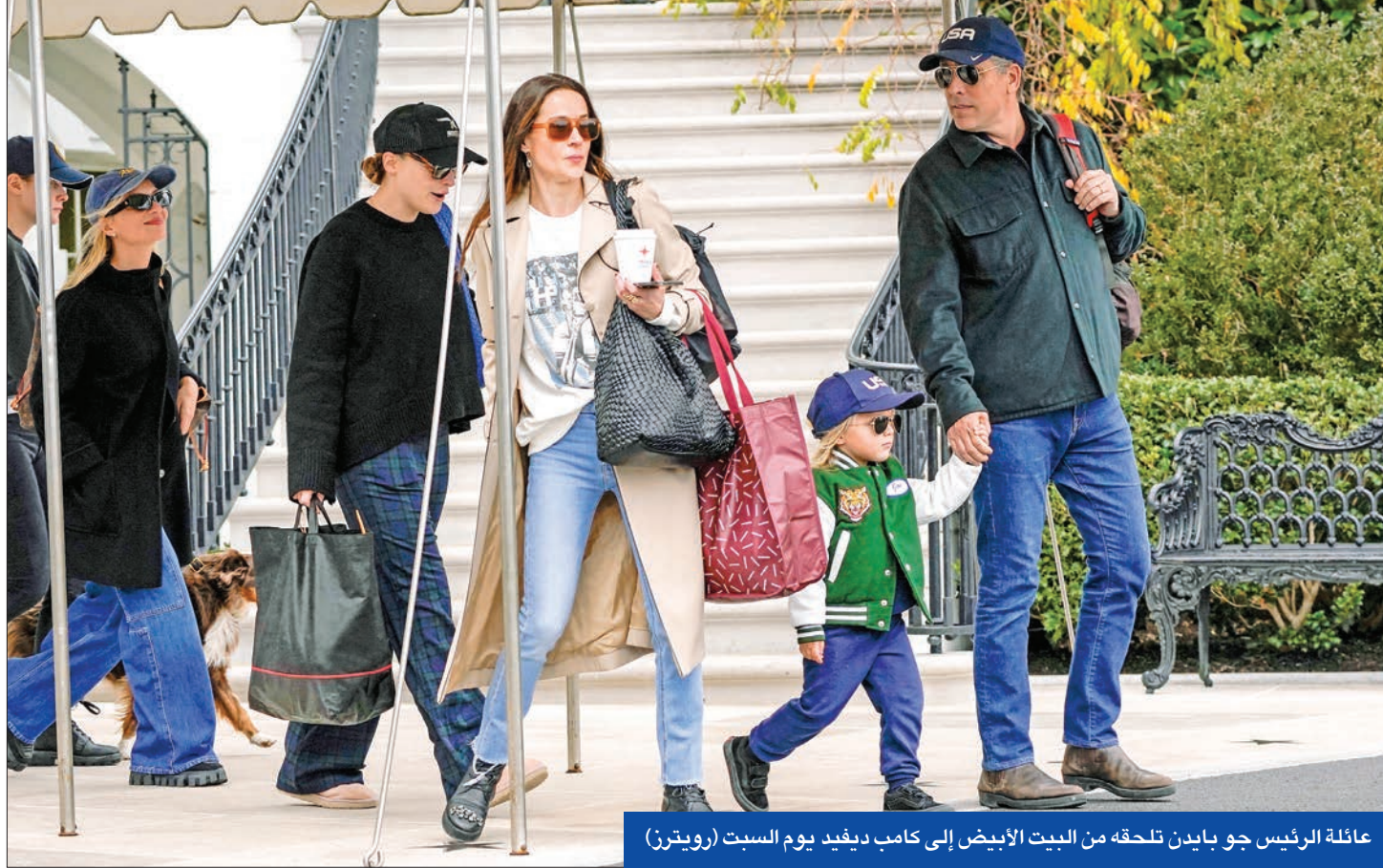
عائلة الرئيس جو بايدن تلحقه من البيت الأبيض إلى كامب ديفيد يوم السبت

أظهرت بيانات رسمية تراجع عدد سكان 7 ولايات بحكمها الديموقراطيون في الولايات المتحدة، في مقدمتها نيويورك وكاليفورنيا، وهو ما برزه الجمهوريون سياسيات يسارية متطرفة حولتها إلى مدن طاردة وغير صالحة للعيش.