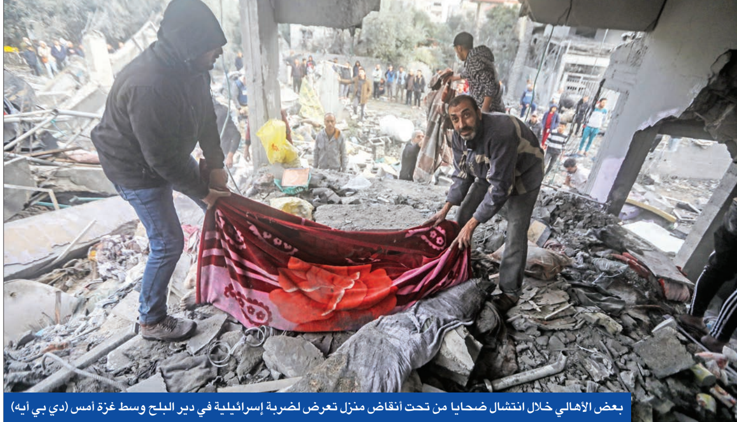
بعض الأهالي خلال انتشار ضحايا من تحت انقاض منزل تعرض لضربة إسرائيلية في دير البلح وسط غزة أمس

● عشرات القتلى في المغازي والتصيرات والبريج... وحكومة نتنياهو تبحث مقترح مصر لإنهاء الأزمة