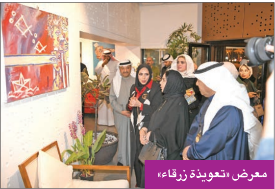
معرض «تعويذة زرقاء»