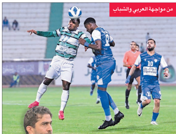
من مواجهة العربي والشباب