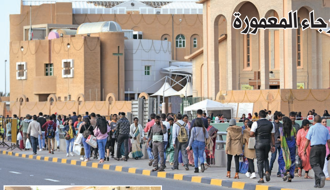
رواد الكنيسة الكاثوليكية في العاصمة أمس

غريب - الجريدة: نصلي إلى الله أن يعم السلام أرجاء المعمورة