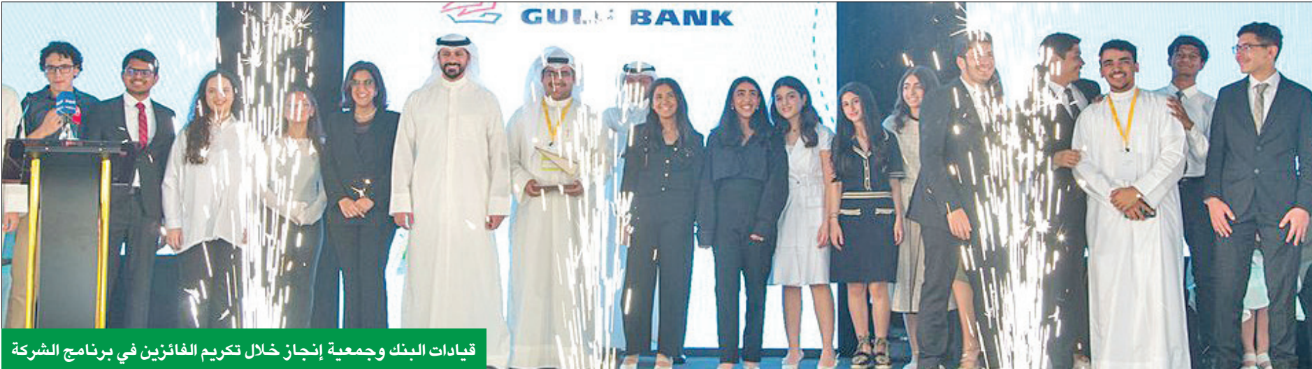
قيادات البنك وجمعية إنجاز خلال تكريم الفائزين في برنامج الشركة

من خلال قيام البنك بحزمة كبيرة من المبادرات والفعاليات والشراكات