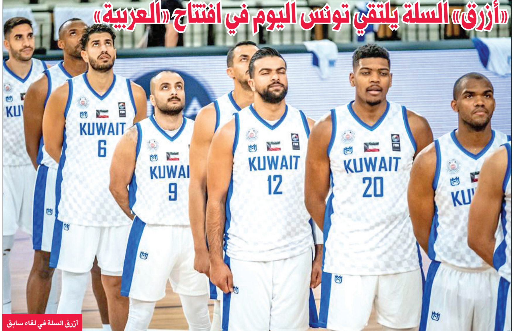
أزرق السلة في لقاء سابق

وتبدو مواجهة الأزرق اليوم قوية أمام المنتخب التونسي لما يملكه منافسه من خبرة وتاريخ كبير في اللعبة، إذ يسعى منتخبنا إلى مجاراة نظيره التونسي الذي لم يتضح بعد مشاركته في كامل نجومه أم لا.