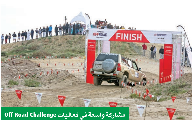
مشاركة واسعة في فعاليات Off Road Challenge

انطلاقاً من دعمه المستمر لفئة الشباب، اختتم بنك الخليج رعايته لبرنامج «المؤثر»، الذي