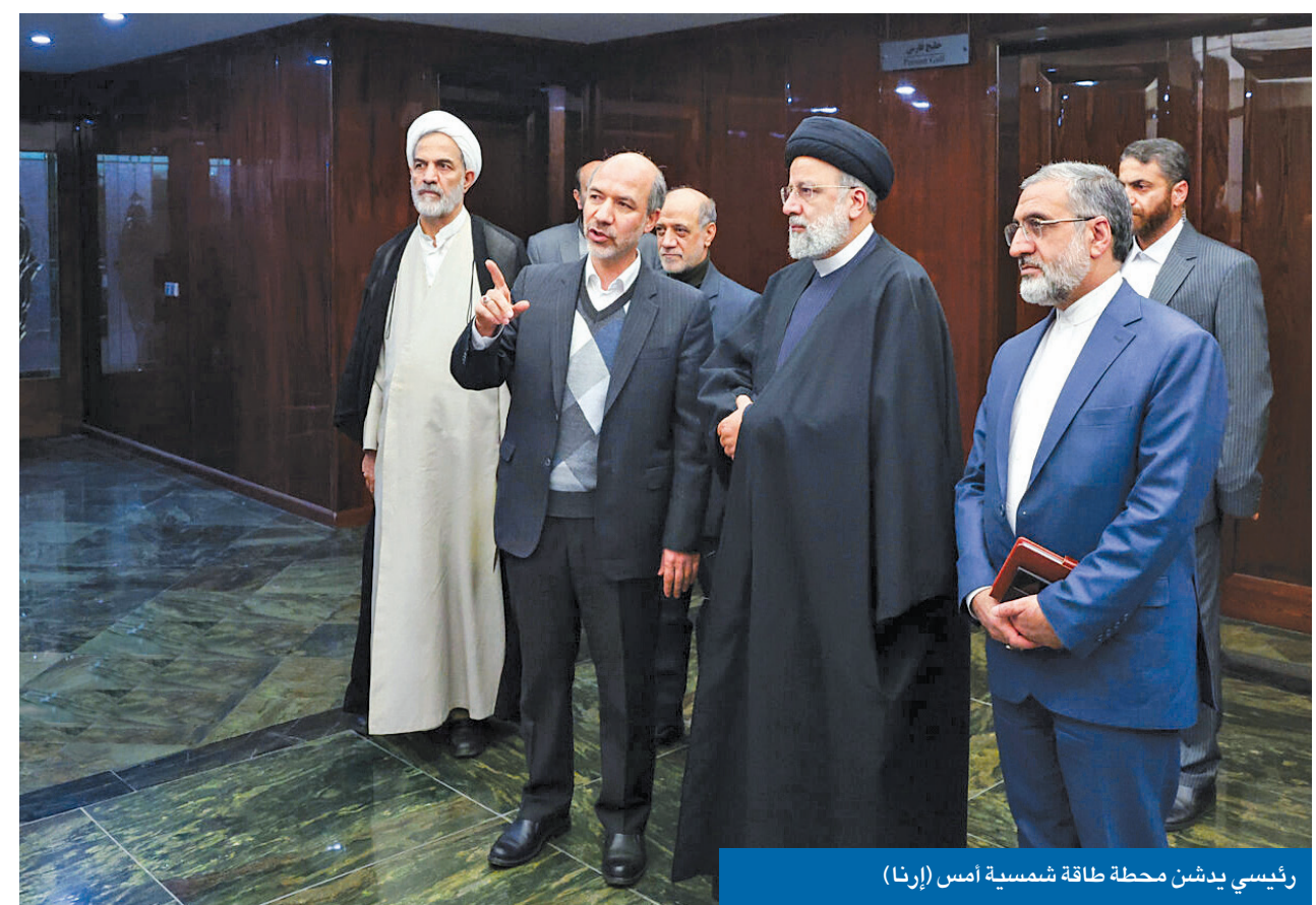
رئيسي يبدشن محطة طاقة شمسية أمس

بالترزامن مع مخاوف واسعة من اندلاع مواجهة كبرى على عدة جبهات في المنطقة، وفي تطور إيراني داخلي، تلقى الرئيس إبراهيم رئيسي تحذيرات أمنية من إمكانية اغتياله، في حين أمر المرشد الأعلى علي خامنئي بالرد على التهديدات الأميركية بإذارات عملية. وقال مصدر بمكتب الرئيس الإيراني لـ «الجريدة»، إن الأجهزة الأمنية طالبت رئيسي بتوخي الحذر في تحركاته؛ بعد أن حصلت على معلومات تفيد بأن منظمة «مجاهدي خلق» المعارضة تجهز بالتعاون مع الاستخبارات الإسرائيلية، لاغتياله. وأوضح المصدر أن هذه المعلومات دفعت رئيسي لزيارة مدينة بربند، الجمعة الماضي، برفقة أكثر من 500 عنصر أمني وسط إجراءات مشددة حالت دون مشاركة أي من الجماهير. وأظهر إصرار الأجهزة الأمنية على منع مشاركة سكان مدينة بربند، التي تشمل، بالإضافة إلى مناطق فقيرة أخرى، عصب قدرة النظام الإيراني على الاستمرار، حجب القلق من حدوث اختراق، خصوصاً وسط الأوضاع الاقتصادية