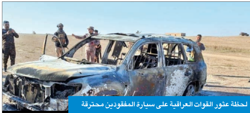
لحظة عبور القوات العراقية على سيارة المفقودين محترقة