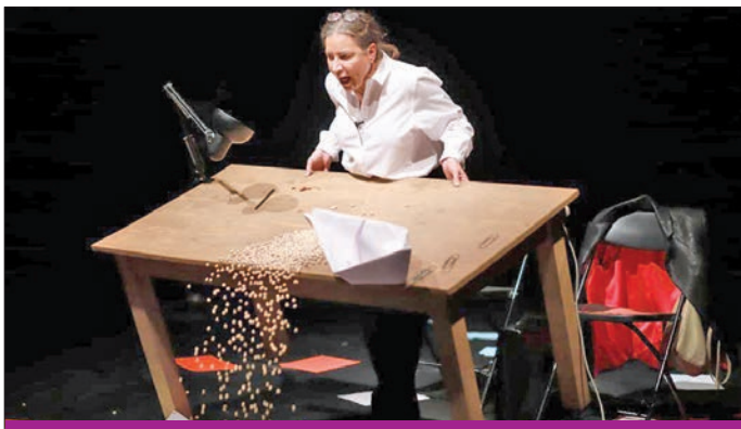
رائدة طه في مسرحية «الأي زيك فين يا علي» بفعاليات المهرجان

كما سيحظى الحاضرون بأمسية غنائية لفرقة «بنات القدس» التابعة لمعهد إدوارد سعيد الوطني للموسيقى، وفي اليوم الثالث ستتاح للحضور مشاهدة مسرحية «غزال عكا» في عرضها الثاني،