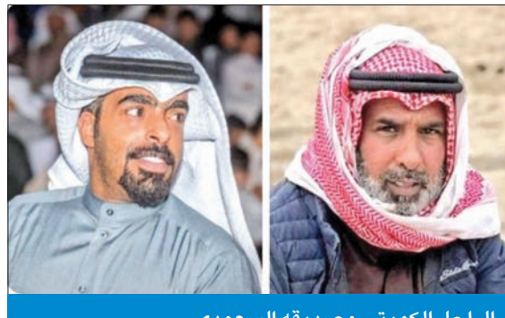
الراحل الكويتي وصديقه السعودي