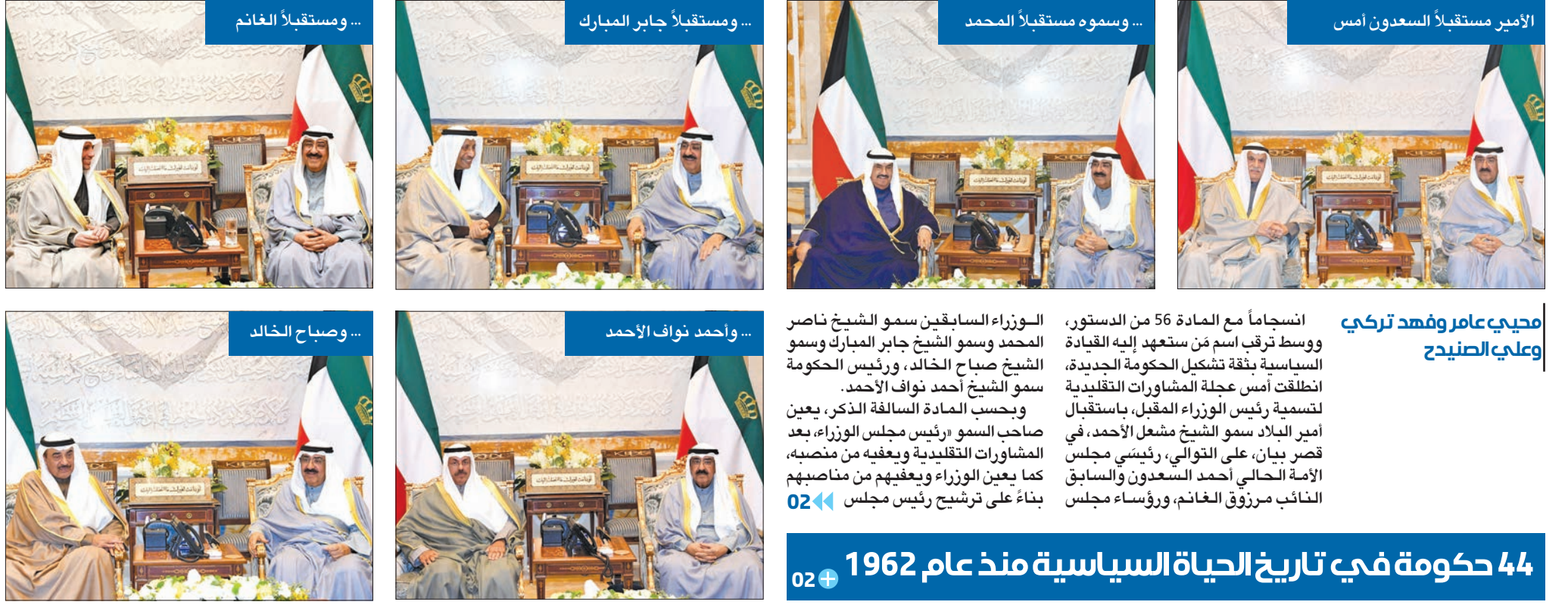
الأمير مستقبلاً السعدون أمس

الأمير استقبل السعدون والغانم والمحمد والمبارك والخالد والنواف