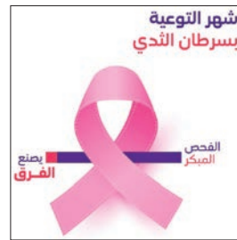
شهر التوعية بسرطان الثدي

تم إطلاقها في إطار برنامج المسؤولية المجتمعية: تحت مظلة «ويك» و«ياك» واحدة من المبادرات الثلاث الرئيسية التي أطلقتها stc لهذا العام، التي أتم التركيز على دعم رواد الأعمال والشباب والشركات الناشئة، للاستفادة من الزخم القوي الذي اكتسبته من نجاح حملاتها في السنوات الماضية. أما المبادرة الأساسية الثانية فكانت تحت مظلة