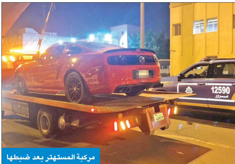
مركبة المشتبه بعد ضبطها

أصدرت وزارة الداخلية بياناً لاحقاً لبيانها السابق بشأن واقعة التعدي على رجل الأمن أثناء أداء واجبه مساء أمس الأول في منطقة الجابرية، خلال ضبطه لأحد المشتبهين وحجز مركبته. وأفاد البيان بأنه تم اتخاذ الإجراءات القانونية بحق أطراف الواقعة وتسجيل عدد من القضايا بحقهم، وهي: التعدي على موظف عام أثناء تادية العمل، وإهانة موظف عام، وإساءة استخدام هاتف (تصوير).