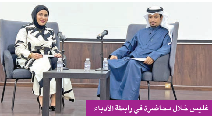
غليس خلال محاضرة في رابطة الأدباء

أكد أنها فاقت كل اللغات بخصائص وميزات لا تمتلكها غيرها