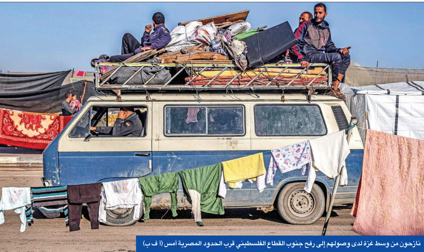
نازحون من وسط غزة لدى وصولهم إلى رفح جنوب القطاع الفلسطيني قرب الحدود المصرية أمس