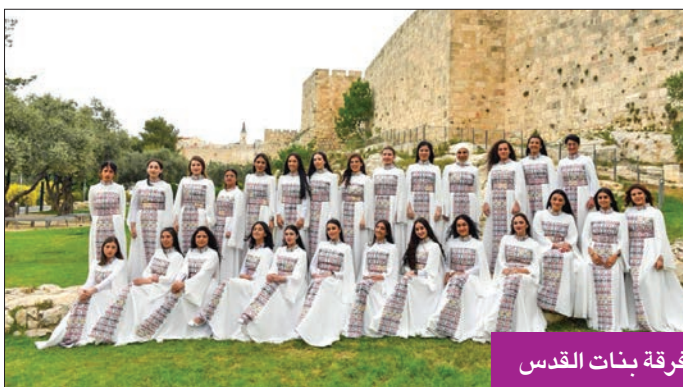
فرقة بنات القدس