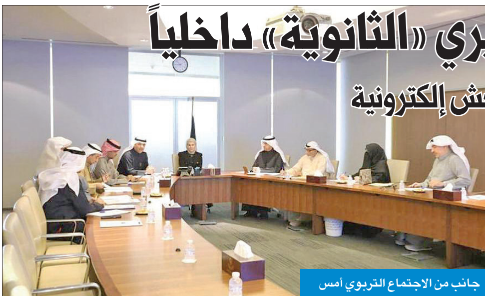
جانب من الاجتماع التربوي أمس

في اختبارات الـ 12... ومحاضر الغش الإلكترونية