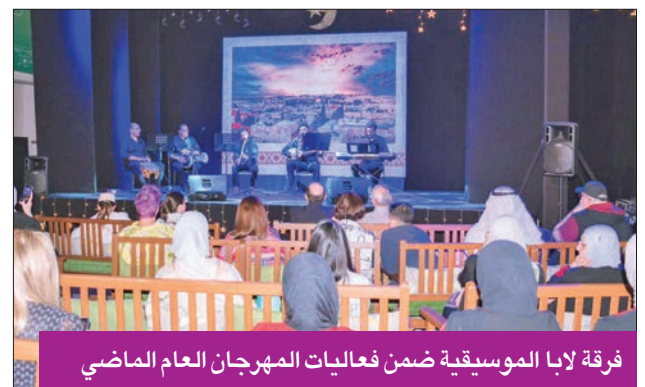
فرقة لبأ الموسيقية ضمن فعاليات المهرجان العام الماضي