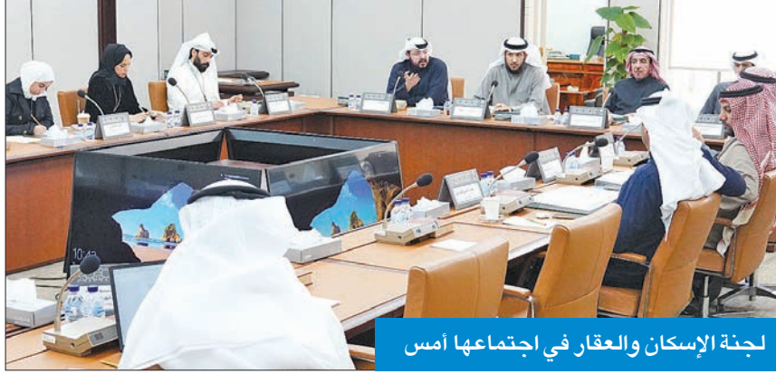
لجنة الإسكان والعقار في اجتماعها أمس

بحثت لجنة الإسكان والعقار البرلمانية، في اجتماعها، أمس، تكليف المجلس بدراسة معوقات تنفيذ المدن والمناطق السكنية الحديثة والمستقبلية، وأسباب تأخر الخدمات الأساسية وتشغيل المرافق العامة فيها، بحضور ممثلين عن المؤسسة العامة للرعاية السكنية.