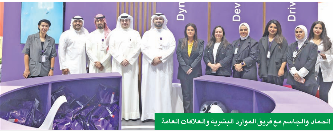
الحمد والجاسم مع فريق الموارد البشرية والعلاقات العامة