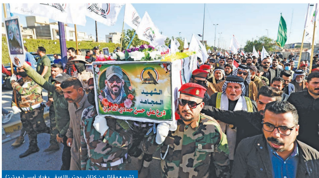
تشجيع مقاتل من كتائب «حزب الله» في بغداد أمس

وقعت اشتباكات مسلحة، ليل الإثنين- الثلاثاء بين عناصر «سرايا السلام» التابعة لزعيم الفيلق المصري مقتدى الصدر ومليشيات «عصائب أهل الحق» المقربة من إيران بقيادة قيس الخزعلي في منطقة العامل ببغداد. وأوضحت وسائل إعلام محلية، بينها «بغداد اليوم»، أن تلك الاشتباكات المسلحة تعود إلى إزالة لافتات تحمل صور قائد «فيلق القدس» الإيراني السابق قاسم سليمان، 02