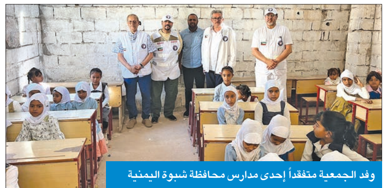
وفد الجمعية متفقداً إحدى مدارس محافظة شبوة اليمنية

تفقدت جمعية الهلال الأحمر، أمس، مشروع «مدرسة مساعد السايير التعليمية» بمحافظة شبوة شرقي اليمن، التي يجري العمل على تنفيذها منذ أشهر، ضمن حملة «الكويت بجانكم» المستمرة للعام التاسع على التوالي. واطلع وفد الجمعية الزائر لليمن على حجم الإنجاز في المدرسة التابعة لمديرية «الروضة» ومرافقها التي تتكون من 8 فصول دراسية ومكاتب للإدارة والمدرسين ومستودع وساحة عامة وودورات مياه بطاقة استيعابية لـ 360 طالباً.