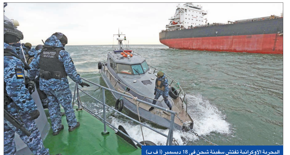
البحرية الأوكرانية تفتش سفينة شحن في 18 ديسمبر

قبل تأكيد وزير الدفاع الروسي سيرغي شويغو إحباط الهجوم المضاد، أعلن قائد القوات الجوية الأوكرانية ميولا أوليشوك، أمس، ضرب سفينة إنزال روسية في مدينة فيودوسيا بالقرم وتدميرها. وقال أوليشوك، إن قواته دمّرت سفينة «نوفوتشركاسك»، بواسطة صواريخ كروز تكتيكية بعد الاشتباه في أنها تحمل صواريخ وطائرات مسيرة إيرانية. ونشر أوليشوك مقطعاً لانفجار ضخم في الميناء، وقال للقوات الروسية: «ارتدي بنطالك وغادر وطننا قبل قوات الأوان». في المقابل، أكد رئيس سلطات القرم سيرغي