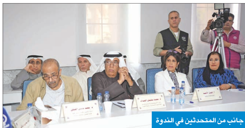
جانب من المتحدثين في الندوة