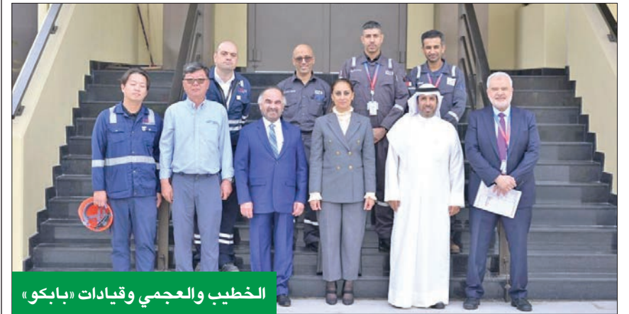
الخطيب والعجمي وقيادات «بابكو»

في إطار التعاون المشترك وتبادل الخبرات بين الشركات الوطنية للتكرير وإسالة الغاز في دول مجلس التعاون الخليجي، قامت الرئيسة التنفيذية لشركة البترول الوطنية الكويتية وضحة الخطيب، والرئيس التنفيذي لشركة البترول الكويتية العالمية شافي العجمي، بزيارة شركة بابكو للتكرير بمملكة البحرين، وقد كان باستقبالهما الرئيس التنفيذي لبابكو للتكرير د. عبدالرحمن جواهري.