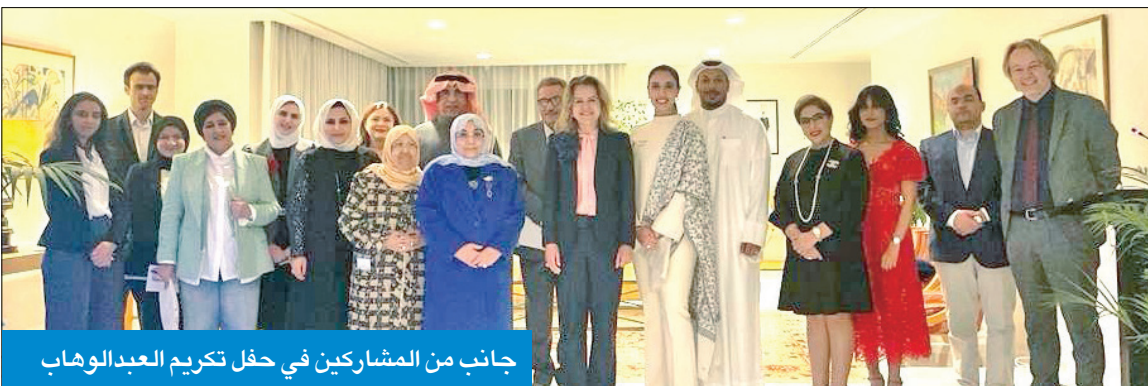
جانب من المشاركين في حفل تكريم العبد الوهاب

العبد الوهاب صاحبة دور ثقافي كبير يستحق الإشادة والتقدير لوفيليشر