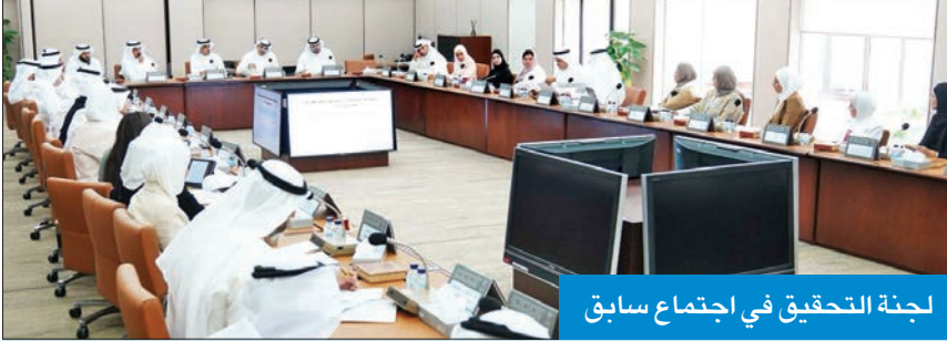
لجنة التحقيق في اجتماع سابق

عقدت 23 اجتماعاً وحققت مع 98 قيادياً حكومياً وشخصيات معنية