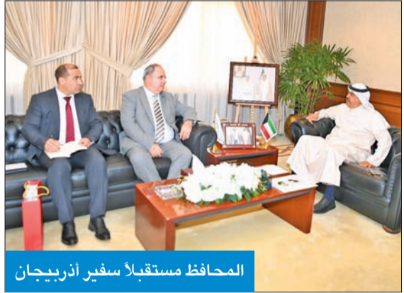
المحافظ مستقبلاً سفير أذربيجان

استقبل محافظ حولي علي الأصغر بمكتبه بديوان عام المحافظة سفير أذربيجان لدى دولة الكويت إميل كريموف. وتناول اللقاء بحث العلاقات المشتركة بين البلدين، وسبل تبادل الخبرات في المجالات ذات الاهتمام المشترك، وعدداً من القضايا المختلفة. كما استقبل المحافظ الأصغر سفير مملكة إسبانيا ميغيل خوسي مورو أغيلار