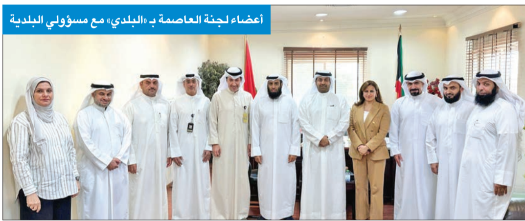
أعضاء لجنة العاصمة ب «البلدي» مع مسؤولي البلدية

أعضاء اللجنة زاروا بلدية العاصمة وبحثوا مع مسؤوليها مشاكل «الفود ترك» بالعديلية