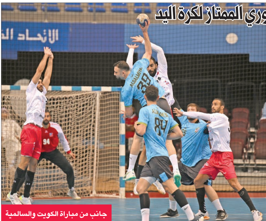
جانب من مباراة الكويت والسالمية