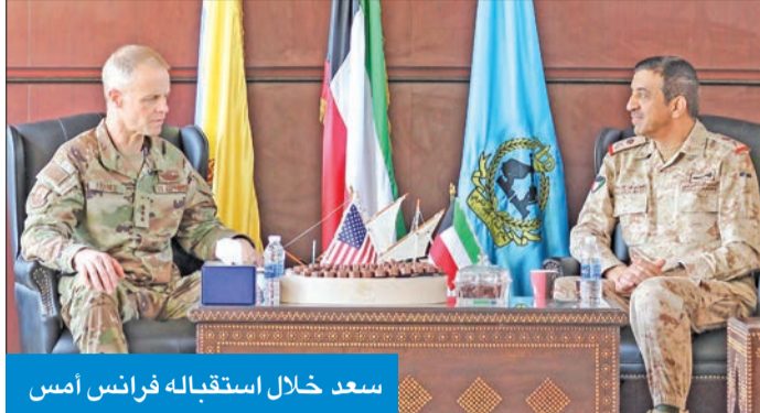
سعد خلال استقبله فرانس أمس

أمر الدفاع الجوي وقائد القوات الجوية الأميركية بحثاً تعزيز التعاون