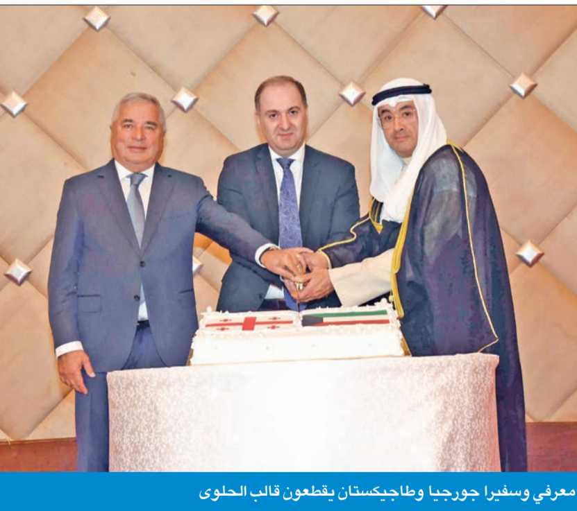
معرفي وسفيراً جورجيا وطاجيكستان يقطعون قالب الحلوى

بين 190 دولة، وهو التصنيف الصادر عن البنك الدولي، حيث تقع جورجيا بشكل أساسي بين الولايات المتحدة وبريطانيا، من حيث الراحة للمستثمرين في حين تم تحقيق عدد من الإنجازات المهمة في مجالات التعاون الاقتصادي. وأضاف البيان أنه نظراً إلى بيئة جورجيا الصديقة للأعمال بشكل استثماري، واستكشاف الفرص التي يمكن أن تقدمها جورجيا للأعمال التجارية.