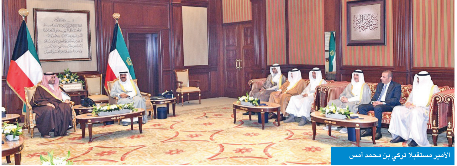
الأمير مستقبلاً تركي بن محمد أسس

حضر اللقاء كبار المسؤولين بالدولة. وحمله صاحب السمو حيايته لخادم الحرمين الشريفين وولي العهد، وتمنياته لهما بموفور الصحة وتمام العافية، تحياتاً وتقدير خادم الحرمين الشريفين الملك سلمان بن عبدالعزيز، وولي العهد رئيس مجلس الوزراء الأمير محمد بن سلمان، وتمنياتها لسموه بموفور الصحة وتمام العافية، ولشعب الكويت دوام التطور والرفي. وحمله صاحب السمو حيايته لخادم الحرمين الشريفين وولي العهد، وتمنياته لهما بموفور الصحة وتمام العافية، تحياتاً وتقدير خادم الحرمين الشريفين الملك سلمان بن عبدالعزيز، وولي العهد رئيس مجلس الوزراء الأمير محمد بن سلمان، وتمنياتها لسموه بموفور