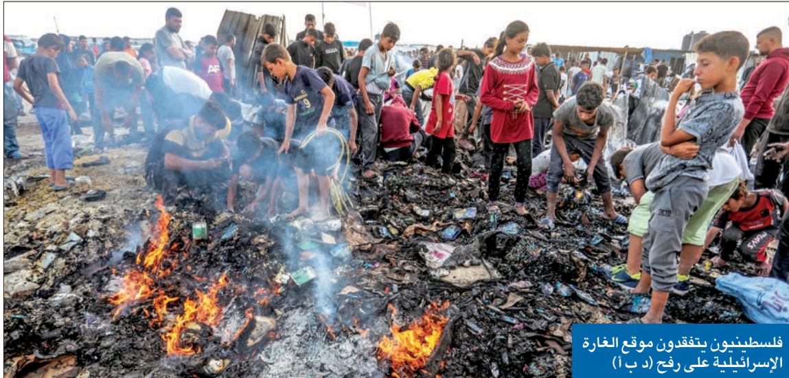
فلسطينيون يتفقدون موقع الغارة الإسرائيلية على رفح

الجيش الإسرائيلي يقتل جندياً مصرياً بمحيط معبر رفح والقاهرة وتل أبيب تحقان بالملابسات الكويت تندد بالإبادة وتدعو إلى تدخل دولي فوري لحماية الفلسطينيين وإلزام الاحتلال بوقف هجماته