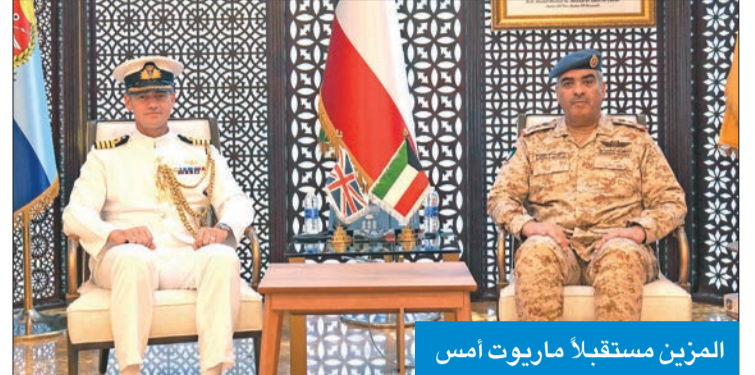
المزّين مستقبلاً ماريوت أمس

استقبل رئيس الأركان العامة للجيش الفريق الركن الطيار بندر المزّين بمكتبه أمس، الملحق العسكري البريطاني لدى البلاد العقيد الركن البحري نيل ماريوت، وذلك بمناسبة تسليم مهام عمله. وتمنى المزّين للمسؤول البريطاني التوفيق والنجاح في مهام منصبه الجديد بما يعزز ويطور سبل التعاون العسكري المشترك بين البلدين الصديقين. من جانب آخر، استقبل أمر سلاح الدفاع الجوي، اللواء الركن خالد سعد، بمكتبه صباح أمس قائد القوات الجوية الأميركية