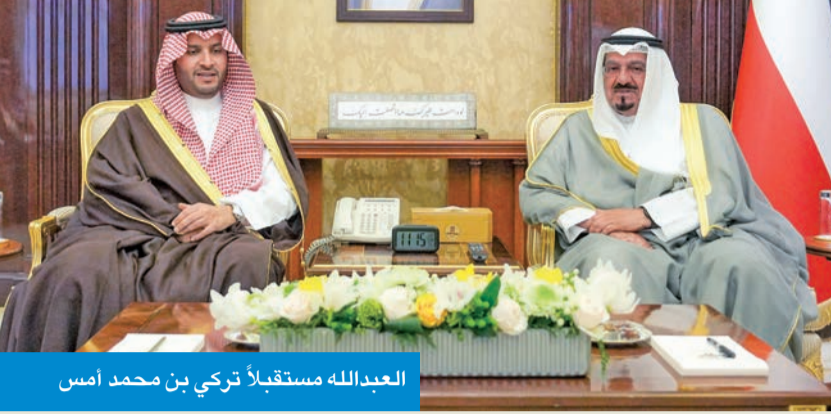
العدالله مستقبلاً تركي بن محمد أسس

استقبل رئيس مجلس الوزراء سمو الشيخ أحمد العدالله، في قصر بيان أمس، وزير الدولة عضو مجلس الوزراء بالسعودية الأمير تركي بن محمد بن فهد، والوفد المرافق له، بمناسبة زيارته للبلاد. حضر المقابلة وزير شؤون الديوان الأميري، الشيخ محمد العدالله، وسفير خادم الحرمين الشريفين لدى الكويت الأمير سلطان بن سعد، ورئيس ديوان رئيس مجلس الوزراء عبدالعزيز الدخيل. من جهة أخرى، بعث سمو رئيس مجلس الوزراء ببرقية تعزية إلى خادم الحرمين الشريفين الملك سلمان بن عبدالعزيز، ضمنها سموه خالص تعازيه ومواساته بوفاء المغفور له بإذن الله تعالى الأمير سعود بن عبدالعزيز.