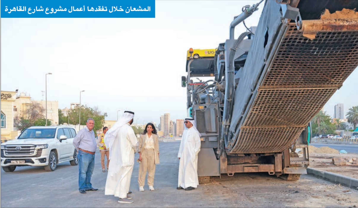
المشعان خلال تفقدها أعمال مشروع شارع القاهرة وحولي، وافتتاح النفق رقم 3 بين منطقتي الدسمة والمنصورة بتاريخ 23 مايو الجاري. الماضي والتي شملت النفق رقم 1 وثلاثة جسور مركبات وجسر التفاف علوي والتي تربط بين منطقتي الشعب

وزيرة الأشغال تفقدت المشروع وأكدت الالتزام بتوفير البنية التحتية الملائمة للاحتياجات المتنامية