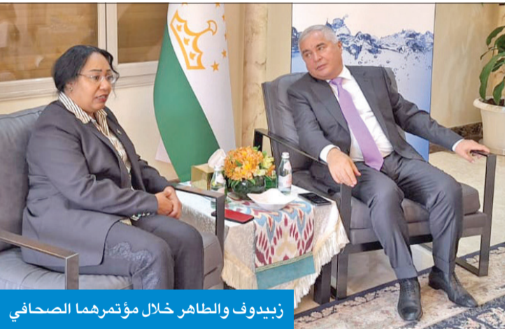
زيدوف والطاهر خلال مؤتمرهما الصحافي

«تعاون وثيق مع الكويت بمكافحة الإرهاب ومشاورات ثنائية في دوشنبه 25 يونيو» الطاهر: جهود كويتية واضحة لتوفير المياه للجميع ومجابهة التغيرات المناخية