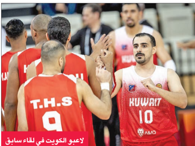
لاعبو الكويت في لقاء سابق