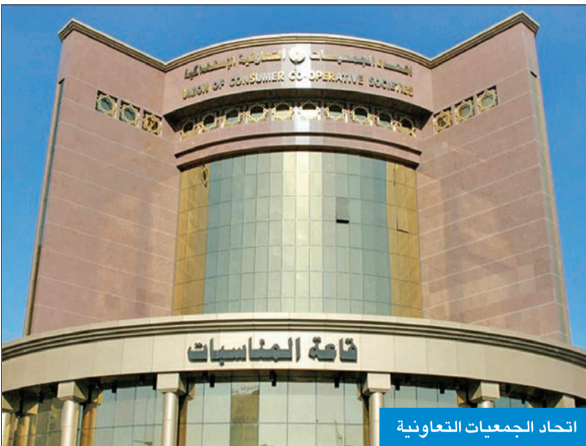
اتحاد الجمعيات التعاونية