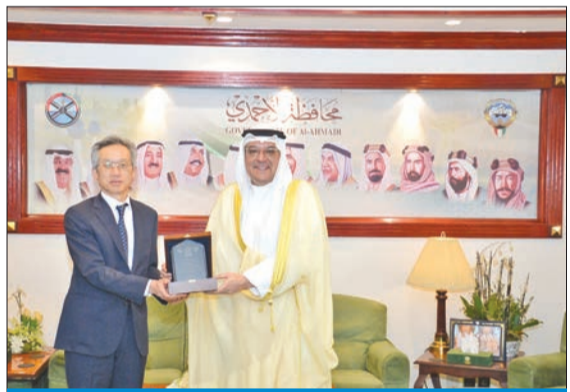
درع تذكارية من محافظ الأحمدى إلى سفير اليابان

استقبل محافظ الأحمدى الشيخ حمد سالم الحمود في مكتبه بديوان عام المحافظة سفير اليابان لدى دولة الكويت مورينو ياسوناري، حيث جرى التعارف وتبادل التهاني والتبريكات بمناسبة تعيين المحافظ في منصبه الجديد، كما تناولوا العلاقات الوثيقة