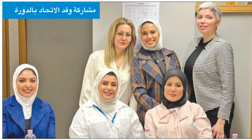
مشاركة وفد الاتحاد بالدورة

فاذية السعد: تعزيز معارف المشاركات بشأن اتفاقية القضاء على التمييز ضد النساء