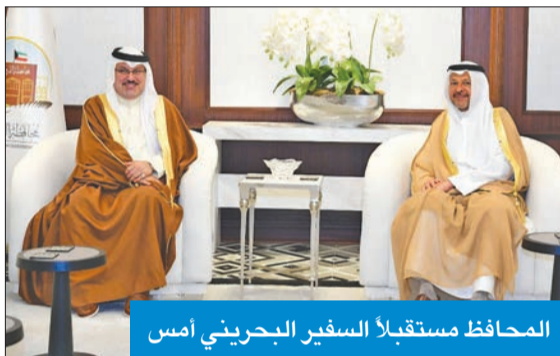
المحافظ مستقبلاً السفير البحريني أمس

استقبل محافظ الفروانية الشيخ عذبي الناصر بمكتبه في ديوان المحافظة، صباح أمس، سفير البحرين لدى الكويت صالح المالكي، لتقديم التهنئة له، بمناسبة نيته السفر السامية من سمو أمير البلاد الشيخ مشعل الأحمد، متمنياً له التوفيق والسداد في مهام عمله.