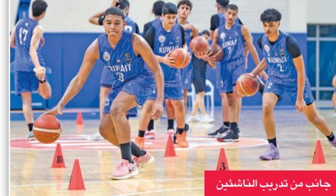
جانب من تدريب الناشئين