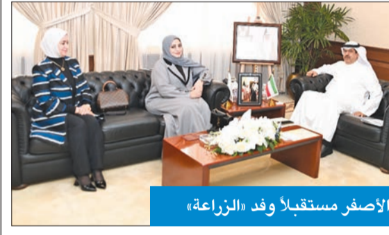
الأصفر مستقبلاً وفد «الزراعة»

تطوير الزراعات التجميلية في محافظة حولي، بهدف زيادة المناطق الزراعية والاهتمام بها، وللحفاظ على البيئة. واثني المحافظ على الجهود التي تبذلها هيئة الزراعة في