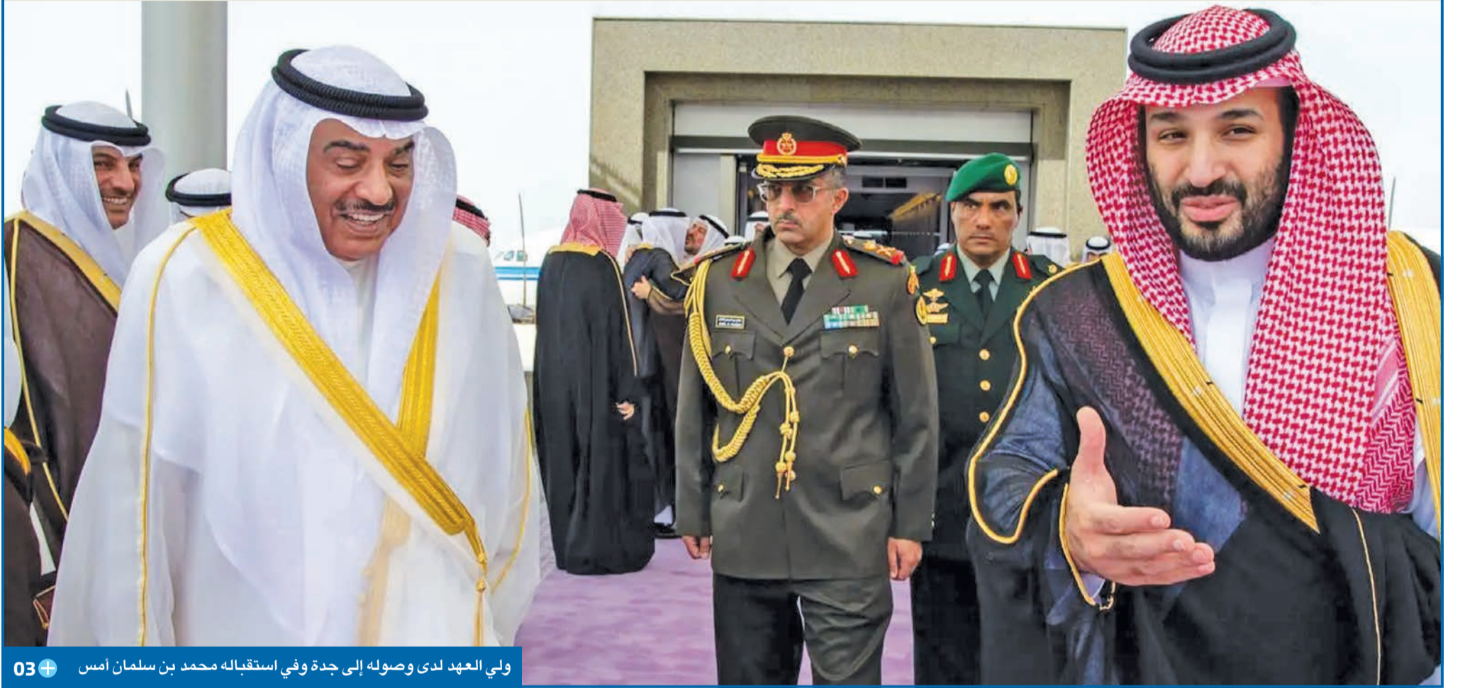
ولي العهد لدى وصوله إلى جدة وفي استقباله محمد بن سلمان أمس 03

الجانبان استعرضا في جدة العلاقات الراسخة بين البلدين الشقيقين وسبل تعزيزها على كل الصعد