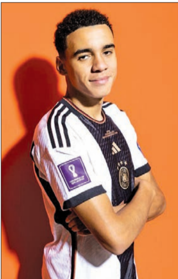
يعني أيضا المزيد من الضغط. لكن هذا يأتي مع كوني اللاعب الذي أريد أن أكونه. (د ب أ)

وصرح موسيالا لوكالة الأنباء الألمانية (د ب أ) قائلاً «لم أعد مجرد اللاعب الشاب العادي». وأضاف: «لقد حدث الكثير في تلك السنوات الثلاث الأخيرة. لم أحصل على دقائق كثيرة في يورو 2021، لكن مجرد التواجد هناك كان شرفاً عظيماً. وأوضح: «العجب كثيراً الآن. أشارك بانتظام في المباريات. أعتقد أنني اتخذت بالفعل الكثير من الخطوات الكبيرة للأمام وقمت بتحسين أدائي بشكل كبير». وفي أول مشاركة له بنهايات كأس العالم 2022 في قطر، لعب موسيالا أساسياً في جميع مباريات المنتخب الألماني بدور المجموعات تحت قيادة مدرب الفريق السابق هانسي فليك، وكان عنصرها مهماً، رغم عدم تسجيله أي هدف بالمونديال وخروج المنتخب مبكراً من الدور الأول للمسابقات. وأحرز موسيالا هدفين فقط في 29 مباراة دولية لعبها مع منتخب ألمانيا، لكنه يأمل في تحسين رصيده التهديفي خلال يورو 2024. وذكر «الدي المزيدي من المسؤولين الآن، وهذا ما كنت أريده. كان هذا هو هدفي. وهذا