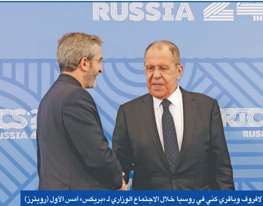
لافروف وباقرى كني في روسيا خلال الاجتماع الوزاري لـ «بريكس» أمس الأول

لكن الحكومة طوال هذه السنوات لم تنفذ الاتفاق أبداً ولم تلتزم بأي من شروطه، خصوصاً موضوع توحيد سعر صرف العملة الإيرانية وتعديل لوائح وقوانين الاستثمار للأجانب التي