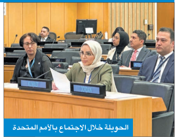
الحويلة خلال الاجتماع بالأمم المتحدة

«الكويت لن تألو جهداً في رعاية الشباب وتمكينهم»