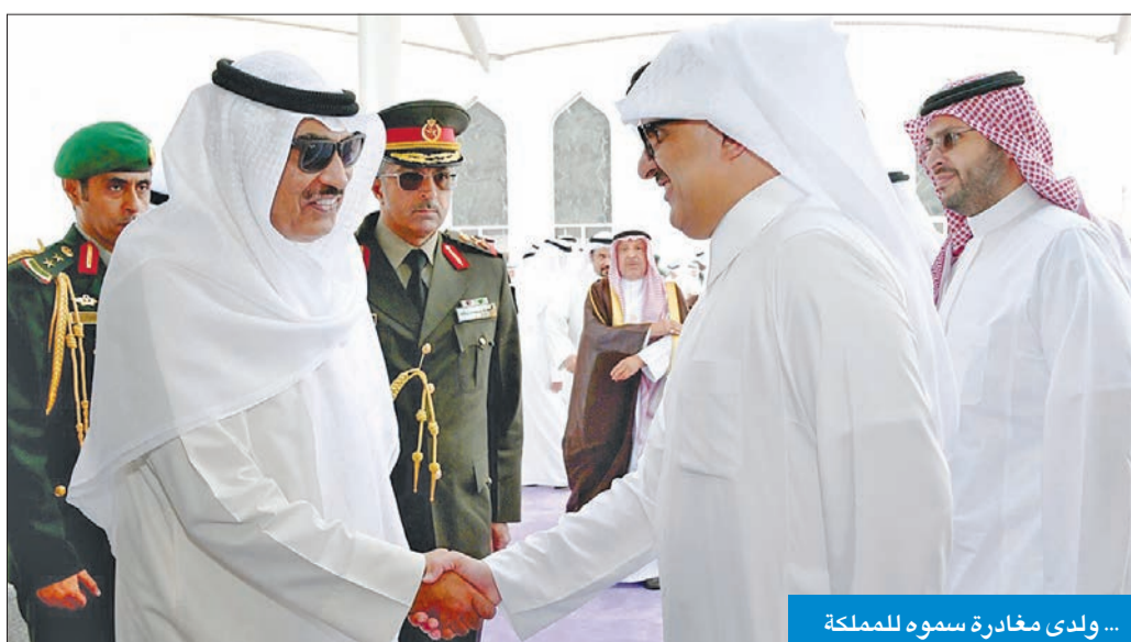
... ولدى مغادرة سموه للمملكة

اجتماعات اللجان الفرعية أقرت 50 مبادرة لتعزيز التعاون بمختلف المجالات