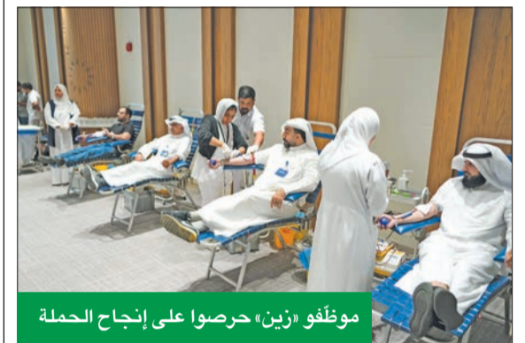
موظفو «زين» حرصوا على إنجاح الحملة

للمساهمة بالتبرع تحت إشراف وتنظيم الفريق الطبي المختص من بنك الدم المركزي، والذي كان مجهزاً بجميع المعدات اللازمة لإنجاح هذه المبادرة وفق المعايير الطبية المعمول بها. وتفخر «زين» بالإقبال الكبير الذي تشهده هذه الحملة من قبل موظفيها في كل عام، حيث تعتبرها الشركة جزءاً من سلسلة الأنشطة السنوية التي تنظمها لتحفيز موظفيها على العطاء وتشجيعهم للإقبال على الأنشطة التطوعية التي تخدم المجتمع، سواء الصحية أو