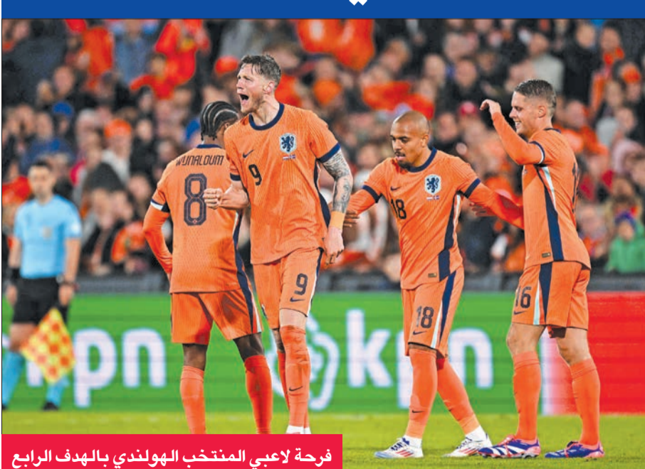
فرحة لاعبي المنتخب الهولندي بالهدف الرابع

أنهت هولندا استعداداتها لكأس أوروبا المقررة في ألمانيا بفوز كبير على ضيفتها آيسلندا 4-0 الإثنين على ملعب «دي كويب» في روتردام في مباراة دولية ودية في كرة القدم. ومنح لاعب وسط باريس سان جرمان الفرنسي الذي لعب على سبيل الإعارة مع لايبزيغ الألماني حتى نهاية الموسم تشافي سيمونز التقدم لهولندا في الدقيقة 23، وأضاف القائد قطب دفاع ليفربول الإنكليزي فيرجيل فان دايك الهدف الثاني بضربة رأسية مطلع الشوط الثاني (49). وحرم القائد الأيمن لمرمي حارس برايتون الإنكليزي يارت فيربروغن لاعب وسط آيسلندا ستيفان تينور ثورارسون من تقليص الفارق برده تسديدته البعيدة بينما من نحو 25 متراً (71)، ومرة أخرى رأسية للمدافع سيرفير إينجي إينغاسون بجوار القائم الأيسر (74).