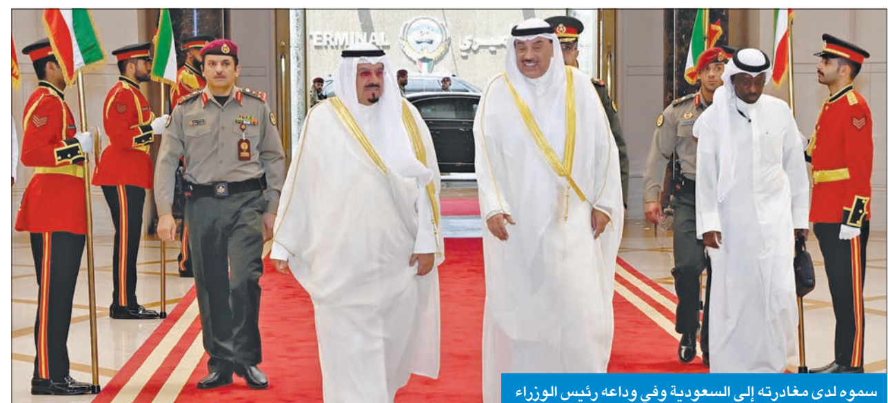
سموه لدى مغادرته إلى السعودية وفي وداعه رئيس الوزراء