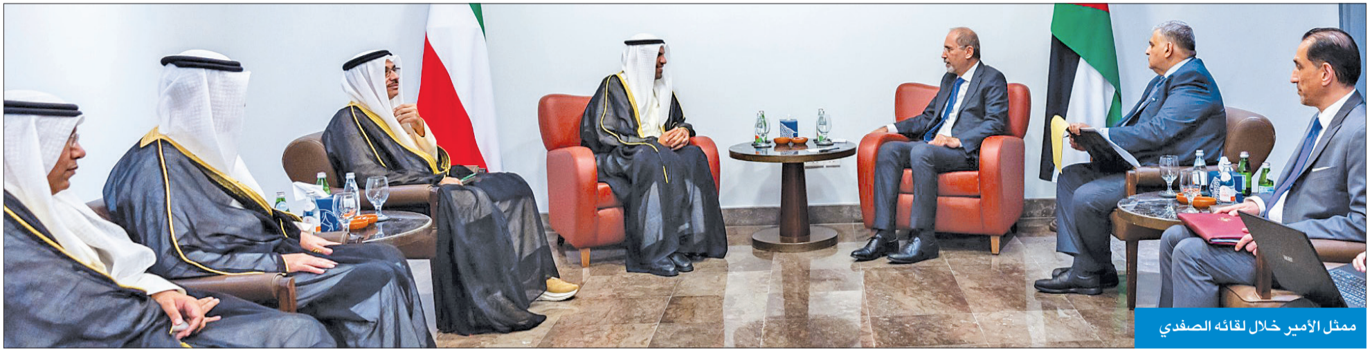
ممثل الأمير خلال لقائه الصفدي

ترأس ممثل سمو أمير البلاد الشيخ مشعل الأحمد، وزير الخارجية عبدالله الجحيا، وفد الكويت في مؤتمر الاستجابة الإنسانية الطارئة لقطاع غزة، والذي يعقد أعماله في البحر الميت. من جانب آخر، التقى ممثل الأمير، نائب