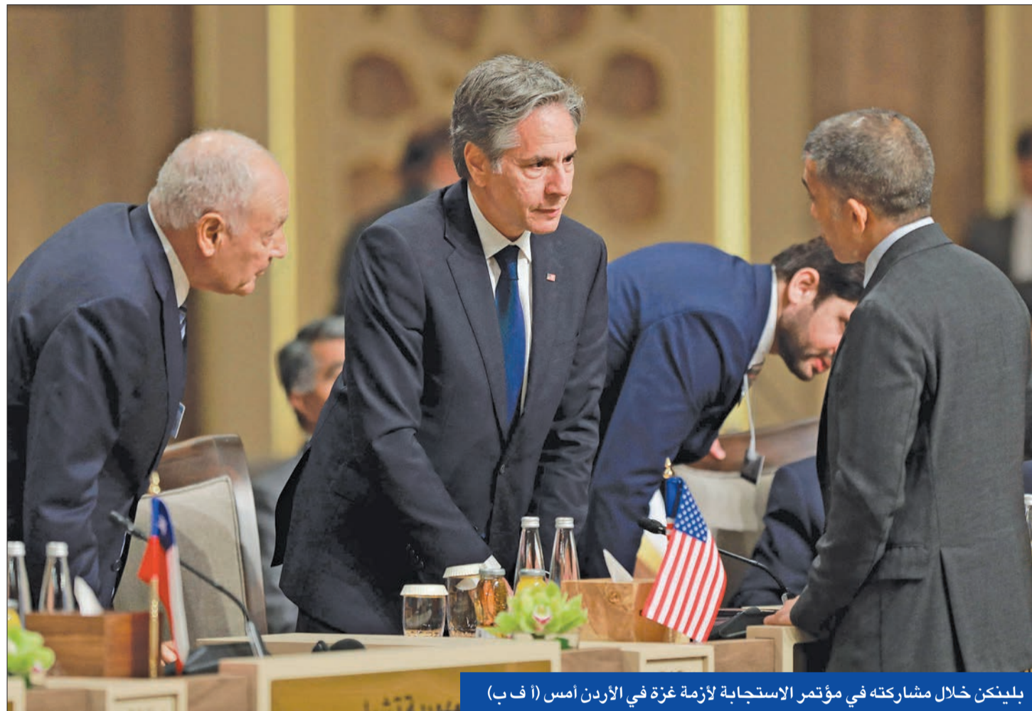
بليكن خلال مشاركته في مؤتمر الاستجابة لازمة غزة في الأردن أمس (أ ب ف)

إشادة دولية واسعة بدعم مجلس الأمن لإنهاء القتال... والكويت تعتبره خطوة محورية لوقف العدوان