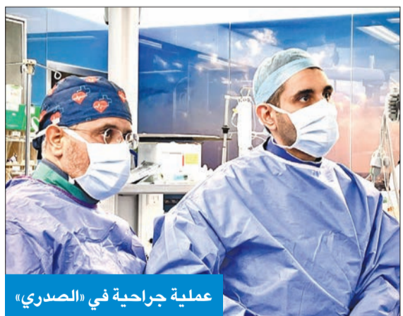
عملية جراحية في «الصدرى»