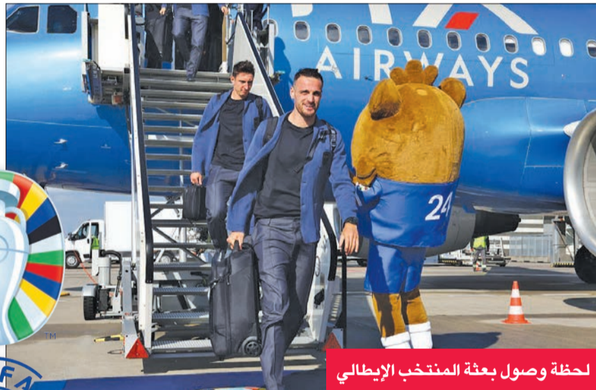
لحظة وصول بعثة المنتخب الإيطالي

وصل المنتخب الإيطالي، حامل لقب كأس أوروبا لكرة القدم، إلى معسكره في إيزرلون بالقرب من دورتموند، غرب ألمانيا، تحضيراً للمشاركة في البطولة القارية التي تنطلق هذا الأسبوع، وفقاً لما أفاد صحافي وكالة فرانس برس. ورحب ممثلو الجالية الإيطالية في المدينة، وقرابة 100 من المشجعين، بالمدرب لوتشيانو سباليتي وبإبطال أوروبا. وكانت البعثة الإيطالية غادرت مركز تدريب كوفرتشانو بعد ظهر الإثنين إلى مطار فلورنسا، حيث استقلت طائرة إلى دوسلدورف، ثم انتقل المنتخب الوطني بالحافلة إلى الفندق الذي سيقدم فيه خلال خوضه دور المجموعات. وتخوض إيطاليا مبارياتها الأولى ضمن المجموعة الثانية في 15 يونيو في دورتموند ضد البنانيا، قبل أن تواجه إسبانيا