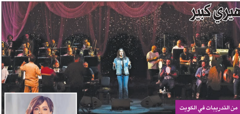
من التدريبات في الكويت

أمسية مميزة بمشاركة 50 عازفاً وسط إقبال جماهيري كبير