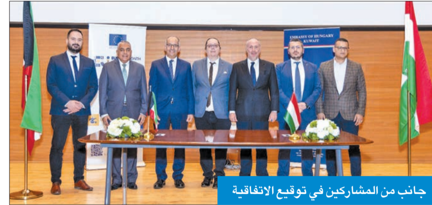
جانب من المشاركين في توقيع الاتفاقية

حياتها أسهل وأكثر كفاءة». وأضاف زايبو: «إن علم صنع الآلة يفكر مثل البشر، وسيتم إنتاج أي قرار بنمط ذكي. واستطاع أن يرى التطور السريع يوماً بعد يوم، حيث إن استخدام الذكاء الاصطناعي سيصبح مطلوباً بشدة في الصناعات المختلفة، وأشجع الأجيال القادمة على استخدام أدوات الذكاء الاصطناعي لأنها ستقدم دائماً فوائد قيمة». وهنا طلاب كلية الكويت للعلوم والتكنولوجيا KCST الذين سيلمسون معنى هذه التكنولوجيا، من خلال تعاونهم مع شركة Tengrai للذكاء الاصطناعي المجرية.