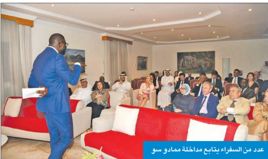
عدد من السفراء يتابع مداخلة ممدادو سو

الداعمين الكرماء لنا، ونحن نعمل معهم على العديد من الملفات.