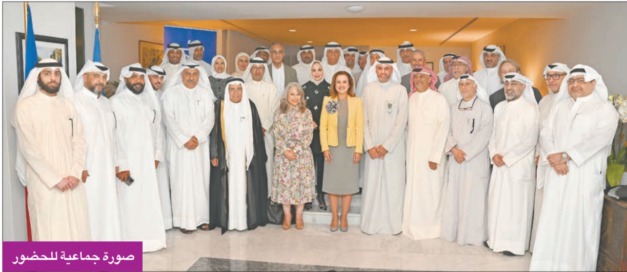
صورة جماعية للحضور

لدوره في تعزيز الروابط الثقافية بين الكويت وفرنسا