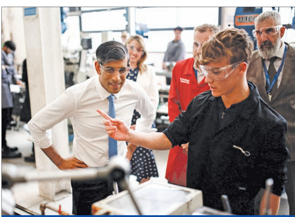
سوناك يتحدث مع الطلاب خلال زيارته الكلية التقنية الجامعية في سيلفرستون أمس

مضيفة أن ملكية منزل أصبحت «حلما كانيا للشباب في بريطانيا اليوم». وكانت الحملة الانتخابية لرئيس المحافظين صعبة في الأيام الأخيرة، خصوصا بسبب الانتقادات التي وجهت إليه بسبب مغامرته المبكرة لمراسم ذكرى الإزلال في نورماندي، فيما لا تزال استطلاعات الرأي تعطي