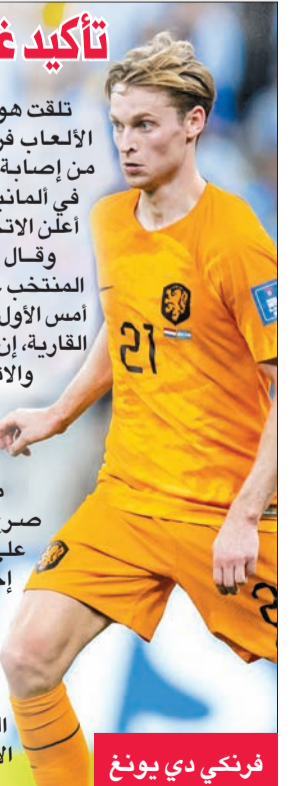
فرنكي دي يونغ

تلقت هولندا ضربة موجعة عقب غياب صانع الألعاب فرنكي دي يونغ غير المتمائل للشفاء من إصابة في كاحله عن نهائيات كأس أوروبا أعلن الاتحاد الهولندي لكرة القدم. وقال الاتحاد المحلي للعبة، بعد فوز المنتخب على إسبانيا 4-0 صفر وديا في روتردام، أمس الأول الإثنين، في الاستعداد الأخير للبطولة القارية، إن الاختبارات الطبية التي أجريت الأحد والأثنين أظهرت أن كاحل لاعب خط الوسط المصاب ليس قويا بما فيه الكفاية. وسيعود دي يونغ (27 عاماً) إلى إسبانيا للاستعداد للموسم المقبل مع ناديه برشلونة. وكان دي يونغ صرح قبل أيام قليلة: «يجب أن أحرص على ألا تصعب الإصابة زمناً، ولا أريد إجراء عملية جراحية». وتم إبلاغ لاعبي المنتخب البرتغالي بانسحاب دي يونغ قبل ودية آيسلندا. كما خسر المدرب رونالد كومان جهود تيون كومينابنر الذي يلعب أيضاً في خط الوسط، وأصيب في فخذه خلال عملية الإحماء مساء الإثنين.