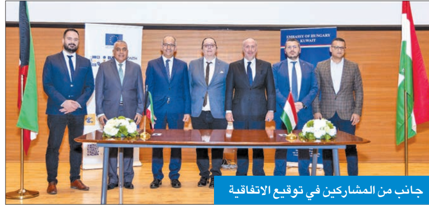
جانب من المشاركين في توقيع الاتفاقية

حياتها أسهل وأكثر كفاءة». وأضاف زايسو: «إن علم صنع الآلة يفكر مثل البشر، وسيتم إنتاج أي قرار بنمط ذكي. واستطاع أن يرى التطور السريع يوما بعد يوم، حيث إن استخدام الذكاء الاصطناعي سيصبح مطلوبا بشدة في الصناعات المختلفة، وأشجع الأجيال القادمة على استخدام أدوات الذكاء الاصطناعي لأنها ستقدم دائما فوائد قيمة». وهنا طلاب كلية الكويت للعلوم والتكنولوجيا KCST الذين سيلمسون معنى هذه التكنولوجيا، من خلال تعاونهم مع شركة Tengrai للذكاء الاصطناعي المجرية.