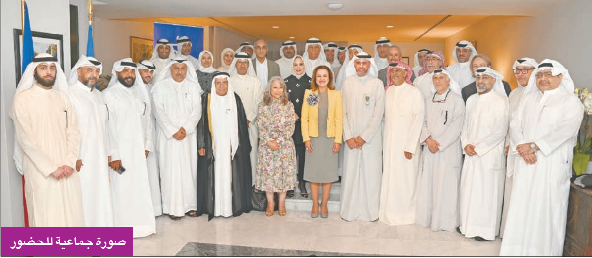
صورة جماعية للحضور

لدوره في تعزيز الروابط الثقافية بين الكويت وفرنسا