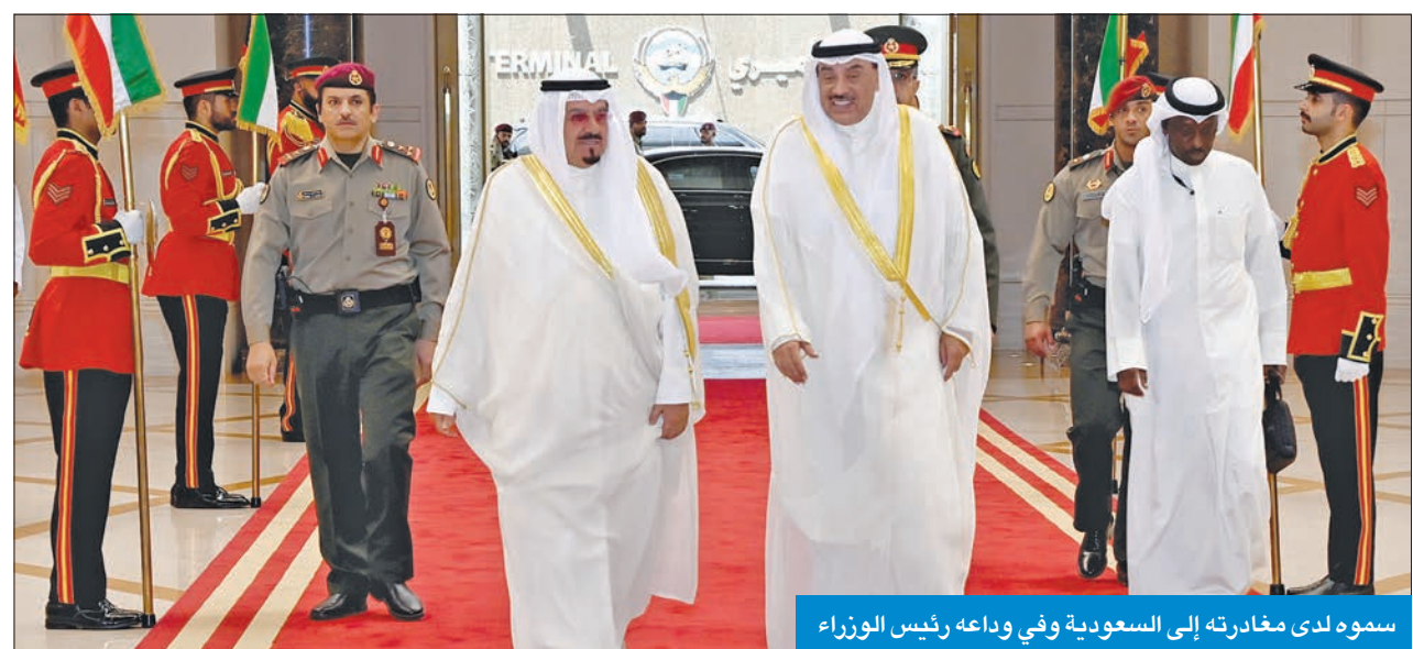
سموه لدى مغادرته إلى السعودية وفي وداعه رئيس الوزراء