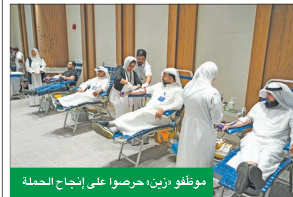
موظفو «زين» حرصوا على إنجاح الحملة

وتعري أجيليتي برنامج «الكويت تبرمج 2024» للنسبة الثانية على التوالي، والذي يقدم فرصة قيمة لأكثر من 1000 طالب وطالبة بمرحلة الدراسة الثانوية لتعلم أساسيات البرمجة الحديثة في مختلف لغات البرمجة ومجالات التكنولوجيا المطلوبة محلياً وعالمياً، مثل برمجة التطبيقات