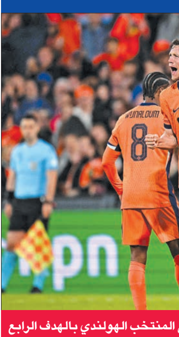
فرحة لاعبي المنتخب الهولندي بالهدف الرابع

أنتلتيكو مدريد الإسباني مفضي ديياني فانطلق كاسرا مصيدة التسلسل وتوغل داخل المنطقة وسددها داخل المرمرى (79). وختّم مهاجم هوفنهايم الألماني فاوت فيخهورست، بديل ديياني (84)، المهرجان بتسجيله الهدف الرابع عندما تلقى كرة من مالن داخل المنطقة فلعبها ساقطة على بعد متر من مرمرى الضيوف (90+3). القائد قطب دفاع ليفربول الإنكليزي فيرجيل فان دايك الهدف الثاني بضربة رأسية مطلع الشوط الثاني (49). وحرم القائد الأيمن لمرمرى حارس برايتون الإنكليزي يارت فيربروغن لاعب وسط إسبانيا ستيفان تينور ثورارسون من تقليص الفارق برده تسديده البعيدة بينما من نحو 25 متراً (71)، ومتر كرة رأسية للمدافع سيرفير إينجي إينغاسون بجوار القائد الأيسر (74). وأضاف مهاجم بوروسيا دورتموند الألماني دونيل مالن الهدف الثالث بعد ثلاث دقائق من دخوله مكان مهاجم ليفربول الإنكليزي كودي خاكبو، اثر تلقيه كرة خلف الدفاع من مهاجم