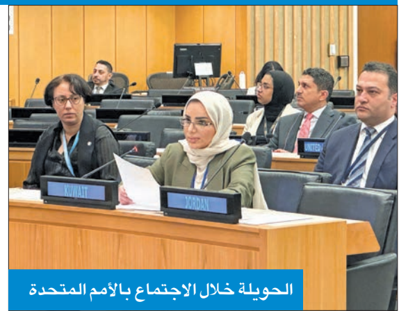
الحويلة خلال الاجتماع بالأمم المتحدة

«الكويت لن تألو جهداً في رعاية الشباب وتمكينهم»