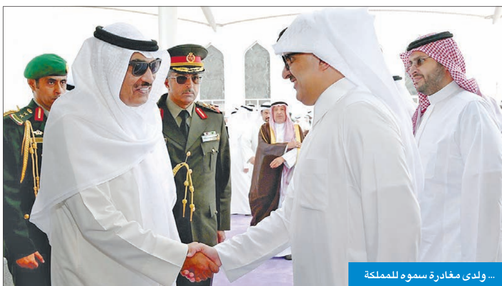
... ولدى مغادرة سموه للمملكة

وقال سفير الكويت لدى السعودية الشيخ صباح الناصر إن زيارة سمو ولي العهد الشقيقة التي رسمها سمو أمير البلاد الشيخ مشعل الأحمد تجاه العلاقات مع الشقيقة الكبرى.