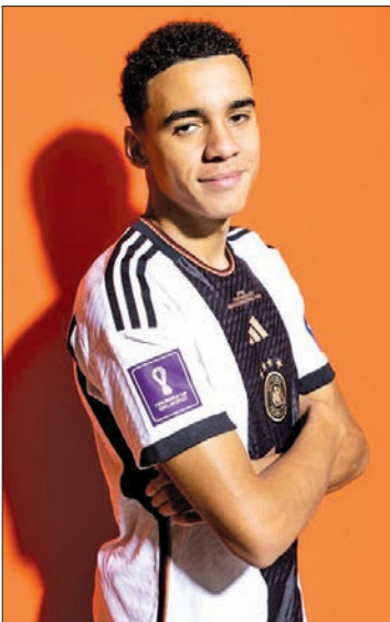
يعني أيضا المزيد من الضغط. لكن هذا يأتي مع كوني اللاعب الذي أريد أن أكونه. (د ب أ)

وصرح موسيالا لوكالة الأنباء الألمانية (د ب أ) قائلاً «لم أعد مجرد اللاعب الشاب العادي». وأضاف: «لقد حدث الكثير في تلك السنوات الثلاث الأخيرة. لم أحصل على دقائق كثيرة في يورو 2021، لكن مجرد التواجد هناك كان شرفاً عظيماً. وأوضح: «العجب كثيراً الآن. أشارك بانتظام في المباريات. أعتقد أنني اتخذت بالفعل الكثير من الخطوات الكبيرة للأمام وقمت بتحسين أدائي بشكل كبير». وفي أول مشاركة له بنهايات كأس العالم 2022 في قطر، لعب موسيالا أساسياً في جميع مباريات المنتخب الألماني بدور المجموعات تحت قيادة مدرب الفريق السابق هانسي فليك، وكان عنصرها مهماً، رغم عدم تسجيله أي هدف بالمونديال وخروج المنتخب مبكراً من الدور الأول للمسابقات. وأحرز موسيالا هدفين فقط في 29 مباراة دولية لعبها مع منتخب ألمانيا، لكنه يأمل في تحسين رصيده التهديفي خلال يورو 2024. وذكر «الدي المزيد من المسؤولية الآن، وهذا ما كنت أريده. كان هذا هو هدفي. وهذا ما كنت أريده. كان هذا هو هدفي. وهذا