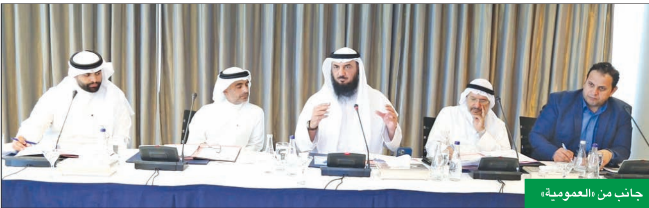
جانب من «العمومية»

إيجابياً ويوفر الضمانات للمستثمرين، مما سيجعل الكويت مركزاً مالياً وإدارياً ومحط اهتمام المستثمر المحلي والأجنبي. كما أكد المساهمون أن الوسيلة شركة مساهمة يملكها مئات المواطنين وعدد كبير من الشركات المساهمة العاملة في السوق، حيث إن أحد أكبر مساهميها هي المؤسسة العامة للتأمينات الاجتماعية القائمة على رعاية حاجات المتقاعدين، مشيراً إلى أن ما يقوم به البعض من محاولة اختزال ملكية الشركة في شخصيات بعينها يعد أمراً مناقياً للحقيقة وللقواعد المهنية، لاسيما أنهم يحاولون خلق رأي عام مغاير للواقع قد ينعكس سلباً على الاقتصاد وتهدد فيه أموال المساهمين، ويتسبب في ضياع حقوقهم.