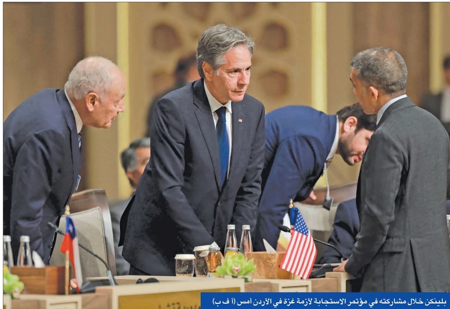
بليكن خلال مشاركته في مؤتمر الاستجابة لازمة غزة في الأردن أمس

إشادة دولية واسعة بدعم مجلس الأمن لإنهاء القتال... والكويت تعتبره خطوة محورية لوقف العدوان