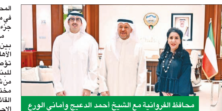
محافظ الفروانية مع الشيخ أحمد الدعيج وأمني الورع

المجتمع المدني، ويطمح إلى دمج جهود مع جهود محافظات الكويت، ومنها الفروانية، لتقديم كل سبل الرعاية والمساعدة الكفيلة بدعم التفاعليات الاجتماعية والخدمية والتعليمية والثقافية المناسبة لقاطني مناطق