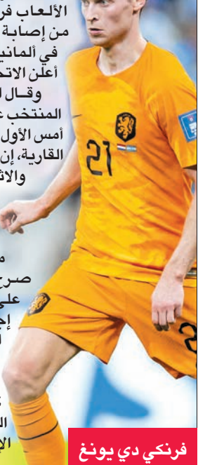
فرنكي دي يونغ

أنتلتيكو مدريد الإسباني مفضي ديياني فانطلق كاسرا مصيدة التسلسل وتوغل داخل المنطقة وسددها داخل المرمرى (79). وختّم مهاجم هوفنهايم الألماني فاوت فيخهورست، بديل ديياني (84)، المهرجان بتسجيله الهدف الرابع عندما تلقى كرة من مالن داخل المنطقة فلعبها ساقطة على بعد متر من مرمرى الضيوف (90+3). القائد قطب دفاع ليفربول الإنكليزي فيرجيل فان دايك الهدف الثاني بضربة رأسية مطلع الشوط الثاني (49). وحرم القائد الأيمن لمرمرى حارس برايتون الإنكليزي يارت فيربروغن لاعب وسط إسبانيا ستيفان تينور ثورارسون من تقليص الفارق برده تسديده البعيدة بينما من نحو 25 متراً (71)، ومتر كرة رأسية للمدافع سيرفير إينجي إينغاسون بجوار القائد الأيسر (74). وأضاف مهاجم بوروسيا دورتموند الألماني دونيل مالن الهدف الثالث بعد ثلاث دقائق من دخوله مكان مهاجم ليفربول الإنكليزي كودي خاكبو، اثر تلقيه كرة خلف الدفاع من مهاجم