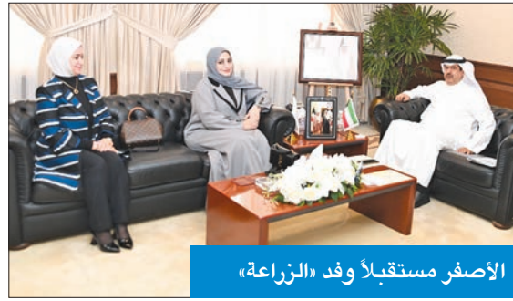
الأصفر مستقبلاً وفد «الزراعة»

إلى تطوير طرق الزراعة الحديثة في محافظة حولي، بهدف زيادة المناطق الزراعية والاهتمام بها، وللحفاظ على البيئة. واثني المحافظ على الجهود التي تبذلها هيئة الزراعة في