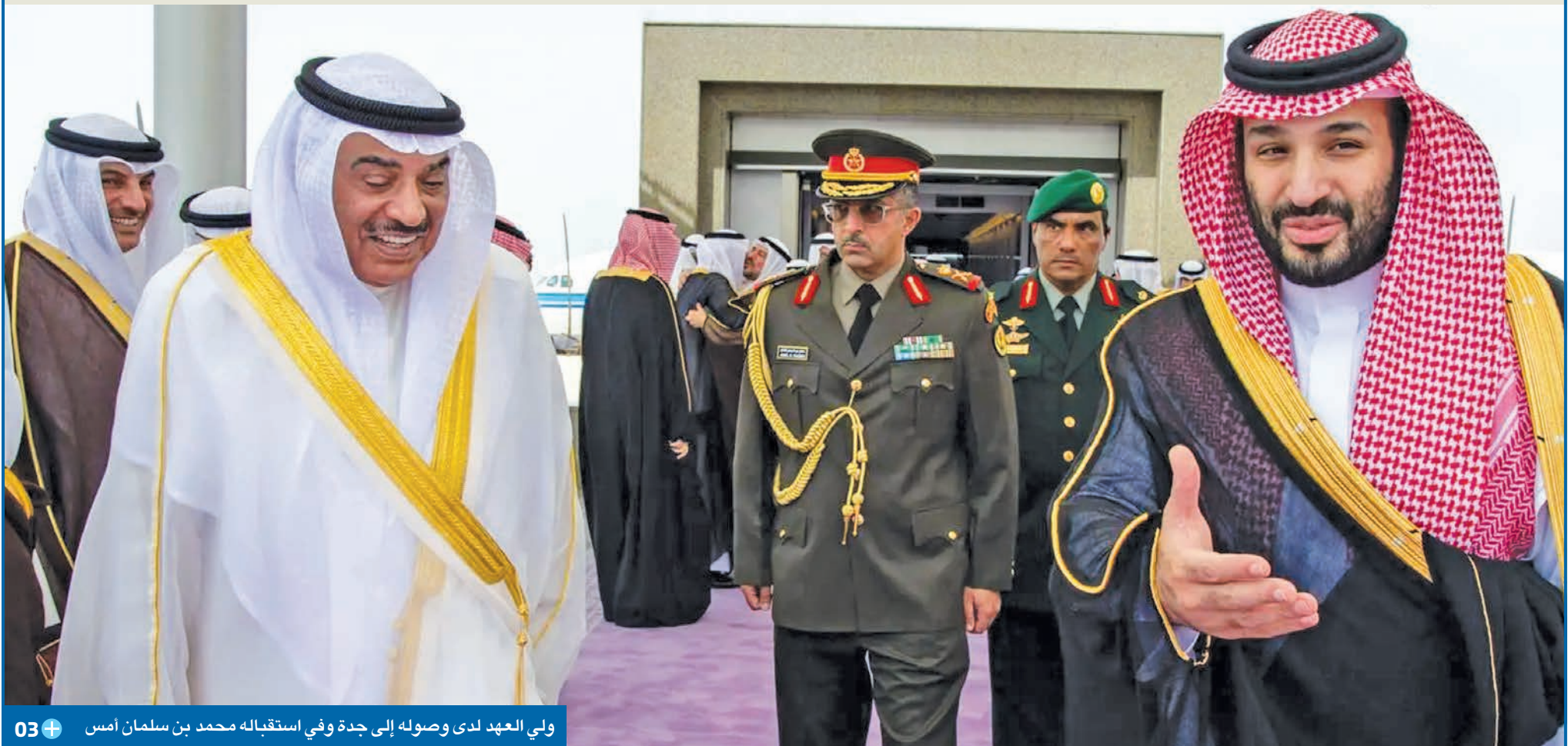
ولي العهد لدى وصوله إلى جدة وفي استقباله محمد بن سلمان أمس 03+

الجانبان استعرضا في جدة العلاقات الراسخة بين البلدين الشقيقين وسبل تعزيزها على كل الصعد