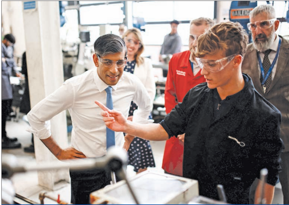
سوناك يتحدث مع الطلاب خلال زيارته الكلية التقنية الجامعية في سيلفرستون أمس

حزب العمال تقدما بنحو 20 نقطة على المحافظين قبل أقل من ثلاثة أسابيع من الانتخابات.