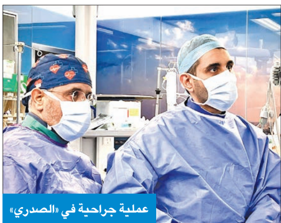
عملية جراحية في «الصدرى»

وأضاف المري أن اختيار مستشفى الصدرى كمركز متميز في المنطقة لعلاج أمراض القلب يعكس المستوى العالمي والخبرة الكبيرة للفريق الطبي في المستشفى.