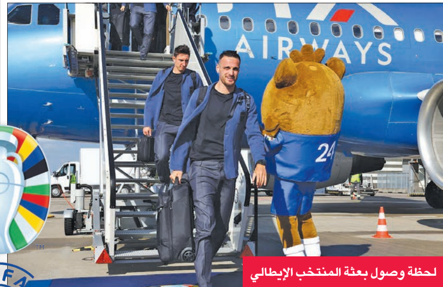
لحظة وصول بعثة المنتخب الإيطالي

أعرب جمال موسيالا، نجم فريق بايرن ميونيخ الألماني لكرة القدم، عن فخره بتطوره السريع مع منتخب ألمانيا، قبل خوض غمار بطولة كأس الأمم الأوروبية (يورو 2024)، التي يستضيفها منتخب (المانكات) على ملاعبه. ويستعد موسيالا (21 عاماً) لخوض بطولته الثالثة مع المنتخب الألماني. في أول ظهور له بالنسخة الماضية لأمم أوروبا (يورو 2020)، والتي أقيمت قبل 3 سنوات، كان موسيالا قد بلغ للثو سن الرشد، لكنه لم يشارك بصورة أساسية مع الفريق. وأصبح موسيالا الآن لاعباً بارزاً في تشكيلة بوليان ناغلسمان، المدير الفني للمنتخب الألماني، ومن المرجح أن يتواجد في القائمة الأساسية للفريق التي تخوض المباراة الافتتاحية لبطولة أمم أوروبا ضد منتخب اسكتلندا يوم الجمعة القادم.