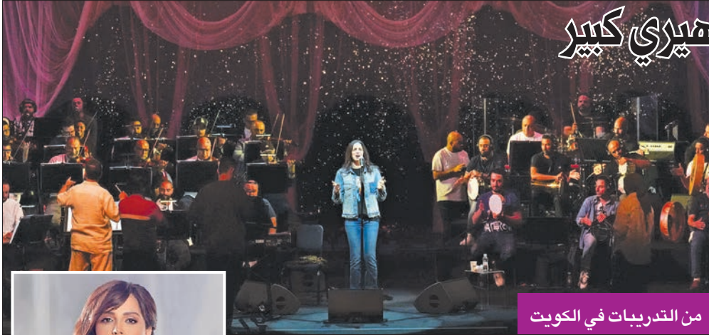
من التدريبات في الكويت

أمسية مميزة بمشاركة 50 عازفاً وسط إقبال جماهيري كبير