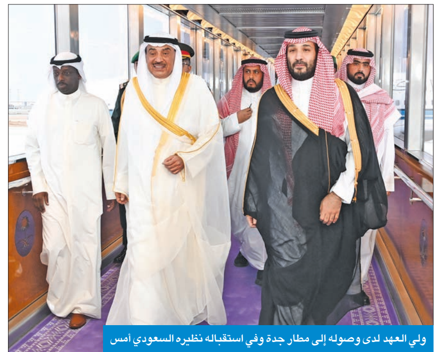
ولي العهد لدى وصوله إلى مطار جدة وفي استقباله نظيره السعودي أمس