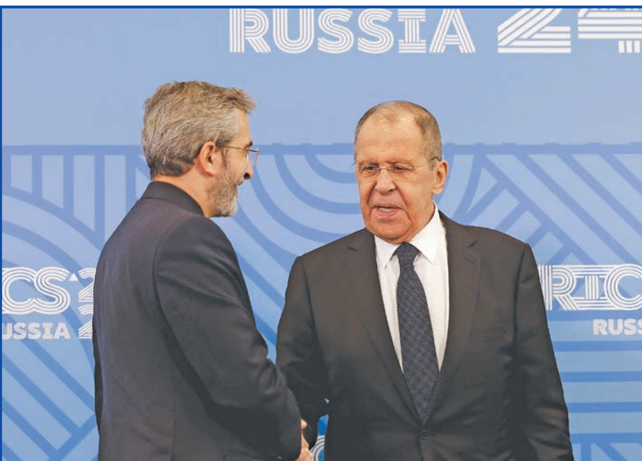
لافروف وباقرى كني في روسيا خلال الاجتماع الوزاري لـ «بريكس» أمس الأول

وتم التوصل إلى اتفاق للتعاون الشامل خلال عهد الرئيس الراحل هاشمي رفسنجاني وفي عام 2020 جرى تمديده مع إدخال تعديلات عليه، وخلال زيارة الرئيس الراحل إبراهيم رئيسي لموسكو في 2022 جرى الإعلان عن العمل على اتفاق مهم جديد. وقالت «الخارجية» الروسية حينها، إن هناك اتفاقاً جديداً بين البلدين يعكس «التحسن غير المسبوق» في العلاقات بين روسيا وإيران، وهو في المراحل النهائية لإبرامه، ومن المتوقع أن يوقعه قريباً بوتين ورئيسي الذي قضى الشهر الماضي بحادث تحطم مروحية على الحدود مع أذربيجان. لكن الحكومة طوال هذه السنوات لم تنفذ الاتفاق أبداً ولم تلتزم بأي من شروطه، خصوصاً موضوع توحيد سعر صرف العملة الإيرانية وتعديل لوائح وقوانين الاستثمار للأجانب التي