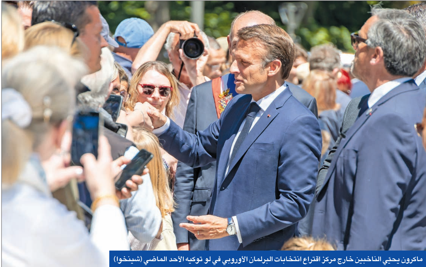
ماكرون يحيي الناخبين خارج مركز اقتراع انتخابات البرلمان الأوروبي في لو توكيه الأحد الماضي (شينخوا)

بعد مغامرته بالدعوة لانتخابات مبكرة ردا على هزيمة حزبه في الانتخابات الأوروبية، استبعد الرئيس الفرنسي إيمانويل ماكرون الاستقالة في حال خسارته الأغلبية، في وقت فجر رئيس حزب الجمهوريين قبلة بإعلانه الانفتاح على التحالف مع حزب مارين لوبن اليميني المتطرف.