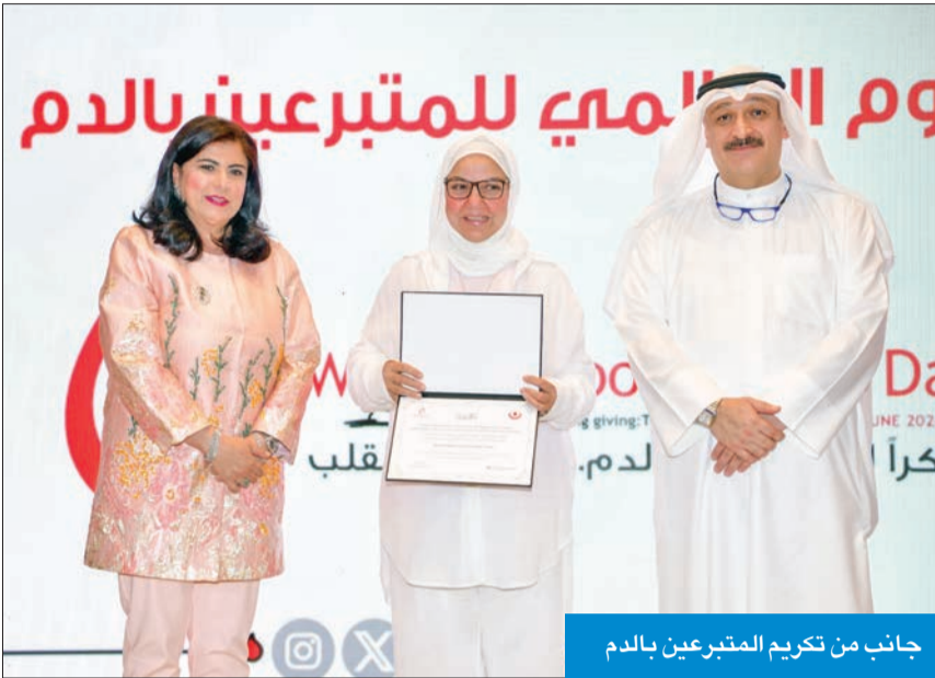
جانب من تكريم المتبرعين بالدم

«55% نسبة المواطنين المتبرعين بالدم و45% للمقيمين من 75 جنسية»