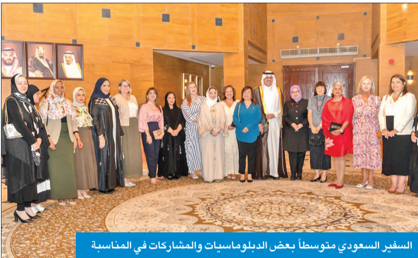
السفير السعودي متوسطاً بعض الدبلوماسيات والمشاركات في المناسبة

احتفت سفارة السعودية لدى الكويت، مساء أمس الأول، بمناسبة اليوم الدولي للمرأة في العمل الدبلوماسي، الذي يصادف 24 من يونيو سنوياً. وأكدت سفيرة خادم الحرمين الشريفين لدى الكويت الأميرة سلطانة بنت سعود آل سعود، في كلمة خلال الاحتفالية، التي أقيمت بمقر سفارة المملكة، أن هذا اليوم «هام وعظيم بالنسبة للمرأة الدبلوماسية» مرحباً بالحضور الواسع من جانبها، وقالت مديرة إدارة المرأة وشؤون الأسرة بوزارة الخارجية السعودية شروق القويقي، في كلمة لها، إن الاحتفالية تأتي لتسلط الضوء على نجاحات وإنجازات وإسهامات المرأة في المجال الدبلوماسي، إذ يعد وجودها فيه «قيمة مضافة» باعتبارها شريكة في التنمية الوطنية وفي البناء والعمارة، لافتة إلى أن العمل الدبلوماسي «يقوم ويرتقي بجهود رجال ونساء الوطن على حد سواء». وأوضحت القويقي أنه