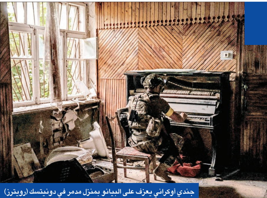
جندي اوكراني يعزف على البيانو بمنزل مدمر في دونيتسك

ومع ذلك، ذكر ستيفن تشيونج، المتحدث باسم ترامب، أن البيانات التي يبدي بها ترامب أو أعضاء