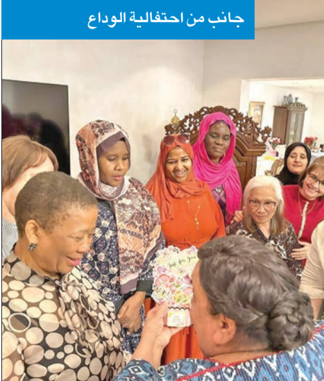
جانب من احتفالية الوداع

«الأيام المقبلة ستشهد زيارات متبادلة لمسؤولي البلدين»