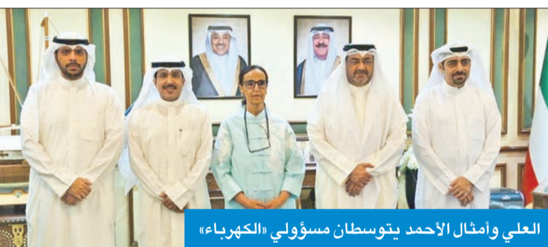
العلي وأمثال الأحمد يتوسطان مسؤولي «الكهرباء»

الشيخة أمثال الأحمد، إلى جانب عدد من مسؤولي المحافظة، للاطلاع على استعدادات الوزارة الحارية في مواجهة موجة الارتفاع غير المسبوقة في درجات الحرارة واستنزاف أحمال الطاقة في مختلف مناطق الكويت، والتعاون المأمول مع المحافظة للمساعدة في التخفيف من هذه الأزمة، لاسيما في مناطق محافظة العاصمة. وشدد العلي على ضرورة العمل ووضع الأولويات المناسبة لمواجهة هذه الموجة ووضع ضوابط من شأنها أن تخفف الضغط الهائل عن الأحمال الكهربائية، والتعاون جميعاً للخروج من هذه الأزمة المؤقتة بأقل الأضرار.