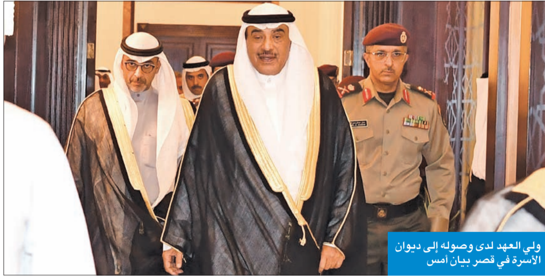
ولي العهد لدى وصوله إلى ديوان الأسرة في قصر بيان أمس

في أجواء يغمرها الود والمحبة، استقبل سمو ولي العهد، الشيخ صباح الخالد، مساء أمس، كبار القياديين بوزارة الخارجية، ورؤساء البعثات الدبلوماسية المعتمدين لدى الكويت، وكبار القادة في الجيش، والشرطة، والحرس الوطني، وقوة الإطفاء العام، وذلك في ديوان أسرة آل الصباح بقصر بيان.