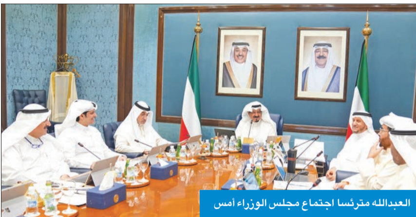
العبدالله مترئسا اجتماع مجلس الوزراء أمس

الإسراع باستكمال تطوير خليج الصليبيخات وكورنيش الجهراء وطرحهما وتسويقهما محلياً ودولياً