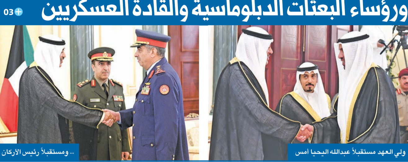
ولي العهد مستقبلاً عبدالله الحيا أمس... ومستقبلاً رئيس الأركان