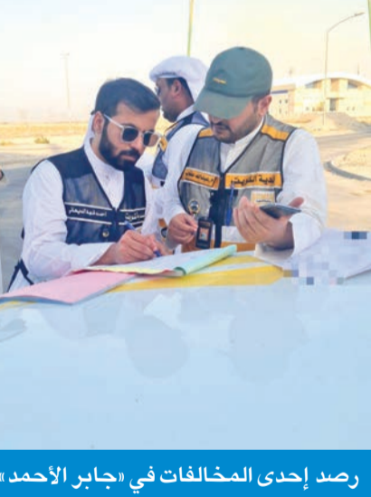
رصد إحدى المخالفات في «جابر الأحمد»

ضرورة الالتزام بلوائح وقوانين البلدية، وتنفيذ المخططات طبقاً للتراخيص الصادرة من البلدية، مؤكدة أن الفرق الرقابية ستكشف جولاتها التفقيسية لرصد المخالفين، واتخاذ كل الإجراءات القانونية بحقهم، ولفنت إلى أن الفرق الرقابية تولي اهتماماً بالغاً بحال المخالفين، سواء مكاتب هندسية أو مقاولين منفذين، من خلال الجولات الميدانية التي يقومون بتنفيذها في المحافظات. من جهة أخرى، أعلنت البلدية مواصلة الفرق الميدانية حملات تفتيش مكثفة، للكشف عن التعديلات على أملاك الدولة في كل المحافظات، وأكدت قيام قسم إزالة المخالفات في محافظة مبارك الكبير بتوجيه 14 إنذار تعدد على أملاك الدولة في منطقة ضاحية صباح السالم.