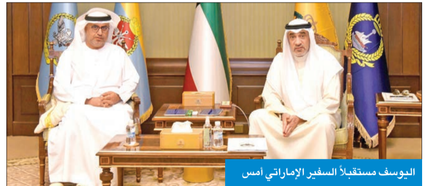
اليوسف مستقبلاً السفير الإماراتي أمس