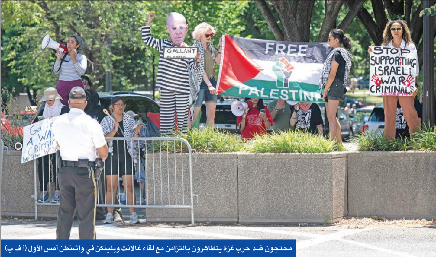
محتجون ضد حرب غزة يتظاهرون بالتزامن مع لقاء غالانت وبلينكن في واشنطن أمس الأول (أ ف ب)

وكشف وزير الداخلية الفرنسي جيرالد دارمانان أن مذكرات المخابرات تشير إلى احتمال حدوث اضطرابات في النظام العام، خلال الانتخابات.