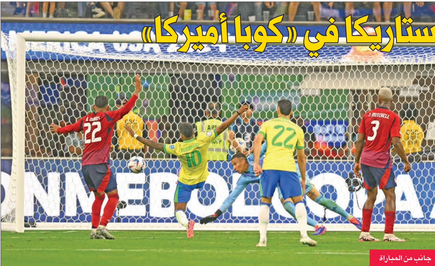
جانب من المباراة