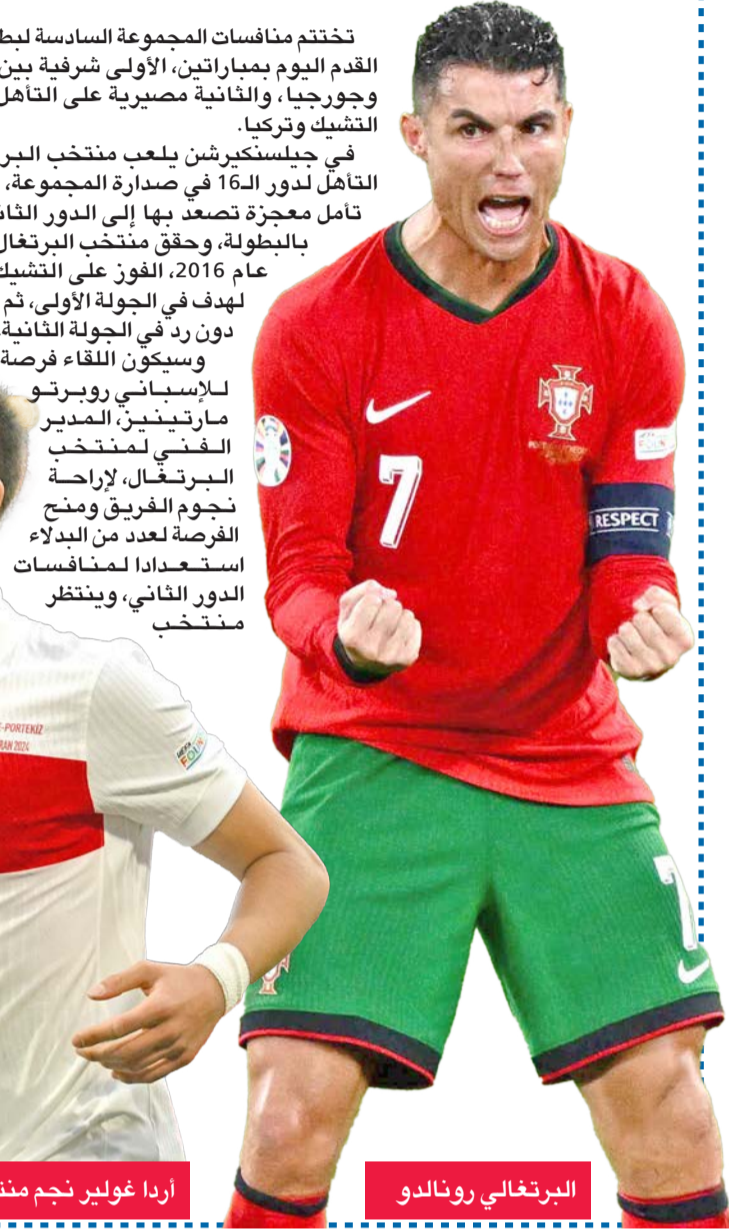
أردا غولير نجم منتخب تركيا البرتغالي رونالدو

البرتغال في دور الـ16 مواجهة المجر أو كرواتيا أو ثالث المجموعة الثالثة التي تضم إنجلترا والدنمارك وسلوفينيا وصربيا. أما منتخب جورجيا، الذي يقوده فنيا الفرنسي ويلي سانويل، فإنه يحلم بمعجزة جديدة تقوده إلى الدور الثاني، بعدما جمع نقطة واحدة بتعادله المثير مع التشيك 1-1 في الجولة الماضية، وخسارته أمام تركيا بثلاثية لهدف في الجولة الأولى، ولتحقيق حلم التأهل لا بد من فوز أمام جورجيا سوى الفوز ورفع رصيدها إلى أربع نقاط مع انتظار خسارة تركيا أمام التشيك، ليتأهل المنتخب الجورجي ضمن أفضل أربعة ثوالت في دور المجموعات. ويرتكز منتخب جورجيا، ومدربه سانويل، على أربع دعائم مؤثرة هي: حارس المرمى جورجي مامارداشفيلي، وخفيشتا كفاتر تسخيليا نجم نابولي، وزميله في الهجوم جورجيس ميكاتادزي، ولاعب الوسط جورجي كوشوراشفيلي.