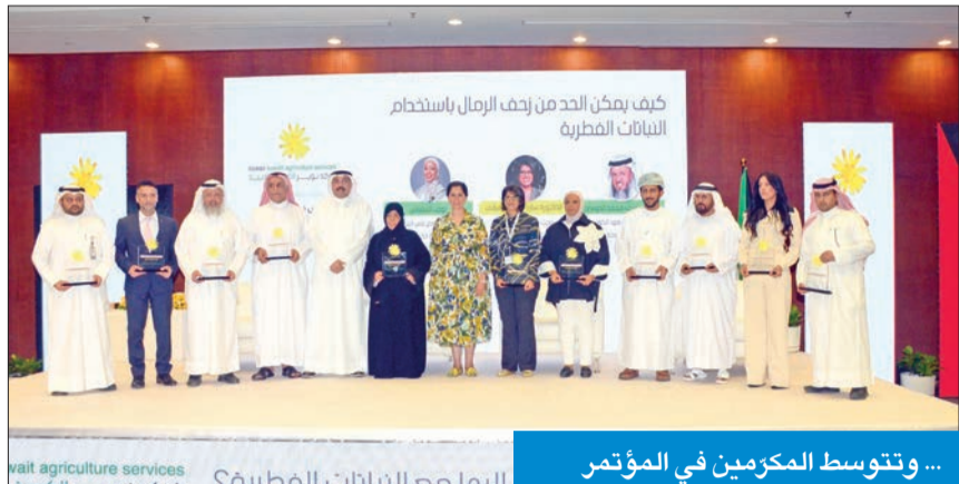
... وتتوسط المكرمين في المؤتمر

تحتوي على النخيل والثلث والزهور الموسمية والنباتات التي تحتاج إلى الري المستمر والدائم، وينتج عنها مشاكل كثيرة أنية ومستقبلية أهمها تكلفة الصيانة المستمرة والعالية والأعداد الكبيرة من العمالة التي تستخدم في الري والتسميد ورش المبيدات والتقليم السنوي. وبيّنت أن كثرة الأسمدة الصناعية ورش المبيدات يتلفان المياه الجوفية والبيئة، موضحة أن الحاجة الكبيرة شبه اليومية للمياه لهذه النباتات غير الجبلية تسبب ملوحة التربة، خاصة أن