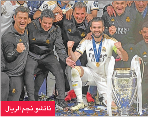
ناتشو نجم الريال

أعلن ريال مدريد بطل إسبانيا وأوروبا الثلاثاء رحيل قائده دفاعه ناتشو فرنانديس (34 عاماً) والمتوقع أن تكون وجهته المقبلة القادسية السعودي، بعد أن أمضى 23 عاماً في كنف نادي العاصمة، و12 موسماً مع الفريق الأول. وجاء في بيان للنادي الملكي: «نحرب عن امتناننا ومحبتنا لناتشو، أحد الأساطير العظيمة في نادينا»، الذي لعب 364 مباراة بالقميص الأبيض وفاز بـ 26 لقباً، من بينها 6 ألقاب في دوري أبطال أوروبا، و4 في الدوري الإسباني و2 في كأس إسبانيا. ووفقاً للصحافة الإسبانية، فقد وقع عقداً لمدة موسمين مع نادي القادسية السعودي العائد للدرجة الأولى. ويسير ناتشو على خطى العديد من الأسماء الأوروبية البارزة، بمن فيهم زميله السابق البرتغالي كريستيانو رونالدو. ويُنتظر الآن وضع اللمسات الأخيرة وإضفاء الطابع الرسمي على صفقة الانتقال.