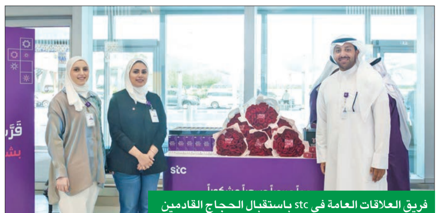
فريق العلاقات العامة في stc باستقبال الحجاج القادمين

رحبت شركة الاتصالات الكويتية stc، بالحجاج القادمين إلى مطار الكويت الدولي من مكة المكرمة في صالة الركاب T4. وتأتي هذه المبادرة، التي تم تنظيمها بالتعاون مع مطار الكويت الدولي والإدارة العامة للطيران المدني وشركة أنش كوربا لإدارة المطارات T4 للعام الثالث على التوالي، كجزء من الأنشطة المنظمة في إطار برنامج المسؤولية المجتمعية المتكامل لـ stc لدعم المجتمع. وقد رحب ممثلو شركة الاتصالات الكويتية بالتعاون مع موظفي مطار الكويت الدولي والإدارة العامة للطيران المدني وشركة أنش كوربا لإدارة المطارات T4، بالحجاج العائدين من مكة المكرمة بالقهوة والتمر. وتم توزيع هدايا عليهم وضيافتهم بالتعاون مع «تعطيرة»، الذين قاموا بتعطير وتبخير الحجاج عند قدومهم. وتشارك هذه المبادرة بمن أتموا فريضة الحج وهم في طريق عودتهم إلى الكويت. ويأتي الترحيب الخاص