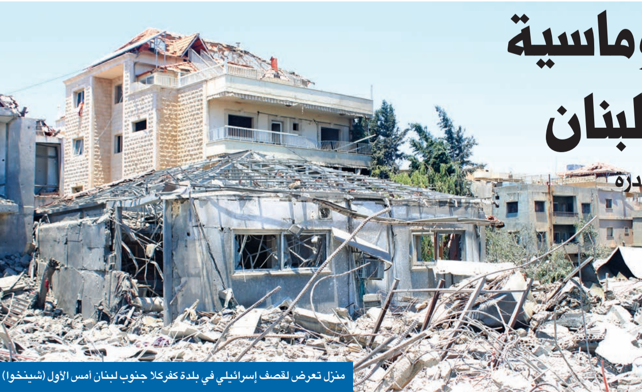
منزل تعرض للقصف الإسرائيلي في بلدة كفر كلا جنوب لبنان أمس الأول

أفكار ألمانية للتهدئة... وكندا تدعو مواطنيها إلى المغادرة