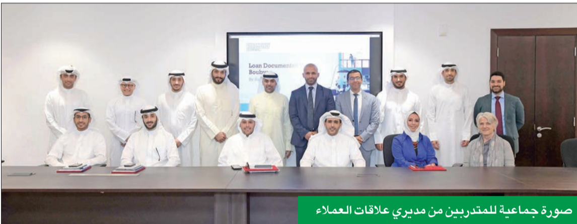
صورة جماعية للمتدربين من مديري علاقات العملاء

لمديري علاقات العملاء بالتعاون مع مؤسسة Euromoney Learning