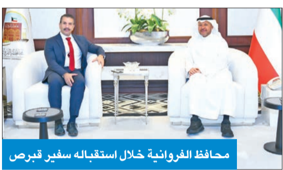
مافظ الفروانية خلال استقباله سفير قبرص

واطلع المحافظ والحضور على عرض مرئي أوضح أن مشروع «ساوت فيلج»، الذي بدأ العمل الفعلي فيه منذ يناير 2024، يضم مناطق حرفية وصناعية ومخازن ومساحات خضراء ومواقف متعددة للسيارات، إضافة إلى محطات كهربائية وأخرى لمعالجة مياه الصرف الصحي، وأن كل المنشآت داخل المشروع تدار بأحدث التقنيات، بهدف تقديم أفضل الخدمات لاهالي المدينة وللمواطنين بشكل عام. وبعد انتهاء العرض المرئي، قام المحافظ والوفد المرافق بزيارة ميدانية لتفقد أعمال المشروع، ثمناً دور القطاع الخاص في التنمية والإعمار بالبلاد. كما قام المحافظ والمدير العام لـ «السكنية» بزيارة ميدانية إلى موقع مشروع الفرصة الاستثمارية 53 «سوق صباح»، الذي يضم سوقاً تقليدياً، بالإضافة إلى فندق، واستمع إلى شرح مفصل عن المشروع من المسؤولين. الذين أشاروا إلى وجود بعض التأخير في إصدار التراخيص اللازمة للبدء الفعلي في تنفيذ أعمال المشروع، فطالب المحافظ بتزويده بالكتب والمراسلات والمعوقات الخاصة بالمشروع بالتنسيق مع الجهات المعنية بشأنها.