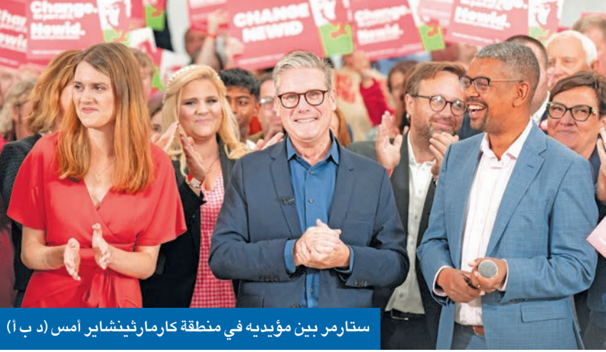
ستارمر بين مؤيديه في منطقة كارمازيتشاير أمس (د ب أ)

2010، بتطلع البريطانيون إلى شيء واحد فقط، هو التغيير، وعلى عكس أوروبا التي تشهد فوزاً تلو الآخر لليمين المتشدد، سيكون التغيير في بريطانيا باتجاه اليسار. وعشية التصويت، رجّح الوزير المحافظ ميل سترايد، وهو أحد أبرز دعاة حملة رئيس الوزراء المحافظ ريشي سوناك، تحقيق «العمال» أكبر أغلبية ساحقة تشهدها بريطانيا على الإطلاق، وتوقع تحليل أجرته شركة «سيرفيسين» أن يفوز «العمال» بنحو 484 مقعداً من إجمالي 650 في البرلمان، بما يزيد كثيراً على 418 مقعداً التي فاز بها زعيم الحزب السابق توني بلير انتصاره الساحق عام 1997 وكانت الأعلى في تاريخ الحزب. في المقابل، تشير التوقعات إلى أن حزب