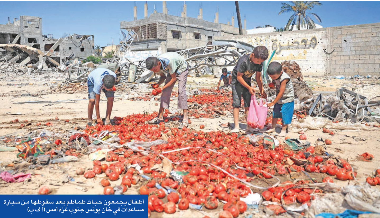
اطفال يجمعون حبات طماطم بعد سقوطها من سيارة مساعدات في خان يونس جنوب غزة أمس

التسوق عنها «أخبرته عبر الهاتف بان هناك من تحزرت بي، وهذا ليس هجوماً بدوافع قومية»، منذ بدء الحرب في 7 أكتوبر إلى «37 ألفاً و953 شهيداً، و87 ألفاً و266 إصابة». وطعن واستيطان