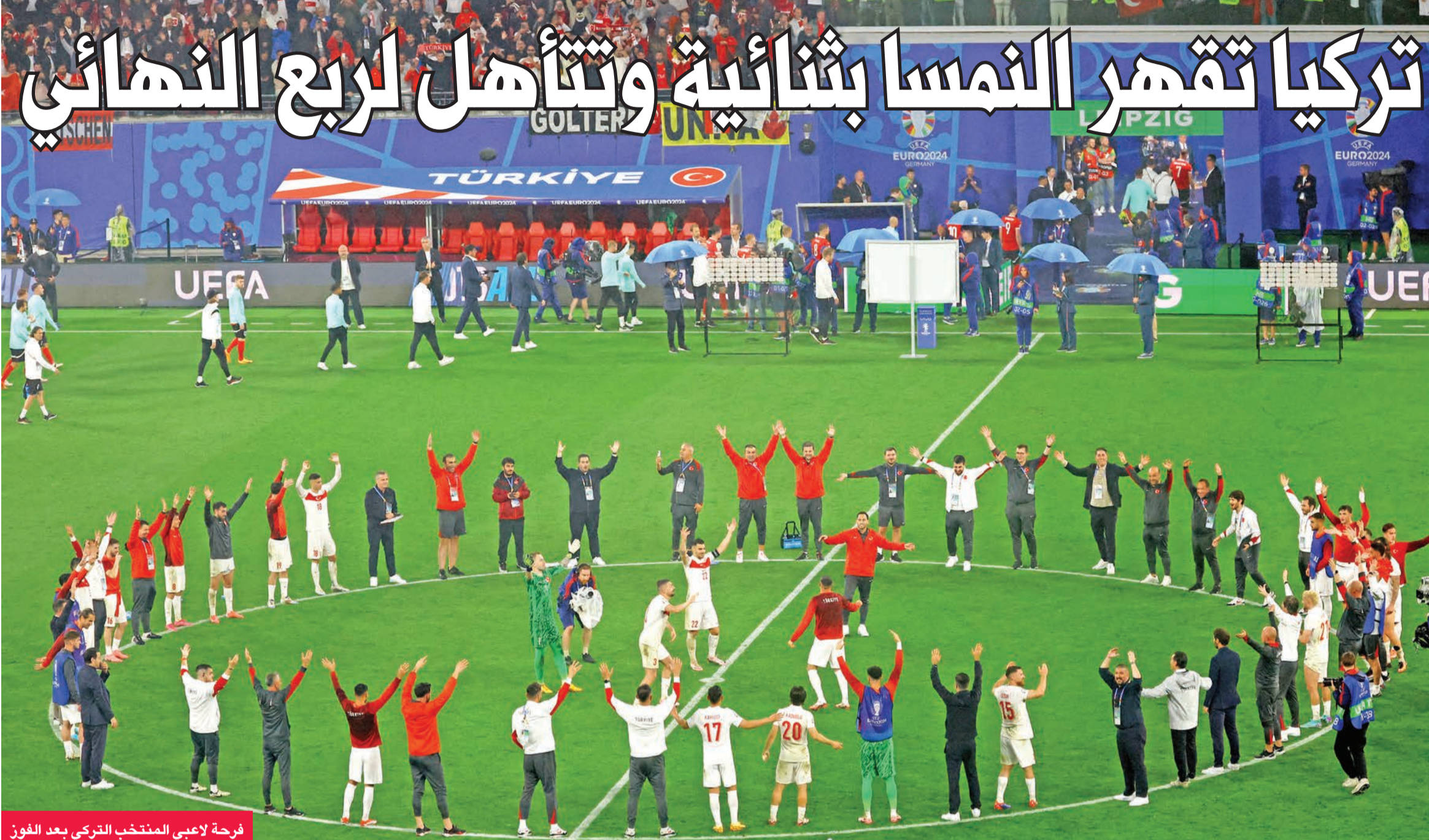
فرحة لاعبي المنتخب التركي بعد الفوز