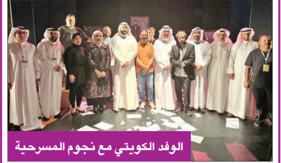
الوفد الكويتي مع نجوم المسرحية

قدمت فرقة مسرح الخليج العربي، أمس الأول، مسرحية بعنوان «سيناريو وحوار»، ضمن فعاليات مهرجان ليالي المسرح الحر الدولي، الذي يقام بدورته الـ 19 في العاصمة الأردنية (عمان). وجسدت أحداث المسرحية مواقف يتعرض لها كاتب مصاب بمرض يسبب اضطراب الشخصيات المتعددة، الذي يُفقد صاحبه ذاكرته، لتبدأ المسرحية بعرض سلسلة من الأحداث في كل مرة يحاول بطل المسرحية كتابة نص جديد، وتظهر له شخصية نسائية تُفاجأ بها لتخبره في النهاية بالحقيقة.