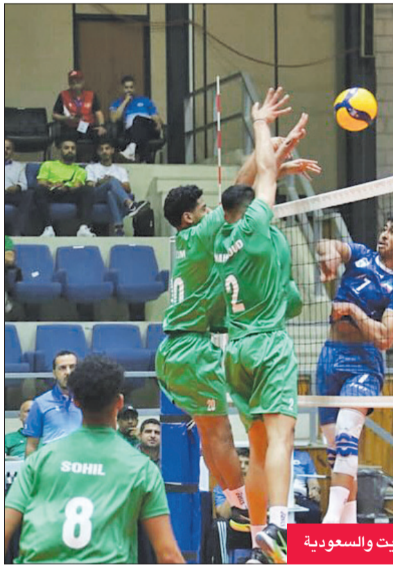
جانب من مباراة الكويت والسعودية