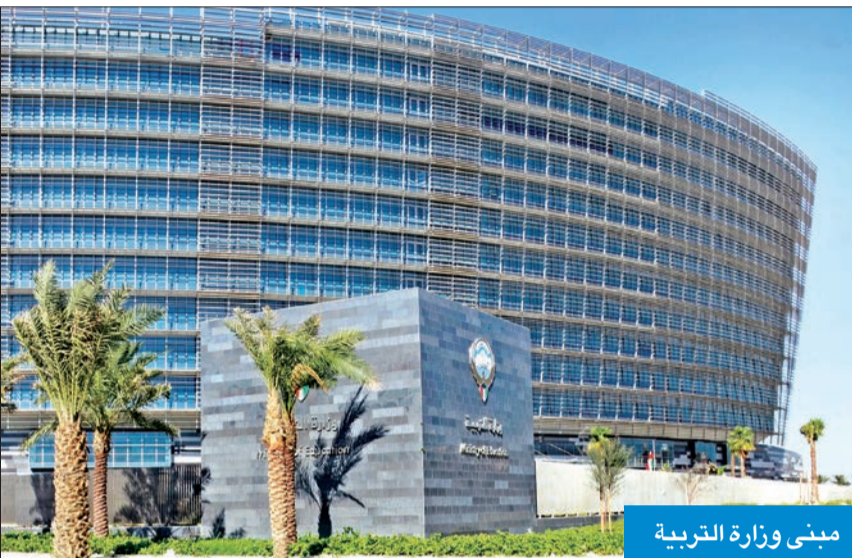
مبنى وزارة التربية

● صادرة من دول خليجية وعربية ومستنداتها مخالفة ● الوزير: ستتبعها إحالات أخرى حتى نقضي على الظاهرة