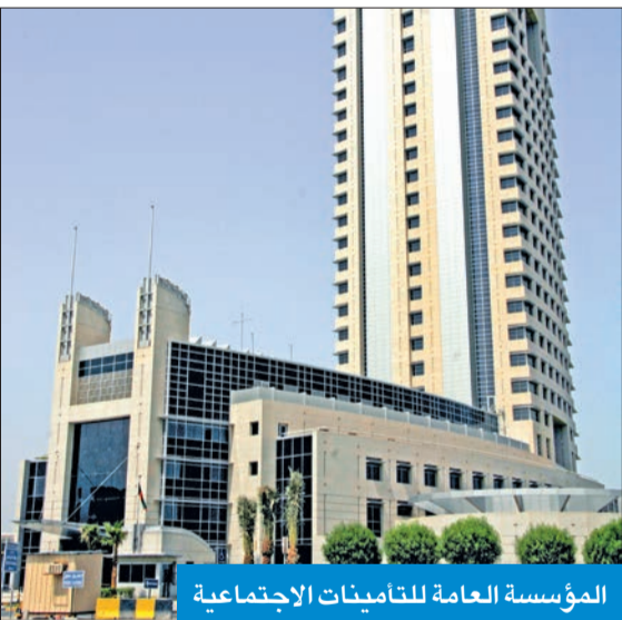
المؤسسة العامة للتأمينات الاجتماعية

استمرار استقبال المراجعين في الفترة الصباحية