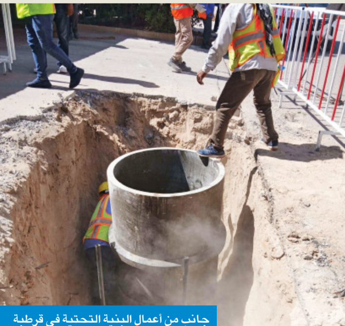
جانب من أعمال البنية التحتية في قرطبة