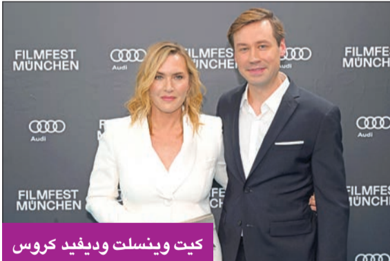
كيت وينسلت وديفيد كروس

تري نجمة هوليوود كيت وينسلت أنه يتعين على النساء أن يخبرن أنفسهن كل يوم بمدى روعتهن. وقالت الممثلة البريطانية أثناء العرض الأوروبي الأول لفيلمها الجديد «لي» (Lee) في مهرجان ميونخ السينمائي، «في المستقبل لا تضيق المزيد من طاقتك القمينة في الخجل من جسدي. لا تشككي في مظهرهن، أنتن جميعاً رائعات».