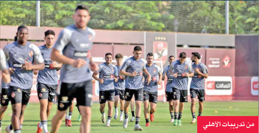
من تدريبات الأهلي

على نفس الفريق بهدف نظيف، في اللقاء الذي جمعهما ضمن مؤجلات الجولة السابعة، ويريد المارد الأحمر مواصلة انتصاراته المحلية، من أجل الضغط على فريق بيراميدز المتصدر برصيد 62 نقطة من 25 مباراة. وفي مباراة أخرى بنفس الجولة، يخوض فريق الاتحاد السكندري مباراة صعبة ضد طلائع الجيش على ملعب جهاز الرياضة، ويحتل فريق زعيم المركز العاشر برصيد 37 نقطة، بينما يحتل طلائع الجيش المركز الحادي عشر برصيد 34 نقطة. ويسعى إلى الفوز اليوم من أجل تعويض خسارته الأخيرة أمام الأهلي برباعية نظيفة.