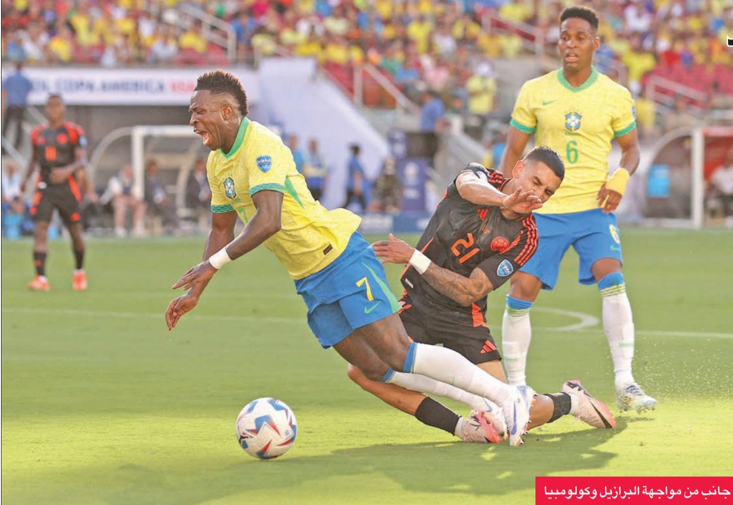
جانب من مواجهة البرازيل وكولومبيا