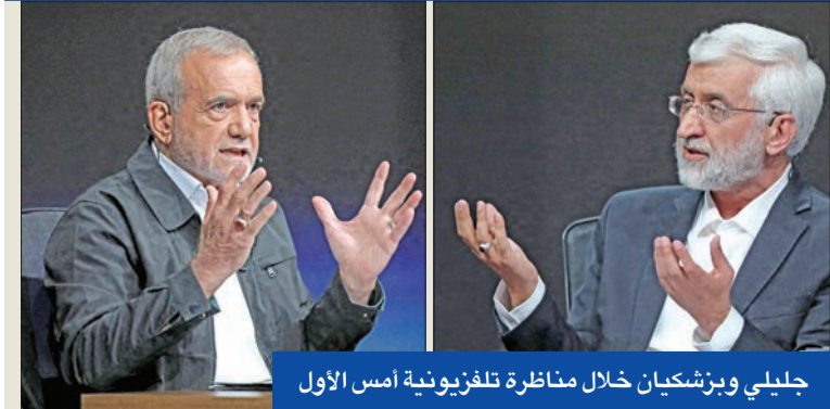
جليلي وبرزشكيان خلال مناظرة تلفزيونية أمس الأول

قال أمس إن نسبة المشاركة في الجولة الأولى (نحو 40 بالمئة)، أقل وجاءت بسبب «عدة عوامل»، وقال «من الخطأ تماماً الاعتقاد بأن أولئك الذين لم يصوتوا بالجولة الأولى هم ضد النظام».