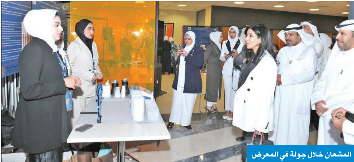
المشعان خلال جولة في المعرض

التصميم الهندسي الـ 46 بدعم من مؤسسة الكويت للتقدم العلمي ومشاركة 279 مهندساً ومهندسة من مختلف التخصصات في الكلية وبـ 69 مشروعاً هندسياً.