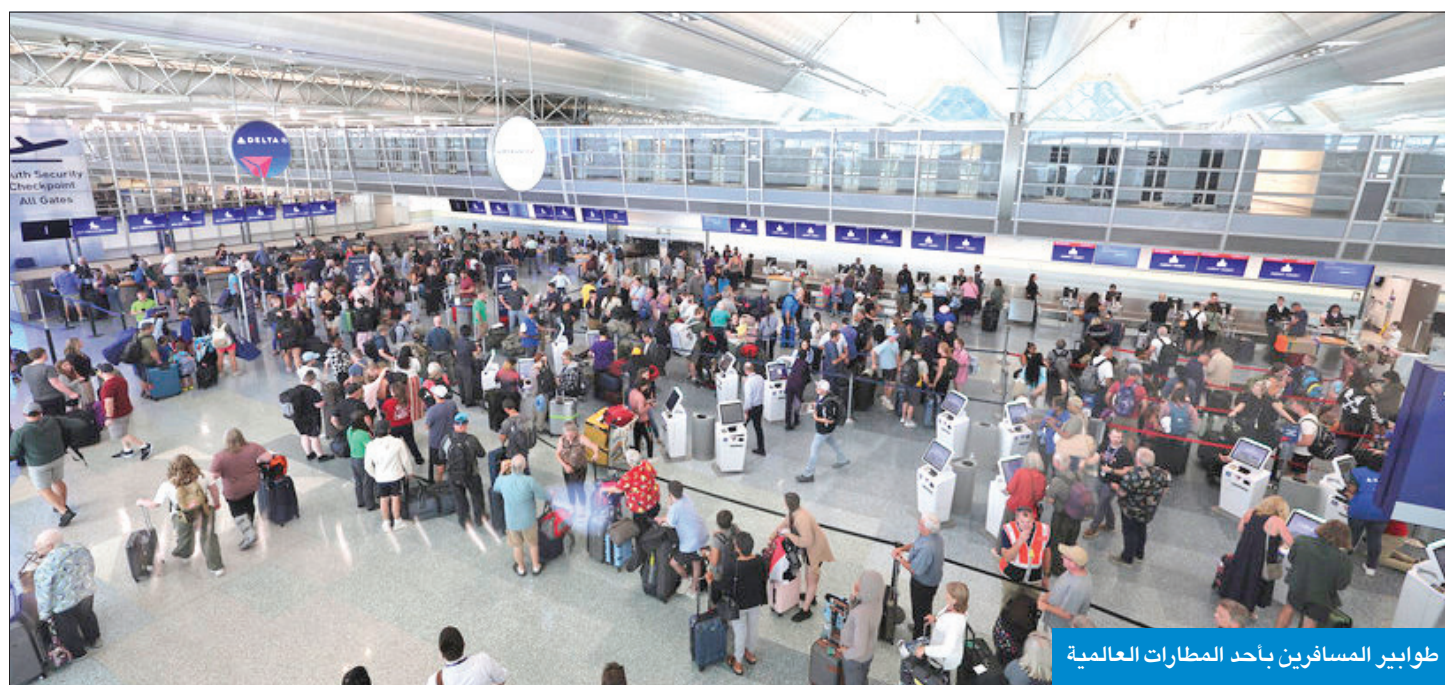
طوابير المسافرين بأحد المطارات العالمية

● العمر: غرفة عمليات مشتركة وخط ساخن لدعم جهات الدولة ومتابعة مشكلات خدمات «كراود سترايك» ● «الاتصالات» و«تكنولوجيا المعلومات» و«الأمن السيبراني» ساهمت في استمرارية كفاءة الأنظمة