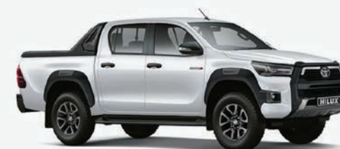
TOYOTA HILUX (MY 2024)

من رقم قاعدة: MROBU8CD7R0128452 إلى رقم: MROBU8CD7R0132519