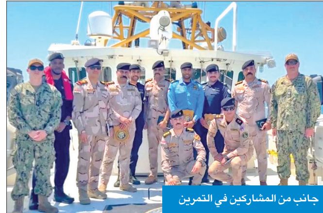
جانب من المشاركين في التمرين

عمليات القرصنة، وتهريب المخدرات، واختبار جاهزية الاتصالات البحرية، وتنفيد المناورات والتشكيلات البحرية