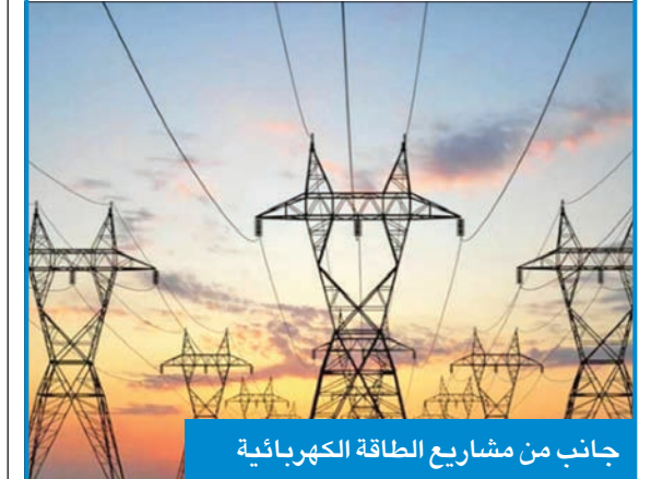
جانب من مشاريع الطاقة الكهربائية

تمضي الكويت بخطوات حثيثة في تعزيز قدرتها على تعزيز إنتاج الطاقة وتجنب البلاد مشاكل انقطاع التيار الكهربائي والقطع المبرمج في ظل التحديات الكبيرة التي تواجه أفاق الطاقة، وتسجيل أرقام قياسية في معدلات استهلاك الكهرباء. وتسارعت تلك الخطوات مع تطبيق الكويت نظام القطع المبرمج في 20 يونيو الماضي، الذي لم يستمر إلا أياماً معدودة بفعل حزمة من الإجراءات الحكومية، وتضافر الجهود لترشيد الاستهلاك.