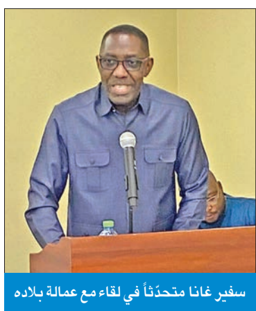
سفير غانا متحدثاً في لقاء مع عمالة بلاده

في تقديم الشكوى، والخطا الشائع هو هروب العامل من صاحب العمل إلى جهة غير معلومة، وعدم تقديم الشكوى وأسباب النزاع، مما يترتب عليه سقوط جميع مستحقاته وحقوقه.