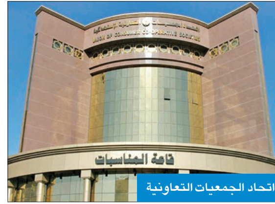
اتحاد الجمعيات التعاونية

وأوضحت أن هذه المخالفات تمثلت في: تراجع حجم السيولة، وفي عدم وجود تحسين واضح بهذا الصدد، وارتفاع أرصدة مديونية الشركات الموزعة للسلع والمواد الغذائية والاستهلاكية، وعدم التزام الجمعية بسداد هذه المستحقات في المواعيد المحددة، علاوة على تراجع معدل دوران المخزون، مما يؤكد عدم اتباع الجمعية سياسة شراء سليمة، إضافة إلى عجز في بعض الأصناف الأساسية مثل