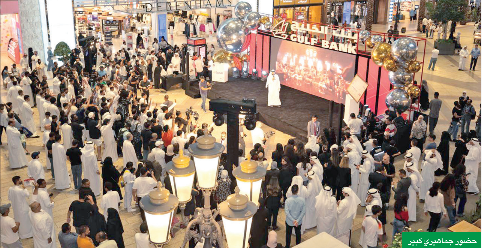
حضور جماهيري كبير