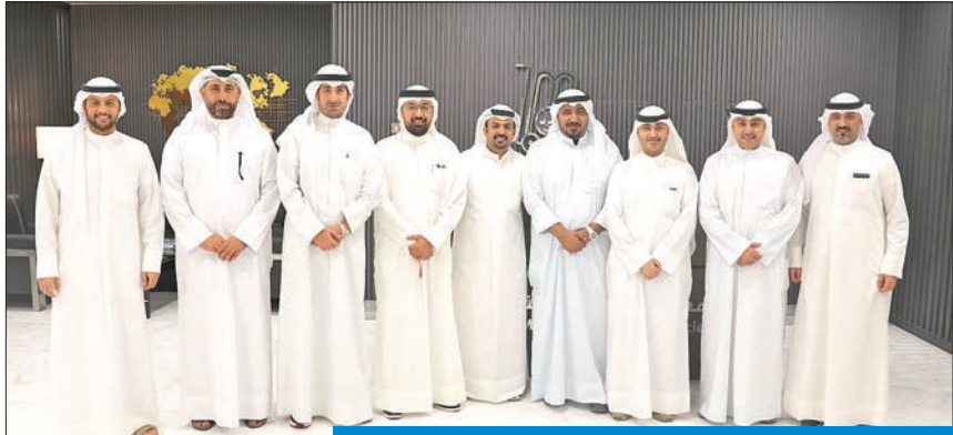
أعضاء مجلس إدارة تعاونية مشرف في لحظة تذكارية

«حققنا إنجازات خلال النصف الأول من العام رغم الصعوبات»