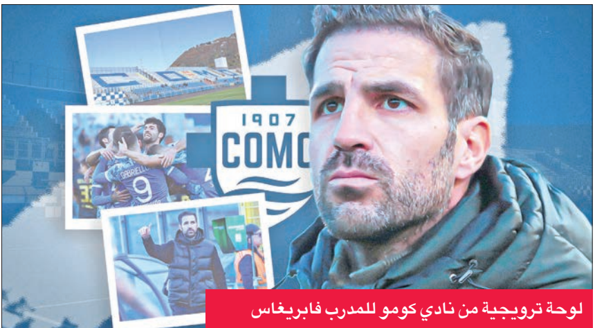
لوحة ترويجية من نادي كونمو للمدرب فابريغاس

أرسلت الإنكليزي (2004-2011)، وبرشلونة الإسباني (2011-2014)، وتشلسي (2014-2019)، وموناكو الفرنسي (2019-2022)، خلال مسيرته الكروية، قبل أن ينهيها مع كونمو الموسم الماضي.