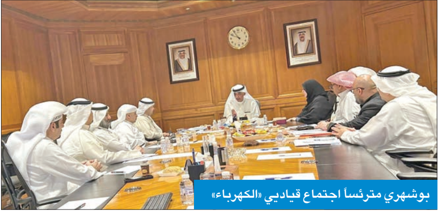
بوشهري مترئساً اجتماع قياديي «الكهرباء»

ترأس اجتماعاً مع قياديي الوزارة لمناقشة الأحمال والترشيد وتسريع المناقصات