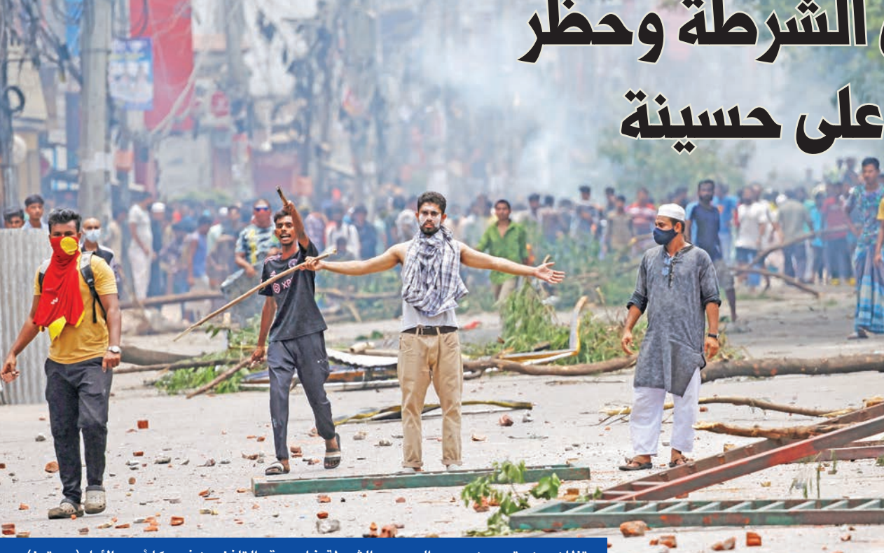
متظاهرون يتحدون حرس الحدود والشرطة خارج مقر التلفزيون في دكا أمس الأول

وفي تحدٍّ جسيم لحكومة حسينة، التي تمسك بالسلطة منذ 15 عاماً، حرق آلاف المحتجين حظر التجول، الذي دخل حيز التنفيذ منتصف ليل الجمعة/السبت، وتجمعوا في أحياء العاصمة وخارجها أمس، وذلك عادة يوم دام شهد حصار الألاف مراكز للشرطة وإحراق بعضها وتهريب معتقلين