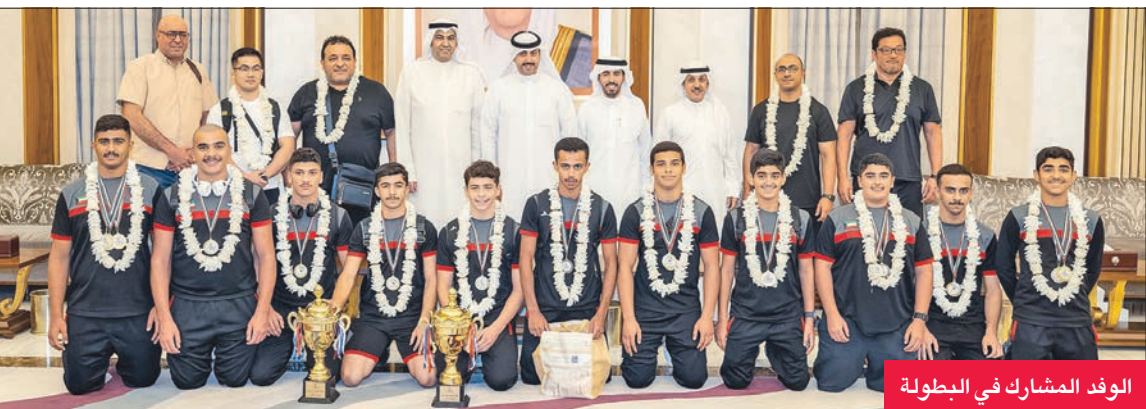
الوفد المشارك في البطولة

ويأتي هذا بعد أن حقق المنتخب الوطني المركز الأول في فردي الناشئين بتحقيقه 4 ذهبيات وفضيتين و3 برونزيات والمركز الثاني فردي فئة الشباب بتحقيقه ذهبيتين و3 برونزيات وصت إجمالاً إلى 14 قبل أن يرتفع عدد الميداليات الذهبية فقط إلى 18 ميدالية في البطولة (كونا)