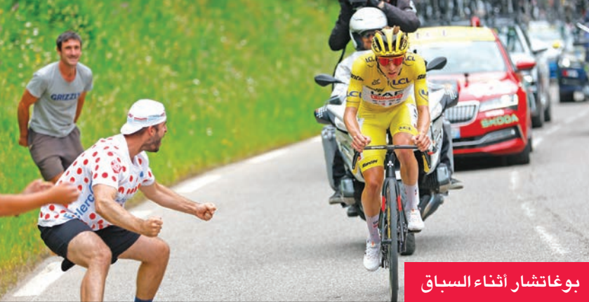
بوغاتشار أثناء السباق

أقرب السلوفيني تادي بوغاتشار (الإمارات) من استعادة لقب طواف فرنسا للدراجات الثارية، بفوزه بالمرحلة التاسعة عشرة في منتجج «إيرولا 2000» للتلزج. وهاجم بوغاتشار قبل 9 كيلومترات من النهاية (144.6 كلم)، حيث تمكن من الانفراد بالصدارة بفارق 21 ثانية عن الأمريكي ماتيو بورغسون، و40 ثانية عن البريطاني سايمون يوتيس، الذي تصدر معظم الفترات قبل أن يتجاوزه الفائز. ودفع بوغاتشار، صاحب القميص الأصفر، الفارق في صدارة الترتيب إلى 5:03 دقائق عن فيغيغارد، و7:01 دقائق عن إيفينيبول.