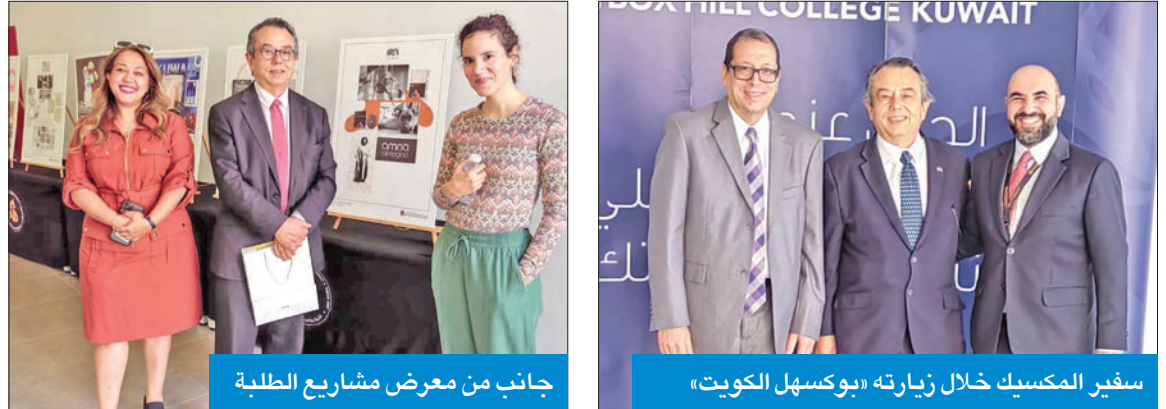
جانب من معرض مشاريع الطلبة

زار معرض التصميم الداخلي والغرافيكي لمشاريع الطلبة وأشاد بإبداعهم