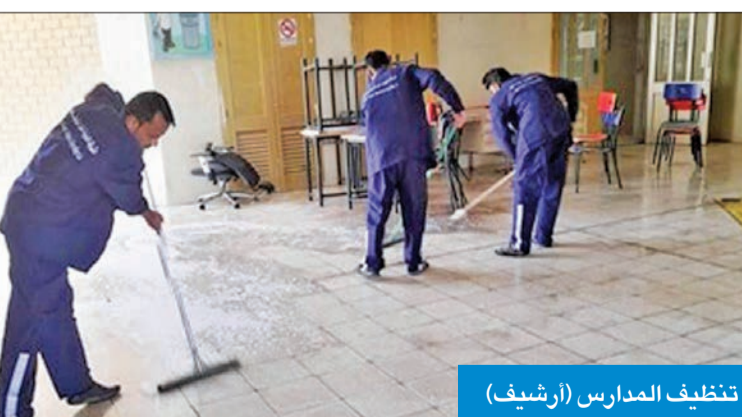
تنظيف المدارس (أرشيف)

صحافي، متابعة الأعمال الخاصة بتنفيذ الصيانة الوقائية لوحدات التكييف التي لم يتم استبدالها، إضافة إلى التكييف المركزي، وبرادات المياه، في منطقة الفروانية التعليمية قبل بدء العام الدراسي الجديد.