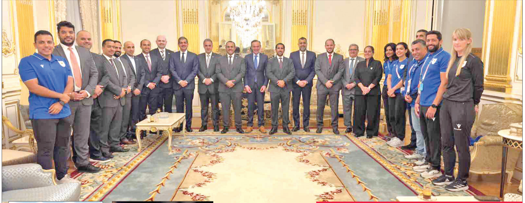
جانب من زيارة رئيس وأعضاء اللجنة الأولمبية للبيت الإماراتي