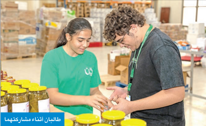
طالبان أثناء مشاركتهما

بمشاركة 53 طالباً والتعاون مع «بابسون» و«رعاية» و«الوطني» و«أجيالتي»