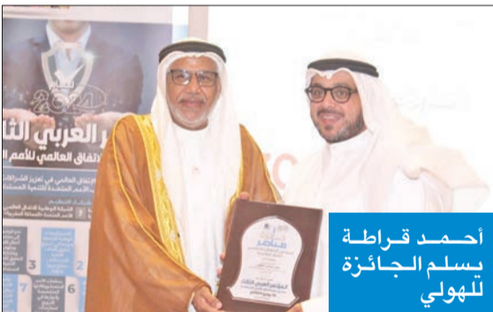
احمد قراطة يسلم الجائزة للهولي

التمكين» استعرض فيها دور جمعية المعلمين في تمكين الأفراد من خلال ما يقدم عبر الأكاديميات التابعة لها من مواد تدريبية تساهم في صنع مبادرات متنوعة تخدم المجتمع، وتعمل على تشجيع المبدعين ودعمهم وتسويق مبادراتهم للاستفادة منها، إلى جانب تنوع المسارات التي من شأنها دعم الخطة الإنمائية للدولة. وقام السراعي الفخري للمؤتمر، والنائب الثاني لرئيس مجلس النواب، والسفير الدولي للمسؤولية المجتمعية في البحرين، أحمد قراطة، بتسليم الجائزة للهولي، الذي عبّر عن اعتزازه وتقديره لحصوله على الجائزة.