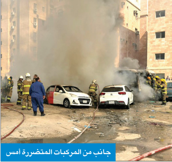
جانِب من المركبات المتضررة أمس