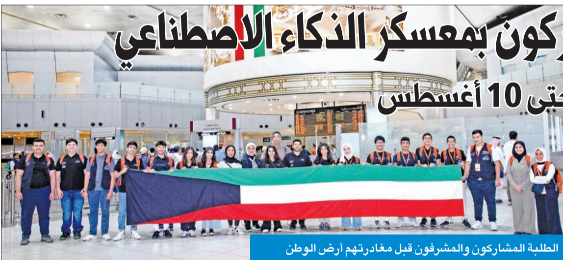
الطلبة المشاركون والمشرفون قبل مغادرتهم أرض الوطن

يقام في كوريا الجنوبية بالتعاون مع «KISTI» ويستمر حتى 10 أغسطس