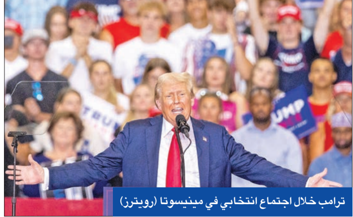
ترامب خلال اجتماع انتخابي في مينيسوتا

وفي اليوم ذاته، قالت ويتمر في برنامج تلفزيوني إنها «ليست ضمن من يتم النظر فيهم» للترشح على منصب نائب الرئيس إلى جانب هاريس. وأضافت «أحظت الجميع، بما في ذلك شعب ميتشغان، بانني ساقية حاكمة حتى نهاية ولايتي في نهاية 2026». وتوقفت هاريس عن نشاطات الحملة ومن بين المرشحين الآخرين، الذين يجري النظر فيهم حاكم كنتاكي أندري بشير، وعضو مجلس الشيوخ عن أريزونا مارك كلي، وحاكم مينيسوتا تيم والز، ووزير النقل بيت بوتيجيج.