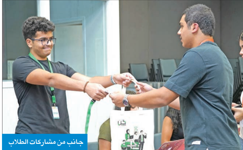
جانب من مشاركات الطلاب

للمعام التاسع على التوالي وينجاح كبير، أطلقت «لويك» بالتعاون مع كلية بابسون الأميركية الرائدة في مجال ريادة الأعمال الاجتماعية برنامج «كُن» تحت رعاية كل من بنك الكويت الوطني الراعي الاجتماعي، وشركة أجيالتي الراعي الذهبي، وشركة أجيالتي الراعي البرونزي، وبإضافة الجامعة الأميركية في الكويت، بمشاركة 53 من الطلبة، بواقع 27 طالباً و26 طالبة، حيث يُعقد البرنامج للفترة العمرية من 12 إلى 16 عاماً، ويستمر حتى 15 أغسطس المقبل.