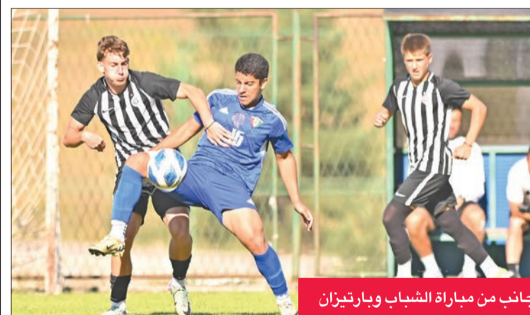
جانب من مباراة الشباب وبارتيزان

المباراة الأخيرة، ومن ثم يعود الوفد إلى الكويت في السابع من أغسطس، حيث سيتم منح اللاعبين راحة من التدريبات من 3 إلى 5 أيام، ثم يستأنفون تدريباتهم مجدداً. من جهة أخرى، يواصل الجهاز الفني مشاهدة بعض مباريات منتخبات الإمارات ولبنان وكوريا الجنوبية، التي سيواجهها في التصفيات، للوقوف على مستوياتها.