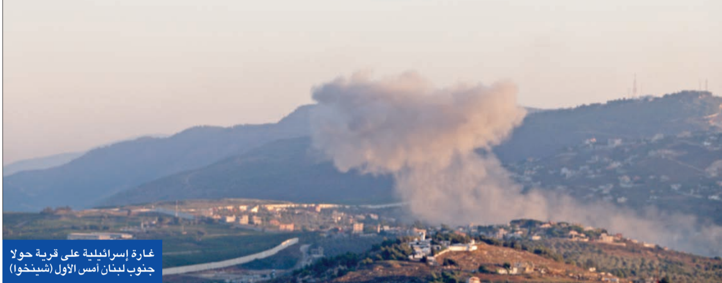
غارة إسرائيلية على قرية حولا جنوب لبنان أمس الأول