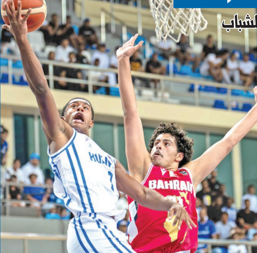
جانب من مباراة الكويت والبحرين

يُلقي في الخامسة مساءً منتخب البحرين مع نظيره العماني، يتبعها الساعة 7:30 مساءً لقاء المنتخب القطري ونظيره السعودي، فيما يخلد منتخبنا الوطني للراحة اليوم، وفق جدول البطولة.