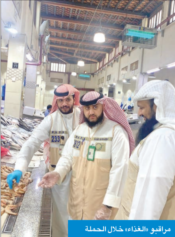
مراقبو «الغذاء» خلال الحملة