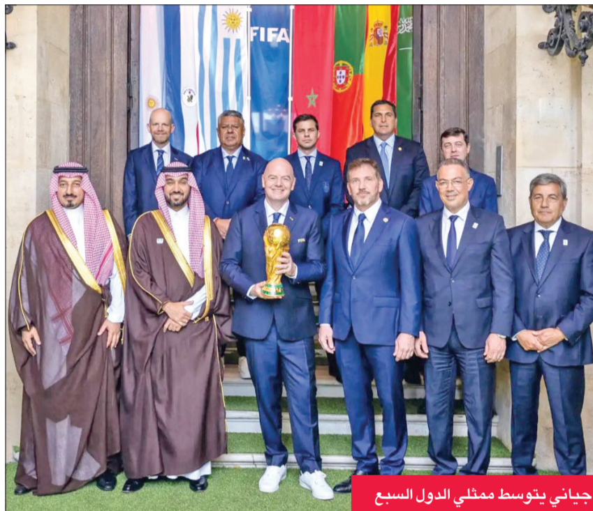
جيانى يتوسط ممثلي الدول السبع

أكد رئيس اللجنة الأولمبية الكويتية الشيخ فهد الناصر، أمس الأول، أن العلاقات الرياضية الكويتية، السعودية متينة وتزداد قوة بفضل توجيهات سمو أمير البلاد الشيخ مشعل الأحمد وخادم الحرمين الشريفين الملك سلمان بن عبدالعزيز. جاء ذلك في تصريح لـ «كونا» بعد حضور الناصر حفل استقبال اللجنة الأولمبية السعودية لرئيسها الأمير عبدالعزيز بن تركي الفيصل في العاصمة الفرنسية باريس. وقال الناصر، إن الرياضة السعودية شهدت تطوراً في الفترة الأخيرة على مختلف المستويات، مهنئاً قيادة المملكة وشعبها على استكمال جميع تفاصيل واشتراطات ملف ترشيح السعودية لاستضافة منافسات كأس العالم 2034، لتسليمه للاتحاد الدولي لكرة القدم (فيفا).