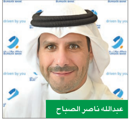
عبدالله ناصر الصباح

أعلن بنك برقان نتائجها المالية للنصف الأول المنتهي في 30 يونيو 2024، محققاً إيرادات بقيمة 111 مليون دينار، في تلك الفترة، مسجلاً نمواً ملحوظاً بنسبة 19% على أساس سنوي، وتعود الزيادة في الإيرادات بشكل رئيسي إلى ارتفاع صافي الدخل من الفوائد إلى 71 مليون دينار، أي بنسبة 17% على أساس سنوي، إلى جانب النمو القوي في الدخل من غير الفوائد بنسبة 24% على أساس سنوي ليصل إلى 39 مليوناً. كما سجل البنك تحسناً في صافي هوامش الفائدة بنحو 20 نقطة أساس على أساس سنوي، لتصل إلى 2.1% في النصف الأول من 2024 مقارنة بـ 1.9% خلال الفترة المقابلة من 2023. وأظهر بنك برقان نمواً كبيراً في الأرباح التشغيلية بنسبة 24% على أساس سنوي، لتصل إلى 48 مليون دينار، وإيضاً شهد البنك تحسناً في نسبة التكلفة إلى الدخل بمقدار 170 نقطة أساس من 58.3% في النصف الأول من عام 2023 إلى 56.6% في النصف الأول من عام 2024. كما ظلت تكلفة الائتمان (بعد خصم المبالغ المستردة) عند مستوى منخفض جداً بلغ 30 نقطة أساس فقط خلال النصف الأول من 2024 على الرغم من المحضضات الاستباقية. ونتيجة لذلك، شهد صافي أرباح البنك نمواً بنحو 17% على أساس سنوي مسجلاً 21 مليون دينار. وخلال النصف الأول من عام 2024، أظهر البنك نمواً كبيراً في الأصول بنسبة بلغت 8% على أساس سنوي، لتصل إلى 7.6 مليارات دينار، كما في نهاية النصف الأول.