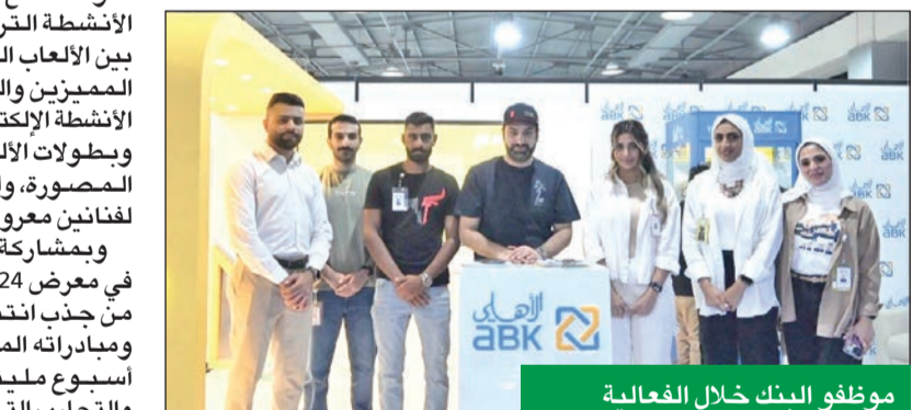
موظفو البنك خلال الفعالية

المبتكر للترويج لحساب الطالب +A. وأضافت معرفي: «وجدونا في الفعالية يؤكد التزامنا بالتواصل مع فئة الشباب، وتعريفهم بالمزاي