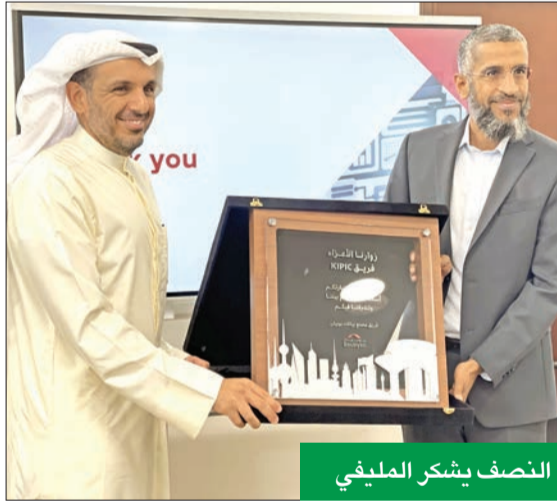
النصف يشكر المليفي

في المقر الرئيسي لمصنع البيانات لتبادل الأفكار والخبرات حول نشر ثقافة البيانات