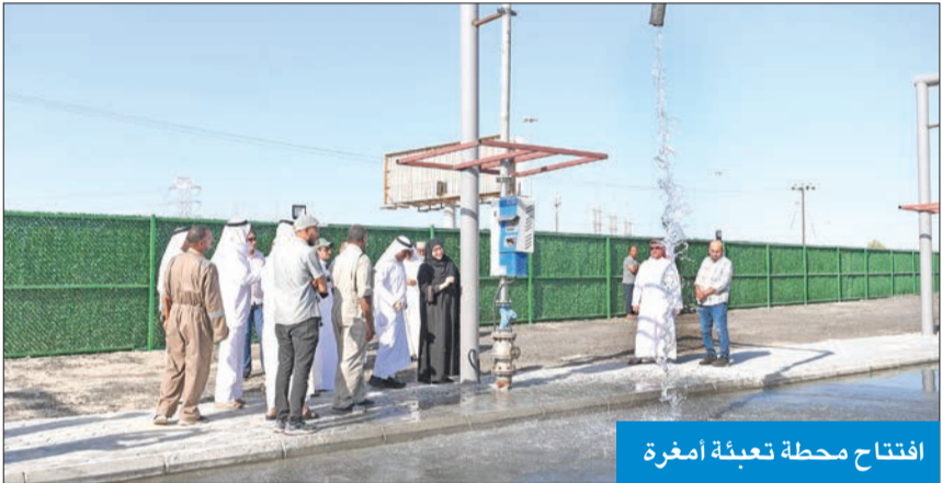
افتتاح محطة تعبئة أمغرة

تفتتح وزارة الكهرباء والماء والطاقة المتجددة، صباح اليوم الأربعاء، محطة تعبئة المياه العذبة في منطقة جنوب المطلاع السكنية، بالموقع رقم «3»، التي تم تنفيذها لتوفير المياه لأهالي المنطقة، وتخفيف الضغط عن محطة تعبئة الجهراء، في ظل ارتفاع الطلب على المياه العذبة مع سكن العديد من العائلات في المنطقة.