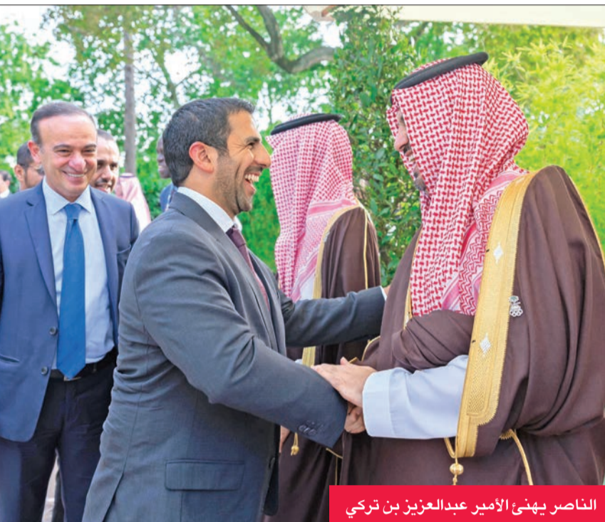
الناصر يهنئ الأمير عبدالعزيز بن تركي

إنفانتينو: نشر تقييم العروض على الموقع الإلكتروني لـ «فيفا»