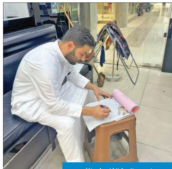
رصد إحدى المخالفات في الأحمدية