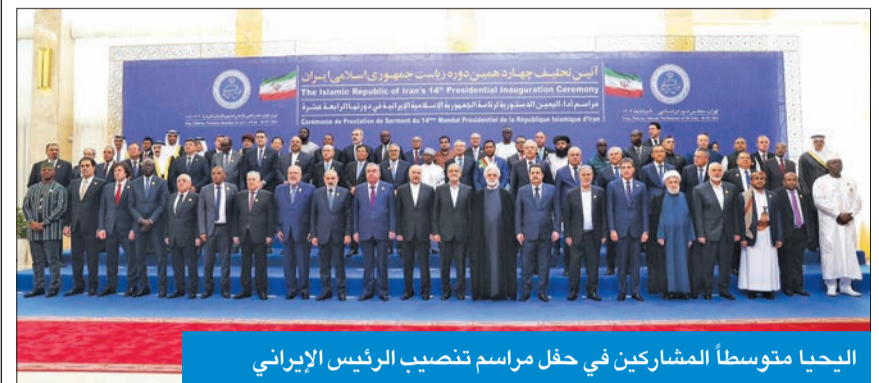
اليحيا متوسطاً المشاركين في حفل مراسم تنصيب الرئيس الإيراني

نقل تحيات القيادة السياسية وحكومة وشعب الكويت إلى برزكيان