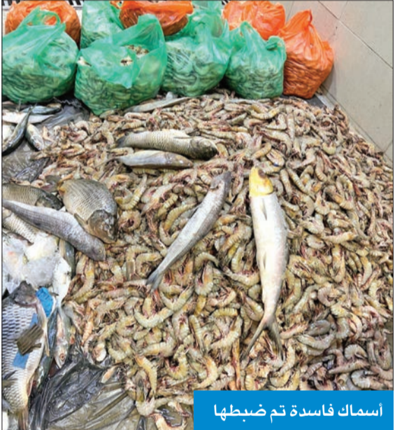
أسماك فاسدة تم ضبطها

وأشار إلى أن الحملات أسفرت أيضاً عن تحرير مخالفات تداول أغذية مغنوشية، وعدم وجود بطاقة بيانات غذائية على المواد الغذائية والأسماك التي تم ضبطها، وتم تحرير محضر ضبط مخالفة واتلاف، كما تمت مخالفة محلات لعدم الالتزام بقواعد النظافة العامة أثناء العمل، لوجود حشرات حية في مواقع الأظعمة. وأفاد بان ما تم ضبطه من أسماك فاسدة داخل سوق المباركية والأسواق المجاورة لها بلغ 377 كيلوغراماً، مؤكداً استمرار حملات التفتيش على مدار الساعة، من خلال نظام النوبات، وأوضح أن