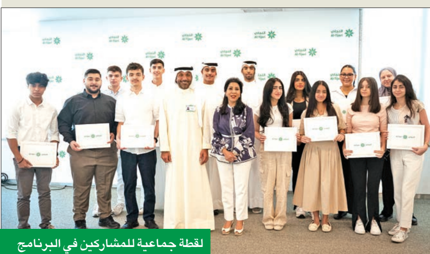
لقطة جماعية للمشاركين في البرنامج

كل الإمكانيات للمتدربين، لتحقيق الاستفادة القصوى. وأضاف صادق: «بعد (التجاري) أحد البنوك الرائدة في استقطاب الطلاب والطالبات من مختلف الجامعات والمدارس لتدريب، ويعكس ذلك التجارب الفريدة والفرص الواعدة التي يقدمها للمتدربين بمختلف تخصصاتهم».