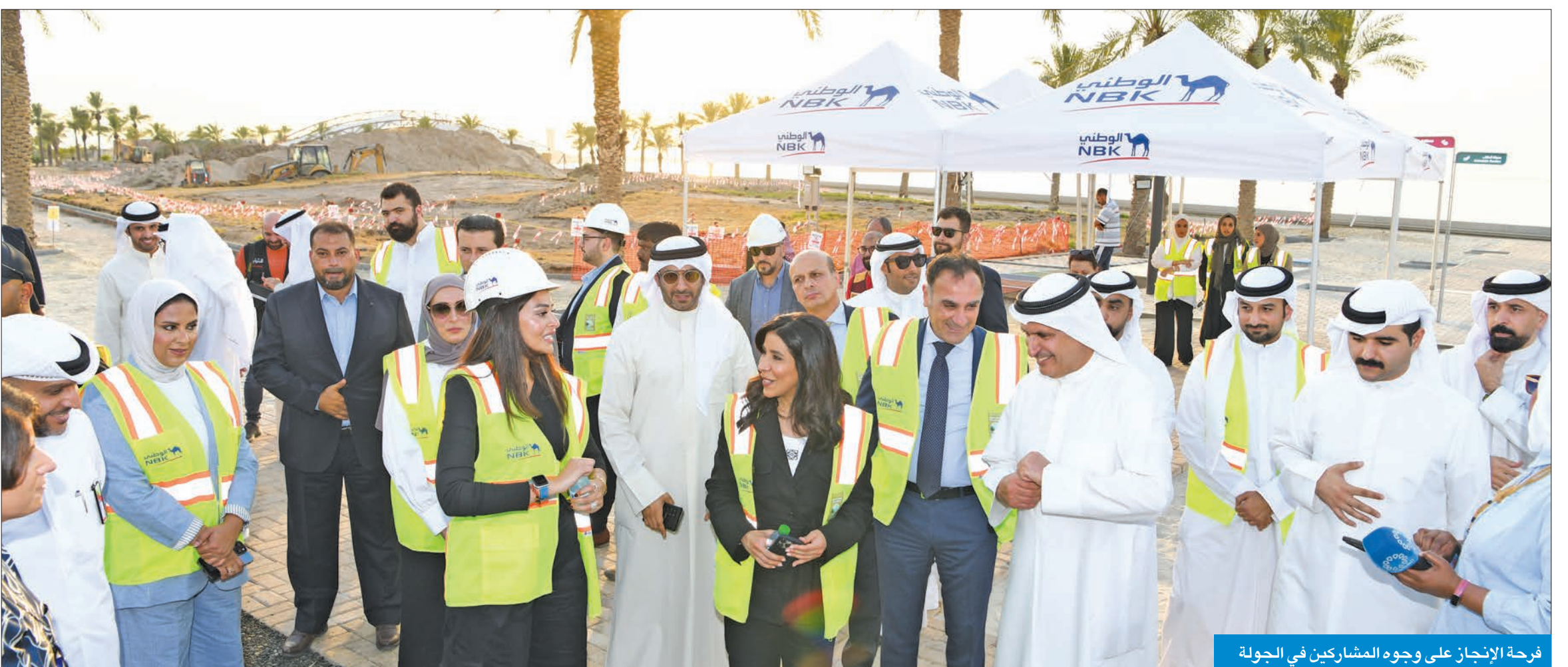
فرحة الإنجاز على وجوه المشاركين في الجولة

وأوضحت بوشهري أن الوزيرة المشعان وفريق من البلدية شاركوا في جولة بالمشروع، ما يؤكد دعم البلدية للتعاون بين القطاع الخاص والحكومة، خصوصاً في مجال المشاريع التنموية، وكاشفة عن العديد من المبادرات المماثلة التي تقدمت بها شركات البلدية. ووجهت الشكر إلى البنك الوطني على دعمه لمشروع تطوير شاطئ الشويخ، لافتة إلى أن المشروع سيقام على مساحة 1.7 كيلومتر، وتمتد مرحلة أعداده وتنفيذه إلى 17 شهراً، وتنقسم إلى مرحلتين: الأولى منها للتصميم ومدتها 5 أشهر، والأخرى للتنفيذ ومدتها 12 شهراً.