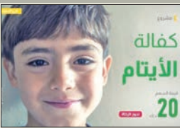
كفالة الأيتام 20

أطلقت جمعية إحياء التراث الإسلامي مبادرة إنسانية كويتية تهدف إلى مساعدة الأيتام واليتيمات داخل الكويت، وسد حاجتهم، لإدخال السرور على قلوبهم. وأوضحت الجمعية، في بيانها، أنه يجوز دفع الكفالة لمشروع كفالة الأيتام حسب فتاوى العلماء، كما يمكن المساهمة فيه من أموال الصدقة والتبرعات العامة، خصوصاً أنه من المشاريع المهمة جداً، نظراً للحاجة الماسة إليه.