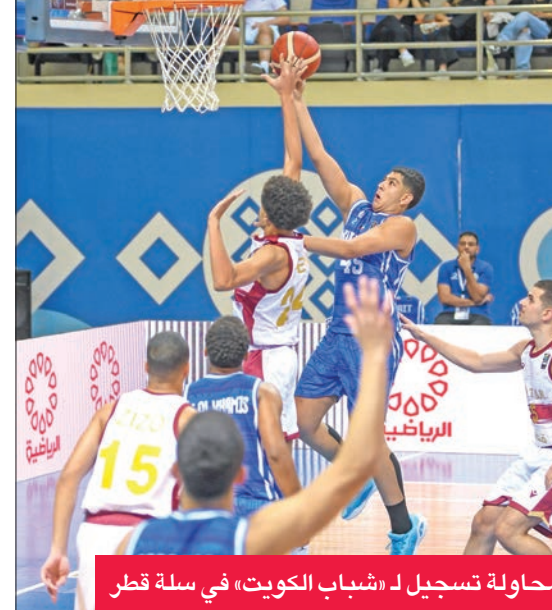
محاولة تسجيل لـ «شباب الكويت» في سلة قطر

وكان منتخب الكويت خسر أمام قطر بنتيجة 60-79 في المباراة التي جمعتهما أمس الأول، ضمن منافسات الجولة الثانية التي شهدت أيضاً خسارة المنتخب السعودي أمام البحرين 94-97.