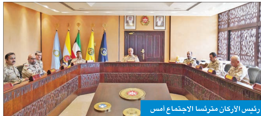
رئيس الأركان مترئساً الاجتماع أمس