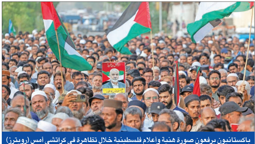
باكستانيون يرفعون صورة هنية وأعلام فلسطينية خلال تظاهرة في كراتشي أمس

تنديد عربي وإسلامي... وأردوغان يعزي عائلة هنية ويدعو عباس لإلقاء كلمة بالبرلمان