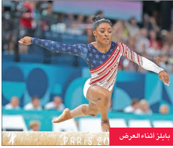
بايلز أثناء العرض

باريس، بفوزه على الألماني دومينيك كوييفر 5-7 و3-6 أمس (الأربعاء) في الدور الثالث على ملاعب رولان غاروس. ويُعد ديوكوفيتش باللعب الأولمبي الوحيد الذي يغيب عن سحله القياسي من الألقاب. وبات ديوكوفيتش أول لاعب يبلغ ربع نهائي المسابقة في الألعاب الأولمبية 4 مرات، بعدما نال برونزية بكن 2008، وحل رابعاً في لندن 2012، وطوكيو 2021، وخرج من الدور الأول في 2016.