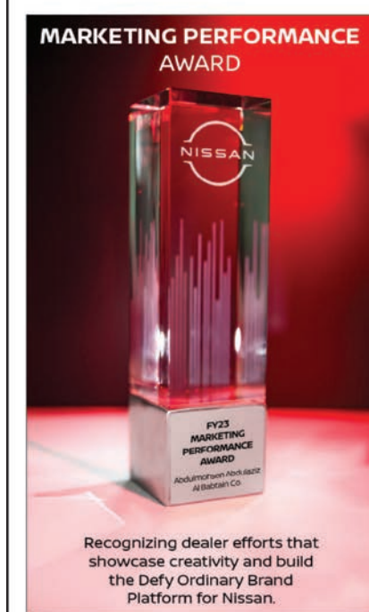
Recognizing dealer efforts that showcase creativity and build the Defy Ordinary Brand Platform for Nissan.

في السنوات الأخيرة، واجهت شركات بيع السيارات العديد من التحديات، مع تقلب الظروف الاقتصادية وتغير تفضيلات المستهلكين، مما أدى إلى انخفاض ملحوظ في المبيعات، وكان هذا واضحا بشكل خاص في الكويت. لذلك تعاملت نيسان الباطين مع هذه التحديات بشكل مباشر، من خلال نهج تسويقي مدروس، وذلك من خلال الاستفادة من الرؤى المستندة إلى البيانات، وتبني التحول الرقمي، وتعزيز المبادرات التي تركز على العملاء، مما أدى إلى النجاح في عكس اتجاه الانكماش في المبيعات وإعادة تنشيط وجودهم في السوق.