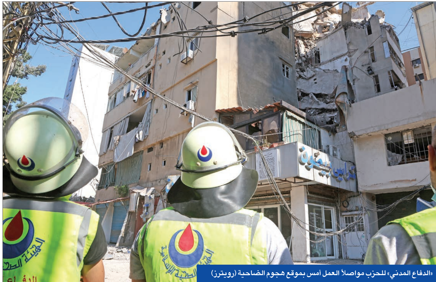
«الدفاع المدني» للحزب مواصلا العمل أمس بموقع هجوم الضاحية

بيروت - منير الربيع دخلت منطقة الشرق الأوسط مرحلة أكثر دقة وخطورة منذ عملية طوفان الأقصى في 7 أكتوبر 2023، واختار رئيس الوزراء الإسرائيلي بنيامين نتانياهو السير على حافة الحرب الإقليمية بتنفيذ ضربتين عسكريتين ذات طابع استخباري مرتفع في قلب الضاحية الجنوبية لبيروت لاغتيال المسؤول العسكري الأرفع في «حزب الله»، فؤاد شكر، وفي قلب طهران لاغتيال رئيس المكتب السياسي لحركة حماس، إسماعيل هنية، متجاوزاً كل الخطوط الحمر وجميع الوساطات التي تقودها جهات غربية وأميركية بالتحديد لتجنب استهداف المدن السكنية المكتظة، لا سيما الضاحية التي أعلنتها الحزب اللبناني خطاً أحمر أبلغ الوطاء أنه بحال تم تجاوزه سيصعد وتيرة عملياته، وهو بذلك يبدو أنه يستعد لرد عنيف.