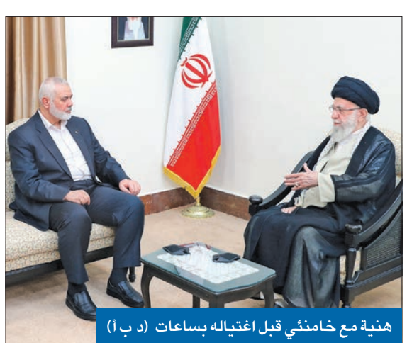
هنية مع خامنئي قبل اغتياله بساعات

هجوم أميركي على «الحشد» بالعراق... والاحتلال يستهدف قيادياً إيرانياً في سورية