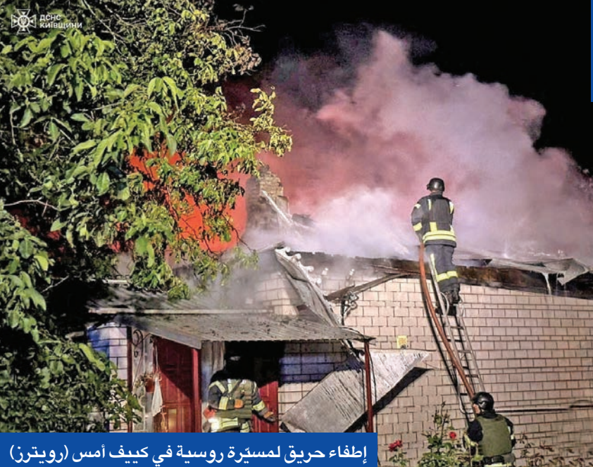
إطفاء حريق لمسيّرة روسية في كييف أمس

الحق أضراراً بأسقف ونوافذ وواجهات 13 مبنى سكنيا في المنطقة. كما أعلنت هيئة الأركان العامة الأوكرانية أنه في أعقاب هجوم أوكراني على منطقة كورسك الحدودية، نشب حريق في مستودع روسي للأسلحة، مضيفاً أنه تم تنفيذ الهجوم باستخدام نظام صاروخي بحري أوكراني معدل من طراز نيتون، الذي يصل مداه إلى 300 كيلومتر.