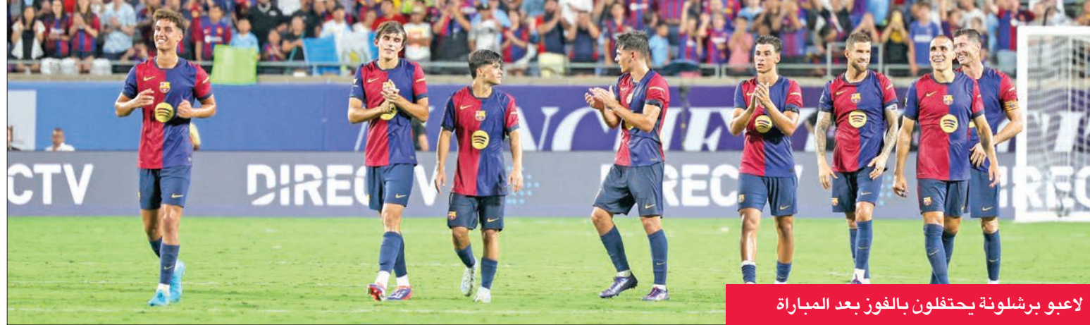
لاعبو برشلونة يحتفلون بالفوز بعد المباراة

وسيطر الكرواتي الدولي ماتيو كوفاتشيتش، في أول مباراة له أساسياً في جولة سيتي الأميركية، على كرة ضائعة، واندفع بالكرة قبل تمريرها إلى الجناح الأيسر الإنجليزي غريليش الذي تجاوز أحد المدافعين وسدد كرة رائعة بقدمه اليسرى من زاوية شديدة برشلونة إلى داخل المرمى. وسيواصل برشلونة جولته الأميركية بمبارتين تحضيريتين للموسم الجديد أمام مواطنه ريال مدريد وميلان الإيطالي، وسيختم سيتي، الذي خسر مباراتين سابقتين في الولايات المتحدة أمام سلتيك الإسكتلندي وميلان، الجولة الأميركية بمواجهة مواطنه تشلسي السبت في كولومبوس بولاية أوهايو.