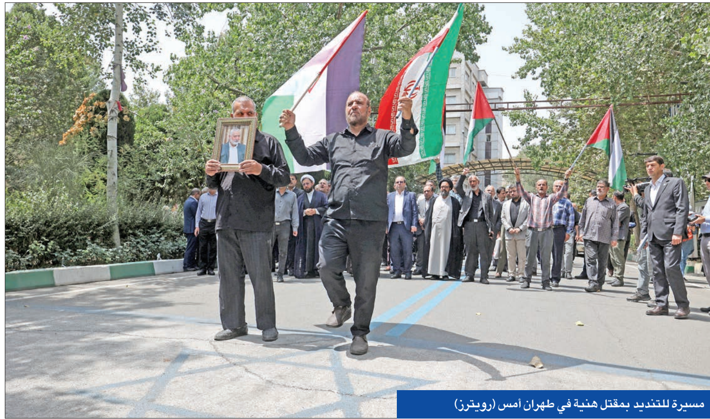
مسيرة للتبديد بمقتل هنية في طهران أمس

في احتراق أمني ومعنوي كبيرين، اغتالت إسرائيل رئيس المكتب السياسي لحركة حماس في قلب طهران، في حين توعد المرشد الأعلى علي خامنئي بالتأثر له.