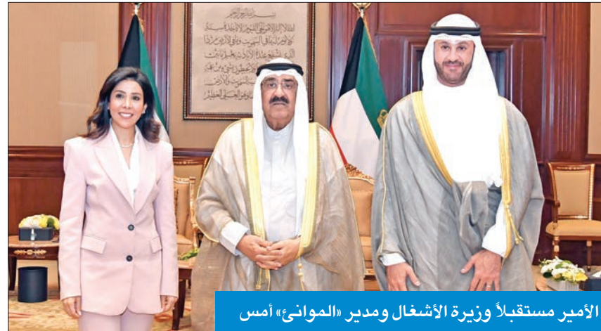
الأمير مستقبلاً وزيرة الأشغال ومدير «الموائ» أمس

استقبل سمو أمير البلاد الشيخ مشعل الأحمد بقصر بيان صباح أمس، وزيرة الأشغال العامة ووزيرة الدولة لشؤون البلدية، الدكتورة نورة المشعان، حيث قدمت لسموه المدير العام لمؤسسة الموائ الكويتية، الشيخ خالد سالم الصباح، بمناسبة تعيينه في منصبه الجديد.