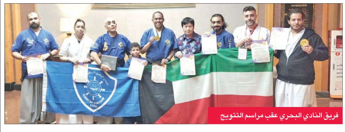
فريق النادي البحري عقب مراسم التتويج

البطولة الخاصة برياضة مهارات الفنون القتالية والمهارات الفنية العالية والسريعة باستخدام السيف.