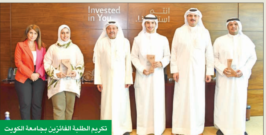
تكريم الطلبة الفائزين بجامعة الكويت

فيما يخص تسليم الحقائق. أما المشروع الثاني، فكان بعنوان «تصميم نظام تخزين ثاني أكسيد الكربون»، والذي يهدف إلى تقديم حلول لتغيير المناخ.