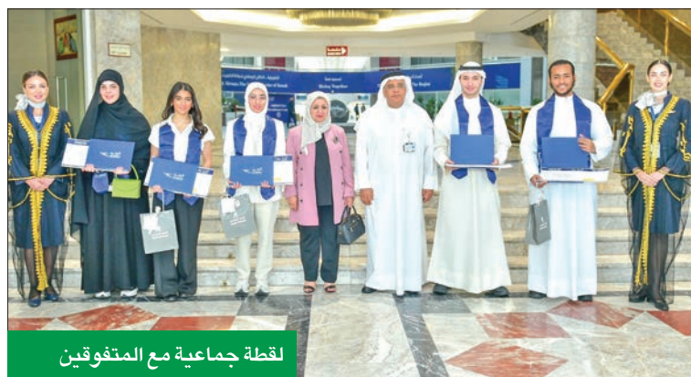
لقطة جماعية مع المتفوقين

حصلت وجبات الطيران الكويتية لخدمات الطيران (كاسكو)، على المركز الأول على مستوى العالم كأفضل وجبات طيران لعام 2023، ضمن دراسة قام بها موقع Money Supermarket البريطاني، حيث حصلت شركة الخطوط الجوية الكويتية على المركز الأول في العالم بمستوى وجبات الطيران التي تقدمها «كاسكو»، بـ 8.58 نقاط، كأفضل وجبات تقدم على الطائرات على مستوى العالم. وأشاد محمد العنزي رئيس مجلس إدارة الشركة الكويتية لخدمات الطيران بالإنجاز الكبير الذي حققته الشركة، بحصولها على المستوى الأول عالمياً، بما يعكس حجم الجهود المبذولة لارتقاء بالخدمات التي تقدمها الشركة. وقد صرّح عبدالرحمن الكندري، الرئيس التنفيذي لـ «الكويتية لخدمات الطيران»، الذي