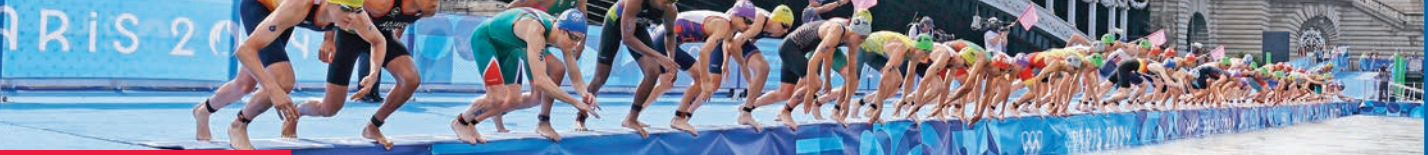
جانب من انطلاق مسابقة الترياثلون على نهر السين

بعدما حدثت ابنة الـ27 عاماً فارقاً في القسم الأخير من سباق الجري، متقدمة في النهاية على السويسرية جولي ديرون والبريطانية بيت بوتزلر اللتين نالتا الفضية والبرونزية تالياً. وانتهت بوغران المسابقة الثلاثية التي تتضمن السباحة والدراجات الهوائية والجري، في 1:54.55 ساعة، في حين سجلت ديرون 1:55.01 س وبوتر 1:55.10 س. وعند الرجال، حيث بدأت المسابقة على المسرح