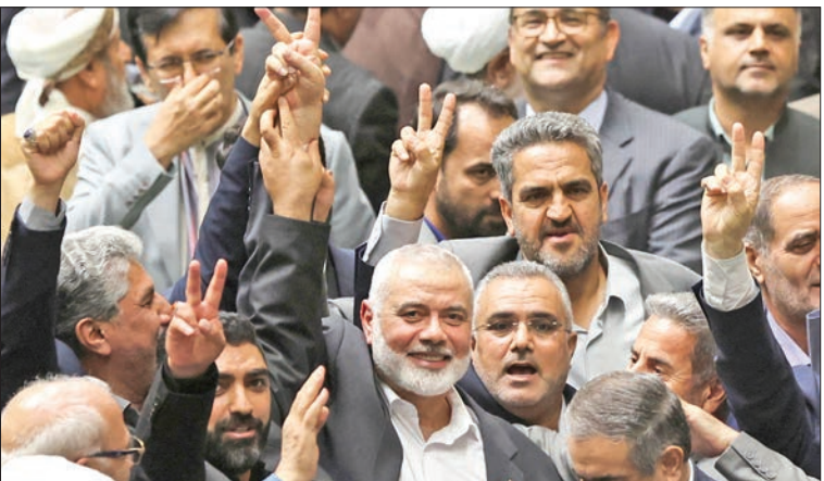
هنية يرفع علامة النصر بأخر ظهور علني له في طهران أمس الأول

هنية بأخر تصريحاته: «يحيي ويميت سبحانه وتعالى وهذه أمة خالدة ومتجددة»