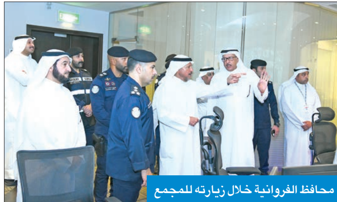
محافظ الفروانية خلال زيارته للمجمع

تفقد «الحكومة مول» والحالة الأمنية بجمع الأفيوز