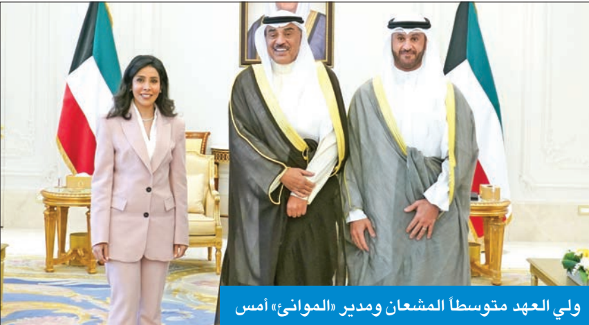
ولي العهد متوسلاً المشعان ومدير «الموائ» أمس

استقبل سمو ولي العهد، الشيخ صباح الخالد بقصر بيان، أمس، وزيرة الأشغال العامة ووزيرة الدولة لشؤون البلدية، الدكتورة نورة المشعان، حيث قدمت لسموه المدير العام لمؤسسة الموائ الكويتية، الشيخ خالد سالم الصباح، بمناسبة تعيينه في منصبه الجديد.