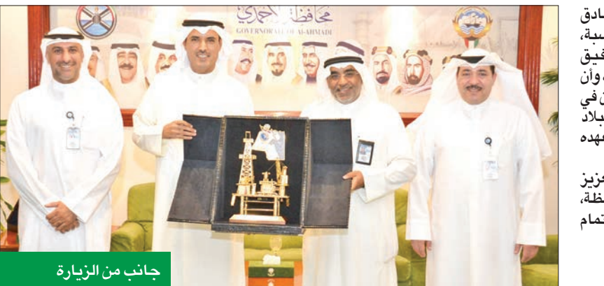
جانب من الزيارة

بالوكالة، خالص التهاني وصادق التمنيات للمحافظ بهذه المناسبة، متمنين لشخصه الكريم التوفيق والسداد في مهام منصبه الجديد، وأن يكون النجاح حليفه لخدمة الوطن في ظل القيادة الحكيمة لسمو أمير البلاد الشيخ مشعل الأحمد، وسمو ولي عهده الأمين الشيخ صباح الخالد.