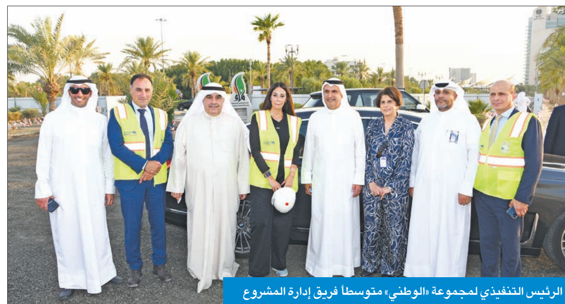
الرئيس التنفيذي لمجموعة «الوطني» متوسطاً فريق إدارة المشروع

يحتوي مشروع تطوير وتجميل شاطئ الشويخ على المناطق التالية: المنطقة الأولى: تتضمن ملاعب رياضية ومناطق ترفيهية ومساحات خضراء واسعة، تسمح بممارسة الأنشطة الخارجية،