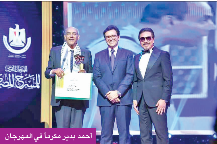
أحمد بدير مكرماً في المهرجان

وقال رئيس المهرجان الممثل محمد رياض: «لنتلقى مجدداً حاملين أحلاماً وطموحات كثيرة لهذا المهرجان بصفة خاصة، والمسرح المصري بصفة عامة، ساعين إلى أن يكون المهرجان ساحة للنقاش والتقاء المدارس المسرحية بكل أطيافها، من خلال مشاهدة العروض وحضور الندوات الفكرية والورش المسرحية بجميع تخصصاتها».