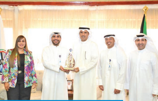
درع تذكارية من محافظ الأحمدى لمسؤولي البنك

استقبل عدداً من قياديي البنك لتهنئته بنبيل ثقة القيادة السياسية