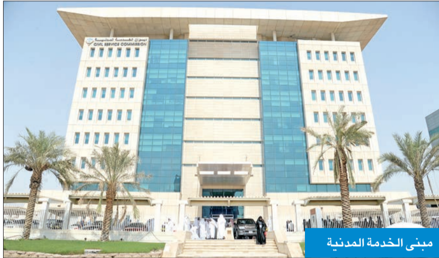
مبنى الخدمة المدنية

إلزام الموظف بإجراء «إثبات الدوام» خلال 60 دقيقة بعد انقضاء ساعتين من بداية دوامه