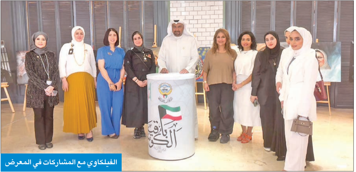
الفيلاكو في المعرض