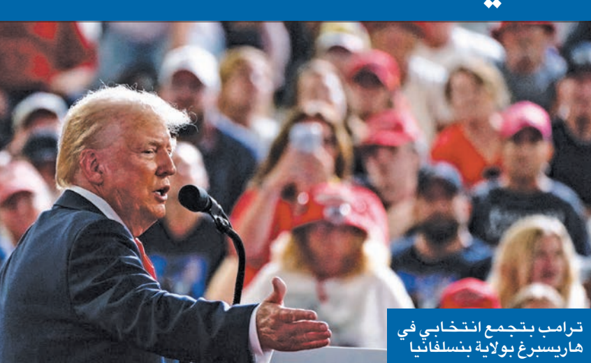
ترامب بتجمع انتخابي في هاريسبرغ بولاية بنسلفانيا