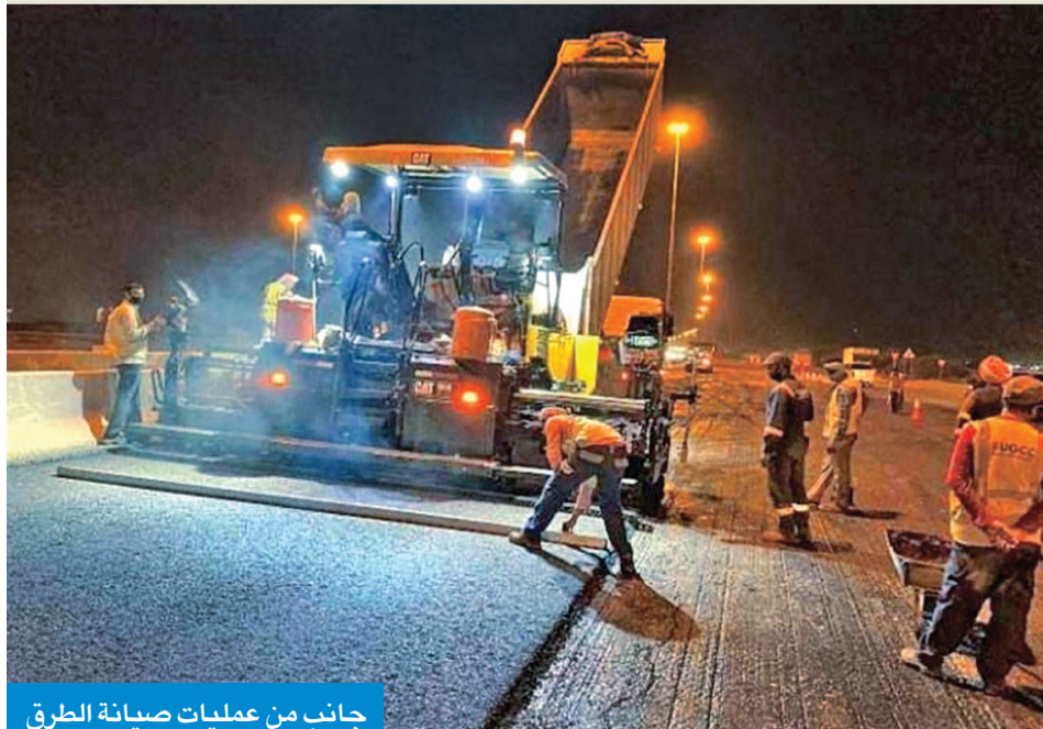
جانب من عمليات صيانة الطرق

عقداً لصيانة الطرق في المحافظات، بواقع عقدين لكل محافظة، إضافة إلى 6 عقود لصيانة الطرق السريعة، وقامت الوزارة بمخاطبة الجهاز المركزي للمناقصات العامة لأخذ موافقته على طرح وثائق تلك المناقصات. في سياق متصل، بينت المصادر أن الوزارة تقوم كذلك خلال الفترة الحالية بالرد من بعض التخلفات التي وردت من بعض الشركات للجنة المناقصات حول مشروع أعمال الدراسة والتصميم التفصيلي وإعداد مستندات مناقصة السكة الحديد «المرحلة الأولى»، وأكدت الوزارة حرصها على تذييل كل العراقيل التي يمكن أن تواجه تنفيذ المشروع، في ظل كونه أحد الشرايين البرية الحيوية التي تدعم رؤية الدولة في تحقيق التنمية الاقتصادية للبلاد.