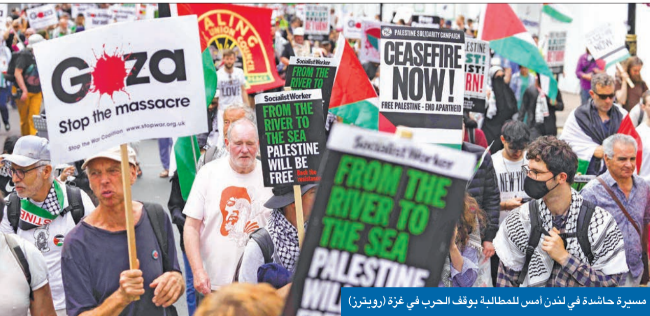
مسيرة حاشدة في لندن أمس للمطالبة بوقف الحرب في غزة

الوفد أبلغ إيران بفتح نافذة لـ «رد يحفظ ماء الوجه» بعد صاعقة هنية وحذرهما من «فخ الانتقام» إدارة بايدن أمدت الإيرانيين بقائمة عملاء لـ «الموساد» ودعتهم إلى تفاهم نووي يُغضب تل أبيب الأجهزة الأمنية توقف 30 إيرانياً و50 أجنبياً بتهمة التورط في اغتيال القيادي الفلسطيني