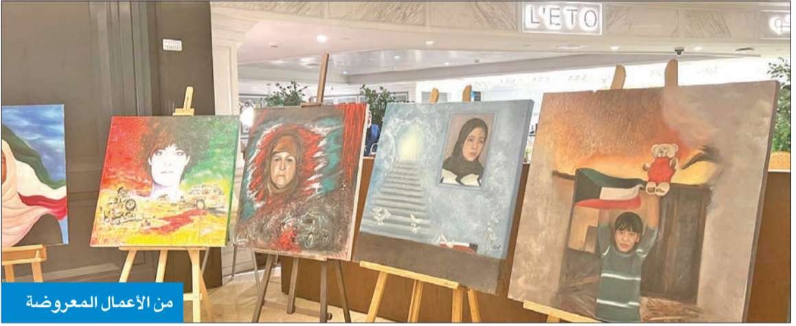
من الأعمال المعروضة

خلال معرض تشكيلي بالتعاون بين نقابة الفنانين ومكتب الشهيد