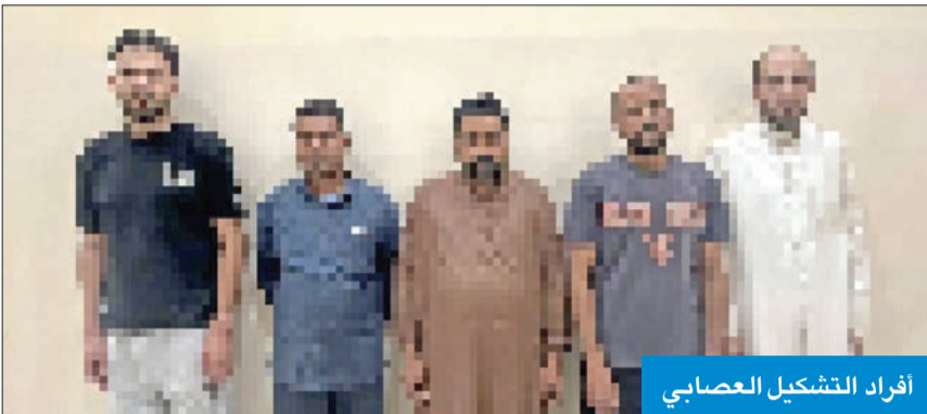
أفراد التشكيل العصابي

حدد تسعيرة 500 دينار للتحويل الداخلي و2000 للاستقدام من الخارج... وسجل 600 عامل هامشي