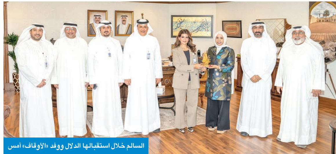
السالم خلال استقبالها الدلال ووفد «الأوقاف» أمس

السالم استقبلت الدلال وأنشأت دور الأمانة في دعم الأعمال الخيرية