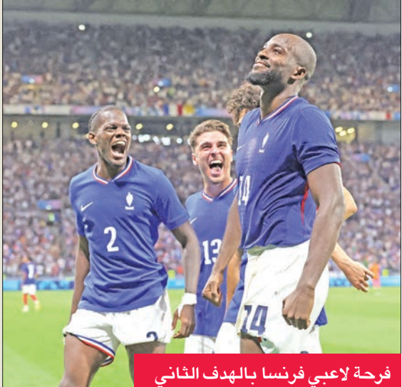
فرحة لاعبي فرنسا بالهدف الثاني

أنهت إسبانيا الوصيفة وفرنسا المضيفة المشوار الرائع للمنتخبين العربيين المغربي والمصري في دور الأربعة، عندما تغلبتا عليهما 1-2 و3-1 بعد التمديد توالياً.