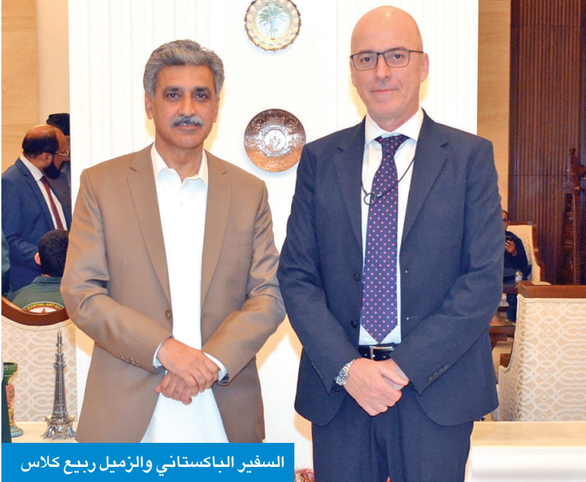
السفير الباكستاني والرئيس ربيع كلاس

فاروق لـ الجريدة: مهمني بالكويت لا تنسى وأنا حزين للمغادرة وكنت أرغب في البقاء مدة أطول