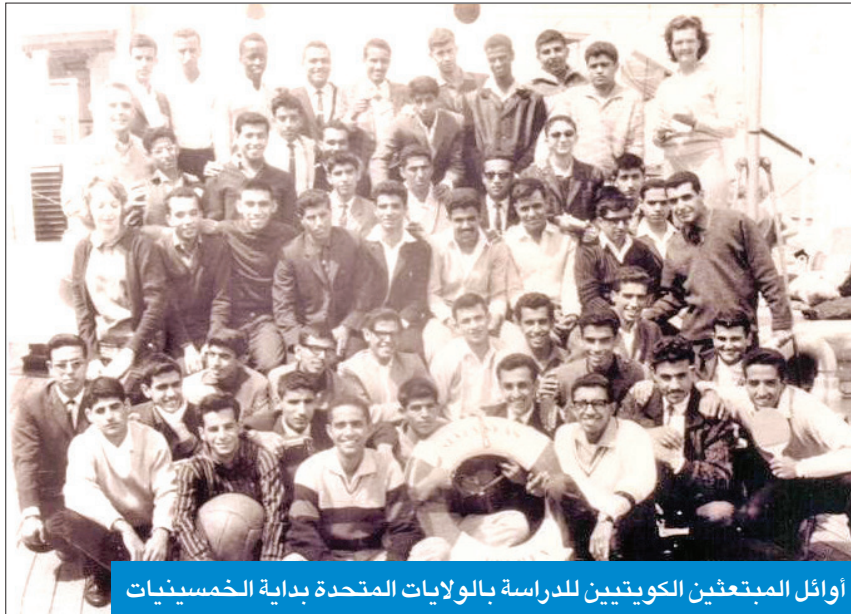
أوائل المبعثين الكويتيين للدراسة بالولايات المتحدة بداية الخمسينيات

أول بعثة كويتية ضمت 7 طلاب إلى الكلية الأعظمية ببغداد