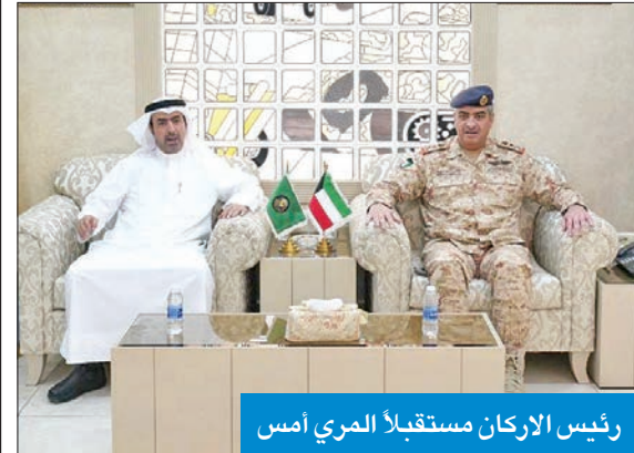
رئيس الأركان مستقبلاً المري أمس

أمر الدفاع الجوي بحث التعاون العسكري مع قائد مجموعة الدعم بالمنطقة