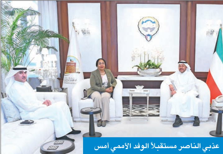
عذبي الناصر مستقبلاً الوفد الأممي أمس

استقبل محافظ الفروانية محافظ العاصمة بالوكالة الشيخ عذبي الناصر في مكتبه، صباح أمس، ممثلة الأمين العام للأمم المتحدة المنسقة المقيمة بدولة الكويت السفيرة غادة الطاهر، ورئيس مكتب ممثل الأمين العام للأمم المتحدة ناصر الشطي، لتهنئة المحافظ بتولي مهامه الجديدة، في ظل قيادة سمو أمير البلاد الشيخ مشعل الأحمد، وسمو ولي العهد الشيخ صباح الخالد.