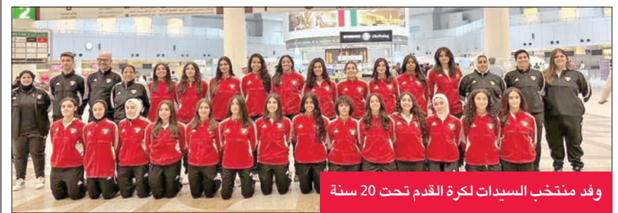
وفد منتخب السيدات لكرة القدم تحت 20 سنة

غادر وفد منتخب الكويت لكرة القدم للسيدات تحت 20 سنة، أمس الأول، إلى هولندا، للدخول هناك في معسكر تدريبي. ويقام المعسكر ضمن استعدادات منتخب الكويت للاستحقاقات المقبلة.