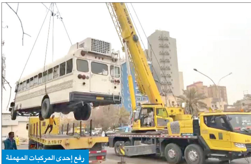
رفع إحدى المركبات المهملة

كل ما يشوه المنظر الجمالي ويعمل على إشغال الطريق بجميع المناطق، من خلال الجولات الميدانية التي يقوم بتنفيذها للحفاظ على المظهر الحضاري للمحافظة. وأشار الجبعة إلى تواصل الجولات الميدانية من الفريق الرقابي بإدارة النظافة العامة وإشغالات الطرق، مشدداً على عدم تهاون الفريق الرقابي في اتخاذ جميع الإجراءات ضد المخالفات.