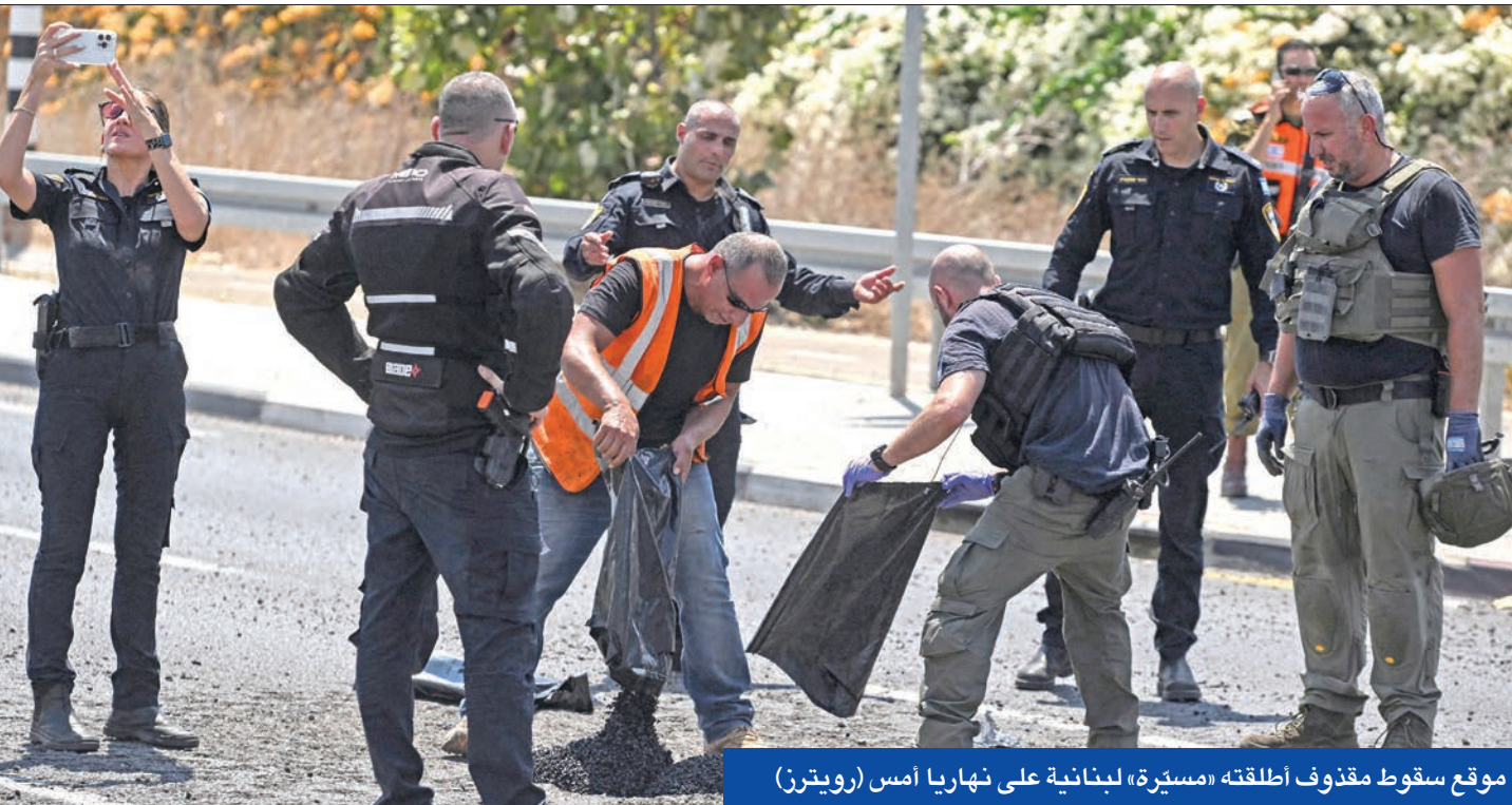
موقع سقوط مقذوف أطلقته «مسيرة» لبنانية على نهاريا أمس

توسيع نطاق الحرب والأزمة في المنطقة، لكن إسرائيل استغلت بالتاكيد الرد على جرائمها وغرستها. وقال نتنياهو ليل الأحد «نحن مصممون على مواجهة» إيران وحلفائها «على كل الجبهات، حيث كل الساحات، قريبة كانت أم بعيدة، لافتاً إلى أن إسرائيل «تستعد لجمع السيناريوهات، هجومياً ودفاعاً».