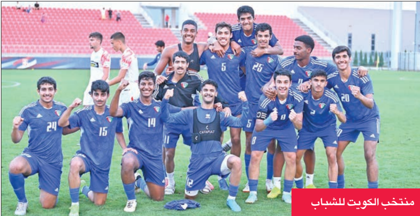
منتخب الكويت للشباب