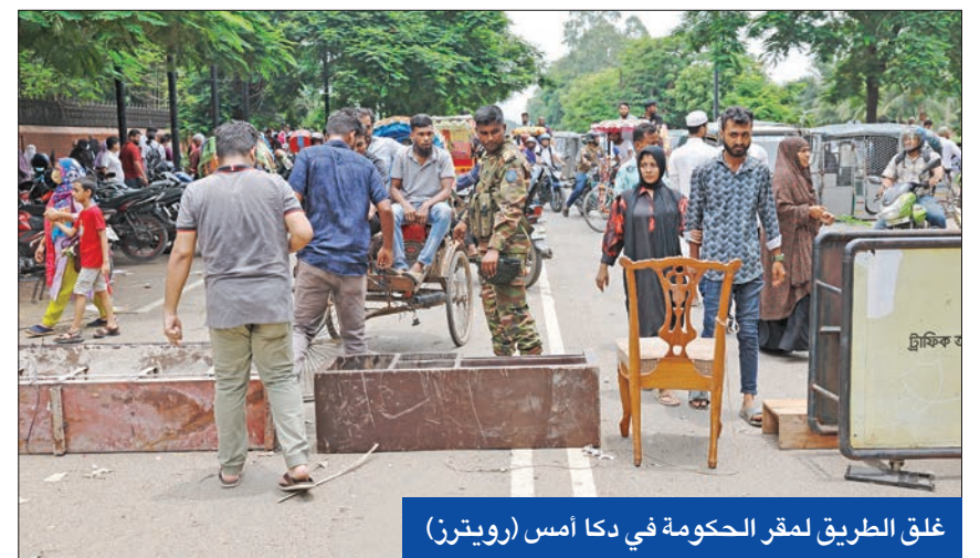
غلق الطريق لمقر الحكومة في دكا أمس

واقترح ناهد إسلام، القيادي الرئيسي في تجمع «طلاب ضد التمييز»، المحرك الرئيسي للاحتجاجات في بنغلادش، اسم الدكتور محمد يونس لقيادة الحكومة المؤقتة، خاصة أنه يتمتع بشهرة عالمية ومعترف