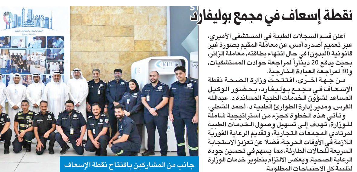
جانب من المشاركين بافتتاح نقطة الإسعاف

«مواجهة «حزب الله»...» ودبلوماسية محلية، وبناء عليها يتم التحضير للمرحلة المقبلة. وبعد زيارة أمين مجلس الأمن الروسي، سيرغي شويغو، إلى إيران، تلقى لبنان وحزب الله المزيد من الرسائل الروسية المحذرة من وقوع في فخ نصيبه رئيس الوزراء الإسرائيلي بنيامين نتانياهو لاستدراج الجميع لحرب واسعة. وتعدى الرسالة الروسية قلقاً من تطورات الأوضاع، ومن أن يستغل نتانياهو أي رد سيقدم عليه الحزب لتوسيع حربه في المنطقة، واستدراج الولايات المتحدة إليها. لكن الواقع الميداني بدت مختلفة عن كل ما يتصل بالمساعي السياسية للحم التصعيد، فبعد ساعات من تصفيتهم أحد كوادر الوحدة الصاروخية بالحزب مع اثنين آخرين في بلدة عبا، واصل الإسرائيليون عملياتهم المكثفة مركزين على الاغتيال، واستهدفوا مبنى من 3