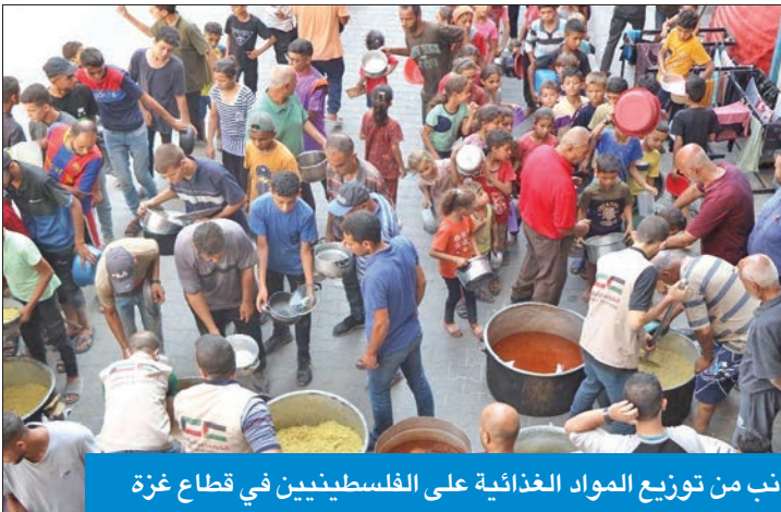
جانب من توزيع المواد الغذائية على الفلسطينيين في قطاع غزة

بإجمالي قيمة تخطت المليون دولار. وبين أن «الكويتية للإغاثة» عبر حملة «سفنينة غزة» بالتعاون مع هيئة الإغاثة الإنسانية (IHH) والهلال الأحمر التركي، ومن خلال 3 سفن إغاثية وفرت حوالي 3750 طناً من شتى المواد الإغاثية الطبية والغذائية والإيوائية، بتكلفة اقتربت قيمتها من 8 ملايين دولار. وكشفت عن تجهيز السفينة الثالثة وشحنها، والتي من المقرر أن تنطلق خلال ثلاثة أيام مقبلة نحو ميناء العقبة جنوب غرب الأردن، حيث سيتم تفريغها وإعادة شحنها في شحناات برية تمهيداً لإدخالها إلى القطاع. وأشاد المسبح بجهود «فريق الكويتية للإغاثة الطبي» الذي نجح قبل ثلاثة أشهر في الدخول مرتين إلى قطاع غزة عبر معبر رفح وبحوزته 10 أطنان من المستلزمات الصحية والأجهزة الطبية، مبيهاً أنه خلال 15 يوماً قاضها داخل القطاع وبالإستعانة