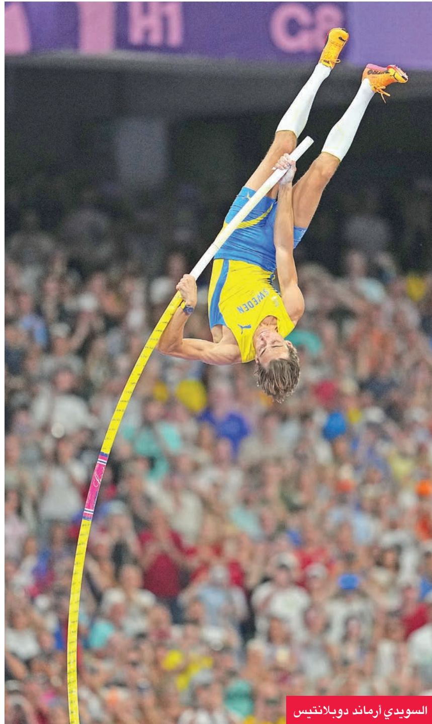
السويدي أرماند دوبلانتيس

ونالت البريطانية كيلي هودجكينسون ذهبية سباق 800 م بعدما سجلت ابنة الـ 22 عاماً وقتاً قدره 1:56.72 دقيقة، متقدمة على الاثيوبية تسيغي دوغوما صاحبة الفضية (1:57.15 د) والكينية ماري مورا التي اكتفت بالبرونزية (1:57.42 د).