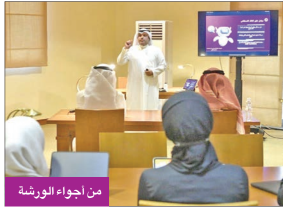
من أجواء الورشة

من جانب آخر، تحدث العنزي عن أهمية الذكاء الاصطناعي في المكتبات، وأعطى أمثلة وهو عند دخول المستخدم إلى المكتبة يحتاج أن يسأل عن مصادر المعلومات الموجودة، وقد لا يعطي أمين المكتبة المعلومة بشكل دقيق، لأنه لم يقرأ جميع الكتب، لكن من خلال الذكاء الاصطناعي يمكن عمل الخدمة المرجعية الآلية التي تقوم بقراءة الكتب كاملة، وهو يكون بمنزلة الدليل الإرشادي والمرجعي للمستخدمين من خلال الأسئلة لتوفير الوقت والجهد على المستخدم، أو لخدمة الباحث الذي لا يستطيع الوصول إلى المكتبة، مبيناً أن هذه الخدمة متوفرة في مكتبة جامعة ستانفورد.