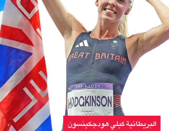
البريطانية كيلي هودجكينسون