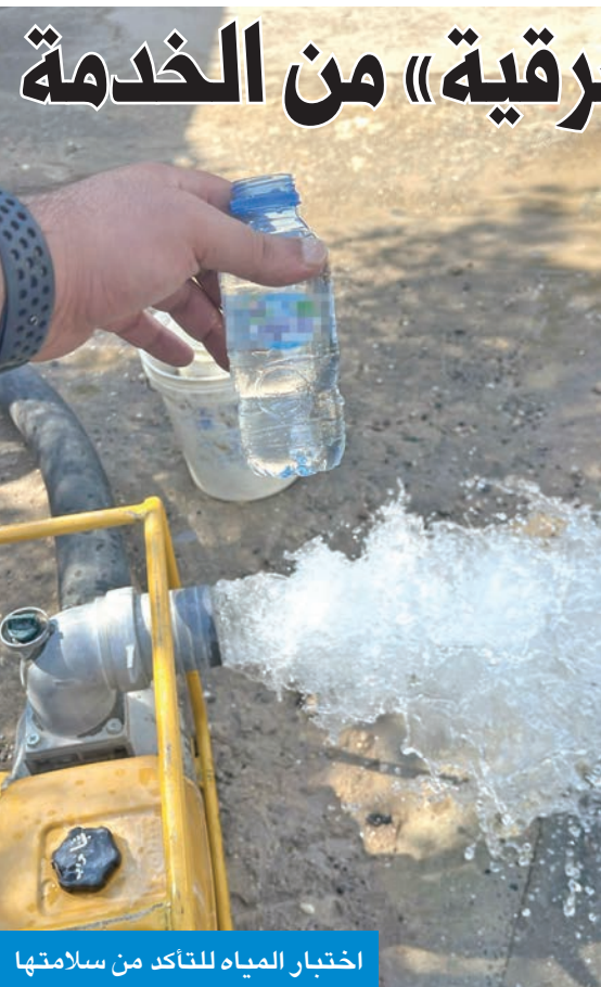
اختبار المياه للتأكد من سلامتها

كشفت مصادر «الكهرباء» عن تعطل خدمات الوزارة الإلكترونية منذ بداية دوام صباح أمس، نتيجة عطل في شبكة «الفاير» المغذية للوزارة، لافتة إلى أن الإدارة المختصة تعمل منذ حدوث الخلل على إصلاحه وإعادة الإنترنت، ومن ثم إعادة خدمات الوزارة الإلكترونية.