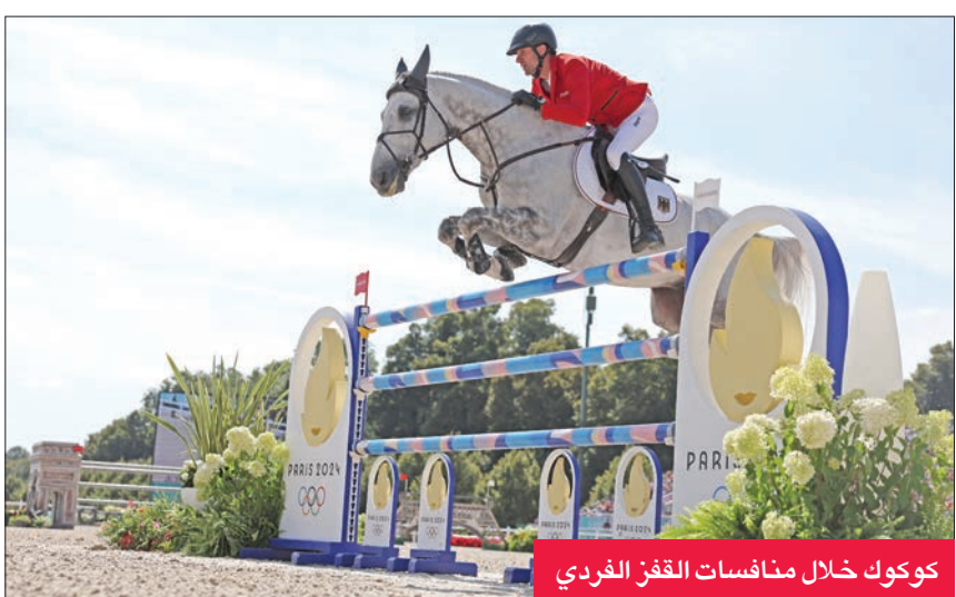
كوكوك خلال منافسات القفز الفردي

توج الفارس الألماني كريستيان كوكوك بالميدالية الذهبية في منافسات القفز