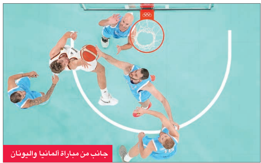
جانب من مباراة ألمانيا واليونان

بلغت ألمانيا بطلة العالم نصف نهائي مسابقة كرة السلة للرجال لأول مرة في سبع مشاركات أولمبية لها، على حساب يانيس أنتيوكونيمو ورفاقه في المنتخب اليوناني بالفوز عليهم 63-76 الثلاثاء في أولمبياد باريس 2024.