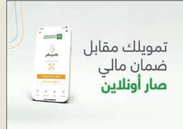
تمويلك مقابل ضمان مالي صار أونلاين

يقدم بيت التمويل الكويتي (بيتك) خدمة «التمويل مقابل ضمان مالي» أونلاين، حيث يمكن للعملاء الآن KFHonline على تطبيق الموبايل وعلى الموقع الإلكتروني «بيتك»، وتعتبر خدمة التمويل مقابل ضمان مالي أحد أفضل الحلول التمويلية المتكيفة التي يقدمها «بيتك» لعملائه، لتلبية احتياجاتهم.