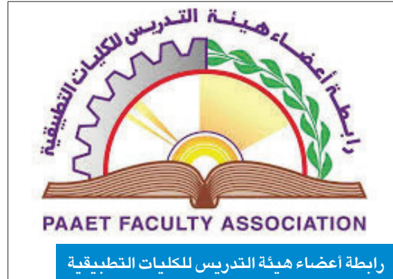
رابطة أعضاء هيئة التدريس للكلية التطبيقية

مجلس الخدمة المدنية إلى إقراره والنظر في ملفات أكبر المؤسسات التعليمية بالدولة بما يتناسب مع حجمها ودورها التنموي. من جانب آخر، علمت «الجريدة» من مصادر مطلعة في