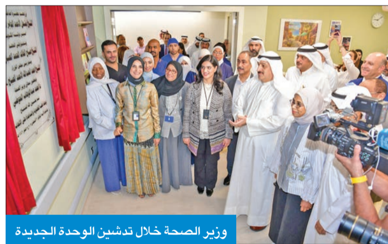
وزير الصحة خلال تدشين الوحدة الجديدة

الثالثة من نوعها وتسهم في تقليل قوائم انتظار تقنية أطفال الأنابيب