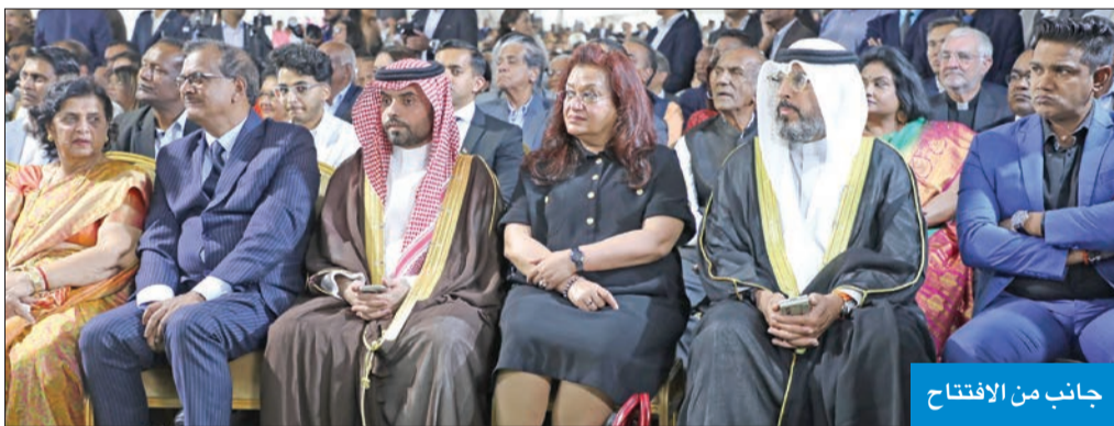
جانب من الافتتاح

127 ألف مليون دولار»، مضيفة أن «مساهمة الصندوق في هذا المشروع بلغت نحو 24 مليون دولار». من جانبه، أشار مدير المستشفى إلى أن المستشفى الجديد يسع حوالي 550 سريراً مقارنة بمستشفى (فلاك) القديم الذي يضم 350 سريراً فقط، مضيفاً «نحن حالياً في مرحلة الانتقال من المستشفى القديم إلى المستشفى الجديد».