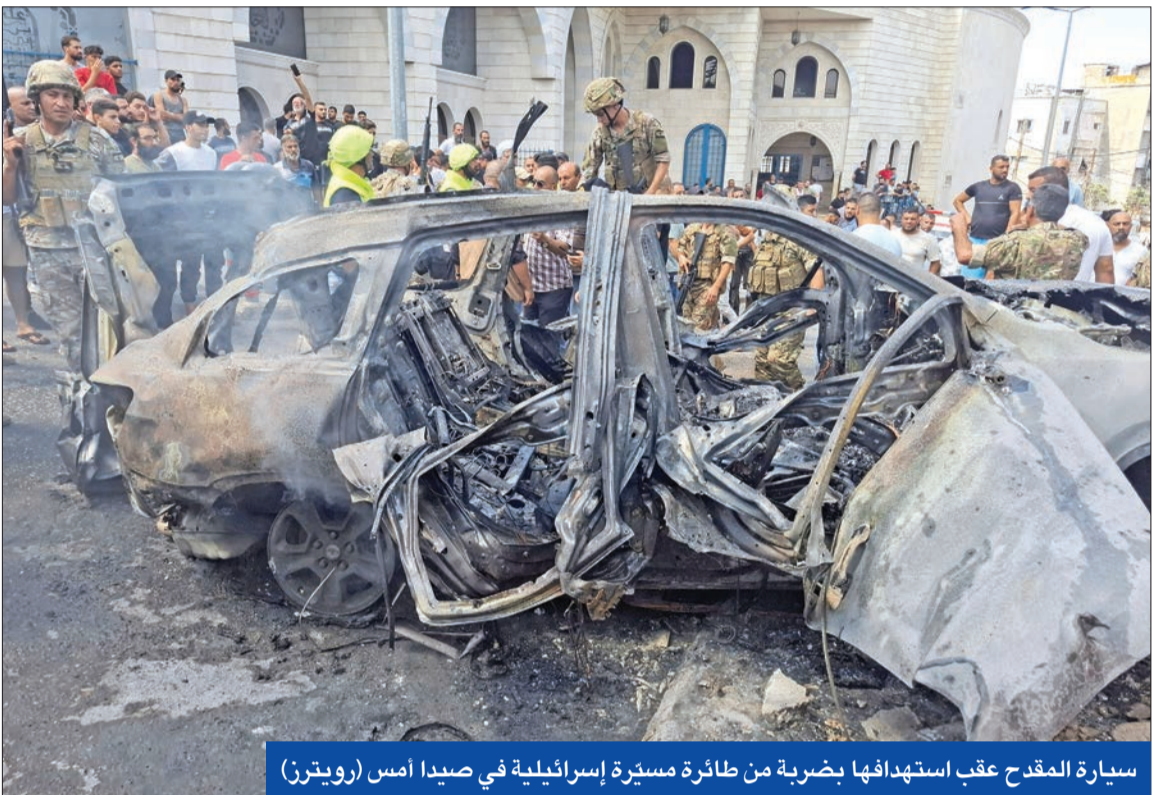
سيارة المقدح عقب استهدافها بضربة من طائرة مسيرة إسرائيلية في صيدا أمس

وبينما أنهى وزير الخارجية الأميركي أنتوني بلينكن