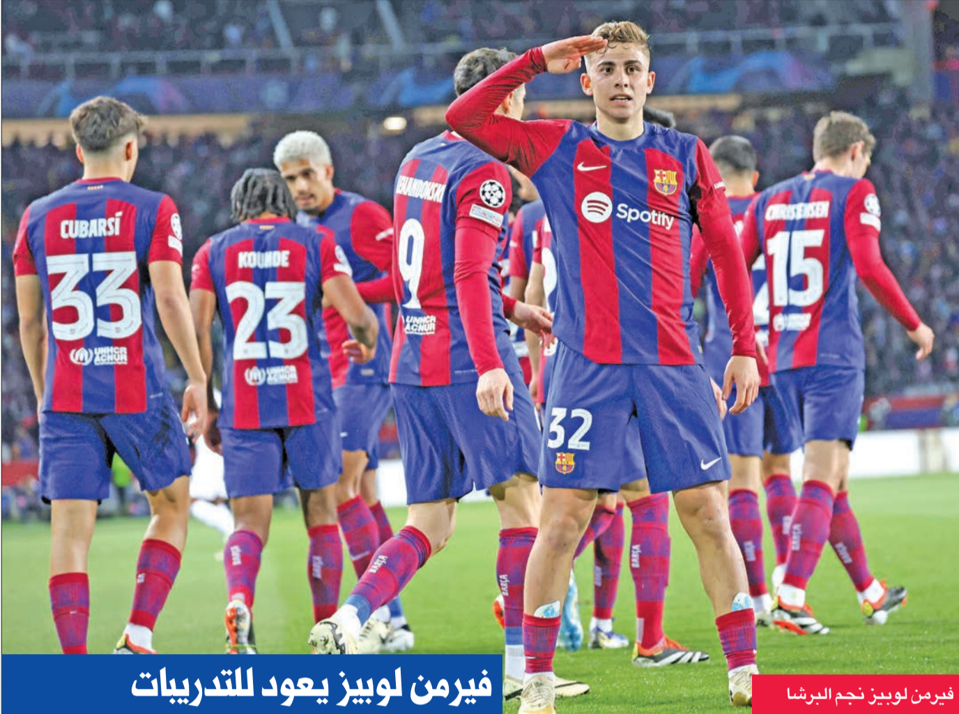
فيرمن لوبيز نجم البرشا