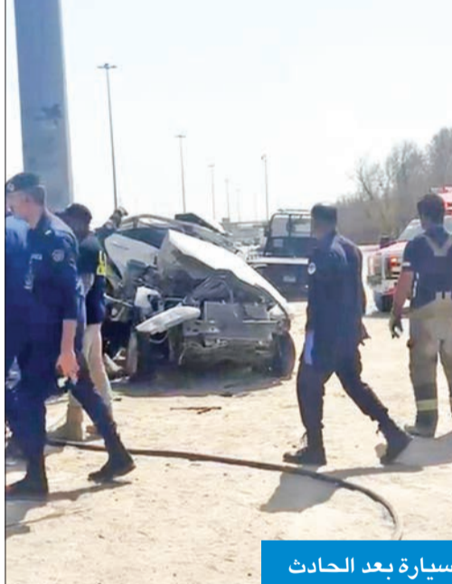
السيارة بعد الحادث

وفي التفاصيل، قالت إدارة العلاقات العامة والإعلام بقوة الإطفاء العام، إن إدارة العمليات بقوة الإطفاء العام تلقت بلاغاً صباح أمس بوقوع حادث تصادم مركبة بلوحة إرشادية مع وجود شخص محشور جراء قوة الاصطدام. وأضافت أنه فور تلقي البلاغ تم تحريك مركزي إطفاء صباحان والانقاذ الفني لموقع الحادث، و عمل رجال الإطفاء فور وصولهم على سحب المركبة التي كانت عالقة بالبلوحة الإرشادية، وانتشال جثة السائق الذي تبين أنه فارق الحياة. وذكرت الإدارة أن رجال الإطفاء سلموا جثة قائد المركبة إلى رجال الإدارة العامة للأدلة الجنائية تمهيداً لإحالتها إلى إدارة الطب الشرعي، مشيرة إلى أن دوريات المرور والنجدة عملت على تنظيم حركة السير التي تعطلت جراء الحادث.