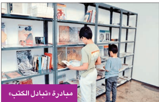
مبادرة «تبادل الكتب»

الغزو، لمساعدة مركز اليرموك في وضع قاعدة بيانات بالأسماء والتجارب المتعلقة بفترة الاحتلال. وأكدت العلي ترحيب مركز اليرموك الثقافي بزيار المعرض، كما دعته للمشاركة بصنع الذاكرة المحلية عن طريق إضافة قصصهم المرتبطة بالأشياء والأدوات المعروضة، للوصول إلى أبعاد جديدة وعميقة من ناحية أخرى، ذكرت العلي