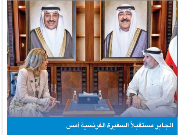
الجابر مستقبلاً السفيرة الفرنسية أمس

استقبل نائب وزير الخارجية، السفير الشيخ جراح الجابر، أمس، كلًا من السفيرة الفرنسية لدى البلاد كلير لو فليشر، وسفير بيرو كارلوس مينديولا، بمناسبة انتهاء فترة عملهما سفيرين لبلديهما لدى الكويت. كما استقبل الجابر السفير الصومالي لدى البلاد عبدالله محمد شيخ، حيث تم بحث العلاقات الثنائية بين البلدين وسبل توطيدها في المجالات كافة، إضافة إلى القضايا محل الاهتمام المشترك.