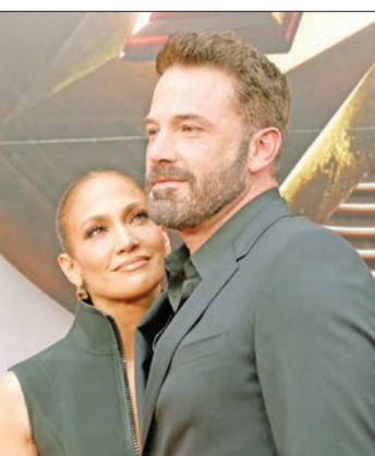
جينيفر لوبيز وبن أفليك

الملقب باسم «بنيفر»، حديث أوساط المشاهير في علاقة تميزت بسياراتهما الفارهة وخاتم الخطبة الكبير المرصع بماسة وريبة اللون تزن 6.1 قاريط. وألقى الاثنان زواجهما المرتقب في 2003 فجأة، وانفصلا بعدها ببضعة أشهر. وتزوجت لوبيز من المغني اللاتيني مارك أنتوني، زوجها الثالث، بعد خمسة أشهر فقط من انفصالها عن أفليك عام 2004. وتزوج أفليك، مخرج فيلم «ارجو»، الحائز جائزة أوسكار، الممثلة جينيفر غارثي، ثم تطلقا فيما بعد. وبدأت لوبيز وأفليك المواعدة مرة أخرى عام 2021، بعد أشهر من فسخ خطبتها على نجم البيسبول اليكس رودريغيز، لتنتهي علاقتهما التي استمرت أربع سنوات. وقالت لوبيز لاحقاً، إن الانفصال الأول عن أفليك «كان أكبر حسرة في حياتي». وأضافت في مقابلة مع أبل ميوزك: «شعرت بصراحة أنني ساموت، لكن الآن بعد مرور 20 عاماً، أصبح للعلاقة نهاية سعيدة».