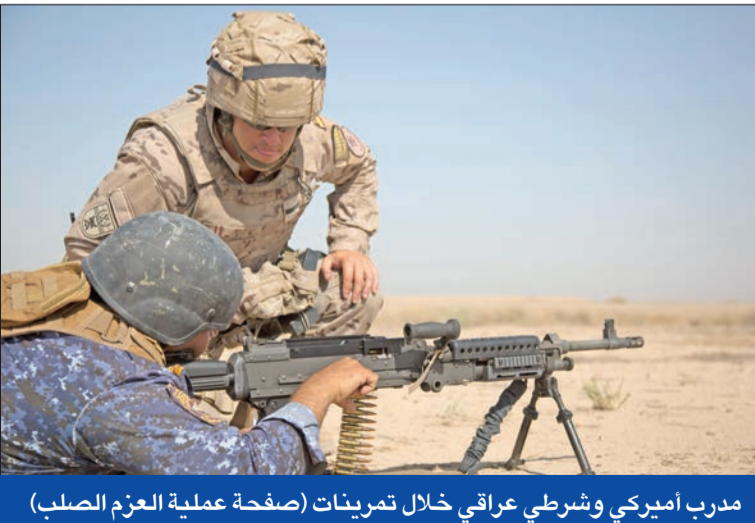
مدرب أميركي وشريطي عراقي خلال تمرينات (صفحة عملية العزم الصلب)

من جهتها، أعلنت حركة النجباء أنها «لم تعد ملزمة بعد الآن بالهدنة مع القوات الأميركية»، التي كانت تهدف إلى منح الحكومة الوقت اللازم للتفاوض مع واشنطن. وقال حيدر الالامي، عضو المجلس السياسي للحركة، في تصريح صحافي، إن «فصائل المقاومة أنهت الهدنة، وجميع الخيارات متاحة لاستهداف جميع القواعد الأميركية داخل العراق»، متابعاً: «هناك تسويق ومماطلة من أميركا بشأن انسحاب قواتها أثناء المفاوضات».