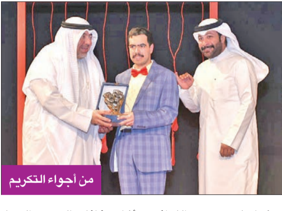
من أجواء التكريم

في البداية، أشاد مقدم الحفل الفنان أحمد النخار بدور فرقة مسرح الخليج والمجلس الوطني للثقافة والفنون والآداب في تقديم طاقات كويتية شبابية جديدة في عالم المسرح والتلفزيون عبر الورش الفنية. بدوره، قال الزامل، إن فرقة مسرح الخليج العربي منذ أسست وإلى اليوم تميزت بالتحدي الدائم، وتقديم المسرح النوعي الجميل، وتنوع الاجتهادات لأعضاء الفرقة، والأمر الرائع فيها هو تلاقي الأجيال وتبادل الخبرات بشكل سريع ومتقن، مشيداً برئيس الفرقة الفنان ميثم بدر، وأعضاء مجلس الإدارة،