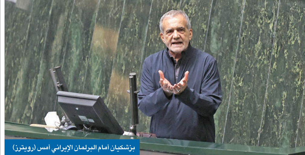
بزشكيان أمام البرلمان الإيراني أمس

تمكّن الرئيس الإيراني مسعود بزشكيان من نيل ثقة مجلس الشورى (البرلمان) لتشكيلته الوزارية كاملة في دورة تصويت واحدة، ليصبح ثاني رئيس في تاريخ الجمهورية الإسلامية بعد محمد خاتمي يتمكن من ذلك. وعلى الرغم من أن حكومة خاتمي عبرت البرلمان بسهولة قبل 23 عاماً فإنه حينها كان الإصلاحيون لديهم أغلبية البرلمان، في حين أن بزشكيان المحسوب على الإصلاحيين نجح في نيل ثقة برلمان يسيطر عليه بشكل كامل الأصوليون المتطرفون المعارضون له بشكل عام. واستطاع بزشكيان تشكيل حكومة تكنوقراط من شخصيات موالية للأصوليين والمحافظين والوسطيين لأول مرة في البلاد، وأطلق عليها «حكومة الوحدة الوطنية»، وقال إنه غير مهتم بالصبغة السياسية للوزراء بل بما يمكنهم أن يفعلوه. وفي حين أن بزشكيان يتفاخر دوماً بأنه رجل أفعال <02