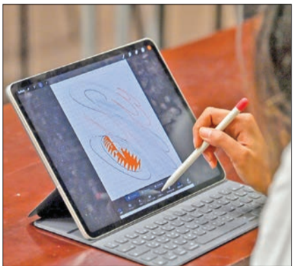
من أجواء الورشة

العديد من المزايا مقارنة باللوحات التقليدية، وتشمل هذه المزايا المرورية، حيث يمكن العمل على المشروع الفني من أي مكان وفي أي وقت طالما أن جهاز الكمبيوتر أو الجهاز اللوحي معك، وإذا ارتكبت خطأ أو أردت إضافة تغيير في اللوحة الرقمية يمكنك الرجوع عن الخطأ أو الرجوع إلى إصدار سابق، وعدم الإضطرار إلى البدء من الصفر كما الحال مع اللوحات التقليدية. وأيضاً يمكن حفظ الأعمال الرقمية بسهولة ومشاركتها عبر الإنترنت، مما يسهل الوصول إليها من جهور أوسع. وأشارت إلى أنه على الرغم من أن