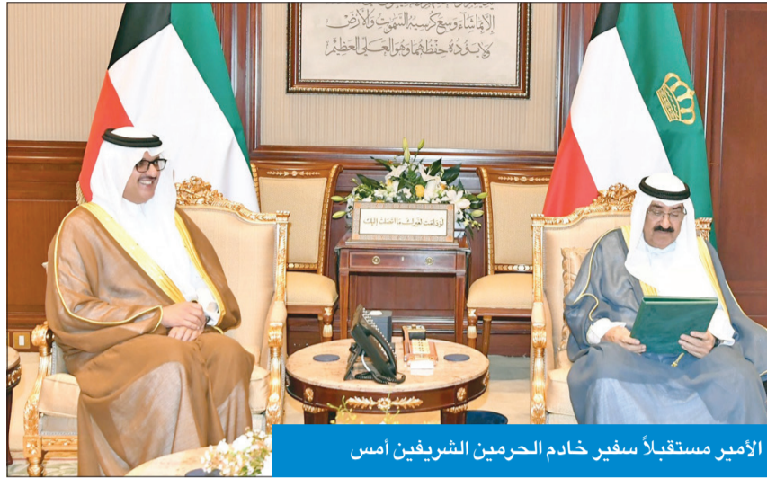
الأمير مستقبلاً سفير خادم الحرمين الشريفين أمس

تسلم سمو أمير البلاد الشيخ مشعل الأحمد بقرص بيان صباح أمس، رسالة خطية من ولي العهد رئيس مجلس الوزراء في المملكة العربية السعودية الشقيقة الأمير محمد بن سلمان تضمنت دعوة سموه لحضور النسخة الثامنة من منتدى مبادرة مستقبل الاستثمار لعام 2024 المزمع عقده بالعاصمة الرياض في أكتوبر المقبل. وقام بتسليم الرسالة لسموه سفير خادم الحرمين الشريفين لدى الكويت الأمير سلطان بن سعد. وحضر المقابلة كبار المسؤولين بالدولة.