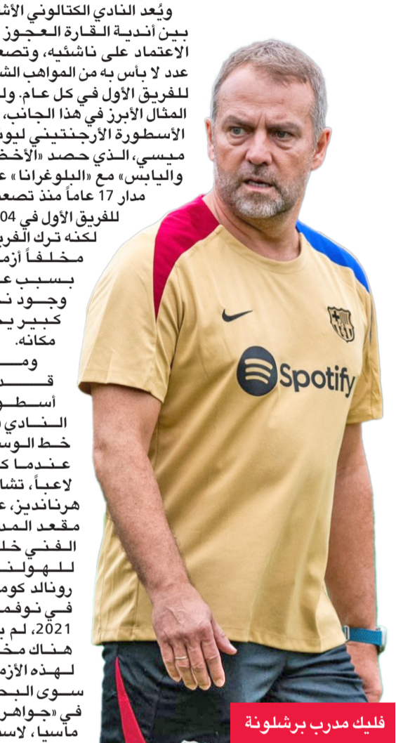
فليك مدرب برشلونة

يجب على هانزي فليك، مدرب برشلونة، الاعتماد بشكل كبير على اللاعبين الشباب وخريجي أكاديمية لا ماسيا، بسبب المشاكل المالية التي يعانيها النادي الكتالوني.