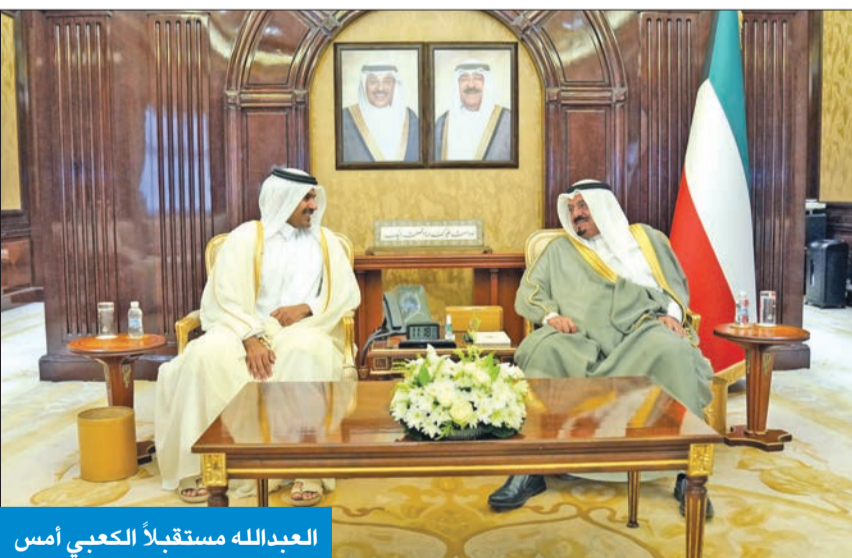
العبدالله مستقبلاً الكعبي أمس

استقبل سمو أمير البلاد الشيخ مشعل الأحمد، في قصر بيان، أمس، وزير الدولة لشؤون الطاقة القطري العضو المنتدب والرئيس التنفيذي لـ «قطر للطاقة» المهندس سعد الكعبي بمناسبة زيارته للبلاد.