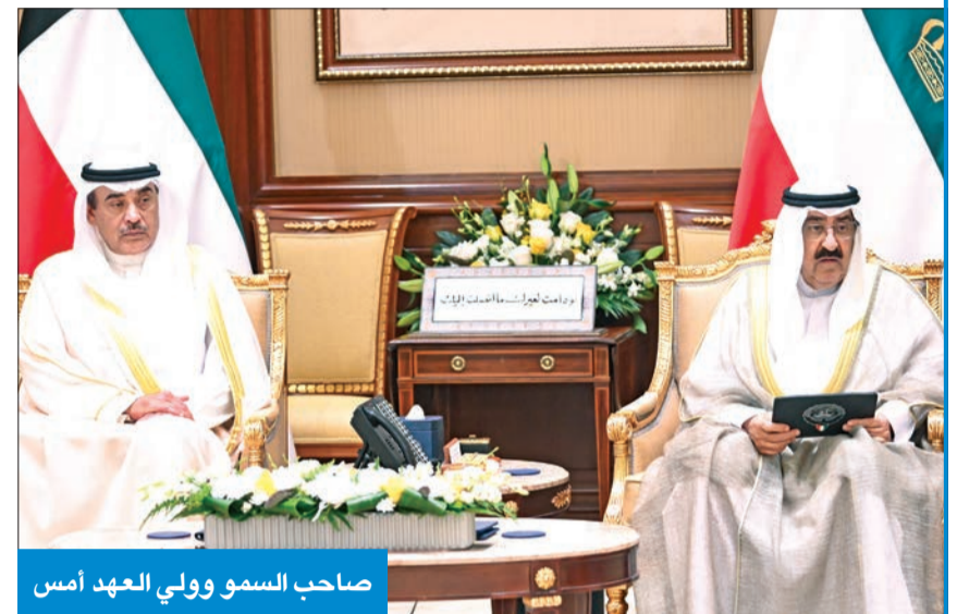
صاحب السمو وولي العهد أمس