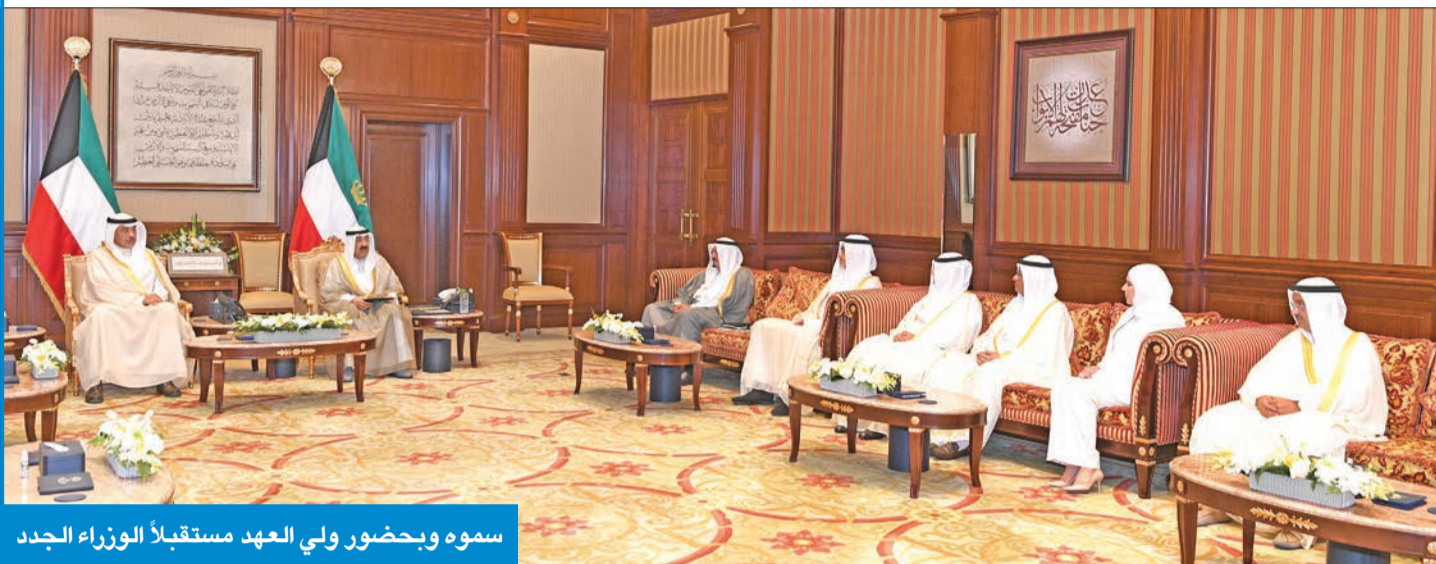
سموه وبحضور ولي العهد مستقبلاً الوزراء الجدد