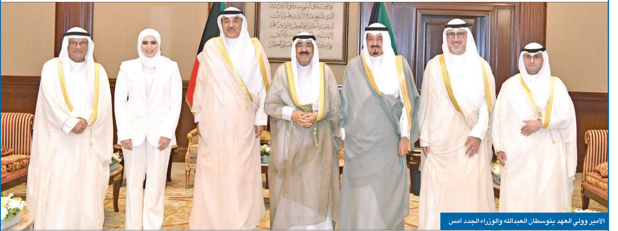
الأمير وولي العهد يتوسطان العبدالله والوزراء الجدد أمس

• العبدالله: بالغ التقدير على الثقة الغالية من سموكم لبذل المزيد من الجهود من أجل الوطن والمواطن