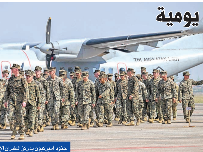
جنود أميركيون بمركز الطيران الإندونيسي في جاوة أمس

وأكد المتحدث باسم وزارة الخارجية، لين جيان، أن «الصين تعزز اتخاذ إجراءات حازمة متواصلة وفق القانون لحماية سيادتها ومصالحها البحرية، ودعم