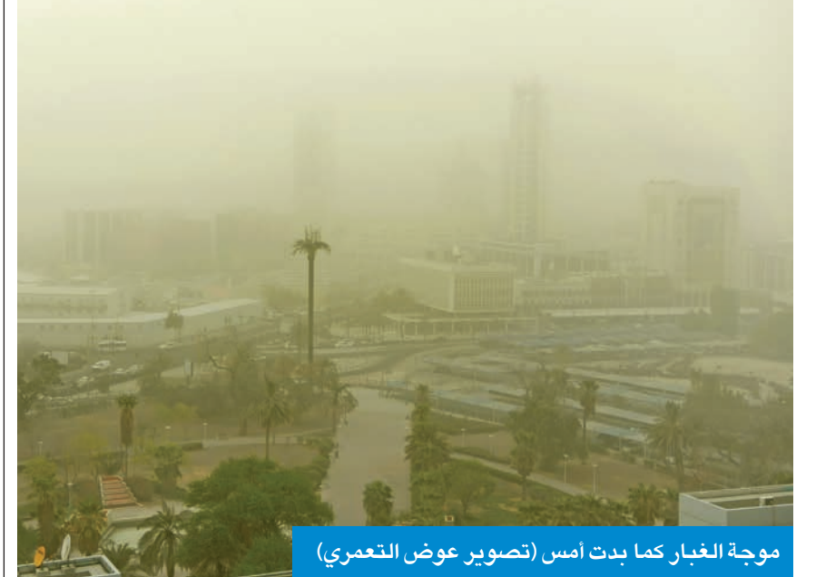
موجة الغبار كما بدت امس

ودعت وزارة الداخلية الجميع إلى الالتزام وأخذ الحيطة والحذر بسبب موجة