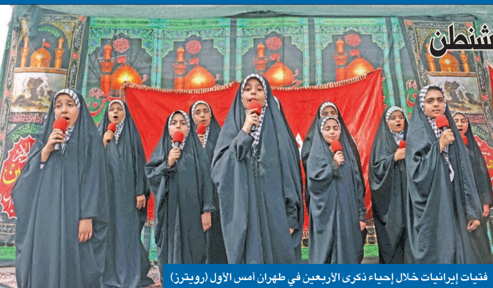
فتيات إيرانيات خلال إحياء ذكرى الأربعين في طهران أمس الأول