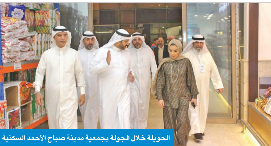
الحويلة خلال الجولة بجمعية مدينة صباح الأحمد السكنية

التطوير والحيابة وتصميم الديكور، إلى جانب صناعة العطور، والرسم، وتشكيل الأكسسوارات وغيرها من الحرف اليدوية المميّزة. وفي ختام الجولة قامت د. الحويلة بتكريم المشاركين والقائمين على المعرض.