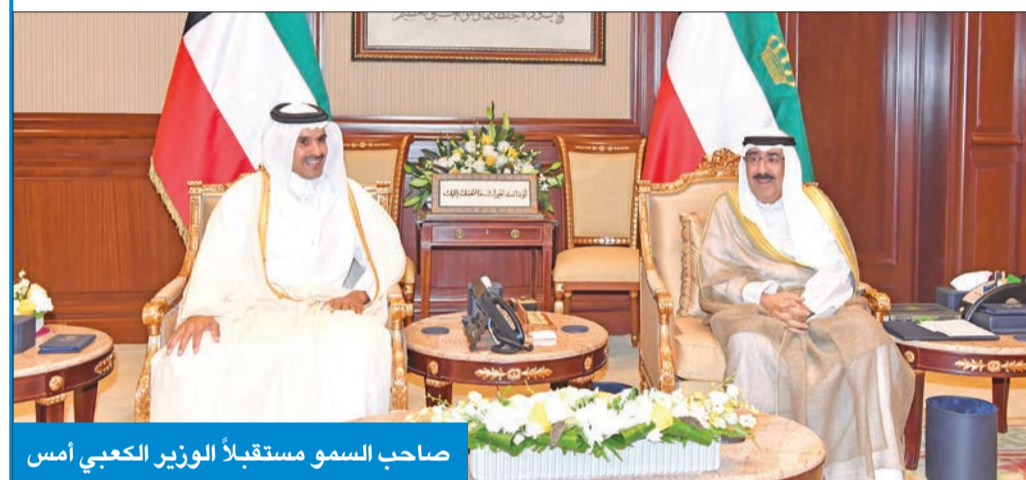
صاحب السمو مستقبلاً الوزير القطري أمس

سموه معزياً بالحص: نستذكر موقفه الشجاع منذ اليوم الأول للغزو