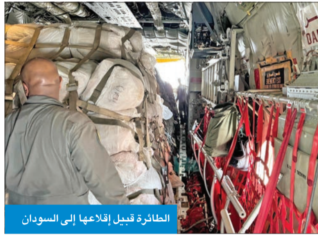
الطائرة قبيل إقلاعها إلى السودان

قبيل إقلاع الطائرة من قاعدة عبدالله المبارك الجوية، إنها تحمل على متنها 150 خيمة إيواء وتأتي كسابقاتها لتخفيف معاناة النازحين جراء النزاعات المستمرة هناك والكوارث الطبيعية متمثلة بسيلول وفيضانات ضربت شمال السودان وأدت لمئات الضحايا والمصابين وتشريد الآلاف، بعد أن دمرت منازلهم قبل نحو من أسبوعين