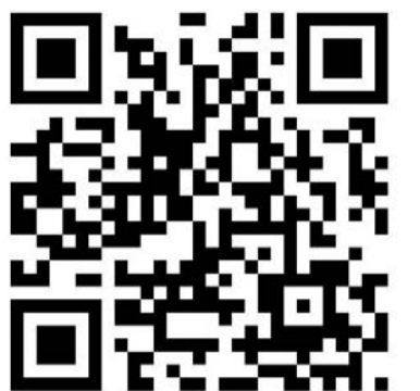
امسح الرمز للتسجيل في ZGI

وأصبحت شركة Zain Ventures أخيراً لتكون أحد محركات الدفع الرئيسية لاستراتيجية مجموعة زين، إذ تمثل المحفظة الاستثمارية لمشاريع المجموعة، فهي مسؤولة عن فتح المزيد من آفاق الفرص الاستثمارية في رأس المال المغامر، والتكنولوجيا المالية، مع التركيز على الابتكارات الرقمية في منظومة بيئة الخدمات الإلكترونية، وريادة الأعمال التي تشهد نمواً متسارعاً. ويوفر الاستثمار في رأس المال المغامر مجموعة واسعة من الفرص لتنوع وتوسيع نطاق وصول «زين» في المنظومة المحيطة بعملياتها. وعلى مدار السنوات الأخيرة، دأبت الشركة على تنوع علاقاتها مع صناديق رأس المال المغامر الإقليمية والدولية لدعم شركات هذه الصناديق. كما واصلت المجموعة مشاركتها النشطة في الاستثمارات الاستراتيجية المباشرة في مجموعة متنوعة من الشركات الناشئة الواعدة، سواء في أسواق المنطقة أو خارجها، إذ تقدم إليها الدعم على جبهات متعددة، بما في ذلك الوصول الجغرافي الواسع النطاق.