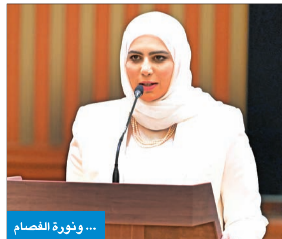
... ونورة القسام