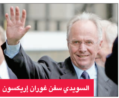
السويدي سفن غوران إريكسون

تحقيق النجاحات في الدرجات الدنيا، نال اهتمام العديد من الأندية الكبرى. وأشرف فيما بعد على نادي «اي أف كي» غوتنبورغ قبل أن ينقل تجربته إلى خارج الحدود، من خلال الإشراف على بنفيكا البرتغالي، إضافة إلى العديد من الأندية الإيطالية بينها روما ولاتسيو.