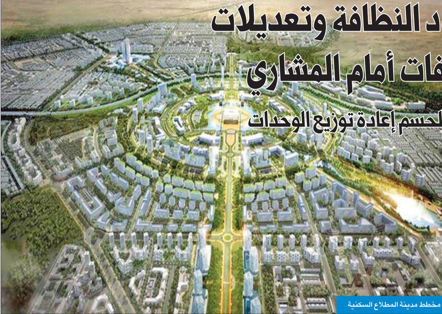
مخطط مدينة المطلاع السكنية

المواطنون ينتظرون اجتماع «السكنية» لحسم إعادة توزيع الوحدات