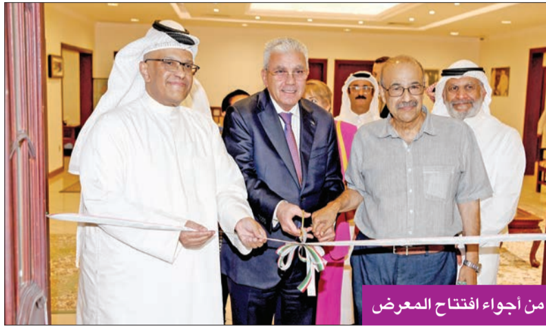
من أجواء افتتاح المعرض

وأوضح أن «حال السينما في الكويت تبشر بالخير، وحاليا هناك بوادر جميلة، وشباب لديهم الاستعداد لتقديم الأفضل، لأن هناك معطيات ومؤشرات تنبئ بوجود شباب عنده رؤية مستقبلية، لذلك يجب أن نحرض عليهم ونعطيه كل ما يتطلبونه من مواد، سواء كانت مادية أو معنوية، ونجهزهم.