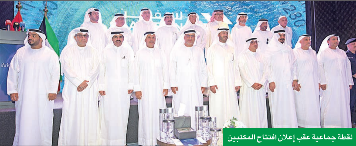
لقطة جماعية عقب إعلان افتتاح المكتبين

والخدمات التدقيق واعتمادات السلامة والجودة في مجالات البنية التحتية والمرافق الصناعية والخدمات الطبية والعديد من المجالات الأخرى، إضافة إلى خدمات التدريب في المجالات البحرية المتنوعة، ويُعد هذا المكتب الثاني شركة تصنف بعد مكاتبها في كل من الإمارات وإندونيسيا.