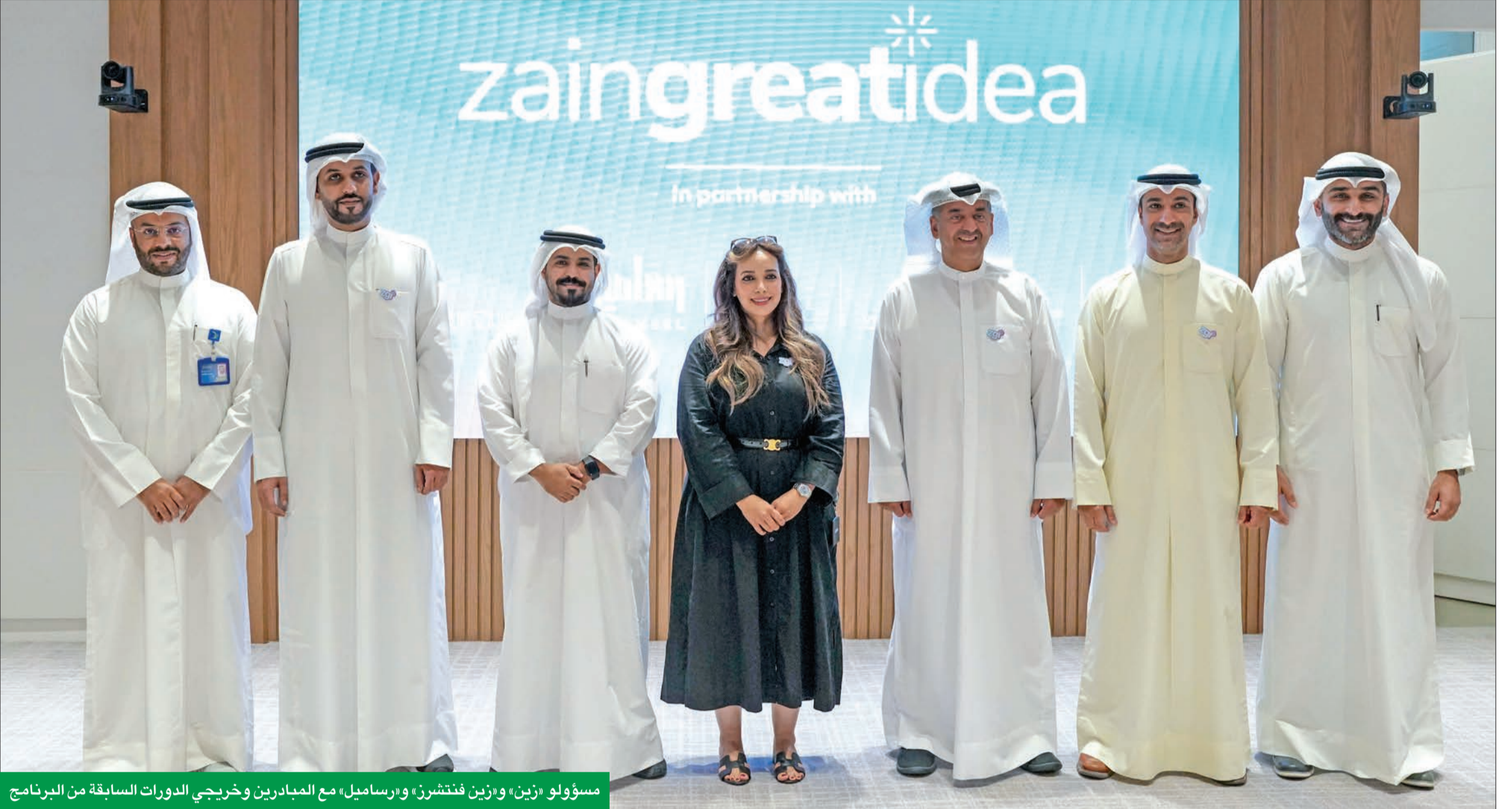
مسؤولو «زين» و«زين فنتشرز» و«رساميل» مع المبادرين وخريجي الدورات السابقة من البرنامج

برنامج تسريع الشركات التكنولوجية الرائد يعود في موسم جديد لتمكين رواد الأعمال