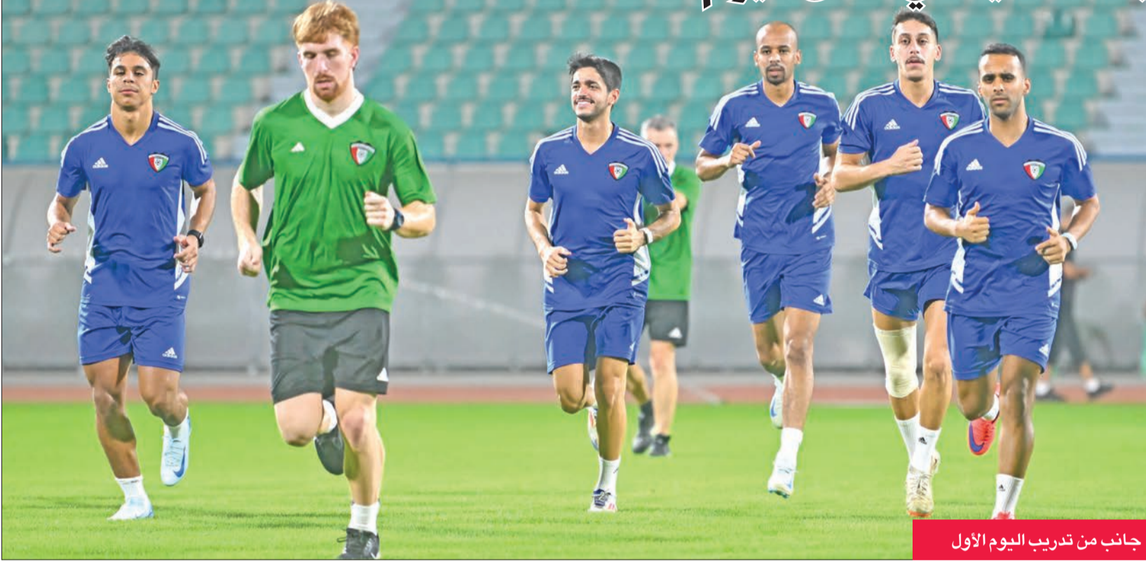
جانب من تدريب اليوم الأول