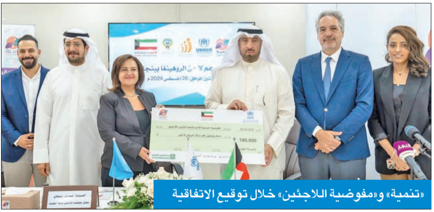
«تنمية» ومفوضية اللاجئين، خلال توقيع الاتفاقية

● العجمي: نسعى لإنشاء رابطة أو اتحاد لدعم اللاجئين بما يتوافق مع قرارات «الشؤون»