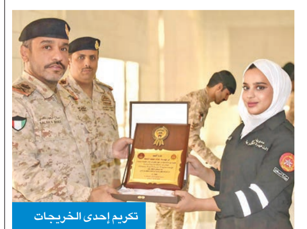
تكريم إحدى الخريجات