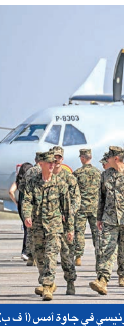
جنود أميركيون بمركز الطيران الإندونيسي في جاوة أمس

بلوشستان، وأعلن «جيش تحرير البلوش» المجموعة الانفصالية المسلحة الأكثر نشاطاً في المنطقة، مسؤولة عن عدة هجمات، مضيفاً أن «المعركة هي ضد الجيش الباكستاني المحتل». وقال كيبا بلوش، وهو محلل وصحافي سابق يتابع العنف في بلوشستان، إن السلطات تستخدم القوة فقط لكبح النزاع المستمر منذ عقدين، بدلاً من البحث عن حلول سياسية. وأضاف أن هذا النهج أدى إلى ازدياد الانتفاخ من جانب الشباب، وفتح التمرد زخماً بدلاً من تراجعها.