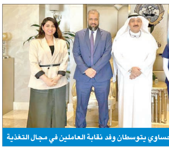
العوضي والحساوي يتوسطان وفد نقابة العاملين في مجال التغذية

وأوضحت أنه في ختام الجولة، التقى الوزير عدداً من الموظفين العاملين في المركز، حيث استمع إلى آرائهم حول