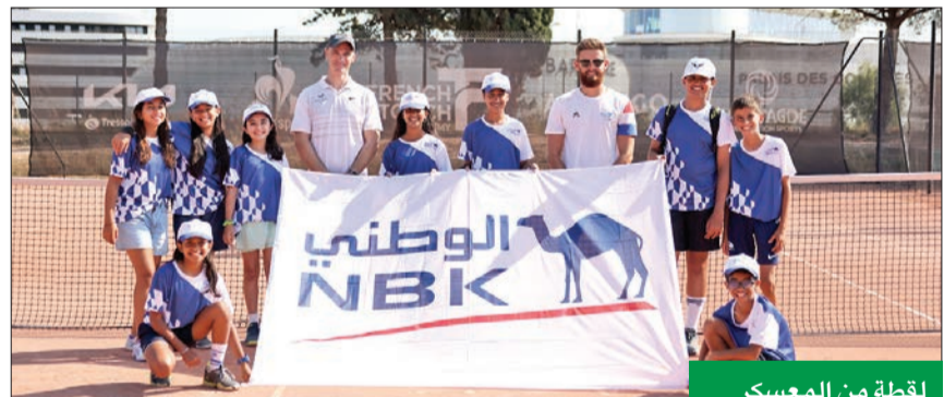
لقطة من المعسكر