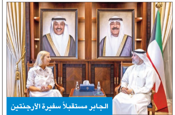
الجابر مستقبلاً سفيرة الأرجنتين

استقبل نائب وزير الخارجية السفير الشيخ جراح الجابر، أمس، سفيرة الأرجنتين كلاوديا زامبيري، بمناسبة انتهاء فترة عملها سفيرة لبلادها لدى دولة الكويت.