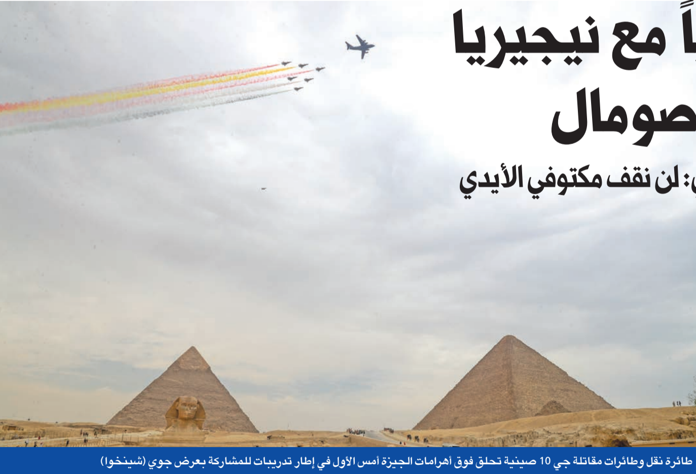
طائرة نقل وطائرات مقاتلة جي 10 صينية تطلق فوق إهرامات الجيزة أمس الأول في إطار تدريبات للمشاركة بعرض جوي

ورغم أن مصادر مصرية أفادت «الجريدة» بأن العمل على التوصل إلى مذكرة التفاهم الموقعة مع نيجيريا مستمر منذ نحو عامين، وبالتالي لا علاقة له بالتطورات في الصومال، فإن مراقبين بشيرون إلى سلوك مصري مختلف في المنطقة، خصوصاً مع إعلان إثيوبيا استكمال بناء سد النهضة في ديسمبر، رغم أن خبراء بينهم الخبر المصري عباس شراقي شككوا في صحة هذا الإعلان، خصوصاً لنجاحية قدرة أدريس إبابا على