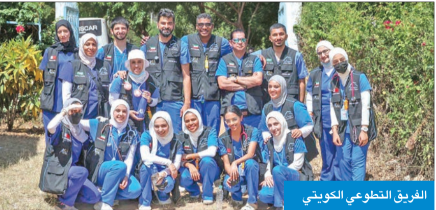
الفريق التطوعي الكويتي

مبادرة لافتة للفريق الكويتي، بهدف بث روح التضامن لدى الأجيال.