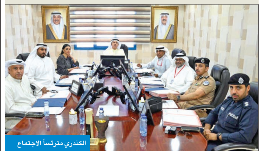
الكندري متروساً الاجتماع

● مجلس إدارته عقد سلسلة اجتماعات لمناقشة جدول أعماله