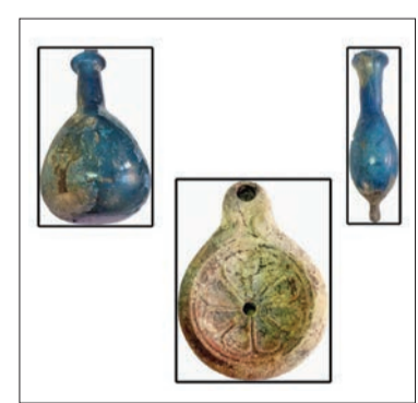
بعض القطع الأثرية المكتشفة

البارز، وفي المنتصف تم تجسيد باب بصلفتين يعلوه إفريز دوري يحتوي على زخرفة الأسنان، ومن تحتها توجد مائدة قربانين من الحجر الجيري. يشار إلى أن مرسى مطروح مدينة وميناء على البحر المتوسط، وهي عاصمة محافظة مطروح تقع قرب الحدود المصرية مع ليبيا على بعد 350 كيلومترا من القاهرة، وتتميز المدينة بشواطئها ذات الرمال البيضاء الناعمة والعياء الهادئة، وبها الخليج محمي من أعالي البحار بواسطة سلسلة من الصخور تشكل حاجز امواج طبيعي، مع وجود فتحة صغيرة للسماح بدخول السفن الخفيفة.