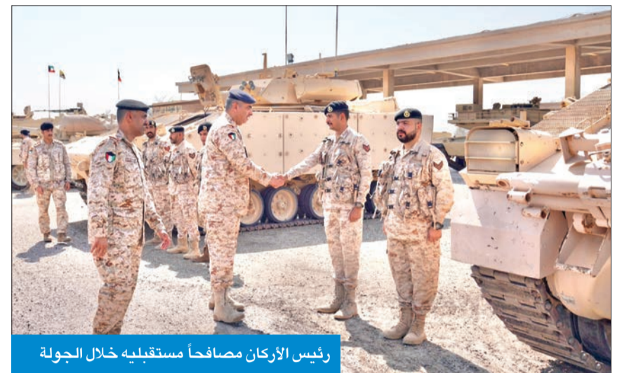
رئيس الأركان مصافحاً مستقبليه خلال الجولة

القائم والمشترك مع القطاعات العسكرية الأخرى في البلاد. كما قام بجولة ميدانية اطلع من خلالها على الأسلحة والمعدات والآليات العسكرية المستخدمة، والتعرف على طبيعة عملها ودورها بالمهام المسندة إليها.