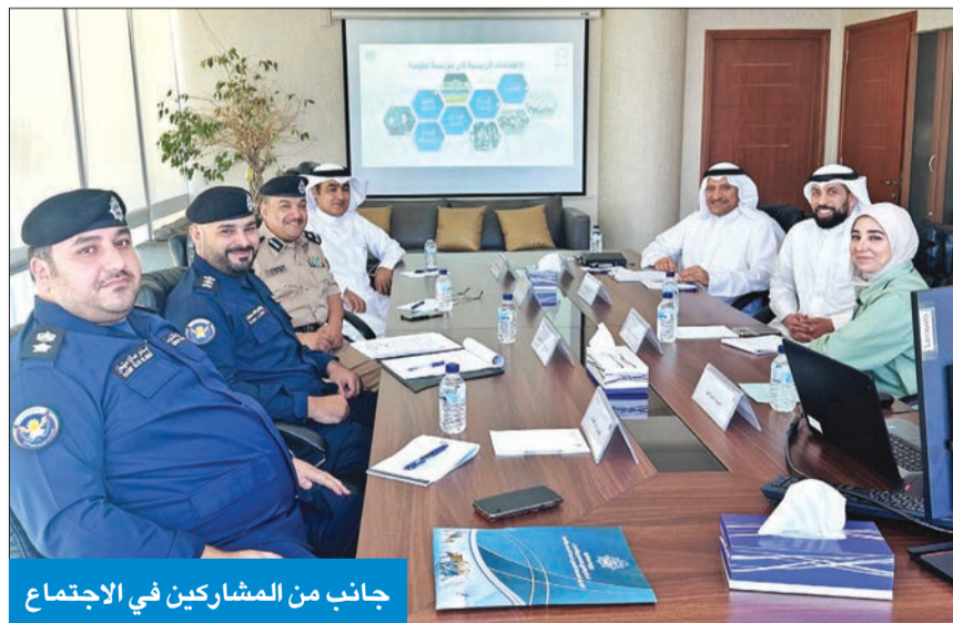
جانب من المشاركين في الاجتماع