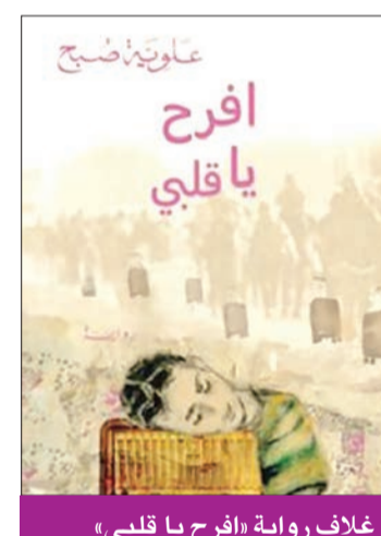
غلاف رواية «افرح يا قلبي»

أهتماك المرأة موجود في جل إبداعاتك، مما دفع النقاد لإطلاق لقب «كاتبة المرأة العربية في الأدب العربي»، ما الذي تناضلين من أجله في سبيل تقدم المرأة العربية؟