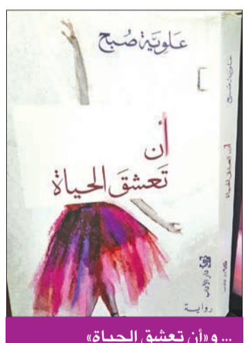
... وإن تعشق الحياة

الكاتب الحقيقي، برايب، يجب ألا ينافس غيره، وإنما ينافس نفسه، وما أنجزه سابقاً، حتى الآن بماثلاء الذات عن هذا النجاح الذي تتحدث عنه، فالعطش للتعبير ظلما لا يرتوي أبداً، وأسعى دائماً إلى عدم تقليل