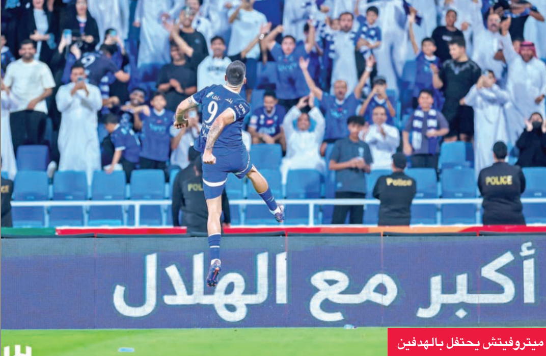
ميتروفيتش يحتفل بالهدفين

واصل النجم الصربي الكسندر ميتروفيتش هوابته التهديدية، ليقتود الهلال إلى الفوز على ضحك بصعوبة 3 - 2 أمس الأول الأربعاء، في المرحلة الثانية من الدوري السعودي لكرة القدم. وسجل للهلال ميتروفيتش هدفين (45) ومصعب الجوير (73)، بينما سجل