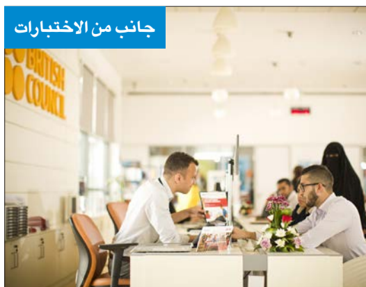
جانب من الاختبارات

النتائج الحاسوبية لاختبار اللغة تصدر خلال يومين فقط