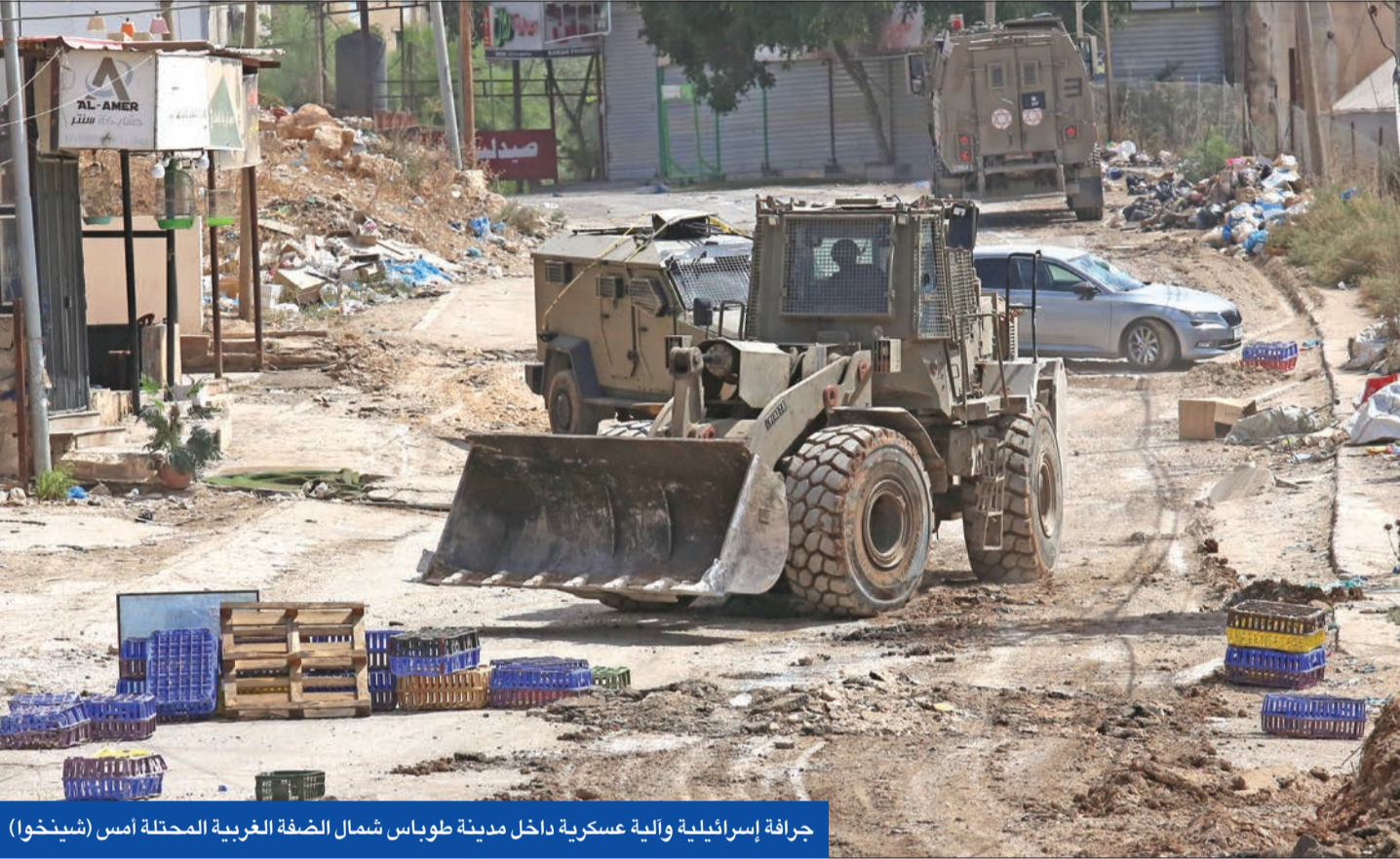
جرافة إسرائيلية والية عسكرية داخل مدينة طوباس شمال الضفة الغربية المحيطة أمس (شبنخوا)

«حماس» توافق وإسرائيل مترددة بإقرار «هدنة التطعيم» في غزة • تحرك أوروبي لمعاكبة وزراء إسرائيليين