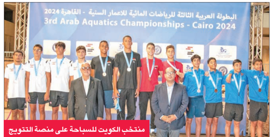
منتخب الكويت للسباحة على منصة التتويج

حفص منتخب الكويت للسباحة سبع ميداليات جديدة، منها ست برونزيات وفضية، في اليوم الرابع والأخير من منافسات البطولة العربية الثالثة للرياضات المائية للشباب والفتيات، المقامة في القاهرة، ليرفع رصيده الإجمالي إلى 26 ميدالية متنوعة.