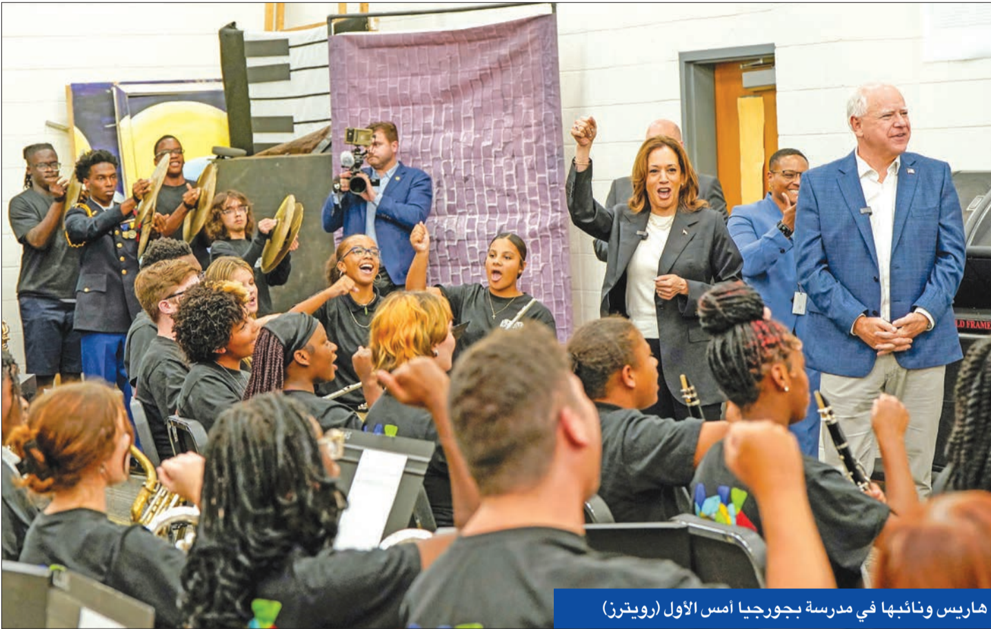
هاريس ونائبها في مدرسة بجورجيا أمس الأول

الرئاسي بعد انسحاب الرئيس بايدن المعادلة الانتخابية رأساً على عقب، حيث قال حوالي 73 بالمئة من الناخبين الديموقراطيين في الاستطلاع إنهم بانوا أكثر حماساً للتصويت، بينما وجد استطلاع «رويتزر/إبوس» في مارس الماضي أن 61 بالمئة من الديموقراطيين كانوا ينوون التصويت لبايدن بشكل أساسي لوقف ترامب. وفي هذا الصدد، قالت إيمي اليسون، وهي مؤسسة مجموعة ليدرالية تهدف لزيادة أعداد النساء الملونات في المناصب المنتخبة، «نرى في هذا الاستطلاع أن الناس أكثر تحفيزاً للمستقبل من الماضي. إنهم ينظرون لهاريس كمستقبل، في حين يرى الجمهوريون هذه الانتخابات على أنها تتعلق بترامب فقط. من المرجح أن ينخرط الناخبون عندما يُمنحون خياراً أكثر من هزيمة ترامب».