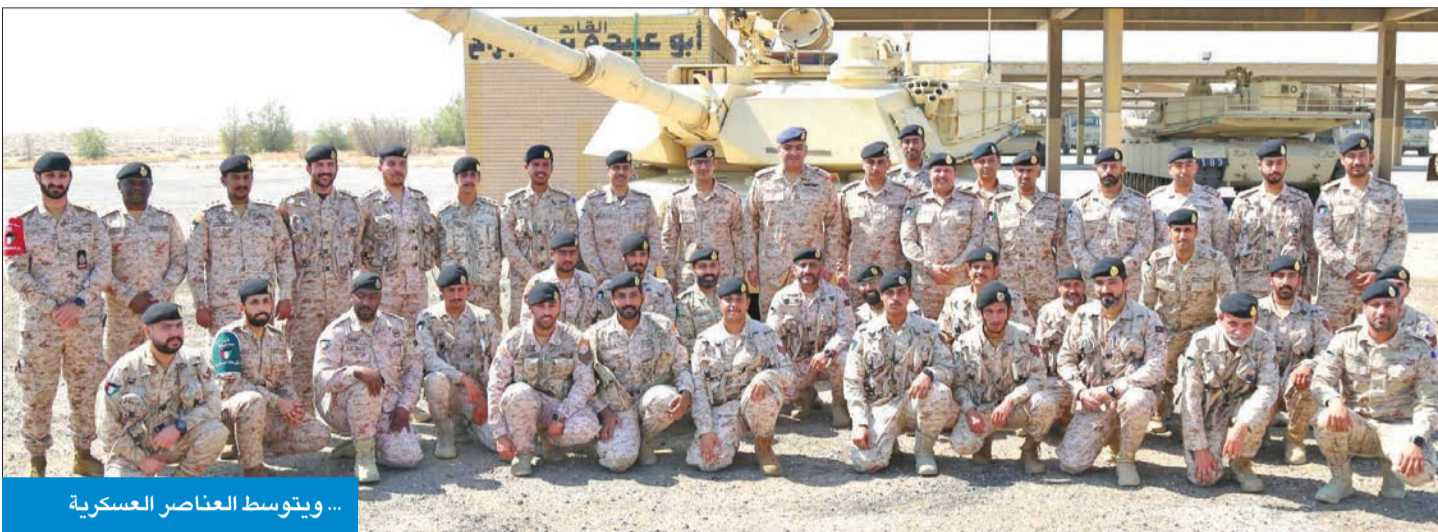
... ويتوسط العناصر العسكرية

● المزين تفقد لواءي مبارك المدرع / 15 وصالح المحمد الآلي / 94 ● «التأهيل والتدريب المستمر استعداداً لتنفيذ مختلف المهام والواجبات»