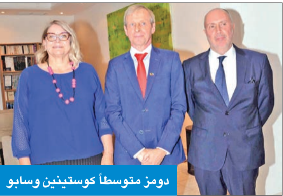
دومز متوسطاً كوستينين وسابو

من جهته، قال السفير البلجيكي: «لقد عززنا خلال رئاستنا دفاع أوروبا وتاهبها واستقلاليتها الاستراتيجية، وحافظت الرئاسة البلجيكية للاتحاد الأوروبي على دعمها الثابت لأوكرانيا، كما عملنا على معالجة الصراع في الشرق الأوسط، من خلال إعادة الانخراط مع (أونروا) وإطلاق عملية أسبديس التابعة لقوة الأمم المتحدة البحرية الأوروبية من أجل الأمن البحري في البحر الأحمر، إضافة إلى ذلك، فرضت عقوبات ضد أعضاء (حماس) و(الجهاد الإسلامي) الفلسطيني، وكذلك ضد المستوطنين الإسرائيليين العنيفين في الضفة الغربية».