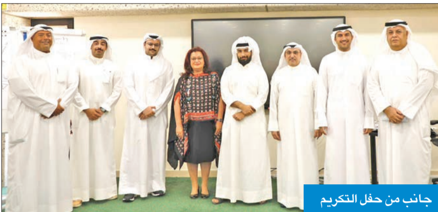
جانب من حفل التكريم

عددهم وصل إلى 1000 متدرب ومتدربة منذ إنطلاقه عام 2004