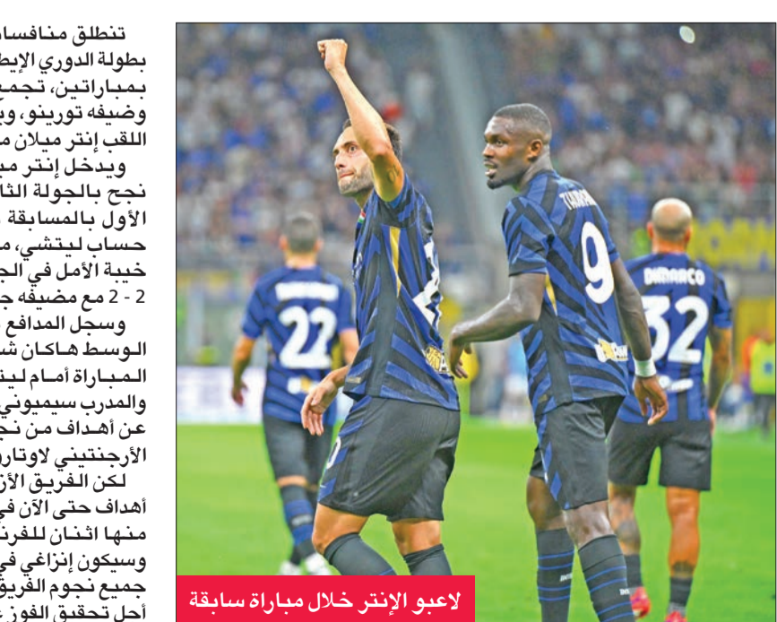
لاعبو الإنتر خلال مباراة سابقة

تنتقل منافسات الجولة الثالثة من بطولة الدوري الإيطالي لكرة القدم الجمعة بمبارتين، تجمع الأولى بين فينيزيا وضيئه تورينو، ويلعب في الثانية حامل اللقب إنتر ميلان مع ضيفه أتالانتا. ويدخل إنتر ميلان لمواجهة بعدما نجح بالجولة الثانية في تحقيق فوزه الأول بالمسابقة بهدفين نظيفين على حساب ليتشي، معوضاً جماهيره عن خيبة الأمل في الجولة الأولى، بالتعادل 2 - 2 مع ضيفه جنوه. وسجل الدفاع ماتيو دارميان ولاعب الوسط هاكان شالهان أوغلو، هدفي المباراة أمام ليتشي، لكن الجماهير والمدرب سيميوني إنزاجي مازالاً يبحثان عن أهداف من نجوم الفريق ولا سيما الأرجنتيني لوتارو مارتينيز. لكن الفريق الأزرق والأسود سجل 4 أهداف حتى الآن في الموسم الحالي، جاء منها اثنتان للفرنسي ماركوس تورام، وسيكون إنزاجي في حاجة لتضافر جهود جميع نجوم الفريق في الخط الأمامي من أجل تحقيق الفوز على فريق عنيد.