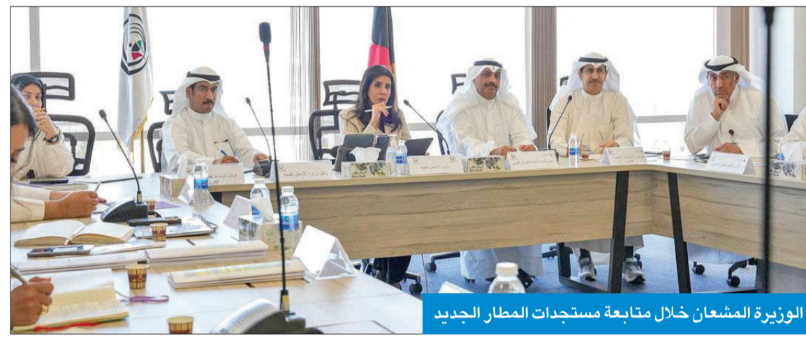
الوزيرة المشعان خلال متابعة مستجدات المطار الجديد

● وزيرة الأشغال أكدت تدليل جميع العقبات لإنجاز مشروع المطار الجديد «T2» ● «الكويت تستحق منا جميعاً العمل بروح الفريق الواحد للنهوض بالمشاريع والخدمات»