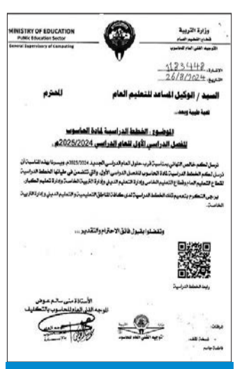
صورة ضوئية من كتاب الخطة الدراسية لمادة الحاسوب

إلى أن طلب نهاية الخدمة يقدم بمركز العمل، ويعتمد من صاحب العلاقة، على أن يعتمد المفوض بالتوقيع بحسب القرارات الوزارية، ويتم التأكد من اعتماد صاحب العلاقة وتوقيعه وتوكيل رسمي وتحديد تاريخ الاستقالة. وشدد على أنه يراعى قبل التقدم بالطلب مراجعة قسم الملفات بالمنطقة التعليمية للبحث في الملف عن مدى استحقاق استكمال المدة المطلوبة، ويكون تقديم الطلب قبل شهر من موعد نهاية الخدمة على الأقل، ليتمكن قسم نهاية الخدمة من بحث الطلب وإصدار القرار الإداري. وحول الراغبين بالاستفادة من مزايا المادتين 41 و42 بشأن حقوق ذوي الإعاقة، والراغبين بالاشتراك في التأمين التكميلي، أشار إلى أن تقديم الطلب يكون إلكترونياً عن طريق موقع الوزارة، مع ضرورة موافقة هيئة الإعاقة «التأمينات»، بكتاب رسمي قبل التقدم بالطلب وإرفاق نسخة من الموافقات، ويتعين على الموظف التأكد من إصدار قرارات التثبيت بعد النذب أو الغاء النذب، كما يجب التنسيق مع قسم الإجازات والدوام واستخراج إجازات الموظف خلال آخر 3 سنوات بالخدمة.