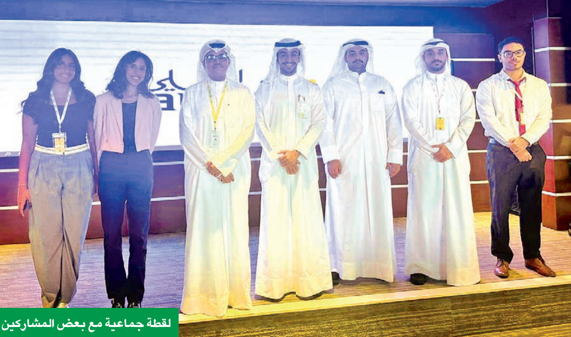
لقطة جماعية مع بعض المشاركين

إلى صالات المطارات في أكثر من 1000 مطار حول العالم، كما يمكنهم ربح نقاط الخليج على جميع مشترياتهم عبر البطاقة خلال الحملة الصيفية، ويمكن استبدال هذه النقاط برحلات مجانية أو حجوزات فندقية أو باقات سفر.