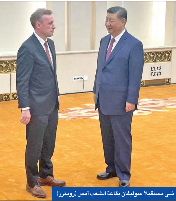
شي مستقبلاً سوليفان بقاعة الشعب أمس (رويتزر)

اتهمت وزيرة الخارجية الألمانية، آنتاليا بربو، أمس، الرئيس الروسي فلاديمير بوتين بالتخصير لـ «حرب برودة» جديدة ضد أوكرانيا. وخلال مشاورات لوزراء خارجية الاتحاد الأوروبي، قالت بربو في بروكسل أمس إن البنية التحتية الخاصة بإمدادات الطاقة والمياه تعرضت لهجمات بشكل متعمد خلال الأسابيع والشهور الماضية «بهدف جعل الناس يتعمدون بالنساء في أسوأ الحالات». وقالت بعثة أوكرانية إلى الوكالة الدولية للطاقة الذرية، أمس، إن الهجوم الذي شنته روسيا بطائرات مسيرة وصواريخ يوم الاثنين أجبر أوكرانيا على فصل عدد من وحدات الطاقة النووية عن الشبكة، وهو ما يشكل خطراً «مسيحاً لتعطيل تشغيل محطات الطاقة النووية في البلاد، والتي تمد أوكرانيا بمعظم الكهرباء». وشنت روسيا يوم الاثنين «اضخم» هجوم لها على أوكرانيا باكثر من 200 صاروخ وطائرة مسيرة، مما أسفر عن مقتل 7 أشخاص، وشمل قصف منشآت الطاقة في أنحاء البلاد. وكثفت روسيا هجماتها على شبكة الطاقة الأوكرانية منذ مارس الماضي، فيما قالت كيف إنه فيما يبدو سعى لتقويض شبكة الكهرباء قبيل الشتاء المقبل عندما تشتد الحاجة إلى الكهرباء ونظمته التدفئة.