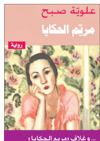
... وغلاف «مريم الحكايا»