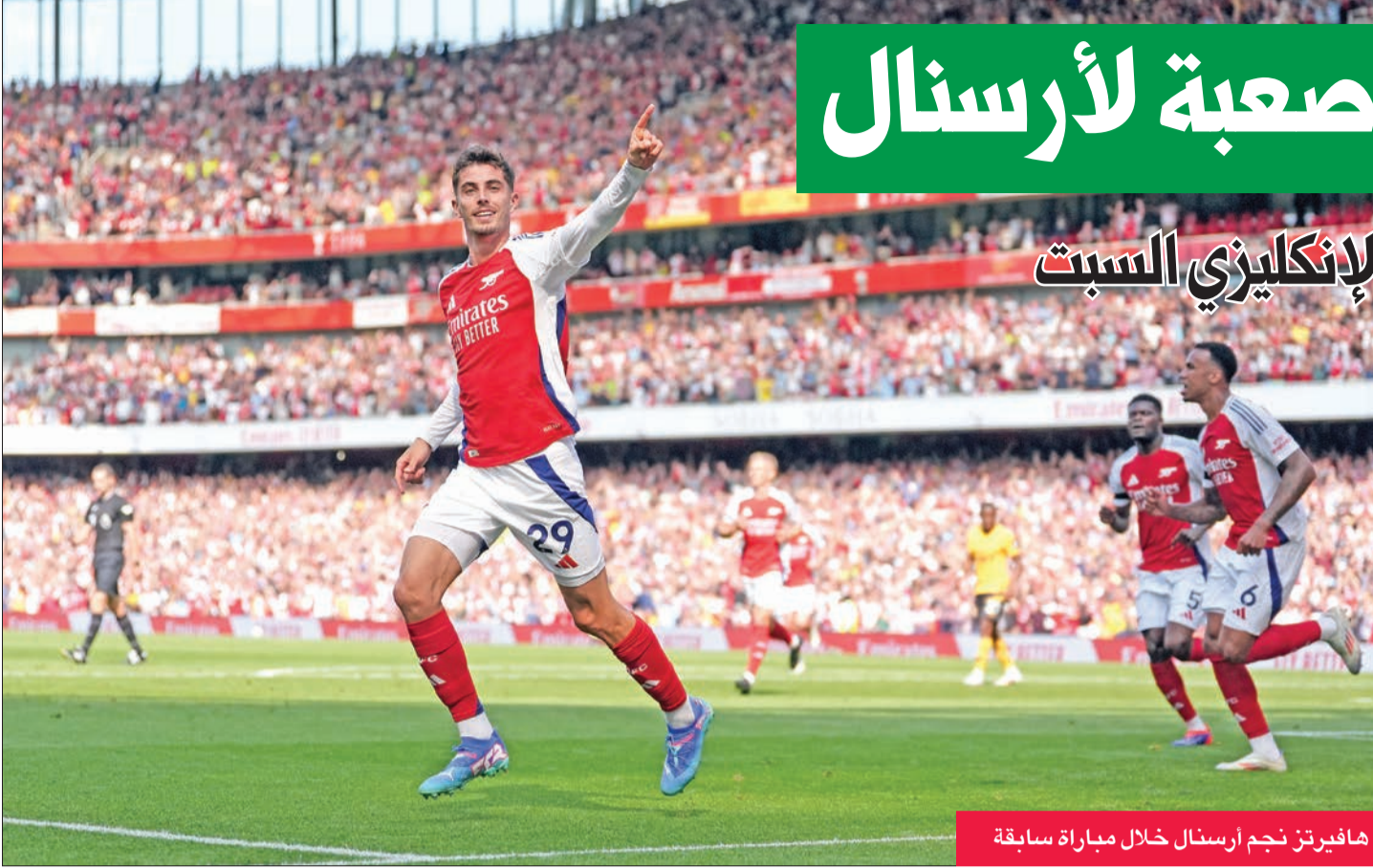
هايفيرتز نجم أرسنال خلال مباراة سابقة

يسعى مانشستر سيتي لتحقيق فوزه الثالث والحفاظ على صدارة الدوري الإنكليزي الممتاز التي يتقاسمها مع برايتون وأرسنال وليفربول، وذلك عندما يحل ضيفا على وست هام غدا السبت في الجولة الثالثة من المسابقة.