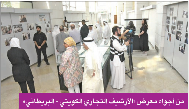
من أجواء معرض «الأرشيف التجاري الكويتي - البريطاني»

يُذكر أن دشتي أقيم أخيراً بالمكتبة معرض «من الأرشيف التجاري الكويتي الوطني» وتطرق المعرض للتاريخ التجاري بين