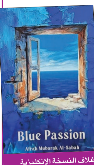
غلاف النسخة الإنكليزية

صدر عن دار الفراشة للنشر والتوزيع النسخة الإنكليزية لديوان «شغف أزرق»، للشاعرة الشبيخة أفرح الصباح، وقام بالترجمة شركة إنترلينغوال للترجمة والاستشارات اللغوية لمؤسستها صافية الخطيب. وبهذه المناسبة، قالت الصباح في سياق حديثها عن ترجمة ديوانها: تساعد ترجمة الشعر إلى اللغة الإنكليزية على نقل الأفكار والمشاعر والثقافة من خلال اللغة الأصلية إلى لغة أخرى، حيث يمكن للأشخاص الذين لا يتحدثون العربية الاستمتاع وتقدير جمال وعمق الشعر العربي، إضافة إلى تعزيز التواصل الثقافي بين اللغات، كما تساهم الترجمة في تبادل الخبرات والمعارف، فمن خلال ترجمة الشعر إلى الإنكليزية، يمكن للقراء الأجانب الاستفادة من خيرات وأفاق جديدة تُقدمها ثقافات العالم الأخرى، مما يساهم في تبادل المعرفة والتعلم المستمر. وأوضحت أن الترجمة تلعب دوراً حيوياً مهماً في تواصل الشعوب وعدم الانغلاق على ثقافة واحدة معينها، مما يساهم في إثراء الساحة الثقافية العالمية، ويجدد حيويتها وسعة انتشارها، «وهو ما جعلني أنجح إلى ترجمة ديواني الأخير، كي يقرأ جمهور آخر يتحدث بلغة مختلفة، وهذا الأمر في حد ذاته مفيد لكل الأطراف». تجدر الإشارة إلى أن ديوان «شغف أزرق» يتكون من عشرين