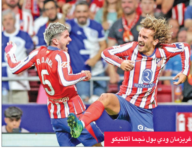
غريزمان ودي بول نجما أتلتيكو

واصل أتلتيكو مدريد انتصاراته في «الليغا»، بفوزه المستحق على ضيفه «الجريح» فالنسيا (0-3) في المباراة التي احتضنها ملعب سيبيناس ميتر وبوليتانو، الأحد، ضمن الجولة الخامسة بدوري الدرجة الأولى الإسباني لكرة القدم. وافتتح الواصل الأخير من اللقاء، وضع الدولي كورنر غالاغر باب التسجيل وأهداه مع الفريق المرديدي (54). وعزز النجم الفرنسي أنطوان غريزمان التقدم بهدف جديد (54)، وهو ثاني أهدافه مع الفريق هذا الموسم، بعد هدفه في شبك جيرونا بالجولة الثانية. وفي الأنفاس الأخيرة من اللقاء، وضع النجم الأرجنتيني خوليان الفاريز بصمته الأولى مع أتلتيكو، بعد الانتقال لصفوفه في الميركاتو الصيفي الماضي من مانشستر سيتي الإنكليزي، بالهدف الثالث في الوقت المحتسب بدلا من الضائع. وياقتصاره الثاني تواليًا، الثالث هذا الموسم، يرفع فريق الأرجنتيني دييغو سيميوني رصيده إلى 11 نقطة في المركز الثالث، بفارق الأهداف خلف جاره اللدود