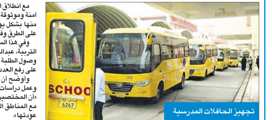
تجهيز الحافلات المدرسية