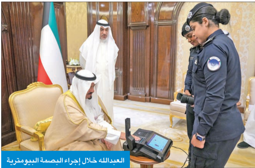
العبدالله خلال إجراء البصمة البيومترية

كما بعث ببرقية تهنئة إلى رئيس المكسيك، أندريس أوبرادور، بمناسبة العيد الوطني لبلاد. وبعث سمو رئيس مجلس الوزراء ببرقية إلى الرئيس عثمان غزالي رئيس جمهورية القمر المتحدة أعرب فيها سموه عن خالص التهنئة لسلامته إثر تعرضه للاعتداء الأثم أثناء المشاركة في مراسم عزاء أحد شيوخ العشائر.