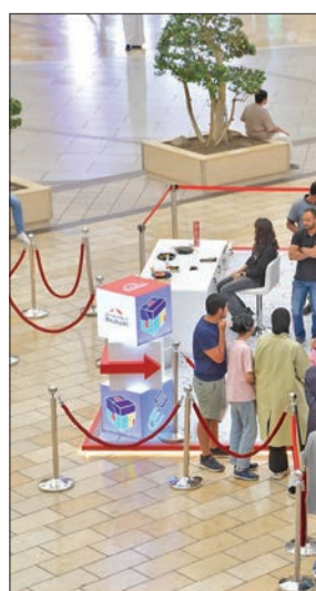
فعالية Boubyan Mind Games

مشارك تمكن من حل معضلة لغز اللعبة في أقل وقت، حصل على جائزة فورية قيمة من بنك بوبيان، إلى جانب تأهله للدخول في سحب على جوائز نقدية قيمة، تشجيعاً على ممارسة الألعاب الهادفة إلى رفع القدرات الذهنية للصغار والكبار وترفع مستويات التحدي بينهم.