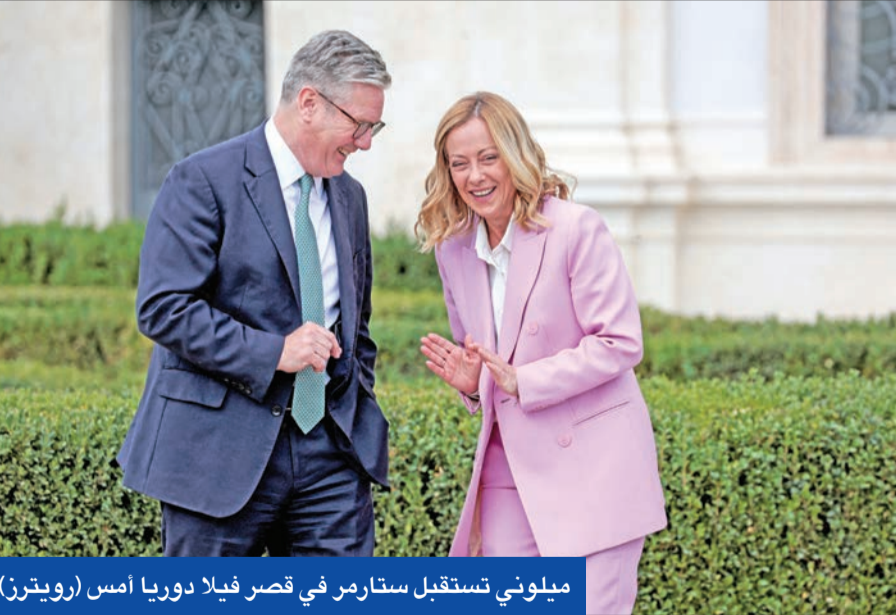
ميلوني تستقبل ستارمر في قصر فيلا دوريا أمس

المتشددين الإسلاميين والجرائم الخطيرة العابرة للحدود، وأثارت هذه الإجراءات انتقادات من جيران ألمانيا. فقد دعا رئيس الوزراء البولندي دونالد توسك إلى إجراء مشاورات عاجلة مع البلدان المتضررة الأخرى التي تخشى أن تضطر إلى استيعاب المزيد من طالبي اللجوء وتعرض تجارتها لأضرار. كما حذر المستشار النمساوي كارل نيهامر من أنه إذا اتخذت ألمانيا تدابير لإعادة المزيد من المهاجرين من الحدود مع النمسا سترد بالمثل بإرسال المزيد من الأشخاص شرقاً نحو البلقان. ومن المقرر أن تستمر عمليات التفيتش على الحدود مع النمسا حتى 11 نوفمبر 2024. وعلى نحو مماثل، من المقرر أن تستمر عمليات التفيتش على الحدود مع بولندا وجمهورية التشيك وسويسرا حتى 15 ديسمبر 2024. وأشارت وزارة الداخلية الألمانية إلى أنه من المرجح أن يكون هناك تمديدات أخرى لفترة تنفيذ هذه الضوابط.