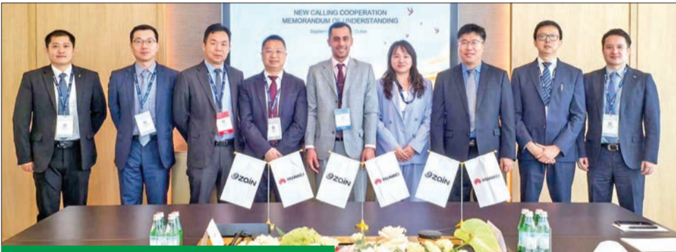
جانب من توقيع مذكرة التفاهم مع «هواوي»