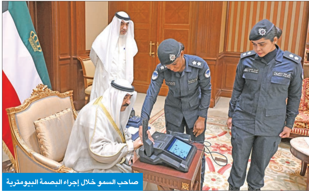
صاحب السمو خلال إجراء البصمة البيومترية

رئيس الولايات المكسيكية المتحدة أندريس مانويل لوبيز أوبرادور عبر فيها سموه عن خالص تهنئته بمناسبة العيد الوطني لبلاد، متمنياً له موفور الصحة والعافية، وشعبها كل التقدم والأزدهار. وبعث صاحب السمو ببرقية إلى رئيس جمهورية القمر المتحدة الشقيقة عثمان غزالي عبر فيها سموه عن خالص التهنئة لسلامته إثر تعرضه للاعتداء الأثم أثناء المشاركة في مراسم عزاء أحد شيوخ العشائر. وعبر سموه عن الاستنكار الشديد لهذا العمل الإجرامي الذي يتنافى مع كافة المبادئ والقيم الإنسانية، متمنياً سموه للرئيس غزالي السلامة الدائمة وموفور الصحة والعافية وكل التوفيق والسداد في خدمة البلد الشقيق.