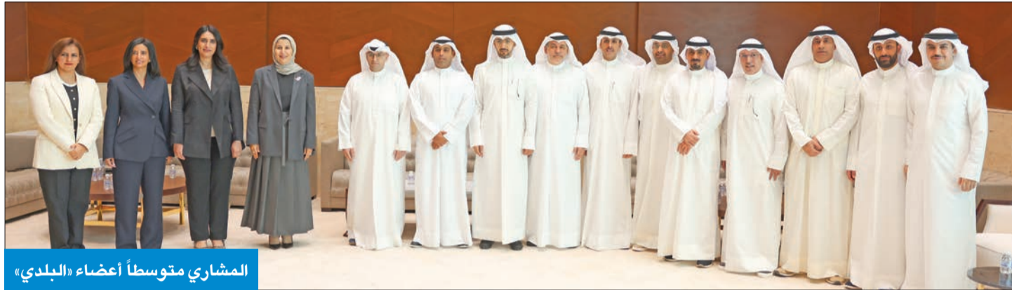
المشاري متوسطاً أعضاء «البلدي»

وزير البلدية زار أعضاء المجلس البلدي وبحث معهم لوائح البناء والحدائق والمظلات «البلدي جزء لا يتجزأ من العملية العمرانية بالدولة وتشكيله من خيرة الشباب»