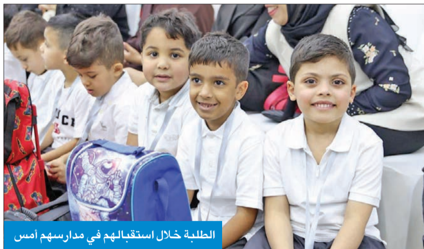
الطلبة خلال استقبالهم في مدارسهم أمس

وقالت وزارة التربية إن إجمالي عدد الطلاب والطالبات الملتحقين بمدارس التعليم العام والمدارس الأهلية العربية بالتعليم الخاص بلغ 497206 متعلمين و متعلمات بواقع 29637 طفلاً في مرحلة الرياض، و 149316 طالباً وطالبة في المرحلة الابتدائية، و 127548 طالباً في المرحلة المتوسطة، و 92564 طالباً في المرحلة الثانوية بالمدارس الحكومية، موضحة أن عدد طلبة مدارس التربية الخاصة يبلغ 692 طالباً وطالبة، في حين يبلغ بمعاهد التعليم الديني 3159 طالباً وطالبة، أما في المدارس الخاصة العربية فيبلغ عدد المتعلمين 84463 طالباً وطالبة. وفي هذا السياق، كانت انطلاقاً من العام الدراسي في يومها الأول موفقة، حيث استقبلت المدارس الابتدائية