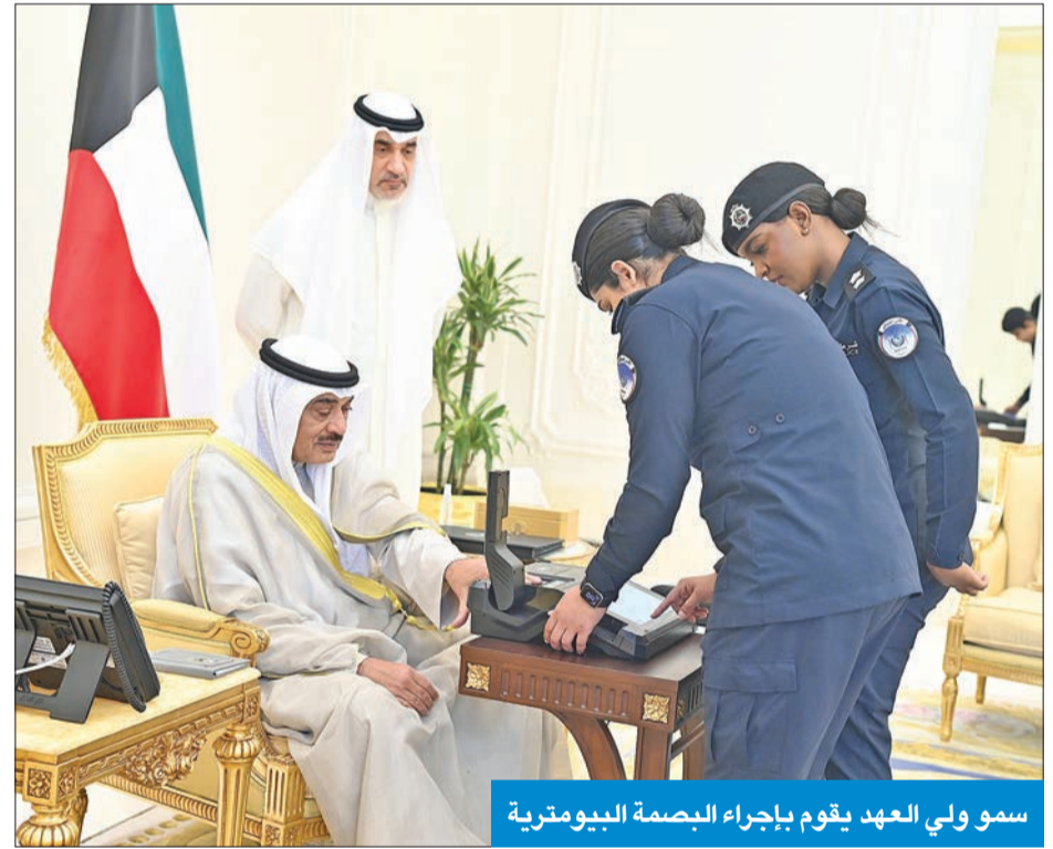
سمو ولي العهد يقوم بإجراء البصمة البيومترية

سموه أجرى «البيومترية» واستنكر الاعتداء على رئيس جمهورية القمر