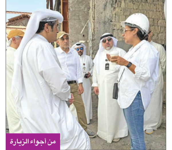
من أجواء الزيارة

قام وفد من المجلس الوطني للثقافة والفنون والآداب، ترافقه مجموعة من المختصين من فريق العمل الاستشاري لمتابعة أعمال معالجة آثار حريق المباركية، ومشروع تطوير المباركية، ومقاوم المشروع، وزيارة لسوق المباركية الذي تعرض لحريق منذ فترة، وذلك لمتابعة أعمال معالجة آثار هذا الحريق، ومشروع تطوير السوق التاريخي، والتحقق من الأعمدة التي تم اكتشافها أخيراً، بعد أن كانت مدفونة تحت الأرض. وتأتي هذه الزيارة في إطار الجهود المستمرة لإعادة إعمار الموقع المحترق من سوق المباركية، وهو أحد المعالم التاريخية في البلاد. وفي هذا الإطار، أكد الأمين العام للمجلس، د. محمد الجبار، أهمية دراسة هذا الاكتشاف