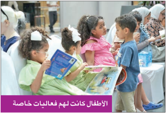
الأطفال كاث لهم فعاليات خاصة