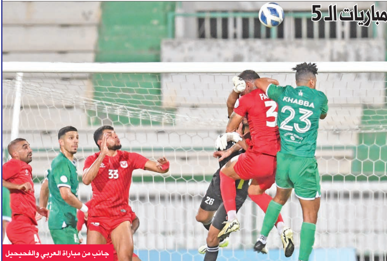
جانب من مباراة العربي والفحيحيل