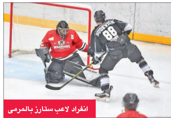
انفراد لاعب ستارز بالمرمي