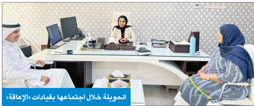
الحويلة خلال اجتماعها بقيادات «الإعاقه»

أعلنت وزارة الشؤون الاجتماعية، في بيان، رداً على خبر «الجريدة» المنشور في عددها الصادر، أمس، بعنوان «الشؤون» تسحب قريباً قرار عزل عضوي «تعاونية»، إن «القرار الوزاري الصادر أخيراً بعزل عضوي مجلس