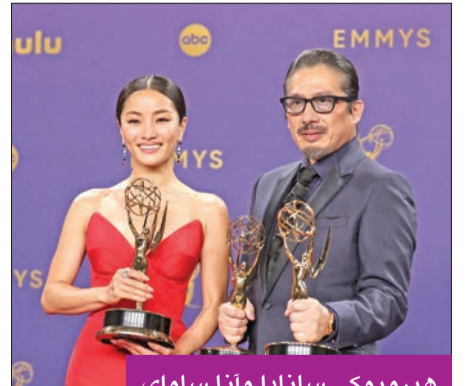
هيرويوكي سانادا وأنا ساواي

دخل مسلسل «Shogun» (شوغن) الياباني تاريخ جوائز «إيمي»، وهي جوائز أميركية تقدمها أكاديمية فنون وعلوم التلفزيون لتكريم أفضل البرامج التلفزيونية الأميركية، أمس الأول، بحصده عدداً قياسياً من الجوائز، بلغ 18 جائزة، بينها أفضل مسلسل، ليصبح أول عمل غير ناطق بالإنكليزية يحصل على الجائزة الرئيسية في هذا المسابقة الملقبة «أوسكار التلفزيون»، في الاحتفال السادس والسبعين لجوائز إيمي.