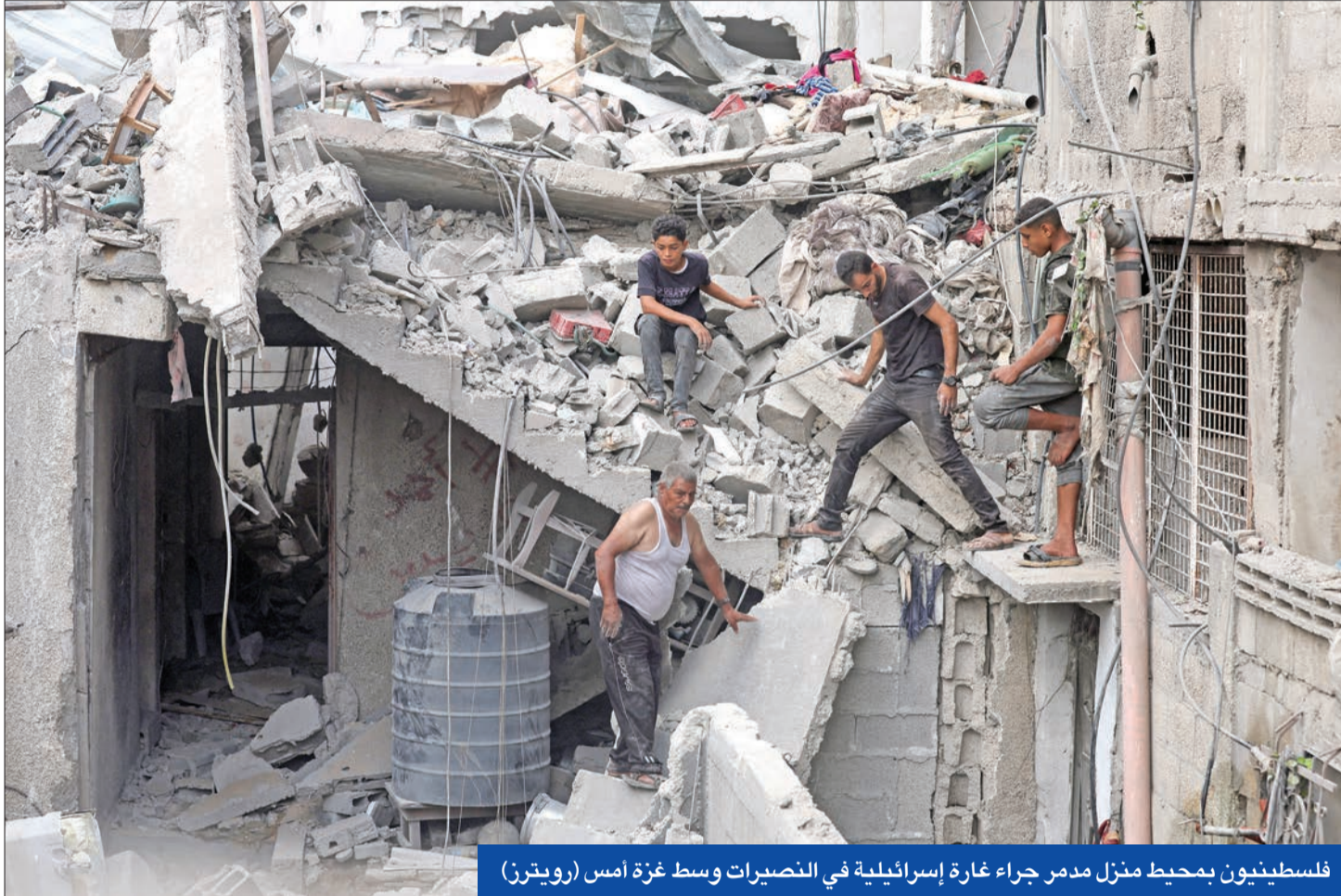
فلسطينيون بمحيط منزل مدمر جراء غارة إسرائيلية في النصيرات وسط غزة أمس

شكل إدارة القطاع في هذه المرحلة، ومن بين الاقتراحات الجاري بحثها إقامة هيئة إدارة محلية تتشكل من شخصيات مستقلة، ومنها تشكيل حكومة تكنوقراط بموافقة الحركتين وبقية الفصائل.