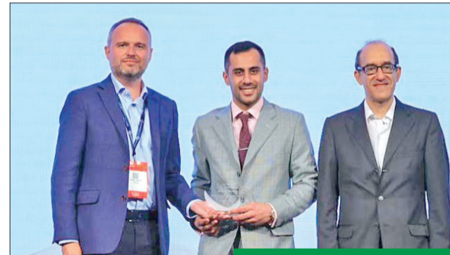
المتلا متسلمة الجائزة في دبي

تلقتها العديد من الإنجازات في تطوير تقنيات الجيل الخامس لتطوير تجربة العملاء الرقمية. وما زالت الشركة تستثمر في البنية التحتية الخاصة بشبكتها للجيل الخامس وفق أعلى المعايير العالمية، لتحقيق أعلى مستويات الكفاءة التشغيلية والسرعات، واكتشاف بيئات الأعمال التي توفرها هذه التقنية المتطورة، لخدمة كل احتياجات عملائها الأفراد، والهياكل والشركات، والمؤسسات الحكومية وغيرها.