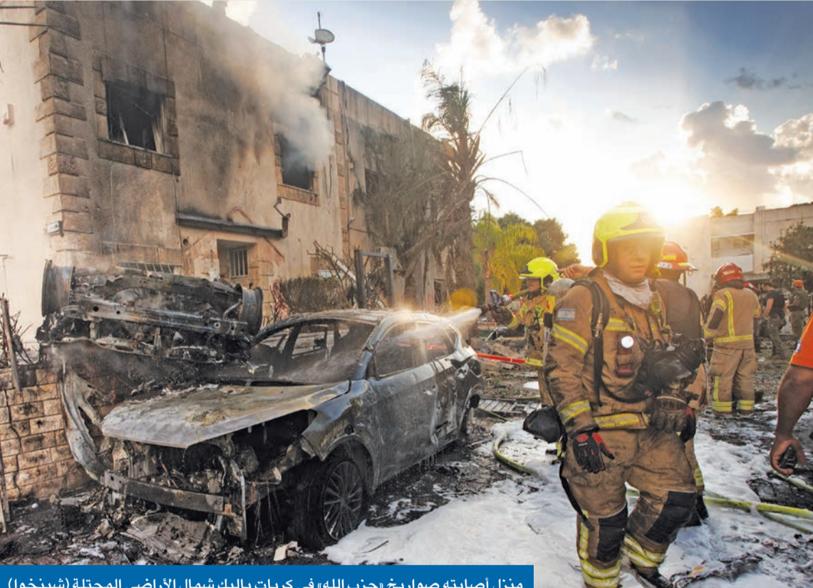
منزل أصابته صواريخ «حزب الله» في كريات باليك شمال الأراضي المحتلة (شنيخو)

طهران تسمح لـ «حزب الله» باستخدام أسلحة كانت اتفقت مع واشنطن وباريس على تحييدها