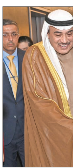
سموه خلال لقائه الرئيس الفلسطيني

مكان في مستقبلنا، حتى لا ننزلق إلى عالم تسوده سياسة الغاب». وناقش سموه في تنفيذ مشاريع تنموية متنوعة في 105 دول. واستذكر ممثل الأمير باعتزاز جهود دولة الكويت وتقديمها وتحياتها للفقرات المتعلقة بعملية إصلاح مجلس الأمن، وناشد سموه «المجتمع الدولي للدفع بشكل أكبر للخفاوض والعمل على تسريع وتيرة إصلاح منظومتنا الدولية؛ حتى نترجم واقعنا القائم وتحدياتنا الراهنة، وصولاً إلى مجلس أمن شامل.. فعال... شفاف... خاضع للمساءلة». وأشار سموه إلى أن دولة الكويت حرصت بعد استقلالها بفترة وجيزة في عام 1961 على تأسيس الصندوق الكويتي للتنمية الاقتصادية العربية، إيماناً منها بأهمية الدفع بتعزيز الأسس الإنمائية للكثير من الدول النامية والأقل نمواً، حيث قدم الصندوق منذ ذلك