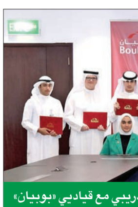
صورة جماعية لخريجي البرنامج التدريبي مع قياديي «بوبيان»