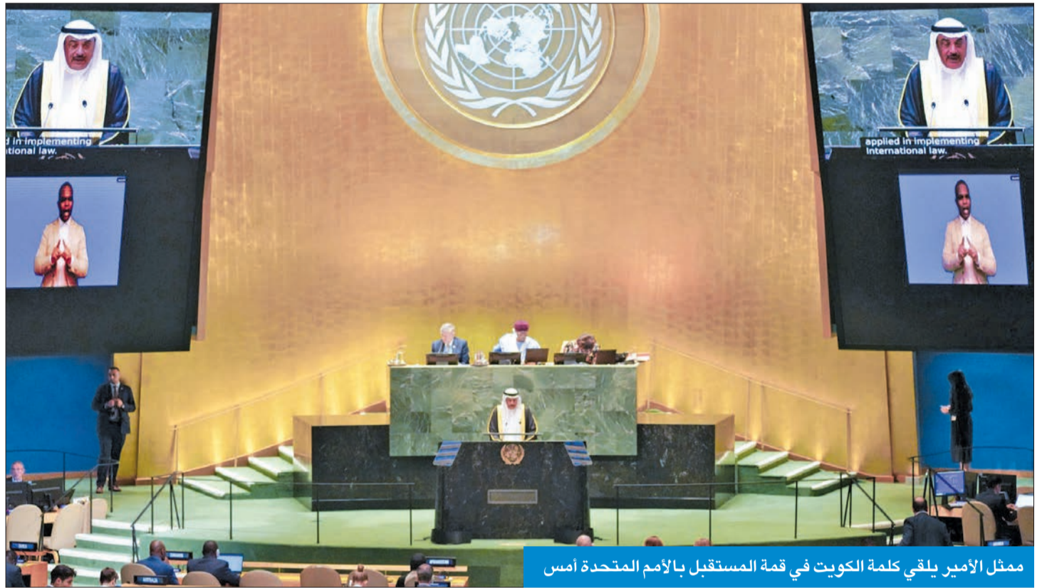
ممثل الأمير يلقي كلمة الكويت في قمة المستقبل بالأمم المتحدة أمس

يانغ، حيث نقل سموه له تحيات سمو الأمير. وقدم التهنية له بمناسبة نيله ثقة المجتمع الدولي، متمنياً له الكفاءة والتميز في أداء مهامه. أعماله الجديدة، مؤكداً دعم الكويت لجهودها بهدف التيسير بين الدول الأعضاء بهدف حلحلة القضايا الموضوعية العديدة التي تطرح بشكل مستمر في اجتماعات الجمعية العامة. من جانبه، أعرب رئيس الجمعية العامة عن بالغ شكره وتقديره للكويت بقيادة وشعبها على إسهاماتها البارزة ودعمها للاحتفال لمنظمة الأمم المتحدة والأجهزة الفنية التابعة لها. كما جرى خلال اللقاء بحث آخر المستجدات على الساحتين الإقليمية والدولية، ودور الأمم المتحدة في إرساء أسس السلم والأمن الدوليين لتحقيق الاستقرار في منطقة الشرق الأوسط والعالم أجمع وتنفيذ أهداف التنمية المستدامة لعام 2030.