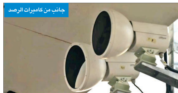
جانب من كاميرات الرصد

بمقانون المرور، داعية قائدي المركبات إلى ضرورة الالتزام بقواعد السير والمرور، والتقيّد باستخدام حزام الأمان، وتجنّب استخدام الهاتف أثناء القيادة، وحفاظاً على سلامتهم وسلامة مرادتي الطريق. وأكدت أن تطبيق هذه الأنظمة يأتي ضمن استراتيجية شاملة لتعزيز الأمن المروري وتقليل