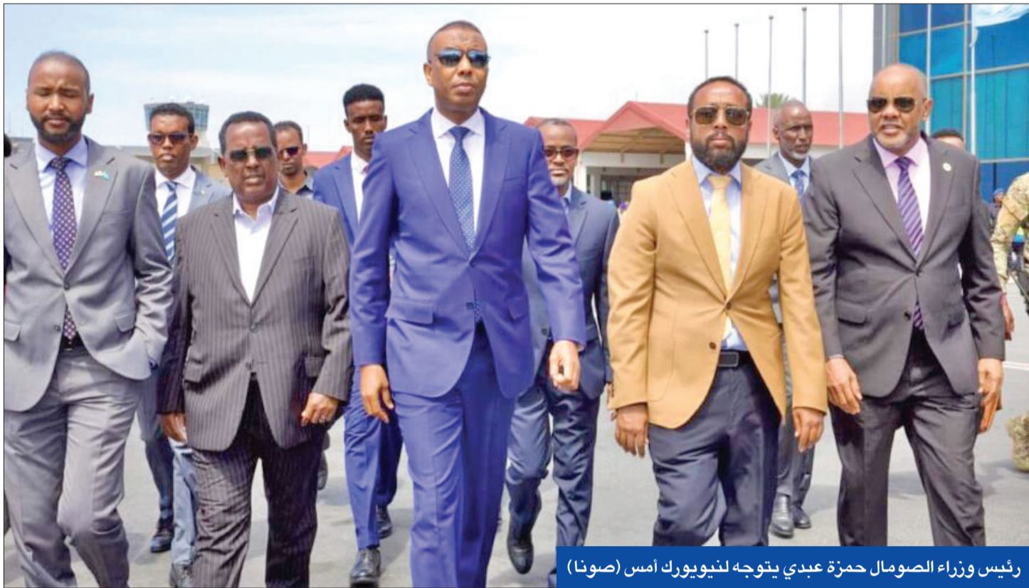
رئيس وزراء الصومال حمزة عبيدي يتوجه لنيويورك أمس