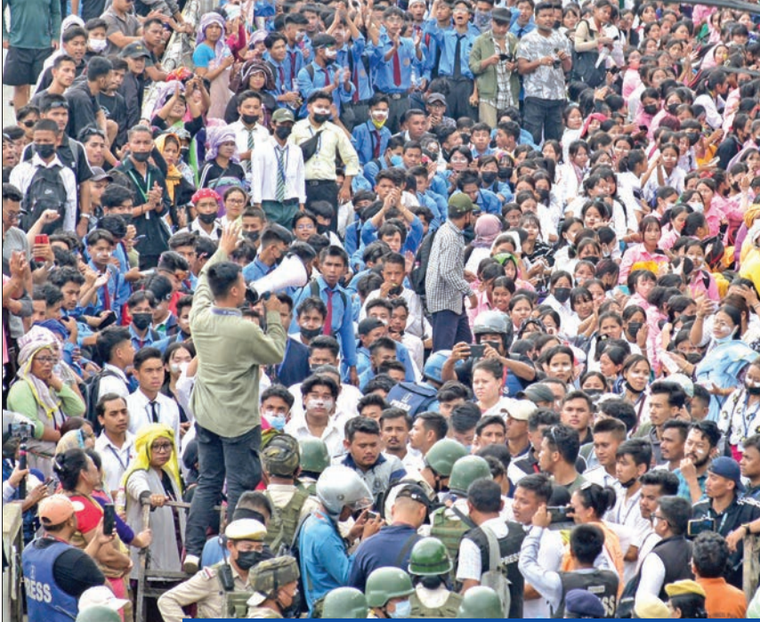
تظاهرة ضد العنف في إيفال عاصمة مانيبور قبل أيام