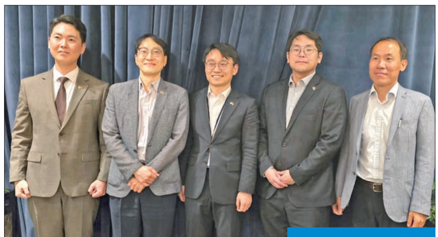
الفريق الدبلوماسي الكوري

المشاركة في رؤية الكويت 2035 بما في ذلك تطوير الجزر والموانئ، وستواصل دعم مشاريع مختلفة من