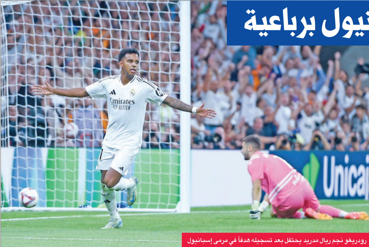
رودريغو نجم ريال مدريد يحتفل بعد تسجيله هدفاً في مرعى إسبانيول

عوض ريال مدريد حامل اللقب تأخره بهدف ليهزم ضيفه إسبانيول 4-1 أمس الأول ضمن المرحلة السادسة من الدوري الإسباني لكرة القدم. وانتظر الفريقان الشوط الثاني لتسجيل الأهداف الخمسة على ملعب سانتياغو برنابيو، فقلب «ميرينغي» الطاولة على إسبانيول الذي تقدم بهدف الحارس البلجيكي تيبو كورتوا عن طريق الخطأ (54)، ليسجل رباعية تناوب عليها داني كارفاخال (58)، والبرازيليان رودريغو (75)، وفينيسيوس جونيور (78)، والفرنسي كيليان مبابي (90) من ركلة جزاء.