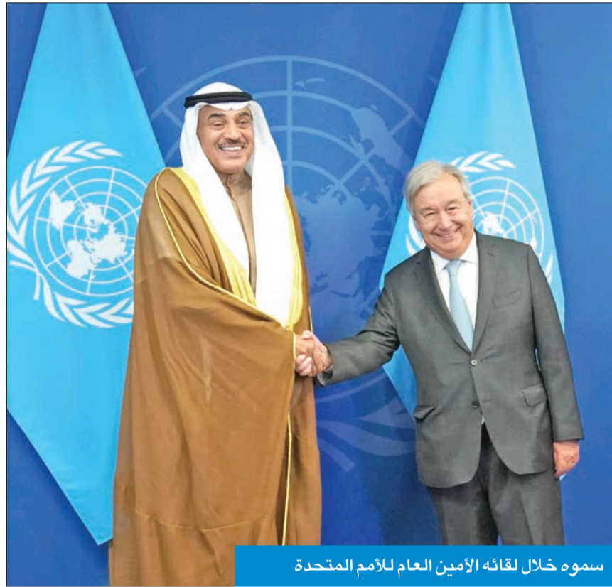
سموه خلال لقائه الأمين العام للأمم المتحدة