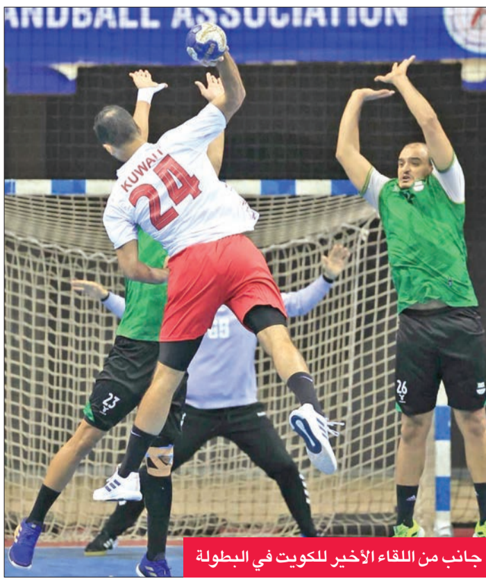
جانب من اللقاء الأخير للكويت في البطولة

القطري متصدر مجموعته الثانية في الدور الأول الأقرب لحسمها والصعود لنصف النهائي نظراً لمستوى المميز الذي ظهر به الفريق خلال مباريات الدور الأول بالمقارنة بأداء