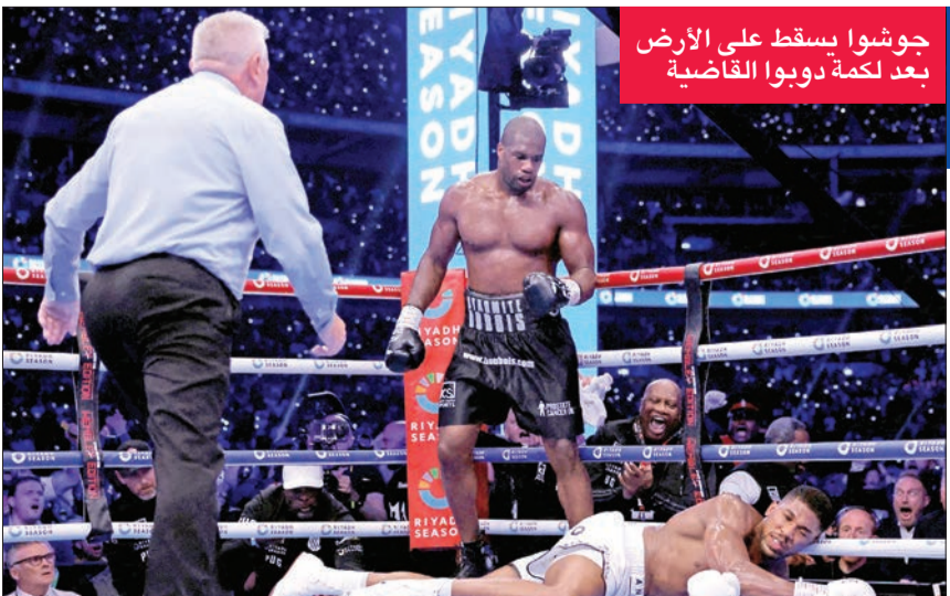
جوشوا يسقط على الأرض بعد لكمة دويو القاضية

وفرض ابن الـ 27 عاماً تفوقه منذ البداية وأسقط مرات عدة مواطنه الفائز مرتين باللقب العالمي الموحد للوزن الثقيل. ويعد 59 ثانية فقط على