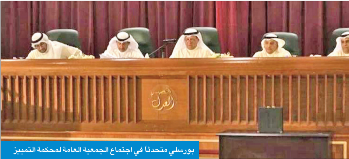
بورسلي متحدثاً في اجتماع الجمعية العامة لمحكمة التمييز

«القضاء الكويتي أثبت على مر السنين قدرته على حمل الأمانة»