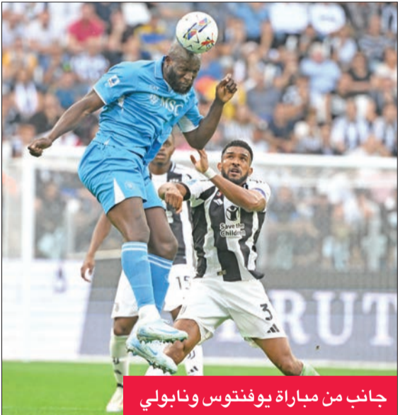
جانب من مباراة يوفنتوس ونابولي

حسم التعادل السلبي موقعة يوفنتوس ونابولي ضمن الجولة الخامسة من الدوري الإيطالي لكرة القدم. وعلى استاد اليانز ستاديو، فشل الفريقان في التظفر بنقاط المواجهة الثلاث.