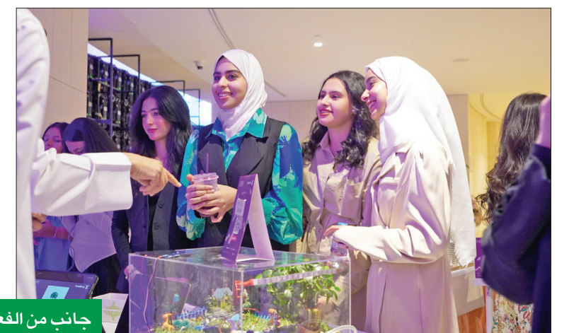
جانب من الفعالية