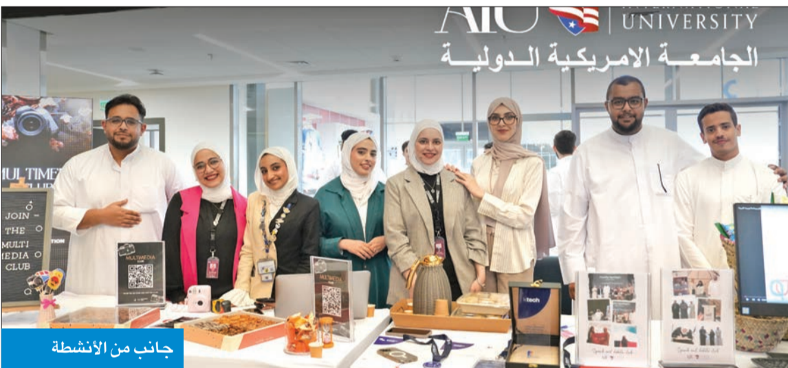
جانب من الأنشطة

احتفلت الجامعة الأمريكية الدولية (AIU) بسلسلة من الأنشطة الجذابة خلال أسبوع الطلاب الجدد على التكيف مع الحياة الجامعية والتواصل مع زملائهم. وتميّز الأسبوع هذا العام بجلسات مفتوحة، ولقاءات ومبادرات يقودها الطلاب وطوال الأسبوع، أتاحت للطلاب فرصة استكشاف مختلف الأقسام، بما في ذلك: الإرشاد، وخدمات التوظيف، ومركز الرياضة، خلال جلسات مفتوحة مخصصة. وقدمت هذه الفعاليات موارد أساسية، ودعمًا للنجاح الأكاديمي والشخصي في AIU، وإضافة إلى الجلسات المفتوحة للأقسام، شمل أسبوع الترحيب لقاء مع أعضاء هيئة التدريس من جميع كليات الجامعة، بما في ذلك: الأقسام الهندسية والحاسوب والهندسة المعمارية والتصميم والآداب والعلوم.