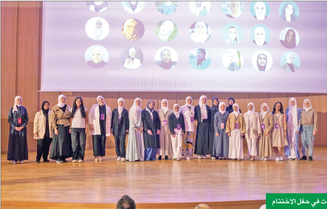
لقطات جماعية للمشاركات في حفل الإختتام

حققنا أهداف البرنامج التدريبي لتمكين الفتيات الكويتيات في التكنولوجيا وريادة الأعمال