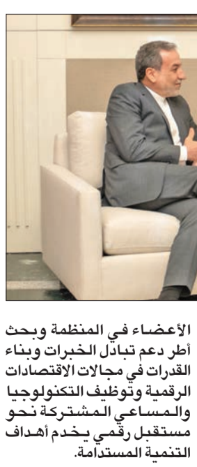
اليحيا مستقبلاً نظيره الإيراني

التقى وزير الخارجية، عبدالله البعيا، نظيره الإيراني عباس عراقجي، على هامش أعمال الأسبوع رفيع المستوى للجمعية العامة للأمم المتحدة في دورتها الـ 79 في مدينة نيويورك. وذكرت وزارة الخارجية، في بيان لها، أن الجانبين تناولوا خلال اللقاء سبل تعزيز العلاقات الثنائية بين البلدين الصديقين في مختلف المجالات. كما بحث اللقاء آخر المستجدات على الساحتين الإقليمية والدولية والقضايا محل الاهتمام المشترك. وفي مجال آخر، شارك وزير الخارجية في حفل استقبال رفيع المستوى حول تعزيز التعاون الرقمي من أجل الأزدهار أقيم مساء أمس الأول