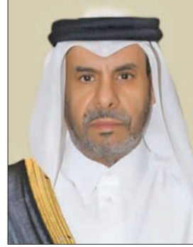
علي بن عبدالله آل محمود

قال سفير دولة قطر لدى الكويت، علي بن عبدالله آل محمود، إن المساعدات التي تقدمها دولة الكويت للشعوب المتضررة تأتي استكمالاً واستشعاراً لدورها وواجبها الإنساني في مساعدة الدول والشعوب المتضررة جراء الكوارث أو الأزمات الإنسانية. وأشار السفير آل محمود في تصريح لـ «كونا»، عقب لقائه نائب رئيس مجلس إدارة جمعية الهلال الأحمر الكويتي، أنور الحساوي، بجهود الكويت على الساحة الإنسانية الدولية لإسما برامجها الإنسانية ومشاريعها التنموية في العالم. وأضاف أن الجمعية تؤدي دوراً محورياً في تعزيز الجهود الدولية لتخفيف آثار الأزمات والكوارث عبر مبادراتها