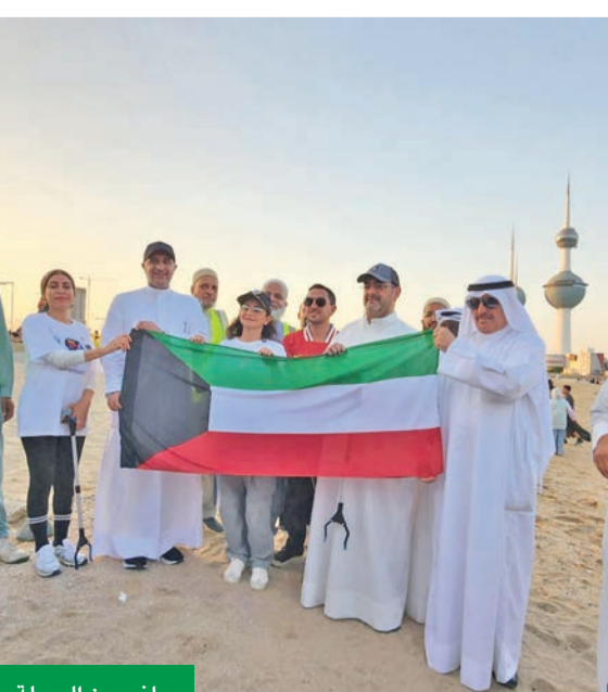
جانب من الحملة