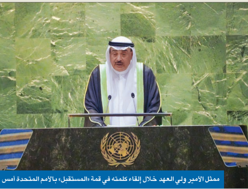
ممثل الأمير ولي العهد خلال إلقاء كلمته في قمة «المستقبل» بالأمم المتحدة أمس

«الإبادة الجماعية في فلسطين وعجز مجلس الأمن عن إيقافها مثال قاطع مؤسف على هذا النهج»