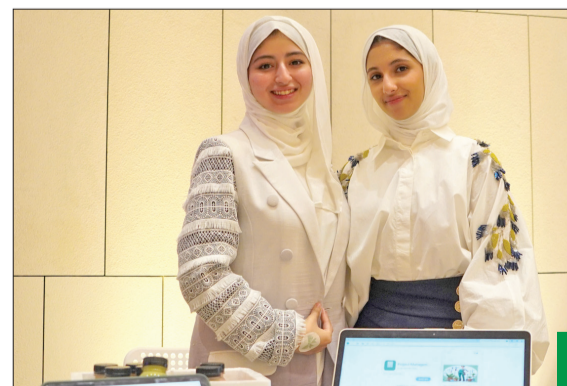
مشاركات في المبادرة

أقيم الحفل الختامي الثلاثاء الماضي بجامعة الكويت، حيث تم الاحتفاء بتخرج الدفعة الثالثة والأخيرة من الطالبات المشاركات في البرنامج. وقد تضمن الحفل توزيع شهادات التقدير، إلى جانب عرض المشاريع النهائية التي قدّمتها الطالبات، والتي أظهرت مستوى عالياً من الإبداع والابتكار، ما يعكس نجاح البرنامج في تمكينهن. تم إطلاق مبادرة Academy-X في مارس الماضي، بهدف سد الفجوة بين الشباب والشابات في مجالات التكنولوجيا وريادة الأعمال. وشهد البرنامج إقبالا كبيرا من الفتيات