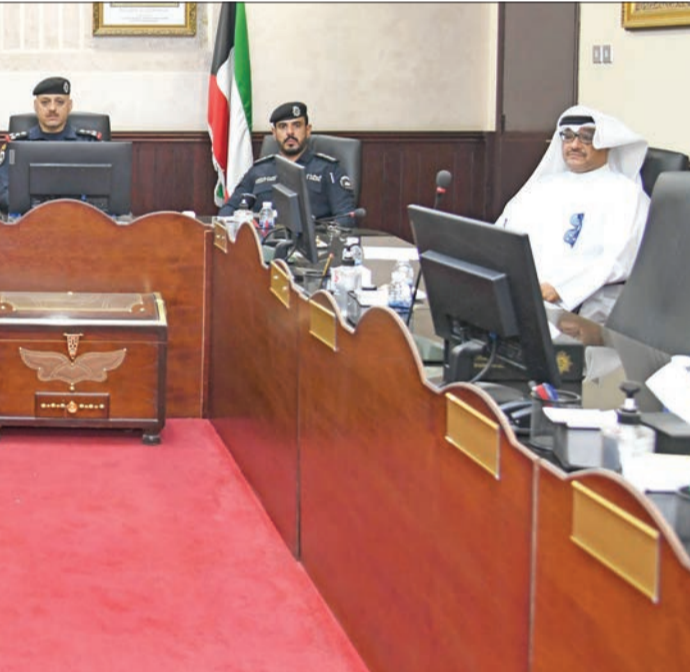
الرئيس محمد الشهران مع قيادات المؤسسات الإصلاحية

لم يعد هناك مندوبون يرسلون معاملات ورقية من وإلى النيابة العامة، وصار هناك تراسل إلكتروني حكومي «جي توجي»، إضافة إلى مشروع طرحته جمعية المحامين الكويتية بمقابلة المحامي للسجين عن بعد.