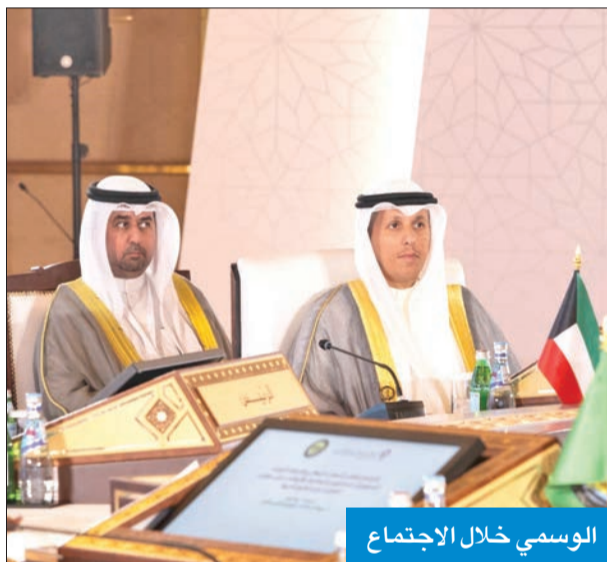
الوسمي خلال الاجتماع

أكد وزير العدل وزير الأوقاف والشؤون الإسلامية، د. محمد الوسمي، أهمية الاجتماع الـ 10 للوزراء المسؤولين عن الشؤون الإسلامية والأوقاف، بدول مجلس التعاون لدول الخليج العربية في العاصمة القطرية الدوحة.