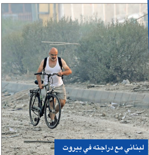
لبناني مع دراجته في بيروت

ترحب بالبيان لكنها لم توقع عليه. ولم يتضح إذا كانت الحكومة، التي تضم وزراء من حزب الله موافقة فعلاً على فصل جبهة غزة عن جبهة لبنان من خلال وقف إطلاق النار الفوري في لبنان، وهو الأمر الذي يرفضه حزب الله. وفيما نفى رئيس مجلس النواب نبيه بري صحة كلام نسب إليه بأنه لا تفاوض تحت النار وبأن مسارات الدبلوماسية أغلقت بالكامل، أثارت تصريحات للنائب في البرلمان اللبناني عن حزب الله حسين الحاج حسن على قناة الجزيرة مزيداً من الالتباس حول الموقف الرسمي اللبناني. وقال الحاج حسن، إن موقف لبنان الرسمي قبل بمقترح