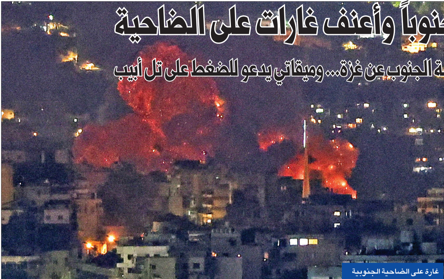
غارة على الضاحية الجنوبية

مواقف «ملتبسة» لـ «حزب الله» من فصل جبهة الجنوب عن غزة... وميقاتي يدعو للضغط على تل أبيب