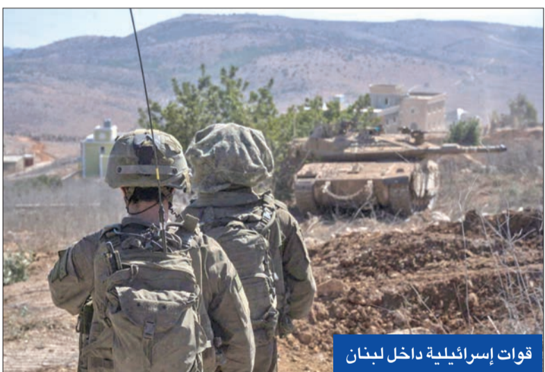
قوات إسرائيلية داخل لبنان

القرارات الدولية بشأن غزة» ولفت شري إلى أن بيانات حزب الله العسكرية لا تزال تذكر أن العمليات «هي إسناد لغزة ودفاع عن لبنان»، مضيفاً أن المطلوب وقف العدوان على لبنان، وحين يتوقف لكل حادث حديث ونقطة على السطر.»