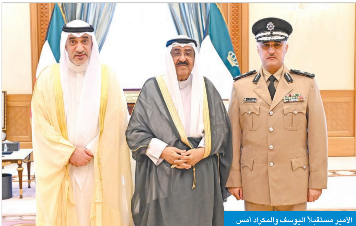
الأمير مستقبلاً اليوسف والمكرام أمس

استقبل سمو أمير البلاد، الشيخ مشعل الأحمد، بقصر السيف، صباح أمس، سمو ولي العهد الشيخ صباح الخالد، ثم رئيس مجلس الوزراء، سمو الشيخ أحمد العبدالله.