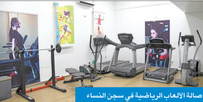
صالة الألعاب الرياضية في سجن النساء