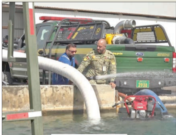
عنصر من الحرس وأخر من «نفط الكويت» خلال التمرين