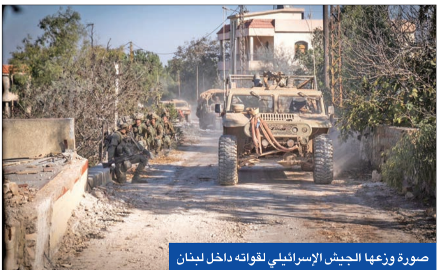
صورة وزعها الجيش الإسرائيلي لقواته داخل لبنان

القرارات الدولية بشأن غزة» ولفت شري إلى أن بيانات حزب الله العسكرية لا تزال تذكر أن العمليات «هي إسناد لغزة ودفاع عن لبنان»، مضيفاً أن المطلوب وقف العدوان على لبنان، وحين يتوقف لكل حادث حديث ونقطة على السطر.»