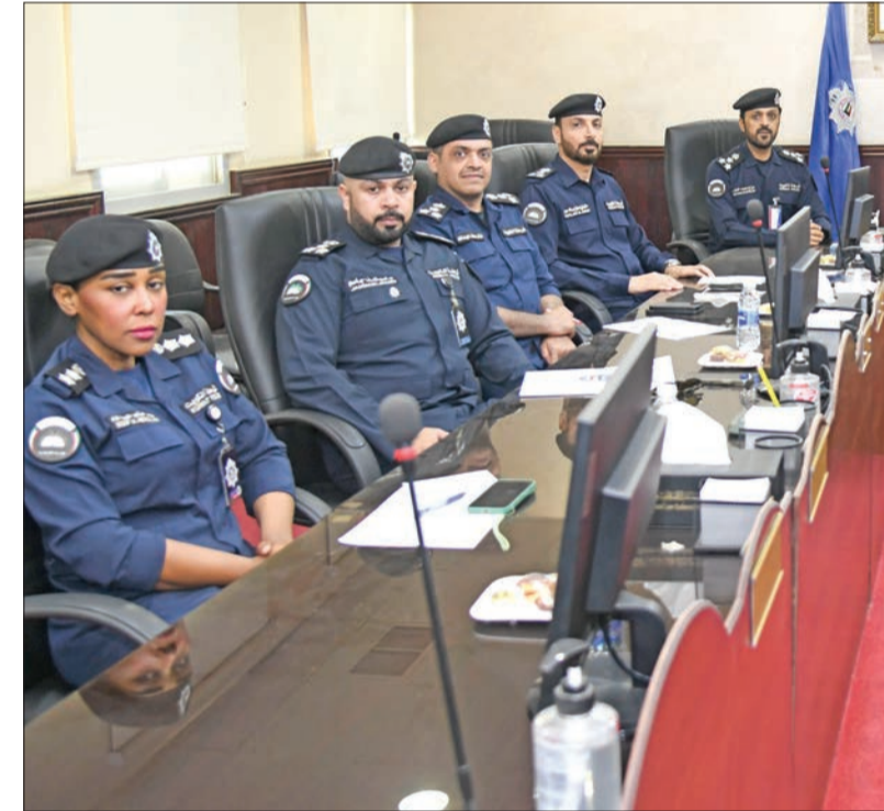
غرفة مراقبة السجون

والكويت من أوائل الدول العربية التي غيرت اسم السجون إلى المؤسسات الإصلاحية، وهذا البروتوكول الذي نتحدث عنه يحدد طبيعة ومدى العلاقة مع السجناء في ضوء حقوق الإنسان، ولدينا الإدارة العامة للمؤسسات الإصلاحية تخضع للرقابة من النيابة العامة، والتي يأتي وكلاهما للتفتيش على السجناء والعاملين وعلى القطاع بشكل عام، فللسجين حقوق زيارات يأخذها بشكل كامل، وحقوقه الصحية والاجتماعية، وكل من يأتي لدينا من سجناء نبين لهم حقوقهم