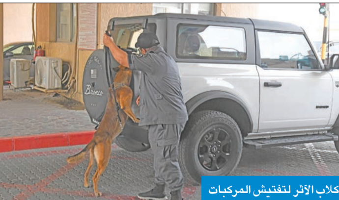
كلاب الأثر لتفتيش المركبات