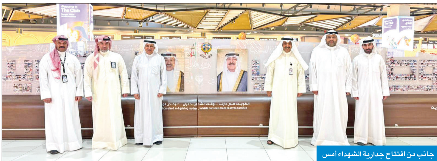
جانب من افتتاح جدارية الشهداء أمس

العوفان: تخليداً لشهدائنا وتوظيف تضحياتهم في بث روح الانتماء الوطني