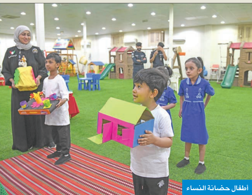
اطفال حضانة النساء

وذكرت الكهيلي أن عدد نزليات سجن النساء يبلغ 205 نزليات، وأن السعة المكانية مناسبة ولا تمثل مشكلة، مشيرة إلى أنه من الحقوق المتاحة للنزليات إمكانية تقديمها طلباً للحصول على الخلوّة الشرعية، حيث تتم الموافقة عليه حسب الإجراءات القانونية.