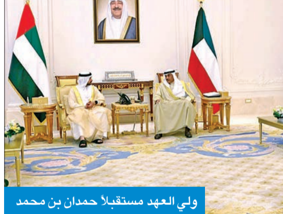
ولي العهد مستقبلاً حمدان بن محمد