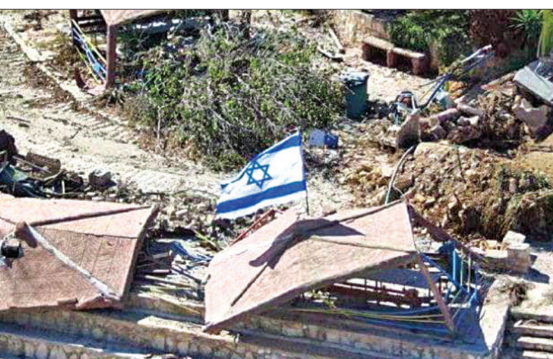
صورة وزعها الجيش الإسرائيلي قال إنها لرفع علم إسرائيلي على «الحديقة الإيرانية» في مارون الراس جنوب لبنان

للنفاوض السياسي على الرغم من تأكيد نائب الأمين العام للحزب الشيخ نعيم قاسم، أمس، تفويض رئيس مجلس النواب نبيه بري بالدور الدبلوماسي الذي يقوم به. نقطتان أساسيتان لا بد من التوقف عندهما في كلمة قاسم الثانية، منذ اغتيال الأمين العام للحزب حسن نصرالله بغارة إسرائيلية في 27 سبتمبر الماضي، تتعلقان بالمحور ودوره وتوجهاته، النقطة الأولى هي تطابق موقف حزب الله مع موقف إيران منذ زيارة وزير الخارجية الإيراني عباس عراقجي إلى بيروت وصولاً إلى كلمة قاسم، أما النقطة الثانية فهي تكرار خطأ «حماس» في غزة لناحية الرهان على العملية البرية وعلى قدرة مقاتلي حزب الله على تعبيد الإسرائيليين خسائر كبيرة تدفعهم إلى القبول بوقف إطلاق النار. بداية وفي استعادة لتجربة غزة، فإن إسرائيل أبدت استعداداً لتحمل الخسائر الكبيرة بشراً، وعمل نتنياهو على