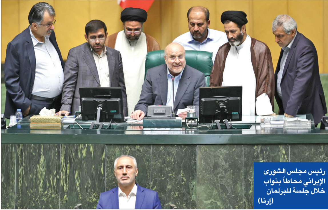
رئيس مجلس الشورى الإيراني محمداً بنواب خلال جلسة للبرلمان

بالتزامن مع تقارير عن تحذير واشنطن لإسرائيل من أن طهران قد تنسحب من معاهدة منع انتشار التسليح النووي بحال استهدفت مواقعها الذرية. وقبل ذلك، خرجت تصريحات من مسؤولين أميركيين بأن رد إسرائيل على إيران قد يشمل مواقع عسكرية وأمنية وقيادية تشمل مقر المرشد علي خامنئي. وأضافوا بأن الدولة العبرية ستحتفظ بخيار ضرب المواقع النووية الإيرانية في حال التصعيد.