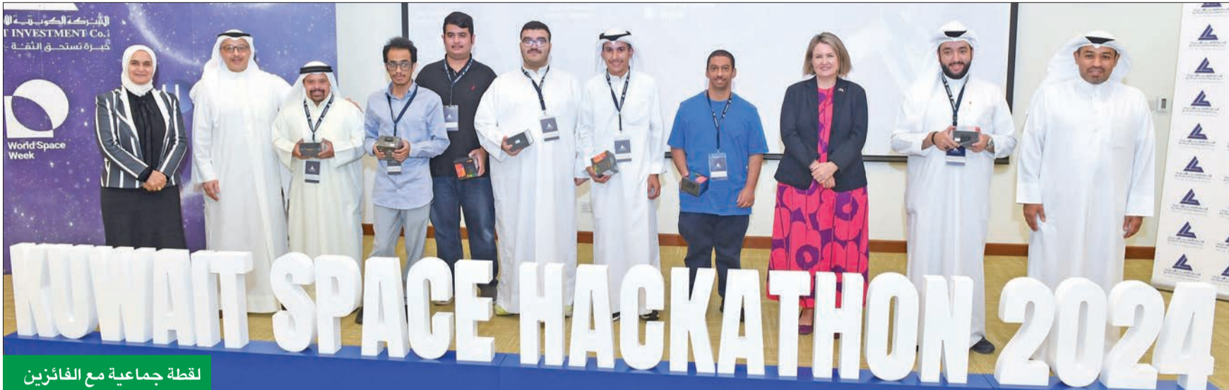
لقطة جماعية مع الفائزين

الأحمد: المسؤولية المجتمعية مبوبة بجوهر أعمالنا التي يتعين تنميتها وتكاملها مع سياسة الشركة