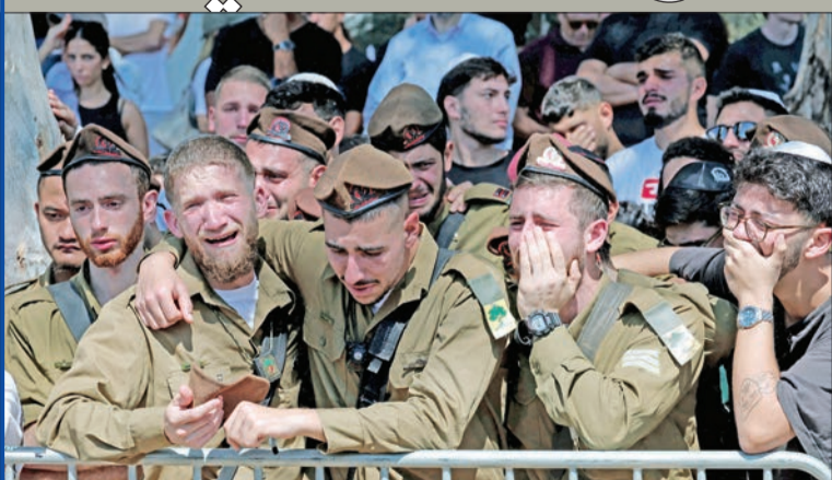
جنود إسرائيليون يكون زميلهم المقتول شمال غزة أمس

العديد من المسلحين الفلسطينيين وعتوره على أسلحة وفك بنية تحتية عسكرية خلال عملياته في جباليا.