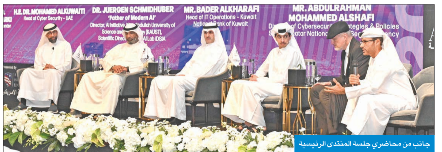
جانب من محاضري جلسة المنتدى الرئيسية