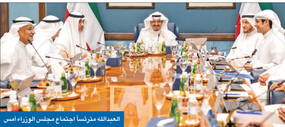
العمير مستقبلاً ولي عهد دبي أمس

أكد خلال اجتماعه الأسبوعي ضرورة الجاهزية الحكومية لمواجهة أي طارئ بالمنطقة ● اتخاذ جميع متطلبات حفظ أمن وسلامة المواطنين والمقيمين وحماية المرافق الحيوية ● كلف «الدفاع المدني» موافاته بتقرير أسبوعي بشأن خطوات الجهات الرسمية في هذا الشأن