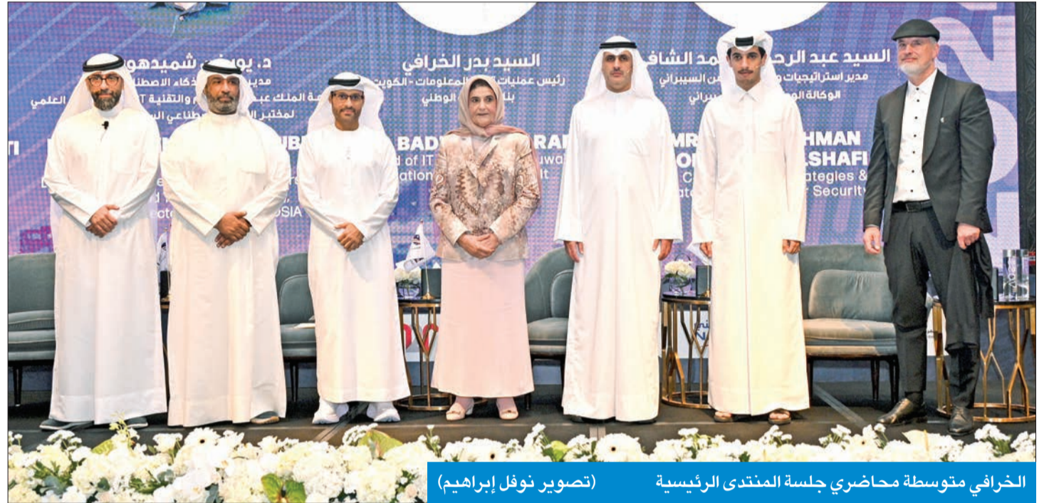
الخرافي متوسطة محاضري جلسة المنتدى الرئيسية

وكشف بوغري عن اجتماع سيتم بين الدول الخليجية خلال ديسمبر المقبل، لتعزيز البنى التحتية للذكاء الاصطناعي والأمن السيبراني بما يعطي مظلة لدول مجلس التعاون الخليجي للتعاون مع مخاطر وتحتج الذكاء الاصطناعي والأمن السيبراني.