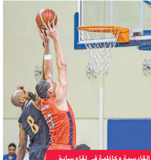
القادسية وكازمة في لقاء سابق

يلقى الفريق الأول لكرة السلة بنادي القادسية مع مواطنه كازمة في الساعة الثانية بعد ظهر اليوم، في انطلاق مواجهات الدور ربع النهائي لبطولة السلة العربية السادسة والثلاثين للعبة المقامة حالياً في مدينة الإسكندرية، وتستمر حتى 12 الجاري. ويلعب في الدور ذاته اليوم أيضاً سبورتغ والصعي مع سموحة، والعربي القطري مع نظيره الغرافة، كما يلعب الاتحاد السنخندري المصري مع الوحدة الإماراتي. وكان القادسية تصدر المجموعة الثانية بالعلامة الكاملة برصيد 10 نقاط بفوزه على الوحدة الإماراتي 76-112 أمس الأول في ختام الدور الأول، وتغلب كازمة على الشارقة الإماراتي بصعوبة 75-79 ليحتل المركز الرابع برصيد 7 نقاط في مجموعته الأولى. وينص نظام البطولة على تأهل الفرق الأربعة