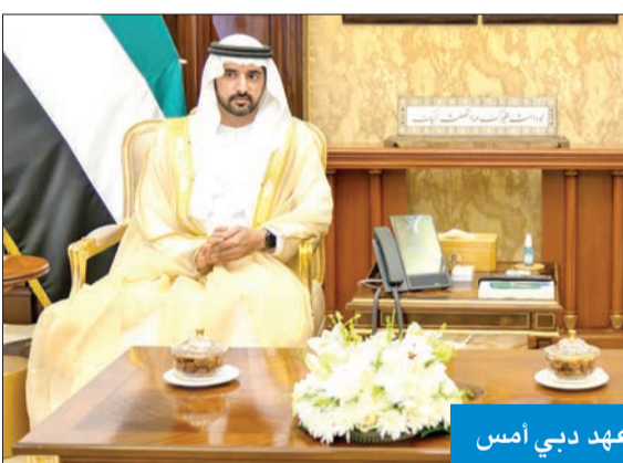
رئيس الوزراء مستقبلاً ولي عهد دبي أمس