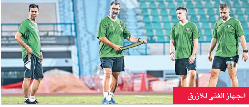
الجهاز الفني للأزرق

بيتزي يضع الروتوش الأخيرة على الخطة والتشكيل