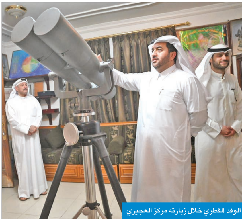
الوفد القطري خلال زيارته مركز العجيري

وقّع مركز العجيري العلمي، ودار التقويم القطري، ووثيقة تعاون مشتركة بشأن تعزيز الجانب التدريبي وإقامة المخيمات الفلكية سواء في الكويت أو قطر، وتبادل الخبرات في هذا الجانب، علاوة على تعزيز كل ما يتعلق بامور التقويم وتطويرها، بما يتماشى مع التكنولوجيا.