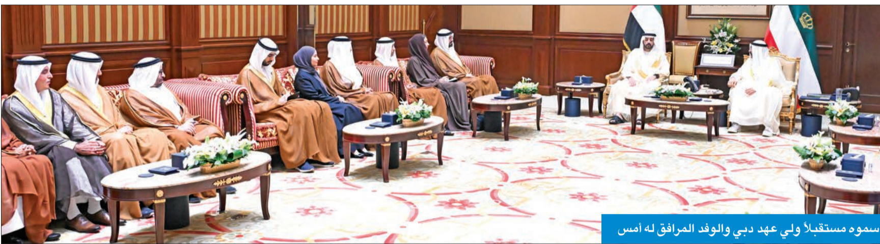
سموه مستقبلاً ولي عهد دبي والوفد المرافق له أمس

استقبل سمو أمير البلاد الشيخ مشعل الأحمد، بقصر بيان، صباح أمس، ولي عهد دبي نائب رئيس مجلس الوزراء وزير الدفاع بدولة الإمارات العربية المتحدة الشقيقة الشيخ حمدان بن محمد بن راشد، والوفد الرسمي المرافق له، بمناسبة زيارته الرسمية للبلاد. ونقل ولي عهد دبي لسموه تحيات وتقدير رئيس دولة الإمارات الشيخ محمد بن زايد، ونائب رئيس الدولة رئيس مجلس الوزراء حاكم دبي الشيخ محمد بن راشد وتمنياتها لسموه بموفور الصحة ودوام العافية ولشعب الكويت المزيد من التقدم والازدهار.