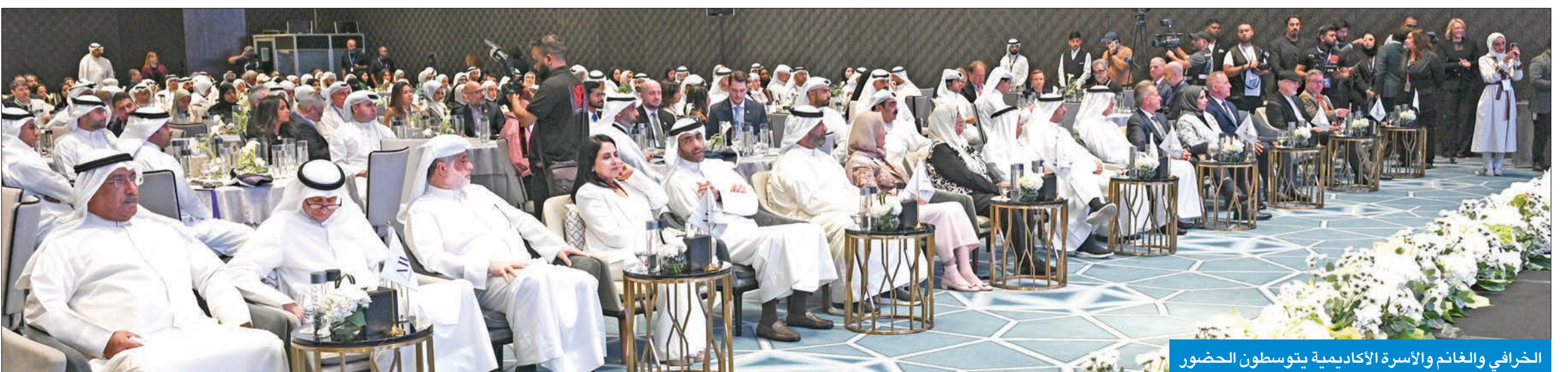
الخرافي والغانم والأسرة الأكاديمية يتوسطون الحضور

عقدت في اليوم الأول ورش عمل متخصصة لمناقشة مواضيع الذكاء الاصطناعي والأمن السيبراني قدمها عدد من المتخصصين، منهم الدكتورة أيفا ماري مولر ستولر - رئيسة قسم البيانات والذكاء الاصطناعي في شركة EY لمنطقة الشرق الأوسط وشمال افريقيا، والتي تحدثت عن الذكاء الاصطناعي لاتخاذ القرارات التنفيذية: تمكين القيادة من خلال الرؤى المستندة الى البيانات.