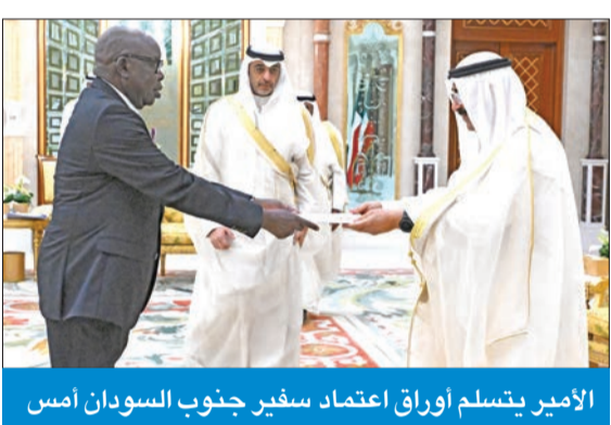
الأمير يتسلم أوراق اعتماد سفير جنوب السودان أمس

القيادة الإمارات نتمنى للكويت المزيد من التقدم والازدهار حمدان بن محمد