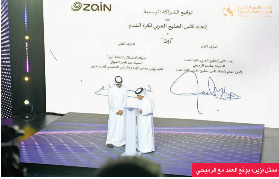
ممثل «زين» يوقع العقد مع الرميحي

في حفل بمركز جابر الأحمد الثقافي شهد توقيع عقود مع شركة عالمية كبرى لتنظيم البطولة