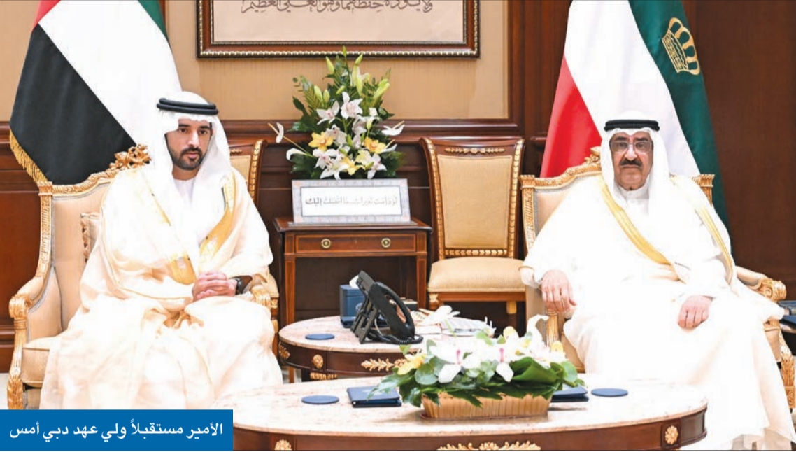
الأمير مستقبلاً ولي عهد دبي أمس

سموه بحث مع ولي عهد دبي تعزيز العلاقات والقضايا المشتركة والمستجدات الإقليمية والدولية ● الأحاديث الودية عكست رسوخ الروابط الأخوية وتعزيزها بما يخدم المصالح الثنائية