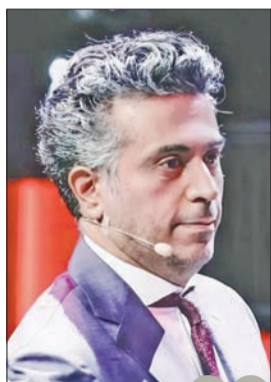
سيتم الرجوع بعقارب الزمن إلى 5 قرون سابقة أحمد العود