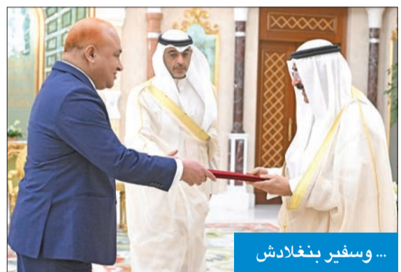
... وسفير بنغلادش