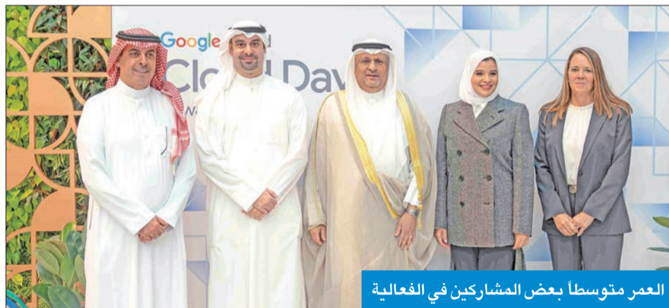
العمر متوسطاً بعض المشاركين في الفعالية

العمر: إطلاق «هيرو كلاود» لتمكين الشباب من اكتساب مهارات متقدمة بالذكاء الاصطناعي