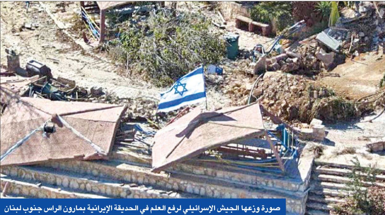
صورة وزعها الجيش الإسرائيلي لرفع العلم في الحديقة الإيرانية بمارون الراس جنوب لبنان