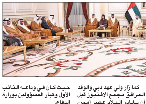
النائب الأول خلال لقائه ولي عهد دبي أمس

حيث كان في وداعه النائب الأول وكبار المسؤولين بوزارة الدفاع.