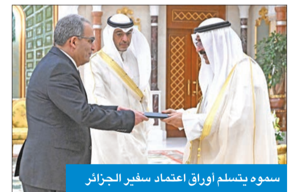
سموه يتسلم أوراق اعتماد سفير الجزائر