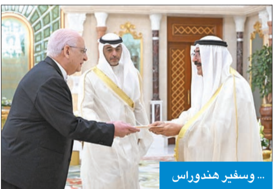
... وسفير هندوراس

الشقيقين، وسيل تعزيرها في المجالات كافة بما يخدم مصالحهما المشتركة. كما تم بحث القضايا ذات الاهتمام المشترك وآخر المستجدات على الساحتين الإقليمية والدولية. حضر المقابلة النائب الأول لرئيس مجلس الوزراء وزير الدفاع وزير الداخلية الشيخ فهد اليوسف، وكبار المسؤولين بالدولة من جانب آخر، احتفل في قصر بيان، صباح أمس، بتسلم سمو أمير البلاد، أوراق اعتماد