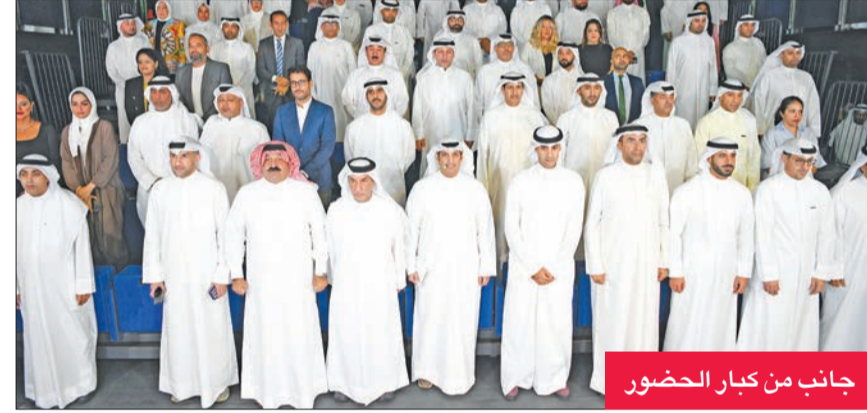
جانب من كبار الحضور

«المستقبل للخليج»، وأكد أن الرياضة الكويتية تحظى بدعم هائل من القيادة السياسية، مضيفاً في كلمة له أن الرياضة مرت بمراحل عديدة منها العصر الذهبي