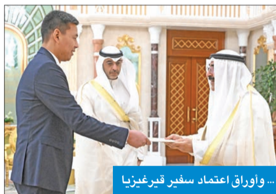
... وأوراق اعتماد سفير قبرغيزيا