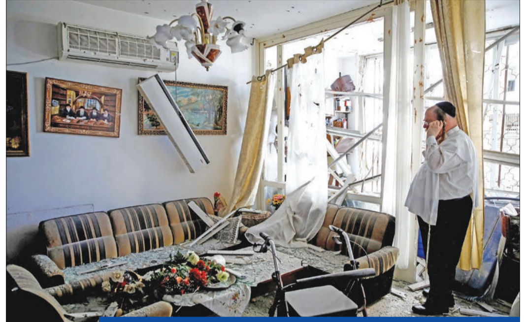
منزل إسرائيلي أصيب بصاروخ أطلق من لبنان في كريات يام شمال إسرائيل