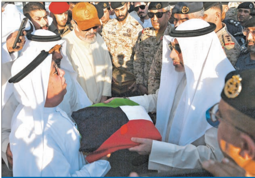
النائب الأول يسلم علم الكويت إلى والد الشهيد أثناء تقديمه واجب العزاء