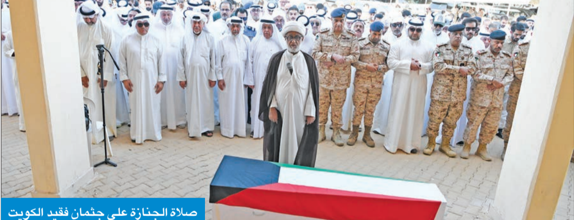
صلاة الجنازة على جثمان فقيد الكويت

عزت دول عربية الكويت في سقوط الطائرة المقاتلة واستشهاد قائدها، مؤكدة تضامنها الكامل مع الكويت حكومة وشعباً في هذا الحادث الأليم. وفي السياق، أعربت وزارة الخارجية الأردنية عن أصدق مشاعر التعزية والمواساة للكويت في حادث سقوط الطائرة المقاتلة الذي وقع أمس الأول ما أسفر عن استشهاد قائدها. وأكد المتحدث باسم الخارجية الأردنية سفيان القضاة في بيان له تضامن الأردن الكامل مع الكويت حكومة وشعباً في هذا