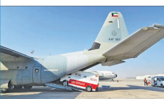
نقل سيارتي الإسعاف إلى الطائرة الإغاثية أمس

جاءت الأحداث الصعبة والإنسانية هناك، وأكد العبيد أن مساعي «الكويتية للإغاثة» مستمرة في دعم وإغاثة الأشقاء السودانيين، إلى جانب مساندة الدعم الحكومي الكويتي بغية ضمان وصول المساعدات المتنوعة إلى مستحقها، موضحاً أن الجمعية تتواصل مع الجهات المعنية هناك لسد الاحتياجات اللازمة والضرورية لتحقيق سبل العيش الكريم للأسر النازحة جراء تلك الأزمة الراهنة.