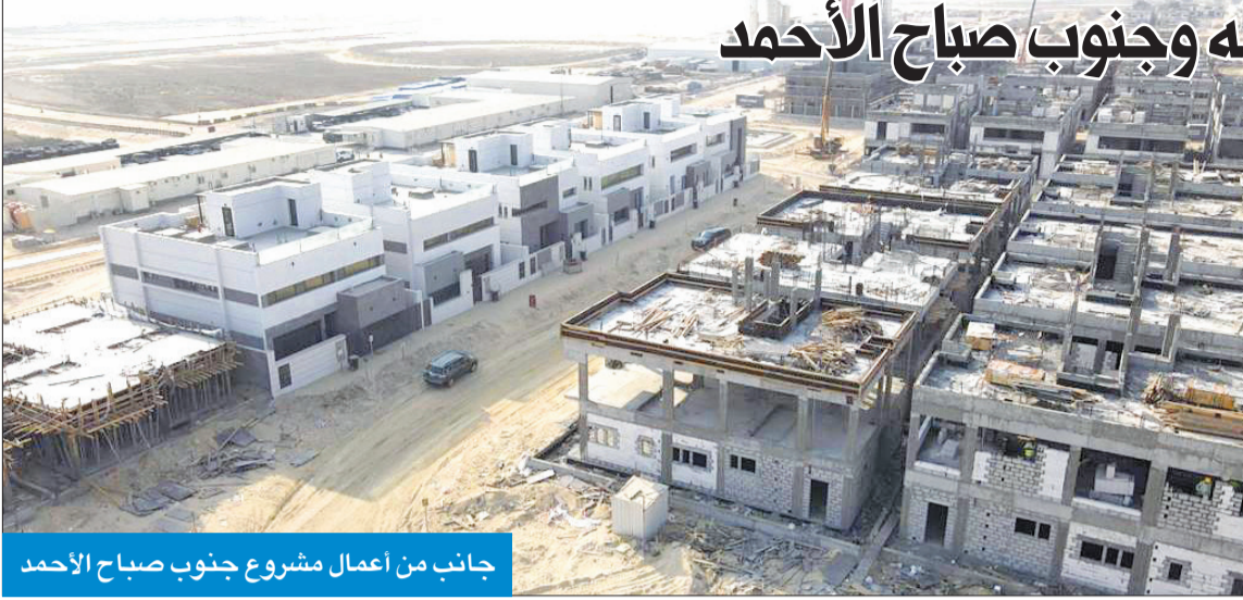
جانب من أعمال مشروع جنوب صباح الأحمد

تشمل مدن المطلاع وجنوب سعد عبدالله وجنوب صباح الأحمد