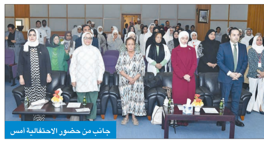
جانب من حضور الاحتفالية أمس