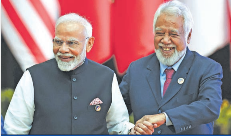
رئيس الوزراء الهندي مودي يتحدث مع رئيس وزراء تيمور الشرقية زانانا جوسماو خلال قمة رابطة دول جنوب شرق آسيا والهند

دهلي تبني غواصتين هجوميتين لمواجهة وجود بكين في المحيط الهندي