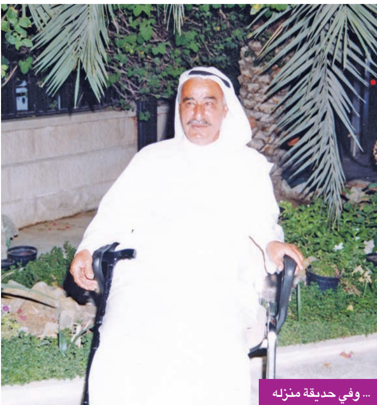
... وفي حديقة منزله