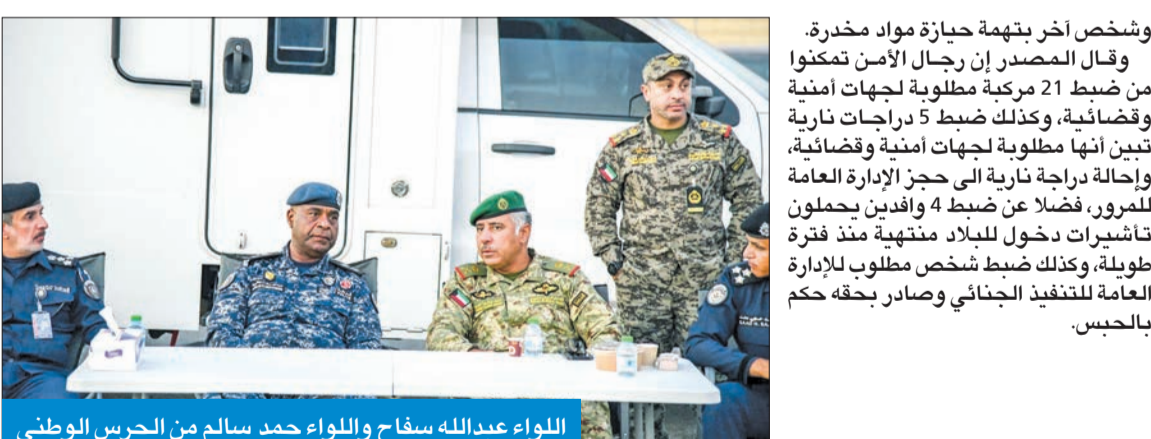
اللواء عبدالله سفاوح واللواء حمد سالم من الحرس الوطني

خاصة بحملة أمنية في مناطق جليب الشيوخ والحساوي والعباسية، بهدف ضبط مخالفين قانون الإقامة والخارجين عن القانون ومرتكبي المخالفات المرورية والمطلوبين للجهات الأمنية، مبيّناً أن الخطة قضت بأن تتولى قوة الحرس الوطني بالمهمة داخل ومخارج المناطق المستهدفة بالحملة الأمنية، على أن تتولى قوات وزارة الداخلية المؤلفة من قوات قطاع الأمن العام وقطاع الأمن الخاص وقطاع المرور والعمليات والإدارة العامة لمباحث الإقامة، عملية ضبط المخالفين عن طريق الدوريات الراجلة ونقاط التفقيش الثابتة. وأفاد المصدر بأن رجال الأمن وقوة الحرس الوطني تمكنوا من ضبط 1553