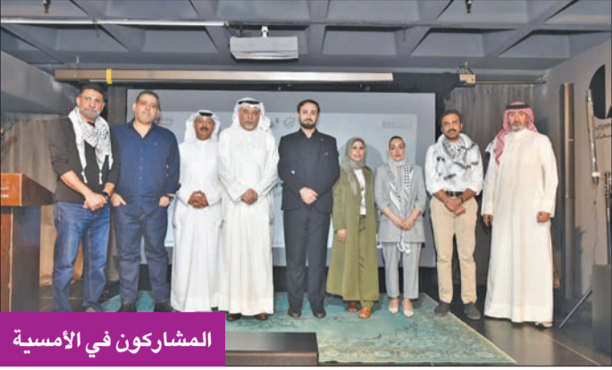
المشاركين في الأمسية

تزامناً مع شعبي فلسطين ولبنان إزاء ما يتعرضان له من عدوان صهيوني