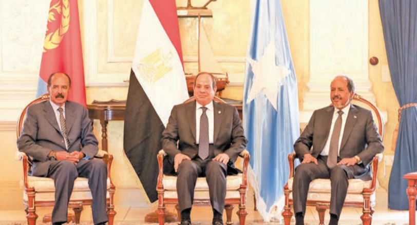
السياسي متوسطاً أفورقي وشيخ محمود

القاهرة تنفي اتهامات حميدي بالمشاركة في الغارات ضد قواته