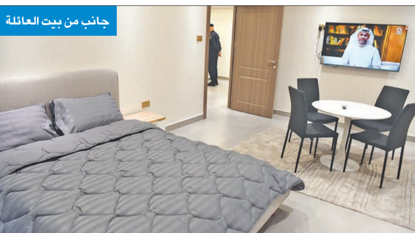
جانب من بيت العائلة

العبيد: الأولوية لحسن السلوك... وحجز المواعيد عبر «سهل» نهاية الجاري