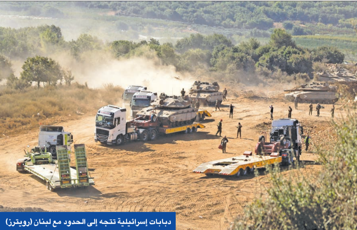
دبابات إسرائيلية تتجه إلى الحدود مع لبنان