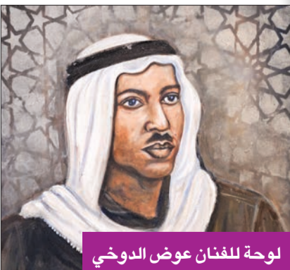
لوحة للفنان عوض الدوخي