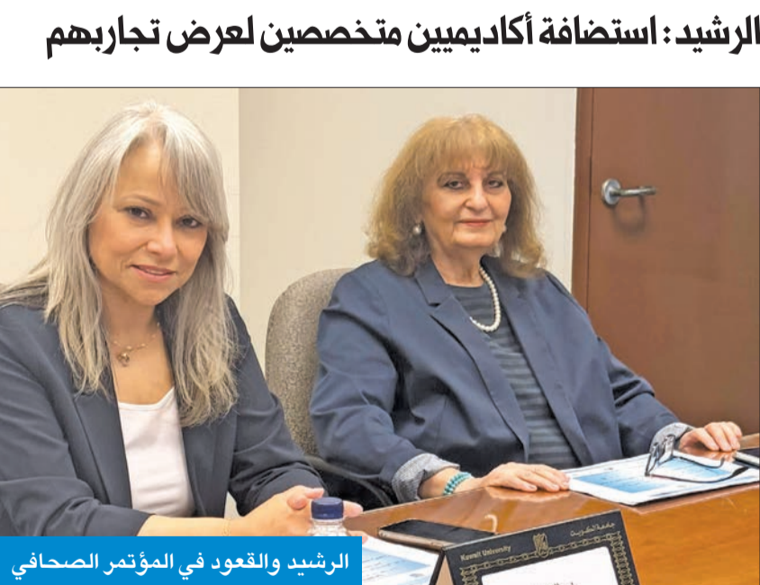
الرشيد والقعود في المؤتمر الصحفي

الرشيد: استضافة أكاديميين متخصصين لعرض تجاربهم