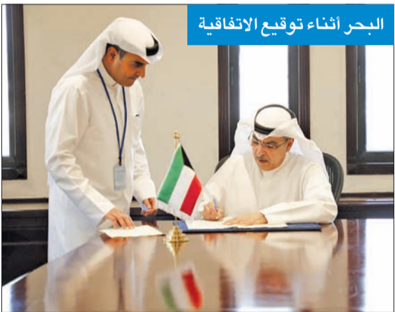
البحر اثناء توقيع الاتفاقية

أبرم اتفاقية منحة مع مركز سرطان الأطفال لتوفير الرعاية