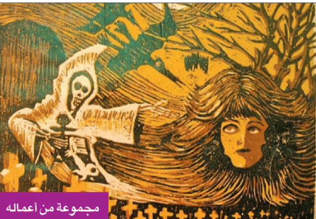
مجموعة من أعماله

كنت طفلاً محباً للرسم، والعديد من الفنون الأخرى، فالحياة في نظري فن، وكل عمل يمارسه الإنسان فيه جانب فني، ولذلك فقد انطلقت منذ سنينيات القرن الماضي وحتى الآن في مسيرة تجاوزت النصف قرن، مارست خلالها فنون التصوير والرسم والنحت والطباعة والكاريكاتور والرسم المتحركة، كما أن لدي مهارات متعددة اعتبرها نوعاً مهماً من الفنون، فأنا