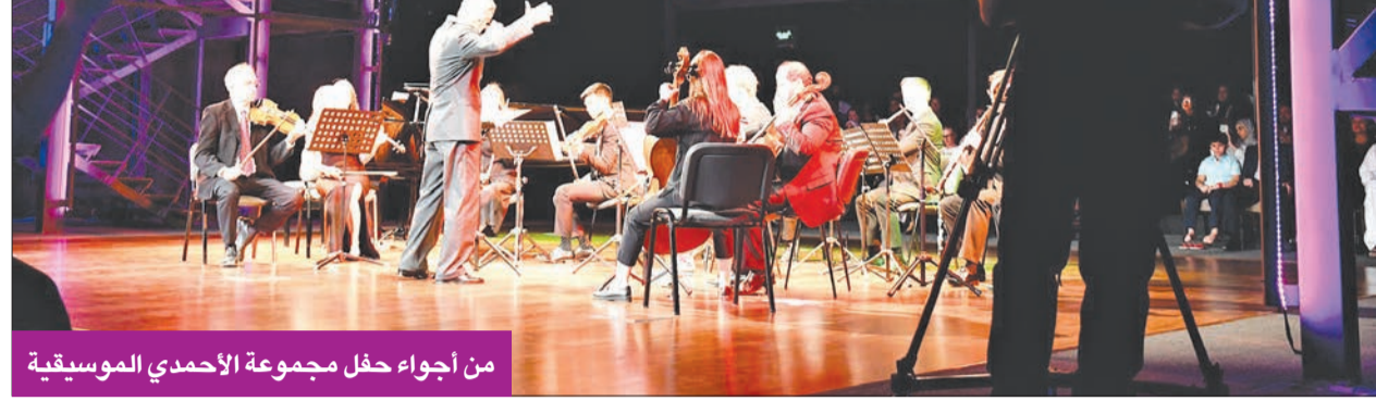
من أجواء حفل مجموعة الأحمدي الموسيقية

العشور الموسيقية المختلفة، إضافة إلى متعة الأجواء، كما أنها أمسية تثقيفية من حيث المعلومات التي يقدمها المايسترو لأعمال الموسيقيين بمختلف الأزمنة والحقب التاريخية، وأثرت على الأعمال التي قدموها، ابتداء من عصر النهضة، انتقالاً لعصر الباروك والعصر الموسيقي الكلاسيكي والرومانسي، وخاتماً بالموسيقى المعاصرة.