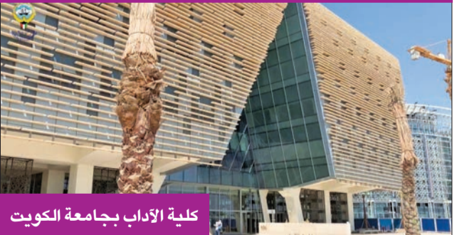
كلية الآداب بجامعة الكويت