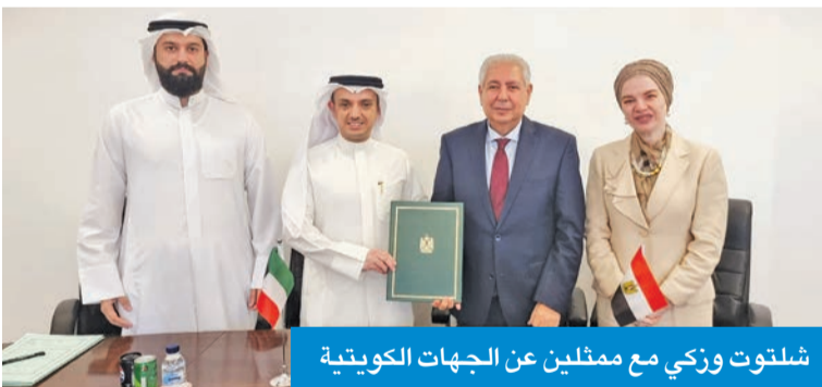
شلتوت وزكي مع ممثلين عن الجهات الكويتية

الأرض لبناء مقر دائم للقنصلية المصرية في الكويت». وأضافت أن «السفير شلتوت، والسفيرة هبة زكي، رئيسة البعثة القنصلية المصرية في الكويت، شهدا مراسم توقيع، بحضور ممثلين من الجانب الكويتي»، مؤكدة أن «هذه الخطوة تأتي سعياً وراء تقديم أفضل خدمة للمواطنين المصريين ولكل مراجعي القنصلية المصرية بالكويت».