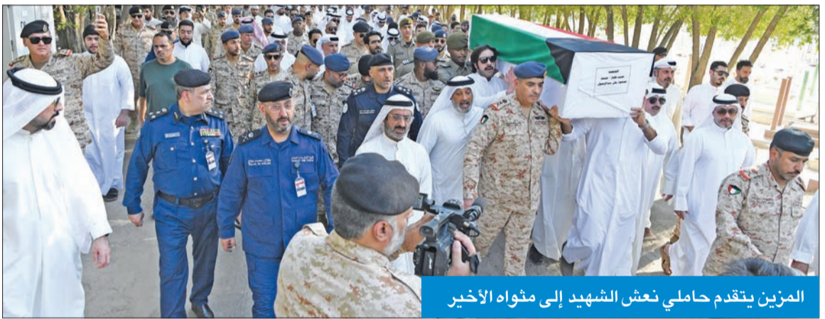
المزين يتقدم حاملي نعش الشهيد إلى متواه الأخير

شارك في الجنازة النائب الأول لرئيس مجلس الوزراء وزير الداخلية وزير الدفاع، الشيخ فهد اليوسف، ورئيس الأركان العامة للجيش، الفريق ركن طيار بندر المزين، ووكيل وزارة الدفاع، الشيخ الدكتور عبدالله المشعل، وقيادات الجهات العسكرية الثلاثة ورفقاء السلاح وحضور كثيف من ذوي الشهيد، والقيادات