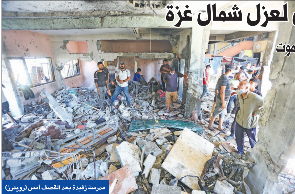
مدرسة زفيدة بعد القصف أمس

وفي تل أبيب، أصيب إسرائيليان بجروح خطيرة أمس، في عملية طعن جديدة في بريدس حنا بقضاء الخضير، تمكن منفذاً من الفرار.