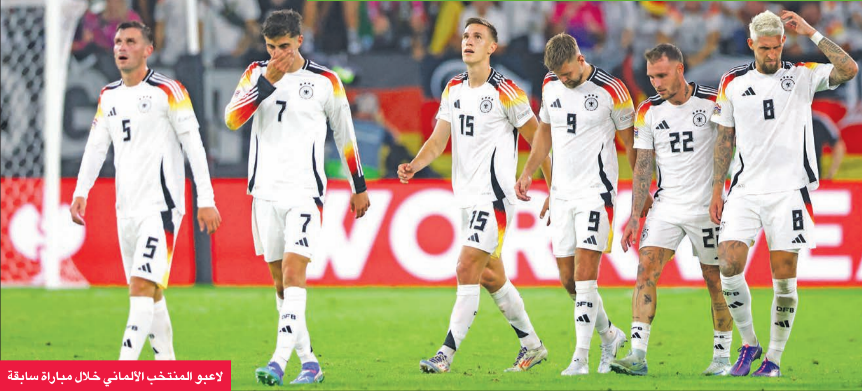
لاعبو المنتخب الألماني خلال مباراة سابقة

ليتوانيا مع كوسوفو، وقبرص مع رومانيا، وتقام مباريات الجولة الرابعة الختلفة المقبلة حيث يلتقي منتخب صربيا وسويسرا. كما تقام السبت أيضا مباريات الجولة الثالثة للمجموعة الأولى بالمستوى الأول، حيث يلتقي منتخب بولندا مع البرتغال، وكرواتيا مع اسكتلندا. كما يشهد السبت أيضا إقامة مباريات المجموعتين الثانية والثالثة للمستوى الثالث. ففي المجموعة الثانية يلتقي منتخب