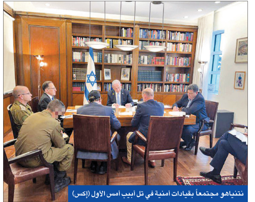
نتنايهو مجتمعاً بقيادات أمنية في تل أبيب أمس الأول (إكس)