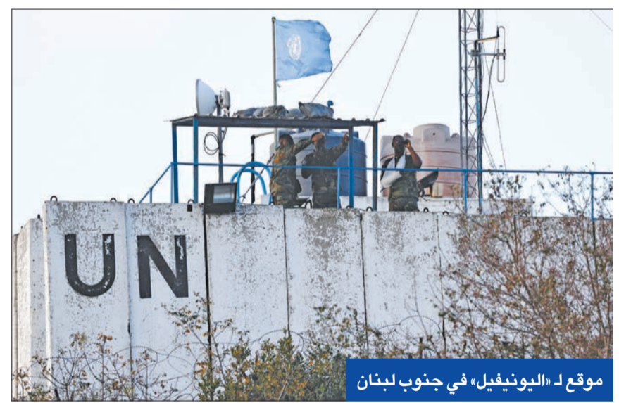
موقع لـ «اليونيفيل» في جنوب لبنان

وقال حزب الله، إنه تصدى لإليات إسرائيلية أثناء تقدمها عند رأس الناقورة في القطاع الغربي، في وقت أظهر شريط مصور وقوع اشتباكات عنيفة بعدة أنواع من الأسلحة قرب بلدة ميس الجبل في القطاع الشرقي، وتحدثت وسائل إعلام عبرية عن إصابة 7 جنود إسرائيليين بجروح، فيما أعلن مقتل نائب احتياط خلال المعارك في الأيام السابقة. وصباحاً أعلن الجيش الإسرائيلي، أمس، رصد إطلاق 40 صاروخاً من لبنان على منطقة الجليل الأعلى، في حين قال «حزب الله» إنه استهدف مستوطنة