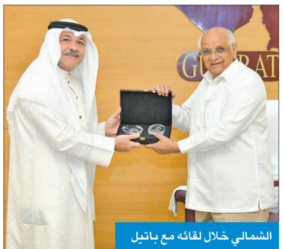
الشمالي خلال لقائه مع باتيل

أكد سفير الكويت لدى الهند مشعل الشمالي، أمس، أهمية تنمية العلاقات الثنائية بين الكويت والهند إلى أفق أرحب. جاء ذلك في تصريح أدلى به الشمالي لـ «كونا» عقب لقاء مع رئيس وزراء ولاية «غوڤارات» بوبيندر باي باتيل. وأوضح السفير الشمالي أنه ناقش خلال الاجتماع، الذي عقد بمقر إقامة باتيل في «غاندي ناجار»، على هامش حضور مهرجان غوجارات للثقافة والفنون، سبل تعميق العلاقات بين الكويت وولاية غوجارات في المجالات ذات الاهتمام المشترك، كالأمّن الغذائي والمائي وقطاع تكنولوجيا المعلومات وتطوير الطاقة الخضراء المتجددة. وشدد على أن ما يجمع الكويت والهند تاريخ حافل بإنجازات، وصداقة عمرها سنوات، وتعاون ينمو باستمرار.