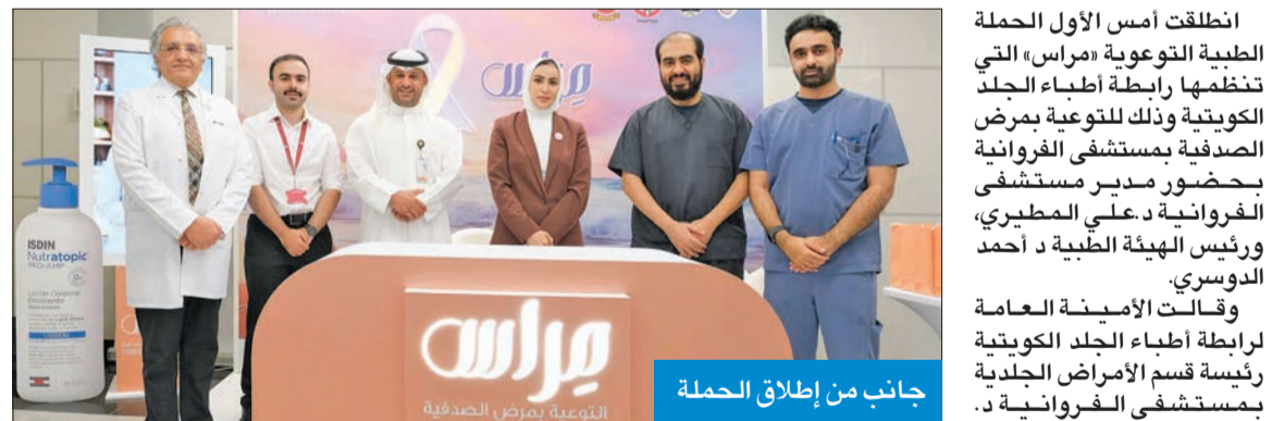
جانب من إطلاق الحملة

وذكرت أن الحملة ستكون بمواقع مختلفة على امتداد شهر أكتوبر، حيث ستقام الحملة في مول العاصمة