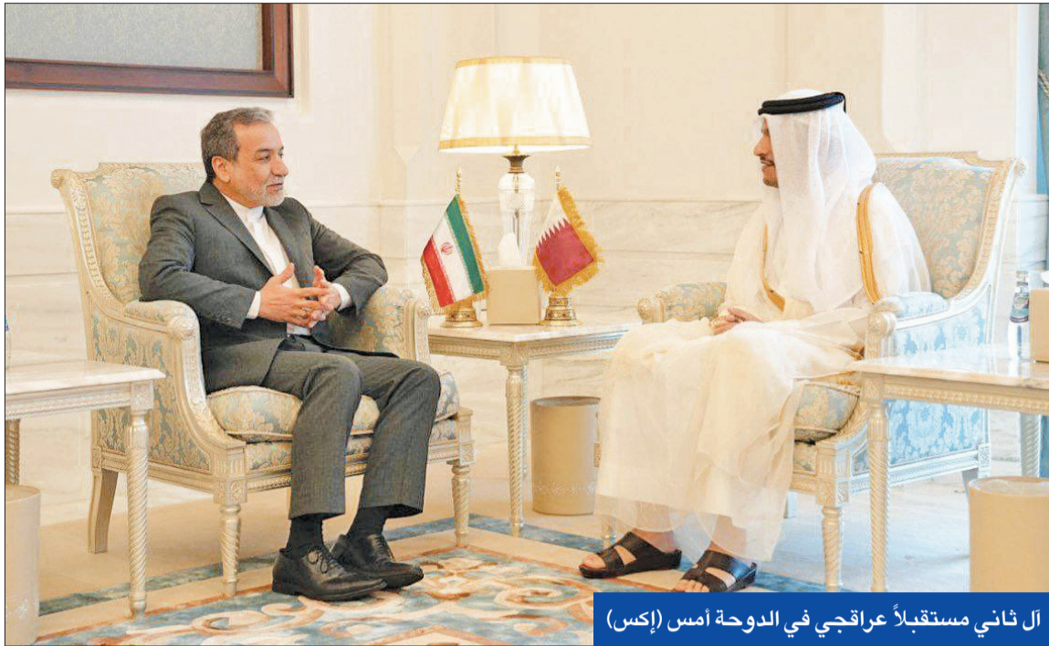
أل ثاني مستقبلاً عراقجي في الدوحة أمس

«الطاقة» و«رئاسة أميركا» تحاصران الرد • عراقجي من الدوحة: نتنايهو يريد إشعال المنطقة