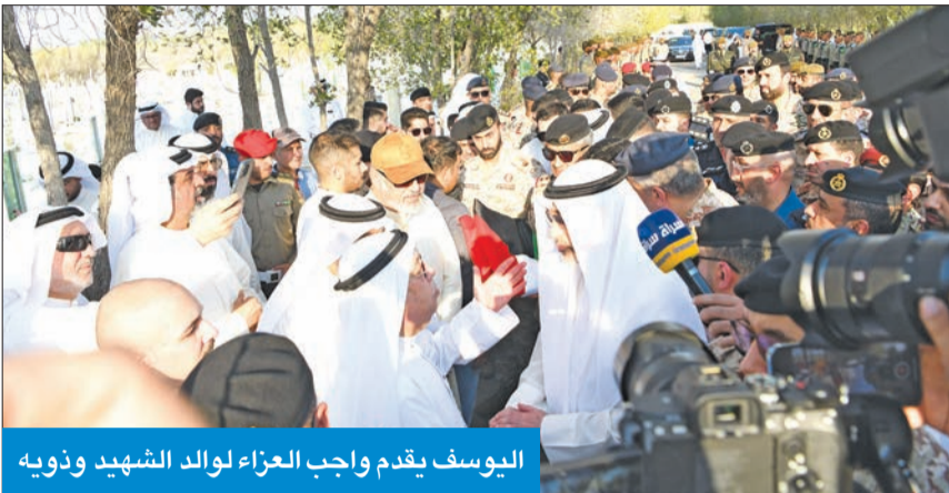
اليوسف يقدم واجب العزاء لوالد الشهيد وذويه