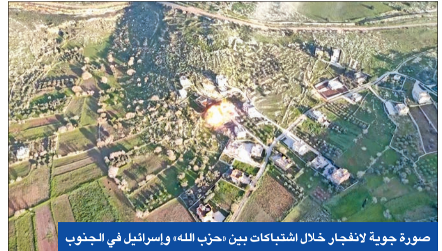
صورة جوية لانفجار خلال اشتباكات بين «حزب الله» وإسرائيل في الجنوب

أن إسرائيل لن تنجح أبداً في تدمير «حزب الله» بشكل تام، لافتين إلى أنه لا بد للحزب أن يكون جزءاً من أي تسوية سياسية للصراع.