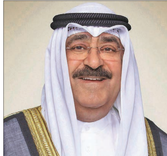
انتخابه من قبل الجمعية الوطنية الفيتنامية رئيساً متمنياً سموه له كل التوفيق لجمهورية فيتنام الاشتراكية، والسداد.

بعث صاحب السمو أمير البلاد، الشيخ مشعل الأحمد، ببرقية تهنئة إلى رئيس جمهورية فيتنام الاشتراكية الصديقة، ليونغ كيونغ، عبر فيها سموه عن خالص تهانيه بمناسبة انتخابه من قبل الجمعية الوطنية الفيتنامية «البرلمان» رئيساً لجمهورية فيتنام الاشتراكية، وأدائه اليمين الدستورية.