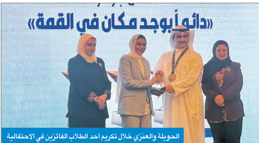
الحوية والعززي خلال تكريم أحد الطلاب الفائزين في الاحتفالية

ولفتت العززي إلى أنه في سياق الاحتفال بيوم الطفل العربي، نذكر أيضاً بأهمية الصحة النفسية للأطفال، فمن خلال دعم الصحة النفسية نستطيع أن نمح أطفالنا الأدوات اللازمة لمواجهة تحديات الحياة بثقة وإيجابية، «فالصحة النفسية ركيزة أساسية لنموهم السليم، وتطورهم الشامل، وخلاوة محورية نحو بناء مجتمع متوازن قادر على مواجهة التحديات». مبدية أن الإنجازات التي حققها المجلس تسهم بفعالية كبيرة في رسم سياسات ترتقي بمستوى الطفولة في الكويت، وتشجع على تكوين مظلة اجتماعية مستدامة تعزز مهارات الأطفال وتمنحهم محيطاً آمناً وبيئة مستقرة تخلو من العنف.