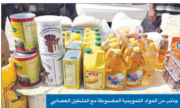
جانب من المواد التموينية المضبوطة مع التشكيل العصابي

وأوضحت الإدارة العامة للعلاقات والإعلام الأمني بالداخلية أنه تم ضبط الشخص بعد التأكد من صحة المعلومات، واستصدار الإذن القانوني، حيث تم القبض عليه في كمين أثناء بيعه أقراص «لاريكا»، وعثر بحوزته على 500 حبة متنوعة من المؤثرات العقلية، كما أُرشد إلى كمية