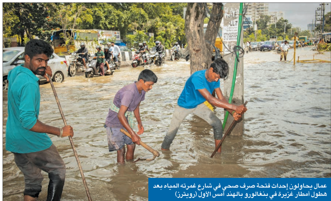
عمال يحاولون إحداث فتحة صرف صحي في شارع غمرته المياه بعد هطول أمطار غزيرة في بنغالورو بالهند أمس الأول

محلية كوشيك مينيا وكالة فرانس برس ب «توافد السياح لمحطة بوري» لمغادرة المدينة.