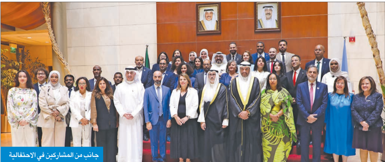
جانب من المشاركين في الاحتفالية

بالالتزام والالتفات للكويتيين ولجميع شعوب العالم، مؤكدة أن دولة الكويت ستظل ملتزمة بالعمل على تحقيق أهدافها ومقاصدها الخيرة لخدمة شعوب العالم وتحقيق تطلعاته وغاياته، فالعالم اليوم بات يقف على أعتاب حقبة جديدة بتحديات جديدة تستوجب منا تجديد التزامنا بالسلام كركيزة أساسية نبني عليها ازدهارنا الجماعي وأمننا المستدام».