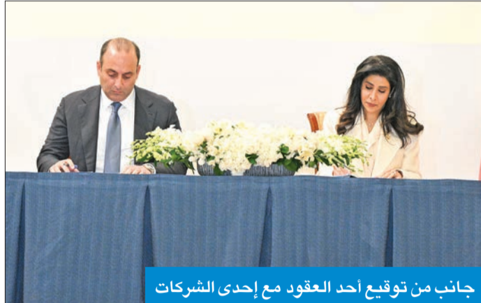
جانب من توقيع أحد العقود مع إحدى الشركات