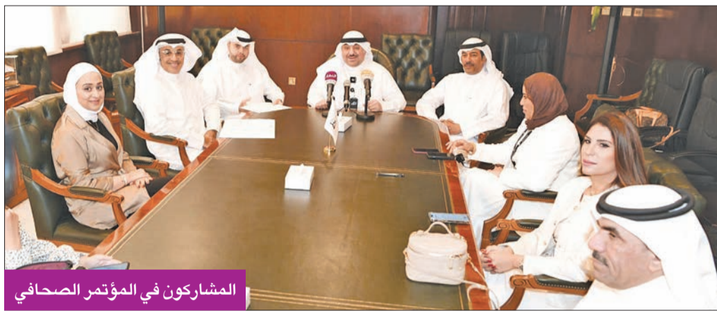
المشاركون في المؤتمر الصحافي

وتطرق الزامل في حديثه إلى حفل الافتتاح وأنه سيكون برعاية وزير الإعلام والثقافة ووزير الدولة لشؤون الشباب عبدالرحمن المطيري، وسيقام على المسرح الوطني في مركز الشيخ جابر الثقافي، أما شخصية المهرجان هذا العام وهو الفنان محمد البلوشي، ومن مقتطفات ما قال الزامل شارحاً مسيرة اللؤلؤ النرية: «خرج المعهد العالي للفنون الموسيقية، ودرس فيه، ويملك إنجازاً كبيراً من الألمان