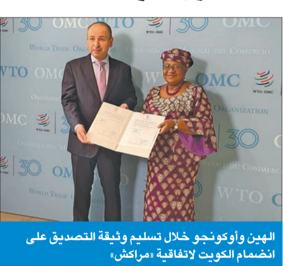
الهيئ وأوكونجو خلال تسلم وثيقة التصديق على انضمام الكويت لاتفاقية «مراكش»

سلمت الكويت، أمس الأول، وثيقة التصديق الرسمية على البروتوكول المعدل لاتفاقية مراكش المنشئة لمنظمة التجارة العالمية، المعنى بحماية مصادد الأسماك، في خطوة تؤكد التزام البلاد بدعم النظام التجاري العالمي العادل والمستدام والحفاظ على الموارد الطبيعية وحماية البيئة البحرية للأجيال المقبلة. وقال المندوب الدائم للكويت لدى الأمم المتحدة والمنظمات الدولية الأخرى في جنيف السفير الهين، لـ«كويتنا»، إن المصادقة على هذا البروتوكول المعدل تعكس دعم الكويت للنظام التجاري متعدد الأطراف وتوجهها نحو تعزيز التجارة الدولية العادلة والمستدامة، كما يعزز جهودها في مكافحة ممارسات الصيد الجائر وحماية النظم البيئية البحرية». أكد السفير الهين خلال لقائه المدير العام لمنظمة التجارة العالمية تجويزا إيويولا أوكونجو، التزام الكويت بتعزيز التعاون الدولي في هذا المجال، مشيراً إلى أهمية تضافر الجهود لضمان نجاح تنفيذ الاتفاقية. وشدد على أهمية استمرار الحوار الدولي في مواجهة الأزمات التي تمر بها منطقة الشرق الأوسط، لما لها من تأثيرات مباشرة