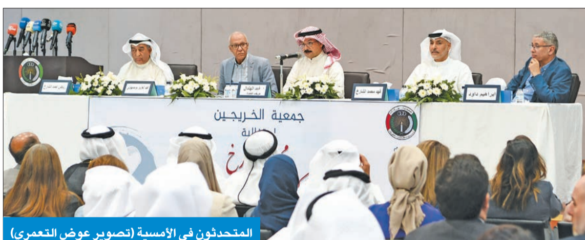
المتحدثون في الأمسية

الشارخ، من خلال تسمية شارع أو كلية الحاسوب باسمه، لما له من إسهامات كبيرة وبارزة في خدمة العلوم بشتى أنواعها التكنولوجية.