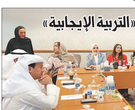
جانب من دورة «التربية الإيجابية»

وذكر المؤلف في محتويات الإصدار، أن عظام الأطفال تنمو باستمرار، وتعيد تشكيل نفسها (القولبة) على نطاق واسع، حيث يبدأ النمو من جزء من العظم يسمى صفحة النمو، فيما قد يحدث العديد من الاضطرابات العظمية بسبب الاضطرابات التي تحدث في الجهاز العضلي الهيكلي للطفل.