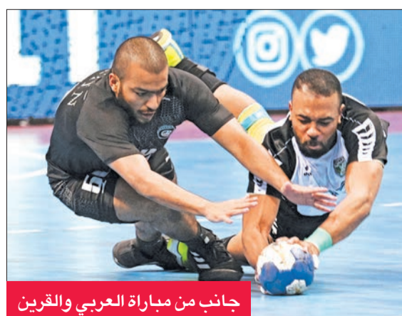
جانب من مباراة العربي والقرين

تقام اليوم ثلاث مباريات في افتتاح منافسات الجولة الرابعة من الدور التمهيدي للدوري العام لكرة اليد على صالة نادي الكويت، حيث يلتقي في الرابعة والنصف عصراً العربي مع القرين، وفي السادسة مساءً يلعب النصر مع الصليبيخات، وفي السابعة والنصف مساءً الكويت مع التضامن.