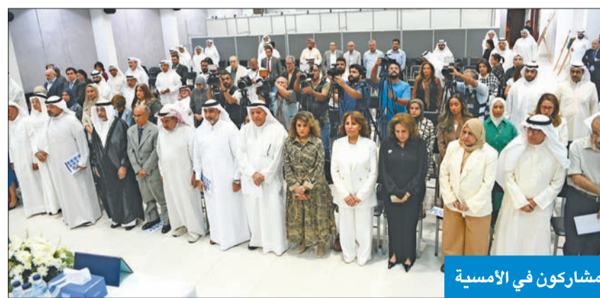
مشاركون في الأمسية