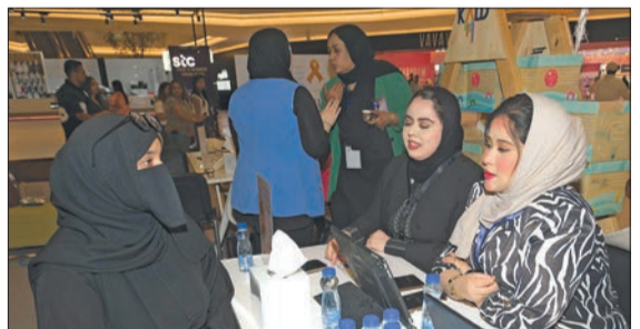
جانب من الحملة في الأبنوز