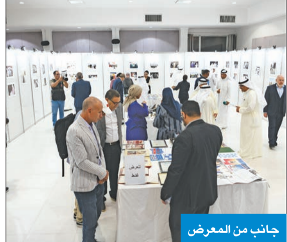
جانب من المعرض

صاحب الأمسية معرض يتضمن صوراً وأجهزة صخر الأولى وتطبيقات ووثائق تروي مسيرة رجل كويتي عربي عشق اللغة العربية حتى النخاع، فكان هاجسه حتى آخر يوم في عمره الحفاظ عليها وعلى هويتها، فعرّب الحاسوب وخلق مشروعه الثقافي الذي نهض به حتى جاءت ريادته.