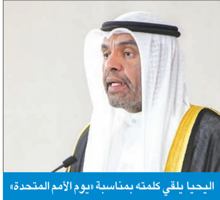
اليحيا يلقي كلمته بمناسبة «يوم الأمم المتحدة»

والخاريجي للامم المتحدة بأجهزتها المختلفة في دعم دولة الكويت لاستعادة سيادتها وحريتها في عام 1991، ذلك الموقف الذي يعد أحد أبرز النماذج الرائدة لدور الأمم المتحدة في حماية السلم والأمن الدوليين، وأحد أصق التجارب وأنجحها في هذا الإطار. وأكد دعم دولة الكويت ومساندتها لجهود الأمم المتحدة وكالاتها المتخصصة في تحقيق أهدافها ومقاصدها الخيرة لخدمة شعوب العالم وتحقيق تطلعاته وغاياته، فالعالم اليوم بات يقف على أعتاب حقبة جديدة بتحديات جديدة تستوجب منا تجديد التزامنا بالسلام كركيزة أساسية نبني عليها ازدهارنا الجماعي وأمننا المستدام».