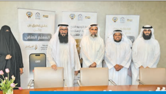
توجيه «الإسلامية» وأعضاء جمعية الوقف

من جانب آخر، اجتمع التوجيه الفني العام للتربية الإسلامية، والجمعية الكويتية للوقف الإنساني والتنمية لبحث مشروع تعقيب القرآن عبر منصة «صاد» لمعلمي ومعلمات التربية، وأثر هذا التعاون في غرس القيم والأخلاق، مما يعود بالنفع على كل المتعلمين. وتمت إقامة الدورات