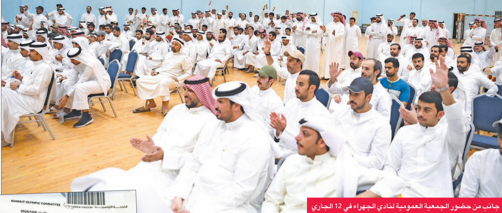
جانب من حضور الجمعية العمومية لنادي الجهراء في 12 الجاري