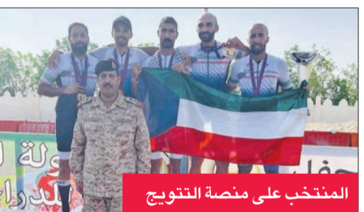
المنتخب على منصة التتويج

حصل المنتخب العسكري الكويتي على المركز الأول للفريق بالمجموع العام، في بطولة القوات المسلحة للدراجات الهوائية التي أقيمت في قطر، من 20 حتى 23 الجاري. وتهدف هذه البطولة العسكرية إلى رفع اللياقة البدنية للعسكريين، وقياس مدى قدرة التحمل والجهد البدني للمشاركين، حيث تعتبر اللياقة البدنية عنصراً أساسياً لأفراد القوات المسلحة. حضر حفل التتويج الحلق العسكري الكويتي لدى قطر العميد الركن بدر ناصر البكر أن المنتخب العسكري يضم مشاركين من الجيش الكويتي ووزارة الداخلية.