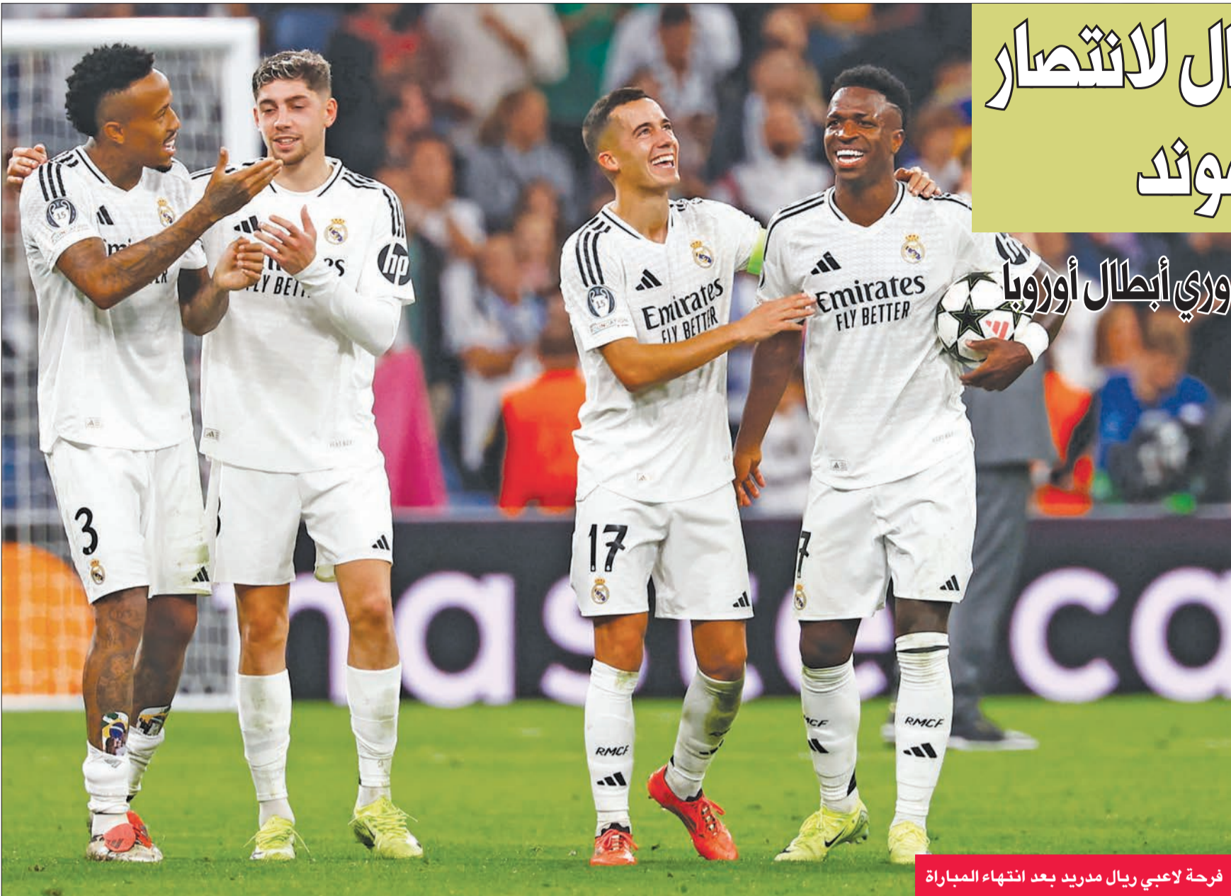
فرحة لاعبي ريال مدريد بعد انتهاء المباراة