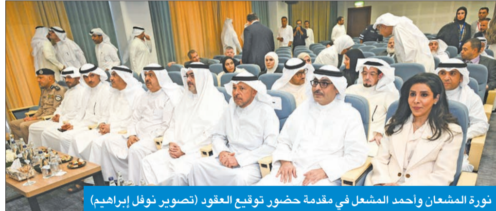
نورة المشعان وأحمد المشعل في مقدمة حضور توقيع العقود

وقعت وزيرة الأشغال العامة د. نورة المشعان، صباح أمس، عقود الصيانة الجذرية لأعمال الطرق السريعة والداخلية وتشمل 18 ممراسة كبرى لصيانة الطرق في مختلف مناطق البلاد بالمحافظات الست، بقيمة تقارب 400 مليون دينار.