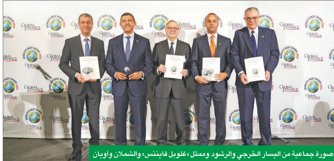
صورة جماعية من اليسار الخرجي والرشود وممثل «غلوبل فايننس» والشملان وأويان

خلال حفل خاص على هامش اجتماعات صندوق النقد والبنك الدوليين في واشنطن ● الرشود: «بيتك» يحظى بتقدير واسع في الأسواق العالمية بفضل مكانته ونجاحاته