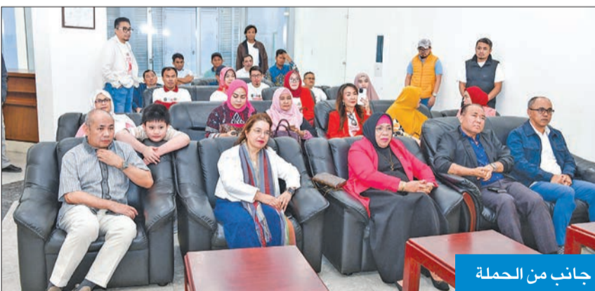
جانبا من الحملة

وشارك أكثر من 300 فرد من الجالية الإندونيسية في حملة التبرع بالدم طوعا، في مشهد يعكس قيما إنسانية ومضامين سامية مثل التضامن والرعاية والمسؤولية المجتمعية.