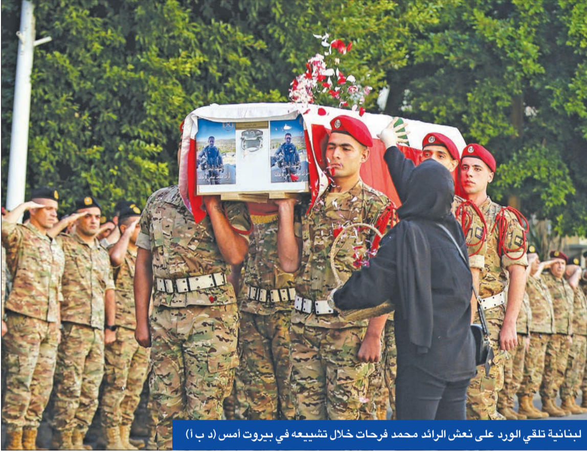
لبنانية تلقي الورد على نعش الرائد محمد فرحات خلال تشييعه في بيروت أمس

مسيرات تستهدف قاعدة جوية في تل أبيب لأول مرة... وتفجير منازل وذخائر بالجنوب اللبناني