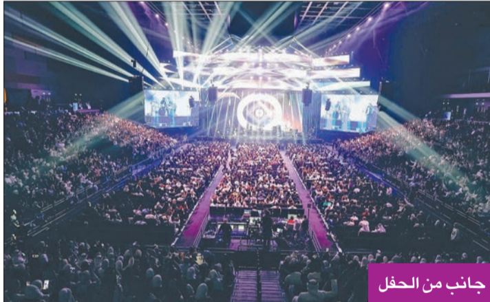
جانب من الحفل