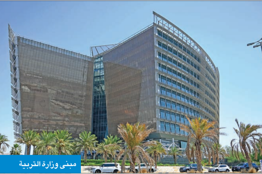
مبنى وزارة التربية

إجراءاتها، لافتة إلى أن هذه الإجراءات ستستغرق وقتاً، بالتالي سيكون المتقاعد محروماً من الرواتب لمدة قد تصل إلى شهرين. وطالبت المصادر مسؤولي «التربية» بالعمل على إصدار قرارات تكليف لموظفي أقسام نهاية الخدمة بالمناطق التعليمية، وديوان عام الوزارة للعمل خلال الفترة المسائية، لإنهاء إجراءات المتقاعدين، وبحث ملفات خدمتهم وتسوية أمورهم المالية، لاسيما أنهم خدموا الوزارة في السجل التجاري وغرفة تجارة وصناعة الكويت للعام الحالي. وأشارت إلى أن الممارسة غير قابلة للتجزئة، وتخص تنفيذ كل الأعمال موضوعاً، والخاصة، كما أن الممارس عليه تقديم تأمين أولي قدره 2