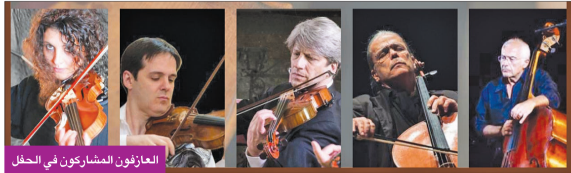
العازفون المشاركون في الحفل

ذکر السفير الإيطالي لدى الكويت لورينزو موريني أن السفارة بصدد إطلاق سلسلة من الأنشطة الثقافية المتنوعة، من 28 أكتوبر إلى 5 نوفمبر، بمناسبة الاحتفال بيوم الوحدة والقوات المسلحة الإيطالية التي تشارك في إطار الفعاليات «رحلة في الإبداع الإيطالي»، والذي يهدف إلى عرض بعض جوانب التميز الإيطالي في الفن والأزياء والتصميم والثقافة. وقال موريني، خلال مؤتمر صحفي عقده في مقر السفارة مع ممثلي عدد من الصحف المحلية، إنه سيتم خلال المهرجان تقديم سلسلة من الفعاليات التي تركز على تصميم الأزياء والمجوهرات والفنانين وصناع الطعام والشوكولاتة الإيطاليين، إضافة إلى عناصر أخرى ذات صلة لتقديم نمط الحياة الإيطالي بشكل واضح للجمهور الكويتي. وأوضح أن المهرجان يأتي في إطار تعزيز العلاقات الثنائية ودعم وتعميق أواصر الصداقة القوية بين الشعبين الإيطالي والكويتي، وبدأ في 28 أكتوبر بحفل موسيقي كلاسيكي تقدمه فرقة «فيلارمونيتشي دي روما»، وهي فرقة خماسية وتربة إيطالية شهيرة، وستقدم مجموعة مختارة من روائع أهم الملحنين الإيطاليين، مثل فيفالدي وروسيني وتارتيني وبيروغوليزي وريسيني، مبيناً أن الحفل مفتوح للجمهور مجاناً على مسرح الجامعة الأميركية في الكويت. وأشار إلى التعاون مع الجامعة الأميركية في الكويت لتقديم درس موسيقي مجاني للطلاب يقدمه العازفون، مضيفاً أن يوم الوحدة الوطنية