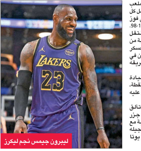
ليبرون جيمس نجم ليكرز

قاد ليبرون جيمس وأنتوني ديفيس فريقهما لوس أنجلوس ليكرز إلى قلب تأخره بفارق 22 نقطة أمام ضيفه فينكس صنز إلى فوز 123-116 في دوري كرة السلة الأمريكي للمحترفين (إن بي إي)، الجمعة. وسجل «الملك» جيمس 21 نقطة و 8 تمريرات حاسمة، فيما فرض ديفيس نفسه نجماً للقاء، بتصدره لأكثر من 35 نقطة، ليحقق ليكرز فوزه الثاني توالياً مع انطلاق الدوري، للمرة الأولى منذ موسم 2010-2011. وواصل ديفيس تألقه للمباراة الثانية توالياً، بعدما كان سجل 36 نقطة أمام مينيسوتا تمبروولفز و 103-110 في مستهل مباريات ليكرز، الثلاثاء. وفي نيويورك، تألق الثنائي الدومينيكاني كارل أنتوني تاوونز وميكال برينجز أمام جماهير ملعب ماديسون سكوير جاردن، فسجل كل منهما 21 نقطة، وساهما في فوز نيكس على إنديانا بايسرز 123-98. وأضاف تاوونز، الذي انتقل إلى نيكس في صفقة ثلاثية من مينيسوتا قبل أيام من معسكر التدريب، 15 متباعدة وصيد في أول مباراة له على ملعب فريقه الجديد. وفاجا شبكاغو بولز، بقيادة كوبي وايت الذي سجل 35 نقطة، مضيفة ميلووكي باكس، وفاز عليه 133-122. وفي سولت لاك سيتي، تألق الاحتياطي بادي هيلد من جزر البهاما في مباراته الثانية مع غولدن ستايت ووريترز، بتسجيله 27 نقطة في الفوز الكبير على يوتا جاز 127-86.