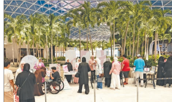
تفاعل جماهيري واسع مع مبادرة «رحلة وجد»

بالتعاون مع مراكز التسوق التابعة لمجموعة التمدين