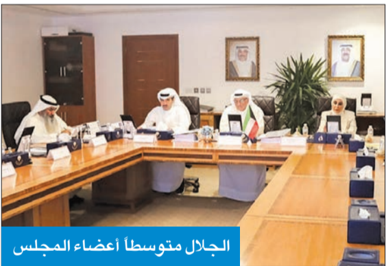
الجلال متوسطا أعضاء المجلس

التعليمية الخاصة، ويأتي ذلك بناءً على طلبات الجامعات والكليات الخاصة.