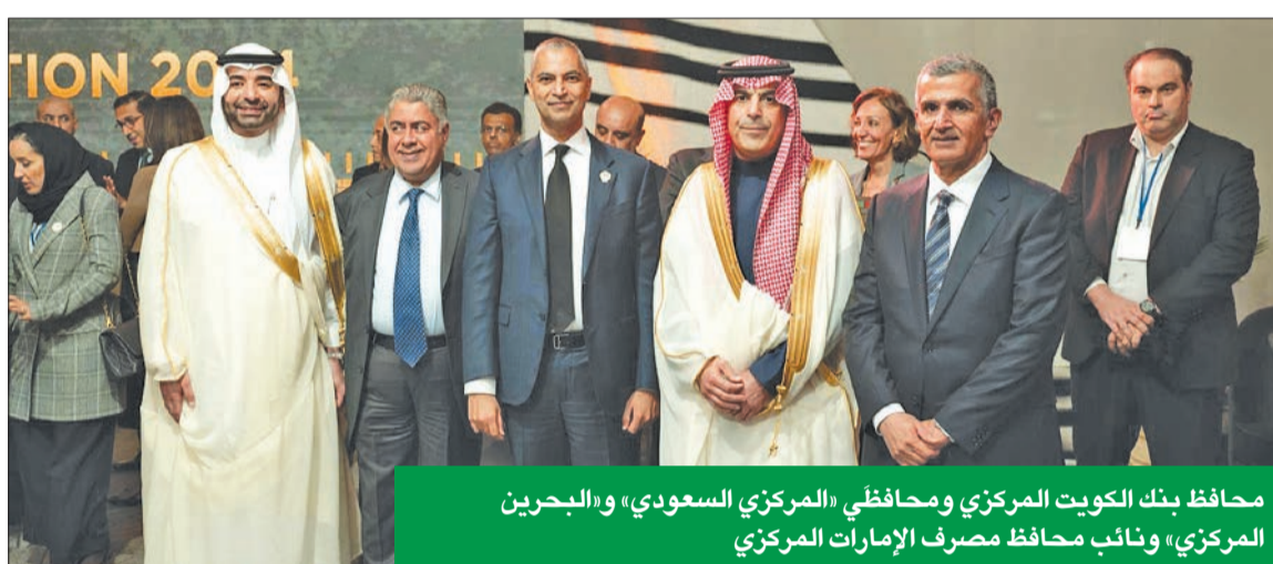
محافظ بنك الكويت المركزي ومحافظي «المركزي السعودي» و«البحرين المركزي» ونائب محافظ مصرف الإمارات المركزي

الدولة للشؤون الاقتصادية والاستثمار، ووزارة النفط، وبالتعاون مع، ثروة الفصام، وعدد كبير من الوزراء ورؤساء وكبار المسؤولين الخليجيين، بحضور سفيرة دولة الكويت لدى الولايات المتحدة الأميركية الشيخة الزين الصباح.