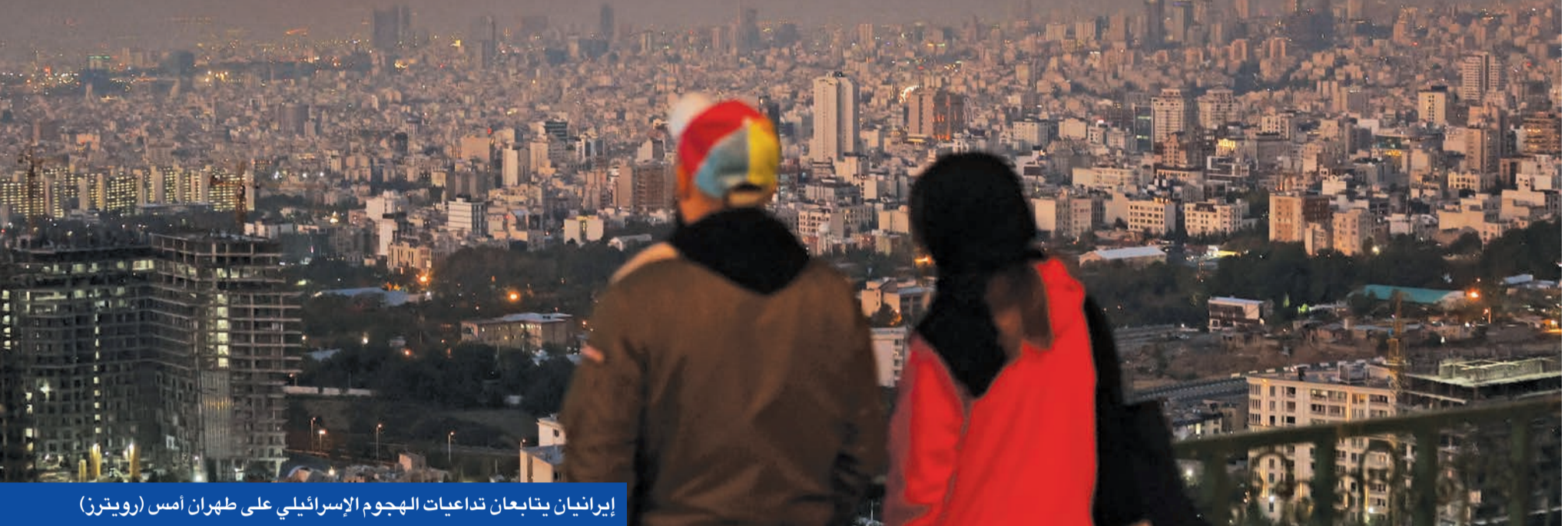
إيرانيان يتابعان تداعيات الهجوم الإسرائيلي على طهران أمس

● الاحتلال: نمتلك الحرية في سماء إيران وهاجمنا 20 موقعاً عسكرياً وألحقنا أضراراً جسيمة بصناعة الصواريخ ● 100 طائرة شاركت في الضربة البعيدة... واستهداف رادارات سورية... والعراق ينفي تعرضه لأي قصف