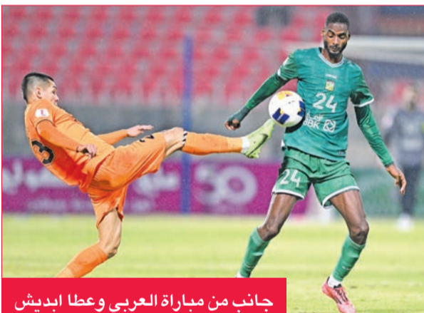
جانب من مباراة العربي وعطا ابديش

ربيع نهائي البطولة وكذلك نصف النهائي من مباراتين في مارس وأبريل من العام المقبل، على أن تقام المباراة النهائية في العاشر من مايو 2025.