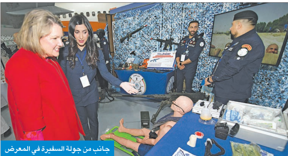
جانبا من جولة السفيرة في المعرض

ندوة «تمكين مستقبل الكويت» سلطت الضوء على رؤية 2035 في تعزيز الاقتصاد