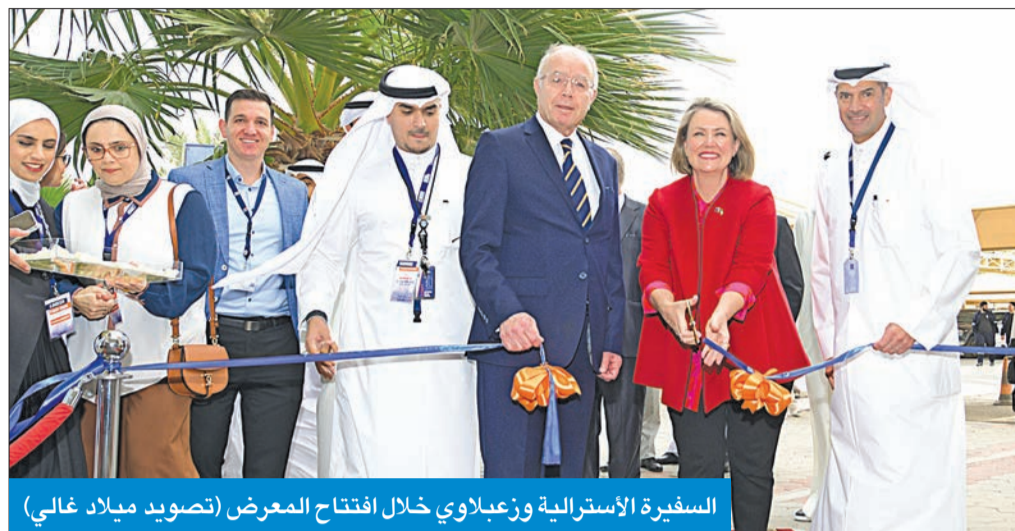
السفيرة الأسترالية وزعبلاوي خلال افتتاح المعرض