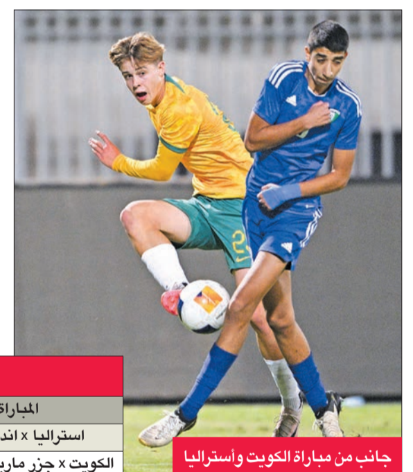
جانب من مباراة الكويت وأستراليا