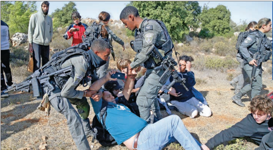
اعتداء على متطوعين يساعدون فلسطينيين في حصاد الزيتون أمس الأول

ودعا الأمين العام للمجلس جاسم محمد البديوي، عن «إدانته واستنكاره الاستهداف العسكري الإسرائيلي الذي تعرضت له الجمهورية الإيرانية»، واعتبره «انتهاكاً لسيادتها ومخالفة للقوانين والأعراف الدولية». ودعا إلى ضرورة تحلي كل الأطراف بأقصى درجات ضبط النفس، لتفادي عواقب استمرار الصراعات العسكرية في المنطقة، ودعا في الوقت ذاته المجتمع الدولي للاضطلاع بمسؤولياته تجاه خفض التصعيد. وحضت الخارجية السعودية كل الأطراف على التحلي بأقصى درجات ضبط النفس وخفض التصعيد،