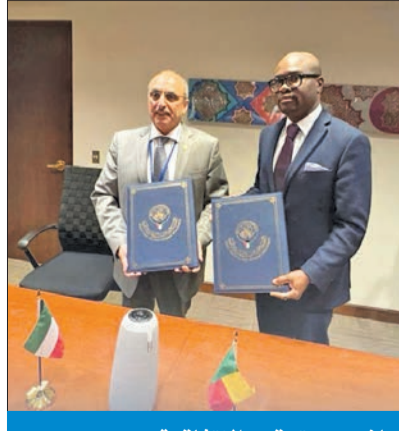
جانبا من توقيع الاتفاقية

لتمويل مشروع توفير المياه لمدينتي باسلا وألادا