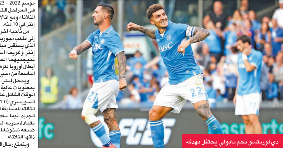
دي لورنتسو نجم نابولي يحتفل بهدفه

ابتعد نابولي بفارق 5 نقاط مؤقتاً في صدارة بطولة إيطاليا لكرة القدم بفوزه على ضيفه ليتشي 1-0 السبت في المرحلة التاسعة بانتظار مباراة القمة بين طارديه إنتر ويوفنتوس.