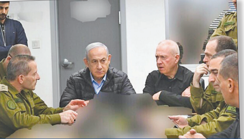
نتجهاه ووزير دفاعه يوافق غالاته وقادته يتابعون الضربة من تل أبيب أمس

انتقد زعيم المعارضة يانير لبيد «الرد العسكري المحدود» الذي أبلغت