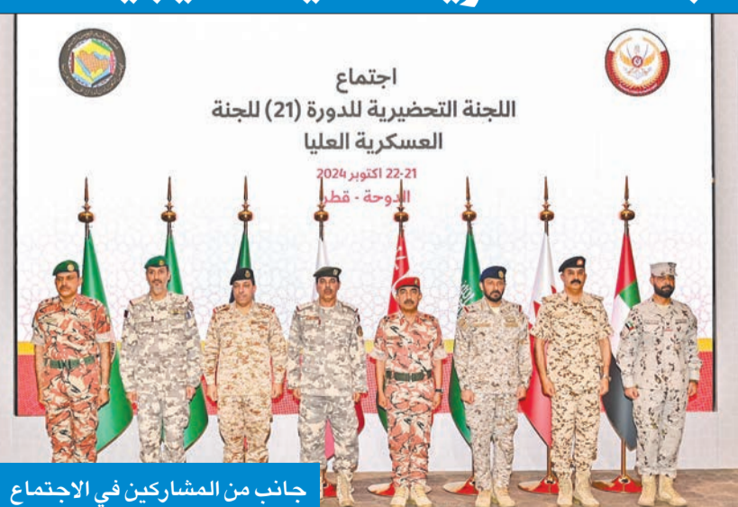
جانبا من المشاركين في الاجتماع

والتحضير للاجتماع والتشاورى الـ 21 للجنة العسكرية العليا، ومراجعة التوصيات والقرارات الخاصة بالعمل العسكري الخليجي المشترك المرفوعة من اللجان العسكرية المشتركة بدول المجلس، الذي يعد مسبقاً قبل اجتماع اللجنة العسكرية العليا لرؤساء أركان القوات المسلحة بدول مجلس التعاون الخليجي.