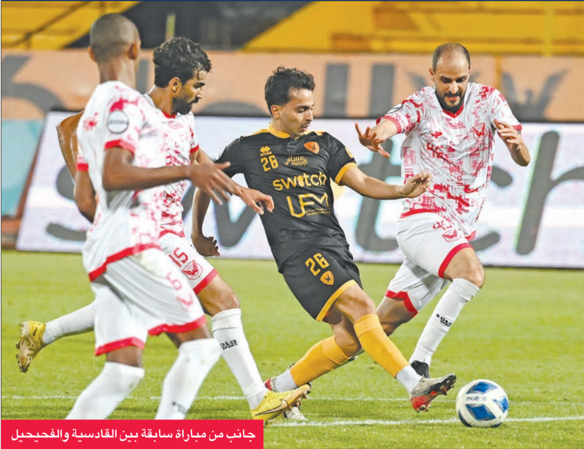
جانب من مباراة سابقة بين القادسية والفحيحيل

ويأتي ميسا إجراء تغييرات محدودة على التشكيل الأساسي، ويعول المدرب كثيراً على نجوم الفريق البرازيلي ليما، والدولي معاذ الأصبغ، والتونسي عماد اللواتي من جانبه، قدم اليرموك، الذي لم يفز حتى مباراة اليوم، مستوى جيداً للغاية في المباريات الماضية، لكن الأخطاء الدفاعية ما زالت تمثل