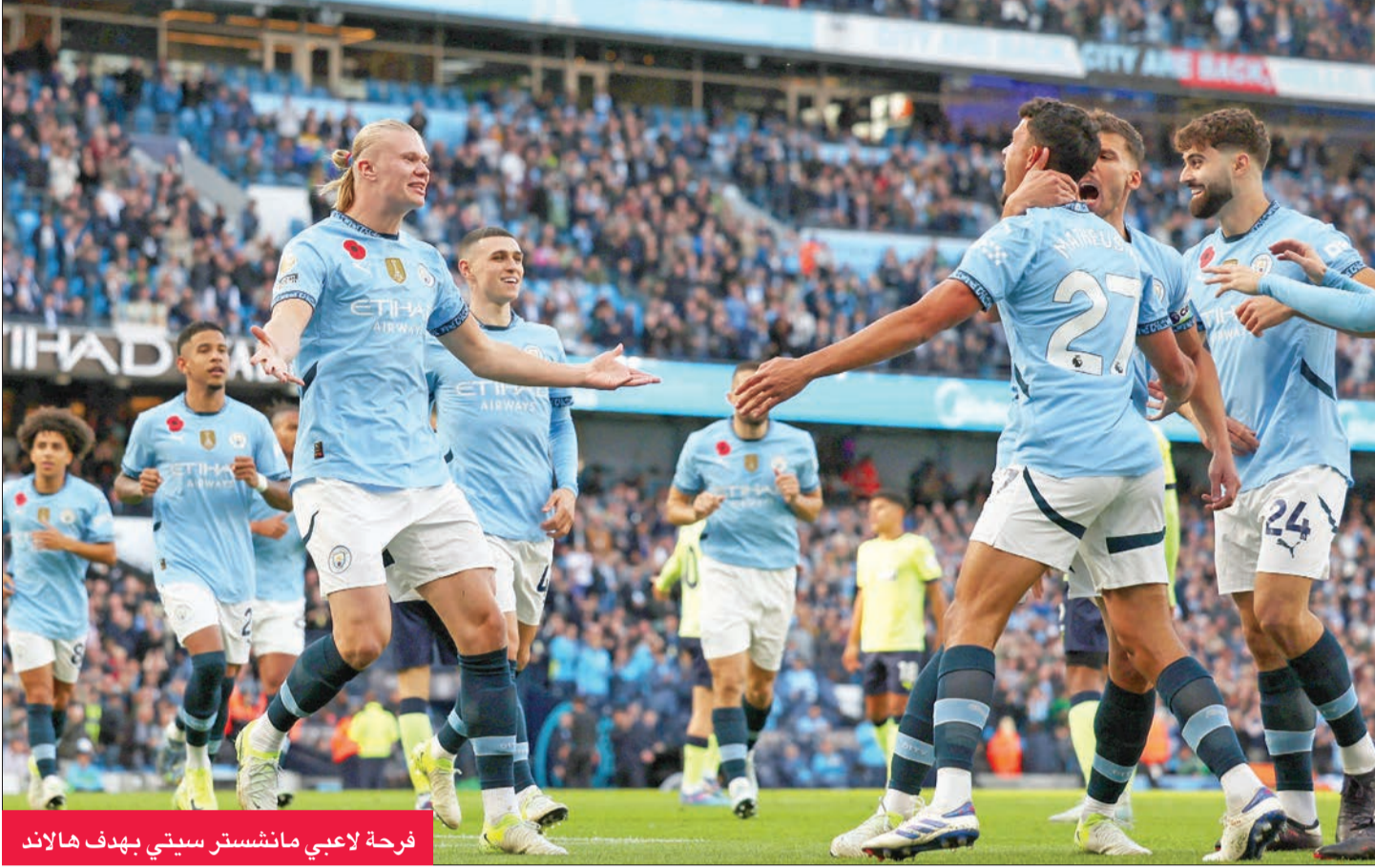
فرحة لاعبي مانشستر سيتي بهدف هالاند