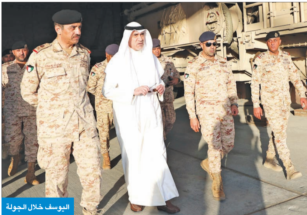
اليوسف خلال الجولة

أشاد النائب الأول لرئيس مجلس الوزراء وزير الدفاع وزير الداخلية، الشيخ فهد اليوسف، بدور سلاح الدفاع الجوي المحوري في الدفاع عن أجواء البلاد، مؤكداً أهميته كركيزة أساسية «ضمن منظومتنا الدفاعية، ومشدداً على تحقيق أقصى درجات اليقظة والجاهزية والاستعداد لحفظ أمن وسلامة أجواء الوطن، وضرورة الاستمرار في هذا النهج لتعزيز القدرات الدفاعية.