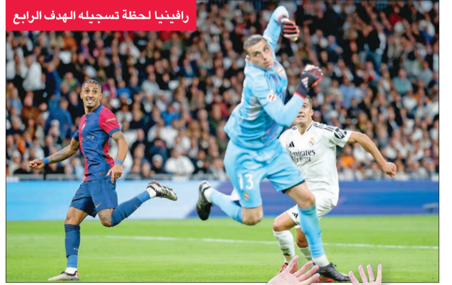
رافينيا لحظة تسجيله الهدف الرابع

ستظل مباراة الكلاسيكو التي أقيمت السبت 26 أكتوبر 2024 في الأذهان فترة طويلة، بعدما أثبت نادي برشلونه في ملعب «سانتياغو برنابيو» أنه الفريق الأفضل جازمية في العالم حاليا، بعدما دك شبك ريال