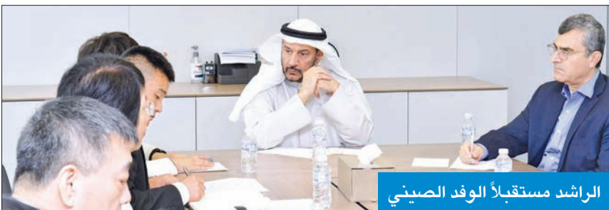
الراشد مستقبلاً الوفد الصيني

تهدف أيضاً إلى بحث سبل تعزيز التبادل والتعاون بين الصين والكويت في مجالات التعليم وتعزيز العلاقات الثقافية والأكاديمية.