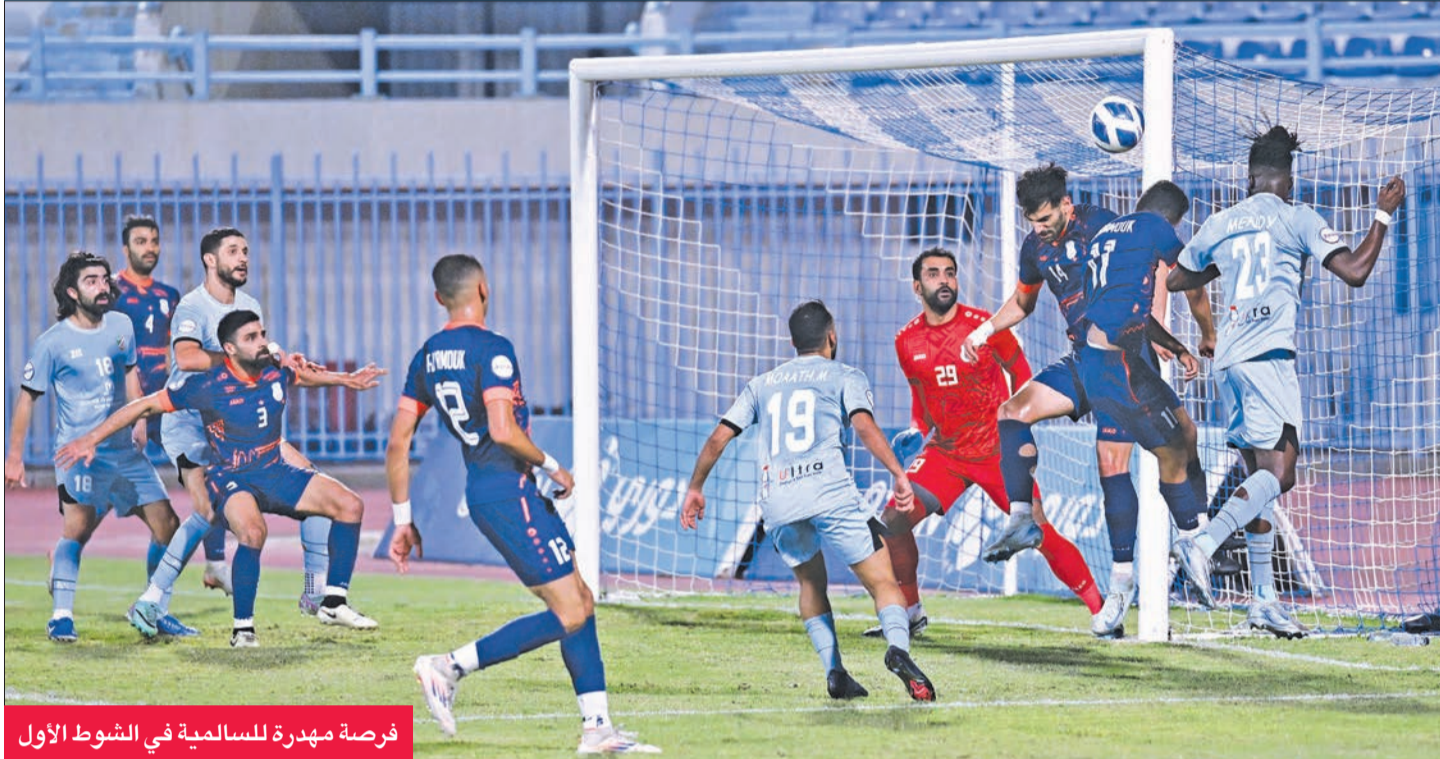
فرصة مهددة للسالمية في الشوط الأول