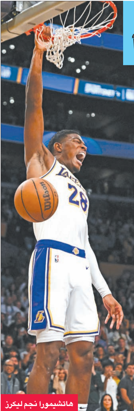
هاشيمورا نجم ليكرز