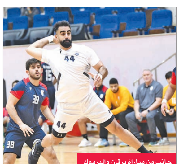
جانب من مباراة برقان واليرموك

عَمّق فريق برقان لكرة اليد جراح منافسه اليرموك، بفوز المباراة التي جمعت الفريقين أمس الأول على صالة نادي الأهداف عن العربي (الخامس) برصيد واحد (6 نقاط)، يليهم خيطان في المركز السادس، والنصر سابغاً، والقادسية ثامناً، والصليبيخات تاسعاً بفارق الأهداف ورصيد 4 نقاط، فيما ظل الفحيحيل بالمركز العاشر، والقرين الحادي عشر بنتقطنين لكل منهما، وبقي اليرموك في المركز الثاني عشر، والساحل الثالث عشر قبل الأخير، والتضامن في المركز الأخير من دون رصيد.