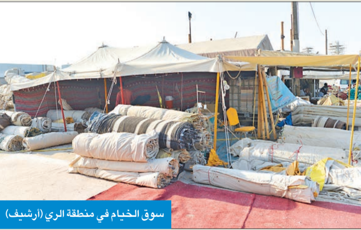
سوق الخيام في منطقة الري (أرشيف)

مواطناً من أصحاب رخص الخيام للحصول على 12 قسيمة، وتبلغ مساحة القسيمة الواحدة 300 متر مربع. وكانت البلدية قد أعلنت، في العام الماضي، طرح 69 قسيمة بسوق الخيام المؤقت بمنطقة الشويخ للاستغلال، وذلك وفق الشروط والضوابط الواردة في لائحة الأسواق العامة الصادرة بالقرار الوزاري رقم 118/2023 موزعة على نحو 55 قسيمة لمن كان مخصصاً له قسائم في سوق الخيام السابق في منطقة أسواق الري، قسيمان تعملان بنظام التنزيل الحر، ومدة استغلالها لمدة 6 أشهر فقط، إضافة إلى 12 قسيمة تعمل بنظام التخصيص لمن لديه ترخيص تجاري يسمح بنشاط الخيام. ودعت البلدية، آنذاك، من تنطبق عليهم الشروط والضوابط إلى التقدم بطلباتهم مصحوبة بالمستندات الثبوتية إلى مراقبة الخدمات البلدية فرع بلدية العاصمة في الشويخ خلال الفترة من 10 إلى 21 ديسمبر الماضي، لكن القرعة التي كانت مقررة في 2 يناير الماضي أجلت حتى أمس 26 الجاري.