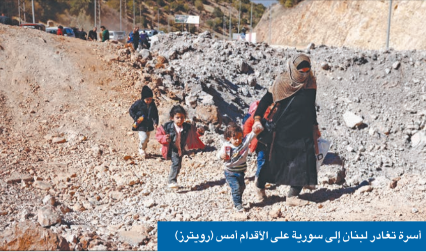
أسرة تغادر لبنان إلى سورية على الأقدام أمس

نقاط أخرى من الحدود منذ مدة طويلة، موضحاً أن هذه المقار المستهدفة تعتبر متروكة وخالية، وبين فينة وأخرى كان عناصر من «حرس الحدود» الإيرانيين يبيتون فيها لتثبيت موقعهم أو رصد تحركات المهريين. وأضاف أن هذه المخافر تعود إلى حقبة الحرب الإيرانية العراقية، وهي عملياً غير فعالة، لكن ما حدث أن الإسرائيليين استغلوا التفاهم وأطلقوا صواريخ تجاه طهران وكرمانشاه وتبريز وأصفهان والأهواز وإيلام وشيراز، ظناً منهم أن الإيرانيين لن يكونوا جاهزين للهجوم المباغت بسبب الاتفاق المنسق عبر الوسطاء. ولفت إلى أن الخطة الإسرائيلية كانت تشمل تحريك عملاء داخل إيران ليقوموا بتدمير منشآت الدفاعات الجوية واستهدافها أو إشغالها لتمكين الطائرات الإسرائيلية من قصف الأهداف بسهولة، لكن الأجهزة الأمنية الإيرانية كشفت