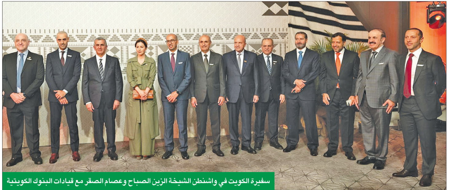
سفيرة الكويت في واشنطن الشبخة الزين الصباح وعصام الصقر مع قيادات البنوك الكويتية

وناقشت الاجتماعات السنوية هذا العام العديد من الموضوعات المهمة من بينها كيفية بناء المرونة الاقتصادية في ظل الاقتصاد العالمي الضعيف وارتفاع حالة عدم اليقين، حيث يحتاج صناع السياسات إلى بناء مستقبل أكثر مرونة من خلال تعزيز شبكات الأمان الاجتماعي لحماية الفئات الأكثر ضعفاً، وتحسين الحوكمة والمساءلة، وتعزيز أطر السياسات، ومعالجة تغير المناخ.