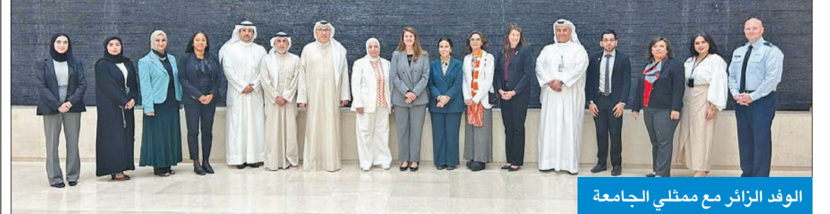
الوفد الزائر مع ممثلي الجامعة

الذي تم الإعلان عنه بالأمر السامي من سمو أمير البلاد الشيخ مشعل الأحمد لأن يكون هو جهة الاتصال للتعاون بين وكالة ناسا والجهات الكويتية المعنية.