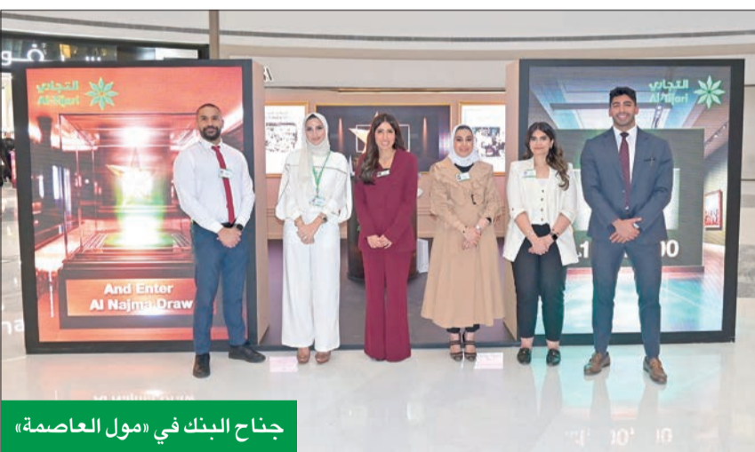
جناح البنك في «مول العاصمة»