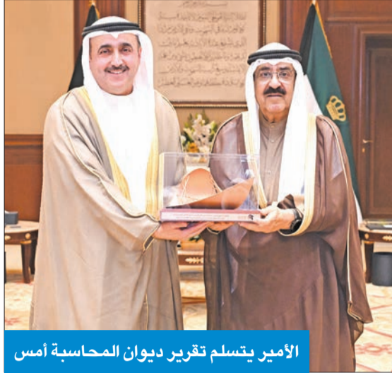
الأمير يتسلم تقرير ديوان المحاسبة أمس

استقبل سمو أمير البلاد الشيخ مشعل الأحمد، بقصر بيان صباح أمس، سمو ولي العهد الشيخ صباح الخالد، واستقبل سموه رئيس مجلس الوزراء، سمو الشيخ أحمد العبدالله. كما استقبل سموه وزير التجارة والصناعة وزير المالية، وزير الدولة للشؤون الاقتصادية والاستثمار بالإصابة، خليفة العجيل، ومدير هيئة تشجيع الاستثمار المباشر الشيخ د. مشعل الجابر، ونائبة رئيس مجلس إدارة الهيئة وفاء القطامي، حيث قدموا لسموه التقرير السنوي التاسع لهيئة تشجيع الاستثمار المالي 2023/2024. وأستقبل سموه رئيس ديوان المحاسبة، عصام الرومي، حيث قدم لسموه التقرير السنوي لديوان المحاسبة عن نتائج الفحص والمراجعة على تنفيذ مبادرات الجهات المشمولة برعايته وحساباتها الختامية للسنة المالية 2023/2024. من جهة أخرى، بعث سموه ببرقية تهنئة إلى رئيس التشيك، بيتز بافيل، عبر فيها سموه عن خالص تهنائيه بمناسبة العيد الوطني لبلاده، وتمنى سموه له موفق في الصحة والعافية وللتشيك وشعبها كل التقدم والازدهار.