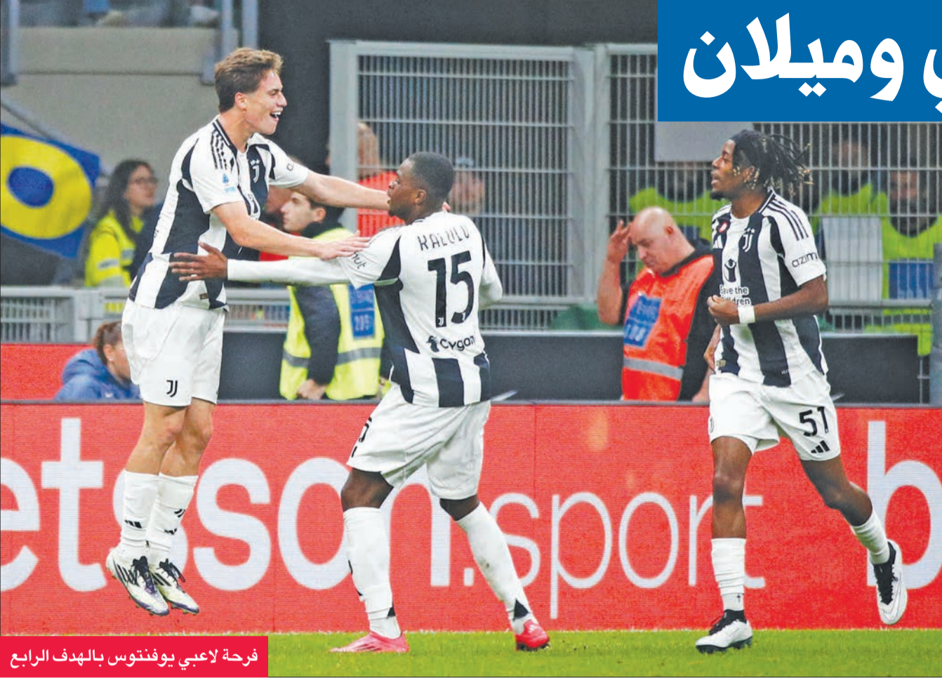
فرحة لاعبي يوفنتوس بالهدف الرابع

خطا في رمى فريقه) مقابل هدف للفرنسي مانو كونيه (39)، ولعب روما بعشرة لاعبين منذ الدقيقة 65 بسبب طرد مدافعه الإسباني ماريو هيرموسو لتلقيه الإنذار الثاني. وهو الفوز الثالث تواليًا والرابع لفورنتينا هذا الموسم، ورفع رصيده إلى 16 نقطة وارتقى إلى المركز الرابع بفارق الأهداف أمام أتالانتا ولاتسيو وأودينيزي، فيما تعرض روما للخسارة الثانية تواليًا والثالثة هذا الموسم فتمتد رصيده عند 10 نقطة وتراجعت إلى المركز الحادي عشر.