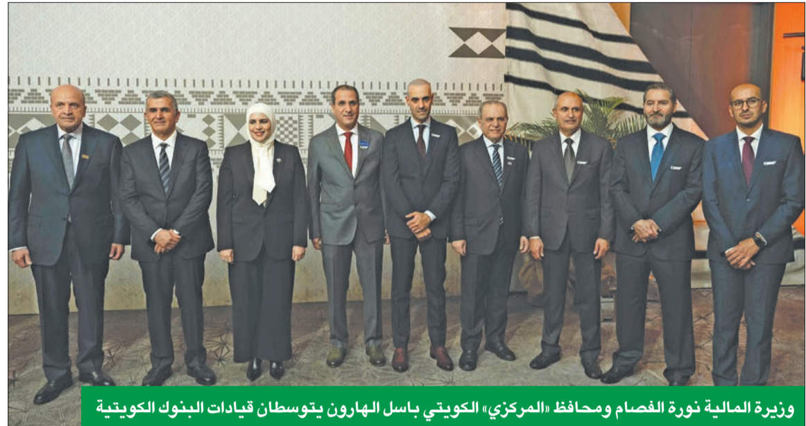
وزيرة المالية نورة الفصام ومحافظ «المركزي» الكويتي باسل الهارون يتوسطان قيادات البنوك الكويتية

من المؤسستين، لتشمل الاجتماعات دورات وجلسات إعلامية ومؤتمرات صحافية والكثير من الأنشطة والفعاليات الأخرى، التي تركز على الاقتصاد العالمي، والتنمية الدولية، والنظام المالي العالمي. وتتضمن الاجتماعات السنوية اجتماعات لجنة التنمية، واللجنة الدولية للشؤون النقدية والمالية، ومجموعة العشرة، ومجموعة الأربعة والعشرين، والعديد من مجموعات الأعضاء الأخرى. وفي ختام اجتماعاتها، تقوم اللجان المذكورة، فضلاً عن العديد من المجموعات الأخرى، بإصدار بيانات خاصة بكل منها.