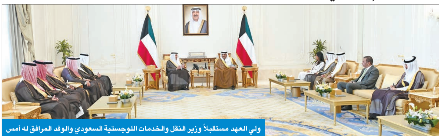
ولي العهد مستقبلاً وزير النقل والخدمات اللوجستية السعودي والوفد المرافق له أمس

سموه تسلم تقرير «تشجيع الاستثمار» و«المحاسبة» وهنأ التشيك