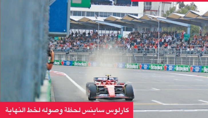
كارلوس ساينس لحظة وصوله لخط النهاية

أحرز سائق فيراري الإسباني كارلوس ساينس جونيور المركز الأول في سباق جائزة المكسيك الكبرى، الجولة العشرين من بطولة العالم لسباقات الفورمولا واحد، الأحد على حلبة برمانوس رودريغيس في مكسيكو سيتي. وتفوق ساينس الذي أحرز المركز الأول للمرة الأولى في المكسيك والرابعة في مسيرته الاحترافية، على سائق ماكلارين البريطاني لاندو نوريس وزميله في الفريق الإيطالي شارل لوكلير من موناكو.