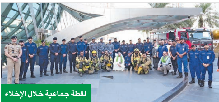
لقطة جماعية خلال الإخلاء

بعد أمراً أساسياً لضمان نجاح عمليات الإخلاء، هذه الأنظمة تعمل معاً لتوفير بيئة آمنة وفعالة في حالات الطوارئ. يُذكر أن شركة الحمراء العقارية حرصت على توفير أعلى معايير السلامة، مما يجعل أماناً في الكويت تماشياً مع أسسها الرامية لتعزيز سلامة المستأجرين والموظفين، تواصل الشركة تقديم تدريبات السلامة بشكل دوري لضمان الجاهزية الكاملة في حالات الطوارئ.