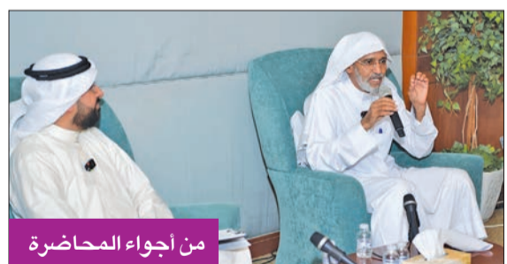
من أجواء المحاضرة

وعلى هامش المحاضرة، قالت العلي إن مكتبة عبدالعزيز حسين تسعى إلى تعزيز الثقافة والمعرفة، من خلال تنظيم مجموعة متنوعة من الأنشطة الثقافية والمحاضرات، ما يساهم في تطوير مهارات التفكير النقدي لدى المشاركين، وأيضاً تنظيم الورش التي تهدف إلى تنمية مهارات الإبداع لدى الشباب والمبدعين، مؤكدة أن تلك الأنشطة تشكل منخبة لتبادل الأفكار وتعزيز الحوار بين الأفراد، ما يساهم في بناء مجتمع منفتح وواع.