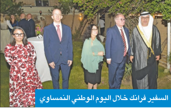
السفير فرانك خلال اليوم الوطني النمساوي

بشكل مشترك المفاوضات الحكومية الدولية بشأن التمثيل العادل في مجلس الأمن وزيادة عدد أعضائه، وإننا نلتزم بجعل هذا المجلس أكثر فعالية بما في ذلك ترشيحنا لمقعد غير دائم في الانتخابات في 2026، بالإضافة إلى ذلك، جرت مشاورات سياسية بين وزارتي دولتيينا قبل بضعة أشهر». وتابع «إننا نشهد القيم والحرية والديموقراطية تتعرض للهجوم بشكل متزايد في جميع أنحاء العالم، ولكن دعوني أخبركم يجب أن ندافع عن القيم الدائم حتى يتمكن الإسرائيليون والفلسطينيون من العيش جنباً إلى جنب في سلام».