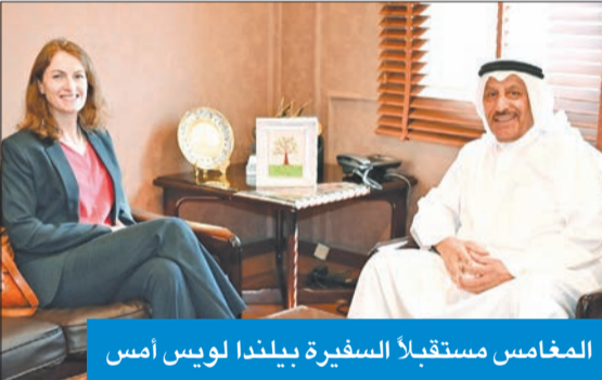
المغامس مستقبلاً السفيرة بيلندا لويس أمس

المغامس: «الهلل الأحمر» حققت ما تصبو إليه في العمل الخيري