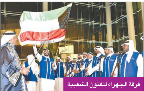
فرقة الجهراء للفنون الشعبية

الكويتي، حيث تعكس تاريخاً غنياً وتنعواً ثقافياً يتميز به المجتمع الكويتي، حيث تجسّد هذه الفرق الفنون التقليدية من الأغاني، وتعتبر وسيلة لنقل التراث من جيل إلى جيل. وحول أهمية الفنون الشعبية، قال إنها تمثل جزءاً أساسياً من الهوية الثقافية الكويتية، لافتاً إلى أنها تعكس القيم والتقاليد التي نشأ عليها المجتمع الكويتي، وتعزز روح الانتماء والهوية للوطن، كما تلعب فرق الفنون الشعبية دوراً مهماً