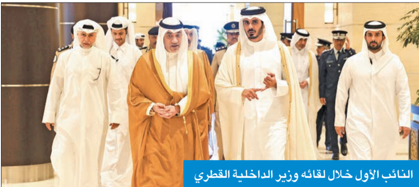
النائب الأول خلال لقائه وزير الداخلية القطري