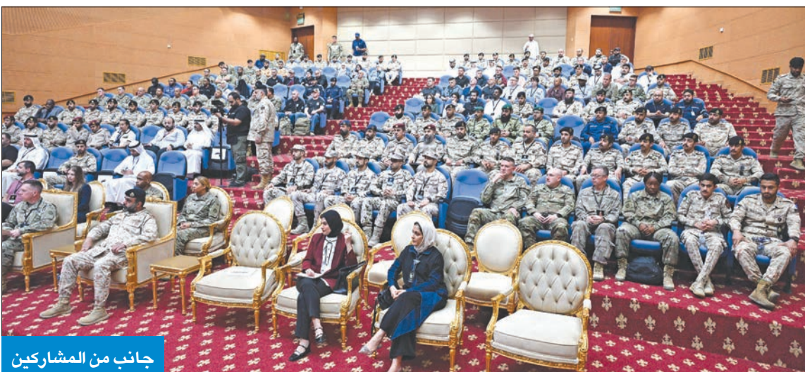
جانب من المشاركين

بمشاركة 80 فريقاً يمثلون 10 دول وبالتعاون مع الجيش الأميركي