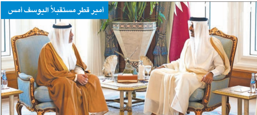
أمير قطر مستقبلاً اليوسف أمس

استقبل أمير دولة قطر الشقيقة الشيخ تميم بن حمد آل ثاني، النائب الأول لرئيس مجلس الوزراء وزير الدفاع وزير الداخلية الشيخ فهد اليوسف، والوفد المرافق له بمناسبة زيارته للدوحة للمشاركة في افتتاح الدورة الـ15 لمعرض ومؤتمر «مليبول قطر 2024»، وقال بيان تلقته «كونا»، إن اليوسف نقل خلال اللقاء تحيات سمو أمير البلاد القائد الأعلى للقوات المسلحة الشيخ مشعل الأحمد، وسمو ولي العهد الشيخ صباح الخالد إلى أخيهما الشيخ تميم بن حمد آل ثاني وتمنياتهم له بموفور الصحة والعافية،