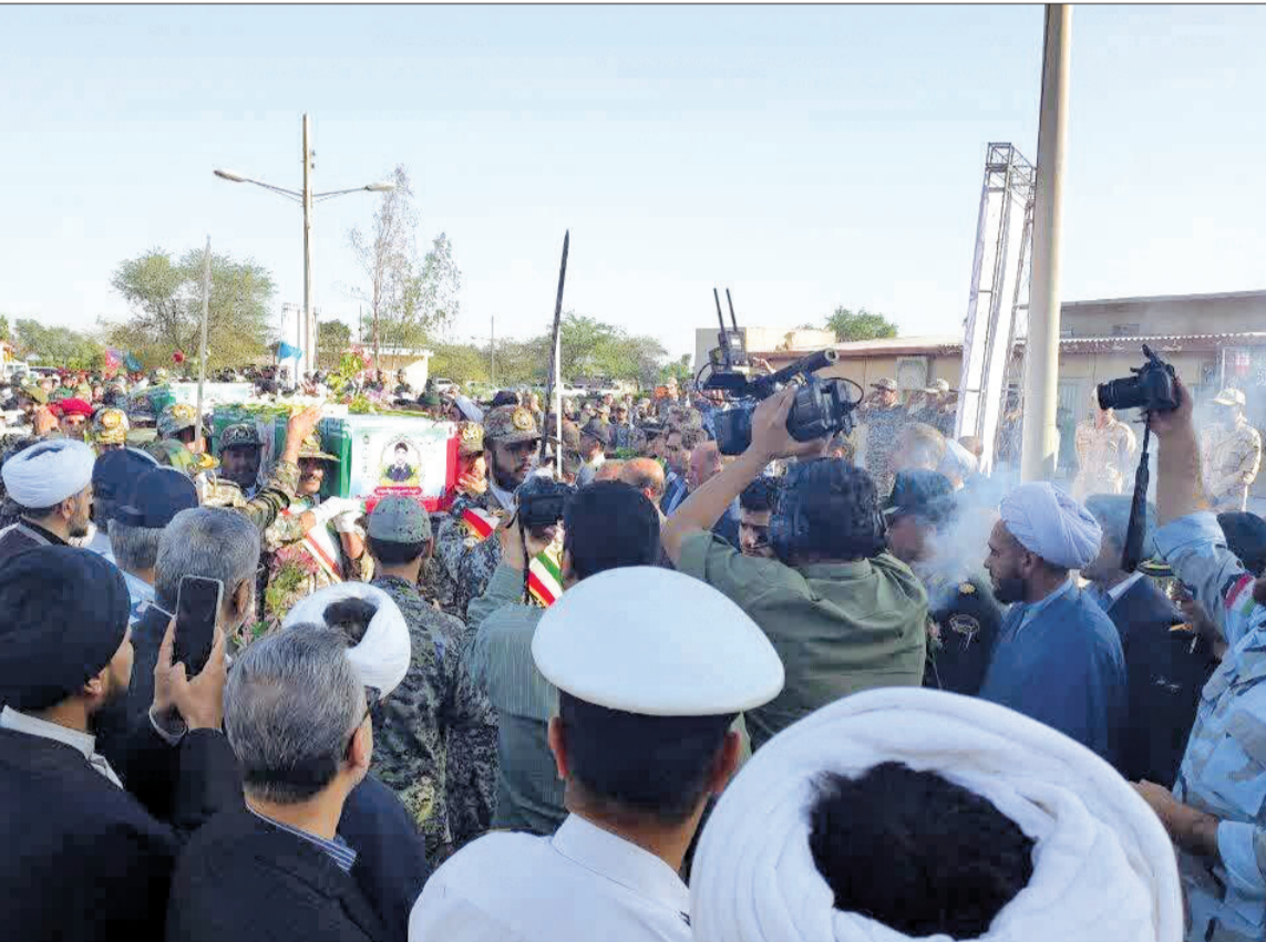
مراسم تشييع أحد عناصر الدفاع الجوي الإيراني الذين سقطوا جراء الهجوم الإسرائيلي بمدينة شوشتر أمس

وزارة الخارجية الروسية، أن «موسكو تبذل أقصى الجهود لمنع انزلاق منطقة الشرق الأوسط إلى هاوية الحرب الكبرى». على الجبهة المقابلة، أكد رئيس الأركان الإسرائيلي، هرتسي هاليفي، أن ضربة «جزءاً من قدراتنا فقط، ولدينا القدرة على فعل ما هو أكبر بكثير». وقال خلال اجتماع تقييم للهجوم: «قمنا بضرب أنظمة استراتيجية في إيران. وسنرى كيف ستتطور الأمور. نحن مستعدون لجميع السيناريوهات على جميع الجبهات». واعتبر أن الضربة كانت «رسالة واضحة»، مضيفاً: «نعرف كيف نصل، ونضرب أي تهديد في أي مكان وفي أي وقت». ولاحقاً، نفى رئيس الوزراء الإسرائيلي بنيامين نتنياهو خلال اجتماع في «الكنيست» أن يكون قد تنازل عن التعامل مع خطر البرنامج النووي، معتبراً أنه رأس اهتمامه «ونحن مستمرون في العمل من أجل إزالة التهديد الإيراني. وإسرائيل الأكثر قوة في المنطقة. وهذه أيام مصيرية لتحول تاريخي».