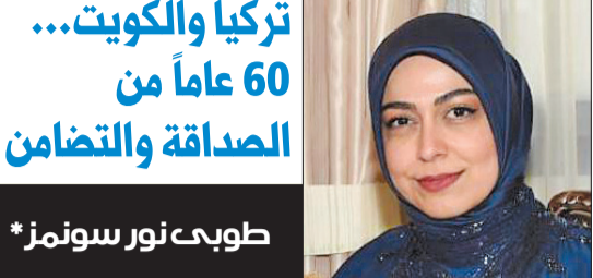
طوبعت نور سونمز*

الناس تأتي عبر رحلات الطيران المباشرة بين بلدينا، واعتقد أننا حققنا نتائج كبيرة مع شركة طيران كويتية خاصة، ونعمل بجدية كبيرة معهم، وقريباً جداً، أعتقد في نهاية نوفمبر المقبل، سنحاول توقيع مذكرة تفاهم بين هذه الشركة وبين مطار بودابست لنبدأ الرحلات المباشرة الصيف المقبل، وأنا متفائل جداً لأن الرحلات المباشرة ستجلب الأعمال والسياحة، وأستطيع أن أقول إن ثمة ضوءاً في نهاية النفق مع الرحلات المباشرة». وأعرب السفير الهنغاري عن اعتزازه وفخره في نهاية عام على بداية مهمته في الكويت، قائلاً: «أنا سعيد وفخور جداً لأن ما حققته خلال هذا العام هو أنني استطعت وضع الكويت على الخريطة المجرية، وهذا شيء مهم جداً بالنسبة لبودابست،