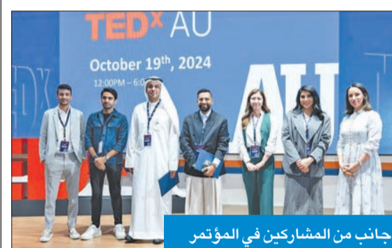
جانب من المشاركين في المؤتمر

استضاف مركز التعليم والتعلم في الجامعة الأسترالية المؤتمر العالمي للمحاضرات TEDx، تحت عنوان «طريقة تفكير: بناء الغد»، السبت 19 الجاري، في قاعة محاضرات الجامعة.