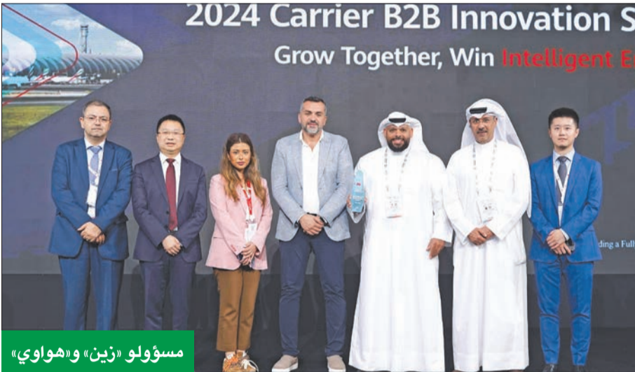
مسؤولو «زين» و«هواوي»

خلال قمة «هواوي» لابتكار الأعمال على هامش معرض «جيتكس» في دبي