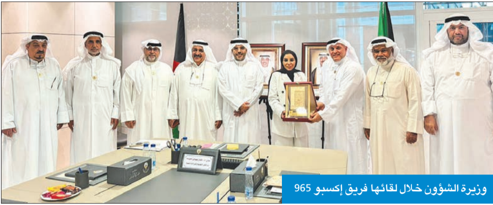
وزيرة الشؤون خلال لقائها فريق إكسبو 965

«المالية» أبلغتها بعدم الصرف ما لم تزودها الجمعيات بقرارات مجلس الوزراء بشأن صرف مخصصاتها