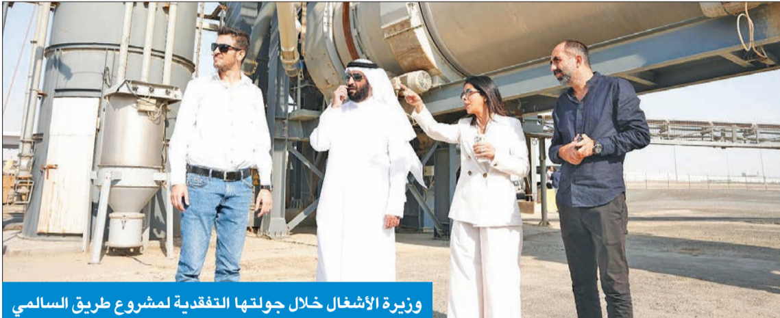
وزيرة الأشغال خلال جولتها التقديرية لمشروع طريق السالمي