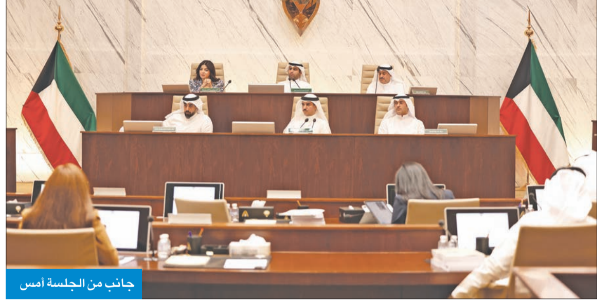
جانب من الجلسة أمس

الكويت بالاستعداد لهذا الحدث الرياضي الكبير، بمتابعة جمع الجوانب المتعلقة بالنظافة العامة والتحضرات اللوجستية؛ للحفاظ على النظافة والمنظر الحضاري لدولة الكويت. وأضاف أن وضع جليب الشيوخ يزداد سوءاً خصوصاً أنها مليئة بالمخالفات والتجاوزات الأمنية الخطيرة، وعلى الجانب البيئي والنظافة العامة، يكفي جولة بين بعض شوارع المنطقة لمشاهدة تراكم القمامة وانبعاث الروائح الكريهة، وهذا كله ينعكس على الصحة العامة للقاطنين فيها، وحتى في المناطق القريبة منها.