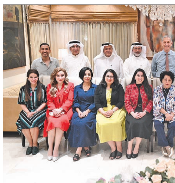
المشاركون في الملتقى الثقافي

ومن الممكن أن ينسب شخص منتجاً ليس له عن طريق الذكاء الاصطناعي، فتلج الأصور وجدت في السابق، وترجع بالدرجة الأولى إلى ضمير الشخص، فالسرقة وجدت قبل الذكاء الاصطناعي، والأمن أصبح شيئاً ملهماً. وتابع: «الصعوبة في الذكاء الاصطناعي تكمن في طرح السؤال بشكل صحيح، ومن ستكون الإجابة وافية، ومن الصعب الحصول عليها في أي مكان آخر. اعتقد أنه من الممكن الاستفادة من الذكاء الاصطناعي، لكن يتعين على المستخدم أن يتصف بالأمانة في استعماله، وذلك بنطق أيضاً على استعمال الكتب في عمل البحث، ووضع قائمة بالمصادر».