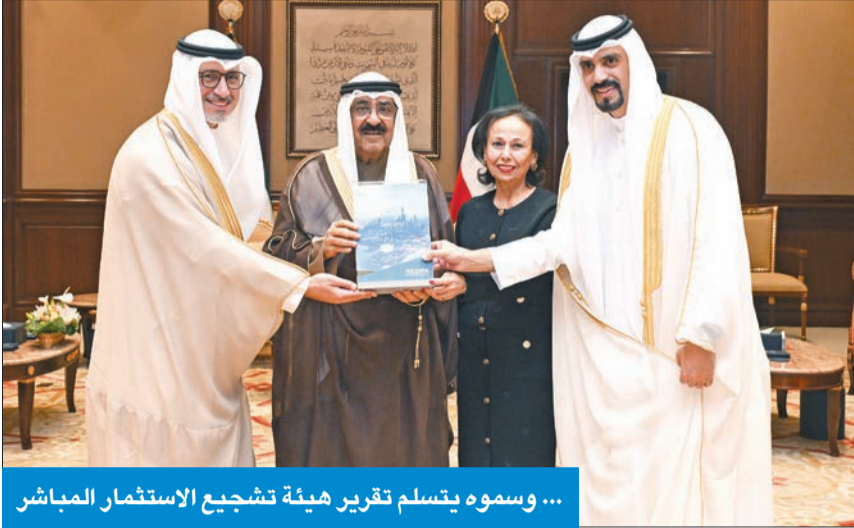
... وسموه يتسلم تقرير هيئة تشجيع الاستثمار المباشر

سموه استقبل ولي العهد والعبدة والعجيل والجابر والقطامي والرومي... وهنأ التشيك