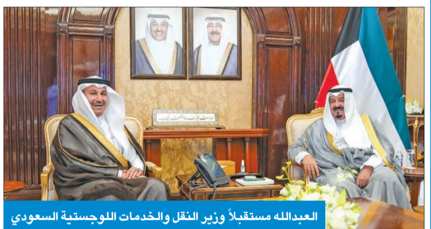
العبدالله مستقبلاً وزير النقل والخدمات اللوجستية السعودي

استقبل رئيس مجلس الوزراء سمو الشيخ أحمد العبدالله، بحضور وزيرة الأشغال العامة د. نورة المشعان، في قصر بيان أمس، وزير النقل والخدمات اللوجستية بالمملكة العربية السعودية الشقيقة صالح الجاسر، والوفد المرافق له، بمناسبة زيارته للبلاد. حضر المقابلة سفير خادم الحرمين الشريفين لدى الكويت الأمير سلطان بن محمد العبدالله الصباح، ورئيس ديوان رئيس مجلس الوزراء عبدالعزیز الدخيل، ورئيس الإدارة العامة للطيران المدني، الشيخ حمود الصباح. من جهة أخرى، بعث سموه ببرقية تهنئة إلى رئيس جمهورية التشيك بيتز بافيل، بمناسبة العيد الوطني لبلاده.