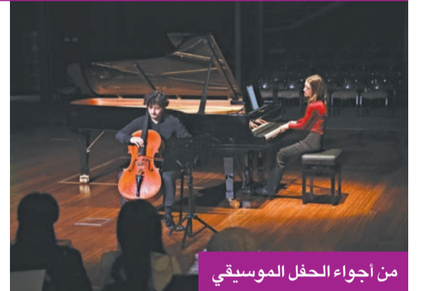
من أجواء الحفل الموسيقي