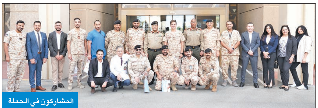
المشاركون في الحملة

ختام فعاليات حملة «اعرف أكثر عن مرض الصدفية»