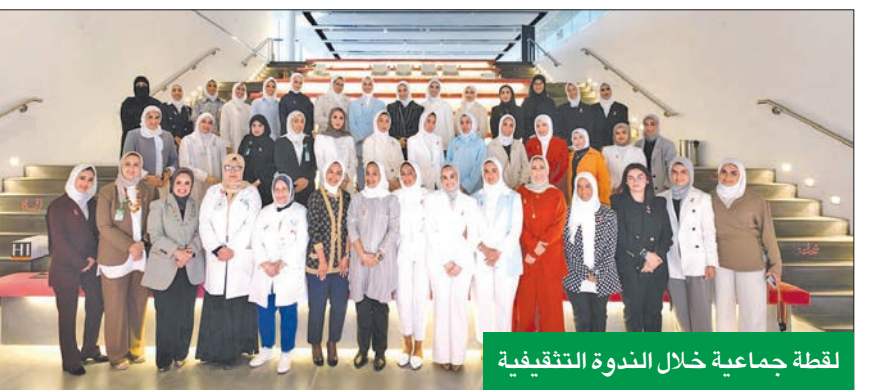
لقطة جماعية خلال الندوة التثقيفية

متفاعلات، للاستفادة من تجاربهن وخبرتهن، وبت روح التفاؤل في السيدات اللاتي يعانين المرض. وتأتي الحملة، التي دأب البنك على تنظيمها سنوياً، انطلاقاً من مسؤوليته الاجتماعية تجاه مختلف القضايا التي تهم المجتمع وأفراده، بما في ذلك مجال التوعية الصحية ودعم المبادرات الصحية.