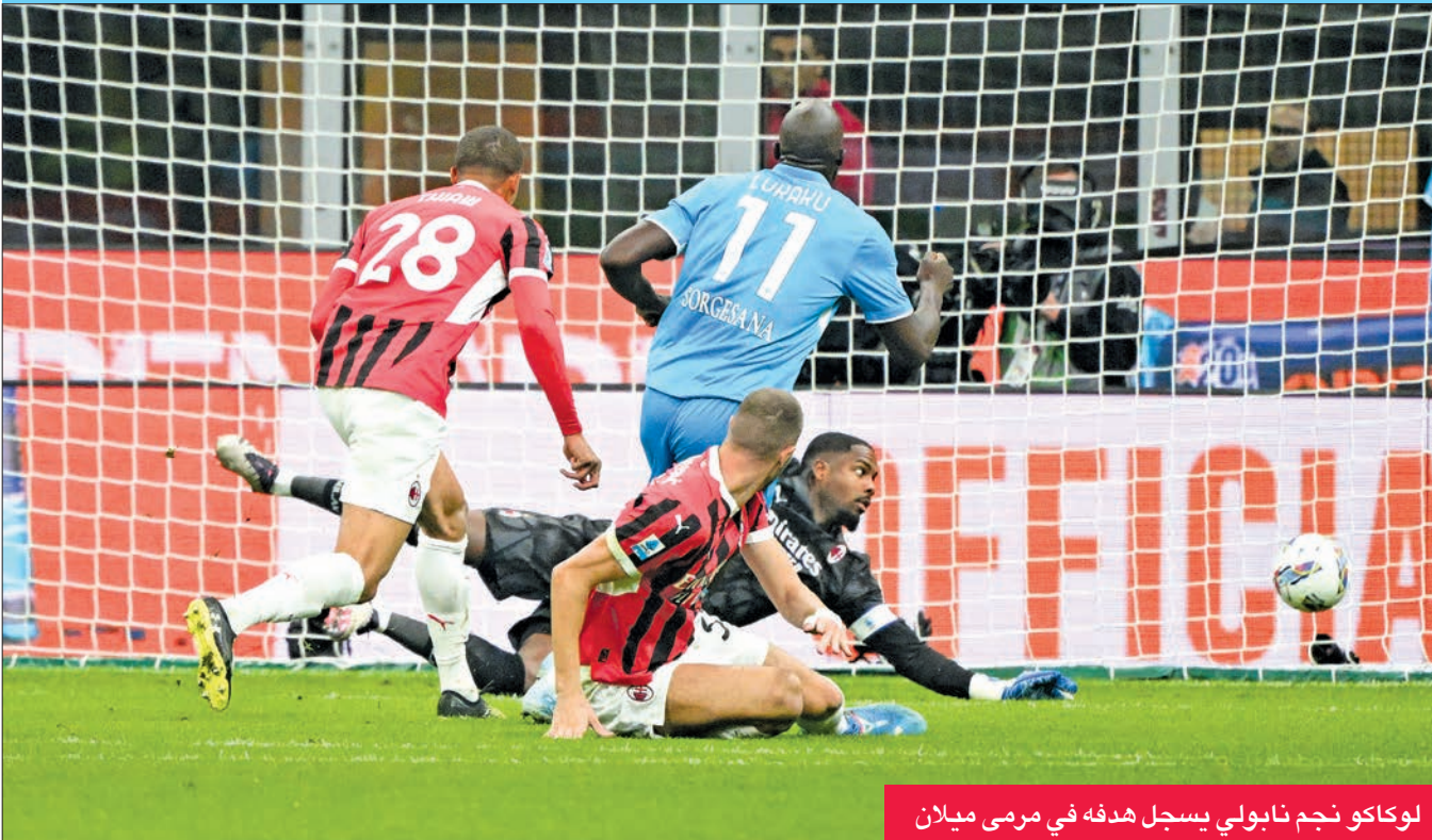
لوكاكو نجم نابولي يسجل هدفة في مرمرى ميلان

واصل نابولي تألقه بقيادة مدربه الجديد أنطونيو كونتي بتحقيقه انتصاره الخامس تاليا والسابع للموسم، على حساب مضيفه ميلان 2 - 0 في «سان سيرو»، أمس الأول الثلاثاء، في المرحلة العاشرة من الدوري الإيطالي لكرة القدم، وأثبت الفريق الجنوبي أن الغياب عن المشاركة القارية نتيجة ترتيبه المخيب الموسم الماضي صب في صالحه، رافعا رصيده إلى ثمانية انتصارات في 10 مباريات، ليتعد مؤقتا في الصدارة بفارق 7 نقاط عن إنتر (حامل اللقب) الذي يلعب الأربعاء في ضيافة إمبولي. ويدين نابولي لاعبه الجديد البلجيكي روميلو لوكاكو، الذي مهد طريق الفوز بافتتاحه التسجيل منذ الدقيقة الخامسة، ورفع رصيده إلى 4 أهداف في الدوري هذا الموسم، بعدما وصلته الكرة بتمريرة بينية من الكاميروني اندريه فرانك أنغيسا، فخطى المدافع الصربي ستراخينيا وروما في المراحل الثلاث المقبلة.