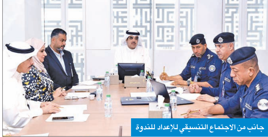
جانب من الاجتماع التنسيق للندوة