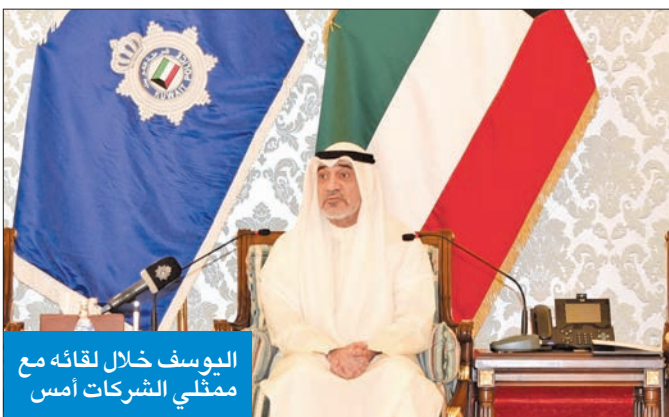
اليوسف خلال لقائه مع ممثلي الشركات أمس

وشدد النائب الأول على أنه سيتم التعامل بكل حزم واتخاذ الإجراءات القانونية بحق جميع الشركات التي تخالف قرار مجلس الوزراء «فلا أحد فوق القانون»، الذي سيطبق على الجميع بمسطرة واحدة.