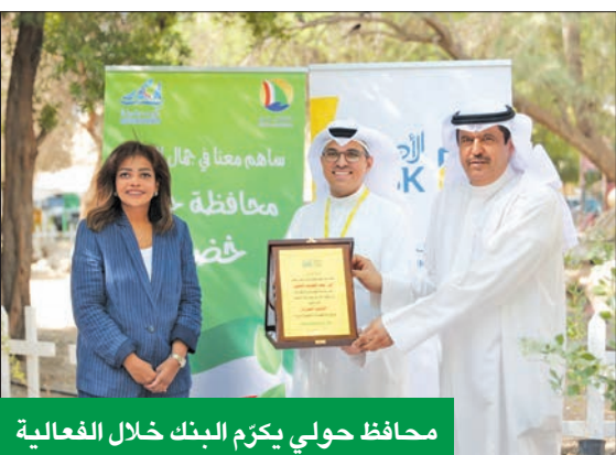
محافظ حولي يكرم البنك خلال الفعالية