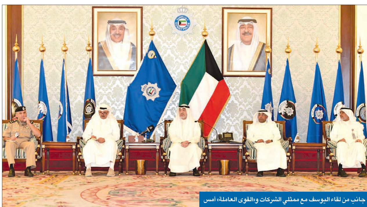
جانب من لقاء اليوسف مع ممثلي الشركات والقوى العاملة، أمس

بلهجة حازمة وعبارات قاطعة، أكد النائب الأول لرئيس مجلس الوزراء وزير الدفاع وزير الداخلية الشيخ فهد اليوسف أنه سيتم التعامل بكل حزم واتخاذ الإجراءات القانونية الفورية بحق الشركات التي تخالف قرار مجلس الوزراء بشأن دفع أجور عمالة الشركات بانتظام، معقبا بأنه «لا أحد فوق القانون»، وأنه «سيطبق على الجميع بمسطرة واحدة». وشدد النائب الأول، خلال لقائه ممثلي بعض الشركات أمس لمناقشة آلية تنفيذ قرار المجلس، على أنه لن يسمح أبداً بـ«الإضرار بسمعة الكويت»، خصوصا في مجال حقوق الإنسان لأن «سمعة الكويت فوق كل اعتبار»، مؤكداً أنه سيتابع أولاً بأول التزام الشركات بدفع أجور عمالها، حيث إن تأخير وتخاذل بعض الشركات في دفع أجور عمالها يدفعهم إلى الاعتصام أو الإضراب، مما يترتب عليه تعطيل العمل. ولفت إلى أنه ستكون هناك جولات تفتيشية مكثفة على جميع الشركات التي لديها عمالة للتأكد من تطبيقها قرار مجلس الوزراء، وتسلم هذه العمالة لرواتبها، مشدداً على أنه سيتم اتخاذ إجراءات قانونية فورية بحق الشركات المخالفة، في موازاة تقديم الحكومة للشركات جميع التسهيلات للإيفاء بمتطلباتها وفق النظم والقوانين المعمول بها.