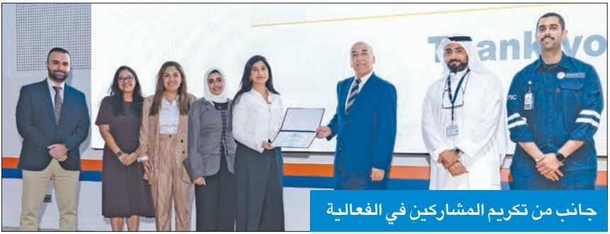
جانب من تكريم المشاركين في الفعالية

استضافت الجامعة الأسترالية، مبادرة قادة الغد، بالتعاون مع مجلس الشباب التابع لاتحاد الخليجي للبيوتروكيماويات والكيمياء (GPCA)، تعزيزاً للشراكة التي نشأت بين الطرفين وفق مذكرة التفاهم المشتركة بينهما.