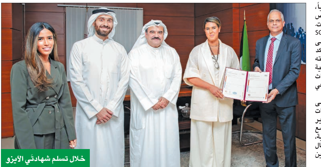
خلال تسلم شهادتي أيزو

تتعلقان بنظامي إدارة الجودة الشامل وإدارة الجودة في التعليم والتدريب