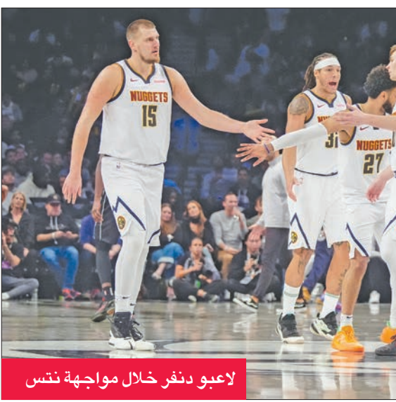
لاعب دنفر خلال مواجهة نتس

أنقذ العملاق الصربي نيكولا يوكيتش فريقه دنفر ناقساً من الخسارة، عندما خاض وقتاً إضافياً للمرة الثانية في يومين، وتغلب على مضيفه بروكلين نتس 144-139، في دوري كرة السلة الأميركي للمحترفين. وبعد فوزه على تورونتو رابنوزز بتمديد الوقت الإثنين الماضي، خاض دنفر وقتاً ممدداً على أرض بروكلين، حيث تالت يوكيتش صاحب 29 نقطة، و18 متابعه، و16 تمريرة حاسمة، محققاً «تريبيل دابل» (عشر أو أكثر في ثلاث فئات إحصائية). ونجح أفضل لاعب في الدوري ثلاث مرات (2021، 2022، 2024) وصاحب 40 نقطة في سلة تورونتو، بتسجيل رمية «هوك» قبل 9 ثوانٍ من نهاية الوقت، ليرسل المباراة إلى الشوط الإضافي. وأضاف أربع نقاط بعدها، ليمنح دنفر، حامل