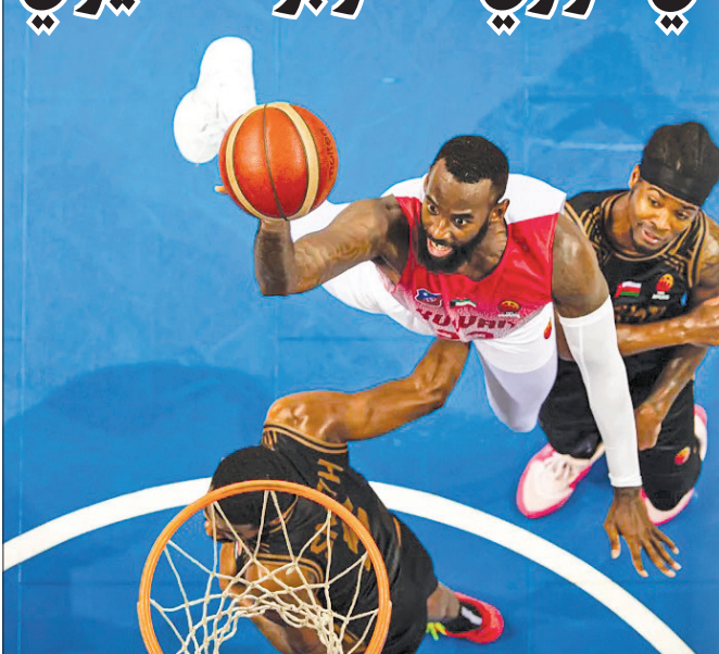
جانب من مباراة الكويت والبشائر العماني