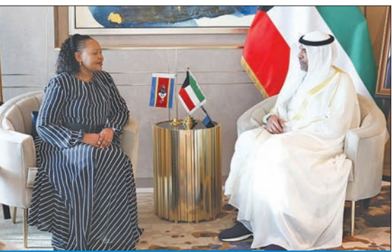
اليحيا مستقبلاً وزيرة الخارجية بمملكة إسواتيني أمس

شكأنقو، على هامش أعمال المؤتمر، وتم خلال اللقاء استعراض العلاقات الوثيقة التي تربط البلدين الصديقين وأطر تعزيزها وتنميتها في مختلف المجالات، ومناقشة المستجدات على الساحتين الإقليمية والدولية وعدد من الموضوعات محل الاهتمام المشترك. كما التقى اليحيا الأمين العام لمنظمة شانغهاي للتعاون، تشيانغ مينغ، وتم خلال اللقاء استعراض علاقات الشراكة الوثيقة التي تربط بين الكويت والمنظمة، إلى جانب مناقشة سبل تعزيز الجهود الدولية تجاه محاربة الإرهاب ومكافحة الجريمة وتجارة المخدرات ودعم الأمن والسلم الدوليين ومجالات التعاون الإقليمي والدولي في هذا الإطار.