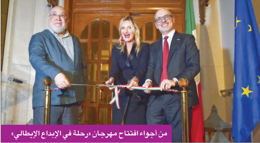
من أجواء افتتاح مهرجان «رحلة في الإبداع الإيطالي»

وأضاف أن «المعرض أيضاً يصور المزج بين تصميمات أفلام شركة أوروبا الإيطالية وأحبارهم وريشتي لتقديم صورة مميزة لفنون الخط العربي، لافتاً إلى أنه شارك بـ 26 لوحة فنية جميعها باستخدام الخط العربي ولكن