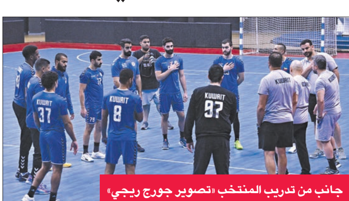
جانب من تدريب المنتخب

متنطق اليوم بطولة الكويت الدولية الأولى لكرة اليد التي يستضيفها الاتحاد الكويتي للعبة على صالة مجمع الشيخ سعد العبدالله الرياضي حتى 9 الجاري، بإقامة مباراتين أبرزهما في الساعة مساء بين منتخب الكويت المضيف، ومنتخب الرأس الأخضر، ويسبقها في الخامسة مساء مباراة منتخبى تونس والبحرين.