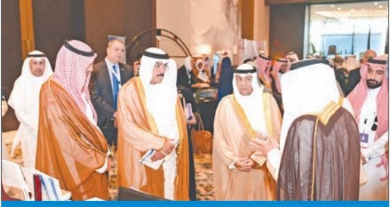
الطبيبائي خلال جولة على المعرض المصاحب للمؤتمر

أكد أهمية استكشاف الفرص والتحديات أمام تحويل التعليم بدول الخليج