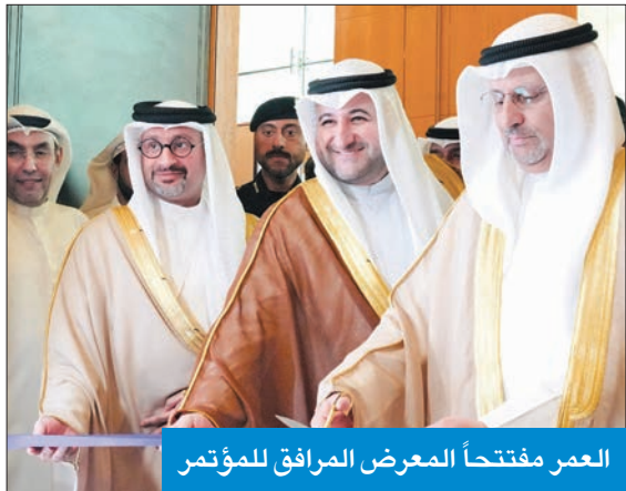
العمر مفتتحاً المعرض المرافق للمؤتمر