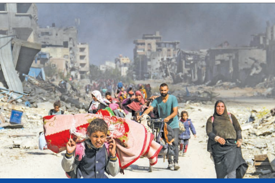
مدنيون غزيون يفرون من آلة القتل الإسرائيلية في غزة أمس

بارو، اليوم، إلى إسرائيل والأراضي الفلسطينية، بهدف الضغط على تل أبيب للمشاركة في الجهود الدبلوماسية لإنهاء الحرب في غزة ولبنان، بعد انتهاء التصويت في الانتخابات الرئاسية الأمريكية. وفي وقت سابق، ذكرت وزارة الخارجية الأمريكية، أن الوزير أنتوني بلينكن بحث هاتفياً مع نظيره المصري بدر عبد العاطي الوضع في الشرق الأوسط. وأوضحت أن وزير الخارجية الأميركي أكد لنظيره المصري أهمية إنهاء الحرب في غزة، وتأمين إطلاق سراح المحتجزين وزيادة واستدامة إحصال المساعدات الإنسانية للقطاع المنكوب. كما ناقش الجانبان الجهود الرامية لتعزيز الحل الدبلوماسي في لبنان.