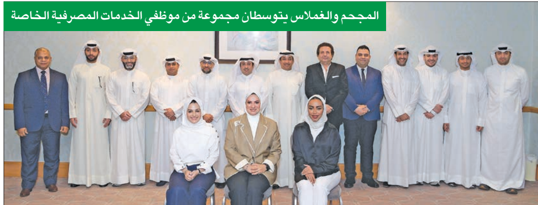
المجدد والغملاس يتوسطان مجموعة من موظفي الخدمات المصرفية الخاصة

لموظفي «الخدمات المصرفية الخاصة» بالتعاون مع «يوروموني» العالمية