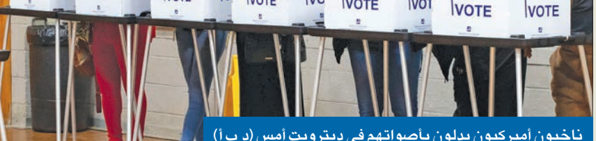
ناخبون أميركيون يدلون بأصواتهم في ديترويت أمس

● منافسة محمومة في الولايات المتأرجحة... وبنسلفانيا «صانعة الملوك» ● فرز الأصوات قد يحتاج أياماً... ومخاوف من «سراب التصويت»