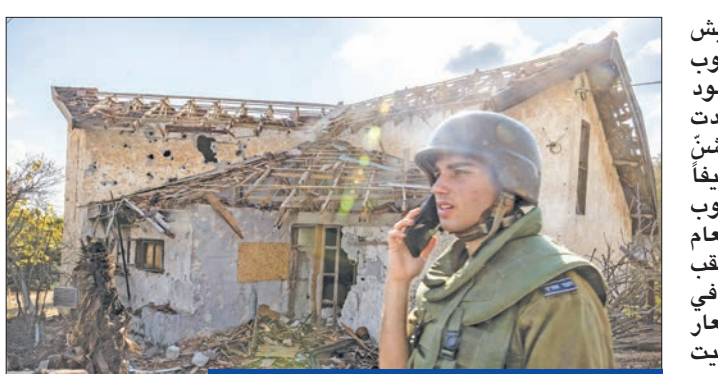
جندي إسرائيلي أمام منزل تضرر بصواريخ «حزب الله» في متولا قرب الحدود مع لبنان أمس (أ ف ب)

مع لبنان، وفق ما أورد الإعلام الرسمي، في ثاني استهداف للبلدة في أقل من أسبوع. وأفادت وكالة الأنباء الرسمية (سانا) «عن عدوان إسرائيلي» استهدف المنطقة الصناعية في القصير وبعض الأبنية السكنية المحيطة بها. وكانت ثلاث غارات إسرائيلية على البلدة أسفرت نهاية الشهر الماضي عن مقتل «سبعة مدنيين وثلاثة مقاتلين سوريين يعملون لمصلحة حزب الله»، وفق المرصد السوري لحقوق الإنسان. وكان حزب الله هاجم بلدة القصير وسيطر عليها بعد أن طرد مقاتلي المعارضة السورية منها في بداية تدخله في الحرب الأهلية السورية التي اندلعت في العام 2011. وقال وزير الدفاع الإسرائيلي يوفاف غالانت، إن إسرائيل لا يمكنها أن تقبل بوجود عسكري إيراني في سورية، مضيفاً في تصريحات لصحيفة «فايننشال تايمز» البريطانية: «نحن بحاجة إلى وقف نقل الأسلحة من إيران عبر سورية والعراق إلى لبنان».