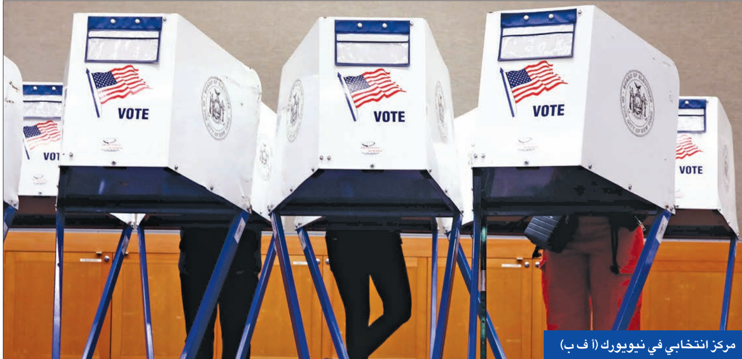
مركز انتخابي في نيويورك