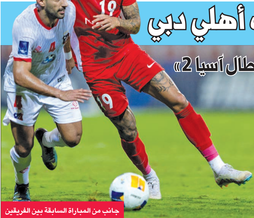
جانب من المباراة السابقة بين الفريقين

غاب الكثير من اللاعبين في رياضات مختلفة، لكن اللافت جداً كان غياب لاعبي كرة القدم عن التقدم للترشح وحتى المشاركة في الجولة في الانتخاب، رغم أنهم الأكثر حاجة للتتمثيل في مثل هذه اللجان أو الهيئات، باعتبارها اللعبة الشعبية الأولى والأكثر أيضاً حاجة إلى حلول للمشاكل والأزمات التي يواجهونها، وهو ما يؤكد أن غياب الوعي الذي كان منوطاً باللجنة الأولمبية نشره هذه اللجنة ودورها... لكن يبدو أن «الربع في حولي ما يعرفون غير التصريحات والتصوير».