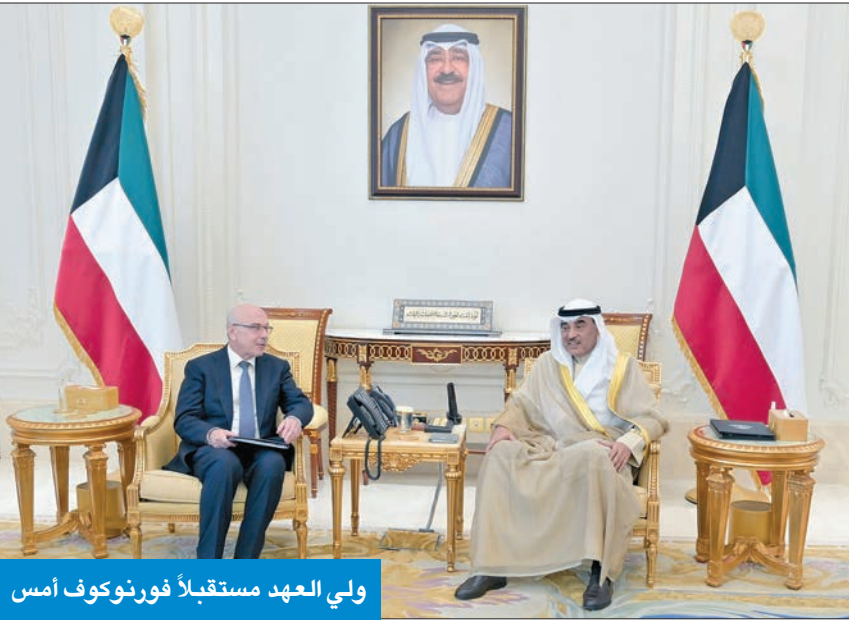
ولي العهد مستقبلاً فورنوكونف وأحمد النواف

استقبل سمو ولي العهد الشيخ صباح خالد، بقصر بيان صباح أمس، وكيل الأمين العام لمكتب الأمم المتحدة لمكافحة الإرهاب، فلايمير فورنوكونف، والوفد المرافق، وذلك بمناسبة انعقاد المؤتمر رفيع المستوى الرابع حول تعزيز التعاون الدولي في مكافحة الإرهاب وبناء آليات مرنة لأمن الحدود - مرحلة الكويت من عملية دوشانبه، بالكويت. حضر اللقاء وزير الخارجية عبدالله الجحيا وكبار المسؤولين بديوان سمو ولي العهد ووزارة الخارجية. كما استقبل سموه، سمو الشيخ أحمد نواف الأحمد.