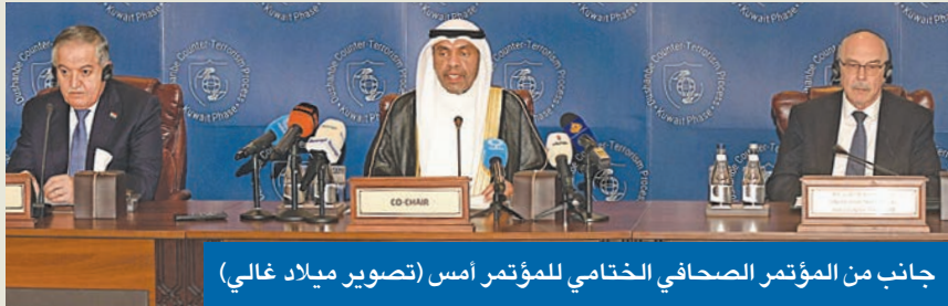
جانب من المؤتمر الصحافي الختامي للمؤتمر أمس

● مهر الدين: مواصلة جهود مكافحة وتعزيز الأمن والاستقرار مع الشركاء ● فورونكوف: صعوبة في التوافق على مسمى الإرهاب وهناك مفاوضات لتعريف محدد