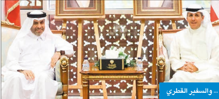
... والسفير القطري

بحث مع النياي وأل محمود والسفير الإسباني سبل التعاون قضائياً وقانونياً