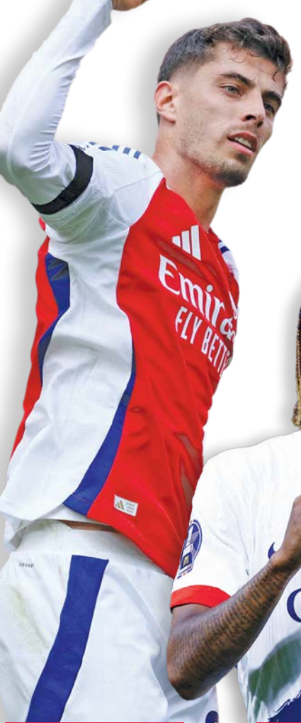
هافيرتس نجم أرسنال باركولا نجم باريس

موصلة سجله المثالي وتحقيق فوزه الرابع توالياً عندما يحل ضيفاً على كلوب بروج البلجيكي، فيما يحل برشلونة على النجم الأحمر بعد خضه ست نقاط من ثلاث مباريات.