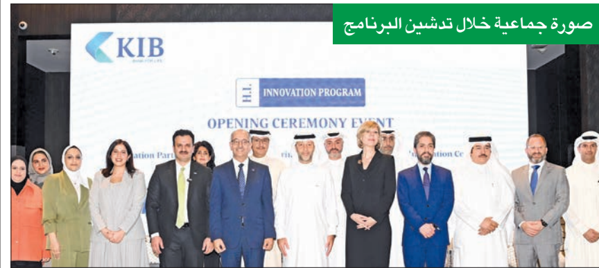
صورة جماعية خلال تدشين البرنامج

المبادرة جزءاً من التزامنا المستمر برعاية المواهب الشابة وتعزيز ثقافة الابتكار داخل المجتمع. ومن خلال الشراكة مع مؤسسات مرموقة مثل فيزا وSIA Partners، فإننا نتيح للطلبة فرصة حقيقية لدخول عالم الأعمال وإحداث أثر ملموس».