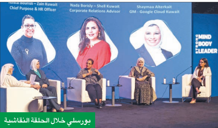
بورسلي خلال الحلقة النقاشية

الدور الذي تلعبه مثل هذه المنتديات الأكاديمية والثقافية في تعزيز بيئة الإبداع في المجتمع، وتحفيز التطور المستمر لدى أفرادها، والمساهمة في إعداد القادة، ولهذا فقد حرصت الشركة على أن تكون أول الداعمين لهذا المؤتمر منذ نسخته الأولى. يذكر أن المعهد الوطني للقادة (NLI) هو أحد المراكز المملوكة للشركة الوطنية للخدمات التعليمية والتدريب (NEST) التابعة للشركة الوطنية لمشاريع التكنولوجيا، وتم إطلاق أول سلسلة لمؤتمرات المعهد في عام 2021 لعرض الحلول التدريبية على المؤسسات الكويتية، بحضور الآلاف من المشاركين في نسخته السابقة.