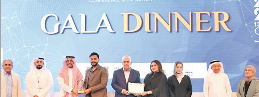
لقطة من المؤتمر

حققت الجامعة الأسترالية حضوراً بارزاً في المؤتمر والمعرض الدولي السابع للصيانة والاعتمادية وإدارة الموارد «Maintcon 2024»، والذي أقيم في معرض البحرين العالمي للمعارض تحت عنوان «بناء المرونة في الموارد لمستقبل مستدام»، إذ نما المؤتمر بشكل كبير ليصبح أكبر تجمع عالمي للمختصين في مجال الصيانة والاعتمادية وإدارة الموارد.