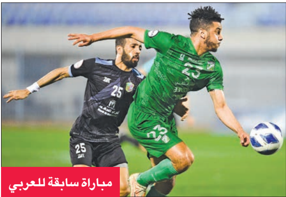
مباراة سابقة للعربي