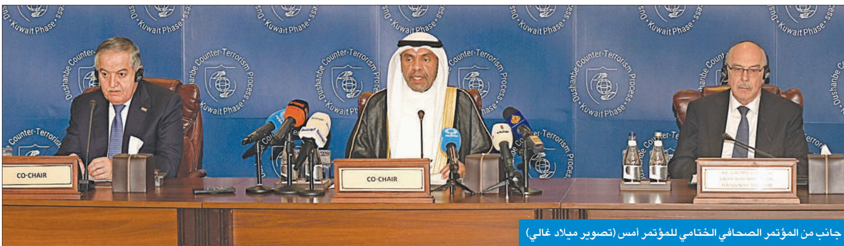
جانب من المؤتمر الصحافي الختامي للمؤتمر أمس

● أكد عقب مؤتمر «تعزيز التعاون الدولي» دعم المساعي الأممية والإقليمية لمواجهة التطرف ● مهر الدين: مواصلة جهود مجابهة الإرهاب وتعزيز الأمن والاستقرار مع الشركاء