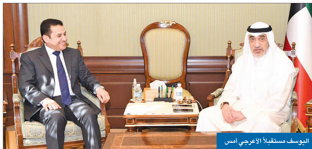
اليوسف مستقبلاً الأعرجي أمس

وفي نهاية اللقاء، وجّه الأعرجي الشكر إلى يوسف على الجهود المبذولة لتعزيز التعاون الأمني بين البلدين. من جانبه، التقى وزير الخارجية عدنان الحجيلي، أمس، الأعرجي، على هامش أعمال المؤتمر رفيع المستوى الرابع حول «تعزيز التعاون الدولي في مكافحة الإرهاب وبناء البنية التحتية للحدود»، الذي استضافته الكويت على مدى اليومين الماضيين. واستعرض الجانبان خلال اللقاء العلاقات الوثيقة التي تربط البلدين الشقيقين، بما في ذلك الجهود المشتركة في مكافحة الإرهاب وتبعاته، إلى جانب مناقشة عدد من الموضوعات والملفات محل الاهتمام المشترك.