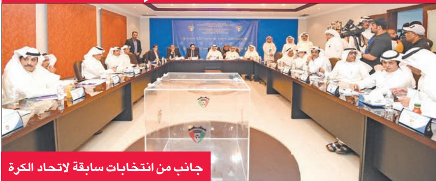
جانب من انتخابات سابقة لاتحاد الكرة

التي تقدّم بها مجلس الإدارة السابق، على خلفية فشل التنظيم لمباراة الكويت والعراق، التي أقيمت في العاشر من سبتمبر الماضي بالجولة الثانية من منافسات المجموعة الثانية، لتصفيات مونديال 2026.