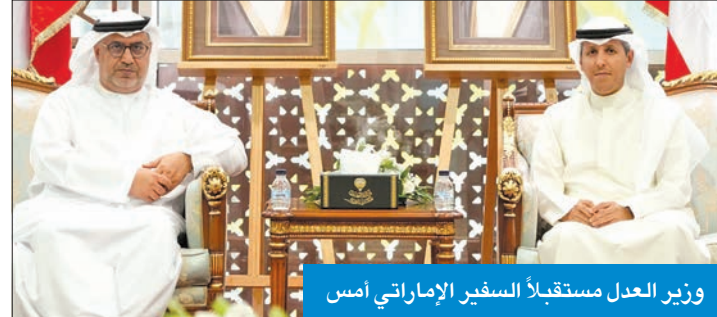
وزير العدل مستقبلاً السفير الإماراتي أمس

سبل تطوير وتعزيز التعاون القضائي والقانوني بين الجانبين.