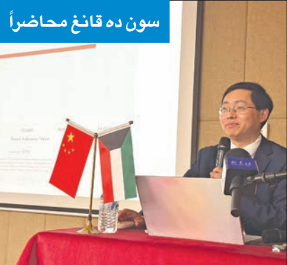
سون ده قانغ محاضراً

أشاد مدير مركز دراسات الشرق الأوسط في جامعة فودان الصينية في شنغهاي البروفيسور سون ده قانغ بالعلاقات الصينية - الكويتية، وثنم جهودها في تحقيق المصالحة والسلام بالمنطقة، ووصف الكويت بـ«القاطرة الأساسية لمشاركة الصين في تحقيق التحول الاقتصادي المستقبلي البناء لدول الخليج»، مؤكداً أن «الكويت صديقة للجميع، وسياستها الخارجية تدعم السلام والاستقرار الإقليمي».