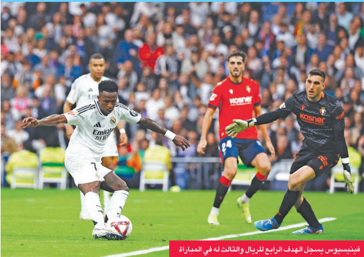
فينيسيوس يسجل الهدف الرابع للريال والثالث له في المباراة

المركز الحادي عشر، لكنه يأمل البناء على فوزه الأخير على إشبيلية خارج أرضه 2 - 0 للاقترب أكثر من المركز الأمامية، بحيث يتخلف 4 نقاط عن المركز السادس. من ناحية أخرى، يسعى أتلتيكو مدريد إلى الاستمرار في تسلسل الترتيب، مستفيداً من تعثر جاره المرديدي، وسيوواجه ريال مايوركا.