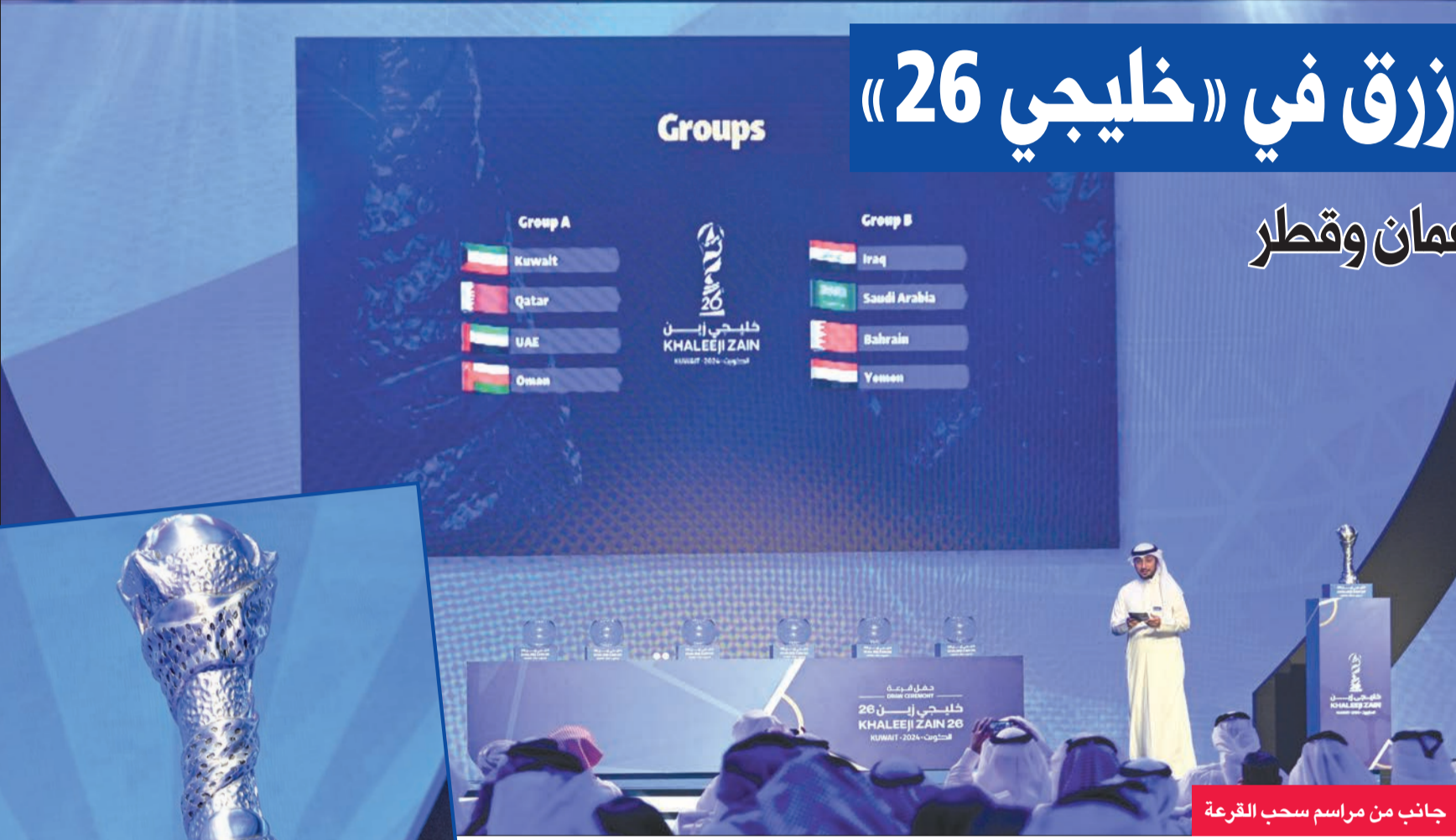
جانبا من مراسم سحب القرعة

وذكر أن سبعة منتخبات تنافس على البطولة الخليجية منذ سنوات باستثناء اليمن، لأن المستويات متقاربة من جانبه، قال الأمين العام لاتحاد كأس الخليج العربي لكرة القدم جاسم المريخي، إنه يمتنى أن تكون المنتخبات جاهزة للبطولة، مشيداً بجهود وزارة «الشباب» التي ستعظم بطولة متميزة.