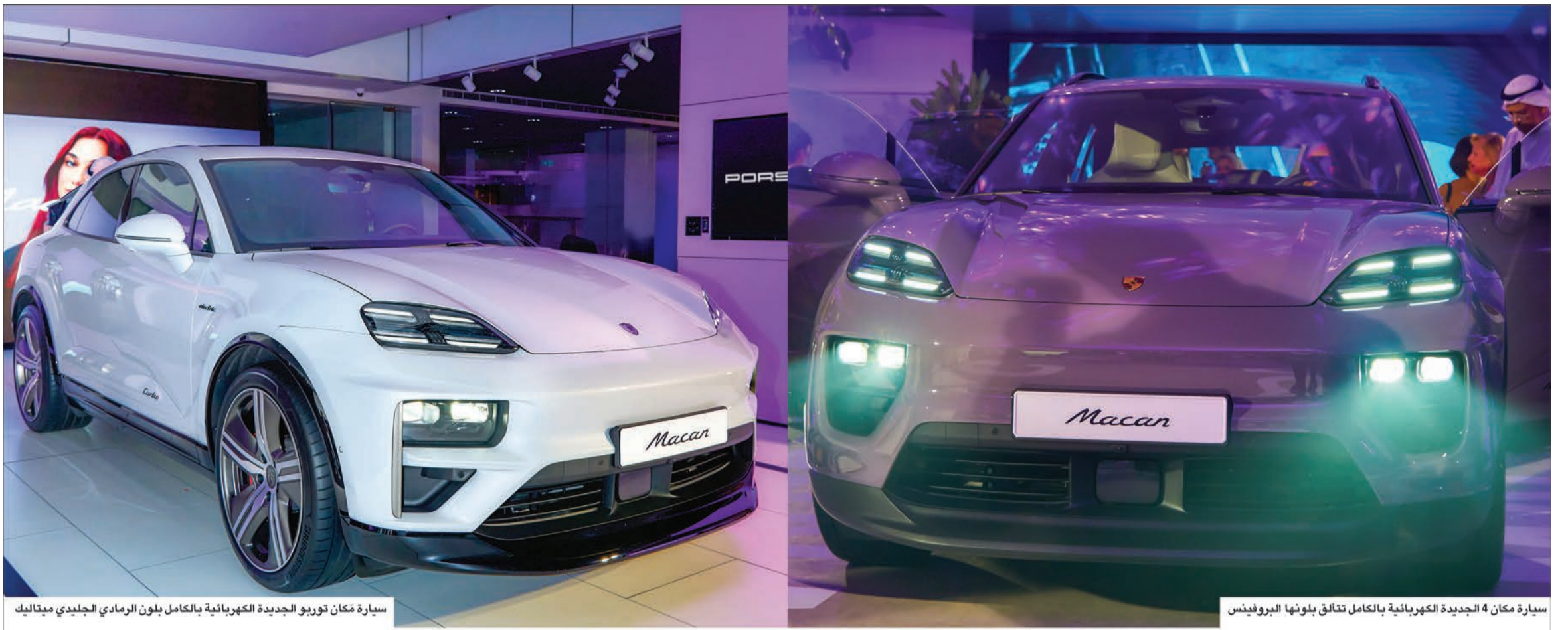
سيارة مكان توربو الجديدة الكهربائية بالكامل بلون الرمادي الجليدي ميتاليك