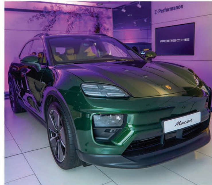
سيارة مكان الجديدة الكهربائية بالكامل بلون الأخضر سندان ميتاليك نيو