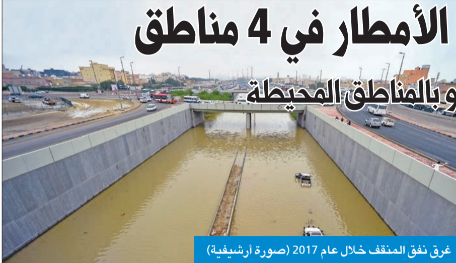
غرق نفق المنفق خلال عام 2017 (صورة أرشيفية)

وبينت أن المشروع الآخر هو مشروع إنشاء وإنجاز وصيانة خزانات لصرف مياه الأمطار لتحسين الشبكة القائمة في مناطق متفرقة من الكويت. ولفتت إلى أن المشروع يهدف إلى توفير مستوى جيد من الخدمات للمواطنين بالمناطق