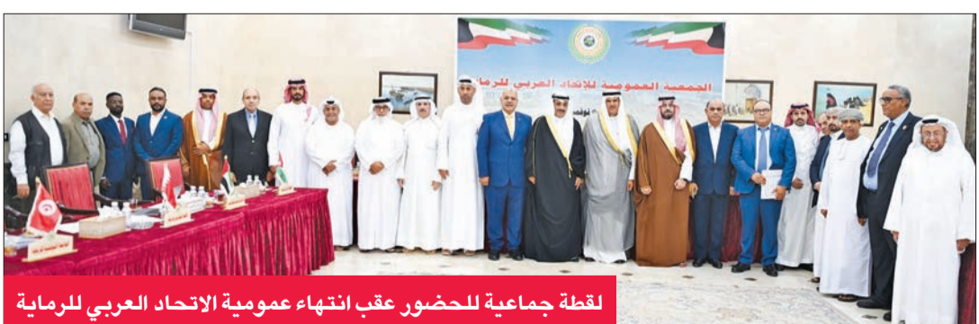
لقطة جماعية للحضور عقب انتهائهم عمومية الاتحاد العربي للرمية

بمجمع ميادين الشيخ صباح الأحمد الأولمبي، بحضور رؤساء وممثلين للاتحادات الأهلية.