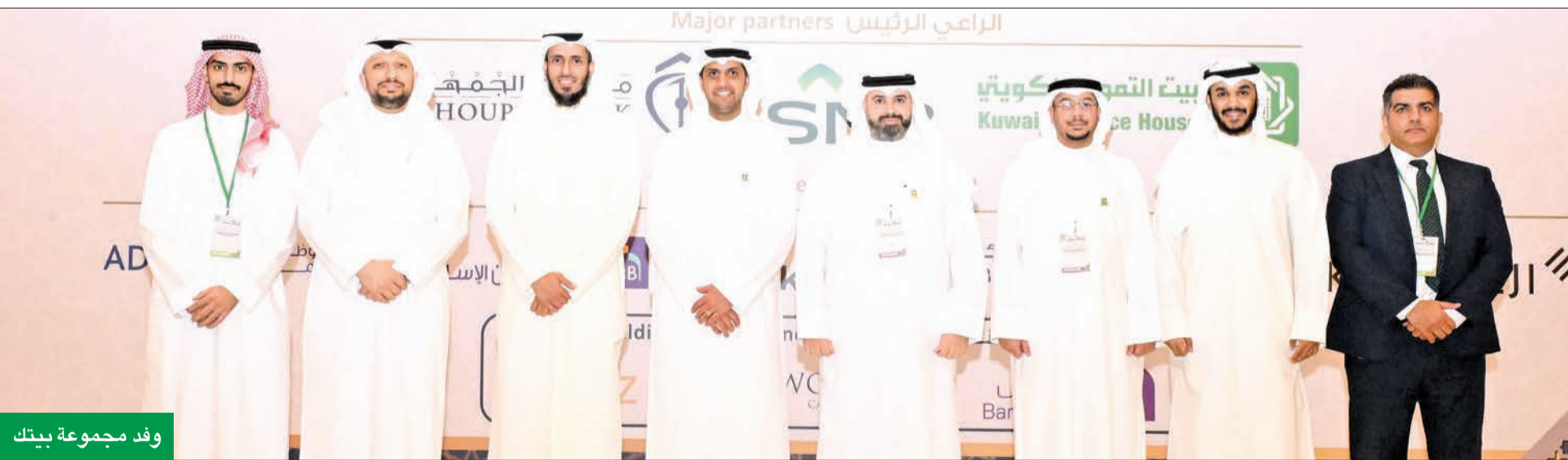
وفد مجموعة بيتك

ويبحث المؤتمر خلال 7 جلسات نقاشية مع المشايخ العلماء والقادة والخبراء في الصناعة المالية الإسلامية وكبار مسؤولي البنوك المركزية والسلطات الرقابية والإشرافية، كيفية تعزيز إمكانيات المالية الإسلامية لبناء منظومة حلال مستدامة، مع التركيز على موضوعات مثل: الانتقال من المالية الحلال إلى الاقتصاد الحلال، وتحسين سلاسل التوريد، ومعالجة قضايا