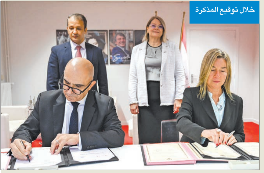
خلال توقيع المذكرة

كويستين لـ الجريدة: فرصة للعمل معاً لمواجهة التحديات العالمية