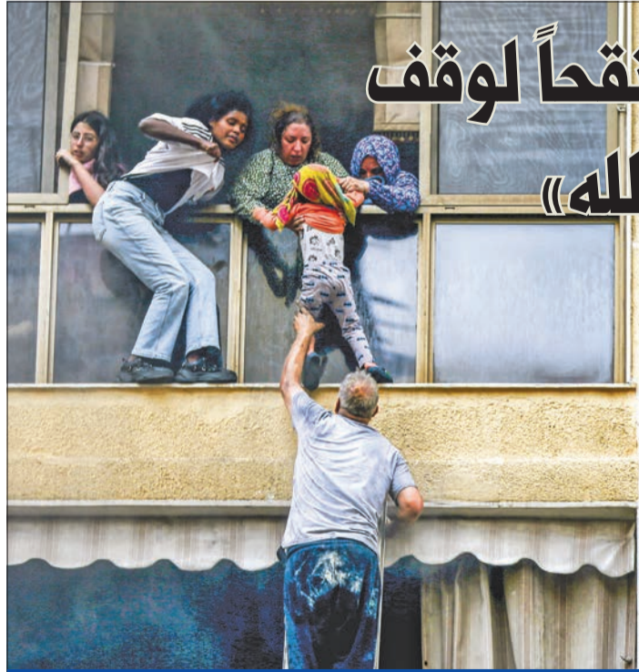
لبنانيون يفرون من حريق تسبب به مولد كهربائي بـ«الحمراء» في بيروت أمس

النواب نبقيه بري، مع إعادة صياغته بوضوح، وتقول المصادر: «ما يعمل عليه هوكشتاين يراعي الهواجس اللبنانية والخطوط الحمر، ويتناسب مع الليونة التي يمكن لرئيس الوزراء الإسرائيلي بنيامين نتنياهو أن يبديها». وتضيف المصادر المتابعة أن المبعوث الأميركي يتحدث بوضوح عن إمكانية التوصل إلى وقف إطلاق النار خلال فترة تمتد ما بين أسبوع وعشرة أيام أو أسبوعين، على أن يكون وفقاً دائماً لإطلاق النار. إذ على الرغم مما حكي سابقاً عن وقف لإطلاق النار لمدة سنتين يوماً، فإن النقاش حالياً يتركز حول وقف النار نهائياً مع وضع برنامج واضح للخطوات التي يجب اتخاذها، حول تطبيق القرار 1701 مع ضمانات أميركية في حسن تطبيقه، ومن أبرز النقاط التي يركز عليها الاتفاق: وقف إطلاق العمليات العسكرية بين الجانبين، ودخول الجيش اللبناني إلى الجنوب، وانسحاب الجيش الإسرائيلي من المناطق التي دخل إليها، وانسحاب حزب الله بأسلحته من جنوب نهر اللطاني، وتعزيز عمل قوات اليونيفيل، وتكون الولايات المتحدة الأميركية الجهة الضامنة لوقف النار ولائية تطبيق القرار 1701 من خلال مراقبة تطبيق مندرجات