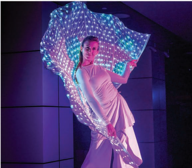
جزء من فعاليات الحدث، عرض الضوء المدهش الذي أضاف لمسة سحرية إلى الأجواء