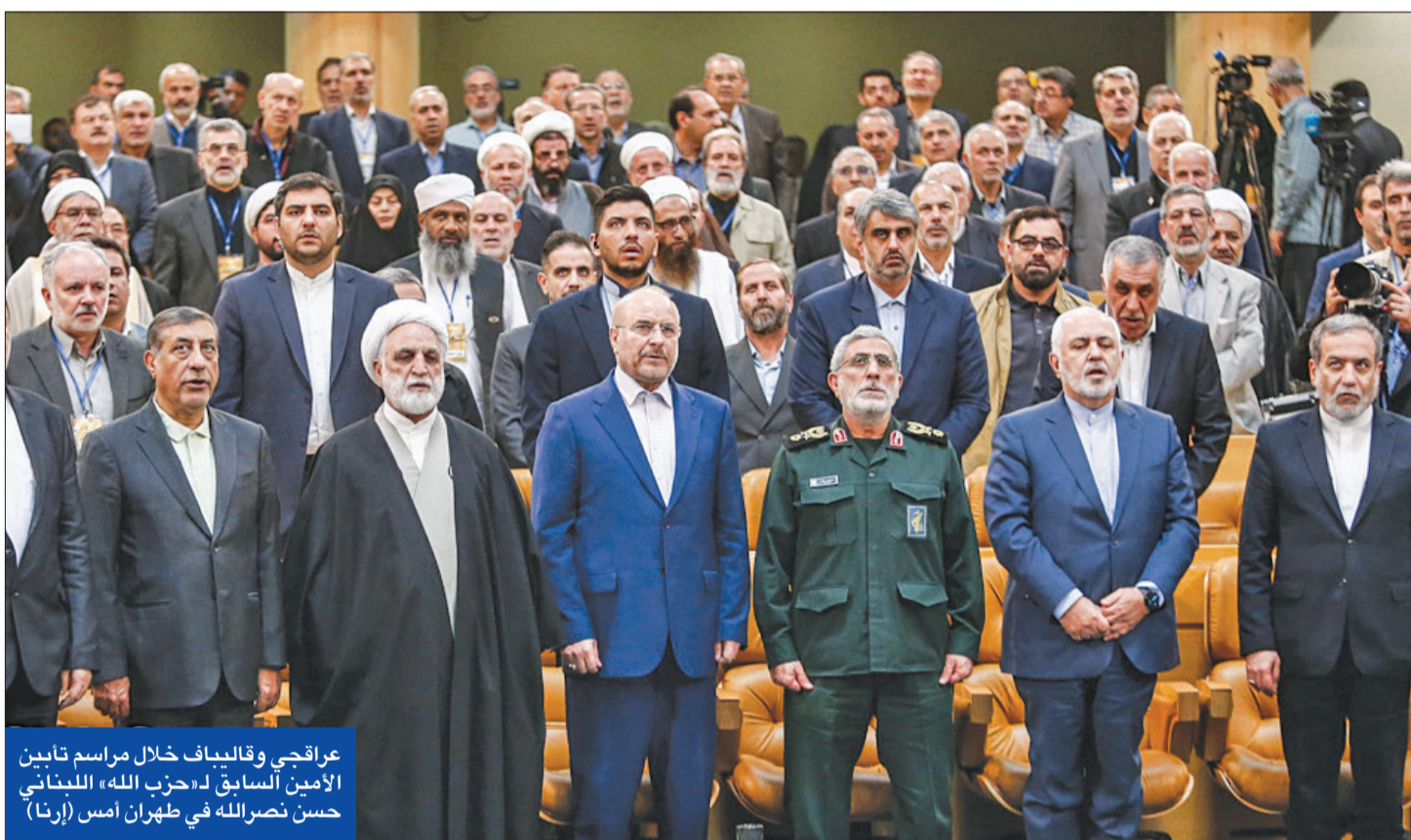
عراقي وقائيف خلال مراسم تابين الأمين السابق لـ «حزب الله» اللبناني حسن نصرالله في طهران أمس (إرنا)

بزشكيان يطلب من خامنئي تأجيل الانتقام... واجتماع حاسم لـ «الأعلى للأمن القومي» لاتخاذ قرار