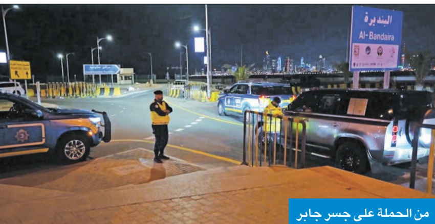
من الحملة على جسر جابر

نفذت وزارة الداخلية، بتعليمات مباشرة من رئيس مجلس الوزراء بالإنابة وزير الداخلية وزير الدفاع، الشيخ فهد اليوسف، حملتين أمنيتين خلال عطلة نهاية الأسبوع الماضي في منطقتي ميدان حولي وجسر الشيخ جابر بالاتجاهين، بمشاركة القطاعات الأمنية الميدانية وقطاع المرور والعمليات. وفي تفاصيل الحملة الأولى التي استهدفت منطقة ميدان حولي، قال مصدر أمسي لـ «الجريدة» إنها أسفرت عن تحرير 1141 مخالفة مرورية، وإحالة 24 مركبة ودراجة إلى كراج حجز الإدارة العامة للمرور، إلى جانب ضبط 8 مركبات ودراجات ناربية تبين أنها مطلوبة على ذمة قضايا أمنية وقضائية. وأضاف المصدر أن نقاط التفتيش تمكنت من ضبط