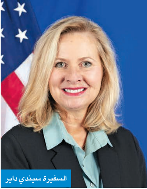
السفيرة سيندي دايـر

« جهود فهد اليوسف الحثيثة لمواجهة الظاهرة تستحق الثناء والتقدير »