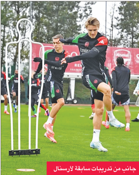
جانب من تدريبات سابقة لأرسنال

أعرب بيني زاهافي، وكيل اللاعب جوناثان تاه، عن اعتقاده بأن المدافع سيرحل عن فريق باير ليفركوزن الألماني لكرة القدم، بنهاية الموسم الجاري. وقال زاهافي، لصحيفة «بيلد ام سونتاج» «بايرن لديه فرصة جيدة للغاية لضمه مرة أخرى»، مضيفاً: «لسوء الحظ أراد ليفركوزن المزيد من الأموال». وكان المدافع الدولي الألماني قريباً من الانتقال لبايرن، حامل الرقم القياسي من حيث عدد مرات التوقيع بالودوري