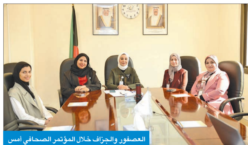
العصفور والجرف خلال المؤتمر الصحفي أمس

العديد من بلدان إقليم الشرق الأوسط يتراوح بين 9 و15 بالمئة من إجمالي الطاقة، مما يزيد من خطر الإصابة بالسمنة وأمراض القلب وارتفاع ضغط الدم وداء السكري من النوع الثاني، إضافة إلى تسوس الأسنان الذي يعد من أكثر المشاكل الصحية شيوعاً بين الأطفال.