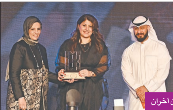
... وتكريمان آخران

المهرجان خطوة عظيمة في طريق دعم صناعة السينما بالكويت أريج الغانم