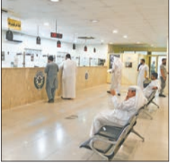
التوسع في استحداث مسميات وظيفية جديدة ضرورة ملحة