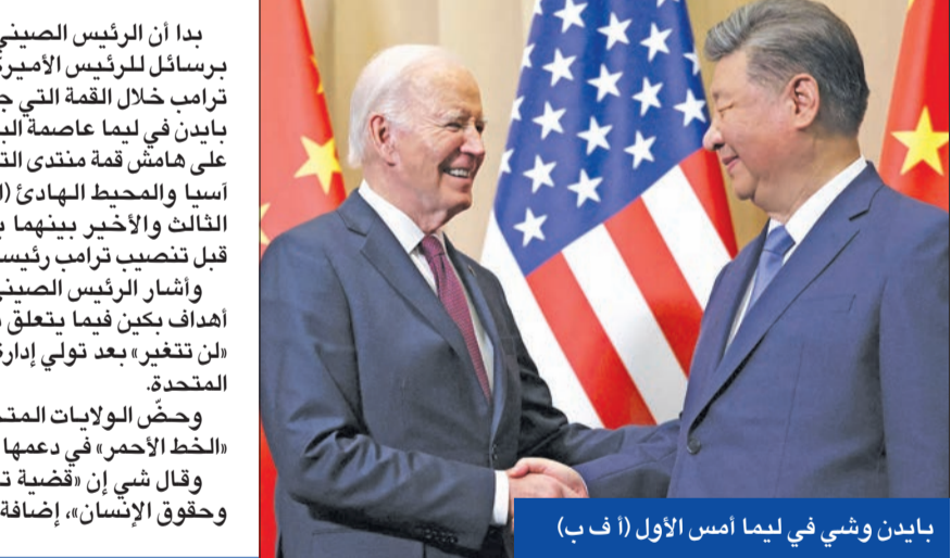
بايدن وشي في ليمّا أمس الأول

وسحبت الأرجنتين وفدها من مفاوضات المناخ كوب 29 في باكو، وتسري تهكّات بشأن انسحابها المحتمل من اتفاقية باريس للمناخ، وهي خطوة أقدم عليها ترامب نفسه خلال فترة ولايته الأولى في منصبه. إلى ذلك، وجّه الرئيس البرازيلي اليساري لويس إيناسيو لولا دا سيلفا، أمس الأول، انتقادات لاذعة ضد «النيوليبرالية»، وذلك قبل يومين من استضافة بلاده قمة لمجموعة العشرين ترمي إلى تعزيز التعاون الاقتصادي. ويستقبل لولا اليوم قادة بينهم الرئيس الأميركي بايدن وماكرون،