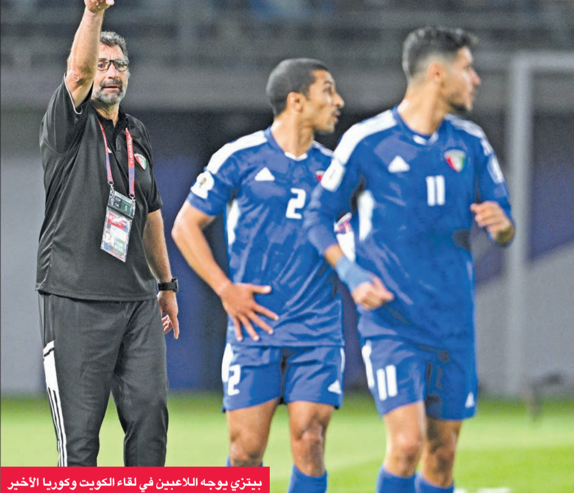
بيتزي يوجه اللاعبين في لقاء الكويت وكوريا الأخير

شكل لافت للنظر، وقيادة أكثر من هجمة على مرعى المنافس.