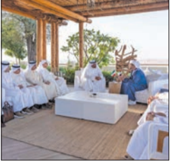
الأمير يوجه الدعوة إلى بن زايد وسلطان عمان لحضور القمة الخليجية