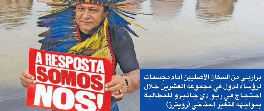
برازيلي من السكان الأصليين أمام مجسمات لرؤساء دول في مجموعة العشرين خلال احتجاج في ريو دي جانيرو للمطالبة بمواجهة التغير المناخي

خلال القمة بينها فرض ضريبة على أصحاب الثروات في العالم، وتشريعات ضد المعلومات المضللة وخطاب الكراهية حين تسعى «قوى اليمين المتطرف»، إلى تقويض الديموقراطية.