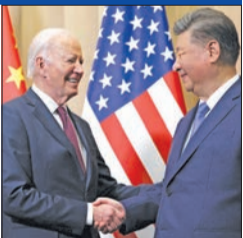
شني يرسم في قمته مع بايدن خطوطاً حمراء لتزامب