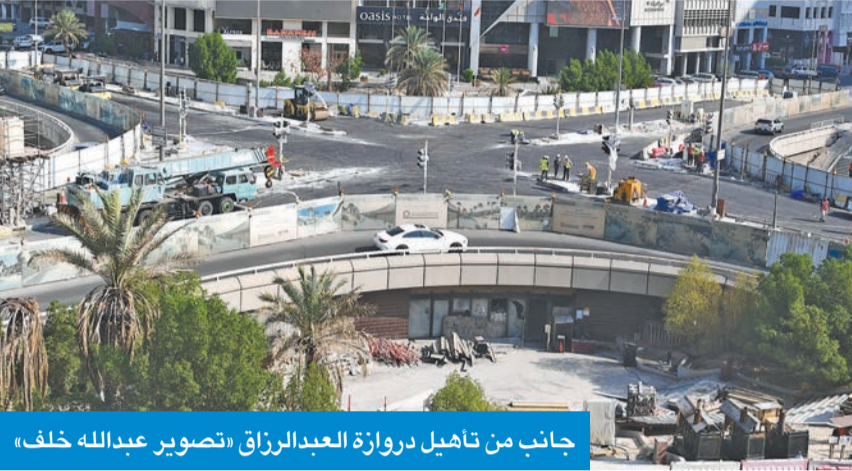
جانب من تاهيل دروازة العبدالرزاق

الموقع يعود للحياة بعد إغلاق دام أكثر من 4 سنوات