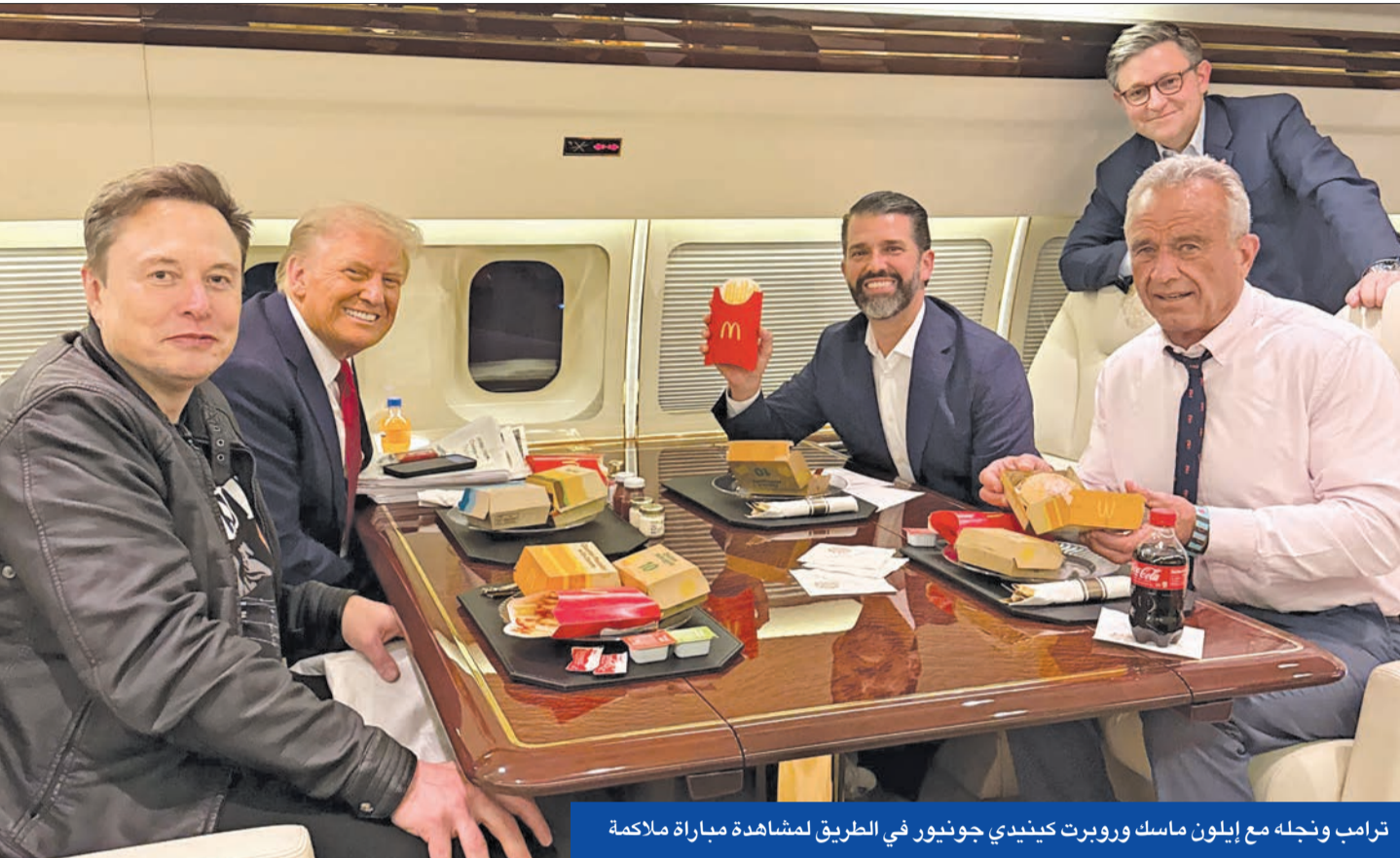
ترامب ونجله مع إيلون ماسك وروبرت كينيدي جونيور في الطريق لمشاهدة مباراة ملاكمة

لا تعدو الترشيحات المثيرة للجدل التي أعلنها الرئيس الأميركي المنتخب، دونالد ترامب، إلا أن تكون «رأس جيل الجليد»، الذي يخفي خطة لإعادة هيكلة النظام الأميركي عبر تقليص حجم الحكومة وتهدم الكونغرس، و«تطهير» البيتاعون وتركيز السلطة في البيت الأبيض.