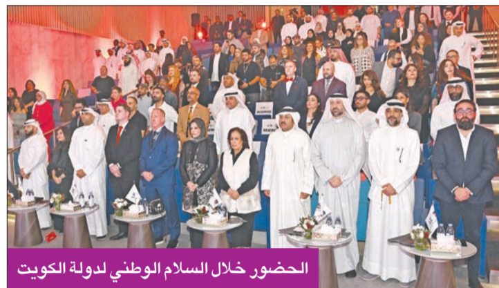
الحضور خلال السلام الوطني لدولة الكويت

«زين» مستمرة في دعم المهرجان إنتاج الأفلام حمد المصبيح