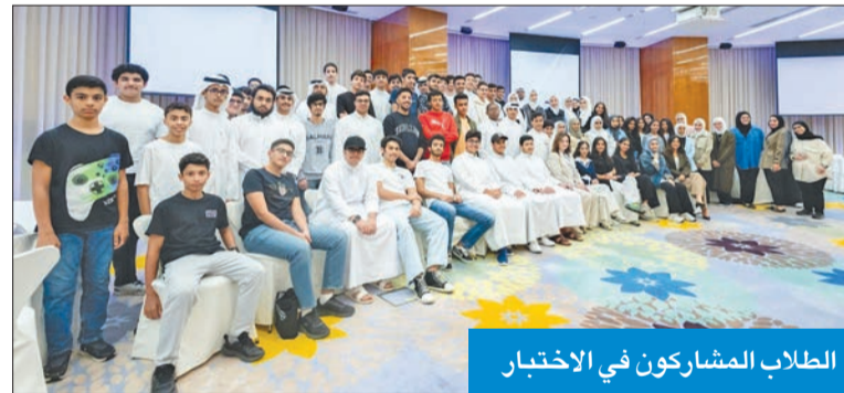
الطلاب المشاركون في الاختبار

بهدف اجتياز المقابلات الشخصية والتأهل للمشاركة في الهاكاثون المزمع عقده في فبراير 2025.