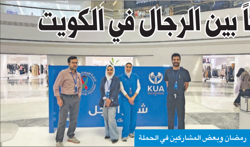
رمضان وبعض المشاركين في الحملة

رابطة الأورام أطلقت حملة توعية في مول العاصمة بشعار «شهر الرجل فحصك وقاية»