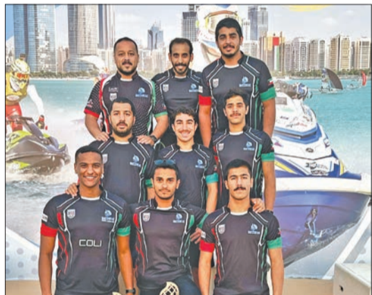
فريق الكويت للدراجات المائية عقب التنويع

نادي الرياضات البحرية في دعم وتطوير هذه الرياضة.