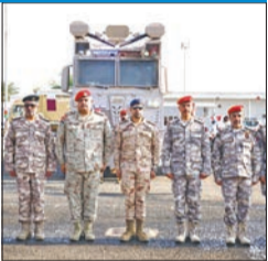
صباح الجابر: الشرطة العسكرية قدوة في الانضباط والالتزام