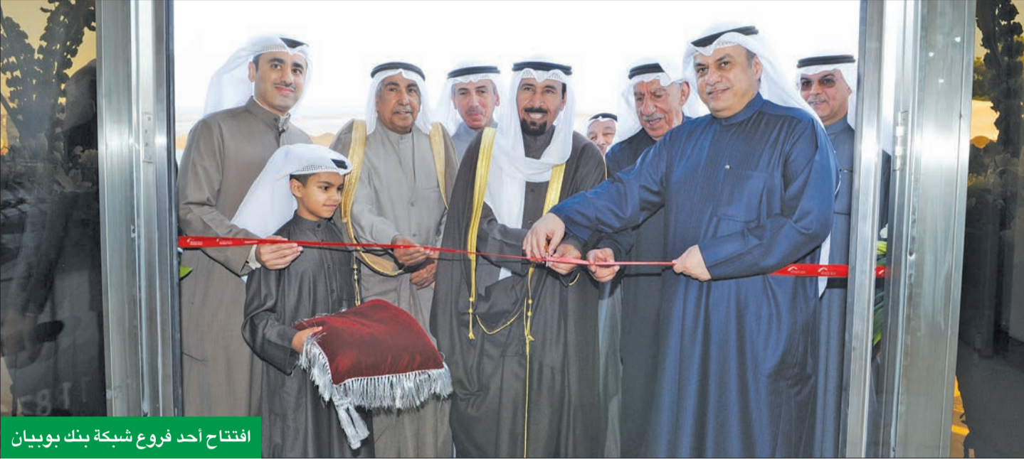
افتتاح أحد فروع شبكة بنك بوبيان

البنك عزز وجوده الدولي بالاستحواذ على «لندن والشرق الأوسط» والتوسع بقاعدة العملاء والتركيز على إدارة الثروات