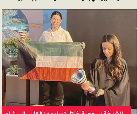
الشيخة د. حصة خلال تسليمها الكأس إلى شاه

حققت لاعبة منتخب الكويت للشراع المتألقة أمينة شاه كأس المركز الثاني في النسخة الأولى من البطولة العربية للشراع للبنات، التي نظمتها الاتحاد البحريني للرياضات البحرية، برعاية الشيخة د. حصة بنت خالد آل خليفة، عضوة مجلس إدارة اللجنة الأولمبية رئيسة لجنة تكافؤ الفرص بين الجنسين في المجال الرياضي، وبمتابعة وإشراف وحضور الشيخ خليفة بن عبدالله آل خليفة، رئيس الاتحاد البحريني للرياضات البحرية ورئيس الاتحاد العربي للشراع.