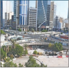
«الأشغال» تستعد لافتتاح دروازة العبد الرزاق