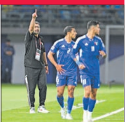
الأزرق يختم تدريباته اليوم استعداداً للقاء الأردن المرتقب