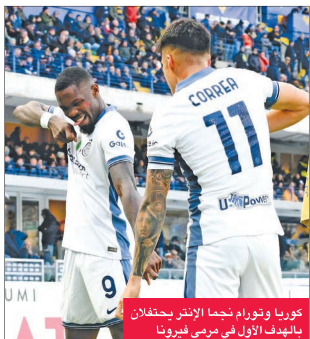
كوربا وتورام نجما الإنتر يحتفلان بالهدف الأول في مرمى فيرونا

حقق فريق إنتر ميلان فوزا كاسحا على مضيفه فيرونا «5- صفر» أمس، في المرحلة الثالثة عشرة من الدوري الإيطالي لكرة القدم. وحسم إنتر ميلان الفوز في الشوط الأول، الذي شهد تسجيل حامل اللقب أهدافه الخمسة. وافتتح الأرجنتيني خواكين كوربا التسجيل لإنتر ميلان في الدقيقة 17 وبعدها بخمس دقائق أضاف الفرنسي ماركوس تورام الهدف الثاني. وعاد تورام وسجل الهدف الثاني له والثالث لإنتر ميلان في الدقيقة 25 ثم وقع الهولندي ستيفان دي فري الهدف الرابع في الدقيقة 31 وتكفل الألماني يان بيسيك بتسجيل الهدف الخامس في الدقيقة 41.