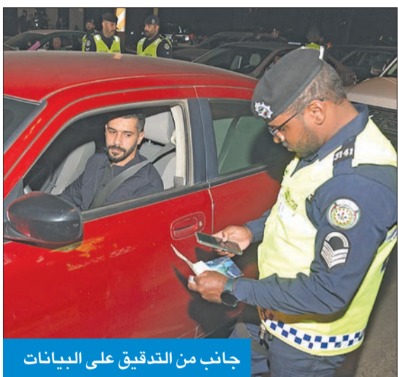
جانب من التدقيق على البيانات