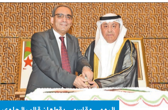
الرومي وقاسمي يقطعان قالب الحلوى

أكد وزير النفط طارق الرومي، أن «هناك تواصلًا دائمًا وتنسيقًا مستمرًا مع كل وزراء النفط في منظمة الدول المصدرة للنفط (أوبك)، وهناك سياسة لضبط الأسعار»، لافتاً إلى أنه «سيكون هناك التزام بما تم الاتفاق عليه في المنظمة خلال اجتماعها الأخير، وستستمر هذه السياسة حتى نرى أن هناك بوادر لارتفاع الأسعار. ونسعى أن يكون سعر النفط أفضل مما هو عليه».