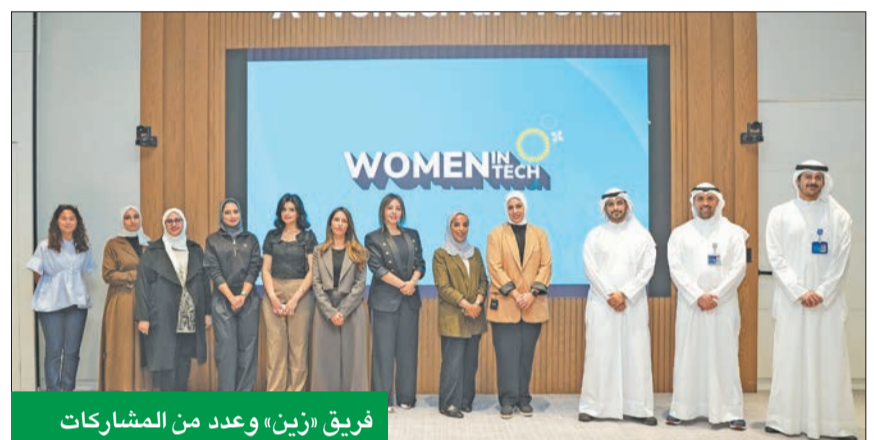
فريق «زين» وعدد من المشاركات

أطلقت «زين» مبادرة «المرأة في التكنولوجيا»، الهادفة إلى تمكين المرأة وتعزيز وجودها في ميادين التكنولوجيا الحديثة، وإعداد الكفاءات الوطنية النسائية في مجالات العلوم والتكنولوجيا والهندسة، وتأهيلها لدخول سوق العمل الحديث. وجاءت هذه الخطوة تحت مظلة استراتيجية زين للاستدامة المؤسسية، والتي تستند حول عدد من الركائز الرئيسية، مثل الاستثمار في العنصر البشري، وتأهيل الكفاءات الوطنية في مجالات التكنولوجيا، والدفع بجهود تمكين المرأة، وتعزيز الأشتغال والتخوع في المجتمع، وغيرها من الركائز المجتمعية التي تسهم في تحقيق النمو المستدام.