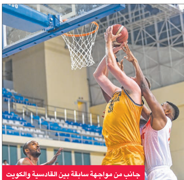
جانب من مواجهة سابقة بين القادسية والكويت