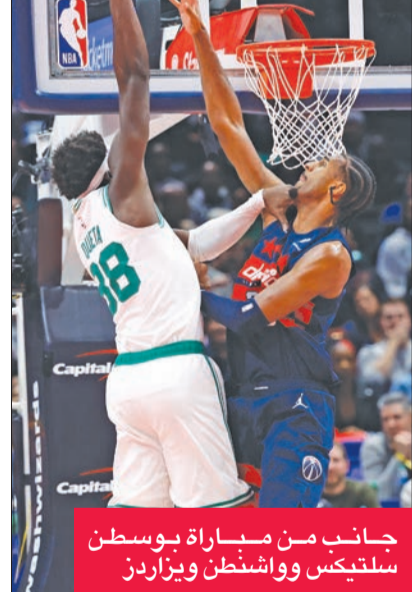
جانب من مباراة بوسطن سلتيكس وواشنطن ويزاردز