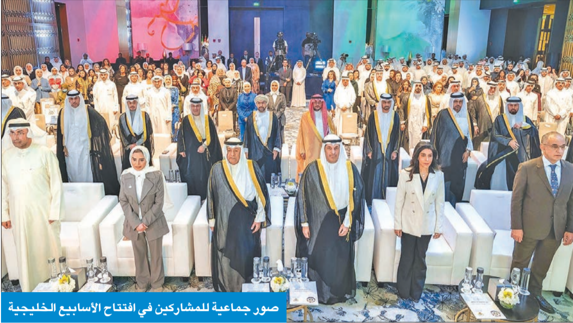
صور جماعية للمشاركين في افتتاح الأسابيع الخليجية

المجلس وشعوبها، متمنياً من الله العليّ القدير أن تحقق هذه المبادرات الأهداف المرجوة منها. وتم خلال الحفل عرض فيلم قصير يستعرض مسيرة مجلس التعاون، وأهم ما تحقق من إنجازات لدول المجلس في ميادين مختلفة، كما قدمت فرقة التلفزيون للفنون عرضاً غنائياً تضمن عدداً من الأغاني الوطنية والخليجية والتراثية في فني مختلفة من الغناء.