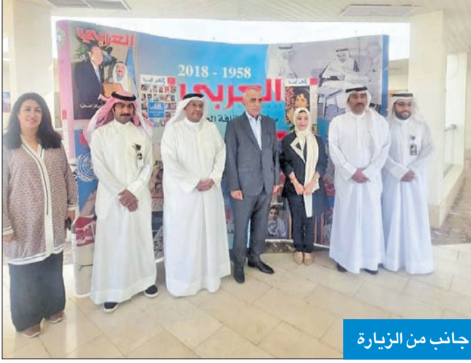
جانب من الزيارة