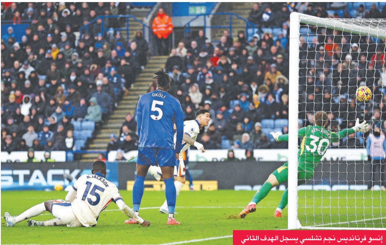
إنسو فرنانديس نجم تشلسي يسجل الهدف الثاني