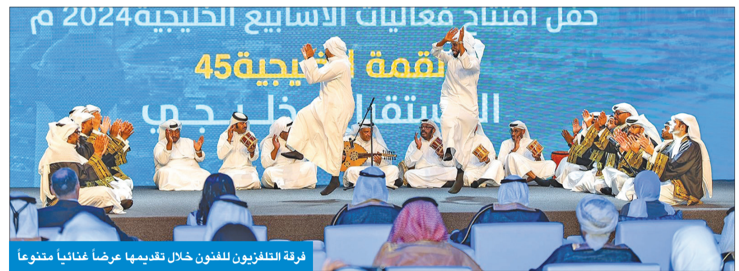
فرقة التلفزيون للفنون خلال تقديمها عرضاً غنائياً متنوعاً

كشف وزير الإعلام والثقافة وزير الدولة لشؤون الشباب، عبدالرحمن المطيري، أن الأسابيع الخليجية وما تتضمنه من ندوات ومعارض وعروض فنية وفعاليات متعددة انطلاقاً من يوم أمس الأول وحتى 30 الجاري تهدف إلى مناقشة القضايا والاهتمامات التي تهم المواطن الخليجي وتؤثر في حاضره ومستقبله، إضافة إلى ما توفره من فرصة للقاء المباشر بين أعضاء الأسرة الخليجية وتعزيز الروابط ووشائج المحبة بين دول المجلس وشعوبه. جاء ذلك خلال حفل انطلاق الأسابيع الخليجية بحضور وزيرة الأشغال رئيسة اللجنة العليا للإعداد والتحضير لمؤتمر القمة لدول مجلس التعاون، د. نورة المشعان، ووزيرة الشؤون الاجتماعية وشؤون الأسرة والطفولة، د. أمثال الحوييلة، والإمين العام لمجلس التعاون جاسم البديوي، وعدد من سفراء دول الخليج ومسؤولين كويتيين. وأكد المطيري أن فعاليات