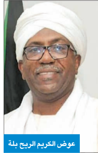
عوض الكريم الريح بلة

اليمن يتمنى رؤية نتنياهو وهو يحاكم كمجرم حرب وكمجرم دولي