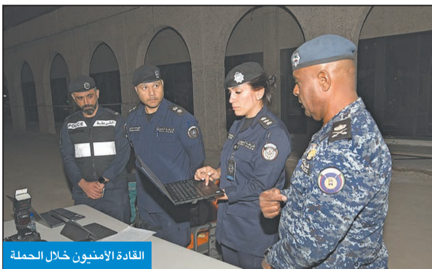
القادة الأمنيون خلال الحملة

مخالفات مرور جسيمة، كما تمكن رجال الأمن من ضبط 11 مركبة مطلوبة لجهات أمنية وقضائية. وتمكنوا أيضاً من ضبط 15 مخالفاً لقانون الإقامة والعمل، و5 وأقدين مسجلة بحقهم قضايا تغيب وصادر بحقهم أوامر ضبط وإحضار، فضلاً عن ضبط 6 أشخاص صادرة بحقهم أوامر إلقاء القبض، وضبط 4 أشخاص لا يحملون إثبات شخصية، وضبط شخص بحوزته مواد مسكرة، وشخصين آخرين؛ أحدهما مطلوب للإدارة العامة للتنفيذ الجنائي، وآخر بحالة غير طبيعية.