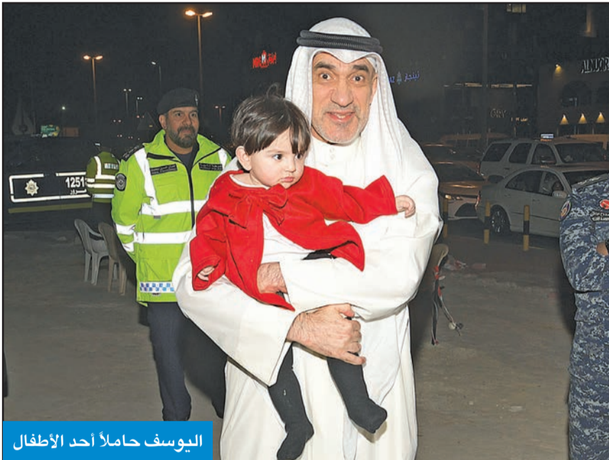
اليوسف حاملاً أحد الأطفال

«مَن خدم الكويت بشرف وأمانة لا يستحق منا سوى التكريم وردّ الجميل» أشرف ميدانياً على حملة أمنية في حولي وعالج حالات إنسانية بالموقع