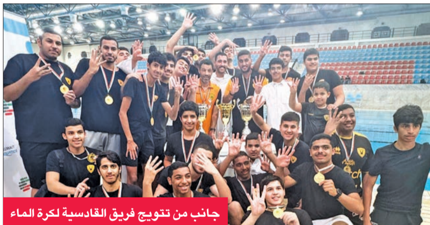
جانب من تتويج فريق القادسية لكرة الماء

الدوري الذي اختتمت منافساته 7 نوفمبر الجاري بعد فوزه في مبارياته الأربع أيضاً مسجلاً 44 هدفاً مقابل 29 هدفاً في مرماه، في حين اختتم فريق مرحلة 18 سنة مبارياته