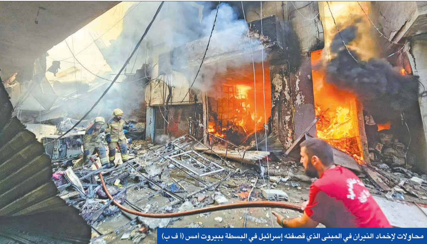
محاولات لإخماد النيران في المبنى الذي قصفته إسرائيل في البسطة ببيروت أمس

واشنطن ملتزمة بحل دبلوماسي وتل أبيب تعتبر تنفيذ اتفاق وقف النار أهم من الاتفاق نفسه