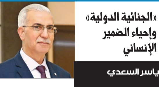
«الجناية الدولية» وإحياء الضمير الإنساني

من السفراء المعتمدين لدى البلاد، في تصريحات لـ «الجريدة»، على أن «قرارات المحكمة الجنائية الدولية ملازمة لجميع الدول الأطراف في نظام روما الأساسي»، وهي تمثل «خطوة حاسمة في محاسبة المسؤولين عن أعمال الإبادة الجماعية ضد الفلسطينيين»، معتبرين أن «قرار المحكمة الخاص باعتقال رئيس وزراء إسرائيل بنيامين نتنياهو ووزير دفاعه السابق يوآف غالانت مستحق»، وأن أيام المحاسبة على جرائم الحرب تقترب أكثر فأكثر... وفيما يلي التفاصيل: