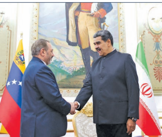
رئيس فنزويلا نيكولاس مادورو مستقبلاً وزير الدفاع الإيراني عزيز ناصر زاده في كراكاس أمس الأول

لاريجاني: منفتحون على اتفاق نووي جديد إذا قبلت واشنطن شروطنا