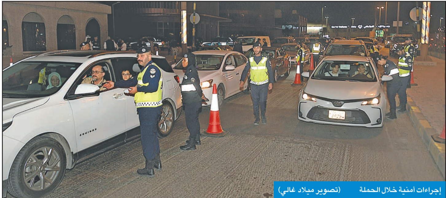
إجراءات أمنية خلال الحملة