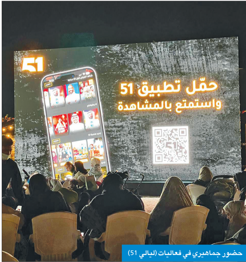
حضور جماهيري في فعاليات «ليالي 51»

أكد وزير الثقافة الأردني مصطفى الرواشدة أن مجلة العربي الكويتية شكلت منارة ثقافية للأجيال، وقامت بفعل ثقافي متميز على امتداد مساحة الوطن العربي. وأشاد الرواشدة، خلال زيارته، الخميس الماضي، مقر المجلة ولقائه رئيس تحريرها إبراهيم المليفي، بمراحل تطور المجلة وعراقتها وحضورها في الذاكرة. من جهته، تحدث المليفي عن تطور المجلة ودورها الثقافي وأهميتها