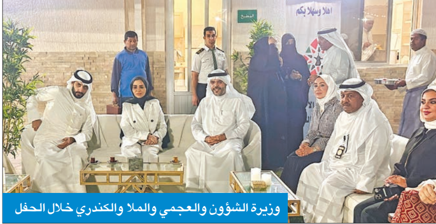
وزيرة الشؤون والعجمي والملا والكندري خلال الحفل

ووعده الموظفين بأن تكون «الشؤون» من أوائل الجهات الحكومية التي تنجز التقويم وتصفى المكافآت بأقصى سرعة ممكنة، نافيةً أن يكون هناك أي نوع من أنواع التقليص في صرف المكافآت، وأن «مبلغ المكافآت