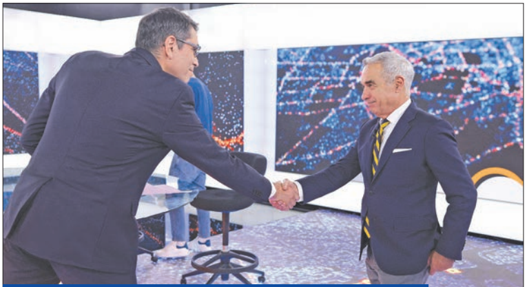
جورجيسكو خلال مناظرة تلفزيونية في بوخارست

عاجبه بيوتين «الانتخابات الرئاسية الرومانية» رأساً على عقب، وفق ما وصفت «بلومبرغ» مضيئة أن رومانيا، المتاخمة لأوكرانيا، تستعد لرحلة إعادة في 8 ديسمبر بين هذا القومي ومرشح المؤسسة في واحدة من أكبر المفاجآت في البلاد منذ نهاية التسعينيات. ورحب جورجيسكو (62 عاماً) بـ«الصحة» غير العادية للشعب الروماني، الذي «عاني اضطراباً اقتصادياً وأحزاباً أثقلت كاهله على امتداد 35 عاماً»، وأثار حديثه عن «صحة» تساؤلات حول إذا ما كانت رومانيا وغيرها