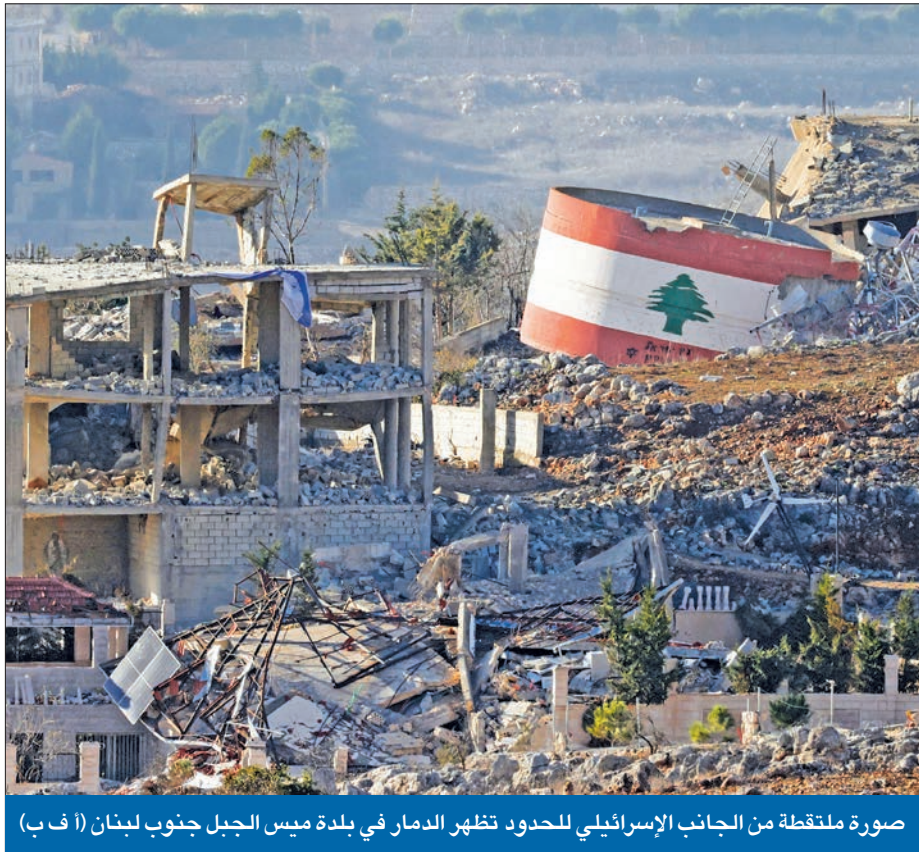
صورة ملتقطة من الجانب الإسرائيلي للحدود تظهر الدمار في بلدة ميس الجبل جنوب لبنان

وقال «أكسيوس» إن الاتفاق ينص على انسحاب إسرائيل تدريجياً من المناطق التي توغلت فيها بجنوب لبنان في غضون 60 يوماً، ينتشر خلالها الجيش اللبناني في المنطقة، في حين ينسحب «حزب الله» إلى ما وراء نهر الليطاني. وكانت مصادر مقربة من الحزب قالت إن الانسحاب يجب أن يكون فوراً، في حين لم يصدر عن الحزب أي إشارة حول استعداده لانسحاب فعلي من المنطقة. وبحسب «أكسيوس» وافقت الولايات المتحدة على تقديم رسالة ضمانات لنيل أيبب تدعم أي عمل عسكري لها ضد تهديدات وشيكة من الأراضي اللبنانية، أو ضد أي محاولات لـ «حزب الله» لإعادة تأسيس وجود عسكري قوي له بمحاذاة الحدود، على أن يجري ذلك بالتشاور بين البلدين، وفي حال عدم تصدي الجيش اللبناني للتهديد. وكان الحزب رفض أي بند يسمح لإسرائيل بحرية العمل داخل لبنان. كما يتضمن الاتفاق، حسب «أكسيوس» تشكيل لجنة رقابية تقودها واشنطن لمتابعة تنفيذ الاتفاق ومعالجة الانتهاكات من ناحيتها، قالت القناة 14 العبرية، إن الاتفاق يسمح للمدنيين اللبنانيين فقط بالعودة إلى قراهم لا لمسلحي الحزب، وليس واضحاً كيف سيتم تنفيذ هذا البند بالنسبة لمقاتليه الذين يتحدرون من المنطقة الحدودية، فضلاً عن وجود عموض أيضاً بالنسبة للحدود، حيث برزت رغبة إسرائيلية في اعتماد الحدود الدولية لا الخط الأزرق وهو ما يرفضه اللبنانيون.