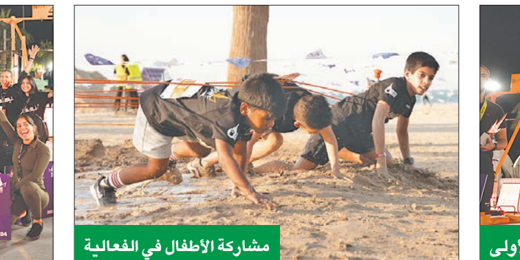
مشاركة الأطفال في الفعالية