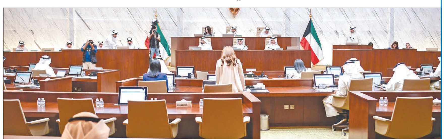
جانب من جلسة «البلدي» أمس