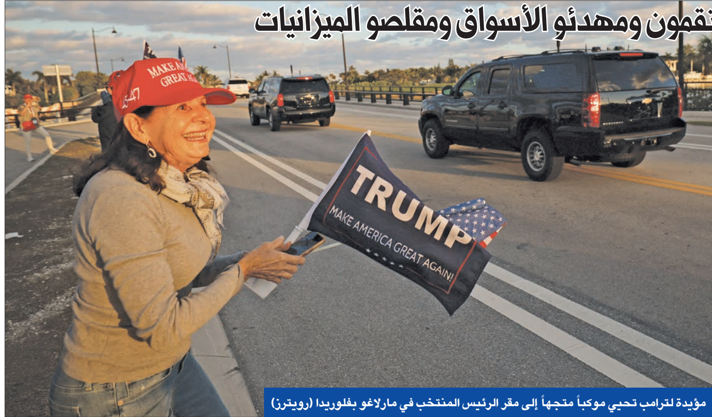
مؤيدة لترامب تحيي موكباً متجهاً إلى مقر الرئيس المنتخب في مارلاغو بفلوريدا

أثارت التعيينات التي قام بها الرئيس الأميركي المنتخب دونالد ترامب، والتي جمعت شخصيات من مشارب أيديولوجية وتجارب سياسية مختلفة وأحياناً متناقضة، تساؤلات حول مدى قدرة هذا الفريق على تطبيق السياسات التي وعد بها ترامب.