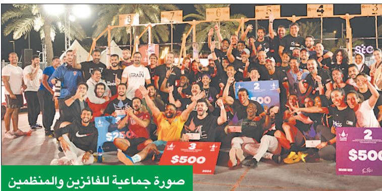
صورة جماعية للفائزين والمنظمين

ويتمتع بسجل حافل بالنجاحات في جذب مجموعة كبيرة من المتنافسين من مختلف أنحاء المنطقة، ويشهد كل عام إقبالاً هائلاً من الحضور الذين يتواجدون لمتابعة الرياضيين المشاركين وهم يتنافسون على الألقاب البطولات المختلفة، واستقبل المهرجان هذا العام أكثر من 3500 متنافس سجل في جميع فعاليات البطولة، بإجمالي أكثر من 8 آلاف مشارك على مدار ثلاثة أيام.