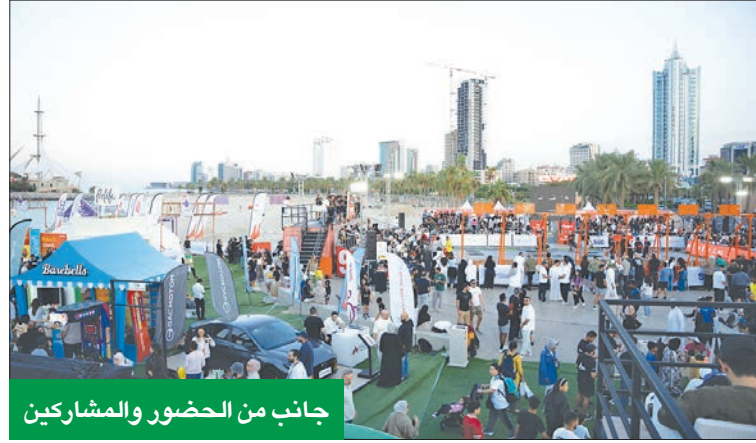
جانب من الحضور والمشاركين