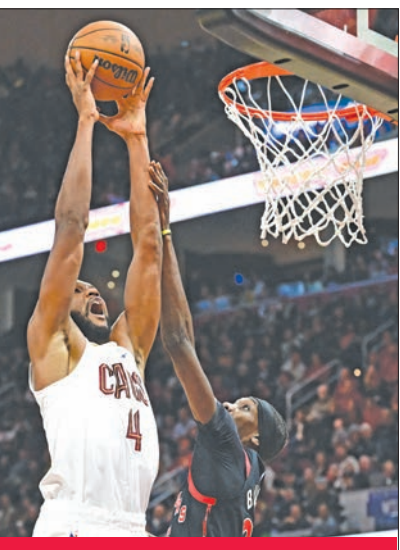
موبلي نجم كافاليرز يسجل في سلة رابرتوز

وسحق لوس أنجلوس كليبرز مضيفه فيلادلفيا سفنتي سيكسرز 125 - 99، مواصلاً سلسلة انتصاراته المتتالية التي وصلت إلى خمسة.