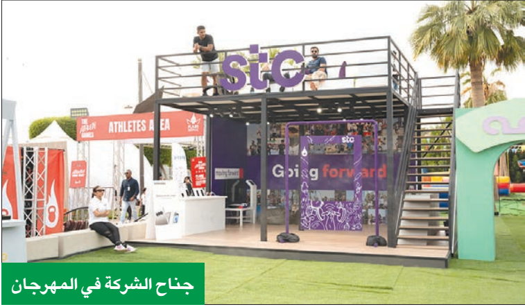
جناح الشركة في المهرجان

بمشاركة 3500 رياضي... وسط حضور كبير تجاوز 8 آلاف شخص خلال 3 أيام