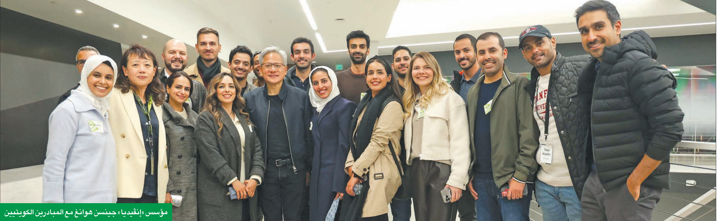
مؤسس «إنفديا» جينسن هوانغ مع المبادرين الكويتيين

ضمن برنامجها المبتكر Zain Great Idea لتسريع الشركات التكنولوجية الناشئة