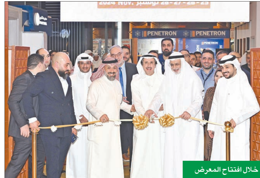
خلال افتتاح المعرض