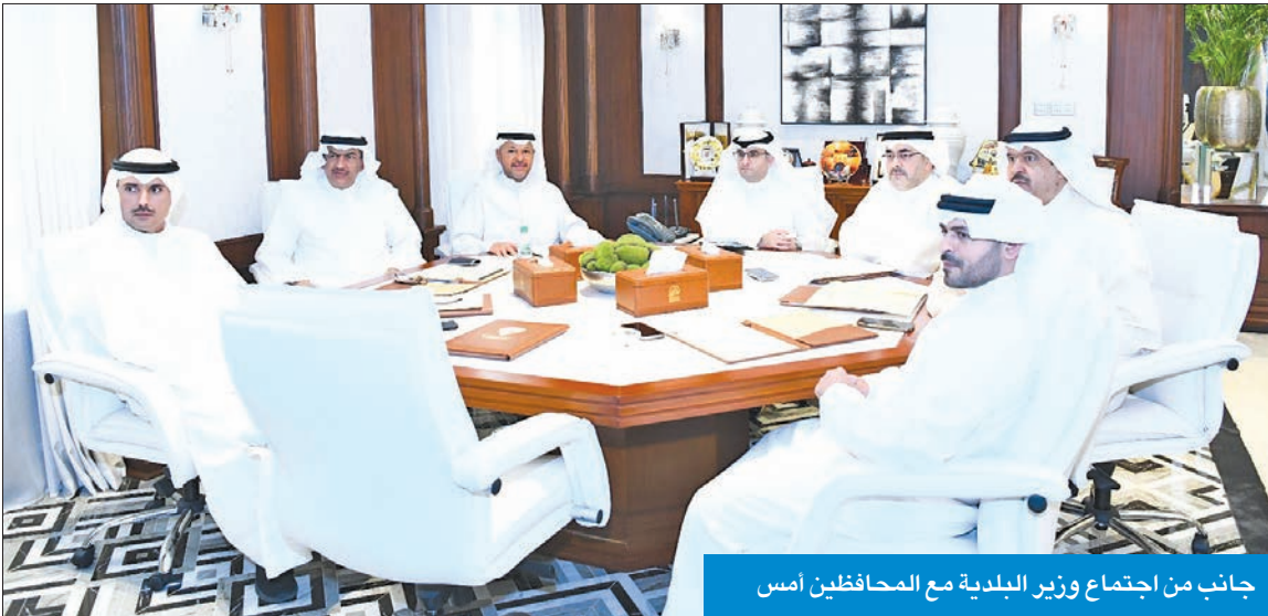
جانب من اجتماع وزير البلدية مع المحافظين أمس

هم العيون التي تكتشف من خلالها كل المشكلات التي يعانها المواطنون وتأكيد تلبية طلباتهم وإنجاز كل الخدمات الخاصة بهم، خاصة ما يتعلق بالنظافة وإزالة كل التبعثبات على أملاك الدولة، والتأكد من الحفاظ على المال العام، وتنفيذ توجيهات مجلس الوزراء الرامية إلى تفعيل دور المحافظين في إنجاز كل المشاريع والخدمات في المحافظات الست.