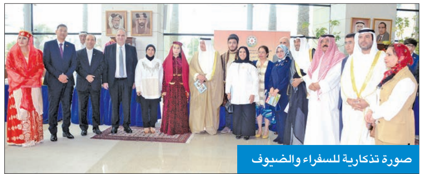
صورة تذكارية للسفراء والضيوف

المكتبة الوطنية تستضيف فعالية إعلان «شوشا عاصمة الثقافة للعالم الإسلامي»