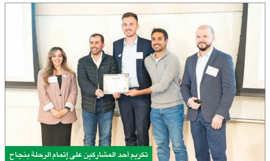
تكرم أحد المشاركين على إتمام الرحلة بنجاح

المشاركون اطلعوا على كيفية دمج التقنيات المتطورة في شركاتهم الناشئة وتوظيفها لتحقيق النمو المستدام