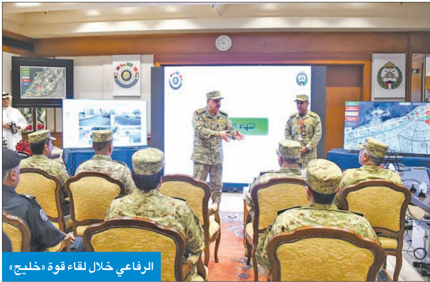
الرفاعي خلال لقاء قوة «خليج»

طبيعة المهمة وأهميتها، مشدداً على ضرورة أن يتسم الأداء خلال القمة بالوعي الأمني، والتقدير التام لطبيعة المهمة بناءً على تعليمات قيادة الحرس ممثلة في رئيسه الشيخ مبارك الحمود، ونائب الرئيس الشيخ فيصل النواف.