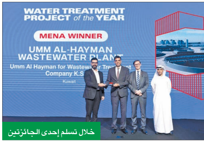
خلال تسلم إحدى الجائزتين

حازت شركة أم الهيمنان لمعالجة مياه الصرف الصحي «ش ك م» على تكريم مرموق في النسخة الرابعة عشرة من جوائز MEED Projects، بالتعاون مع بنك الشرق، حيث حصلت الشركة على جائزتين مهمتين: الأولى جائزة مشروع البنية التحتية لمنطقة الشرق الأوسط وشمال إفريقيا للعام 2024، والثانية مشروع معالجة المياه لمنطقة الشرق الأوسط وشمال إفريقيا للعام 2024.