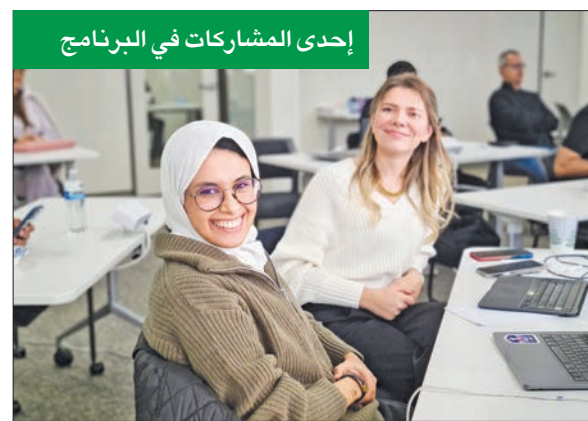
إحدى المشاركات في البرنامج