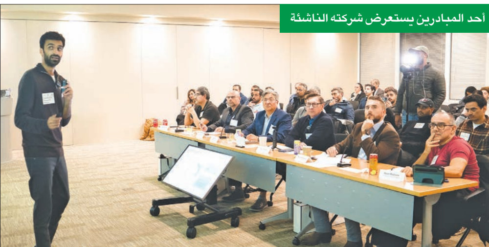
أحد المبادرين يستعرض شركته الناشئة