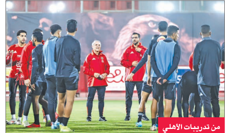
من تدريبات الأهلي

تشدّ القمة المغربية بين الرجاء الرياضي وضيغه الجيش الملكي اليوم الانتظار في الجولة الافتتاحية لدور المجموعات