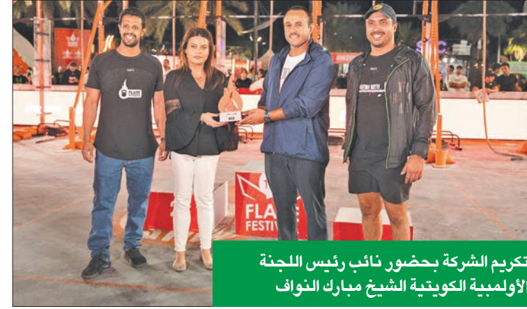
تكريم الشركة بحضور نائب رئيس اللجنة الأولمبية الكويتية الشيخ مبارك النواف

وتابعت: «تتمن stc الدور الفعال الذي تلعبه كشركة رائدة في السوق الكويتي، وفي إطار المسؤولية الاجتماعية للشركات، تعاونت stc على مر السنين مع العديد من الشركات في القطاع الحكومي والخاص لبناء علاقات تعاون مثمرة طويلة الأمد، ولعب دور فعال في المجتمع، من خلال المبادرات التي ستعكس بشكل إيجابي على جيل الشباب».