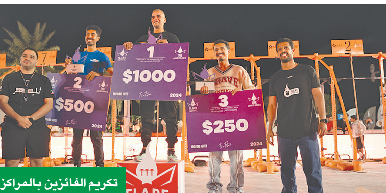
تكريم الفائزين بالمراكز الأولى