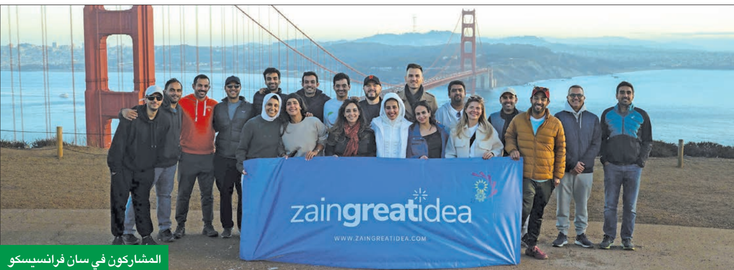
المشاركون في سان فرانسيسكو

اختتمت «زين» بنجاح كبير المحطة الأبرز من برنامجها الرائد لتسريع الشركات التكنولوجية الناشئة Zain Great Idea، وهي مرحلة التسريع العالمي في الولايات المتحدة، والتي شهدت زيارة رواد الأعمال الكويتيين أصحاب شركات محلية تكنولوجية ناشئة إلى وادي السيليكون، الذي يُعتبر العاصمة الروحية لريادة الأعمال والابتكار، ومنشأ كبرى شركات التكنولوجيا العالمية.