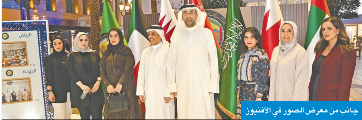
جانب من معرض الصور في الأفنيوز