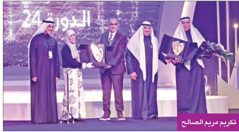
تكريم مريم الصالح

الصالح تستحق هذه الوقفة، وهذا المسمى لشخصية المهرجان، لما لها من تاريخ فني مفعم بالعطاء على جميع المستويات الفنية محليا وخليجيا وعربيا»، ووجه تحية إلى ضيف المهرجان إسماعيل عبدالله، قائلا: «صانع رجال المسرح والألحان المسرحية، تحية لك في بلدك الكويت، وتابع: «تشرّفنا أن يكون لنا ضيوف من اعلام المسرح العربي من المحيط إلى الخليج، وحرصنا على التنوع الفني لتكون لياليها المسرحية تتوافق مع الأهداف والغايات التي أنشئ من أجلها المهرجان، وتأكيدا منا على التعزيز الأكاديمي رأت اللجنة العليا إقامة ندوة فكرية من محورين»، كما أعلن خلال الحفل أسماء أعضاء لجنة تحكيم المهرجان، وهم: الدكتور عبدالله العابر رئيسا، وعضوية الدكتور موسى أرتي والكاتبة تغريد الداوود والفنانين جمال الردهان وعبدالله التركماني.