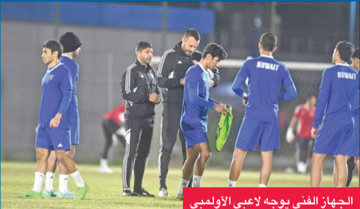
الجهاز الفني يوجه لاعبي الأولمبي

يخوض منتخب الكويت الأولمبي لكرة القدم ثاني مبارياته التجريبية، بمواجهة الفريق الأول بنادي الشباب مساء الأحد المقبل. وكان المنتخب الأولمبي لعب مباراته الأولى الأحد الماضي أمام نادي برقان، وانتهت بفوز برقان بهدف دون رد.