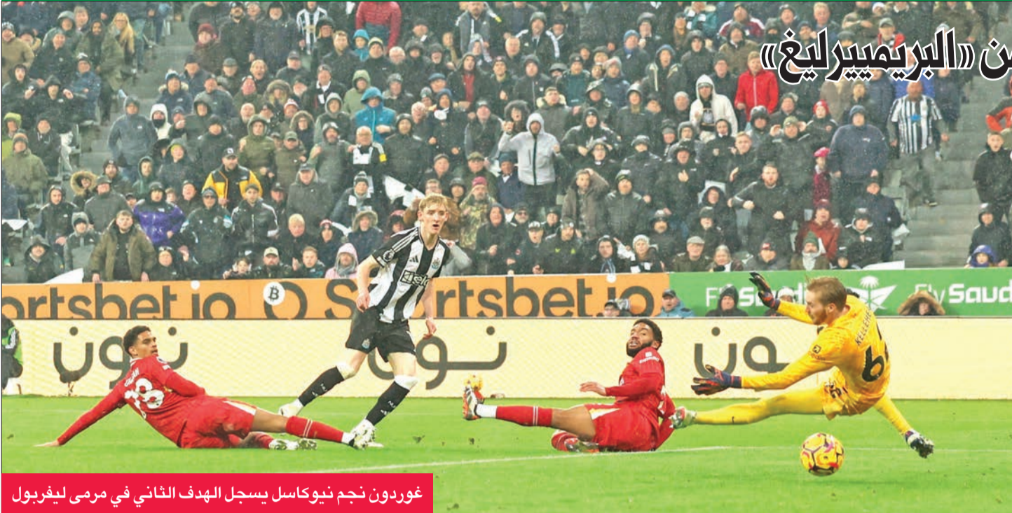
غوردون نجم نيوكاسل يسجل الهدف الثاني في مرمى ليفربول