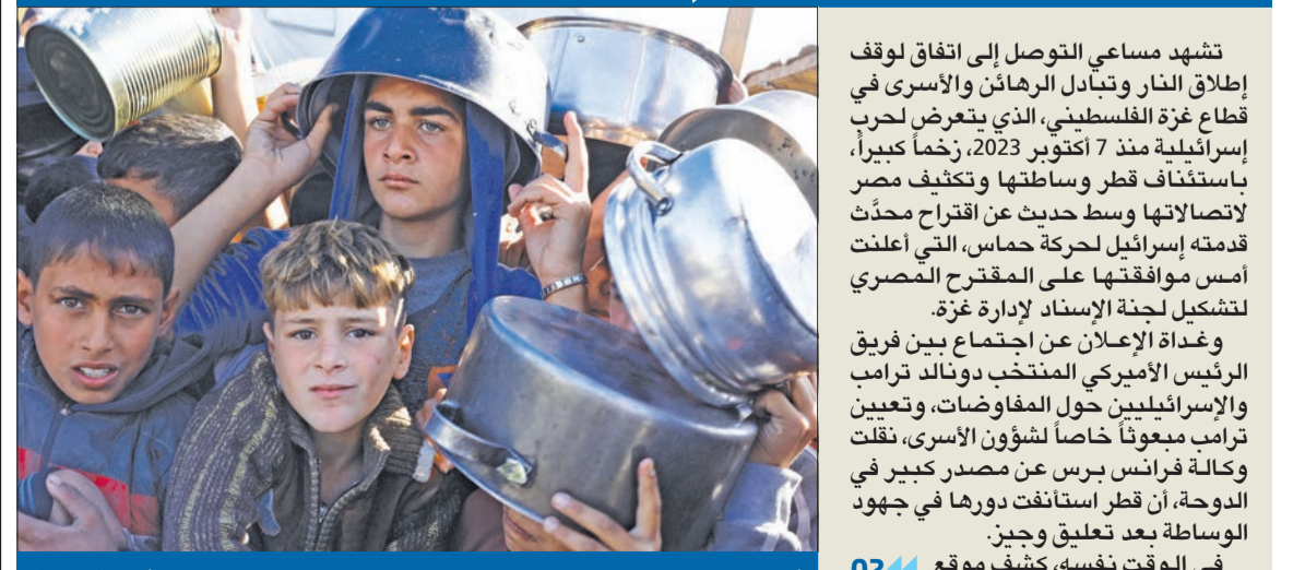
اطفال فلسطينيون ينتظرون دورهم للحصول على مساعدات غذائية في غزة امس

تشهد مساعي التوصل إلى اتفاق لوقف إطلاق النار وتبادل الرهائن والأسرى في قطاع غزة الفلسطيني، الذي يعرض للحرب الإسرائيلية منذ 7 أكتوبر 2023، زخماً كبيراً، باستئناف قطر وساطتها وتكثيف مصر لاتصالاتها وسط حديث عن اقتراح محدث قدمته إسرائيل لحركة حماس، التي أعلنت أمس موافقتها على المقترح المصري لتشكيل لجنة الإسناد لإدارة غزة. وغداة الإعلان عن اجتماع بين فريق الرئيس الأميركي المنتخب دونالد ترامب والإسرائيليين حول المفاوضات، وتعيين ترامب مبعوثاً خاصاً لشؤون الأسرى، نقلت وكالة فرانس برس عن مصدر كبير في الدوحة، أن قطر استأنفت دورها في جهود الوساطة بعد تعليق وجيز في الوقت نفسه، كشف موقع