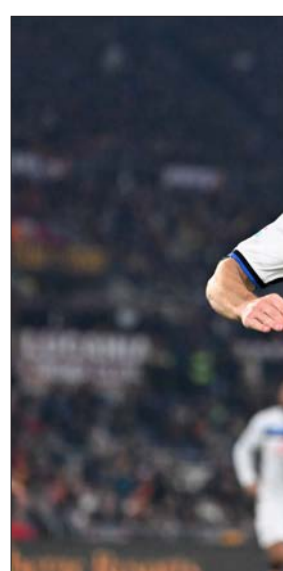
مارتن دي رون نجم أتالانتا

المركز الرابع برصيد 28 نقطة، بالتساوي مع إنتر الثالث ولاتسيو الرابع، متاخرا بفارق بثلاث نقاط عن أتالانتا، مع مباراة مؤجلة بعد أمسية مؤلمة نُكرت جماهير «فيولا» بوفاة قائدهم السابق دافيدي استوري اثر نوبة قلبية في غرفته في أحد الفنادق في عام 2018.