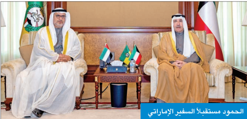
الحمود مستقبلاً السفير الإماراتي

استقبل رئيس الحرس الوطني، الشيخ مبارك الحمد، في ديوانه بالرئاسة العامة للحرس سفير دولة الإمارات لدى الكويت، د. مطر النباوي، الذي قدم له التهنئة لحصوله على ثقة القيادة السياسية وتعيينه رئيساً للحرس الوطني. وتقدم رئيس الحرس بالشكر والتقدير لسفير الإمارات على تهنئته، مشيداً بالروابط التاريخية وعمق العلاقات المتميزة بين الكويت والإمارات.