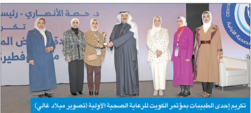
تكريم إحدى الطبيبات بمؤتمر الكويت للرعاية الصحية الأولية

وأكد العوضي أن هذه الاستراتيجية تهدف إلى تعزيز قدرة النظام الصحي على تلبية احتياجات المجتمع، في ظل التوسع السكاني والتطورات السريعة في المجال الطبي. وأشار إلى أن عدد مراكز الرعاية الصحية الأولية في البلاد بلغ 116