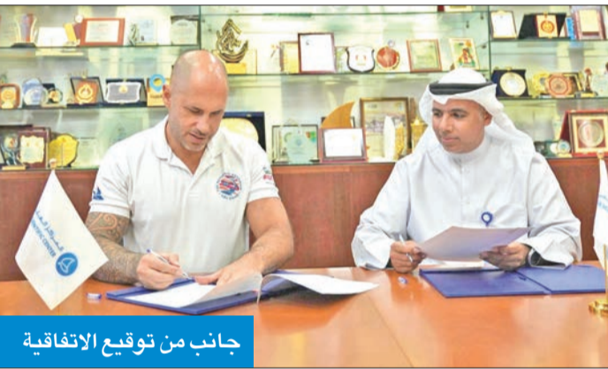
جانب من توقيع الاتفاقية

المجال أمام تطوير مبادرات ومشاريع مستقبلية بغية دعم الجهود البيئية والتعليمية، مع التركيز على أهمية تبني الممارسات المستدامة والابتكارات الصديقة للبيئة.