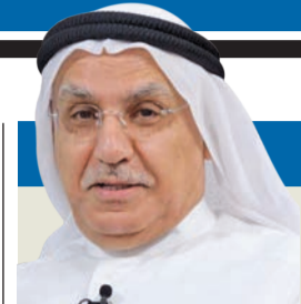
من سيد خاطر