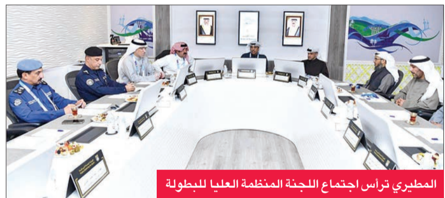
المطيري ترأس اجتماع اللجنة المنظمة العليا للبطولة

أكدت اللجنة المنظمة الكويتية العليا لبطولة كأس الخليج العربي لكرة القدم (خليجي 26) برئاسة وزير الإعلام والثقافة وزير الشؤون الشباب عبدالرحمن المطيري أن الاستعدادات لاستضافة الكويت للتلعب الخليجي الرياضي المهم تسير بصورة مميزة من جميع الجوانب الفنية والتنظيمية.