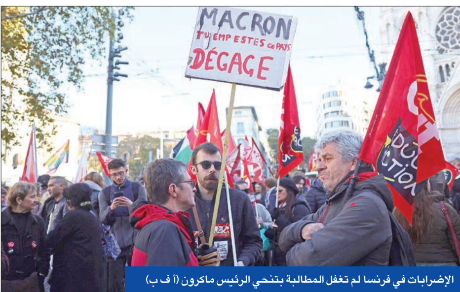
الإضرابات في فرنسا لم تغفل المطالبة بتخني الرئيس ماكرون

قبل نهاية عهده، حيث كشف استطلاع أجرته مجموعة «كلوستر» 17، لمصلحة مجلة «لويوان»، أن نصف الفرنسيين يؤيدون تخني ماكرون، بينما يعتبر 36 بالمئة منهم أن حجب الثقة عن حكومة بارنييه «إجراء سيئاً». وبينما حفل 13 في المئة فقط بارنييه مسؤولية سقوط الحكومة، أيد 54 بالمئة من الشعب الفرنسي استقالة الرئيس ماكرون وإجراء انتخابات رئاسية مبكرة اعتباراً من عام 2025، خاصة أن 40 بالمئة من المستجوبين يعتقدون أنه لا يوجد حلّ عملي للخروج من المازق الحالي في ظل أزمة شرعية تؤثر على كل المؤسسات الديمقراطية. وتفتح استقالة بارنييه مرحلة من عدم اليقين السياسي في فرنسا، حيث سيكون أمام ماكرون تحدي تعيين رئيس حكومة جديد قادر على التعامل مع الوضع البرلماني المعقد واستقرار الأوضاع الاقتصادية المتدهورة أخيراً. ونفى سياسيتان لوكرونو، وزير القوات المسلحة، الذي تم ذكره كمرشح محتمل لتولي رئاسة الحكومة، أي رغبة في شغل هذا المنصب.