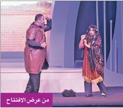
من عرض الافتتاح