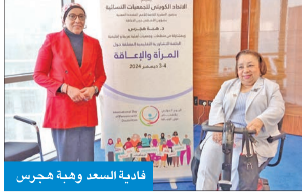
فادية السعد وهبة هجرس

الأشخاص ذوي الاحتياجات الخاصة ضمن أولويات السياسة العامة للدولة، والعمل على تذليل العقبات التي تحد من تمتعهم بكامل حقوقهم ليكونوا أكثر تمثيلاً في الأدوار القيادية، خاصة النساء عبر جميع القطاعات الاقتصادية والاجتماعية والثقافية وغيرها. وأشارت إلى أن الحلقة التي أقيمت بحضور المقررة الخاصة بالأمم المتحدة المعنية بحماية الأشخاص ذوي الإعاقة، د. هبة هجرس، أوصت كذلك بأهمية إكفاء الوعي العام باليات الأمم المتحدة، خاصة لدى ذوات الاحتياجات الخاصة بهدف دعمهم وتسهيل الضوء على التحديات والحوار التي تحول دون قيادة ذوي الاحتياجات الخاصة.