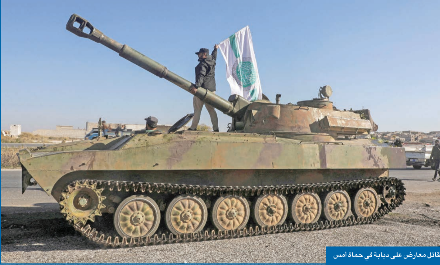
مقاتل معارض على دبابة في حماة امس