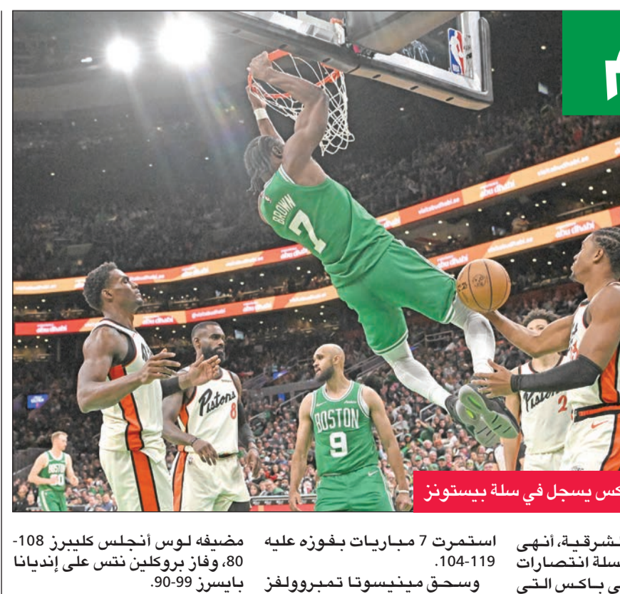
براون نجم سلاتيكس يسجل في سلة ويستونز

تعرض نجم فينيكس صنز في دوري كرة السلة الأميركي للمحترفين (إن بي إيه) لالتواء في كاحله الأيسر، وسيغيب عن مباريات الأسبوع المقبل حسب تقارير عدة. وعانى دورانت من الإصابة في الربع الثاني من مباراة فريقه مع سان أنتونيو سبيرز (104-93)، عندما داس على قدم اللاعب جوليان شامباني. وأفادت شبكة «إي أس بي إن» وصحيفة «أريزونا ريبابليك» بأن دورانت سيعيب عن المباريات الثلاث أمام نيو أورليانز بليكازن، وميامي هيت، وأورلاندو ماجيك، قبل أن يتم تقييم حالته من جديد. ويبلغ معدل دورانت،