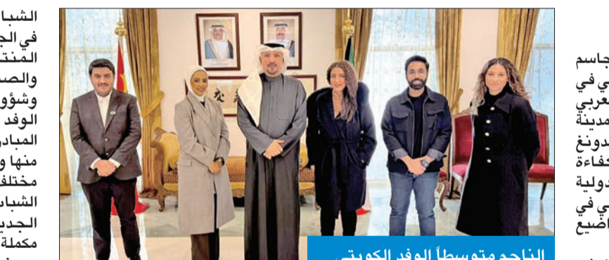
الناجم متوسطاً الوفد الكويتي

أشاد سفير الكويت لدى الصين جاسم الناجم بمشاركة الوفد الكويتي في الدورة الثالثة للمنتدى الصيني - العربي للسياحة الشباب، التي أقيمت في مدينة زوهاي، إحدى مدن مقاطعة قوانغدونغ الصينية، مضيفاً أنها تعكس كفاءة الشباب الكويتيين في المحافل الدولية والإقليمية، وجودة تمثيلهم الوطني في شتى المجالات والخصائص والمواضع المشتركة دولياً. وأكد الناجم، خلال استقباله للوفد، بمقر السفارة في العاصمة الصينية بكين، أمس الأول، عمق العلاقات الكويتية - الصينية الممتدة منذ 53 عاماً وأهميتها المشتركة لمستقبل البلدين في النماء والازدهار والقائمة على الشراكة الاستراتيجية والاقتصادية والتبادل التجاري والثقافي والاحترام المتبادل، مشيراً إلى التقارب الدبلوماسي الرفع