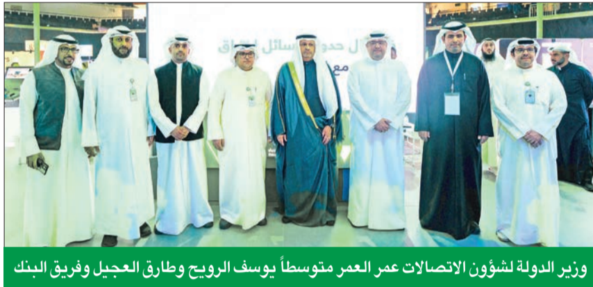
وزير الدولة لشؤون الاتصالات عمر العمر متوسطاً يوسف الرويح وطارق العجيل وفريق البنك

الرويح: حريصون على دعم مبادرات التحول الرقمي والابتكار