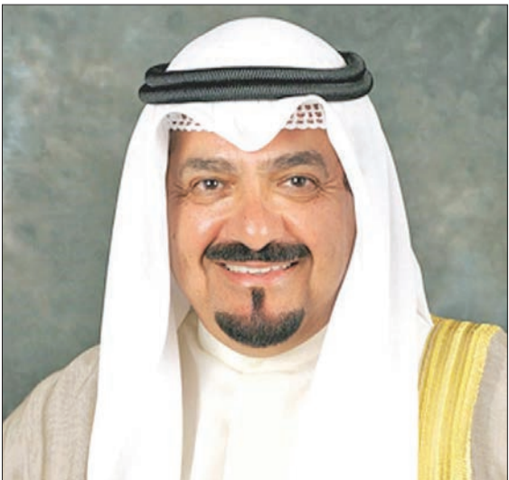
السوداء سمو الشيخ أحمد العبدالله ببرقية تعزية إلى خادم الحرمين الشريفين بوفاة الأميرة جواهر، كما بعث ببرقية تهنئة