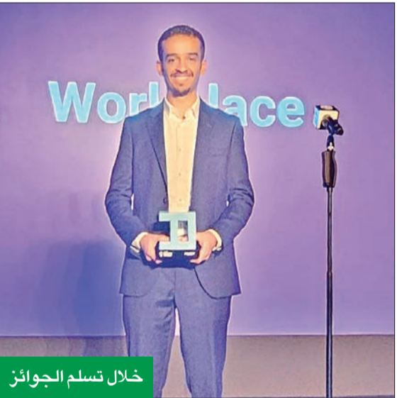
خلال تسلم الجوائز

وتعتقد المجلة: «إن نمو قائمة الشركات الأكثر ابتكاراً في المنطقة الشرق يشير إلى كيفية تركيز الشركات مثل زين على الابتكار، واستخدامها لأحدث التطبيقات التكنولوجية في جميع جوانب العمل، وهذا بدوره يعكس قدرة هذه الشركات على قيادة الأعمال». وبيصفتها شركة تضع الأفراد في المقام الأول، لتعزيز مهمتها التنظيمية وأهدافها التجارية الطموحة، بالإضافة إلى مواصلة التزامها بتعزيز القدرات الداخلية من أجل تعزيز النمو الشخصي والمهني لوقتها العاملة. أسست مجموعة زين أول إدارة متخصصة في مجالات الاشتغال والتنوع والإنصاف IDE في المنطقة. وترتكز المبادرات الاستراتيجية التي تطلقها مجموعة زين في مجالات الاشتغال والتنوع والإنصاف على عدة برامج تتوافق مع استراتيجية الشركة الشاملة «4Sight»، التي تركز على تعزيز التنمية الشخصية والمهنية وترسيخ دور زين كقوة عالمية للتعبير الإيجابي من خلال 6 برامج استراتيجية: جامعة IDE بالشراكة مع جامعة AE في إسبانيا، برنامج WE الخاص بتككين المرأة وتحقيق المساواة بين الجنسين، برنامج WE ABLE إذ حُرِصَ «زين» على رفاهية الموظفين والصحة العقلية، برنامج زين لتنمية الشباب ZY الذي تسعى فيه إلى تمكين الشباب المهرة داخل بيئة العمل، منصة ZAINIAC التي تقدم فرص عمل جديدة للأفكار الناشئة، ومبادرة BE WELL لرفاهية الموظفين.