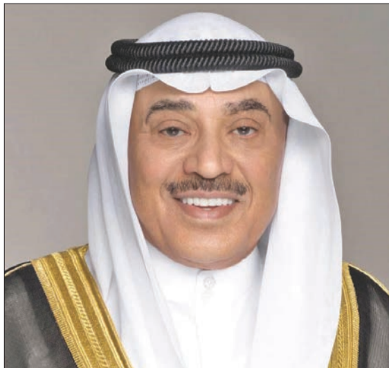
سموه خالص تهانیه بمناسبة العيد الوطني لبلادہ، راجياً له دوام الصحة والعافية. من جهته، بعث رئيس مجلس