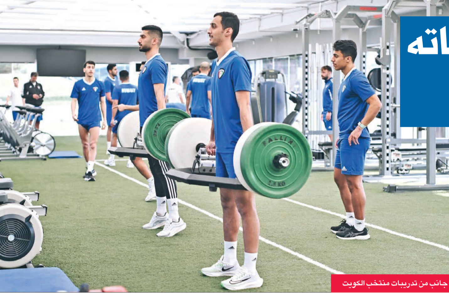
جانب من تدريبات منتخب الكويت