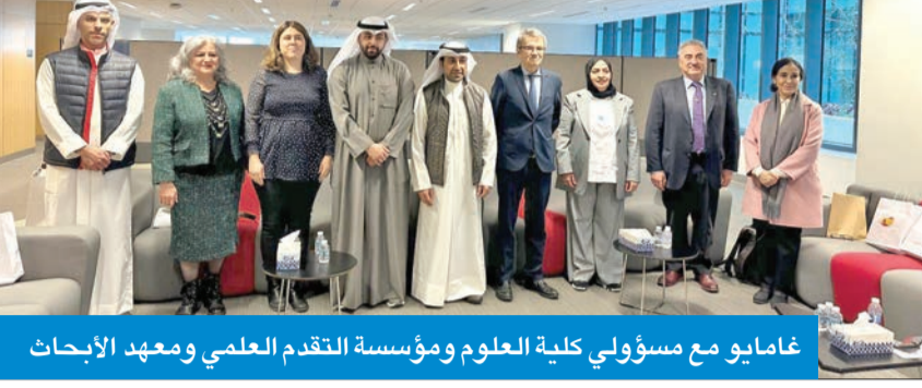
غامايو مع مسؤولي كلية العلوم ومؤسسة التقدم العلمي ومعهد الأبحاث

نظمت كلية العلوم بجامعة الكويت محاضرة بعنوان «المناخ وفهم فيزياء الغلاف الجوي للأرض ولماذا نحتاج إلى الاستشعار عن بُعد بواسطة الأقمار الصناعية» قدمها أستاذ الفيزياء التطبيقية بكلية العلوم في جامعة غرناطة مدير المعهد الأندلسي لأبحاث نظام الأرض منذ عام 2017 د. لوكاس الأديوس أربوليداس، بحضور السفير الإسباني في الكويت، مانويل هيرنانديز غامايو، وممثلة مؤسسة الكويت للتقدم العلمي مديرة إدارة الثقافة العلمية بالوكالة د. ليلى الموسوي في الكلية مؤخرًا.