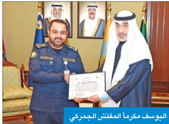
اليوسف مكرماً المفتش الجمركي

كرم النائب الأول لرئيس مجلس الوزراء وزير الدفاع وزير الداخلية الشيخ فهد اليوسف المفتش الجمركي محمد شمس الدين؛ تقديراً لجهوده في كشف وضبط محاولة لتهريب شخص بطريقة غير مشروعة. وجاء التكريم إثر تمكن المفتش من ضبط شخص حاول الهروب من البلاد بطريقة غير مشروعة، حيث كان هناك شخصان على متن مركبة عبر منفذ النويصيب بغرض مغادرة البلاد، وعند إجراء التفتيش المعتاد في الساحة الجمركية، اكتشف المفتش أن هناك شخصاً آخر مخبأ بالصندوق الخلفي للمركبة. وعند الاستعلام تبين أن الشخص المختبئ يوجد عليه أمر «منع سفر»، وتم تحويلهم لجهة الاختصاص واتخاذ الإجراءات القانونية ضدهم. وأشاد اليوسف ببفظة المفتش، مؤكداً على الدور الذي يقوم به مفتشو الجمارك في تعزيز الأمن وحماية حدود البلاد.