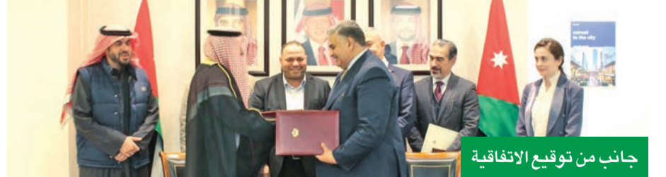
جانب من توقيع الاتفاقية

في نطاق مجلس الوحدة الاقتصادية العربية، الذي أنشأته جامعة الدول العربية. وتهدف الاتفاقية إلى تأسيس مقر للاتحاد في الأردن، من أجل تعزيز الشراكة وتطوير برامج التعاون وتبادل الخبرات مع الاتحاد في قطاع تجارة الذهب والمجوهرات وصناعتها.