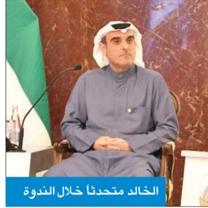
الخالد متحدثاً خلال الندوة

شارك في إطلاق «اللحة العامة للعمل الإنساني العالمي» لـ 2025