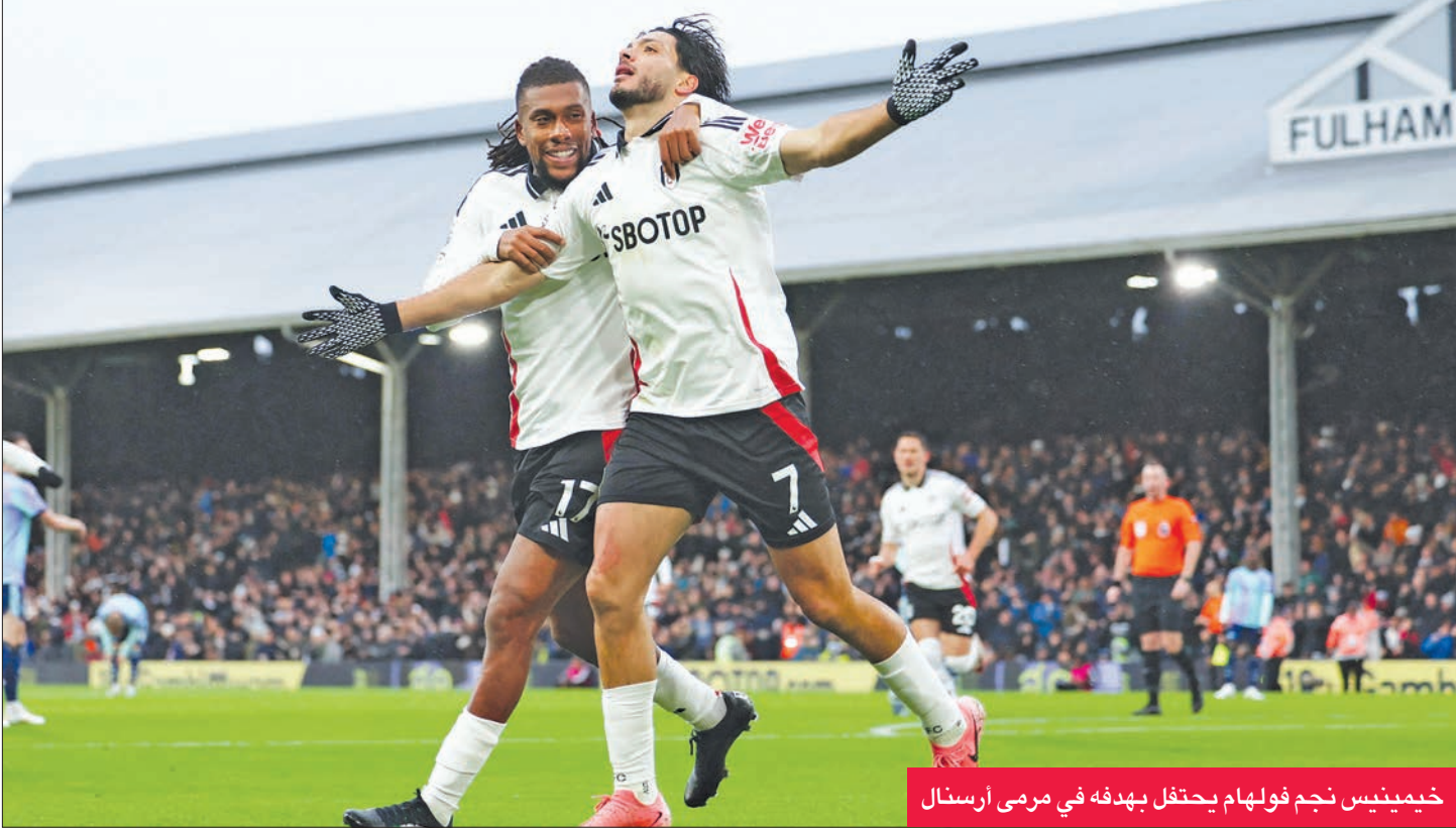
خيمينيس نجم فولهام يحتفل بهدفه في مرعى أرسنال

الجريج ليستر سيتي من الهزيمة الثامنة للموسم بإدراكه التعادل أمام الضيف برايتون 2 - 2، في لقاء تقدم خلاله الأخير بهدفين نظيفين للغاني تاركي لامبتي (37) والبديل الغامبي ياكوبي مينيتي (79)، قبل أن يعيد المخضرم جايمي فاردي أصحاب الأرض إلى الأجواء (86).