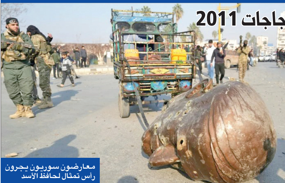
معارضون سوريون يجرون رأس تمثال لحافظ الأسد

الخارج، وبدا في 2012 استخدام الأسلحة الثقيلة ولاسيما المروحيات والطائرات. واتهم الغرب طائفة النظام السوري باستخدام الأسلحة الكيميائية، وهو ما نفته دمشق على الدوام. بموجب استفتاء شعبي في 2012، أقر دستور جديد قدمته السلطات في إطار إصلاحات هدفت لتهدئة