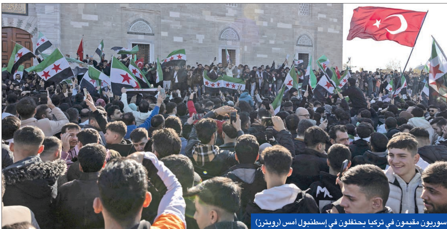
سوريون مقيمون في تركيا يحتفلون في إسطنبول أمس