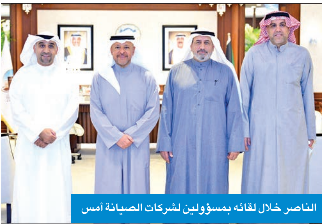
الناصر خلال لقائه بمسؤولين لشركات الصيانة أمس