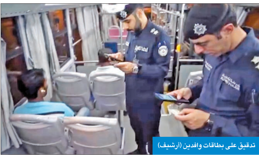
تدقيق على بطاقات وافدين (أرشيف)