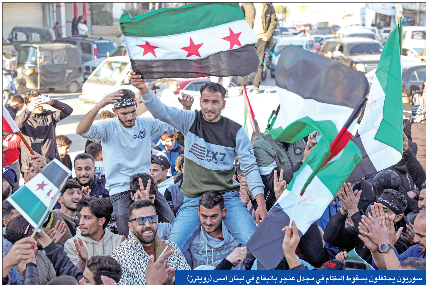
سوريون يحتفلون بسقوط النظام في مجدل عنجر بالبقاع في لبنان أمس

طوبت حقبة حكم عائلة الأسد التي استمرت أكثر من نصف قرن في سورية بعد تمكن الفصائل المعارضة من الاستيلاء على العاصمة دمشق عقب 11 يوماً من هجوم حافظ بدهته من الشمال وإبرامها اتفاقاً مع رئيس الحكومة لتسليم السلطة. أمس، في وقت احتفل سوريون في الداخل ولاجنون بالخارج بالحلقة التاريخية التي تباينت ردود الفعل الدولية بشأنها.