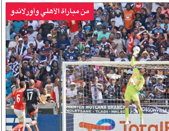
من مباراة الأهلي وأورلاندو

«فيفا» يخطر القلعة الحمراء بمواعيد مونديال الأندية