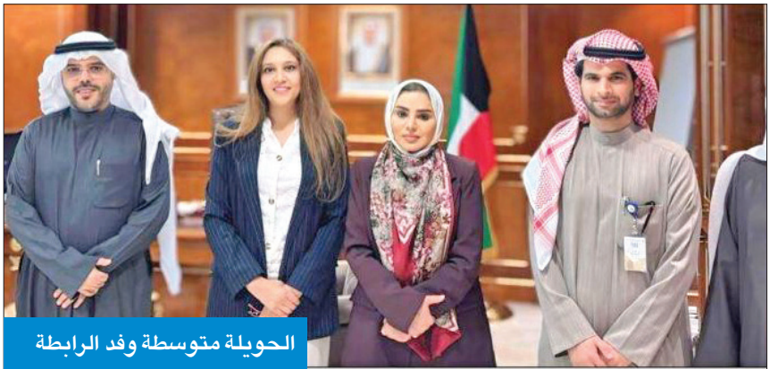
الحويلة متوسطة وفد الرابطة

الرابطة: عرضنا على الوزارة برنامج الإدارة اللوجستية لتأهيل الطلبة