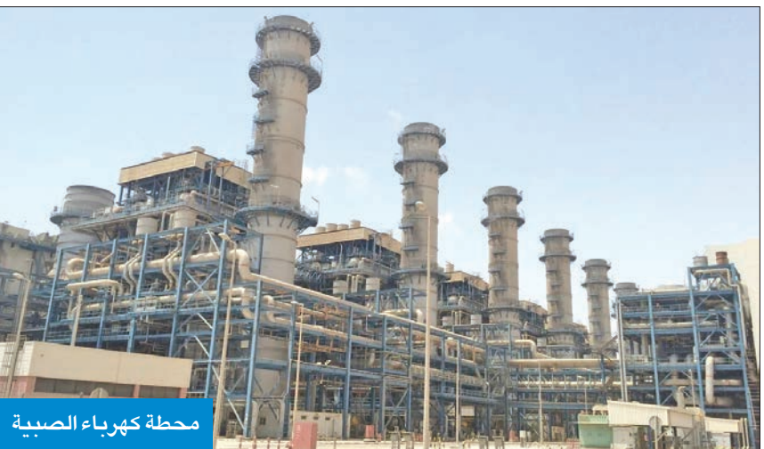
محطة كهرباء الصبية

حصلت على موافقة «المالية» و«الفتوى والتشريع» وتدفع للإنجاز