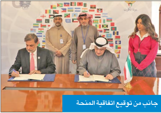
جانب من توقيع اتفاقية المنحة

وقع اتفاقية منحة مع «الصحة العالمية» بـ 5 ملايين دولار