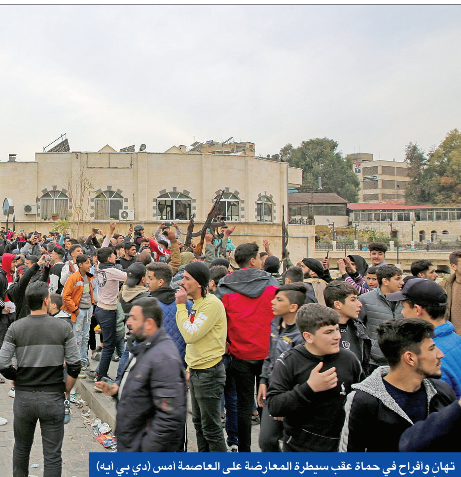
تهانٍ وإفراح في حماة عقب سيطرة المعارضة على العاصمة أمس