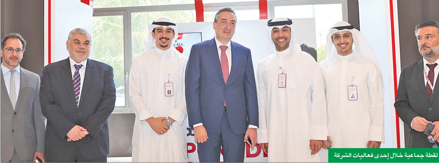
لقطة جماعية خلال إحدى فعاليات الشركة

استثمرت بأكثر من 200 موظف... ومدة التدريب تجاوزت 2700 ساعة