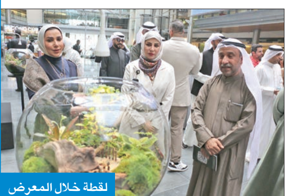
لقطة خلال المعرض

وأعربت الخضران عن فخرها بهذا المجهود الفني الرائع، مؤكدة دعم وزارة التربية والتعليم لتشجيعها المستمر لها.