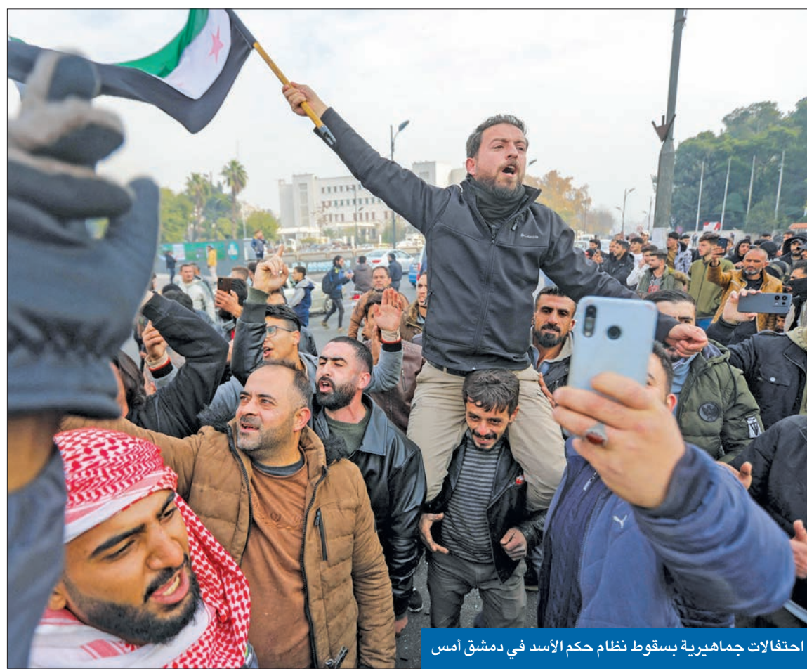
احتفالات جماهيرية بسقوط نظام حكم الأسد في دمشق أمس

المعارضة تتفق مع رئيس الحكومة على تسليم السلطة وتضع خطوطاً عريضة للمرحلة الانتقالية