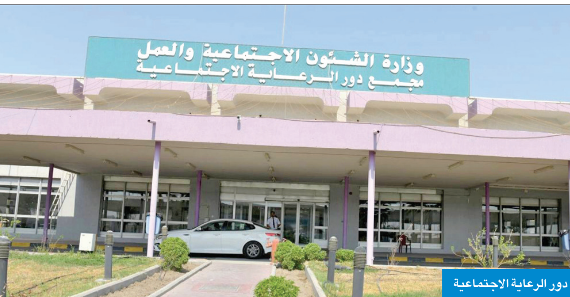
دور الرعاية الاجتماعية

بالمخالفة لقرار مجلس الخدمة المدنية رقم 12 لسنة 2012.