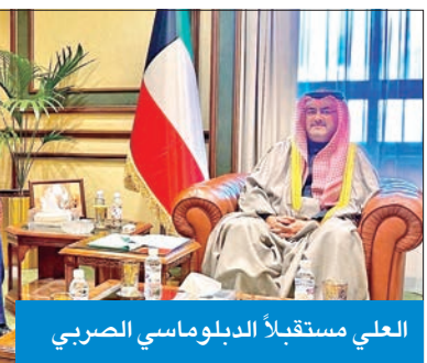
العلي مستقبلاً الدبلوماسي الصربي

والشعب الكويتي على الحفاوة التي تحظى بها البعثة الدبلوماسية لجمهورية صربيا لدى البلاد، معرباً عن