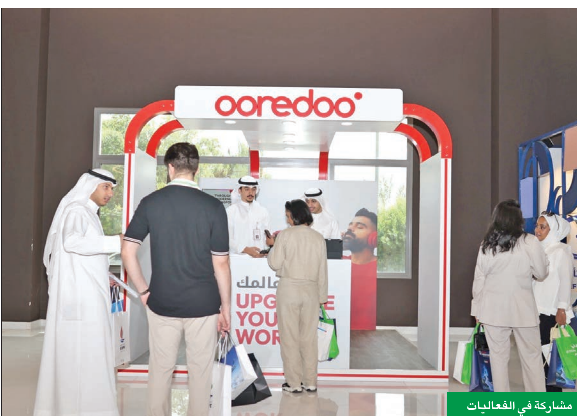
مشاركة في الفعاليات