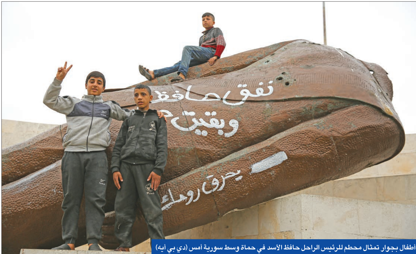
أطفال بجوار تمثال محطم للرئيس الراحل حافظ الأسد في حماة وسط سورية أمس

أعلن الائتلاف الوطني لقوى الثورة والمعارضة السورية، أمس، تاريخ 8 ديسمبر من كل عام عيداً وطنياً لسورية. وقال الائتلاف، في بيان نشره على موقعه الإلكتروني، «تعلن تاريخ الثامن من ديسمبر من كل عام عيداً وطنياً لسورية، لأنه يوم انتصار الشهداء والضحايا، يوم انتصار المعتقلين والمهجّرين والمظلومين، يوم انتصار الحق والعدالة على الإجرام والظلم».