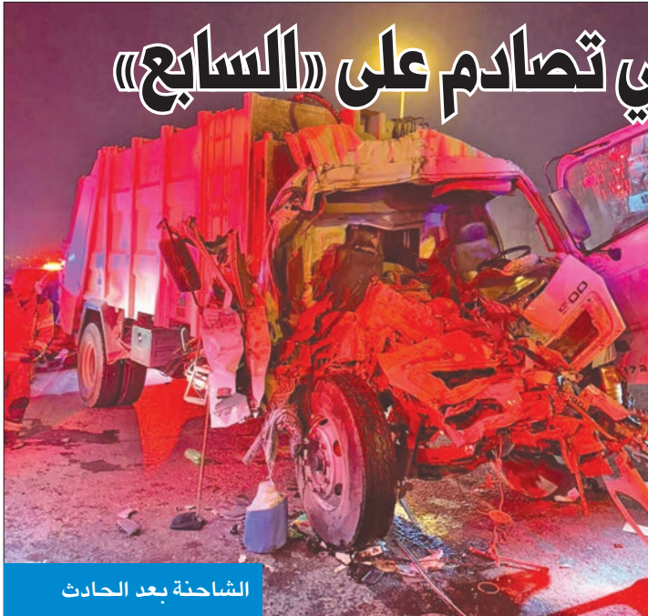
الشاحنة بعد الحادث

وجّهت مركز إطفاء الاستقلال إلى موقع الحادث، وقد تبين لرجال الإطفاء، فور وصولهم، أن الحادث تمثل في تصادم بين نساء رمل وشاحنة نقل قمامة، وأن هناك حالتين وفاة و5 إصابات. وذكرت أن رجال الإطفاء عملوا على إنقاذ المصابين، الذين كانوا محشورين من جراء قوة الاصطدام، وتسليمهم إلى فني الطوارئ الطبية الذين أحالوهم إلى المستشفى لتلقي العلاج، لافتة إلى انخساح جثتين وتسليمهما إلى رجال الأدلة الجنائية الذين أحالوهم بدورهم إلى إدارة الطب الشرعي.