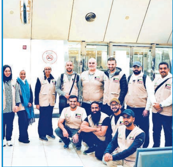
الفرق المشاركة في الحملة

يعتزم عدد من الفرق التطوعية العاملة تحت مظلة الهيئة الخيرية الإسلامية العالمية تنظيم سلسلة من الأنشطة والفعاليات الإنسانية في ثلاث دول، تشمل الكويت وأوزبكستان وكازاخستان، بهدف تعزيز قيم العمل التطوعي، ونشر رسالة العطاء والتضامن الإنساني. ففي الكويت، ستشهد الأنشطة زحماً كبيراً، حيث تنظم الفرق حملة للبرع بالدم وتنظيم زيارة وأنشطة ترفيهية في مركز ملازمة داو، وتوزيع كسوة الشتاء على العمالة والمرضى المحتاجين. أما على المستوى الدولي فستشارك الفرق في توزيع كسوة الشتاء على كل من