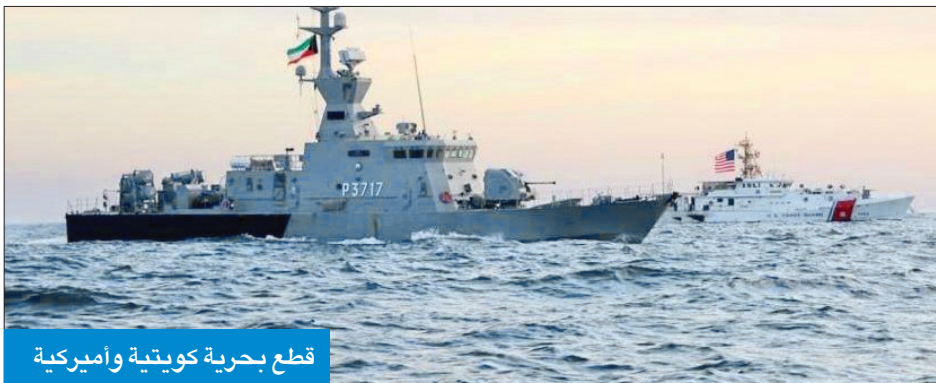
قطع بحرية كويتية وأميركية

نفذت قوة الواجب المختلطة 152 بقيادة القوة البحرية الكويتية، بمشاركة خفر السواحل والطيران العمودي التابع لوزارة الداخلية، وقوة من البحرية الأميركية، عملية مركزة باسم «درع البحر» خلال الفترة من 2 إلى 3 الجاري بمنطقة شمال الخليج العربي.