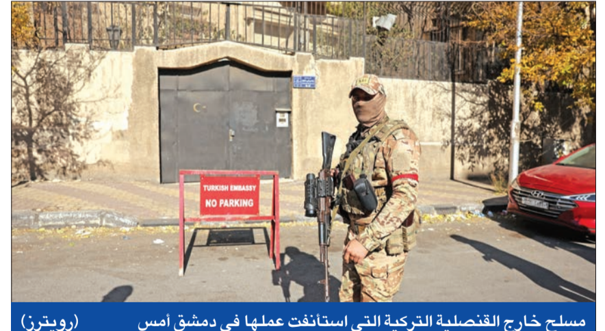
مسلح خارج القنصلية التركية التي استأنفت عملها في دمشق أمس

من جهته، حَصَّ مبعوث الأمم المتحدة، خلال لقاء مع وزير الخارجية الأميركي، القوى الخارجية على بذل الجهود لتجنب انهيار المؤسسات الحيوية السورية. وأعرب بيدرسن عن تأييده لعملية سياسية «موثوقة وشاملة» لتشكيل الحكومة المقبلة بدمشق، مشدداً على ضرورة الحصول على المساعدات الإنسانية في أقرب وقت ممكن، وأضاف: «إذا تمكنا من تحقيق ذلك فربما تكون هناك فرصة جديدة للشعب السوري». وخلال لقائه بيدرسن، قال بيلينكن إن الأمم المتحدة «تؤدي دوراً حاسماً» في المساعدات الإنسانية وحماية الأقليات السورية، لافتاً إلى أن واشنطن تعمل مع الشركاء في المنطقة