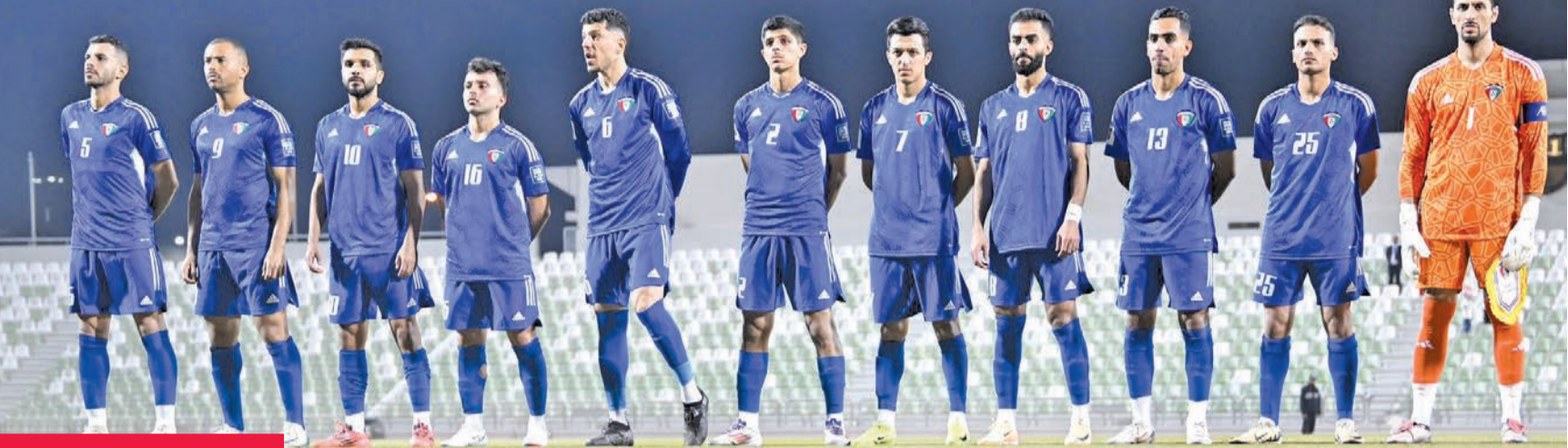
منتخب الكويت الأول لكرة القدم