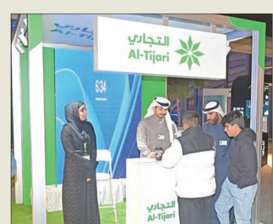
جناح البنك في الفعالية

قدم البنك التجاري الكويتي رعايته التكنولوجية لفعالية «فوق السحاب» Above the Clouds، النسخة الجديدة من معرض «بقشة ماركت»، الذي يُعد من أوائل المعارض والفعاليات التي تقام بالأماكن المكشوفة في الكويت. واستهدفت الفعالية دعم المشاريع الشبابية الوطنية من خلال أكبر مهرجان كويتي. وأقيم المعرض على سطح قاعة العاصمة على مدى ثلاثة أيام. وأتت مشاركة «التجاري» في هذا المعرض ضمن برنامجها الهادف لدعم المواهب والكفاءات والشباب والمشاريع الصغيرة، والإسهام في إعداد جيل جديد من الشباب الكويتيين المبدعين في مجالات العمل الخاص، ودعم وتنمية مواهبهم وقدراتهم، إضافة إلى توفير المعدات واللوازم الأساسية لهم، كما يسعى بنك برقان دائماً إلى التعاون مع العديد من الجهات ودعم الأنشطة والمبادرات والفعاليات المجتمعية التي تسلط الضوء على الأشخاص من ذوي الإعاقة.