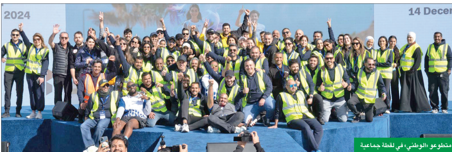
متطوعو «الوطني» في لقطة جماعية