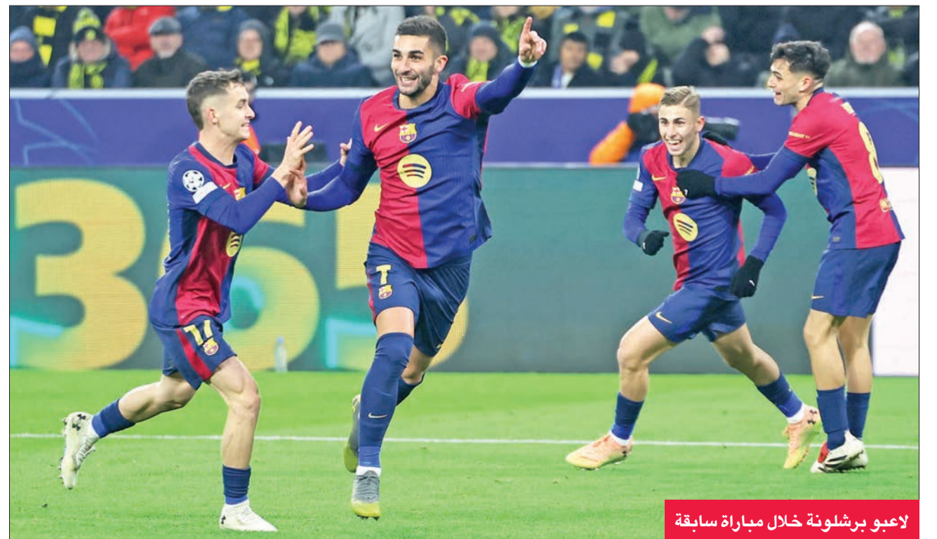
لاعبو برشلونة خلال مباراة سابقة

يبعث برشلونة عن استعادة زخمه محليا بعد تحقيقه انتصارا واحدا في آخر خمس مباريات بالدوري الإسباني لكرة القدم، عندما يستقبل