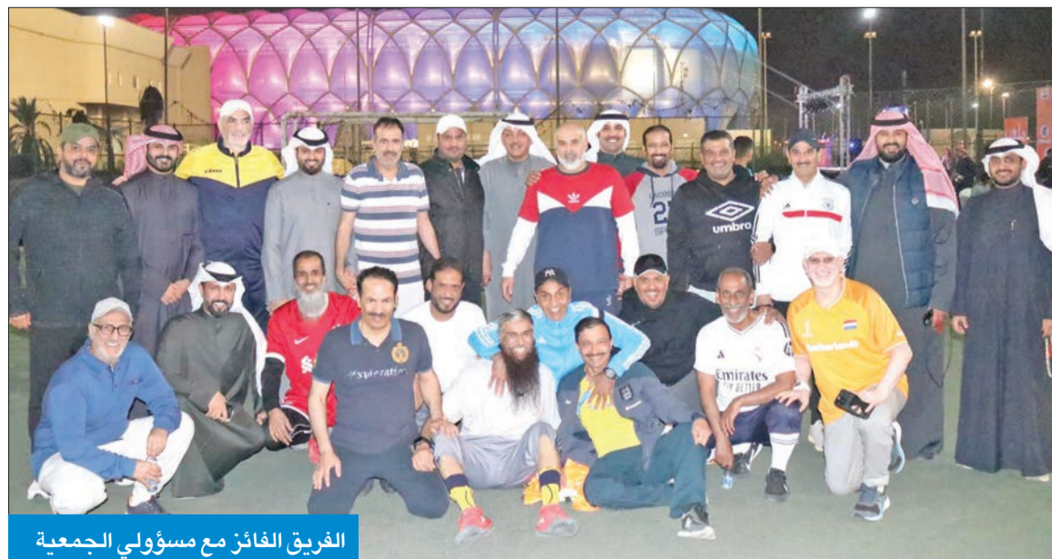
الفريق الفائز مع مسؤولي الجمعية