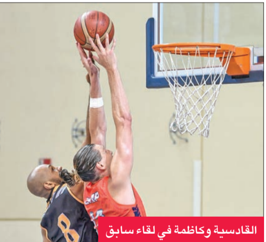
القادسية وكازمة في لقاء سابق

يتصدر الكويت الدوري برصيد 8 نقاط، يليه القادسية والنصر بـ 6 نقاط لكل منهما، ثم كازمة (5 نقاط)، يليه الصليبيخات والقرين بـ 4 نقاط لكل منهما، ثم العربي والبروم والنضامن بـ 3 نقاط لكل فريق. جدير بالذكر أن الفرق الأربعة