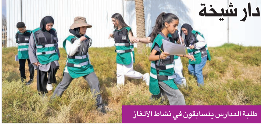
طلبة المدارس يتسابقون في نشاط الألبان

تميّزت النسخة السادسة من مسابقة «إيكوكويست» (Eco-Quest)، بتركيزها على قضية اللاجئين العرب في كل من فلسطين وسورية ولبنان واليمن والسودان، بهدف حثّ طلاب المدارس الثانوية على ابتكار حلول بيئية ومبادرات مجتمعية إنسانية تضمن تحسين الأوضاع المعيشية للاجئين.