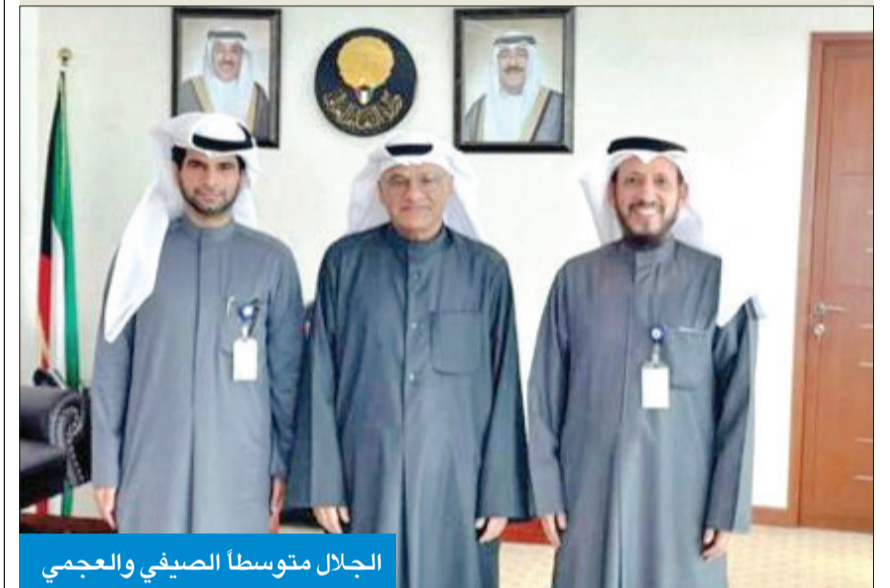
الجلال متوسطا الصفي والعجمي

دعم البرامج الجديدة في هندسة الكمبيوتر والأمن السيبراني