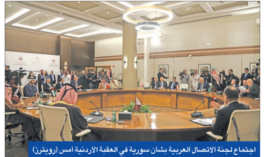
اجتماع لجنة الاتصال العربية بشأن سورية في العقبة الأردنية أمس (رويترز)