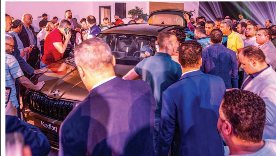
جانب من الحضور مع شكودا كودياك