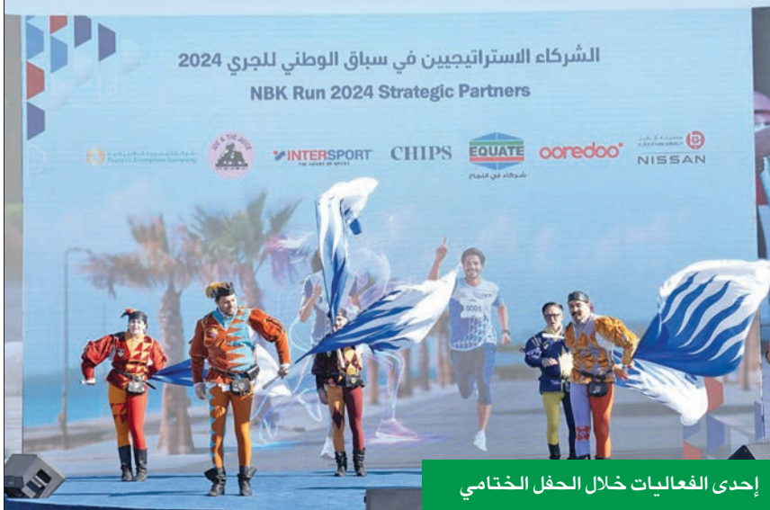
إحدى الفعاليات خلال الحفل الختامي