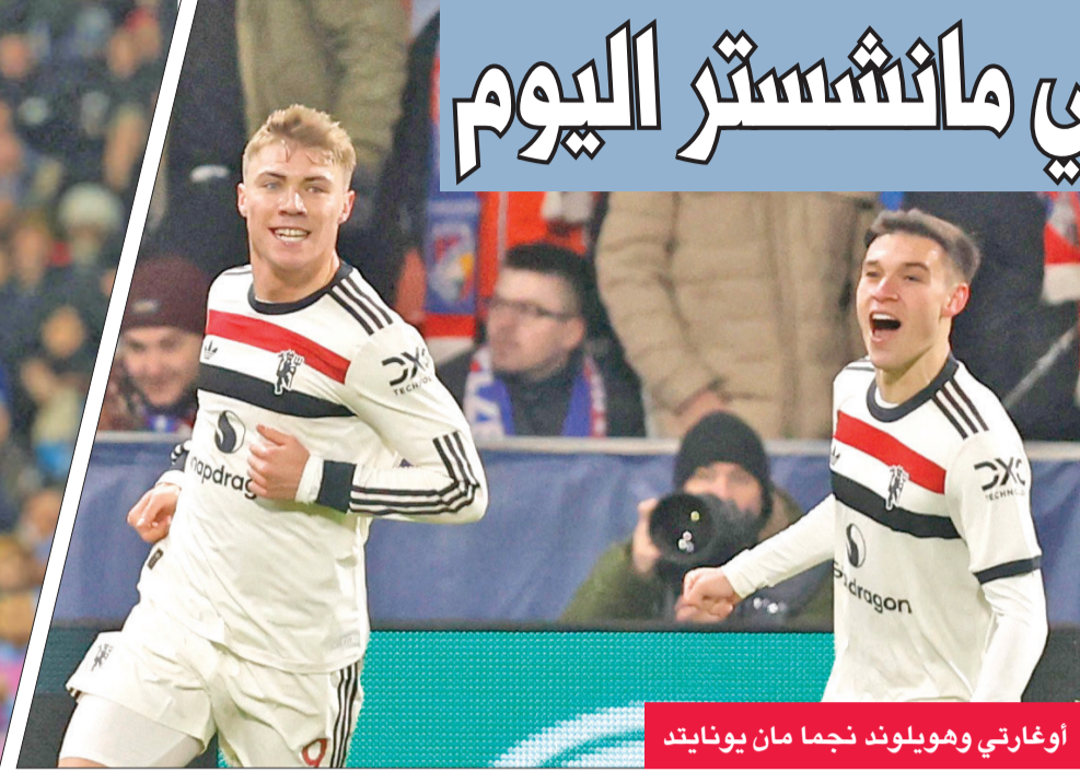
أوغارتي وهولوند نجما مان يونايتد

ستتجه الأنظار اليوم إلى استاد الاتحاد، حيث يتواجه مانشستر سيتي (حامل اللقب) مع ضيفه وغريمه مانشستر يونايتد في ديربي المدينة، في المرحلة السادسة عشرة من الدوري الإنجليزي لكرة القدم. وفي مواجهة بين فريقين يعانيان الأمرين حتى في ظل التغيير الفني الذي طرأ على منصب المدرب في يونايتد، يسعى سيتي وجاره إلى تنفس الصعداء حين يلتقيان في مواجهة يأمل من خلالها حامل اللقب إيجاد نفسه بعد الهوة التي سقط فيها مؤخرا.