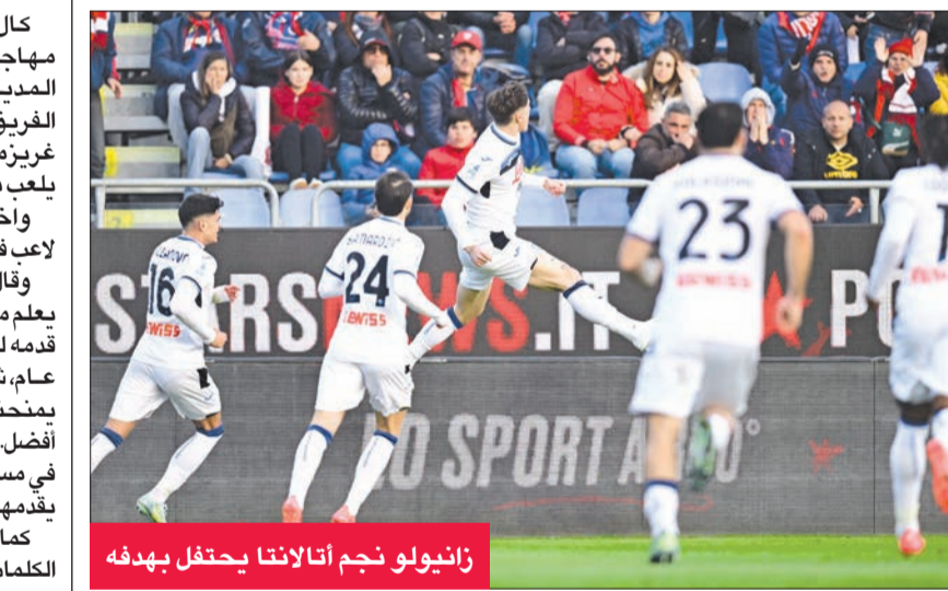
زانيولو نجم أتلانطا يحتفل بهدفه

قال الأرجنتيني خوليان ألفاريز، مهاجم اتلتيكو مدريد الإسباني، المدير لزميله وشريكه في هجوم الفريق مدريد، الفرنسي أنطوان غريزمان، «يجعل الجميع يلعب بشكل أفضل». واختير النجم الأرجنتيني أفضل لاعب في الليغا عن شهر نوفمبر. وقال ألفاريز في تصريحاته «الجميع يعلم مدى قيمة وأهمية أنطوان كل ما قدمه لهذا النادي، ولكرة القدم بشكل عام، بشرط لي اللعب بجواره هو يمنحنا الكثير، ويجعلنا نلعب بشكل أفضل. أتمنى أن يستمر معنا، ويستمر كل مساهماته بمثل هذه الأشياء التي يقدمها». كما وجه صاحب الـ 24 عاماً بعض الكلمات لجماهير «الروخيبالانكوس» مؤكدا أنها سبب كبير في حصوله على هذه الحائزة. وقال في هذا الصدد «بعيدا عن أهمية الجانب الجماعي، هذه الجوائز الفردية تساعد على اكتساب مزيد من