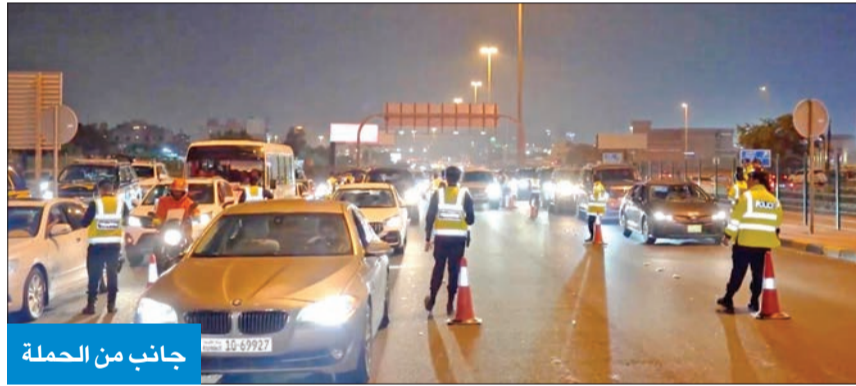
جانب من الحملة