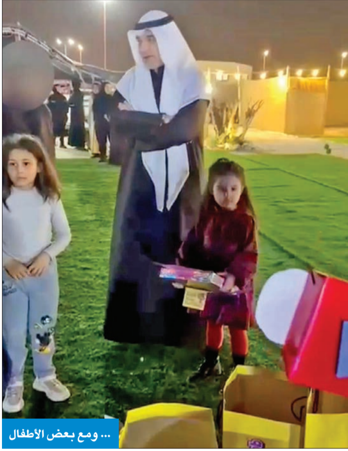
... ومع بعض الأطفال

افتتح النائب الأول لرئيس مجلس الوزراء وزير الدفاع وزير الداخلية، الشيخ فهد اليوسف، المخيم الربيعي للنزيلات المؤسسات الإصلاحية، ضمن إطار جهود «الداخلية» لتعزيز البرامج التأهيلية والتفهيبة للنزيلات. وأكد اليوسف، في تصريح خلال الافتتاح، أن هذه المبادرات تأتي ضمن التزام الوزارة بالمعايير الدولية لحقوق الإنسان، وبما