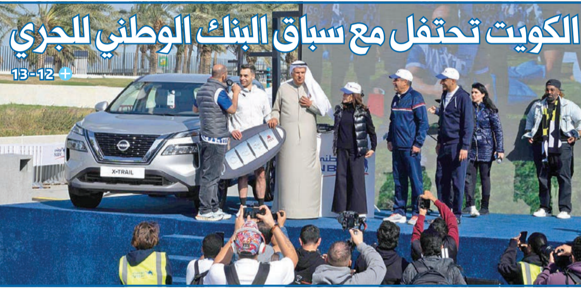
الكويت تحتفل مع سباق البنك الوطني للجري

استعرض تقريراً يحذر من تزايد فرص ضربة أميركية - إسرائيلية لـ «النووي» ● مخاوف من عدم قدرة الأمن الإيراني على قمع أي احتجاجات مقبلة... وقلق من تمدد تركيزه بالإقليم ● عراقجي يدعو إلى انفتاح سريع وملحوظ تجاه ترامب قبل فوات الأوان