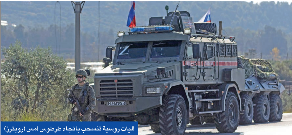
ليات روسية تنسحب باتجاه طرطوس أمس

روسيا تسحب قوات وأسلحة باتجاه ليبيا... وتركيا تتمسك بالقضاء على الميليشيات الكردية