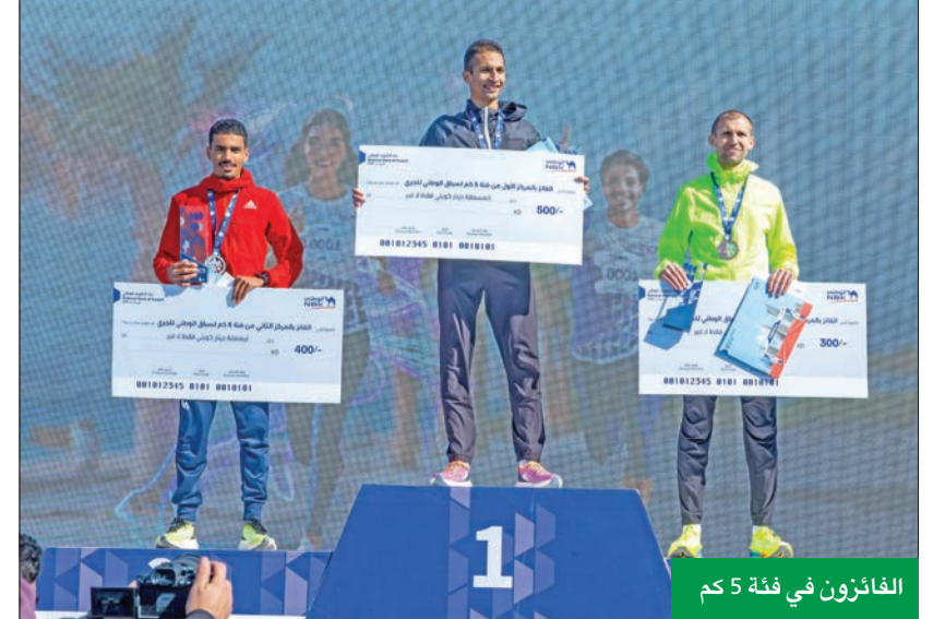
الفائزين في فئة 5 كم