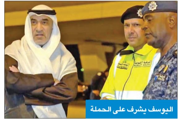
اليوسف يشرف على الحملة