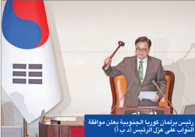
رئيس برلمان كوريا الجنوبية يعلن موافقة النواب على عزل الرئيس

أقر البرلمان في كوريا الجنوبية، أمس، مذكرة لعزل الرئيس يون سوك يول، على خلفية محاولته الناشئة لفرض الأحكام العرفية في الثالث من ديسمبر الجاري، والتي أعادت شبح الحكم العسكري الدكتاتوري إلى إحدى حلفاء الولايات المتحدة الرئيسيين في آسيا. وصوّت 204 نواباً لمصلحة المذكرة بينما عارضها 85 نائباً، وامتنع ثلاثة عن التصويت، وأبطلت ثمانية بطاقات تصويت، وفق النتائج التي أعلنتها رئيس البرلمان. ووافق البرلمان على عزل الرئيس بعد أن انضم 12 عضواً على الأقل في حزب «سلطة الشعب»، المحافظ الحاكم، الذي ينتمي إليه يون إلى المعارضة التي تسيطر على 192 من أصل 300 مقعد في البرلمان المكون من غرفة واحدة، وبذلك اكتمل نصاب الثلثين اللازم لإجراء العزل. وبينما عمّت الفرحة عشرات آلاف المتظاهرين الذين تجمعوا أمام مبنى الجمعية الوطنية بانتظار التصويت، اعتبر زعيم «الحزب الديموقراطي» الذي يقود المعارضة، بارك تشان داي أن «إجراءات العزل اليوم تمثل انتصاراً عظيماً للشعب والديمقراطية». وبهذا التصويت، عُلق عمل الرئيس يون في انتظار قرار المحكمة الدستورية المصادقة على فصله. ومن المقرر أن يتولى رئيس الوزراء هان دوك سو مهام منصبه مؤقتاً. «إحباط شديد» وأمام المحكمة الدستورية الآن 180 يوماً للمصادقة على تصويت البرلمان، وإذا