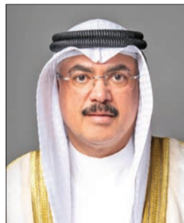
سيد جلال الطببائي

قبل البدء في تطبيقها. وذكرت المصادر أن الوزير الطببائي وجه بضرورة العمل على إدخال التعديلات المطلوبة من قبل التواحيه، لتكون المناهج جاهزة وقابلة للتطبيق في العام الدراسي 2026 / 2025.