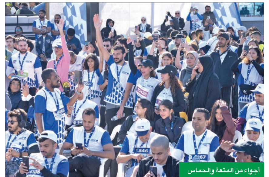
أجواء من المتعة والحماس

بالتعاون مع «أمنية» لإعادة التدوير، وحرصاً من بنك الكويت الوطني على أداء مسؤولياته المجتمعية، تم وضع صناديق مخصصة لتجميع قوارير المياه البلاستيكية على امتداد مسافة السباق، وصولاً إلى نقطة النهاية. كما قامت «أمنية» خلال السباق بتوزيع قوارير مياه معاد تدويرها لنشر الوعي بأهمية الحد من استهلاك البلاستيك والمساهمة في خلق مجتمع أكثر استدامة، وهو ما يتسجم مع رسالة بنك الكويت الوطني والالتزامه كبنك صديق للبيئة بهذه السلوكيات والممارسات.