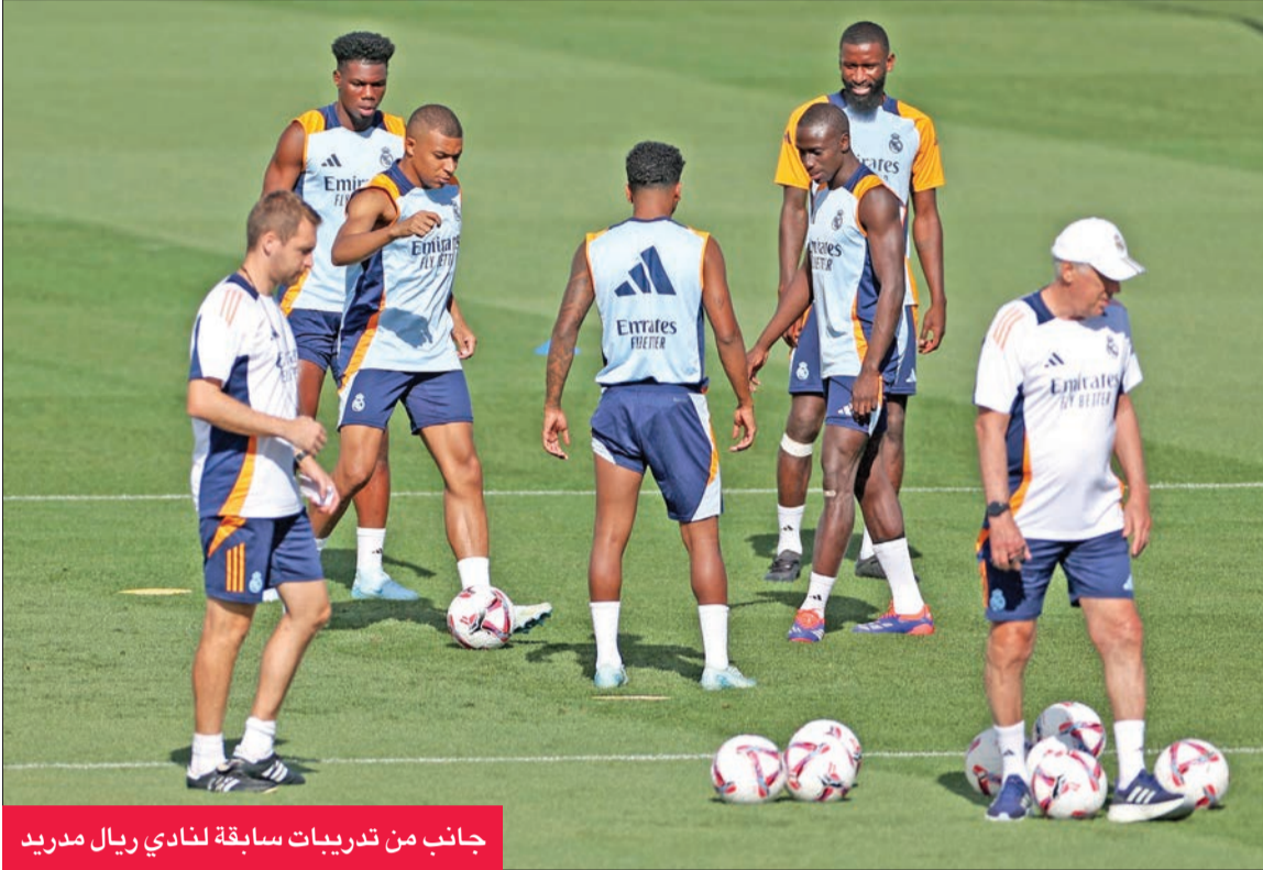
جانب من تدريبات سابقة لنادي ريال مدريد

ولم يسبق لأي فريق مكسيكي (سواء في كأس الإنتركونتيننتال أو من منظمة الكونكاكاف أن أحرز لقب أي مسابقة عالمية للأندية)