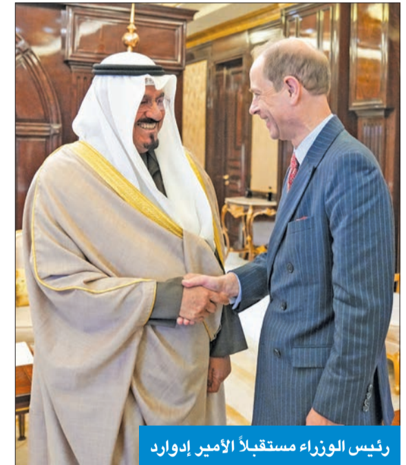
رئيس الوزراء مستقبلاً الأمير إدوارد