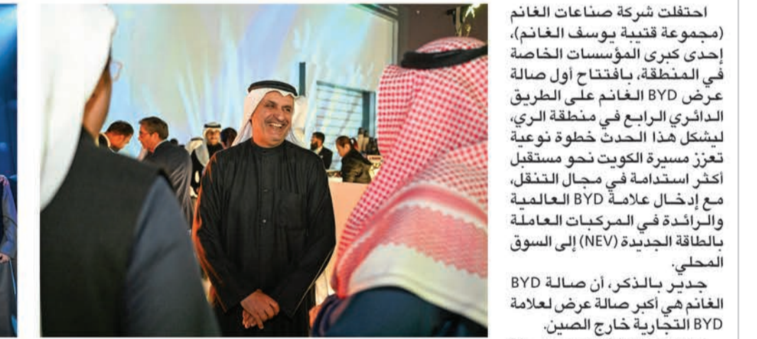
جدير بالذكر، أن صالة BYD الغانم هي أكبر صالة عرض لعلامة BYD التجارية خارج الصين.

احتفلت شركة صناعات الغانم (مجموعة قتيبة يوسف الغانم)، إحدى كبرى المؤسسات الخاصة في المنطقة، بافتتاح أول صالة عرض BYD الغانم على الطريق الدائري الرابع في منطقة الري، ليشكل هذا الحدث خطوة نوعية لتعزيز مسيرة الكويت نحو مستقبل أكثر استدامة في مجال التنقل، مع إدخال علامة BYD العالمية والرائدة في المركبات العاملة بالطاقة الجديدة (NEV) إلى السوق المحلي. جدير بالذكر، أن صالة BYD الغانم هي أكبر صالة عرض لعلامة BYD التجارية خارج الصين. ويزامن هذا الافتتاح مع مرحلة مفصليّة في تاريخ BYD، إذ أعلنت الشركة أخيراً إنتاج مركبتها رقم عشرة ملايين من فئة المركبات العاملة بالطاقة الجديدة، وهو إنجاز عالمي غير مسبق. وباعتبارها رائدة في مجال الطاقة النظيفة، تسهم BYD بابتكاراتها المتقدمة والمسؤولة بيئياً في صياغة ملامح مستقبل التنقل حول العالم. من جهتها، تتسجم هذه الخطوة مع التوجه الاستراتيجي لشركة صناعات الغانم نحو استكشاف فرص جديدة في مجال الطاقة والاستدامة، بما يعكس التزامها الراسخ بالابتكار والتميز في قطاع السيارات وغيره من القطاعات الواعدة. حضر حفل الافتتاح سفير الصين لدى الكويت، تشانغ جيانوي، الذي أشاد ببهذه الشراكة، وما تعكسه من دمج لقيم التميز وخدمة العملاء التي تتميز بها «صناعات الغانم» مع الابتكار المتقدم