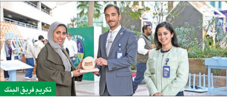
تكريم فريق البنك

ولا تزال هذه المناسبة فقط ثقافة الاستدامة، بل تعتبر منصة ملهمة للشباب ورواد الأعمال الذين يسعون لتطوير أفكارهم ومشاريعهم، بما يتماشى مع معايير التنمية المستدامة. وساهم البنك، من خلال دعم مثل هذه المبادرات، في تشجيع الجيل القادم على الابتكار، وتبني الأفكار التي تخدم البيئة والمجتمع. ويواصل «الوطني» ريادته في مجال الاستدامة في الكويت، معززاً دوره في دعم التنمية الاقتصادية المستدامة وإحداث تأثير إيجابي في المجتمع.