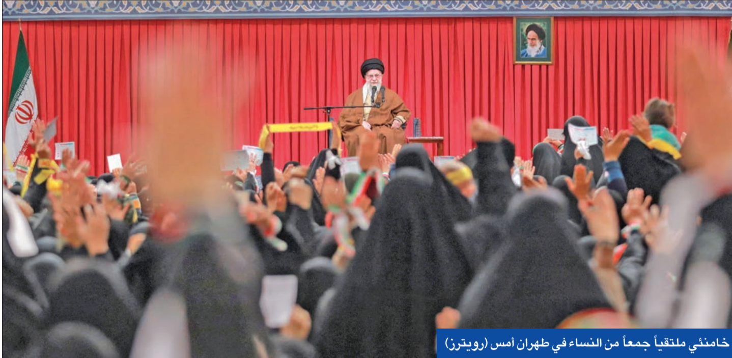
خامنئي ملتقىاً جمعاً من النساء في طهران أمس