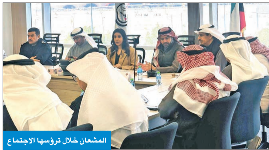
المشعان خلال رؤسها الاجتماع

من طرف المقاول، بالتنسيق مع استشاري العقد والجهاز الإداري في الوزارة والجهات الحكومية ذات الصلة.