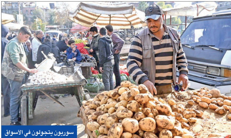
سوريون يتجولون في الأسواق

التي تبعد حوالي كيلومترين عن المنطقة العازلة في الجولان المحتل.