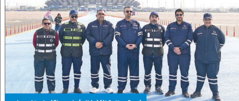
فريق وزارة الأشغال أمام مواقف استاد جابر

من جهته، أكد المتحدث الرسمي باسم الوزارة، المهندس أحمد الصالح، أن الوزارة أكملت جميع الأعمال المكلفة بها في وقت قياسي، بما في ذلك صيانة مواقف استاد جابر ونوفير 20 مدخلاً ومخرجاً لخدمة مواقف السيارات.