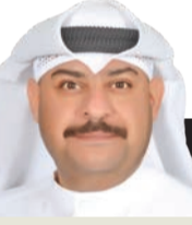
د. سلطان ماجد السالم

حين تتشكل الحكومات حول العالم نجد أنها تأتي وهي تسابق الزمن لتثبّت للشارع المحلي والعالم أمرين رئيسيين: الأول يتصل فيما يتعلق بتطبيقات ذات مدة محددة من خلال مشاريع حيوية تنموية ترقى لتطلعات المواطن والمقيم، والثاني يتعلق بقيام تلك الحكومات بالعمل على إصلاحات مختلفة سواء كانت اقتصادية أو فنية وخلافه، كل هذا يتم من خلال برنامج عمل تلك الحكومة الذي يطرح أمام العامة وكل السلطات والبرلمان للقيام بمراقبته ومحاسبة المسؤولين عنه، ويسبب الوضع الاستثنائي الذي نمر به بتعليق البرلمان حالياً، نجد أن الحكومة الحالية تقوم بأعمال السلطتين التنفيذية وما يتصل بالتشريعية كذلك، ولكن دون رسم واضح للملاح الخاصة بالمرحلة المقبلة. توقعنا جميعا بعد تشكيل الحكومة الحالية أن تتسابق لإسكات أصوات المعتزدين من خلال طرح برنامج عمل تكاملي وفي ذي طابع سياسي واقتصادي واجتماعي كما يسبق له منيل، يكون هذا البرنامج لافتاً لأنظار العالم ومبهوراً إلى حد المثالة السياسية، يركز على جوانب مختلفة لم نر مثلها أبدا، طبعاً كل هذا لم يتحقق بتاتا ولم نر شيئا من المقابيل، بل على العكس مرت أسابيع وشهور طويلة وأخبار بيان البرنامج الخاص بعمل الحكومة (بيص الوضع) سيطرح قريباً، وإن الوزارة والوزير الفلاني أو العالاني يضع اللمسات الأخيرة والنهائية عليه، هذا كله الآن في مهب الريح ولا فائدة نرجوها منه بتاتا، إذ طال الأمد والوعد وأصبحنا الآن ننتظر أي التزام وملاحم للخطة الحكومية القادمة من خلال طرح برنامج عملها لنفهم أين نحن منجهون وإلى ماذا تحديداً.