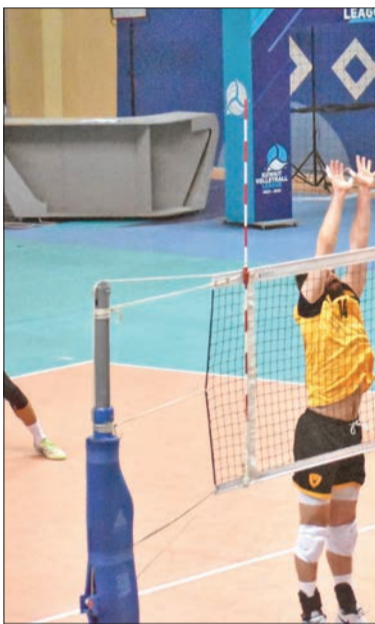
جانب من مباراة القادسية وكاظمة