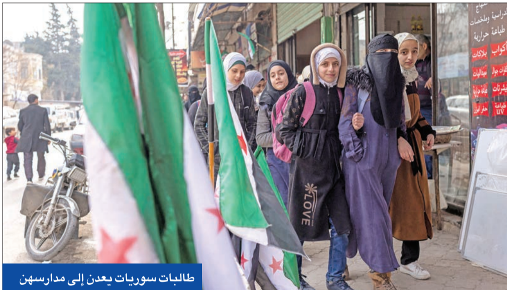
طالبات سوريات يعدن إلى مدارسهن

● الجولاني يلمح لتجنيس المقاتلين الأجانب ويرفض نظام الحصص للطوائف ● حشود عسكرية تركية على حدود منبج وكوباني بعد فشل جهود أميركية لوقف النار