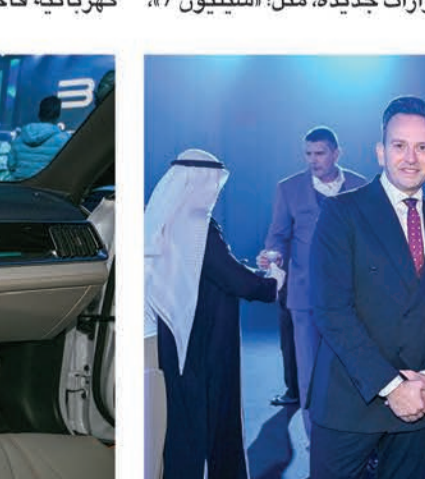
سعادة سفير جمهورية الصين الشعبية لدى دولة الكويت، السفير تشانغ جيانوي