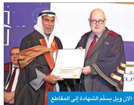
الآن ويل يسلم الشهادة إلى المقاطع

ويهدف المؤسسة، لتلقي كلية القانون الكويتية العالمية ورئيسها وإدارتها، النهائي على هذا الإنجاز المتميز والمتمجد، من أعضاء مجلس الأمناء ومجلس الكلية ولجنة العمداء، إضافة إلى أعضاء الهيئتين التدريسية والإدارية؛ مما يوضح أن عمليات ضمان الجودة لديها قابلة للمقارنة مع أفضل الممارسات الدولية، بمستوى يضاهي الجامعات العالمية.