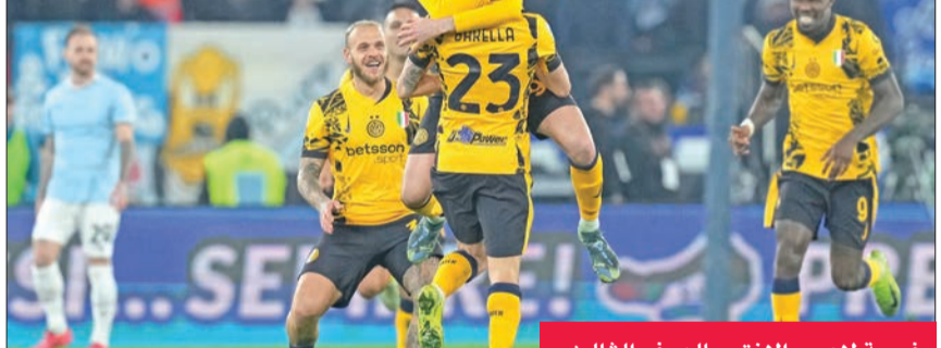
فرحة لاعبي إنتر بالهدف الثالث

أوغلو من ضربة جزاء، حصل عليها إنتر ميلان بعد لمسة يد من ماتيا زاكاني لاعب لاتسيو داخل منطقة الجزاء، وفي الدقيقة الأخيرة من الشوط الأول، سجل فيديريكو ديماركو الهدف الثاني لإنتر ميلان، حيث تلقى عرضية رائعة من زميله ديزيزيل دومفريس، ليسدها مباشرة في الشباك. وواصل إنتر ميلان تألقه في الشوط الثاني، ونجح في إضافة الهدف الثالث عن طريق نيكولو باربلا في الدقيقة 51، الذي سدّد كرة قوية جدا من خارج منطقة الجزاء لتسكن شباك لاتسيو، وأسفر ضغط إنتر المستمر وأداؤه الرائع على أرض الملعب عن تسجيله