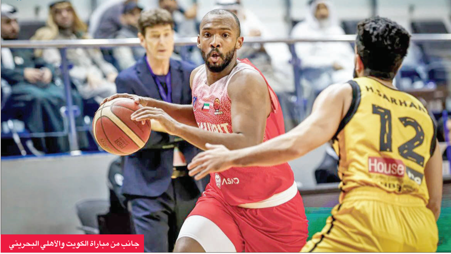
جانب من مباراة الكويت والأهلي البحريني