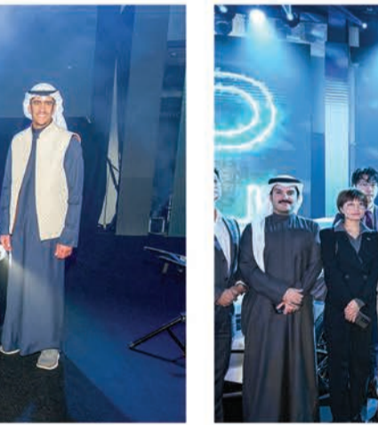
صورة جماعية للفريق بي واي دي الغانم مع وفد بي واي دي الزائر من الصين