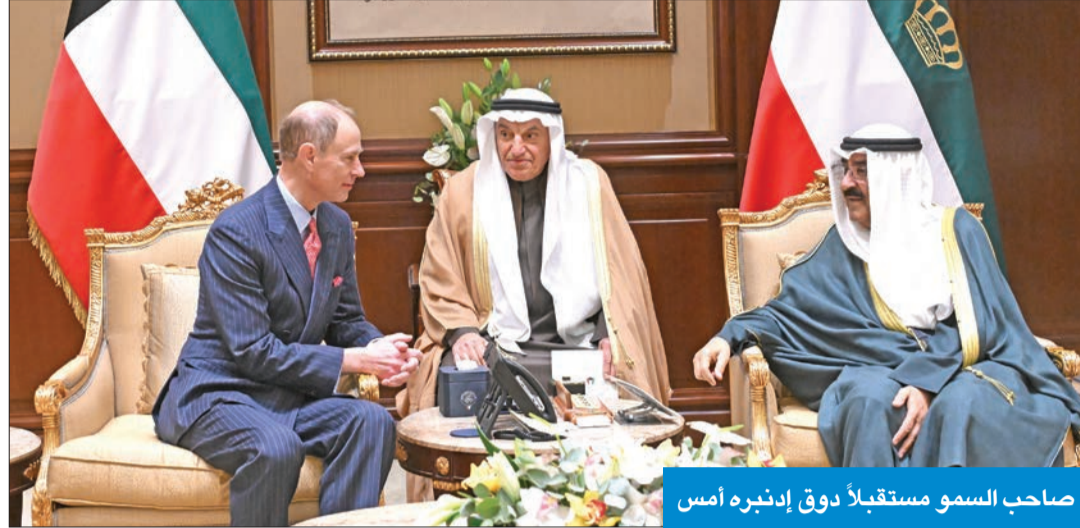
صاحب السمو مستقبلاً دوق إدنبره أمس

استقبل سمو أمير البلاد الشيخ مشعل الأحمد بقصر بيان، ظهر أمس، دوق إدنبره الأمير إدوارد والوفد المرافق، بمناسبة زيارته الرسمية للبلاد. وتسلم سموه رسالة خطية من ملك المملكة المتحدة تشارلز الثالث، تتعلق بالعلاقات التاريخية والوطيدة الراضخة بين دولة الكويت والمملكة المتحدة في جميع المجالات، بما يعكس عمق العلاقات المتينة بين الشعبين والبلدين الصديقين، وسبل تعزيزها في كل الصعد والمجالات. كما تضمنت الرسالة دعوة سموه لزيارة المملكة المتحدة، وقد حمله صاحب السمو تحياته وتقديره للملك تشارلز الثالث، وتمنياته له بموفور الصحة والعافية، ولبلوتان وشعبها الصديق كل التقدم والازدهار.