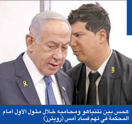
همس بين نتنياهو ومحاميه خلال مثول الأول أمام المحكمة في تهمة فساد (أمس (رويترز)

على مستوى أعلى، وأضاف أن أكبر فجوة لا تزال تتمحور حول عدد الرهائن الذين سيتم إطلاق سراحهم كجزء من الاتفاق. وتسارعت وتيرة الدفع نحو الاتفاق منذ فوز ترامب في الانتخابات الرئاسية، وأجرى مبعوث ترامب للشرق الأوسط (ستيفن ويتكوف) محادثات مع نتنياهو ورئيس الوزراء القطري محمد بن عبد الرحمن في الأسابيع الأخيرة لدفع المفاوضات قدماً. كما التقى نتنياهو أمس الأول، آدم بوهرلر، (مبعوث ترامب لشؤون الرهائن)، خلال زيارة خاصة قام بها بوهرلر إلى إسرائيل، وفقاً لما ذكره مكتب نتنياهو.