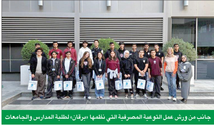
جانب من ورش عمل التوعية المصرفية التي نظّمها «برقان» لطلبة المدارس والجامعات

في تعزيز استراتيجيته بمجال الحوكمة البيئية والاجتماعية والمؤسسية (ESG).