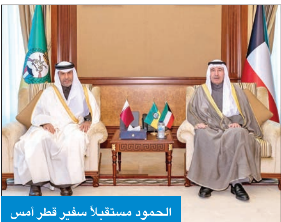
الحمود مستقبلاً سفير قطر أمس

رئيس الحرس الوطني يشيد بالروابط التاريخية والعلاقات المتميزة مع قطر