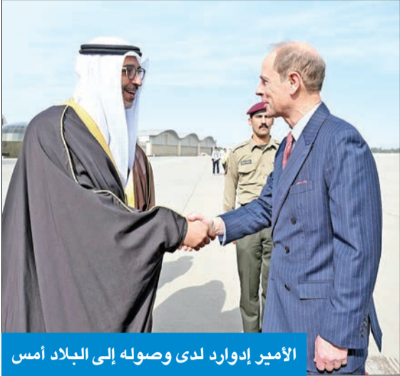
الأمير إدوارد لدى وصوله إلى البلاد أمس

سموه استقبل دوق إدنبره وحمله تحياته إلى الملك وتمنياته للمملكة المتحدة بالتقدم والازدهار