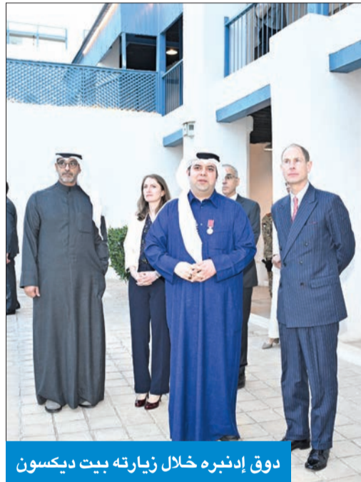
دوق إدنبره خلال زيارته بيت ديكسون