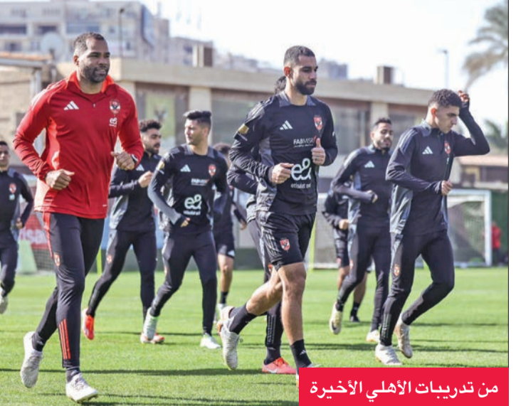
من تدريبات الأهلي الأخيرة