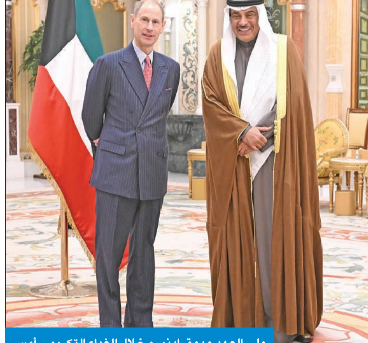
ولي العهد ودوق إدنبره خلال الغداء التكريمي أمس

استقبل سمو ولي العهد، بقصر بيان ظهر أمس، دوق إدنبره الأمير إدوارد والوفد المرافق، بمناسبة زيارته الرسمية للبلاد، وحضر اللقاء كبار المسؤولين بالدولة.