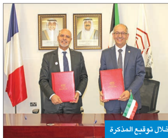
خلال توقيع المذكرة

وصرح أرتيبة بأن الجامعة مؤسسة ناشئة تضم 3 من أعرق الجامعات الفرنسية والمؤسسات التعليمية، وأنها تحتل محل تعاوان مشتركة مع الجامعات الفنية في العالم في مجال البحوث وتبادل الخبرات الأكاديمية لتعليم المنفعة بين جميع الأطراف. وأكد أرتيبة سعي الجامعة للتعاون مع كلية الكويت للعلوم والتكنولوجيا، لتشمل الفعاليات الأكاديمية مثل المؤتمرات والمنتديات العلمية على مستوى دولي.