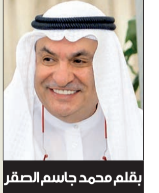
بقلم محمد جاسم الصقر

جنسية الإنسان هي هويته وكيانه وانتماؤه، ومن حقه بل من الواجب عليه أن يتمسك بها بكل ما أوتي من قدرة وأن يدافع عنها ما استطاع إلى ذلك سبيلاً... هذا لكل شعوب الأرض عامة، ولشعب الكويت بصفة خاصة؛ إذ لا يمكن لأحد أن يزايد على هذا الشعب في وطنيته، لأننا بخلاف معظم شعوب الأرض مررباً بتجربة مريرة وخضناً في تاريخنا الحديث نيران غزو أظهرت معدن هذا الشعب ونقاء عنصره ومدى ولائه لوطنه، فكانت خير برهان على حبه لبلاده. ومنذ البداية نقر بأن أمر منح الجنسية أو سحبها إنما هو قرار سيادي، وليقينا بتلك السيادة فيها نحن نقاش شأنها بهدوء وعقلانية وموضوعية بعيداً عن التعصب لهذا الرأي أو ذاك، أمليين إقرار الحق لمستحقه، وسحبها ممن زور أو تلاعب أو تحايل على القانون ليأخذ ما ليس له، شاذين على أيدي المسؤولين بالتصدي للتلاعبات التي لا تماري في أنها قد حدثت بالفعل، وترتب عليها منح الجنسية لمن لا يستحقها، وهذا الصنف هو من يجب أن توجه إليه حملة سحب الجنسية، دون أن تمتد لتشمل من حصل عليها بالطرق القانونية التي أقرتها الإدارة العامة دون أن