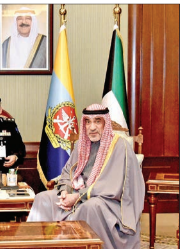
جانب من أحد اللقاءات أمس

من جهتهم، أعرب السفراء عن شكرهم وتقديرهم للناخب الأول على حسن الاستقبال، وأشادوا بالدور المحوري لدولة الكويت في تعزيز الأمن الإقليمي، مؤكداً حرص بلدانهم على تطوير أفاق التعاون مع دولة الكويت في كل المجالات، بما يسهم في تحقيق المصالح المشتركة بين الجانبين.