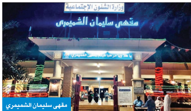
مقهى سليمان الشميمري

الذي دائماً مَيَّز المقاهي الموزعة على جميع المحافظات.