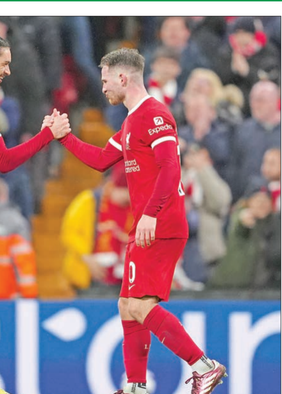
ماك اليستر ونونيز نجما لليفربول

الثالثة له هذا الموسم خلال تعادل لليفربول 2-2 مع فولهام في الدوري الإنجليزي الممتاز السبت الماضي. وقال سلوت لصحافيين، قبل المباراة التي تقام على ملعب سانت ماري، «إذ تم إيقافك في هولندا فلن يُسمح لك بالوجود في أو حول غرف تبديل الملابس أو التحدث مع وسائل الإعلام، هذه نسخة أخف من الإيقاف»، مضيفا: «أود أن أقول إنني أعدت على ذلك، لكن هذه المرة الأولى التي أتعرض فيها للإيقاف». واستدرك: «ما زلت قادرا على القيام بالأشياء التي أريد القيام بها. أقل تأثير لك على فريقك يكون خلال المباراة، وأكثر تأثير يكون بين الشوطين وقيل المباراة». متابعا: «الوضع المثالي هو أن أكون على خط التماس، لكنني حصلت على بطاقة صفراء، والتي ربما كنت أستحقها أيضا لذلك نعم، هذا يحدث». وفي باقي مباريات اليوم يلعب أرسنال مع كريستال بالاس، ونيوكاسل مع برينتفورد.