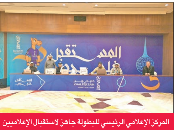
المركز الإعلامي الرئيسي للبطولة جاهز لاستقبال الإعلاميين

التيتم: اللجنة العليا اختارت بعناية مجموعة من اللجان العاملة