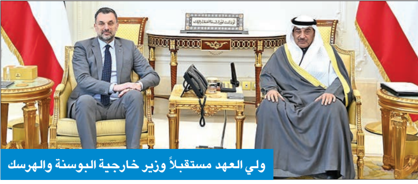
ولي العهد مستقبلاً وزير خارجية البوسنة والهرسك

استقبل سمو ولي العهد الشيخ صباح الخالد، بقصر بيان أمس، وزير خارجية البوسنة والهرسك، المدين كونوكوفيتش، والوفد المرافق، وذلك بمناسبة زيارته الرسمية للبلاد. حضر اللقاء وزير الخارجية عبدالله الجيا، ومدير مكتب سمو ولي العهد الفريق المتقاعد جمال الذياب، ووكيل الشؤون الخارجية بديوان سمو ولي العهد مازن العيسى، ونائب مساعد وزير الخارجية لشؤون أوروبا محمد يعقوب حياتي. بعث سمو ولي العهد ببرقية