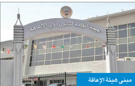
مبنى هيئة الإعاقة

إجراءات قانونية حيال «التسكين» المخالف لضوابط ديوان الخدمة