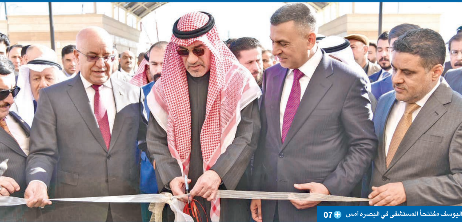
اليوسف مفتحاً المستشفى في البصرة أمس 07

اليوسف خلال الافتتاح في البصرة: روابط أخوية عميقة بين البلدين ومشاريع أخرى في الطريق