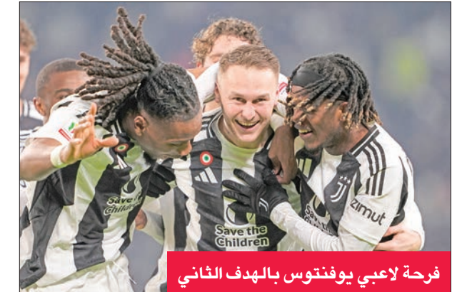
فرحة لاعبي يوفنتوس بالهدف الثاني

جديد على الصعيد المحلي، بعدما تعادل في مبارياته الأربع الأخيرة بالدوري، إذ لم يتذوق طعم الانتصار منذ أكثر من شهر، وتحديدًا منذ مواجهة дерبي أمام توريانو (2 - 0) في 9 نوفمبر الفائت. ويدين فريق «السيدة العجوز» بتأهله للصربي دوشان فلاهوفيتش