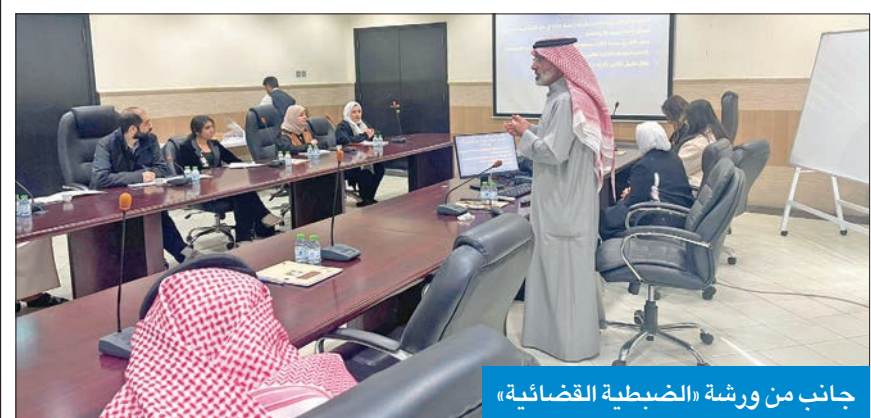
جانب من ورشة «الضبطية القضائية»

الاداء الرقابي لعمل الموظفين ممن لديهم الضبطية القضائية واستخدامها بحق مخالفات التشوينات في أنظمة السلامة البلدية وأجهزة البلدية للعمل كفريق واحد، تالياً للأخطاء القانونية التي تغير ليساً ولغلاً، وإعطاء الفهم الصحيح لهذه الأنظمة.