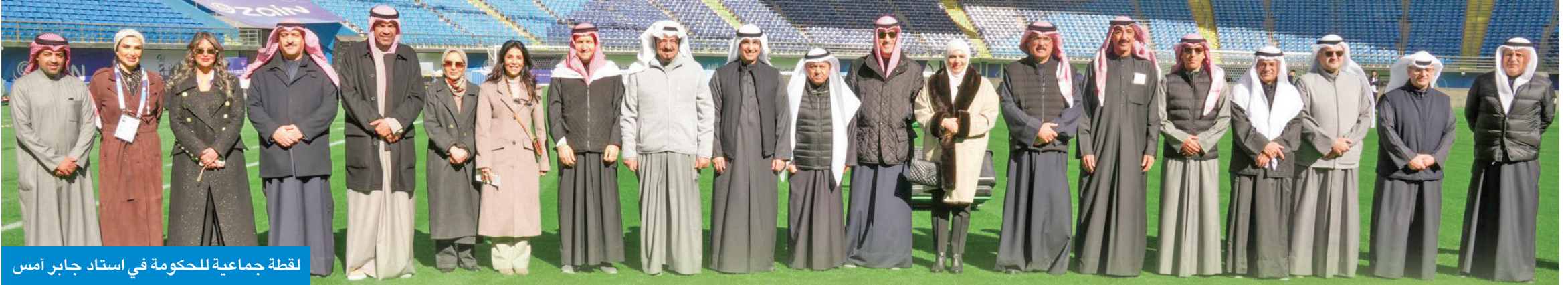
لقطة جماعية للحكومة في استاد جابر امس

مجلس الوزراء عقد اجتماعه الأسبوعي في قاعة الاجتماعات باستاد جابر