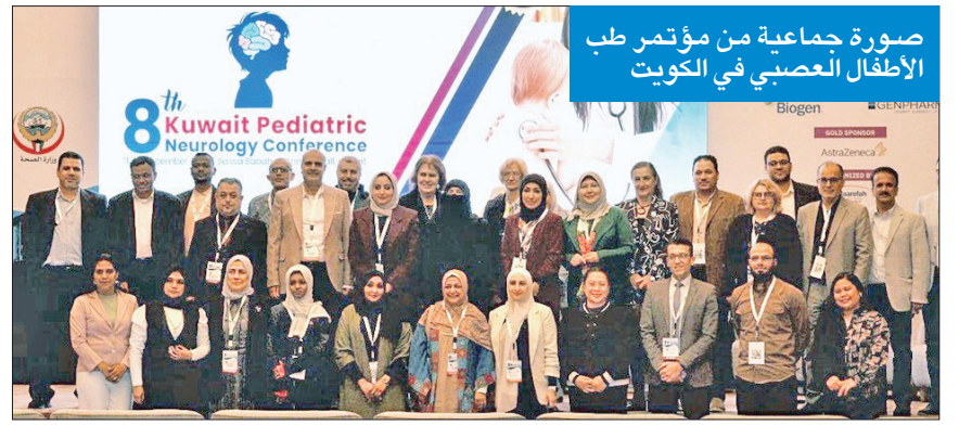
صورة جماعية من مؤتمر طب الأطفال العصبي في الكويت

المطوع: ثمرة التعاون مع «الصحة» و«روش»... وملتزمون بأحدث العلاجات