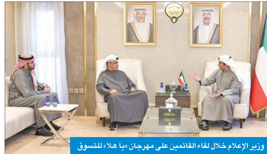
وزير الإعلام خلال لقاء الفائزين على مهرجان «يا هلا» للتسوق

«يجمع بين الإبداع والابتكار في الترويج للمنتجات الوطنية ودعم الأنشطة التجارية»