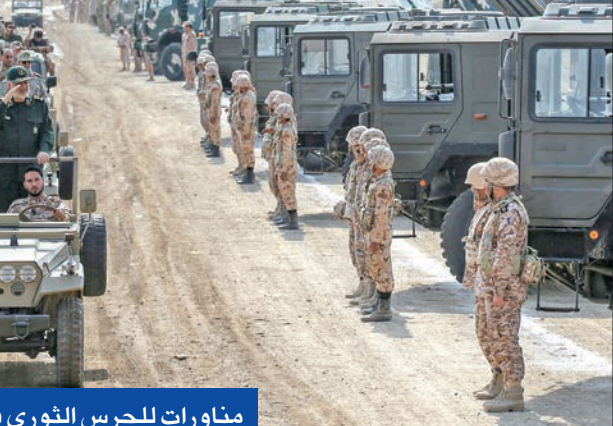
مناورات للحرس الثوري في أذربيجان الشرقية