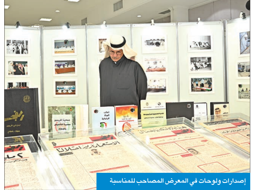
إصدارات ولوحات في المعرض المصاحب للمناسبة

وأكد أنه يوجد مليون كويتي كويتي بعد الغزو و42 في المئة من الكويتيين أقل من 19 عاماً، وهذا