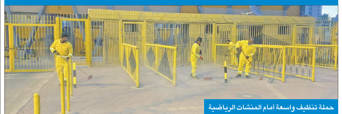
حملة تنظيف واسعة امام المنشآت الرياضية

بمحافظة حوالي بالاستعانة بـ 105 عمال كنس و13 لية وتوزيع 25 حاوية تنوعت ما بين الحجم الكبير والصغير لتنظيف الطرق الرئيسية والداخلية والساحات في محيط نادي البرموك الرياضي بمنطقة مشرف ونادي القادسية الرياضي والساحات المحيطة بفندق ريجنسي ورايسون بلو، وستليها أعمال تنظيف مواقع أخرى في بقية محافظات البلاد.