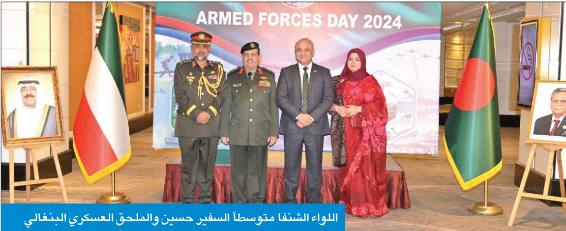
اللواء الشنفا متوسلاً السفير حسين والملحق العسكري البنگالي

الأعمال البناءة والتنمية الكويت. وتابع «إن قواتنا المسلحة هي رمز للفخر ورمز للثقة والأطمئنان، ومساهمتها في أنشطة بناء الأمة وإدارة الكوارث ومهام الأمن الداخلي تحظى بتقدير كل مواطن بنغلاديشي». وأكد أن «يوم القوات المسلحة الذي يوافق 21 نوفمبر له أهمية خاصة ليس فقط لأفراد القوات المسلحة البنغلاديشية، ولكن أيضاً لشعب بنغلادش، إذ إنه يدل على الأهمية القصوى للرفقة باللعلاقة الودية الطويلة الأمد لمحاربة العدو بشكل جماعي. بدوره، قال سفير بنغلادش لدى الجبل، اللواء سيد طارق