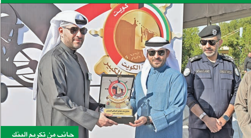
جانب من تكريم البنك