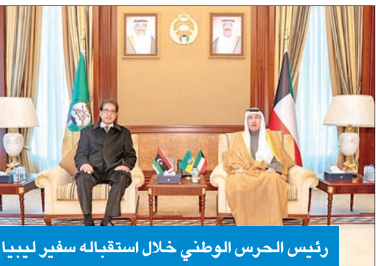
رئيس الحرس الوطني خلال استقباله سفير ليبيا

استقبل رئيس الحرس الوطني، الشيخ مبارك الحمود، في ديوانه بالرئاسة العامة للحرس، سفير ليبيا لدى الكويت سليمان الساحلي، حيث قدم له التهنئة لحصوله على ثقة القيادة السياسية، وتعيينه رئيساً للحرس.