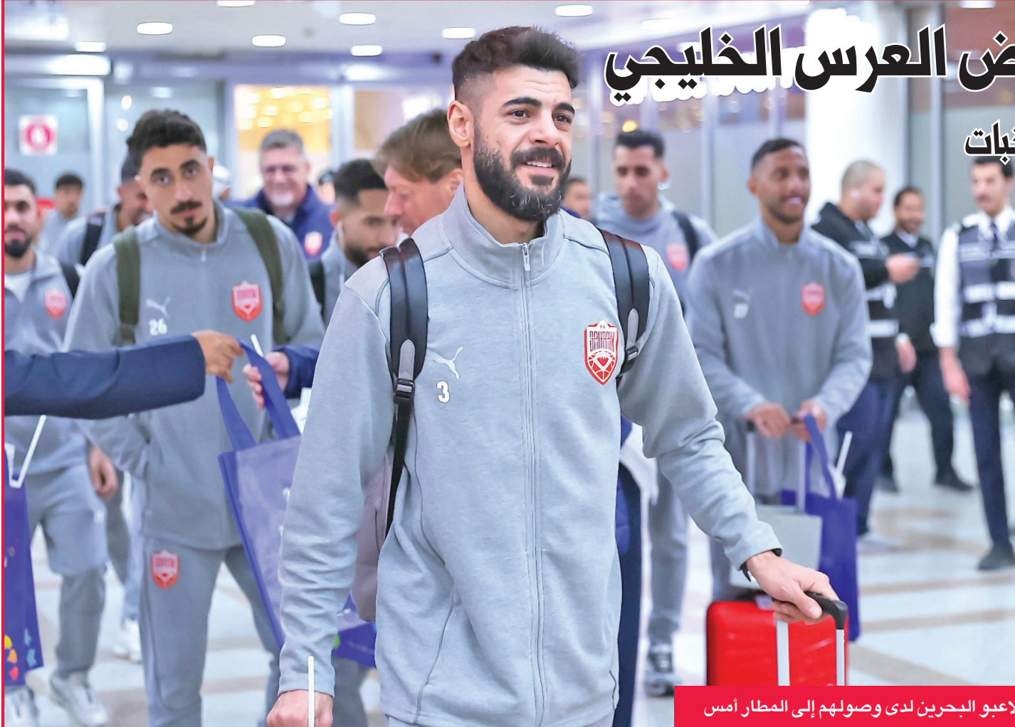
لاعبو البحرين لدى وصولهم إلى المطار أمس

مدرب الأحمر تالاييتش: الفرص متساوية لكل المنتخبات