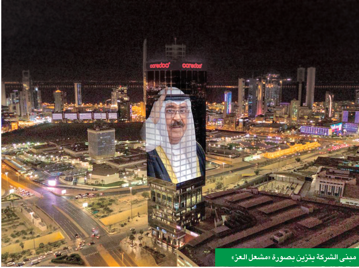
مبنى الشركة يتزين بصورة «مشعل العز»