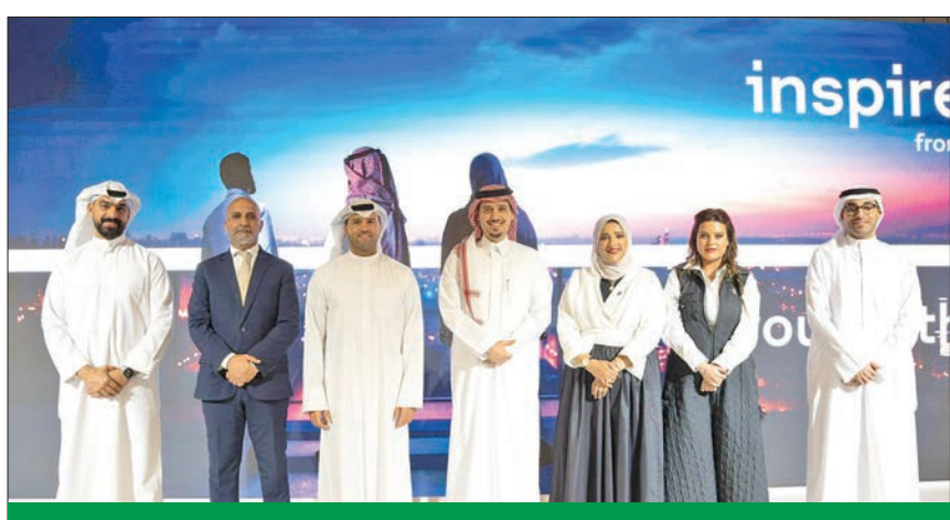
الإدارة التنفيذية في الشركة مع الفائزين من برنامج inspireU الكويت المشاركين في حفل التخرج

بفضل جودة مخرجاتها، أصبحت inspireU وجهة رائدة لصناديق الاستثمار الجريء المحلية والدولية. وتساهم هذه المبادرة في بناء جسور تربط بين الابتكار وفرص الاستثمار العالمية.