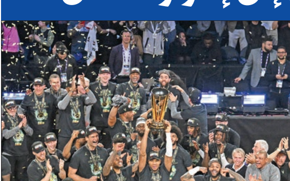
جانب من مراسم تتويج ميلووكي باكس

بات ميلووكي باكس ثاني بطل لمسابقة كأس دوري كرة السلة الأمريكي للمحترفين (إن بي إيه)، بفوزه الثلاثاء في لاس فيغاس على أوكلاهوما سيتي ثاندر 97-81 في النهائي، بفضل النجم اليوناني يانيس أنتيتوكونومو والثلاثيات. وكان التسديد من خارج القوس مفتاح إحراز باكس النسخة الثانية من المسابقة وخلافة لوس أنجلوس ليكرز، الذي توج بلقب النسخة الأولى العام الماضي، إذ نجح في تسجيل 17 ثلاثية، فيما تعلق تحمه يانيس بتسجيل 26 نقطة مع 19 متابعة و10 تمريرات حاسمة، وأضاف داميان ليلارد 23 نقطة. كما ساهم بروك لوبين وغاري ترنت في هذا الانتصار، بعدما سجل كل منهما 13 نقطة لمصلحة باكس، الذي وسع تقدمه بفارق 5 نقاط في الشوط الثاني إلى 19، بعدما نجح في 19 نقطة مقابل 5 فقط لثاندر، الذي اكتفى بـ 31 نقطة في النصف الثاني من اللقاء، ما فتح الباب أمام منافسه لحسم المواعدة. ورغم جهود الكندي شاي غيلجوس-الكسندر وجابلين وليامس، اللذين سجلاً