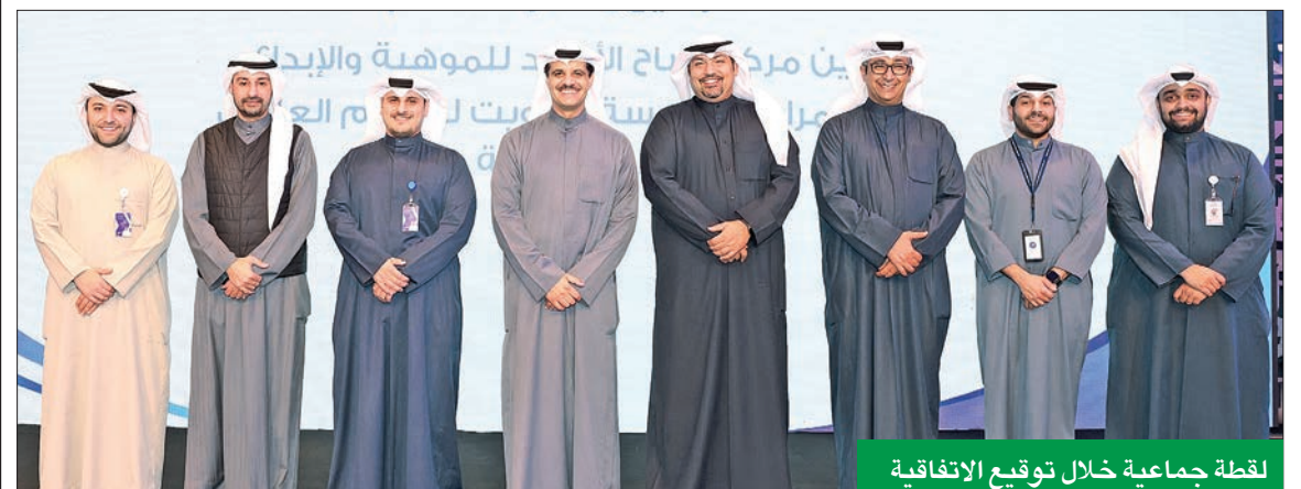
لقطة جماعية خلال توقيع الاتفاقية

وقع بنك وربة اتفاقية شراكة استراتيجية مع مركز صباح الأحمد للموهبة والإبداع، أحد مراكز مؤسسة الكويت للتقدم العلمي، تهدف إلى دعم الابتكار وتنمية مهارات الشباب الكويتي في المجالات العلمية والإبداعية، عبر تعزيز البيئة التعليمية المتطورة التي يوفرها المركز، من خلال برامج التدريب والتقنية المتخصصة لتأهيل الجيل القادم من المبدعين.