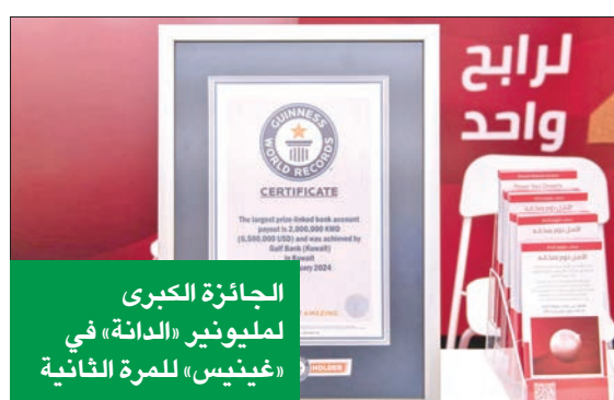
الجائزة الكبرى لمليونير «الدانة» في «غينيس» للمرة الثانية

وفقاً لبيانات «أبل ستور» و«غوغل بلاي» فقد تصدر تطبيق بنك الخليج التطبيقات المصرفية الأعلى تقييماً في الكويت بتقييم 5 نجوم.