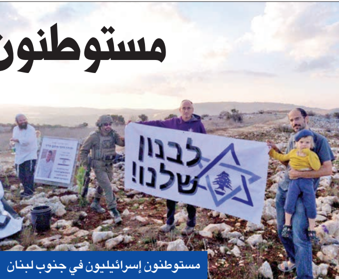
مستوطنون إسرائيليون في جنوب لبنان

حزب الله قبل حوالي شهرين، وبعد بضع ساعات، ومع وصول قوات الجيش الإسرائيلي إلى الموقع، غادر أعضاء الحركة المنطقة. وفي بيان، قال الجيش الإسرائيلي إن أعضاء «عوري تسافون» لم يعبروا الحدود إلى لبنان، وأوضح أنهم أوقفوا داخل الأراضي الإسرائيلية بسبب دخولهم (برفقة أطفال صغار) إلى منطقة عسكرية مغلقة بالقرب من السياج الحدودي. من جهتها، قالت الحركة: «وصلنا إلى هنا استعداداً لإنشاء نواة استيطانية مستقبلية، وأحيينا ذكرى يهودا درور. كانت مارون الراس قرية عبرية قديمة تُعرف باسم مي ماروم. وقد سقط يهودا في معركة ببلدة عينا الشعب، وهي قرية كانت تعيش فيها سابقاً