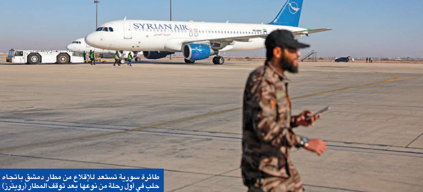
طائرة سورية تستعد للإقلاع من مطار دمشق باتجاه حلب في أول رحلة من نوعها بعد توقف المطار

المعارض أن القوات الإسرائيلية توغلت في محيط قرية صيدا على الحدود الإدارية بين القنيطرة ودرعا، مما يمثل اختراقاً جديداً في منطقة جنوب سورية قرب الحدود الأردنية، ووجهت تحذيرات للسكان المحليين بضرورة تسليم السلاح. وعلى جبهة أخرى، اتهمت قوات «فسد» الكردية تركيا والقوات السورية المدعومة منها بخرق هدنة أعلنت واشنطن تمديدتها في مناطق عديدة بمحيط كوباني وسد تشريين وعين عيسى ليل الثلاثاء - الأربعاء. وكانت الولايات المتحدة أكدت أنها ستنسحب إلى إرساء تفاهم أوسع نطاقاً بين القوات الكردية السورية المدعومة من قبلها وبين أنقرة التي تتهم الأخيرة بدعم التمرد الكردي على أراضيها.