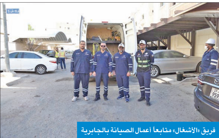
فريق «الأشغال» متابعاً أعمال الصيانة بالجابرية

«الأشغال»: 16 ضابطاً للعمل بنظام النوبة في مختلف القطاعات