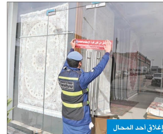
إغلاق أحد المحال

استقبل رئيس قوة الإطفاء العام، اللواء طلال الرومي، رئيس مركز مجلس التعاون لإدارة حالات الطوارئ، العميد د. راشد المري، واللواء المرافق له. وخلال اللقاء أشاد الرومي بعمق العلاقات الثنائية والأخوية بين قوة الإطفاء ومركز مجلس التعاون، وأكد استعداد قوة الإطفاء لتسخير كل الإمكانيات والخبرات لدعم المركز الخليجي في مجالات الإطفاء والحماية المدنية. ويحث رئيس الإطفاء أوجه التعاون ذات الاهتمام المشترك في مجالات الكوارث والأزمات والطوارئ، حيث