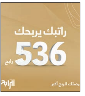
رابطك يربطك 536 رابح

خدماته ومنتجاته المصرفية بما يتواءم مع متطلبات العملاء واحتياجاتهم وتحقيق تطلعاتهم وتزويدهم بما هو عصري ومبتكر، بما ينعكس على تحقيق رضا العميل الذي هو من أساسيات العمل في «بيتك»، الذي حقق نقلة نوعية وتميزاً على مستوى الخدمات المطروحة بالاستفادة من الأدوات التكنولوجية ودراسة متطلبات السوق، وملاءمة كل مرحلة وكل شريحة من شرائح العملاء.