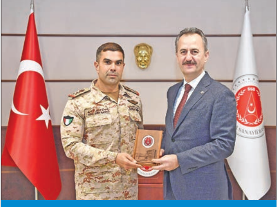
رئيس «الدفاعية التركية» مستقبلاً صباح الجابر أمس

أجرى نائب رئيس الأركان العامة للجيش اللواء الركن طيار الشيخ صباح الجابر أمس مباحثات مع رئيس هيئة الصناعات الدفاعية التركية الدكتور هالوك أغورغون حول قضايا التعاون الثنائي المشترك في مجالي الصناعات الدفاعية والتكنولوجية.