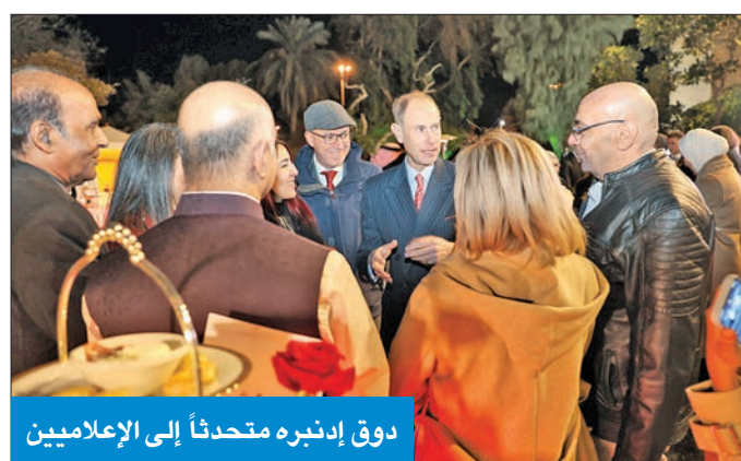
دوق إدنبره متحدثاً إلى الإعلاميين

الاستماع إلى بعض الشباب الذين يساهمون بشكل فعال في مجتمعهم، وتابعت لويس: «زيارتنا لمركز ديسون الثقافي أضفت على تاريخنا الدبلوماسي الحياة، في حين كان حفل الاستقبال في حديقة السفارة فرصة للاحتفاء بالمجموعات التي تعمل على تعزيز علاقاتنا الثنائية ودعم المجتمع البريطاني في الكويت». وغادر البلاد صباح أمس، دوق إدنبره والوفد المرافق، بعد زيارة رسمية للبلاد دامت يومين، وشملت لقاءات مع القيادة السياسية، واختتمت بعشاء في أبراج الكويت، حيث تم إحياء ذكرى زيارة الملكة إليزابيث الثانية للكويت عام 1979.