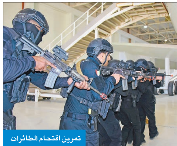
تمرين اقتحام الطائرات