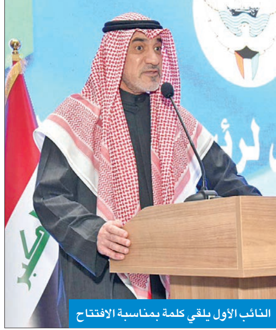
النائب الأول يلقي كلمة بمناسبة الافتتاح