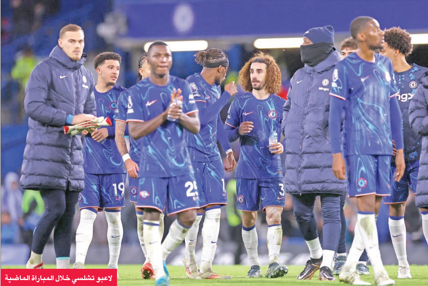
لاعبو تشلسي خلال المباراة الماضية

ويسعى تشلسي للحصول على نقطة ليضمن صدارة التدريب في حال عدم فوز فيوتوريا جيماريش على فيورنتينا بفارق 10 أهداف. ولن تكون مهمة تشلسي سهلة خاصة أن فريق شامروك روفرز يعتمد على دفاعه القوي حيث لم تستقبل شبكاه سوى أربعة أهداف فقط، وهو نفس عدد الأهداف التي استقبلتها شبك تشلسي، ولا يوجد سوى ليجيا وارسو الذي تلقى أهدافاً أقل منها.