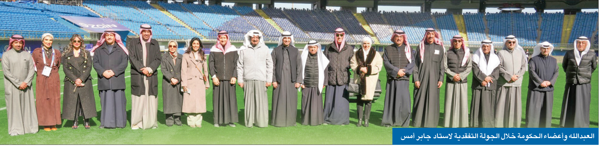
العبدالله وأعضاء الحكومة خلال الجولة التفقدية لاستاد جابر أمس

• وافق على حل وتصفية جمعيات نفع عام وأقر سحب وفقد الجنسية من دفعة جديدة