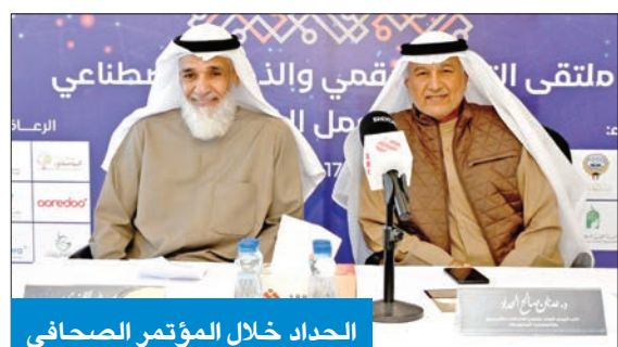
الحداد خلال المؤتمر الصحفي

الحداد: يمكن المؤسسات الخيرية من مواكبة التكنولوجيا