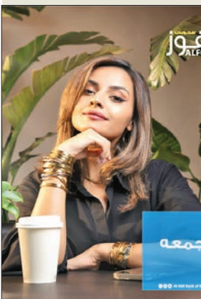
سحب الفوز الأسبوعي

تطوير الحساب وزيادة مكافآت العملاء، تقديراً لولائهم المستمر له. واستمر حساب الفوز في تجاوز التوقعات ونيل المزيد من رضا العملاء، من خلال السحب ربع السنوي بقيمة 100 ألف دينار، إضافة إلى السحب الشهري المثير على جائزة 20 ألف دينار.