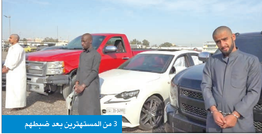
3 من المستهترين بعد ضبطهم

وقالت الإدارة العامة للعلاقات العامة والإعلام الأمني إن عملية البحث والتحرري انطلقت من قبل إدارة الرقابة