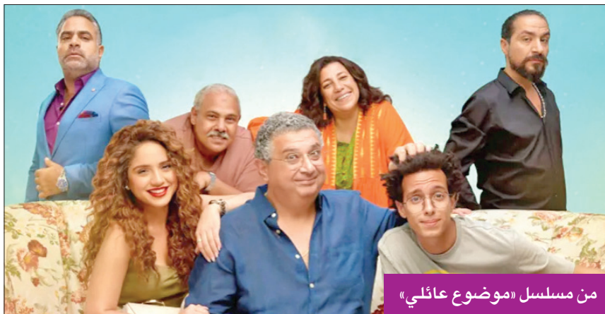
من مسلسل «موضوع عائلي»