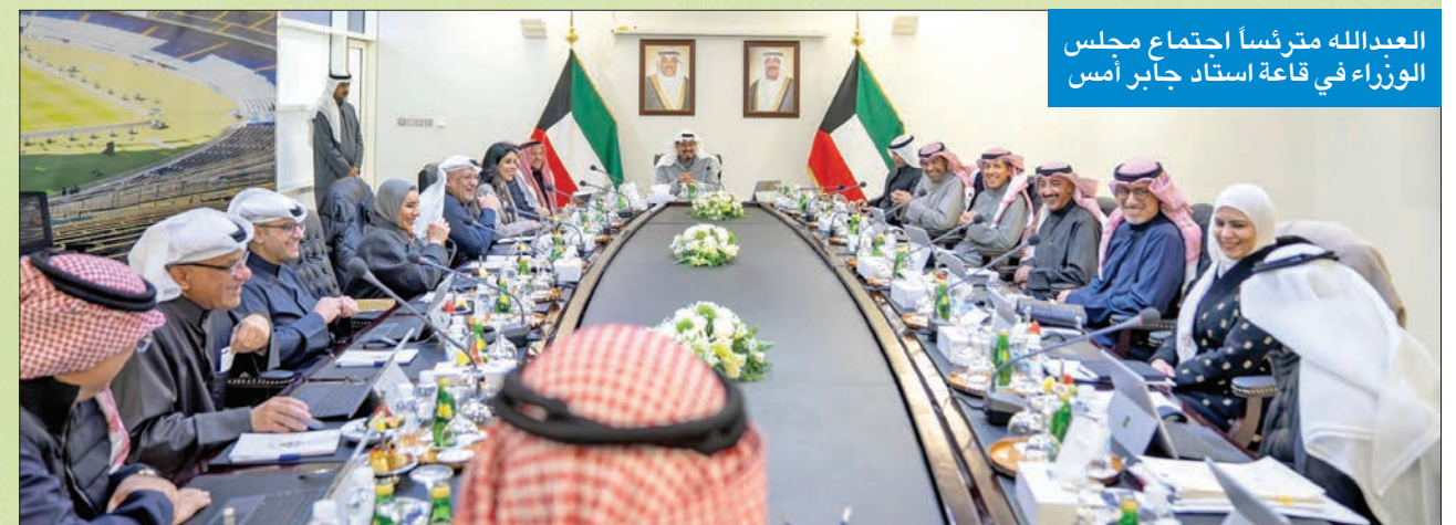
البدالله يترأس اجتماع مجلس الوزراء في قاعة استاد جابر امس

وفي تقرير لـ «كونا»، يستعد مطار الكويت الدولي لاستقبال نحو 30 ألف مشجع للبطولة في نسختها الـ 26 التي تستضيفها البلاد، في خطوة