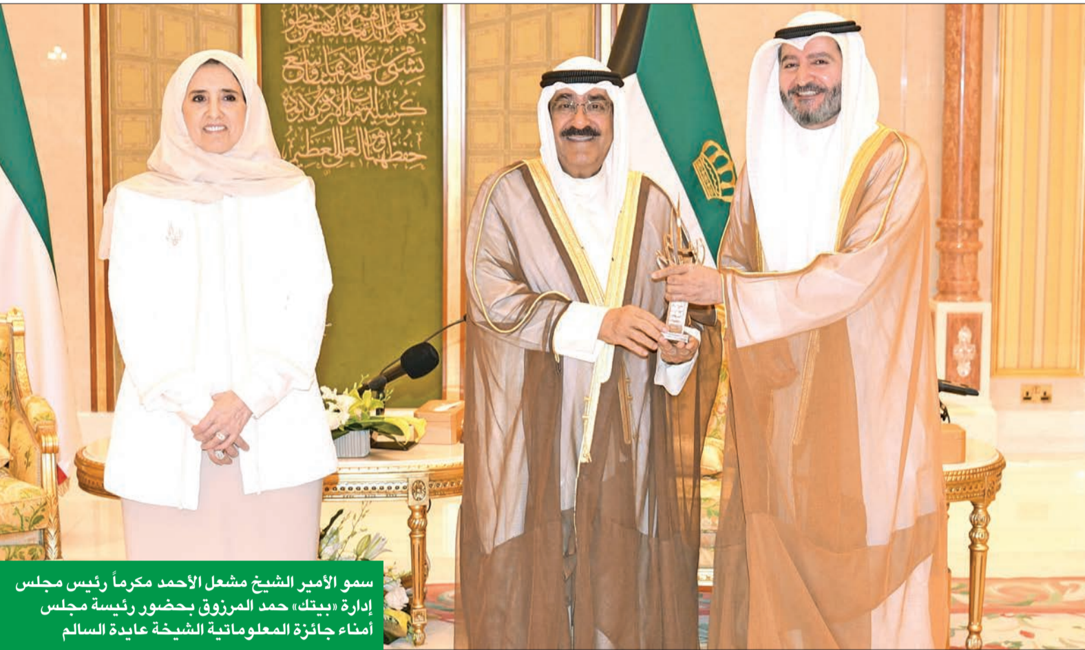
سمو الأمير الشيخ مشعل الأحمد مكرماً رئيس مجلس إدارة «بيتك»، حمد المرزوق بحضور رئيسة مجلس أمناء جائزة المعلوماتية الشيخة عابدة السالم

الرشود: تلبية احتياجات العملاء والنهوض بالصناعة المصرفية وتعزيز الاقتصاد