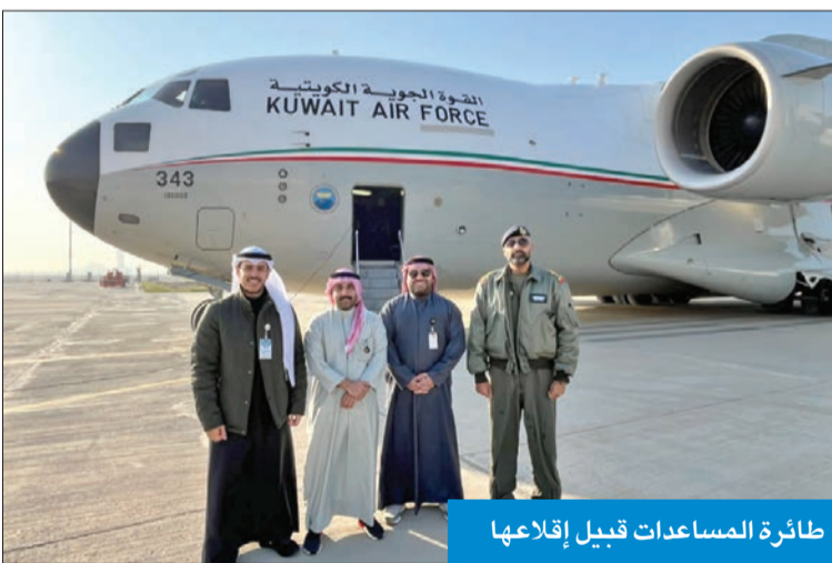
طائرة المساعدات قبيل إقلاعها

في لبنان، مشيراً إلى أن هذا الجسر الجوي يعكس رسالة تضامن إنساني تتجاوز الحدود، وتؤكد مكانة الكويت الرائدة في مجال العمل الإغاثي على مستوى العالم.