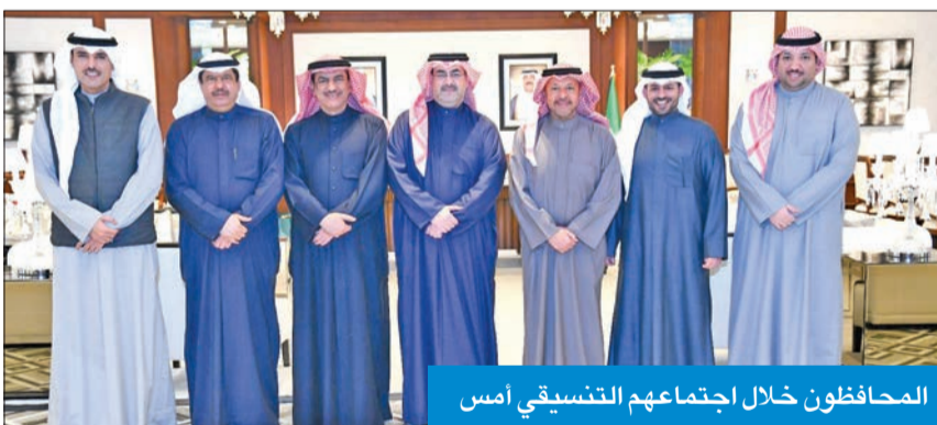
المحافظون خلال اجتماعهم التنسيقي أمس

عقدوا اجتماعاً تنسيقياً لبحث تعزيز التنمية والأمن في المحافظات