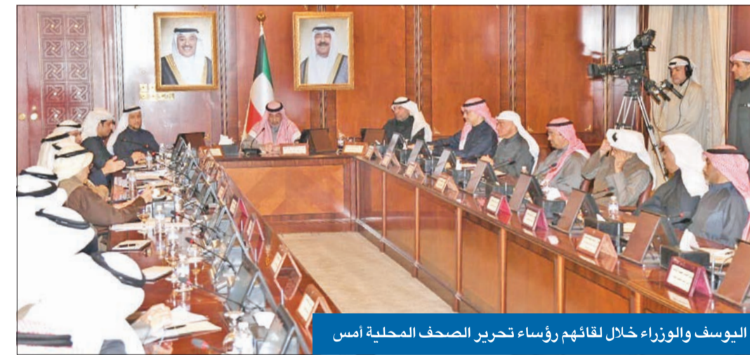
اليوسف والوزراء خلال لقائهم رؤساء تحرير الصحف المحلية أمس

دعا اليوسف إلى عدم استغلال بعض المحامين أي شخص فيما يتعلق بموضوع الجنسية، مؤكداً أن لجنة التظلمات وجدت للنظر في هذه الأمور.