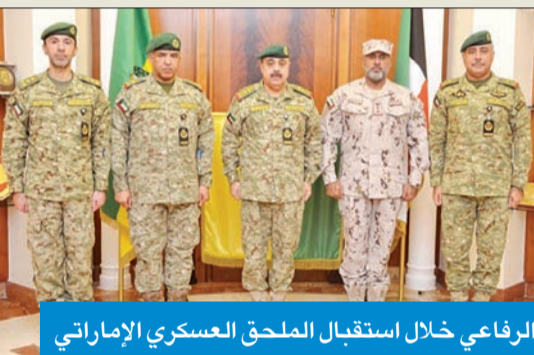
الرفاعي خلال استقبال الملحق العسكري الإماراتي

وأضاف أن وكيل الحرس رحب بالملحق العسكري الإماراتي، مؤكداً عمق العلاقات التاريخية بين البلدين الشقيقين.