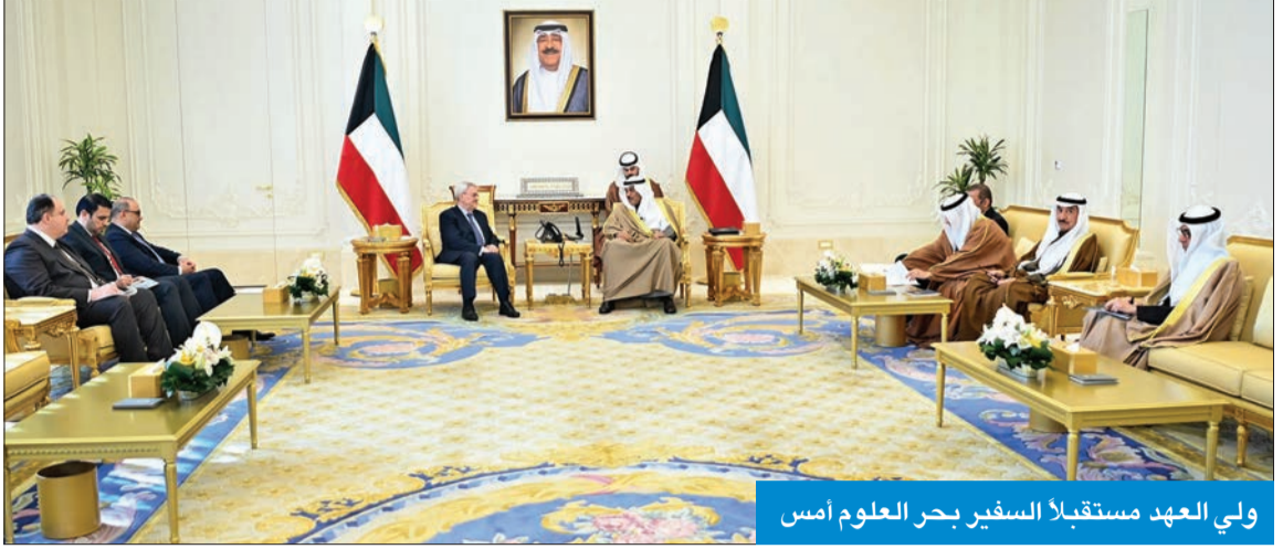
ولي العهد مستقبلاً السفير بحر العلوم أمس

سمو ولي العهد مازن العيسى، ومساعد وزير الخارجية للشؤون القنصلية، نائب وزير الخارجية بالإنابة، السفير عزيز الدجاني، ومستشار وزير الخارجية السفير سالم الزمانان، ومساعد وزير الخارجية لشؤون الوطن العربي السفير أحمد البكر.