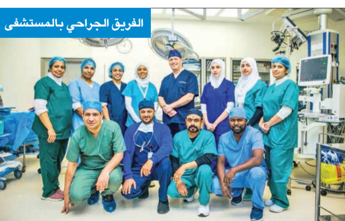
الفريق الجراحي بالمستشفى

الذي تلعبه الأطقم الطبية والمبادرات الوطنية.