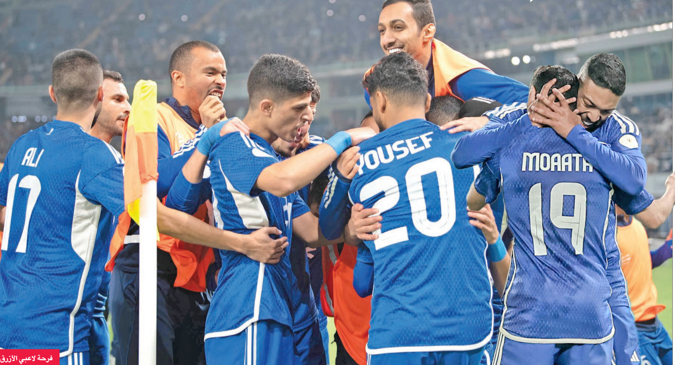
فرحة لاعبي الأزرق