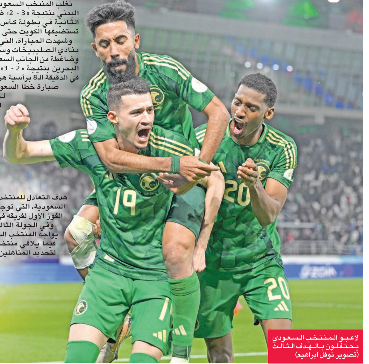
لاعبو المنتخب السعودي يحتفلون بالهدف الثالث