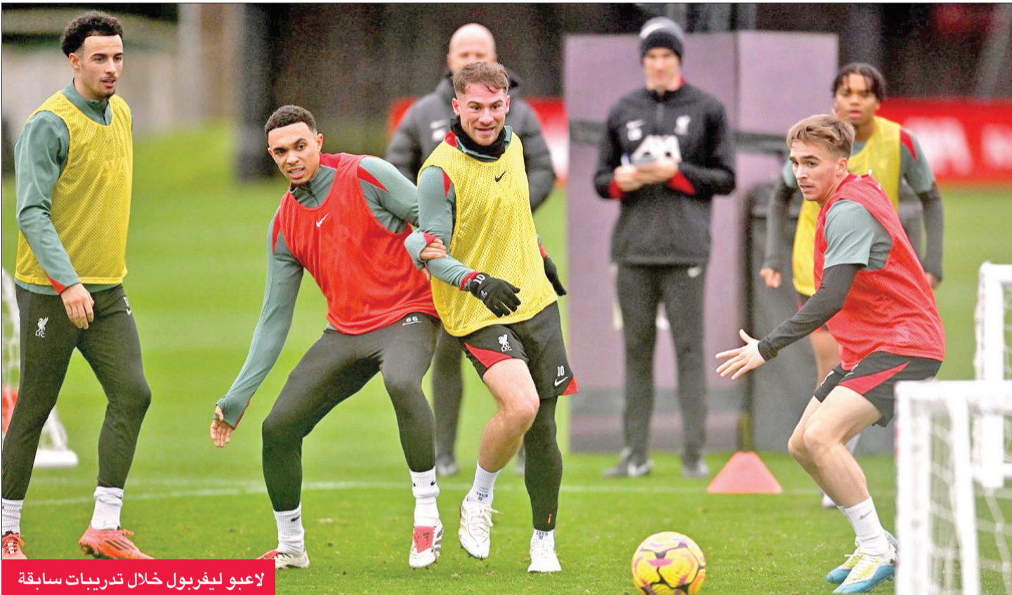
لاعبو ليفربول خلال تدريبات سابقة

بالعودة إلى دوري أبطال أوروبا بعد غياب دام 40 عاماً. وقال نونو الذي قضى فترة غير سعيدة وقصيرة مع توتنهام في 2021 «لا تعرف أبداً ما قد يحدث في المباراة، ما يمكننا رؤيته هو لاعبون جيدون (في توتنهام)، الكثير من الأهداف المسجلة، ويتلقون أهدافاً أيضاً».