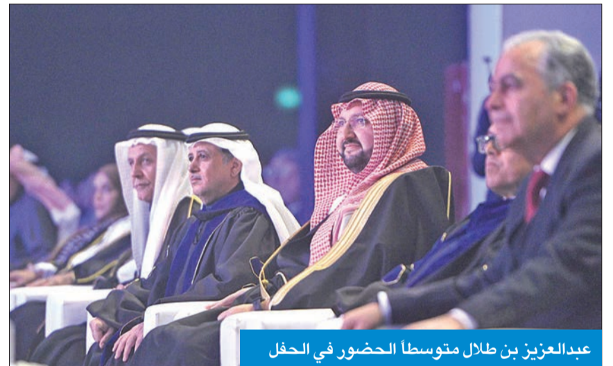
عبدالعزیز بن طلال متوسطاً الحضور في الحفل

الافتتح الجامعة العربية المفتوحة، أمس الأول، بتخريج 458 طالباً وطالبة ضمن الدفعة الـ19 للعام الجامعي (2023 - 2024)، تحت رعاية وحضور رئيس مجلس أمناء الجامعة، الأمير عبدالعزيز بن طلال آل سعود.