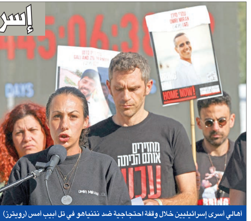
أهالي أسرى إسرائيلييين خلال وقفة احتجاجية ضد نعتيهاو في تل أبيب أمس

استهدفت غارة جوية إسرائيلية منطقة بعلبك شرق لبنان، في أول خرق بارز لاتفاق وقف إطلاق النار بين الجيش الإسرائيلي وحزب الله، والذي دخل حيز التنفيذ 27 نوفمبر الماضي. وجاءت معاودة إسرائيل لقصف ما تصفه بأنه مخازن أسلحة للجماعة اللبنانية المتحالفة مع إيران، رغم سريان اتفاق الهدنة الهشة التي تمتد إلى 60 يوماً، بإشراف لجنة تضم فرنسا والولايات المتحدة وقوات الأمم المتحدة «بونيفيل» في وقت كشفت حركة حماس أن «شروطاً جديدة»، وضعتها حكومة رئيس الوزراء الإسرائيلي بنيامين نتنياهو أدت إلى تأجيل التوصل إلى اتفاق لوقف إطلاق النار في غزة، لكنها وصفت المفاوضات المتواصلة في الدوحة بوساطة قطرية ومصرية بـ«الجديّة».