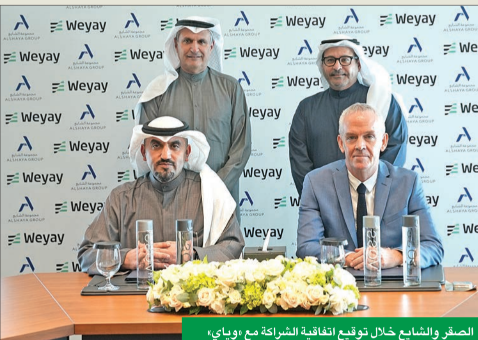
الصقر والشايح خلال توقيع اتفاقية الشراكة مع «وياي»

لتعزيز التجربة الرقمية للعملاء في المجالين المصرفي والتجاري