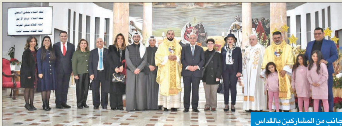
جانب من المشاركين بالقداس

طهوب: تراتيل القداس أدخلت الفرح والرجاء إلى قلوب المؤمنين