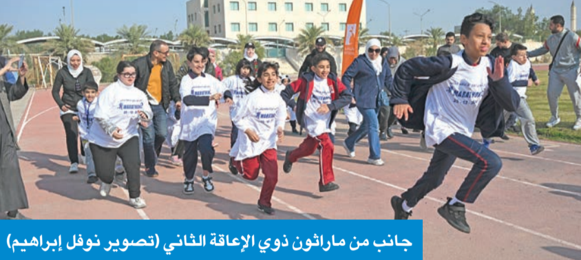
جانب من ماراثون ذوي الإعاقة الثاني

الخاصة بـ «البلدية» و«الإطفاء»، وتزويدها بنسخ ضوئية منها، للتأكد من التزامها بالسلامة اشتراطات الأمن والسلامة اللازمة، حفاظاً على أرواح الطلبة من ذوي الاحتياجات الدارسين بهذه الجهات. وأوضحت المصادر أن الجهات التعليمية التابعة للهيئة موزعة بواقع 17 مدرسة عربية و21 أجنبية، و31 حضائياً، إضافة إلى 11 مركزاً ومؤسسة تأهيلية، وجهتين تعملان بالفترة المسائية هما: 9 توقيت الطفل والديسكسيا، و9 مدارس غير خاضعة لإشراف الهيئة ولتأهيل مستقبل بعض حالات الإعاقة، مشيرة إلى أن إجمالي الطلبة المسجلين في هذه الجهات بلغ نحو 13250 طالباً وطالبة في جميع المراحل، كاشفة أن ميزانية القطاع التعليمي للسنة المالية الحالية 2025/2024 بلغت نحو 45 مليون دينار. إلى ذلك، نظمت شركة