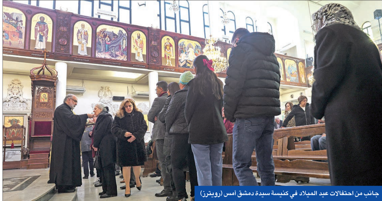
جانِب من احتفالات عيد الميلاد في كنيسة سيدة دمشق أمس

إلى ذلك، أكد الرئيس التركي رجب طيب أردوغان أن انقرة ستقدم بكل قوة إلى جانب الشعب السوري لبناء دولته، داعيا العالم