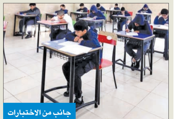
جانب من الاختبارات

واصل طلبة صفوف النقل، أمس، اختبارات نهاية الفترة الدراسية الأولى، ومن المقرر أن ينتهي طلبة المرحلة المتوسطة اليوم من أداء الاختبارات، بينما ينتهي طلبة الصف العاشر والحادي عشر 30 الجاري.