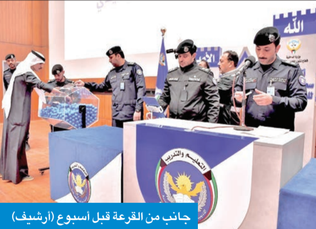
جانب من القرعة قبل أسبوع (أرشيف)

بناءً على توجيهات وتعليمات النائب الأول لرئيس مجلس الوزراء وزير الدفاع وزير الداخلية، الشيخ فهد اليوسف، تم قبول 50 طالباً من قائمة الاحتياطي، ممن اجتازوا القرعة العلنية التي أقيمت 18 الجاري، للالتحاق بدورة رقيب أول (الدفعة 28) في أكاديمية سعد العبدالله للعلوم الأمنية.