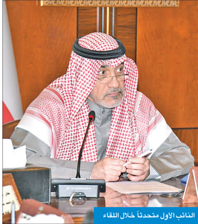
النائب الأول متحدثاً خلال اللقاء

أكد النائب الأول لرئيس مجلس الوزراء وزير الدفاع وزير الداخلية، رئيس اللجنة العليا لتحقيق الجنسية الكويتية، الشيخ فهد يوسف، أن توجيهات السامية جاءت لوضع حلول مناسبة لحالات من فقدوا الجنسية حفاظاً على الأسرة الكويتية كأساس للمجتمع وأولوية وطنية. وأضاف يوسف، في لقاء مع رؤساء تحرير الصحف اليومية والمديرة العامة لـ «كونا»، ورؤساء جمعيات النفع العام، أمس، أن سمو أمير البلاد الشيخ مشعل الأحمد يرغب في «إرجاع الكويت ورقة بيضاء»، مضيفاً أنه «إن يظلم أحد في الكويت ونرغب في منح أبنائنا دولة خالية من الشوائب لنينها»، وقال إنه سيتم رفع الإيقاف عن الحسابات البنكية ممن سحب جنسياتهم وفق المادة الثامنة بدءاً من الأحد المقبل، موضحاً أن من سحبت جنسياتهم وفق المادة الثامنة سيتضمن بكل المزايا السابقة حتى وفاتهم. وكشف أن لجنة التظلمات ستنظر في كل ما يرد إليها، وسيتم تخصيص مكتب للرد المباشر على أي استفسار من النائب الأول شخصياً، موضحاً أن بعض الحالات اكتسبت الجنسية وفق المادة 8 بناء على «زواج مصلحة ليل الجنسية وتم من الطلاق»، معرباً عن تفاؤله بالانتهاه من النظر في حالات المادة الثامنة نهاية يناير المقبل. وأكد يوسف أن إعادة الجنسية بيد صاحب السمو، أملاً ألا يستغل بعض المحامين الأشخاص في موضوع الجنسية. وكشف أن عدد جوازات المادة 17 يبلغ 64 ألفاً، وبعد إيقاف استخدامها عدل 230 شخصاً منهم أوضاعهم.