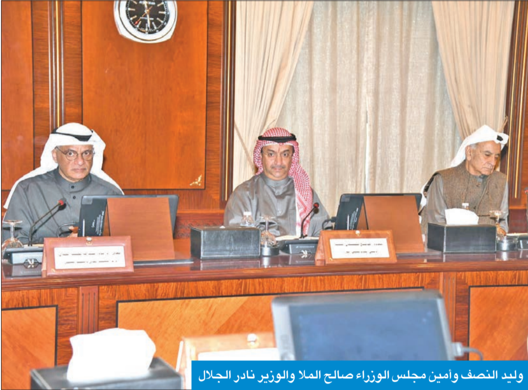
وليد النصف وأمين مجلس الوزراء صالح الملا والوزير نادر الجلال

كشف في لقاء مع رؤساء تحرير الصحف و«كونا» وجمعيات النفع العام أبرز ملامح التعديلات على قانون الجنسية