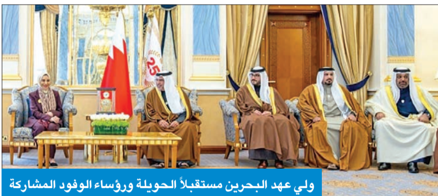
ولي عهد البحرين مستقبلاً الحويلة وروساء الوفود المشاركة

شاركت في الدورة الـ 44 لمجلس وزراء الشؤون الاجتماعية العرب بالبحرين