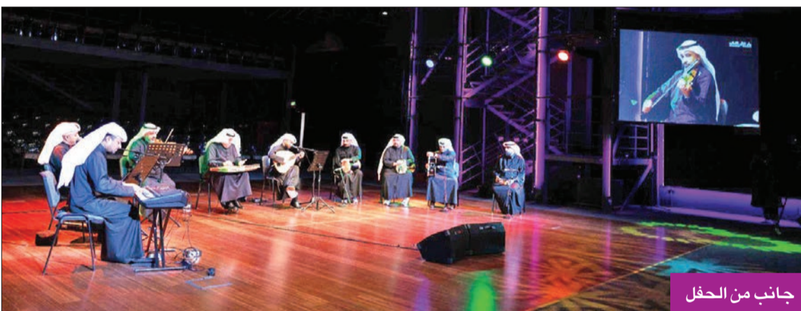
جانب من الحفل

إذ بداياته بمجال الغناء كانت في عام 2010 كهواية، ثم قام بصقلها، لافتاً إلى أن المطربين المفضلين الذين يحب الاستماع لهم؛ الفنان الراحل عبدالكريم عبدالقادر، و«سفير الأغنية الخليجية» عبدالله الرويشد.