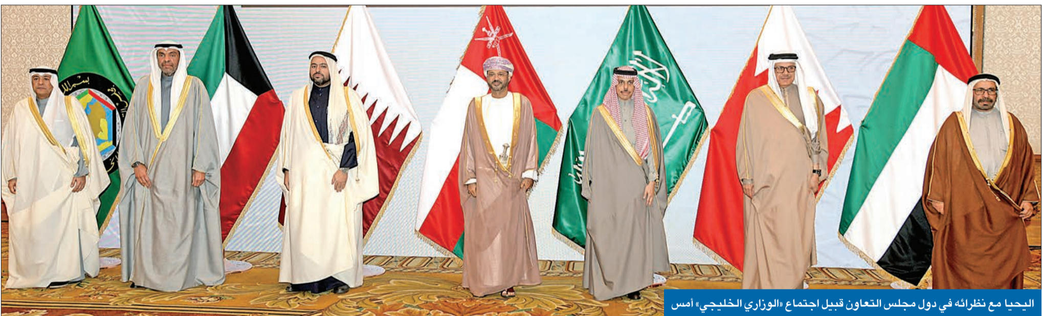
اليجيا مع نظرائه في دول مجلس التعاون قبيل اجتماع «الوزاري الخليجي» أمس

انتخاب الرئيس اللبناني فرصة للاستقرار ولم تدخر جهداً في دعم السوريين