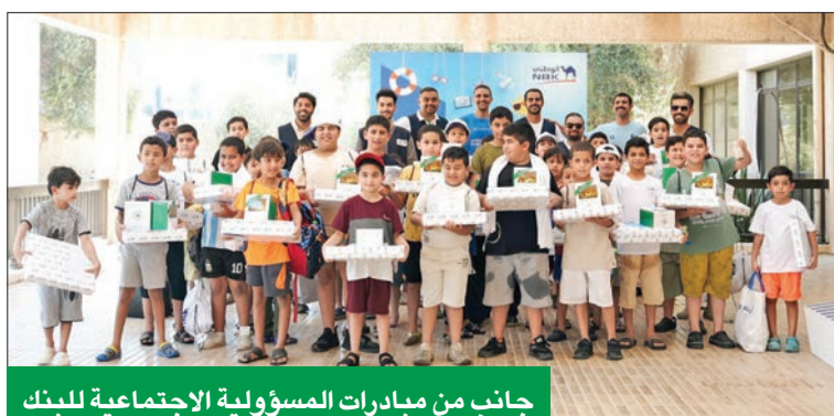
جانب من مبادرات المسؤولية الاجتماعية للبنك