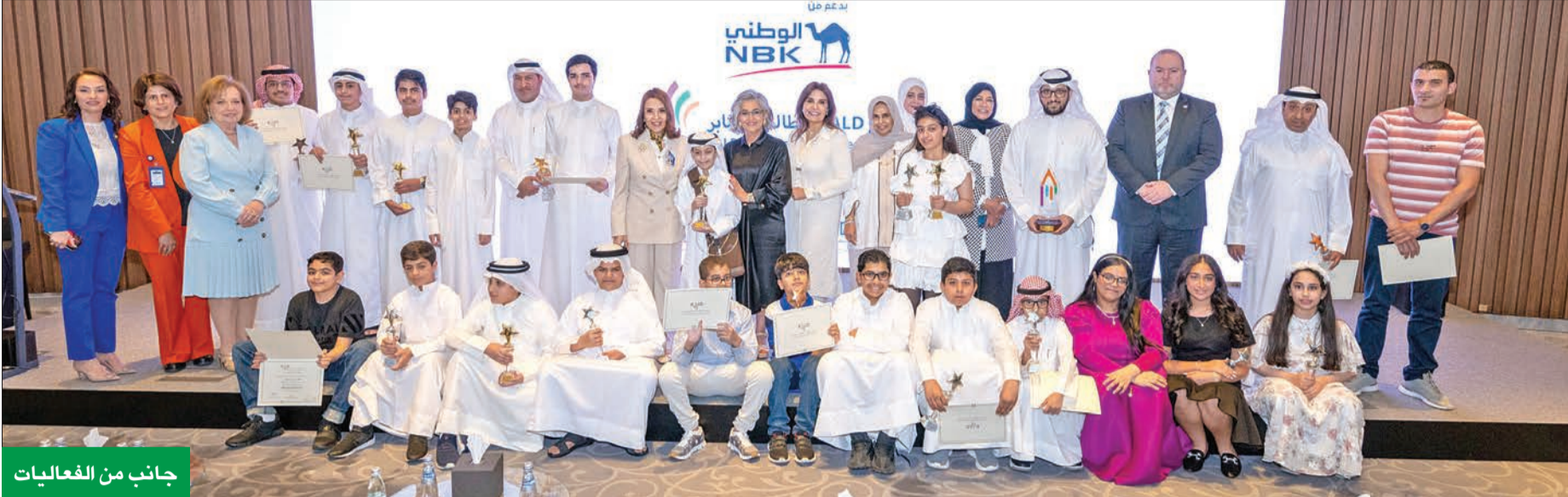
جانب من الفعاليات

المطر: نسير بثبات نحو تعزيز التأثير الإيجابي انسجاماً مع استراتيجية المجموعة حول الحوكمة