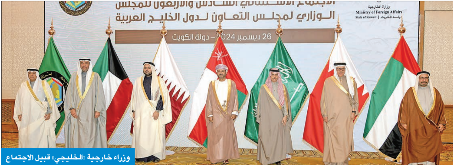
وزراء خارجية «الخليجي» قبيل الاجتماع

ترأس الاجتماع الوزاري الاستثنائي الخليجي وأكد أن التحديات المتسارعة تحتم تنسيقاً مستمراً