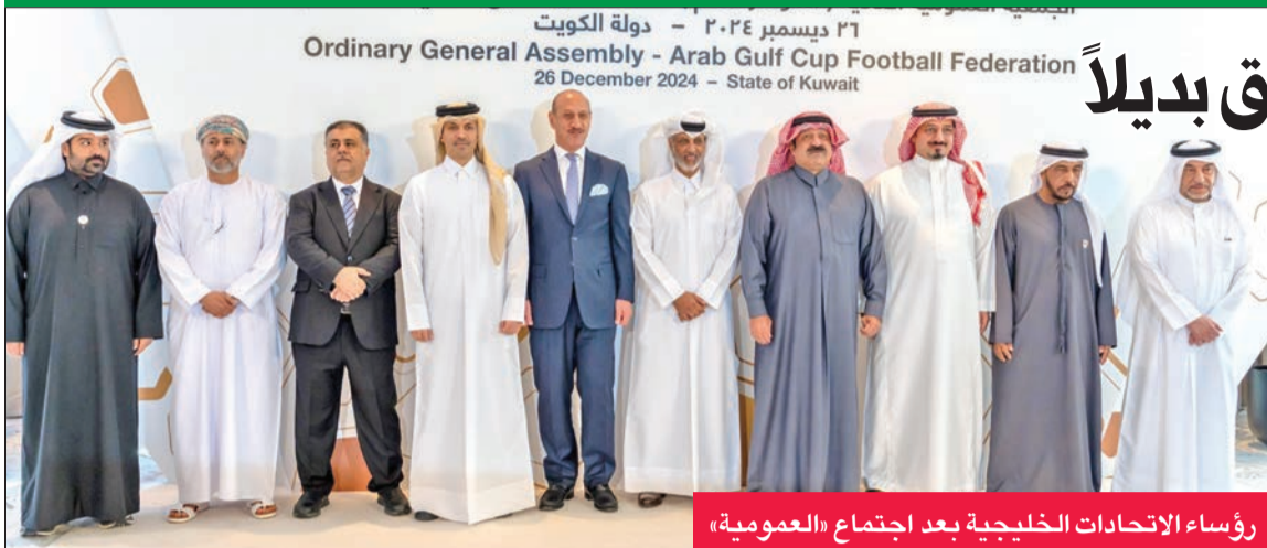
رؤساء الاتحادات الخليجية بعد اجتماع «العمومية»