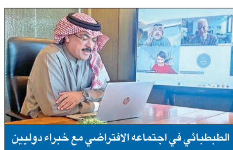
الطبطبائي في اجتماعه الافتراضي مع خبراء دوليين

وزير التربية يناقش مع «OECD» تبني استراتيجية لنظام تعليمي مستدام