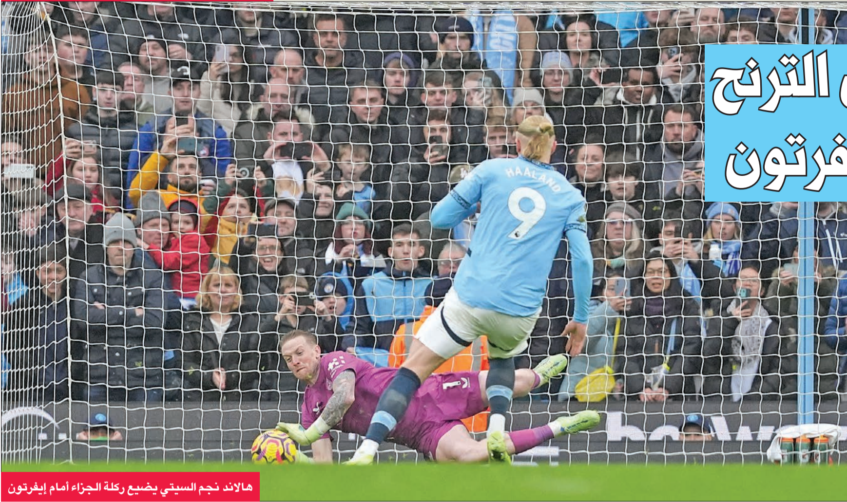
هالاند نجم السيتي يضع ركلة الجزاء أمام إيفرتون