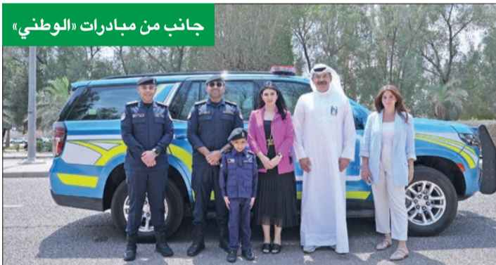
جانب من مبادرات «الوطني»