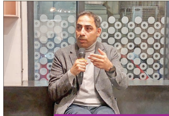
عبدالوهاب الحمادي أثناء المناقشة

أقامت دار الشروق المصرية ندوة ثقافية بمبنى قنصلية وسط البلد في القاهرة، استضافت فيها الروائي الكويتي عبدالوهاب الحمادي ليتكلم ويناقش روايته الجديدة «سنة القطط السمان»، وحاووه الناقد محمود عبدالشكور.