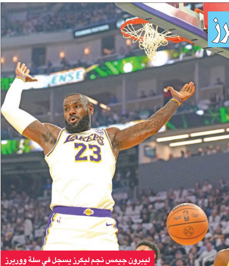
ليبرون جيمس نجم ليكرز يسجل في سلة ووريز