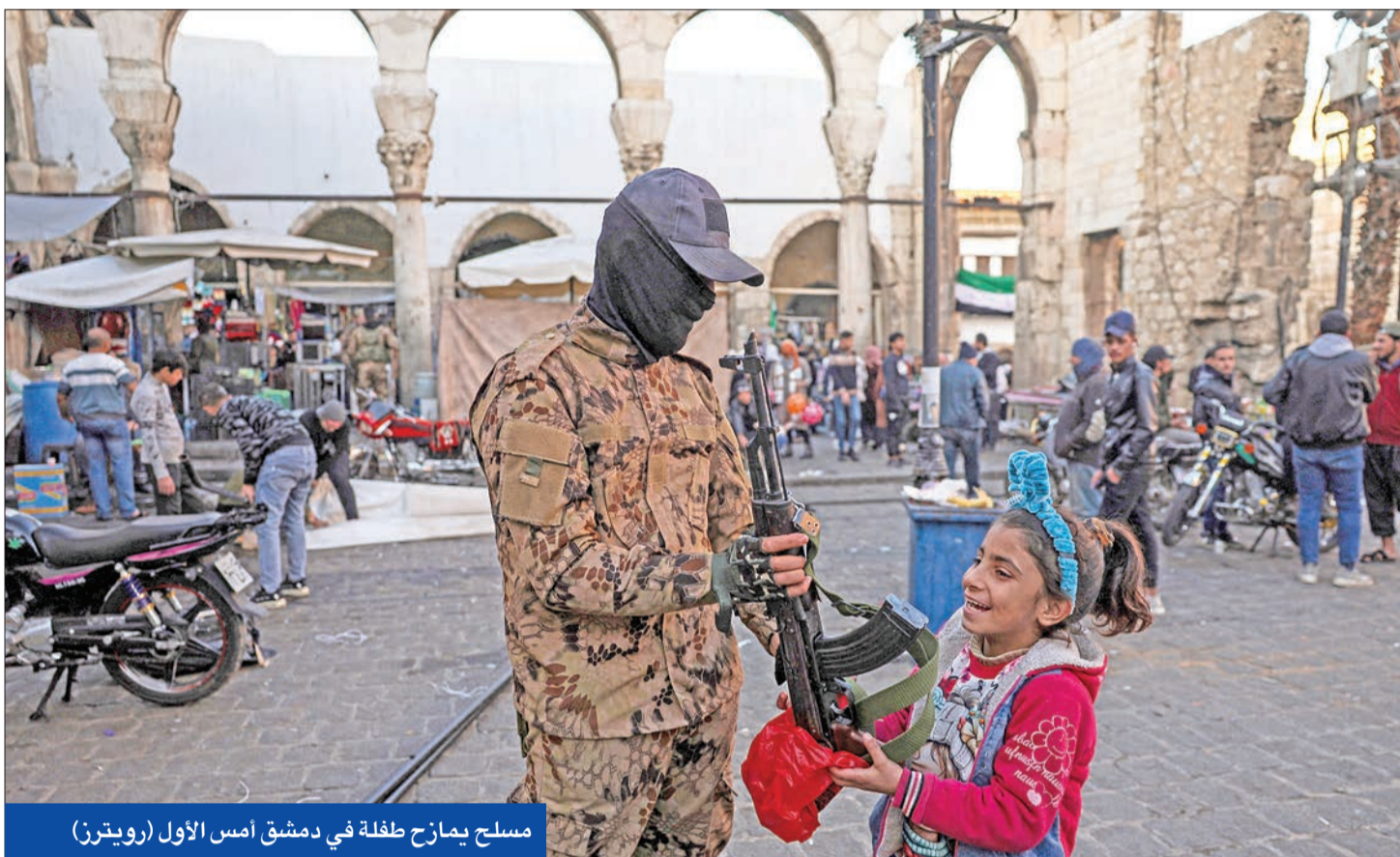
مسلم يمازح طفلة في دمشق أمس الأول

● مساع لتطويق الطائفية ودعوات علوية لتسليم السلاح ● وفد عراقي استخباري يبحث مع الشرع ضبط الحدود