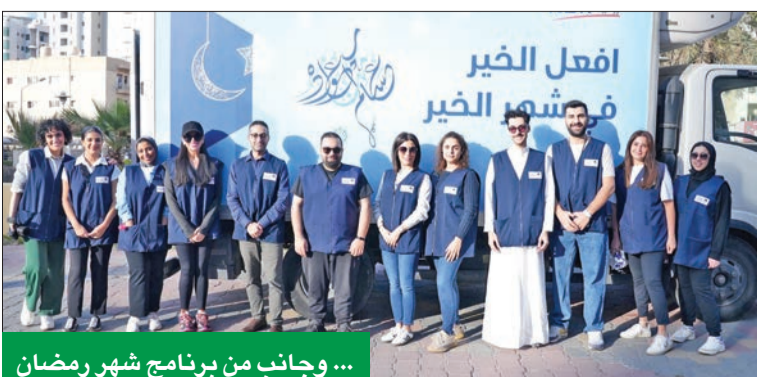
... وجانب من برنامج شهر رمضان

تدريب نحو 200 طالبة وطالب في برامج مصممة خصيصاً للخريجين والجامعيين ومنها «كن» و«تمكن» و«كلمة»