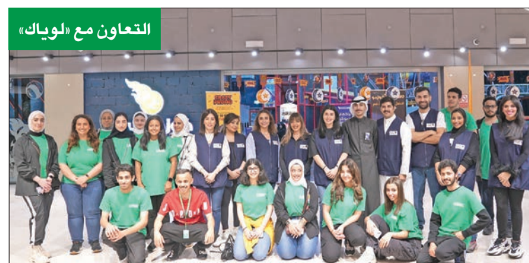
التعاون مع «لويك»