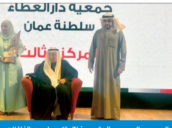
العيسى والعجمي والعتيبي خلال تكريم إحدى الفائزات من عمان

«مبارك» سجل أعلى متوسط لمدة الإقامة والفروانية الأقل خلال 2022