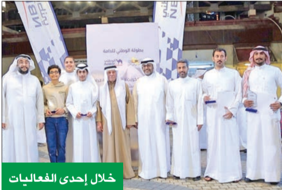
خلال إحدى الفعاليات