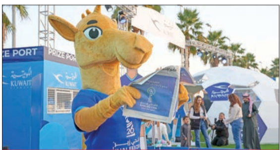
تميمة البطولة «هيدو» حاضرة للتفاعل مع الجماهير

منذ انطلاقة أول صافرة بداية في بطولة خليجي زين 26، حرصت «زين»، الشريك الرسمي للبطولة، على إثراء تجربة الجماهير الخليجية داخل حدود الملعب وخارجه، وذلك عبر مناطق المشجعين التي خصصتها الشركة في جميع أنحاء الكويت للاحتفاء بالعرس الخليجي طوال أيام تنظيم البطولة.