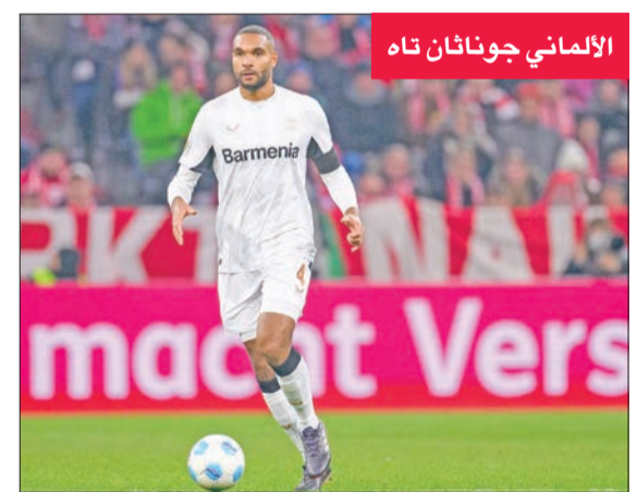
الألماني جوناثان تاه

من جانب آخر، أكدت تقارير إخبارية أن برشلونة قرر عدم