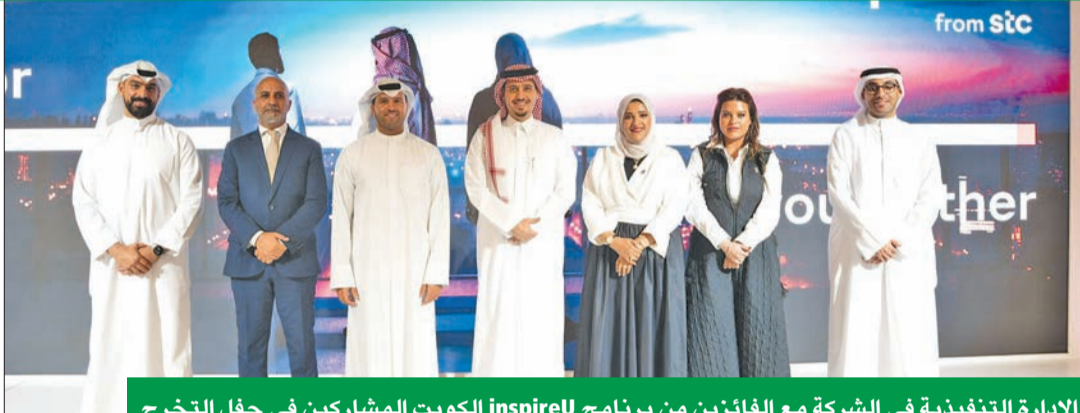
الإدارة التنفيذية في الشركة مع الفائزين من برنامج inspireU الكويت المشاركين في حفل التخرج

بالتعاون مع inspireU من مجموعة stc، وبالتزامن مع إطلاق المجموعة الدفعة الحادية عشرة، أطلقت stc الكويت الدفعة الثانية من برنامج inspireU لدعم الشركات التقنية الناشئة، بما يعزز دور stc كمنصة رقمية ومساهم في الاقتصاد الرقمي، ويهدف البرنامج إلى تمكين رواد الأعمال لتحويل أفكارهم إلى مشاريع ناجحة، وتعزيز ثقافة الابتكار وريادة الأعمال لخلق فرص عمل جديدة وتعزيز النمو المستدام، بما يتماشى مع رؤية stc للتحويل الرقمي.