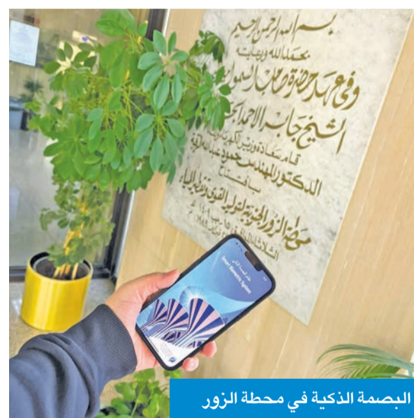
البصمة الذكية في محطة الزور

البصمة الذكية عالي الأمان ويتم تحديثه أولاً فاولاً من متخصصي فريق البصمة بالوزارة، ويضم مهندساتها ومهندسيها، مبيّنة أنَّ التطبيق جزء من عمل الشركة المنفذة لمشروع البصمة الذي انطلق العام 2021 لتحديث منظومة البصمة في الوزارة كلياً. ولفتت إلى أنَّ نظام البصمة الذكية التابع لوزارة الكهرباء يعمل في نطاق ملحقات استشارية، داخل تلك المواقع، ولا يعمل خارجها.