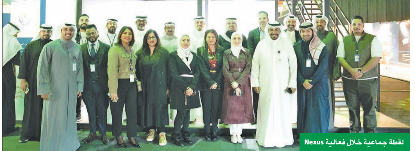
لقطة جماعية خلال فعالية Nexus