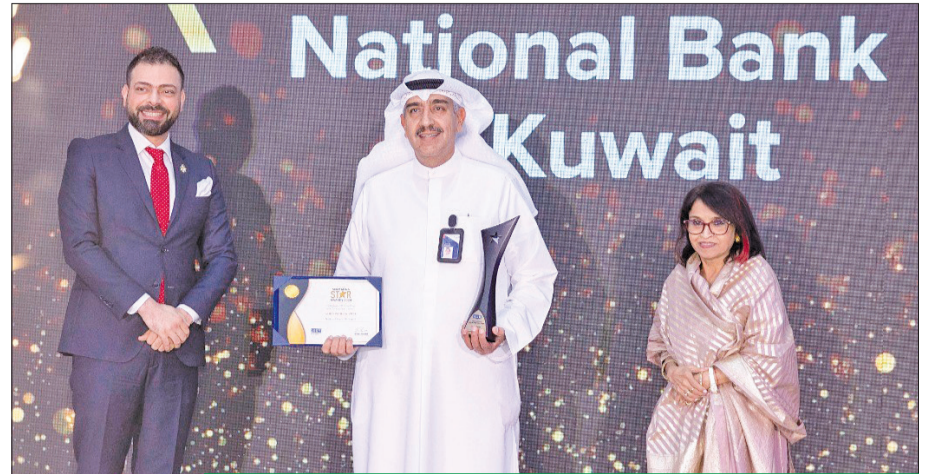
«الوطني» يتوج بالجائزة الذهبية للتميز في صحة ورفاهية الموظفين

الفرص مع التأكيد على التنوع في مكان العمل وتدريب الموظفين وتنمية قدراتهم ومهاراتهم بأفضل البرامج، حتى يتمكنوا من بناء مسيرة مهنية ناجحة تساعدهم على تولى مناصب قيادية داخل البنك في المستقبل، وهو ما يجعل البنك جهة العمل المفضلة في القطاع الخاص بين أوساط الكويتيين حديثي التخرج. وواصل البنك العمل على الحفاظ على نسبة عالية من التكويت، حيث يحرص «الوطني» على المشاركة في العديد من معارض التوظيف عليا بلغت 7 معارض خلال 2024، منح فيها الأولوية لتوظيف المواهب الوطنية، إضافة إلى اقتصار التعيين في بعض التخصصات على القوى العاملة الوطنية بصفة حصرية.