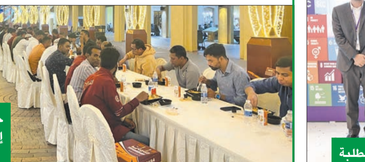
جانب من أكبر مائدة إفطار بالمباركية لأكثر من 3000 صائم

وللمسلة الثالثة على التوالي، قامت stc برعاية بطولة القيس للبادل، وتضمنت بطولة هذا العام مجموعة من الفئات التي اجتذبت حشداً من الحاضرين يزيد على 5000 شخص يومياً لتشجيع لاعبيهم المفضلين. وخلال صلاة القيام في العشر الأواخر من رمضان، نظمت stc خدمة خاصة للمصلين في مساجد الكويت، وتألقت خدمة ضافة المصلين من عدة أنشطة هدفت إلى توفير الراحة خلال العشر الأواخر.