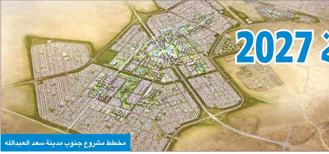
مخطط مشروع جنوب مدينة سعد العبدالله

وقف التوزيعات حالياً حتى إنجاز البنى التحتية للمشاريع الجديدة