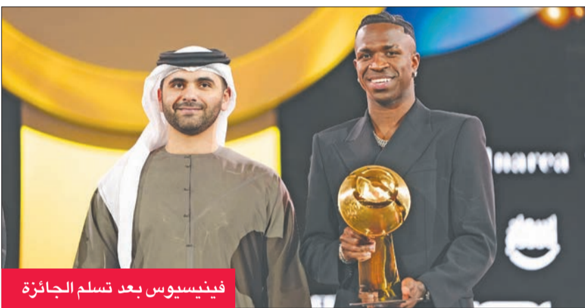
فينيسيوس بعد تسلّم الجائزة

وفي الجوائز الأخرى، حصل جناح برشلونة لامين جمال (17 عاماً) على جائزة أفضل لاعب صاعد، ولعبة إسبانيا على جائزة أفضل لاعبة للعام الثاني تواليا.