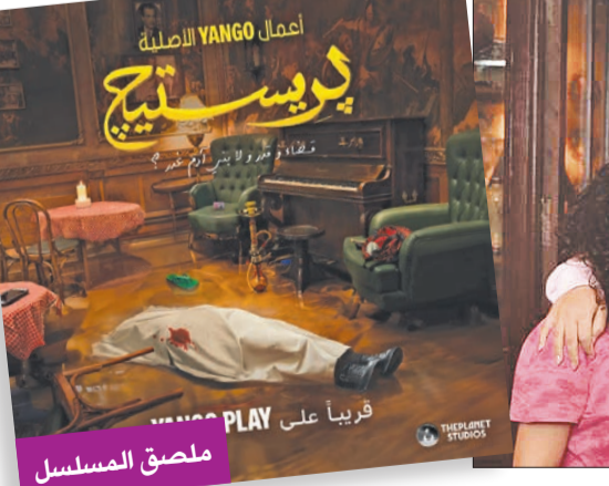
من كواليس التصوير

أحداث العمل الجديد تبدأ بعاصفة عنيفة تغرق شوارع القاهرة، وهو ما يضطر 14 شخصاً من مختلف الطبقات الاجتماعية للجوء إلى مقهى في وسط المدينة، وعندما تتفقق الكهفي ويكتشف مقتل أحدهم، يبدأ الشك في الجميع، حيث يدركون أن القاتل بينهم، ليصبح الجميع مشتبهين ومحققاً في الوقت نفسه. ويقدم المسلسل تجربة مثيرة، ويفرح التساؤل: «من هو القاتل؟»، حيث يسعى الجميع إلى كشف لغز الجريمة على مدار الحلقات. وكان المخرج عمرو سلامة على تحذ كبير حين بحث عن توليفة من الممثلين الـ 14 الذين يقدمون شخصيات من طبقات