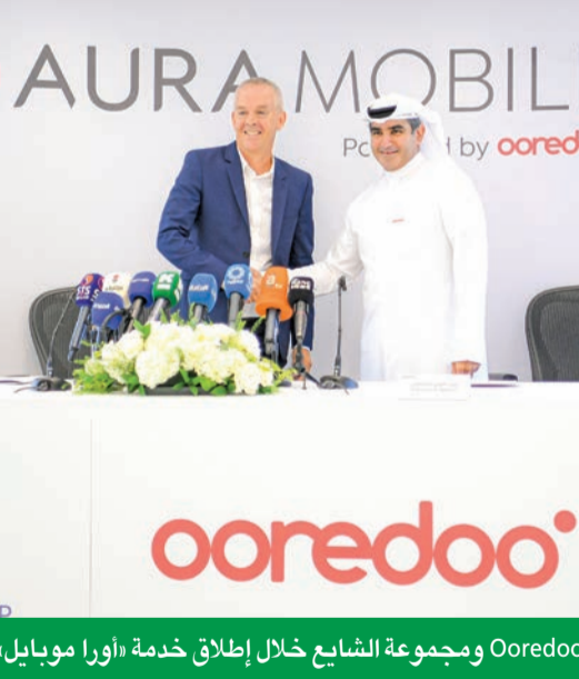
Ooredoo ومجموعة الشايح خلال إطلاق خدمة «أورا موبايل»

• تعاون مع مجموعة الشايح لإطلاق Aura Mobile: يُعد إطلاق هذه الخدمة تأكيداً على التزام الشركة بتقديم حلول مبتكرة تجمع بين الاتصال والمكافآت للعملاء.