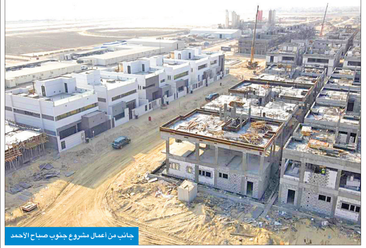
جانب من أعمال مشروع جنوب صباح الأحمد

في إطار التوجيهات المستمرة من مجلس الوزراء، التي تهدف إلى تسريع وتيرة حل المشكلة الإسكانية، وتوفير السكن اللائق للأسر الكويتية، كشف مصدر مسؤول في المؤسسة العامة للرعاية السكنية أن مجلس الوزراء رصد للمؤسسة 1.5 مليار دينار من أجل إنجاز البنى التحتية في مختلف المناطق السكنية القائمة، لا سيما في «جنوب صباح الأحمد» و«جنوب سعد العبدالله» و«جنوب عبدالله المبارك» من طرق ومبان حكومية ومدارس ومبان خدمية ومراكز صحية وضواحي لتكون جاهزة لاستقبال قاطني المناطق المذكورة، مع انتهاء البنى التحتية كاملة، مشيراً إلى أن ذلك بداية العمل بقانون المدن الإسكانية الجديد، الذي لم ينفذ حتى الآن أي من مواده.