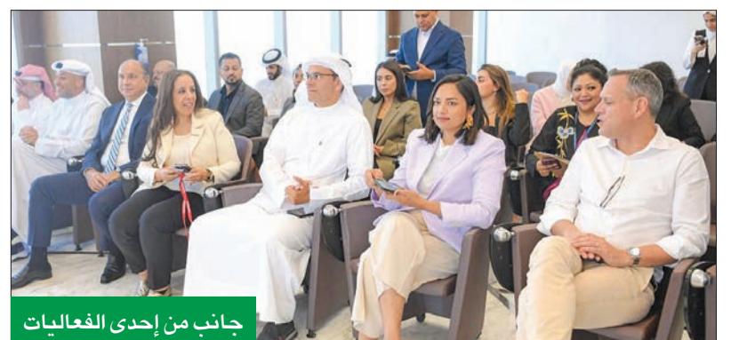
جانب من إحدى الفعاليات