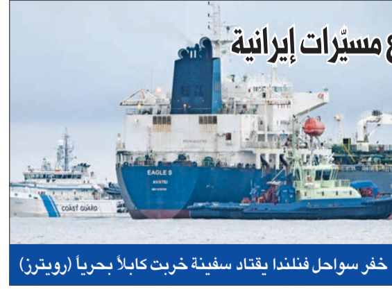
خفر سواحل فنلندا يفتقد سفينة خربت كابلاً بحرياً