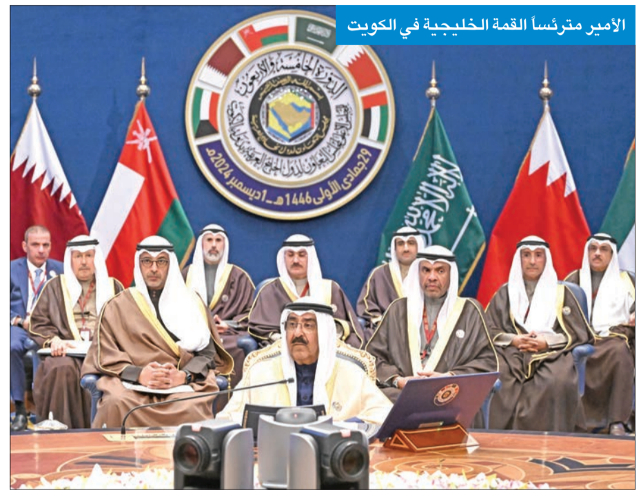
الأمير مترشاً القمة الخليجية في الكويت

الأمة ووقف بعض مواد الدستور لمدة لا تزيد على أربع سنوات، يتم خلالها دراسة جميع جوانب مسيرة الديمقراطية، وفي 12 مايو صدر مرسوم أميرى رقم 73 بتشكيل الوزارة الجديدة برئاسة سمو الشيخ أحمد العبدالله وضمت 13 وزيراً.