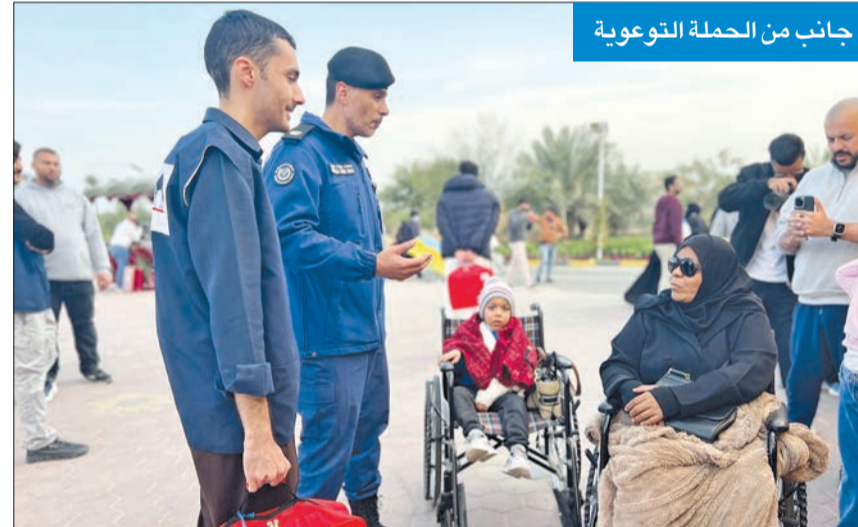
وكيل الداخلية متفقداً الإجراءات في استاد جابر