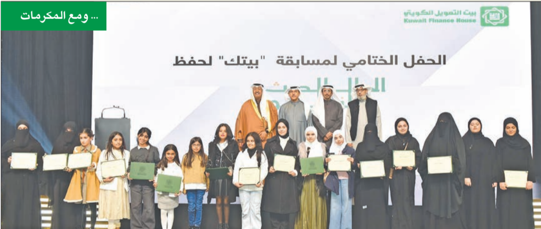
... ومع المكرمات

بمثل هذه الفعاليات التي تشجع المجتمع على الاقتداء بسنة النبي صلى الله عليه وسلم، ولما ذلك من أثر كبير في بناء أجيال تحمل رسالة الإسلام وقيمه السامية. وأكد الطبطبائي أن «بيتك» حريص على تقديم مثل هذه المساهمات المجتمعية الفاعلة التي ترسخ المبادئ النبيلة إلى نسختها العاشرة للموظفين والعملاء. بدوره، أشاد الطبطبائي بالمشاركة الكبيرة لجميع الفئات العمرية في مثل هذه المبادرات الفاعلة، التي تساهم في تعزيز القيم الإسلامية والأخلاقية. وبارك لجميع الفائزين بتفوقهم واجتهادهم في حفظ السنة النبوية الشريفة، مشيداً في الوقت ذاته بالجهود المباركة التي بادرت