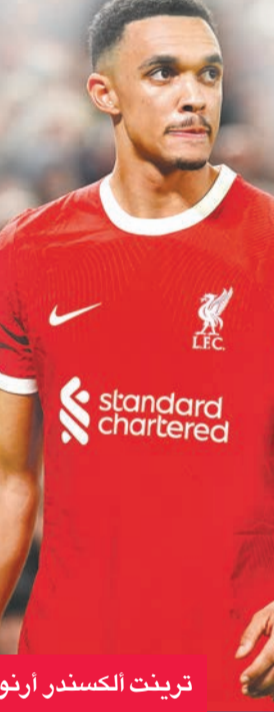
ترينت الكسندر أرنولد

أبلغ ترينت الكسندر أرنولد، الظهير الأيمن الإنكليزي لنادي ليفربول، إدارة الريز برغبته في الانتقال إلى ريال مدريد الإسباني، بحسب صحيفة «ماركا» الإسبانية. يأتي ذلك وسط محاولات متكررة من إدارة ليفربول لتجديد عقد اللاعب، إلا أن رغبة أرنولد في خوض تجربة جديدة مع النادي الملكي بدت واضحة لإدارة النادي الإنكليزي.