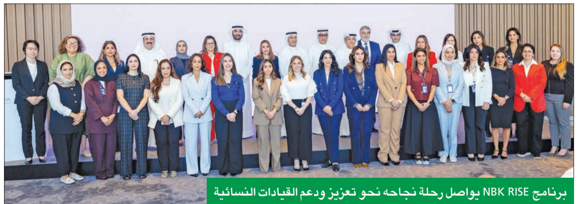
برنامج NBK RISE يواصل رحلة نجاحه نحو تعزيز ودعم القيادات النسائية