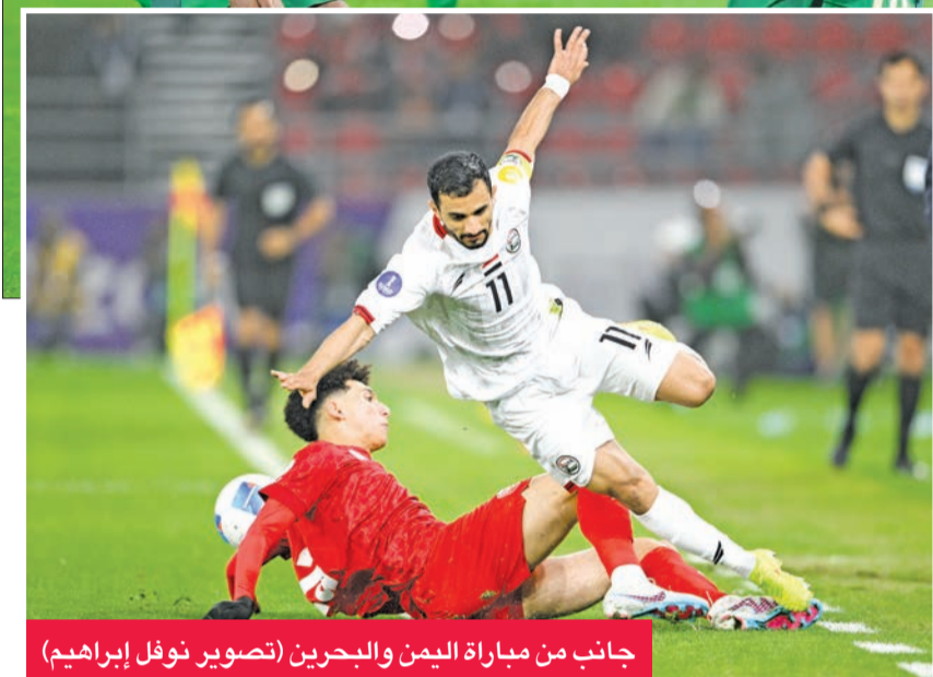
جانب من مباراة اليمن والبحرين