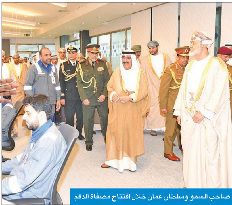
صاحب السمو وسلطان عمان خلال افتتاح مصفاة الدم