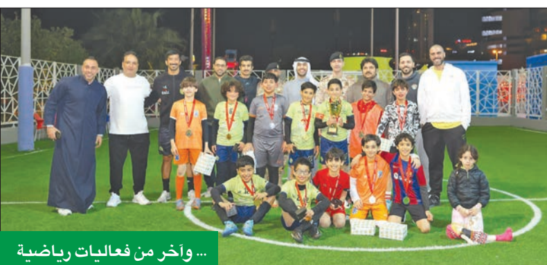
... وأخر من فعاليات رياضية

• شهادة PCI DSS 4.0: حصلت الشركة على هذه الشهادة المرموقة لتعزيز أمن البيانات للعملاء وضمان أعلى معايير الحماية.