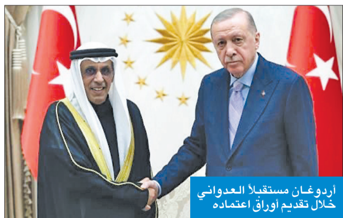
أردوغان مستقبلاً العدواني خلال تقديم أوراق اعتماده

قدم أوراق اعتماده لأردوغان ونقل له تحيات الأمير