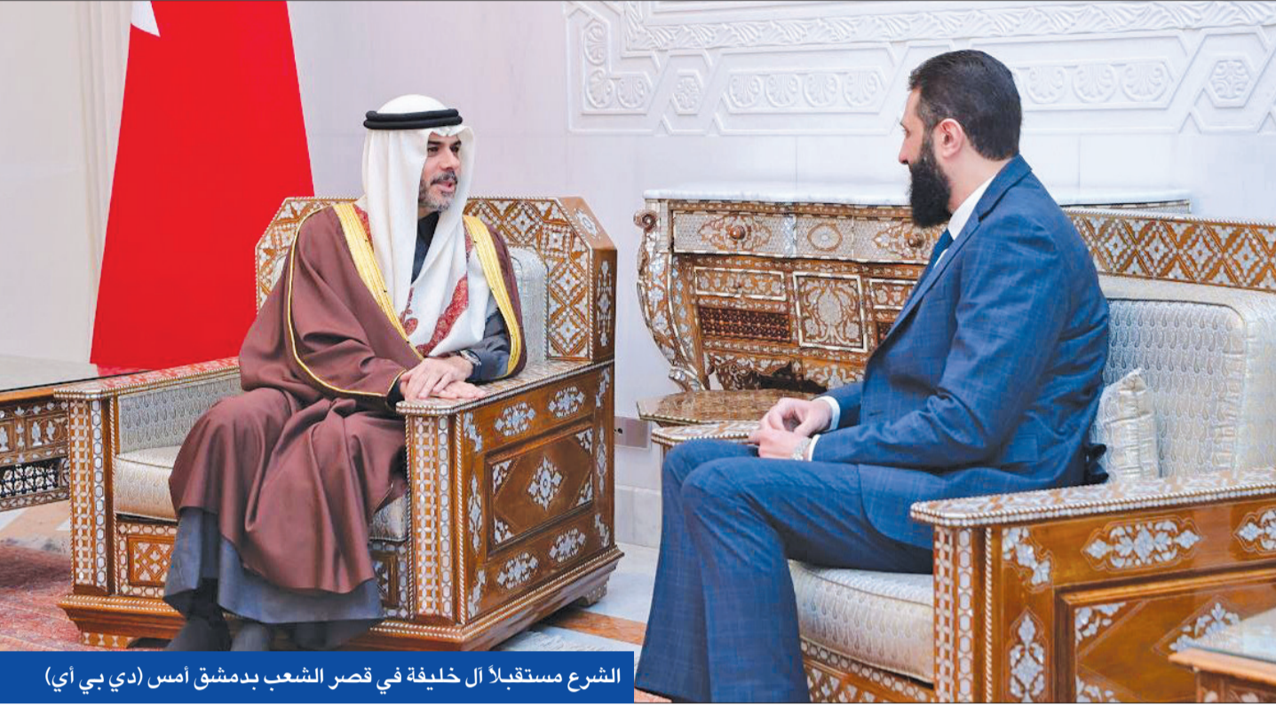
الشرع مستقبلاً آل خليفة في قصر الشعب بدمشق أمس