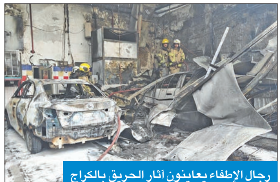
رجال الإطفاء يعينون آثار الحريق بالكراج

أصيب وافد أسويي بحالة اختناق وإجهااد حراري، جراء حريق اندلع مساء أمس الأول في كراج، وامتد إلى عدد من المركبات في منقطة الشويخ الصناعية، كما أسفر الحادث عن خسائر مادية لحقت بالموقع. وقالت إدارة العلاقات العامة والإعلام في قوة الإطفاء العام إن إدارة العمليات بالقوة تلقت بلاغاً مساء أمس الأول يفيد باندلاع حريق في كراج بمقطة الشويخ الصناعية. وأضافت الإدارة أن إدارة العمليات وبفريق تلقى البلاغ حركت مركزي إطفاء الشويخ الصناعي والشهيد إلى موقع البلاغ، لافتة إلى أنه تبين لرجال الإطفاء أن الحريق اندلع في كراج، وامتد إلى عدد من المركبات.