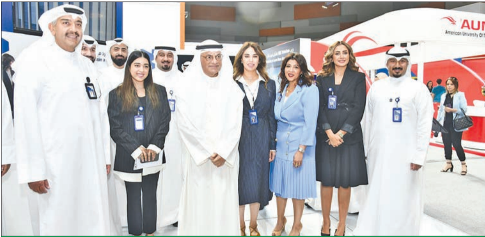
وزير التعليم العالي د. نادر الجلال والعبلاني والكوهجي مع فريق «الوطني» بمعرض «وظيفتي»

الإدارة حرصت خلال 2024 على خلق بيئة عمل مثالية تحفز على الابتكار والإبداع