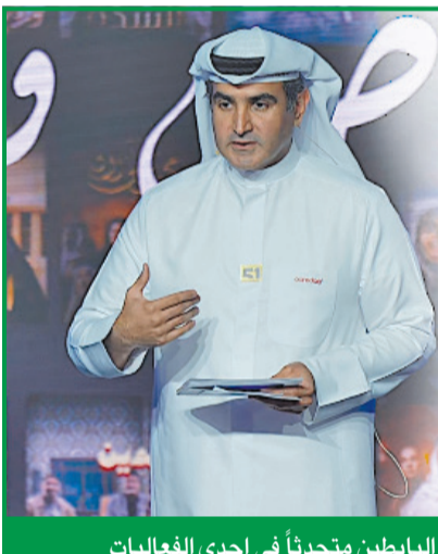
الباطين متحدثاً في إحدى الفعاليات

مع التزامها الثابت بالابتكار والاستدامة، وتطوير راس المال البشري، تواصل الشركة تعزيز الاتصال كإحدى الركائز الأساسية في قطاع الاتصالات بالكويت والمنطقة. من خلال شراكات استراتيجية وتطوير التكنولوجيا وتوفير تجربة عملاء استثنائية، تساهم Ooredoo في دفع عجلة تقدم اقتصاد الكويت ومجتمعها. ومع تطلعها إلى المستقبل، تظل الشركة على استعداد للقيادة نحو عصر جديد من التمكين الرقمي والنمو المستدام.